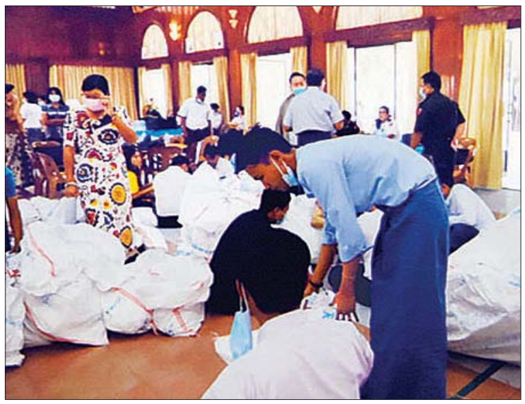
ရန်ကုန်တိုင်းဒေသကြီး မြို့နယ်များတွင် မဲလက်မှတ်များ မြေပြင်စစ်ဆေးမှု မှတ်တမ်း ဓာတ်ပုံများ။