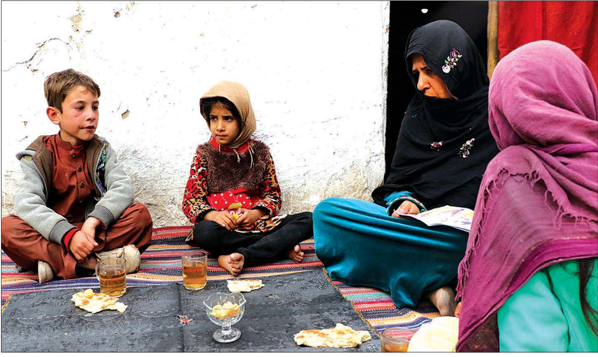
အာဖဂန်နစ္စတန်မိသားစုတစ်စုကို တွေ့ရစဉ်။

အာဖဂန်နစ္စတန်တွင် သတ်ဖြတ်ခံရမှုများကို ထောက်ပြထားသည့် အစီရင်ခံစာ ၈၀ ကျော် အာဖဂန်နစ္စတန်နိုင်ငံဆိုင်ရာ ကုလသမဂ္ဂလုပ်ငန်းတာဝန်အဖွဲ့က ပြောသည်။ ယင်းအစီရင်ခံစာတွင် အကြမ်းဖက်မှုများ၏ ဖြစ်စဉ်အပြည့်အဝ မပါဝင်သေးဟု ၎င်းက ဆက်ပြောသည်။ အာဖဂန်နိုင်ငံသားများ အသတ်ခံရတိုင်း မိမိတို့၏ အသက်မွေးဝမ်းကျောင်းအလုပ်ကို စွန့်လွှတ်ကာ နေရပ်စွန့်ခွာသွားကြရန် စဉ်းစားကြသည့်လူများ များလာသည်ဟုလည်း ၎င်းက ပြောသည်။