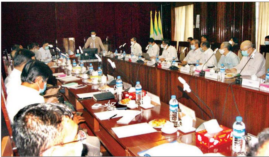
ကုန်သွယ်မှုနှင့် ကုန်စည်စီးဆင်းမှုများ မှန်ကန်မြန်ဆန်စေရေး လုပ်ငန်းညှိနှိုင်းအစည်းအဝေး ကျင်းပစဉ်။

ဆက်လက်၍ ညွှန်ကြားရေးမှူးချုပ်၊ အကောက် ခွန် ဦးစီးဌာနက မိမိတို့ အကောက်ခွန်ဦးစီးဌာန