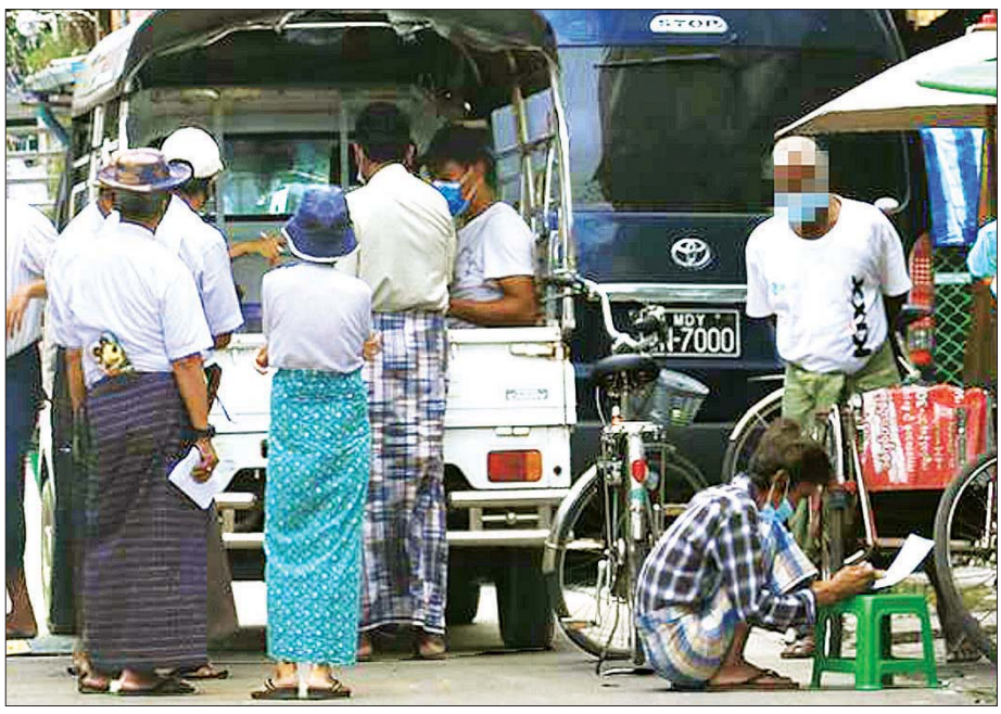
ဥပဒေနှင့်အညီဆောင်ရွက်ခြင်းမရှိသည့် ကြိုတင်ဆန္ဒမဲများ ကောက်ယူနေသည့်ပုံ။

ရွေးကောက်ပွဲကာလတွင် COVID-19 ရောဂါ ဖြစ်ပွားနေသည့်အတွက် ရွှေ့ဆိုင်းပေးရန်ကအစရှိခဲ့ပါကြောင်း၊ ထို့နောက် မဲဆွယ်စည်းရုံးသည့်အချိန်တွင်ဖြစ်ဖြစ် တရားမျှတအောင် ဆောင်ရွက်ပေးရန် တောင်းဆိုမှုများလည်း ရှိပါကြောင်း၊ COVID - 19 ရောဂါကြောင့် မဲဆွယ်စည်းရုံးသည့်အချိန်တွင် မမျှတ