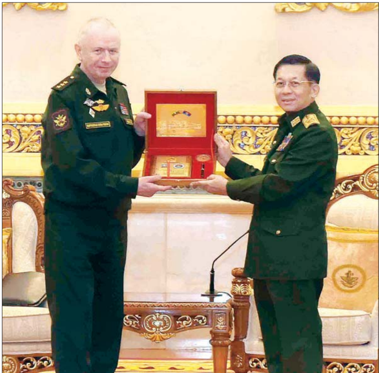
နိုင်ငံတော်စီမံအုပ်ချုပ်ရေးကောင်စီဥက္ကဋ္ဌ တပ်မတော်ကာကွယ်ရေးဦးစီးချုပ် ဗိုလ်ချုပ်မှူးကြီး မင်းအောင်လှိုင် ရုရှားဖက်ဒရေးရှင်းနိုင်ငံ ဒုတိယကာကွယ်ရေးဝန်ကြီး Colonel General Alexander Vasilyevich Fomin အား ဂုဏ်ထူးဆောင်တံဆိပ် ဂုဏ်ပြုပေးအပ်စဉ်။

တွေ့ဆုံဆွေးနွေးရာတွင် နိုင်ငံတော်စီမံအုပ်ချုပ်ရေး ကောင်စီဥက္ကဋ္ဌ တပ်မတော်ကာကွယ်ရေးဦးစီးချုပ်က မြန်မာ့တပ်မတော်၏ (၇၅)နှစ်မြောက် စိန်ရတနာပတ်လည်နေ့သည် ၂၀၂၀ ပြည့်နှစ်တွင် ကျရောက်ခဲ့ပြီး COVID-19 ရောဂါဖြစ်ပွားမှုကြောင့် ကျင်းပနိုင်ခဲ့ခြင်း မရှိသဖြင့် ယခုနှစ်တွင် ကျရောက်သည့် (၇၆)နှစ်မြောက် နှစ်ပတ်လည်နေ့နှင့်ပေါင်း၍ ပြုလုပ်မည်ဖြစ်ကြောင်းနှင့် ယခုကဲ့သို့ ပါဝင်တက်ရောက်သည့်အတွက် ဝမ်းမြောက်မိပါကြောင်း၊ COVID-