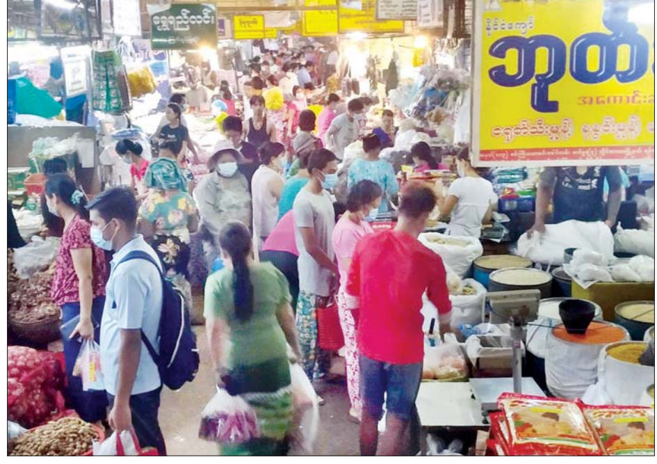
ရန်ကုန်မြို့တော်စည်ပင်သာယာ နယ်နိမိတ်အတွင်း ဈေးပေါင်း ၁၈၄ ဈေးရှိရာ မြို့နယ်အသီးသီးရှိ ဈေးများတွင် ကုန်စည်အဝင်နှင့် အထွက်များမှာလည်း ပုံမှန်ဝင်ရောက်လျက်ရှိပြီး မတ် ၂၆ ရက်က လမ်းမတော်မြို့နယ် ညောင်ပင်လေးဈေးတွင် ဈေးရောင်းဈေးဝယ်များဖြင့် စည်ကားလျက်ရှိသည်ကို တွေ့ရစဉ်။