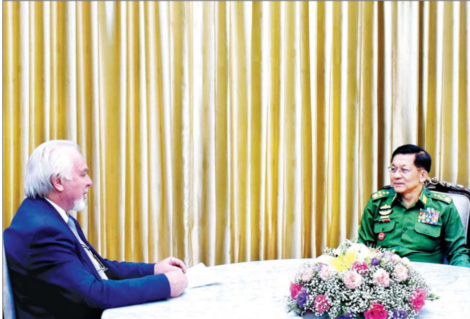
နိုင်ငံတော်စီမံအုပ်ချုပ်ရေးကောင်စီဥက္ကဋ္ဌ တပ်မတော်ကာကွယ်ရေးဦးစီးချုပ် ဗိုလ်ချုပ်မှူးကြီး မင်းအောင်လှိုင် ရုရှားဖက်ဒရေးရှင်းနိုင်ငံ ပြည်သူ့ကောင်စီဥက္ကဋ္ဌနှင့် သမ္မတ၏ သတင်းပြန်ကြားရေး ဆိုင်ရာ အကြံပေးပုဂ္ဂိုလ်ဖြစ်သူ Mr.Pavel GUSEV အား လက်ခံတွေ့ဆုံစဉ်။

မဲမသမာမှုများ ဖြစ်ပေါ်ခဲ့သည့် အခြေအနေများ၊ တပ်မတော်၏ ငြိမ်းချမ်းရေးလုပ်ငန်းဆောင်ရွက် နေမှုနှင့် ဆက်လက်ဆောင်ရွက် သွားမည့်အခြေအနေများ၊ ရုရှား- မြန်မာ စီးပွားရေးပူးပေါင်းဆောင် ရွက်မှုများကို ဆက်လက်မြှင့်တင် ဆောင်ရွက်နိုင်မည့် အခြေအနေ များ၊ COVID-19 ရောဂါကာကွယ် တားဆီး ကုသရေးနှင့် ပတ်သက်၍ ဆက်လက်လုပ်ဆောင်သွားမည့် အခြေအနေများနှင့် အခြားသိရှိလို သည့်မေးမြန်းမှုများကို နိုင်ငံတော် စီမံအုပ်ချုပ်ရေးကောင်စီ ဥက္ကဋ္ဌ တပ်မတော်ကာကွယ်ရေးဦးစီးချုပ် ဗိုလ်ချုပ်မှူးကြီး မင်းအောင်လှိုင်က ပြည့်ပြည့်စုံစုံ ရှင်းလင်းဖြေကြား ခဲ့ကြောင်း သတင်းရရှိသည်။ သတင်းစဉ်