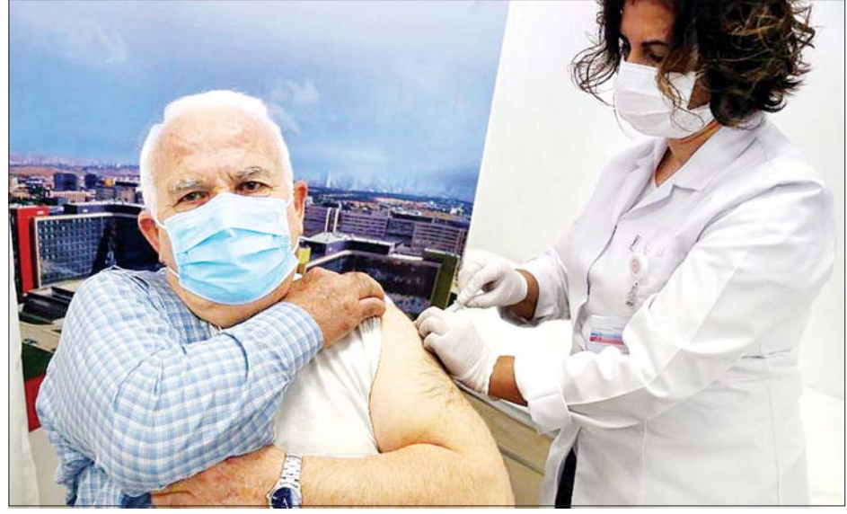
တူရကီနိုင်ငံ အန်ကာရာတွင် ပြည်သူတစ်ဦး ကိုဗစ်-၁၉ ကာကွယ်ဆေးထိုးနှံမှုခံယူနေသည်ကို တွေ့ရစဉ်။