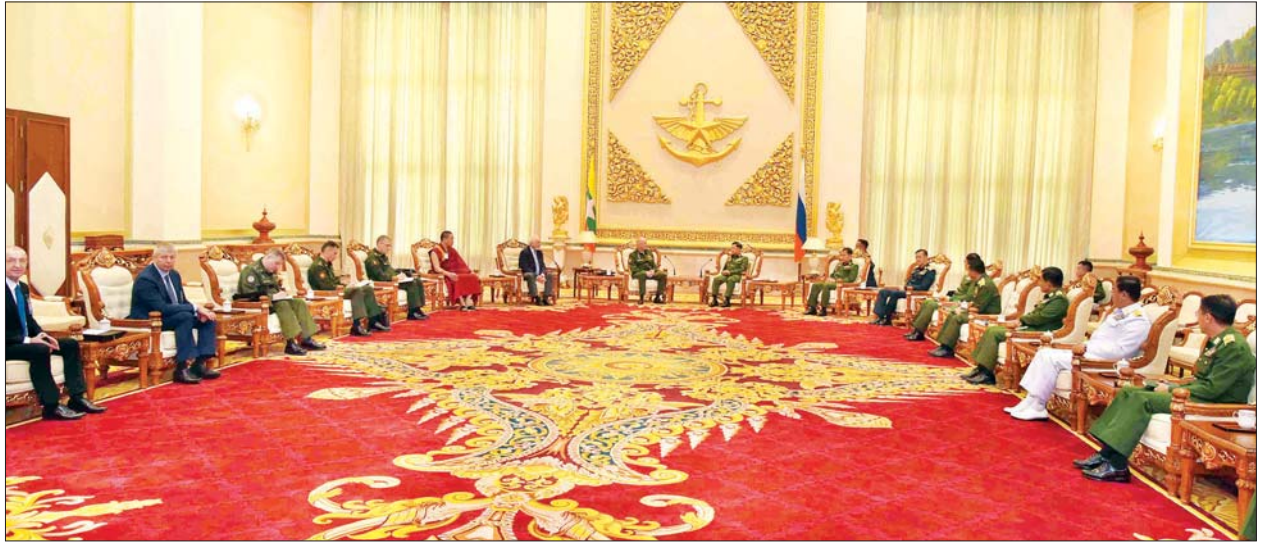
နိုင်ငံတော်စီမံအုပ်ချုပ်ရေးကောင်စီဥက္ကဋ္ဌ တပ်မတော်ကာကွယ်ရေးဦးစီးချုပ် ဗိုလ်ချုပ်မှူးကြီး မင်းအောင်လှိုင် ရုရှားဖက်ဒရေးရှင်းနိုင်ငံ ဒုတိယကာကွယ်ရေးဝန်ကြီး Colonel General Alexander Vasilyevich Fomin ဦးဆောင်သော ကိုယ်စားလှယ်အဖွဲ့အား လက်ခံတွေ့ဆုံစဉ်။

ဆက်လက်ပြီး နှစ်နိုင်ငံတပ်မတော်နှစ်ရပ်အကြားစစ်ဘက်နည်းပညာ ပူးပေါင်းဆောင်ရွက်ရေးဆိုင်ရာကိစ္စရပ်များ၊ နှစ်နိုင်ငံအကြား၊ လူမှုရေး၊ စီးပွားရေး၊ ပညာရေး၊ လေ့ကျင့်ရေးနှင့် ကဏ္ဍပေါင်းစုံတွင် ပူးပေါင်းဆောင်ရွက်ရေးဆိုင်ရာကိစ္စရပ်များ၊ သင်တန်းသားများ စေလွှတ်ရေးဆိုင်ရာကိစ္စရပ်များနှင့် COVID-19 ရောဂါကာကွယ်၊ ကုသ၊ ထိန်းချုပ်ရေးလုပ်ငန်းများတွင် ကာကွယ်ဆေးနှင့် နည်းပညာပေးလှမ်းဆောင်ရာကိစ္စရပ်များနှင့် ချစ်ကြည်ရေးခရီး