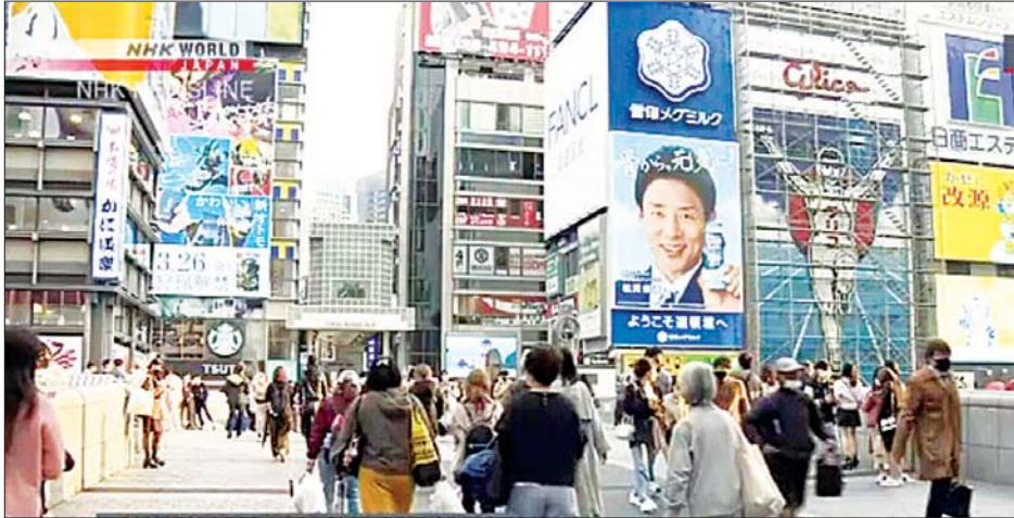
ဂျပန်နိုင်ငံ တိုကျိုရှိ လမ်းတစ်ခုပေါ်တွင် ပြည်သူများ သွားလာနေသည်ကို တွေ့ရစဉ်။