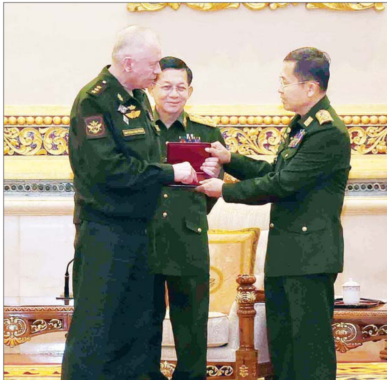
ရုရှားဖက်ဒရေးရှင်းနိုင်ငံ ဒုတိယကာကွယ်ရေးဝန်ကြီး Colonel General Alexander Vasilyevich Fomin က ဒုတိယတပ်မတော်ကာကွယ်ရေးဦးစီးချုပ် ကာကွယ်ရေးဦးစီးချုပ် (ကြည်း) ဒုတိယဗိုလ်ချုပ်မှူးကြီး စိုးဝင်းအား “တိုက်ပွဲဝင် သွေးသောက်စိတ်မြှင့်တင်မှု” ဆုတံဆိပ် ပေးအပ်ချီးမြှင့်စဉ်။

19 ရောဂါဖြစ်ပွားမှုများနှင့် မိမိတို့ နိုင်ငံ၏ နိုင်ငံရေးဖြစ်ပေါ်ပြောင်းလဲမှုအခြေအနေများအကြားမှ ယခုကဲ့သို့ ပါဝင်တက်ရောက်ရန် လာရောက်ခြင်းကို ဝမ်းမြောက်စွာ ကြိုဆိုပါကြောင်းနှင့် မိမိတို့ နှစ်နိုင်ငံသည် အလှမ်းဝေးသော်လည်း တစ်ဦးနှင့်တစ်ဦး လေးစားတန်ဖိုးထားမှုများကို ပိုမိုခိုင်မြဲစေမည်ဖြစ်ပါကြောင်း ဦးစွာ ပြောကြားသည်။