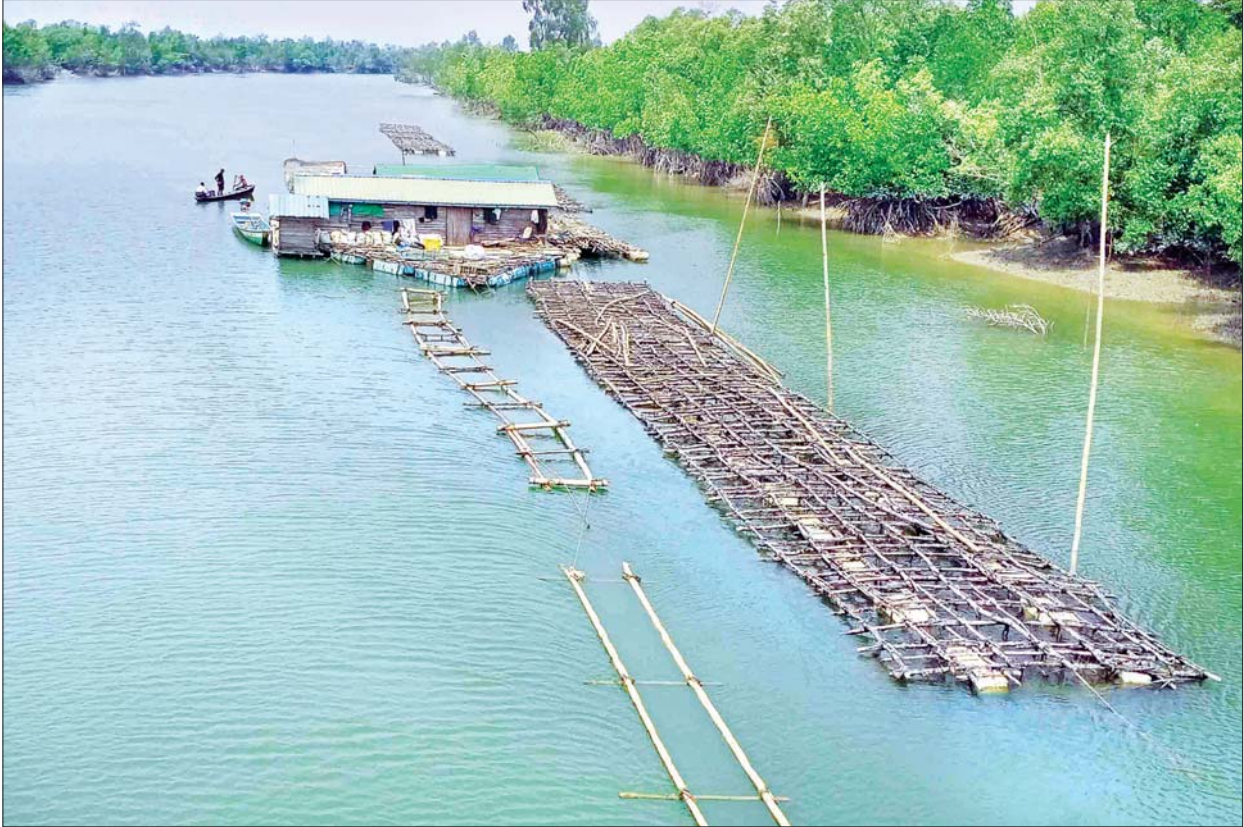
ကယုကမာ စီးပွားဖြစ်မွေးမြူရေးအတွက် ချောင်းအတွင်းချထားသော ဝါးဖောင်များ။

ကျောက်ဖြူ မတ် ၂၆ ရခိုင်ပြည်နယ် ရမ်းဗြဲမြို့နယ်ထဲရှိ သဇင်တန်ပေါက် တံတားအနီး ချောင်းအတွင်း ဝါးဖောင်များဖြင့် စီးပွားဖြစ်မွေးမြူလျက်ရှိသော ကယုကမာ မွေးမြူရေးလုပ်ငန်းများမှာ လက်ရှိအချိန်တွင် အောင်မြင် ဖြစ်ထွန်းနေပြီး ပင်လယ်စာ ရေထွက်ကုန်ဈေးကွက်အတွင်းသို့ ဖြန့်ဖြူးတင်ပို့ရောင်းချသွားနိုင်ရန် စီစဉ်ဆောင်ရွက်လျက်ရှိကြောင်း မွေးမြူရေးလုပ်ငန်းရှင်တစ်ဦးထံမှ သိရသည်။