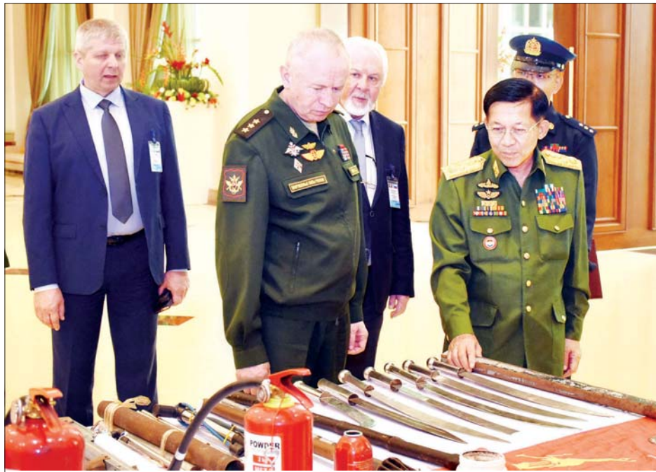
နိုင်ငံတော်စီမံအုပ်ချုပ်ရေးကောင်စီဥက္ကဋ္ဌ တပ်မတော်ကာကွယ်ရေးဦးစီးချုပ် ဗိုလ်ချုပ်မှူးကြီး မင်းအောင်လှိုင် သိမ်းဆည်းရမိခဲ့သည့် ဆူပူအကြမ်းဖက်လှုပ်ရှားမှုများတွင် အသုံးပြုလာသော ဒေသန္တရလုပ် လက်နက်၊ ကိရိယာပစ္စည်းများအား ရုရှားဖက်ဒရေးရှင်းနိုင်ငံ ဒုတိယကာကွယ်ရေးဝန်ကြီးနှင့် အဖွဲ့ဝင်များ၊ ရုရှားသတင်းမီဒီယာများက လေ့လာကြည့်ရှုမှုကို လိုက်လံရှင်းလင်းပြသစဉ်။

စဉ်များ အပြန်အလှန်သွားရောက် ရေးဆိုင်ရာကိစ္စရပ်များကို ခင်မင် ရင်းနှီးစွာ အပြန်အလှန်ဆွေးနွေး ခဲ့ကြသည်။ တွေ့ဆုံပွဲအပြီးတွင် နိုင်ငံတော် စီမံအုပ်ချုပ်ရေး ကောင်စီဥက္ကဋ္ဌ တပ်မတော်ကာကွယ်ရေး ဦးစီး ချုပ်က ရုရှားဖက်ဒရေးရှင်းနိုင်ငံ ဒုတိယကာကွယ်ရေးဝန်ကြီးအား နှစ်နိုင်ငံနှင့် တပ်မတော်နှစ်ရပ် အကြား ချစ်ကြည်ရင်းနှီးမှုနှင့် စစ်ဘက်ဆိုင်ရာ ပူးပေါင်းဆောင် ရွက်မှုတည်တံ့ခိုင်မြဲရေးကို ပိုမို တိုးတက်အောင် ဆောင်ရွက်နိုင်ခဲ့ သဖြင့် ဂုဏ်ထူးဆောင်တံဆိပ် နှင့် ဂုဏ်ထူးဆောင်စားကို ဂုဏ်ပြု ပေးအပ်သည်။ ထို့နောက် ရုရှားဖက်ဒရေးရှင်း နိုင်ငံ ဒုတိယကာကွယ်ရေးဝန်ကြီး က ကောင်စီဒုတိယဥက္ကဋ္ဌ ဒုတိယ တပ်မတော်ကာကွယ်ရေး ဦးစီး