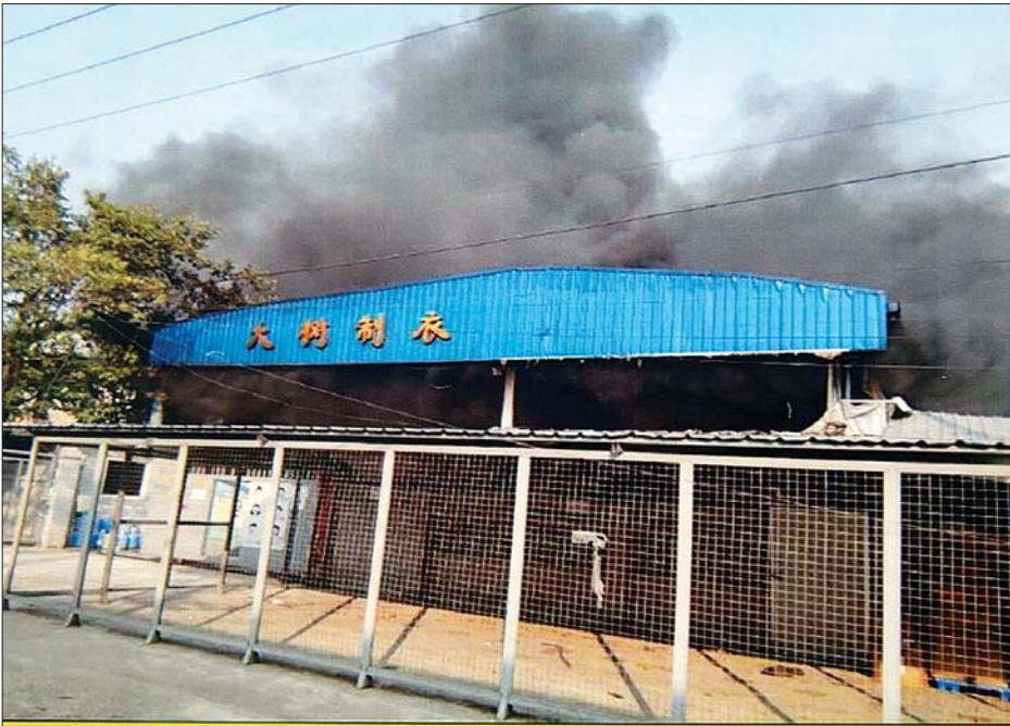
လှိုင်သာယာစက်ရုံများအား အကြမ်းဖက်မီးရှို့ဖျက်ဆီးခြင်း