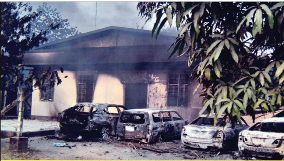
ချမ်းအေးသာစံမြို့နယ်၊ ချမ်းမြသာစည်မြို့နယ်နှင့် လှိုင်သာယာမြို့နယ်ရဲစခန်းများအား အကြမ်းဖက်မီးရှို့ဖျက်ဆီးခြင်း