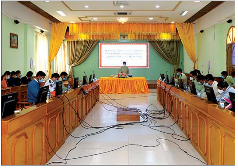
စစ်ကိုင်းတိုင်းဒေသကြီး ကိုဗစ်-၁၉ ထိန်းချုပ်ရေးနှင့် အရေးပေါ်တုံ့ပြန်ရေးကော်မတီ၏ (၁/၂၀၂၁) လုပ်ငန်းညှိနှိုင်းအစည်းအဝေးကျင်းပစဉ်။

လည်းကောင်း၊ ကိုဗစ်-၁၉ ရောဂါအသိပညာပေးရေး လုပ်ငန်းများကိုလည်းကောင်း အသေးစိတ်ဆွေးနွေးတင်ပြမှုများအပေါ် တိုင်းဒေသကြီး စီမံအုပ်ချုပ်ရေးကောင်စီဥက္ကဋ္ဌက လိုအပ်သော အစီအမံများကို ဖြည့်စွက်ရှင်းလင်းပြောကြားပြီး တိုင်းဒေသကြီးအတွင်း ကိုဗစ်-၁၉ ထိန်းချုပ်ရေးနှင့် ကာကွယ်ရေးလုပ်ငန်းများကို သက်ဆိုင်ရာ တာဝန်ရှိသူများအားလုံး ပူးပေါင်းဆောင်ရွက်သွားကြရန် မှာကြားသည်။ တိုင်းဒေသကြီး(ပြန်/ဆက်)