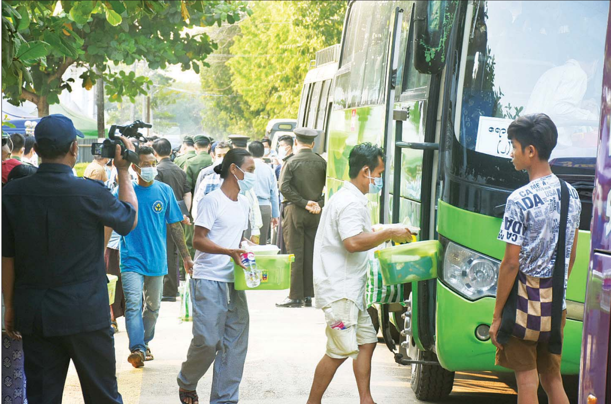
အိန္ဒိယနိုင်ငံ အန်ဒမန်ကျွန်းမှ ပြန်လည်ရောက်ရှိလာသည့် မြန်မာနိုင်ငံသားများအား လှိုင်မြို့နယ် Quarantine Center မှ သက်ဆိုင်ရာပြည်နယ် နှင့် တိုင်းဒေသကြီးအသီးသီးသို့ ပို့ဆောင်ပေးစဉ်။

နေပြည်တော် မတ် ၂၃ နိုင်ငံတော် စီမံအုပ်ချုပ်ရေး ကောင်စီဥက္ကဋ္ဌ တပ်မတော် ကာကွယ်ရေးဦးစီးချုပ် ဗိုလ်ချုပ် မျိုးကြီး မင်းအောင်လှိုင်၏ လမ်းညွှန် မှာကြားချက်အရ တပ်မတော် (ရေ) မှ စစ်ရေယာဉ် များဖြင့် သွားရောက်ခေါ်ဆောင် ခဲ့သည့် အိန္ဒိယနိုင်ငံ အန်ဒမန် ကျွန်းမှ ပြန်လည်ရောက်ရှိ လာသည့် မြန်မာနိုင်ငံသား ရေလုပ်သား ၇၀ ကို ရန်ကုန် တိုင်းဒေသကြီး၊ လှိုင်မြို့နယ်၊ စစ်ကြောရေးနှင့် တည်းခိုရေး စခန်းရှိ COVID-19 ရောဂါ သီးသန့်စောင့်ကြည့်ရမည့်သူများ ထားရှိသည့် Quarantine Center ၌ သီးသန့်ထားရှိရာမှ ယနေ့တွင် သတ်မှတ်ရက် ပြည့်မြောက် သဖြင့် သက်ဆိုင်ရာပြည်နယ်နှင့် တိုင်းဒေသကြီး အသီးသီးသို့ တပ်မတော်နှင့် တာဝန်ရှိသူများက