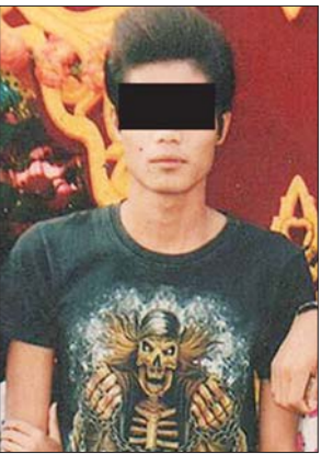
ပြစ်မှုကျူးလွန်သူ ကတိုး(ခ) သူရ