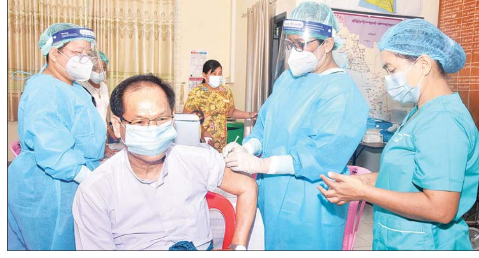
တင်ထွန်း(ပြန်/ဆက်)

က ကိုယ်အပူချိန်တိုင်းတာပေးခြင်း၊ သွေးပေါင်ချိန်တိုင်းတာပေးခြင်း၊ သွေးအတွင်း အောက်ဆီဂျင် ပါဝင်မှုပမာဏ တိုင်းတာပေးခြင်းတို့ကို ဆောင်ရွက်ပေးပြီး ပုံမှန်အနေအထားရှိမှသာ ကာကွယ်ဆေးထိုးနှံပေးကြခြင်းဖြစ်သည်။ ကိုဗစ်-၁၉ ရောဂါကာကွယ်ဆေးကို ပြည်နယ်စီမံအုပ်ချုပ်ရေးကောင်စီဥက္ကဋ္ဌ ဒေါက်တာအောင်ကျော်မင်း၊ ပြည်နယ်စီမံအုပ်ချုပ်ရေးကောင်စီအဖွဲ့ဝင်များ၊ အတွင်းရေးမှူးနှင့် ပြည်နယ်စီမံအုပ်ချုပ်