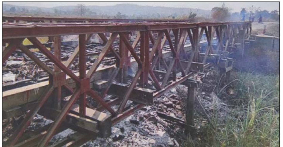
ကျွန်းလှ-ကောလင်းကားလမ်းပေါ်ရှိ ဒေါင်းမြူးချောင်းကူးတံတားအား မီးရှို့ဖျက်ဆီး