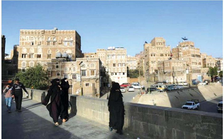
ယီမင်နိုင်ငံ ဆာနားမြို့ကို တွေ့ရစဉ်။

ဆေးကုမ္ပဏီလေးခုရှိ ဂျပန်ပြည်တွင်းထုတ် ကိုဗစ် -၁၉ ကာကွယ်ဆေးကို စမ်းသပ် နေသည့် ဆေးကုမ္ပဏီလေးခုရှိကြောင်း သိရသည်။ ကာကွယ်ဆေး လက်တွေ့စမ်းသပ်မှုတွင် ကျန်းမာရေးကောင်းမွန်သည့် လူငယ် ၁၅၂ ဦး ပါဝင်သည်ဟု ခိုင်ချိဆန်ကျိုကုမ္ပဏီက ပြောသည်။ ကာကွယ်ဆေး၏ လုံခြုံစိတ်ချရမှု၊ ပဋိပစ္စည်းထုတ်လုပ်နိုင်မှု တို့ကို သုတေသီများက စစ်ဆေးသွားမည်ဟု ကုမ္ပဏီဘက်က ပြောသည်။ ထို့ပြင် ဆေးပမာဏ မည်မျှပေးသင့်သည်ကိုလည်း စမ်းသပ်သွားမည်ဟု သိရသည်။ လက်တွေ့စမ်းသပ်မှုပြုလုပ်နေ ဂျပန်နိုင်ငံတွင် ပိုက်ဇာကာကွယ်ဆေးထိုးနှံမှုများကို စတင် နေပြီဖြစ်သည်။ နောက်ထပ် ကိုဗစ်- ၁၉ ကာကွယ်ဆေးစမ်းသပ်မှု ကိုစတင်နေသည့်ကုမ္ပဏီမှာ ဂေအမ်ဘိုင်အိုလောဂျစ်ဖြစ်ပြီး ကျန်းမာသည့် လူငယ် ၂၁၀ ဖြင့် လက်တွေ့စမ်းသပ်မှု ပြုလုပ်နေ သည်။ အဆိုပါကုမ္ပဏီနှစ်ခုမှာ ဂျပန်နိုင်ငံအတွင်း ကိုဗစ် -၁၉ ကာကွယ်ဆေးထုတ်လုပ်နေသည့် တတိယနှင့် စတုတ္ထမြောက် ကုမ္ပဏီနှစ်ခုဖြစ်သည်ဟု ကျန်းမာရေးဝန်ကြီးဌာနက ပြောသည်။ အင်န်အိတ်ချီကေ