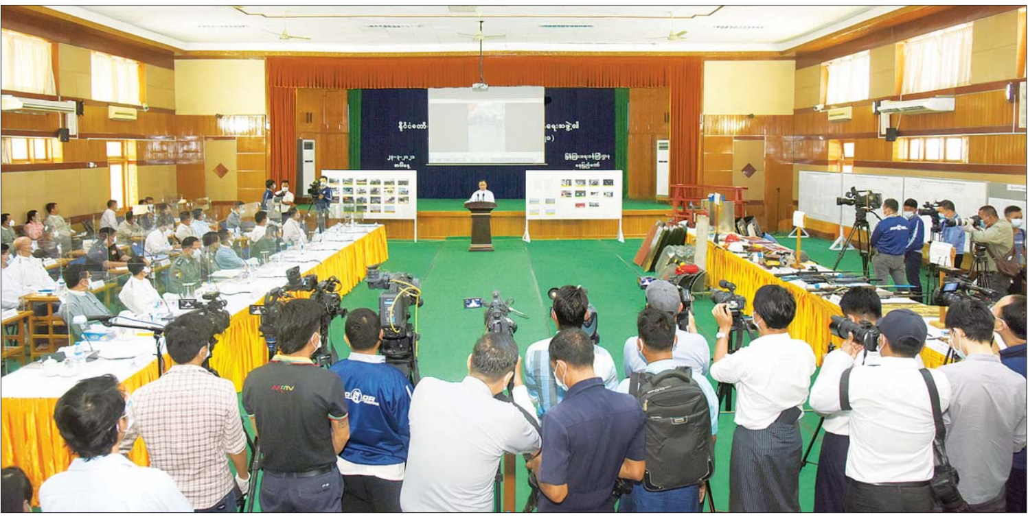
နိုင်ငံတော် စီမံအုပ်ချုပ်ရေးကောင်စီ၊ သတင်းထုတ်ပြန်ရေးအဖွဲ့ခေါင်းဆောင် ဗိုလ်မှူးချုပ်ဇော်မင်းထွန်း၊ သတင်းမီဒီယာများ၏ သိရှိလိုသည့် မေးမြန်းမှုများကို ပြန်လည်ဖြေကြားစဉ်။

နေပြည်တော် မတ် ၂၃ နိုင်ငံတော် စီမံအုပ်ချုပ်ရေးကောင်စီ၊ သတင်းထုတ်ပြန်ရေးအဖွဲ့၏ ၃/၂၀၂၁ ကြိမ်မြောက် သတင်းစာရှင်းလင်းပွဲကို ယနေ့မုန်းလွဲပိုင်းတွင် ပြန်ကြားရေး ဝန်ကြီးဌာန၌ ကျင်းပပြုလုပ်ပြီး နိုင်ငံတော် စီမံအုပ်ချုပ်ရေးကောင်စီ၊ သတင်းထုတ်ပြန်ရေးအဖွဲ့ခေါင်းဆောင် ဗိုလ်မှူးချုပ်ဇော်မင်းထွန်း၊ ပြည်ထောင်စု ရွေးကောက်ပွဲ ကော်မရှင်အဖွဲ့ဝင် ဦးခင်မောင်ဦးနှင့် ဌာနဆိုင်ရာ သတင်း ထုတ်ပြန်ရေးအဖွဲ့ ကိုယ်စားလှယ်များက သတင်းမီဒီယာများ၏ သိရှိလိုသည့် မေးမြန်းမှုများကို ပြန်လည်ဖြေကြားသည်။ သတင်းစာရှင်းလင်းပွဲ မစတင်မီ တက်ရောက်လာကြသူများအား COVID-19 ရောဂါကြိုတင်ကာကွယ်ရေးအတွက် တာဝန်ရှိသူများက လိုအပ်သည့်ကျန်းမာ ရေးဆိုင်ရာများ ဆောင်ရွက်ပေးပြီး သတ်မှတ်အကွာအဝေးအတိုင်း နေရာ ချထားပေးသည်။