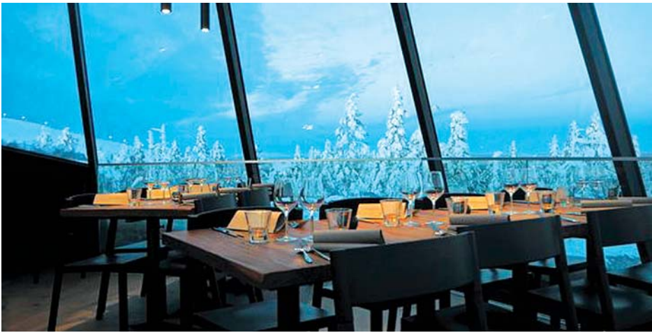
ဖင်လန်နိုင်ငံရှိ စားသောက်ဆိုင်တစ်ဆိုင်ကို တွေ့ရစဉ်။

သူ ၃၀၆ ဦး ရှိသည်ဟု သိရသည်။ အစိုးရ၏ အဆိုပြုချက်ကို မတ် ၂၃ ရက်တွင် ပါလီမန်သို့ တင်သွင်း ခဲ့သည်။ ပါးစပ်၊ နှာခေါင်းစည်း မဖြစ် မနေ တပ်ဆင်ရခြင်း အပါအဝင် နောက်ထပ် တင်းကျပ်မှုများ ပြုလုပ်သွားရန် အစိုးရက ဆွေးနွေးလျက်ရှိသည်။ ဆင်ဟွာ