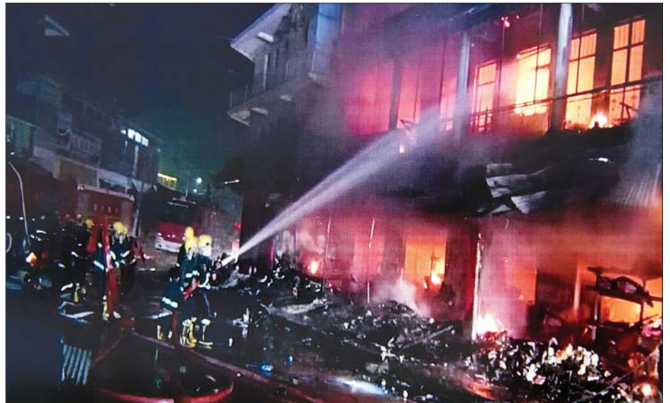
လောက်ကိုင်မြို့ရှိ ဈေးဆိုင်များအား မီးရှို့ဖျက်ဆီးခြင်း