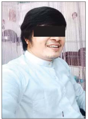
အဓိက ကြီးကိုဇေစိုင်းသူ မင်းခန့်

ထန်းတပင်မြို့နယ်တို့ ဖြစ် ကြောင်း။ သတ်ဖြတ်ခံရသူ အမျိုးသမီး ကို ကားဖြင့် ဖမ်းဆီးခေါ်ဆောင် သွားရာတွင် ဝက်ကြီးနှင့်အတူ ကတိုး(ခ)သူရ(စစ်စစ်ဆဲ) တေး ဥယျဉ် (၁၃)လမ်း အောက်ထိပ် လှိုင်သာယာအရှေ့မြို့နယ်နေသူ ပါရှိပြီး တွဲတေးမြို့နယ် မျောက်ရိုး ကျေးရွာအနီးအရောက်တွင် ကတိုး (ခ) သူရက သေဆုံးသူအမျိုးသမီး ကို ဓားဖြင့် ၇ ချက် ထိုးသတ်ခဲ့ ကြောင်းနှင့် သေဆုံးသူထံမှ လေ့ကတ်သီးပါ ရွှေခွဲကြိုး (၁)ကုံးနှင့် လက်စွပ်(၁)ကွင်းတို့ကို ဖြုတ်ယူခဲ့ပြီး ၎င်းပစ္စည်းများကို လှမျိုးအောင်(ခ) ကိုမျိုး(ခ)ဝက်ကြီး ထံတွင် ထားရှိသဖြင့် နေအိမ်မှ ပြန်လည်သိမ်းဆည်း ရမိခဲ့ ကြောင်း။ အမှုအား ခိုင်မာစွာ တည်ဆောက်လျက်ရှိပြီး ဖမ်းဆီး ရမိရန် ကျန်ရှိနေသူများအား ဆက်လက် ဖော်ထုတ်ဖမ်းဆီးနိုင် ရေးနှင့် ဖမ်းဆီးရမိသူများကို စစ်ခုံရုံးဖြင့် ထိရောက်စွာအရေးယူ နိုင်ရေး ဆက်လက်ဆောင်ရွက် လျက်ရှိကြောင်း သိရသည်။ သတင်းစဉ်