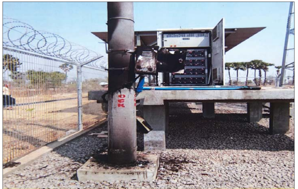
ကနီမြို့နယ် ဆက်သွယ်ရေးတာဝါတိုင်အား မီးရှို့ဖျက်ဆီးခြင်း