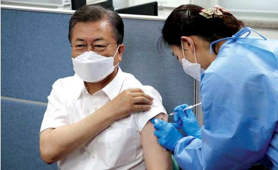
တောင်ကိုရီးယားသမ္မတ ကိုဗစ် -၁၉ ကာကွယ်ဆေး ထိုးနှံမှုခံယူနေစဉ်။

ကာကွယ်ဆေးနှင့်ပတ်သက်ပြီး အများပြည်သူ ၏စိုးရိမ်ပူပန်မှုကို ထိန်းညှိပေးနိုင်ရေးအတွက် ယခုလိုပြောကြားခဲ့ခြင်းဖြစ်သည်။ ဂျာမနီ၊ ပြင်သစ်၊ အီတလီနှင့် အခြားသော ဥရောပနိုင်ငံများသည် အကဲခတ်ရာဇန်ကာ ကာကွယ်ဆေးထိုးနှံမှု ပြန်လည်စတင်နေပြီဖြစ်သည်။ သွေးခဲမှုဖြစ်စဉ် ပေါ်ပေါက်သည်ဟု သတင်းများ ထွက်ပေါ်ပြီးနောက် အကဲခတ်ရာဇန်ကာ ကာကွယ် ဆေးထိုးနှံမှုကို ဆိုင်းငံ့ခဲ့ကြခြင်းဖြစ်သည်။ ကာကွယ် ဆေး၏ လုံခြုံစိတ်ချရမှုနှင့် အစွမ်းထက်မှုတို့အတွက် ဥရောပဆေးအေဂျင်စီက အတည်ပြုခဲ့သည်။ သမ္မတ မွန်ဂျေအင်း ဖြစ်နိုင်နိုင်ငံသို့ ခရီးသွားရောက်မည်ဖြစ်ပြီး ၎င်းနှင့်အတူ ခေါင်းဆောင်ပိုင်းအချို့လည်း ပါဝင်မည်ဖြစ်သည်။ အသက် ၆၅နှစ်နှင့်အထက် လူများနှင့် ဆေးဘက် ဆိုင်ရာဝန်ထမ်းများကို ကိုရီးယားရောဂါထိန်းချုပ် ရေးနှင့် ကာကွယ်ရေးအေဂျင်စီက မတ် ၂၃ ရက်တွင်