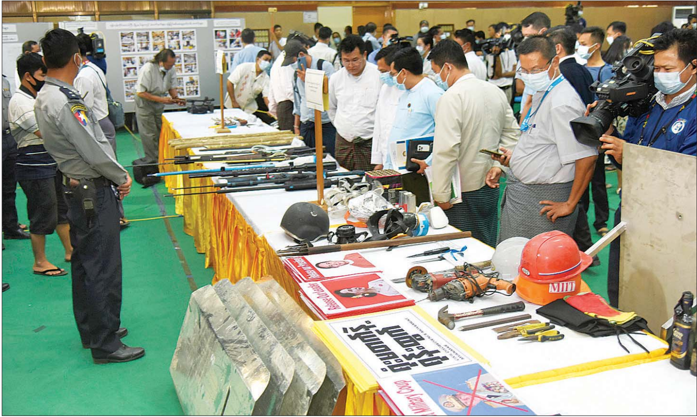
သတင်းစာရှင်းလင်းပွဲတွင် တက်ရောက်လာကြသူများက သိမ်းဆည်းရမိသည့် ဆူပူအကြမ်းဖက်လှုပ်ရှားမှုများတွင် အသုံးပြုလာသော ဒေသန္တရလုပ်လက်နက်ကိရိယာပစ္စည်းများ ခင်းကျင်းပြသထားမှုကို ကြည့်ရှုလေ့လာကြစဉ်။

မှ ၁၉ ရက်နေ့အထိ စက်ရုံ၊ အလုပ်ရုံများ မီးရှို့ဖျက်ဆီးခံရမှုအနေဖြင့် အထည်ချုပ်စက်ရုံ ၁၀ ရုံ၊ အထည်ချုပ်လုပ်ငန်းသုံး စက်ပစ္စည်းစက်ရုံ ၂ ရုံ၊ လျှပ်စစ်ပစ္စည်းစက်ရုံ ၁ ရုံ၊ ဓာတ်မြေဩဇာစက်ရုံ ၁ ရုံ၊ အိတ်ချုပ်စက်ရုံ ၁ ရုံ၊ ပီနီအိတ်စက်ရုံ ၁ ရုံနှင့် ဖော့ပစ္စည်းစက်ရုံ ၁ ရုံ၊ စုစုပေါင်း စက်ရုံ၊ အလုပ်ရုံ မီးလောင်ဆုံးရှုံးမှု ၁၇ ရုံဖြစ်ပြီး ယင်းစက်ရုံ၊ အလုပ်ရုံများတွင် အလုပ်လုပ်ကိုင်နေသူများ၊ မှီခိုနေရသူများ လူဦးရေသောင်းချီ၍ အလုပ်လက်မဲ့ဖြစ်ခဲ့ရသည့် အခြေအနေများ၊ နိုင်ငံ့ကုန်ထုတ်စွမ်းအားစုတွင် အရေးကြီးသည့် ပြည်တွင်းပြည်ပရင်းနှီး မြှုပ်နှံမှု