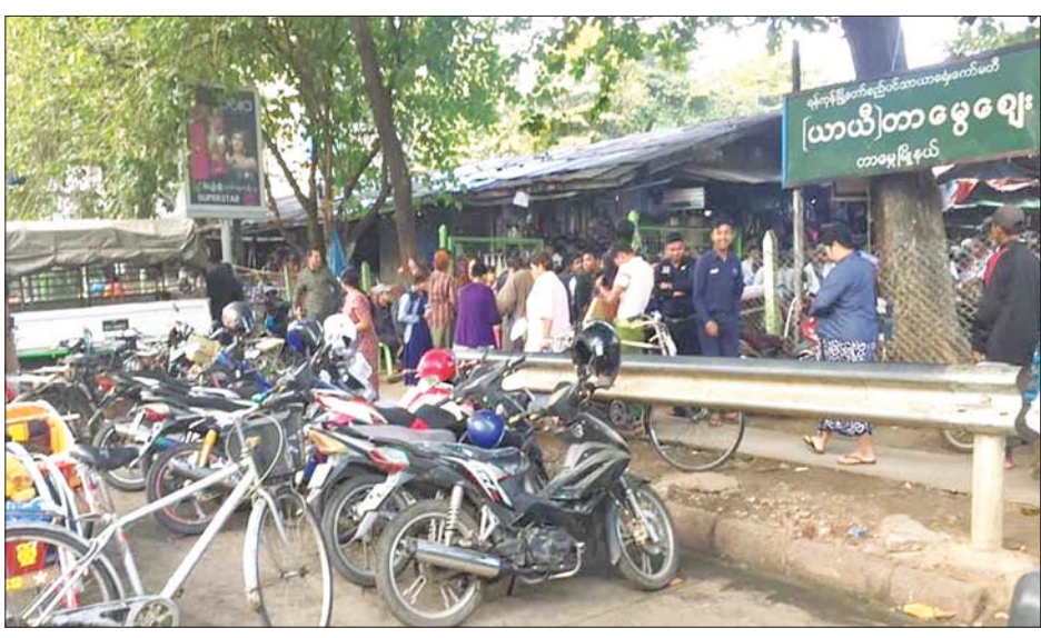
တာမွေယာယီဈေး၌ ဈေးရောင်း ဈေးဝယ်များဖြင့် စည်ကားနေသည်ကို တွေ့ရစဉ်။