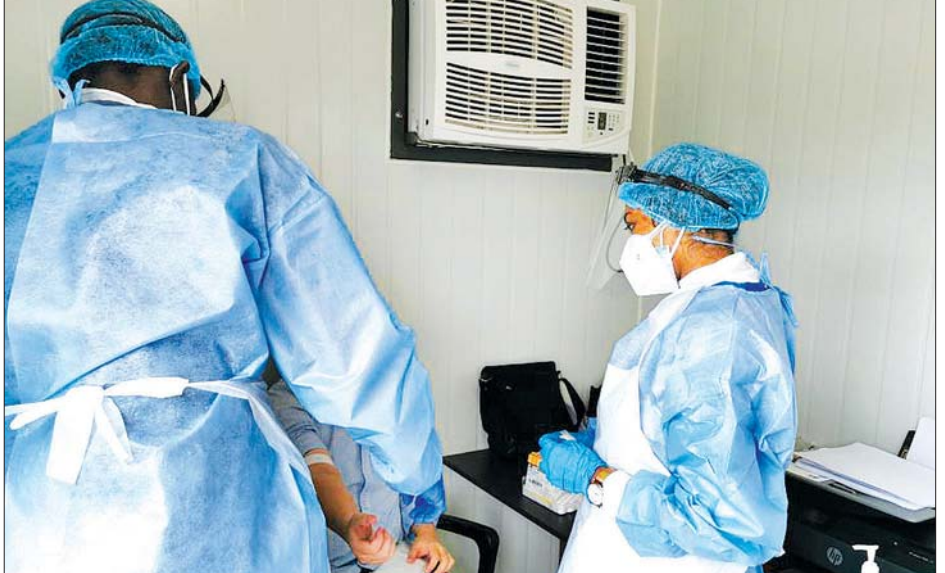
တောင်အာဖရိကတွင် ကျန်းမာရေးဝန်ထမ်းများက လူနာတစ်ဦးကို ကိုဗစ်-၁၉ ရှိ မရှိဆေးစစ်ပေးနေစဉ်။