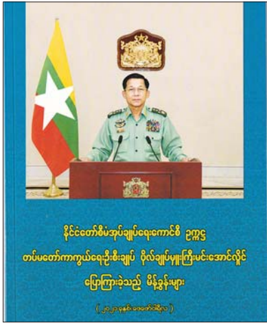
နိုင်ငံတော်စီမံအုပ်ချုပ်ရေးကောင်စီ ဥက္ကဋ္ဌ တပ်မတော်ကာကွယ်ရေးဦးစီးချုပ် ဗိုလ်ချုပ်မှူးကြီးမင်းအောင်လှိုင် ပြောကြားခဲ့သည့် မိန့်ခွန်းများ (၂၀၂၀ ခုနှစ်၊ မတ်လအတွက်)

“နိုင်ငံ့ဝန်ထမ်းများဟာ နိုင်ငံ့အကျိုး၊ ပြည်သူ့အကျိုးကို တိုက်ရိုက်သယ်ပိုးခွင့် ရရှိသူများလည်း ဖြစ်ပါတယ်။ နိုင်ငံတော် ရဲ့ ဥပဒေပြုရေး၊ အုပ်ချုပ်ရေးနဲ့ တရား စီရင်ရေးကဏ္ဍများ ကောင်းမွန်စွာ လည်ပတ်နိုင်ဖို့အတွက် အဆင့်ဆင့် တာဝန်ယူမှု၊ တာဝန်ခံမှုတွေနဲ့ ပြည်သူ့ ကောင်းကျိုးကို လုပ်ဆောင်နေကြရတဲ့