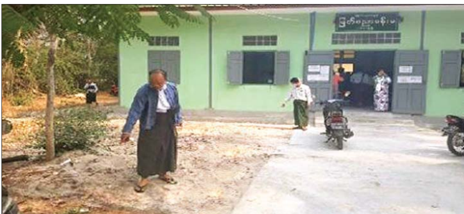
လက်လုပ်အသံမိုင်း ပေါက်ကွဲသည့်နေရာအား ပြသစဉ်။

ယင်းသတင်း ထုတ်ပြန်ချက်အရ ဆူပူအကြမ်းဖက်သူ လူအုပ်စုများအနေဖြင့် နိုင်ငံတော်အစိုးရ၏ အုပ်ချုပ်မှုယန္တရားနှင့် ရပ်ရွာအေးချမ်းသာယာရေး၊ တရားဥပဒေစိုးမိုးရေး ပျက်ပြားစေရေး တို့အတွက် နောက်ကွယ်မှ ကြိုးကိုင် ခြယ်လှယ်နေသူများ၏ သွေးထိုးလှုံ့ဆော်မှုများဖြင့် အကြမ်းဖက်လုပ်ရပ်များ ပြုလုပ်လျက်ရှိရာ ရဲကင်း၊ ရဲစခန်းများအား လူအင်အားဖြင့် ဝင်ရောက်စီးနင်းခြင်း၊ မီးပုလင်းများ အသုံးပြု၍ မီးရှို့ဖျက်ဆီးရန် ကြံစည်