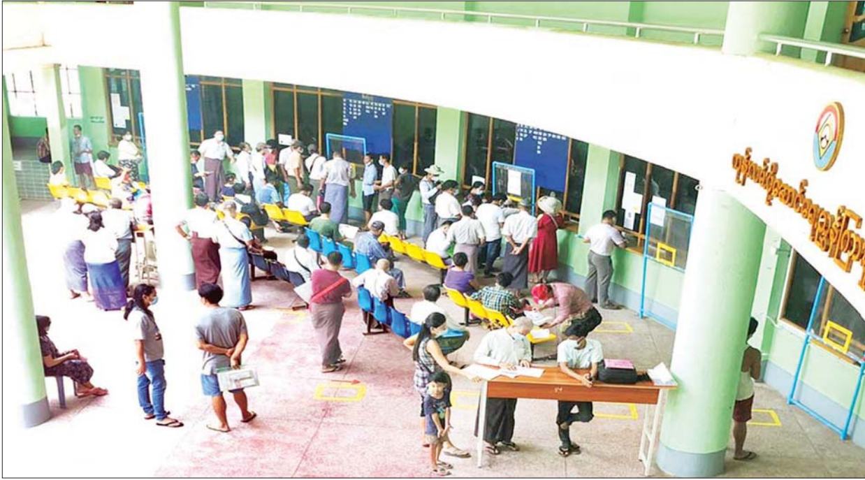
နှစ်လဲ သက်တမ်းတိုး ယာဉ်မှတ်ပုံတင်လုပ်ငန်းများ လာရောက်ဆောင်ရွက်သူများအား တွေ့ရစဉ်။