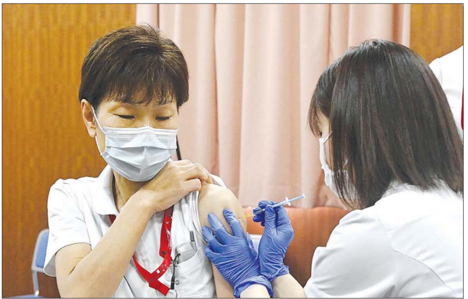
ဂျပန်နိုင်ငံ တိုကျိုမြို့တွင် ကျန်းမာရေးဝန်ထမ်းတစ်ဦးကို ကိုဗစ်-၁၉ ကာကွယ်ဆေးထိုးပေးနေစဉ်။

တိုင်းပြည်အတွင်း ကာကွယ်ဆေးထိုးနှံပေးမှုမှာ ကျန်းမာရေးဝန်ထမ်းများကို ထိုးပေးသည့်အဆင့်တွင်ပင် ရှိနေသေးပြီး ဧပြီလလယ်ပိုင်းမှ သက်ကြီးရွယ်အိုများကို ကာကွယ်ဆေးထိုးပေးမည်ဟု ရည်ရွယ်ထားရာ ယင်းနောက်ပိုင်းတွင် ယခုလို ရလဒ်ထွက်ပေါ်လာခြင်းဖြစ်သည်။ အသက် ၆၅ နှစ်နှင့်အထက် လူများအတွက် ကာကွယ်ဆေးကို ဇွန်လကုန်ပိုင်းမှ အစိုးရက ဒေသခံအစိုးရများဆီ ဖြန့်ဝေပေးမည်ဟု သိရသည်။ ကိုဗစ်-၁၉ နှင့်ပတ်သက်ပြီး ပြည်သူများထံ စစ်တမ်းကောက်ယူရာ ၈၂ ဒသမ ၂ ရာခိုင်နှုန်းမှာ ဗီဇပြောင်း ကိုရိုနာဗိုင်းရပ်စ် ဂျပန်နိုင်ငံတွင် ယုံနုံလာမည်ကို စိုးရိမ်နေကြသည်ဟု ဖြေကြားခဲ့ကြသည်။ တိုကျိုမြို့နှင့် အနီးတစ်ဝိုက်ဒေသများတွင် အရေးပေါ်အခြေအနေကြေညာထားသည်မှာ မတ် ၂၁ ရက်တွင် ပြီးဆုံးသွားပြီဖြစ်သည်။ အခြားခရိုင်များတွင်လည်း အရေးပေါ် အခြေအနေကြေညာထားမှုကို ဖယ်ရှားပေးခဲ့ပြီးဖြစ်သည်။ ထို့ပြင် ကိုဗစ်-၁၉ နှင့်ပတ်သက်၍ တင်းကျပ်သည့် စည်းကမ်းများကိုလည်း ဖြေလျှော့ပေးခဲ့ပြီး ဖြစ်သည်။ ကျိုဒို