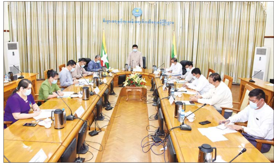
ပြည်ထောင်စုဝန်ကြီး ဒေါက်တာပွင့်ဆန်း လုပ်ငန်းညှိနှိုင်းအစည်းအဝေး၌ အမှာစကား ပြောကြားစဉ်။

ထို့နောက် ရင်းနှီးမြှုပ်နှံမှုနှင့် နိုင်ငံခြားစီးပွား ဆက်သွယ်ရေးဝန်ကြီးဌာန ပြည်ထောင်စုဝန်ကြီး ဦးအောင်နိုင်ဦးက မြန်မာနိုင်ငံ ဆန်စပါးအသင်းချုပ်က ဘင်္ဂလားဒေ့ရှ်နိုင်ငံသို့ G to G အစီအစဉ်ဖြင့် ဆန်တန်ချိန် (၁)သိန်း တင်ပို့ရောင်းချရေးနှင့်ပတ်သက်၍ လုပ်ငန်းများ အဆင်ပြေ ချောမွေ့စေရေးအတွက် Export Financing အနေဖြင့် ငွေကျပ် ဘီလီယံ (၃၀) ကို ချေးပေးခဲ့ပါကြောင်း၊ မြန်မာ Exporter များအနေဖြင့် နိုင်ငံတကာဆန်ဈေးကွက်ပြောင်းလဲမှုများကို မျက်ခြည်မပြတ်လေ့လာကာ ကြိုတင်ပြင်ဆင်မှုများ ဆောင်ရွက်သင့်ပါကြောင်း၊ မြန်မာဆန်ပြည်ပသို့ အရှိန်အဟုန်မပျက် တင်ပို့နိုင်ရေးအတွက် အစိုးရနှင့် ပုဂ္ဂလိက ပိုမိုပူးပေါင်းဆောင်ရွက်သွားကြရမည်ဖြစ်ပါကြောင်း ပြောကြားသည်။