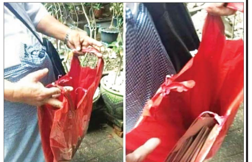
ဥပဒေနှင့်အညီဆောင်ရွက်ခြင်းမရှိသည့် ကြိုတင်ဆန္ဒမဲများ ကောက်ယူနေသည့်ပုံ။