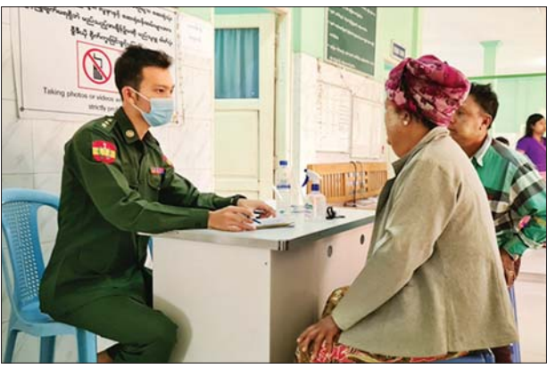
ဖွယ်ရာများနှင့် ကျန်းမာရေး များ ပေးအပ်ခဲ့ကြောင်း ဝန်ထမ်းများအတွက် ချီးမြှင့်ငွေ သတင်းရရှိသည်။ သတင်းစဉ်

၃၃၃၆ ဦးကို သာမန်မွေးဖွားပေး နိုင်ခဲ့ခြင်းကြောင့် ယနေ့အထိ ကလေးငယ် ၅၅၄၀ ဦးကို အောင်မြင်စွာ မွေးဖွားပေးနိုင် ခဲ့သည်။ ယင်းသို့ ဒေသခံပြည်သူများ အား ဆေးကုသပေးနေမှု အခြေ အနေများကို သက်ဆိုင်ရာ တိုင်းစစ်ဌာနချုပ် အသီးသီးမှ တာဝန်ရှိသူများက သွားရောက် ကြည့်ရှုအားပေးပြီး ဆေးရုံ တက်ရောက်ကုသမှုခံယူနေသော လူနာများအတွက် စားသောက်