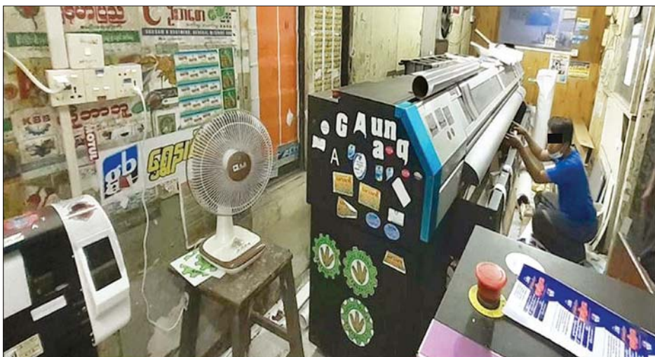
သိမ်းဆည်းရမိသည့် ပုံနှိပ်လုပ်ငန်းတွင် အသုံးပြုသည့်စက်နှင့် ဆက်စပ်ပစ္စည်းများ။