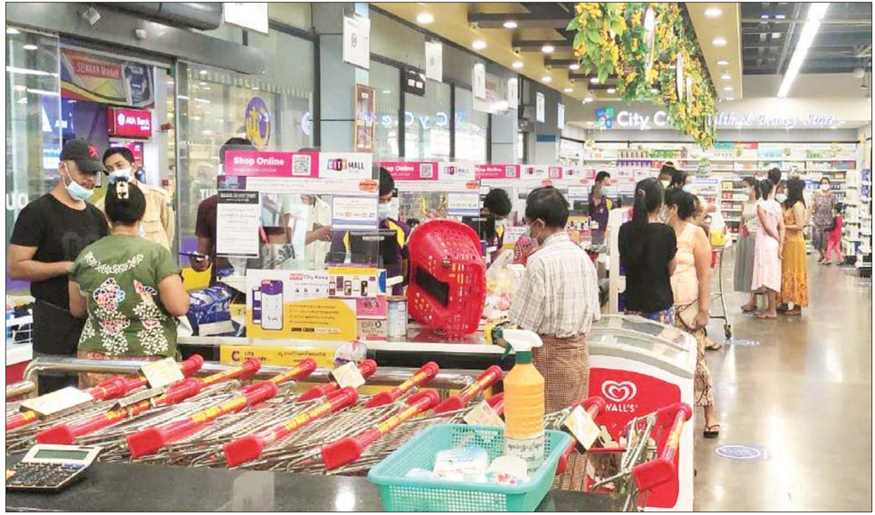
ဒဂုံမြို့သစ်(ဆိပ်ကမ်း)မြို့နယ်ရှိ City Mart ကုန်တိုက် ဖွင့်လှစ်ရောင်းချနေမှုကို တွေ့ရစဉ်။

အေးချမ်းစွာ နေထိုင်လိုသော ပြည်သူလူထု၏ အကျိုးစီးပွား ကိုရှေးရှုကာ လုံခြုံရေးတပ်ဖွဲ့ဝင် များက လုံခြုံရေးတာဝန်များအား စာမျက်နှာ ၇ ကော်လံ ၁ ၂