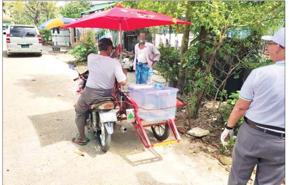
ဥပဒေနှင့်အညီ ဆောင်ရွက်ခြင်းမရှိသည့် ကြိုတင်ဆန္ဒမဲများ ကောက်ယူနေစဉ်။