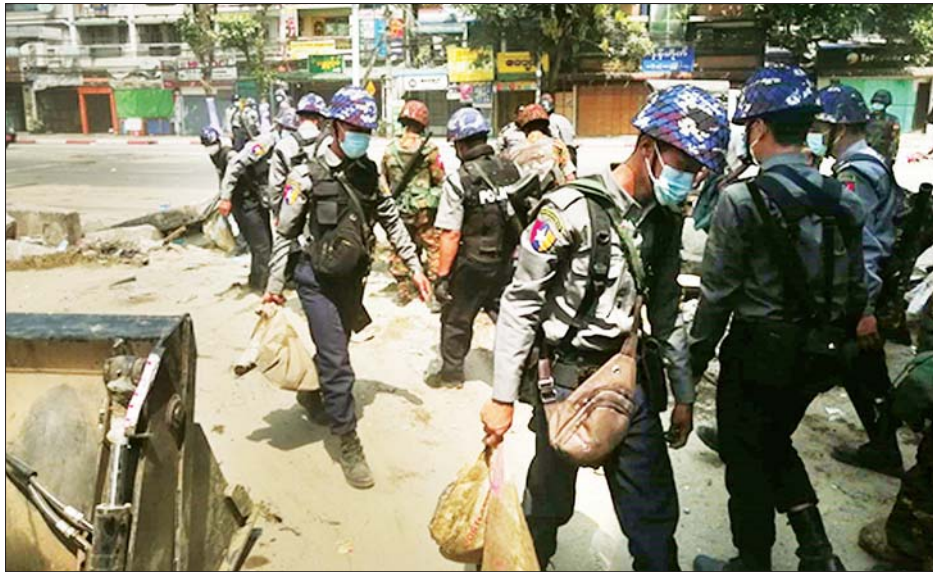
လမ်းများပေါ်၌ ပိတ်ဆို့ထားသော အတားအဆီးများကို လုံခြုံရေးတပ်ဖွဲ့ဝင်များက ရှင်းလင်းဖယ်ရှားကြစဉ်။

နေပြည်တော် မတ် ၂၂ ရန်ကုန်တိုင်းဒေသကြီး လှိုင်မြို့နယ်တွင် လုံခြုံရေးတပ်ဖွဲ့ဝင်များက ဆူပူအကြမ်းဖက်သူများ တားဆီးပိတ်ဆို့ထားသော အတားအဆီးများကို ရှင်းလင်းဖယ်ရှားခဲ့ကြောင်း မြန်မာနိုင်ငံတော်အစိုးရ၏ သတင်းထုတ်ပြန်ချက်အရ သိရသည်။