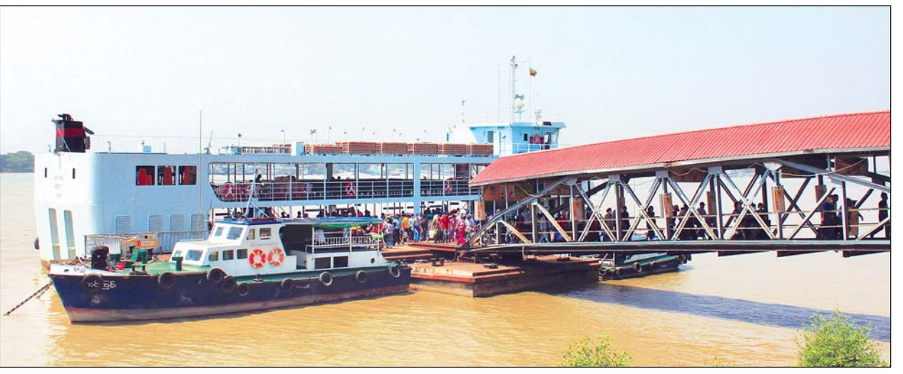
ပန်းဆိုးတန်းမှ ဒလဘက်သို့ ပြေးဆွဲမည့် ချယ်ရီသင်္ဘောနှင့် ခရီးသည်များကို တွေ့ရစဉ်

ရန်ကုန် မတ် ၂၂ ရန်ကုန်(ပန်းဆိုးတန်း)-ဒလ ကူးတို့သင်္ဘောဆိပ်သည် ရန်ကုန်တိုင်း ဒေသကြီးအတွင်းရှိ ဒလ၊ တွံတေး၊ ကော့မှူး၊ ကွမ်းခြံကုန်းမြို့နယ်များနှင့် ဧရာဝတီတိုင်းဒေသကြီးအတွင်း မြို့နယ်များမှ ပြည်သူများအား ရန်ကုန် မြို့သို့ မြစ်တွင်းသွား ချယ်ရီသင်္ဘောများဖြင့် နေ့စဉ် ပို့ဆောင်ပေးလျက် ရှိသော သင်္ဘောဆိပ်ကမ်းတစ်ခုဖြစ်ပြီး ကိုဗစ်-၁၉ ရောဂါ ဖြစ်ပွား ချိန်မှစ၍ လက်ရှိအချိန်အထိ ခရီးသည်သွားလာမှု နည်းပါးနေသော် လည်း ခရီးသည်များ သွားလာရေး အဆင်ပြေချောမွေ့ စေရန်အတွက် ရေယာဉ်ခရီးစဉ်များကို ပုံမှန် ပြေးဆွဲပို့ဆောင်ပေးလျက်ရှိကြောင်း ပြည်တွင်းရေကြောင်းပို့ဆောင်ရေး(မြစ်ဝကျွန်းပေါ်ဌာနခွဲ)မှ သိရသည်။ "ပန်းဆိုးတန်း-ဒလ ကူးတို့ သင်္ဘောဆိပ်ကမ်းက အရင်တုန်းက တစ်နေ့ကို ခရီးသည် ၃၀၀၀ ကျော် သွားလာနေကြတာပေါ့။ ကိုဗစ်- ၁၉ ရောဂါ စတင်ဖြစ်ပွားပြီးတဲ့နောက်ပိုင်းမှာ လူဦးရေ တဖြည်းဖြည်း လျော့နည်းသွားတယ်။ အဲဒီအချိန်မှာလည်း ခရီးသည်တွေ သွားလာမှု အဆင်ပြေစေဖို့အတွက် မရပ်နားဘဲ ခေါက်ရေကို အတိုးအလျှော့နဲ့ ပြေးဆွဲပေးခဲ့တယ်။ လက်ရှိအခြေအနေနဲ့ အချိန်ကာလမှာ ကန့်သတ်မှု တွေရှိသော်လည်း ခရီးသည်သွားလာမှုတွေ ပိုပြီးတော့ ချောမွေ့အောင် ပြေးဆွဲပေးသွားမှာပါ။ အတာသင်္ကြန်ပွဲတော် ကာလအတွင်းမှာလည်း နှစ်စဉ်နှစ်တိုင်း ပြေးဆွဲပေးတဲ့အတိုင်း မရပ်နားဘဲ ခေါက်ရေလျှော့ပြီး ပြေးဆွဲသွားမှာဖြစ်ပါတယ်။"ဟု ပြည်တွင်းရေကြောင်းပို့ဆောင်ရေး (မြစ်ဝကျွန်းပေါ်ဌာနခွဲ)မှ လက်ထောက်အထွေထွေမန်နေဂျာ ဦးလှဝင်း နိုင်က ပြောကြားသည်။ ပန်းဆိုးတန်း-ဒလ ခရီးစဉ်၌ ယခုရက်ပိုင်းအတွင်း ခရီးသည်သွား လာမှုမှာ မတ် ၁၉ ရက်က ၅၂၃ ဦး၊ ၂၀ ရက်တွင် ၃၇၇ ဦး၊ ၂၁ ရက်တွင် ၄၀၂ ဦး ရှိခဲ့ကြောင်း၊ ယခင်က ခရီးသည်သွားလာမှုနှင့်ယှဉ်လျှင် ခရီးသည် နည်းပါးသော်လည်း ရေယာဉ်ခရီးစဉ်များကို အစိုးရရုံးဖွင့်ရက်