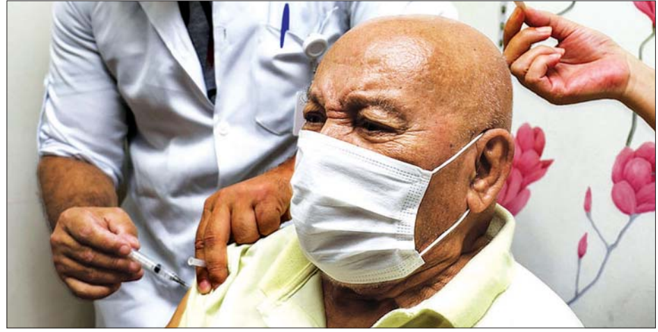
ဘရာဇီးနိုင်ငံ ဆော်ပိုလိုမြို့တွင် ကိုဗစ်-၁၉ ကာကွယ်ဆေးထိုးနှံပေးနေစဉ်။