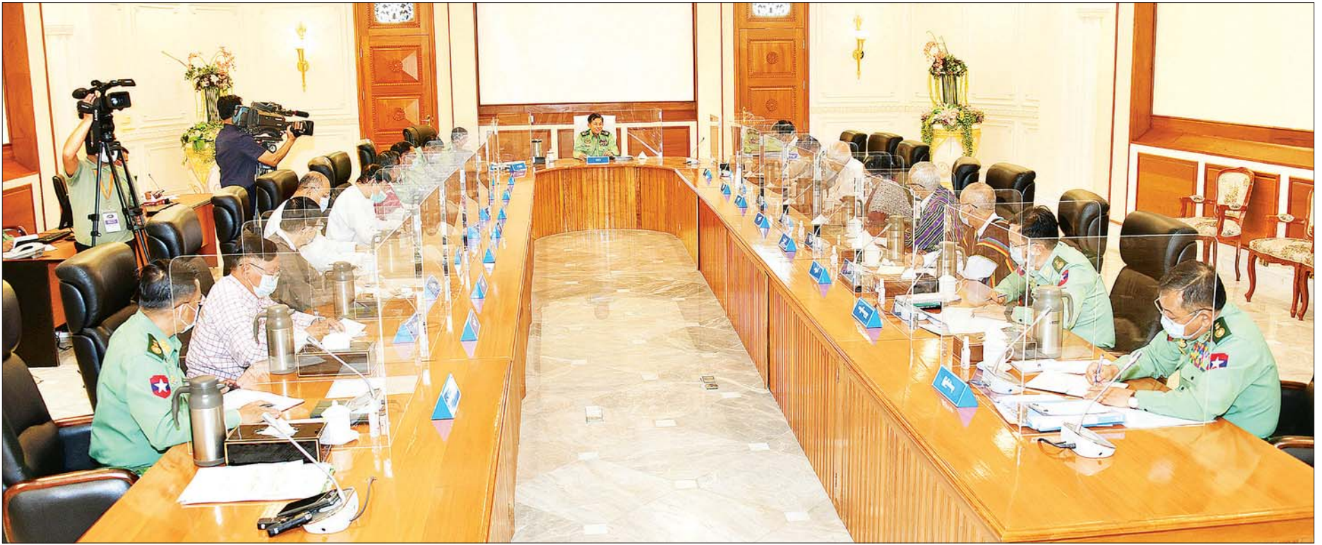
နိုင်ငံတော်စီမံအုပ်ချုပ်ရေးကောင်စီဥက္ကဋ္ဌ၊ တပ်မတော်ကာကွယ်ရေးဦးစီးချုပ် ဗိုလ်ချုပ်မှူးကြီး မင်းအောင်လှိုင် နိုင်ငံတော်စီမံအုပ်ချုပ်ရေးကောင်စီ အစည်းအဝေး (၇/၂၀၂၁) တွင် အမှာစကားပြောကြားစဉ်။ သတင်းစဉ်