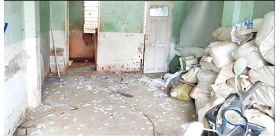
လက်ပစ်ပုံးဖြင့် ပစ်ခတ်မှုကြောင့် မြို့နယ်ရဲတပ်ဖွဲ့မှူးရုံး စတုရန်းပုံအတွင်းရှိ အပျက်အစီးများကို တွေ့ရစဉ်။

နေပြည်တော် မတ် ၂၂ လားရှိုးမြို့ မြို့နယ်ရဲတပ်ဖွဲ့မှူးရုံးကို အကြမ်းဖက် လူတစ်စုက ဒေသန္တရလက်ပစ်ပုံးဖြင့် လာရောက် ပစ်ခတ်ခဲ့ကြောင်း မြန်မာနိုင်ငံရဲတပ်ဖွဲ့၏ သတင်း ထုတ်ပြန်ချက်အရ သိရသည်။ ယင်းသတင်းထုတ်ပြန်ချက်အရ ရှမ်းပြည်နယ် (မြောက်ပိုင်း)၊ လားရှိုးမြို့၊ ရပ်ကွက်(၅)၊ နယ်မြေ (၁၆)ရှိ မြို့နယ်ရဲတပ်ဖွဲ့မှူးရုံးရှိ မြန်မာနိုင်ငံရဲတပ်ဖွဲ့ ဝင်များသည် ပုံမှန်ရုံးလုပ်ငန်းများ ဆောင်ရွက်နေစဉ် ယနေ့ မွန်းလွဲ ၁၂ နာရီ မိနစ် ၅၀ ခန့်တွင် မန္တလေး လမ်းဘက်မှ ရေကန်တောင်ဘက်သို့ CZI အမျိုး အစား မော်တော်ဆိုင်ကယ် မောင်းနှင်လာသည့် အမျိုးသားနှစ်ဦးက ဒေသန္တရလက်ပစ်ပုံး တစ်လုံးဖြင့် လာရောက်ပစ်ခတ်ခဲ့သဖြင့် ရုံးဝင်းအတွင်းရှိ စာရွက် စာတမ်းများ ထားသည့်စတုရန်းပုံ အတွင်းသို့ ကျရောက် ပေါက်ကွဲမှုဖြစ်ပွားခဲ့ကြောင်း။ ဒေသန္တရလက်ပစ်ပုံးပစ်ခတ်မှုကြောင့် မြို့နယ် ရဲတပ်ဖွဲ့မှူးရုံးဝင်းရှိ စတုရန်းပုံ၊ မျက်နှာကြက် အနည်းငယ်ထိခိုက်ပျက်စီး၊ စတုရန်းပုံနှင့်တွဲလျက် အိမ်သာတံခါးမှန် ထိခိုက်ကွဲအက်မှုဖြစ်ပွားခဲ့ပြီး လူနှင့် တိရစ္ဆာန်ထိခိုက်မှုမရှိကြောင်း ။ ယခုကဲ့သို့ အကြမ်းဖက်လုပ်ရပ်များ လုပ်ဆောင် သွားသူများနှင့် ပါဝင်ပတ်သက်သူများအား အမြန်ဆုံး ဖမ်းဆီးရမိရေး လုံခြုံရေးတပ်ဖွဲ့ဝင်များက ဒေသခံ ပြည်သူများနှင့် ပူးပေါင်း၍ အပူတပြင်း ရှာဖွေ လျက်ရှိကြောင်း သတင်းရရှိသည်။ သတင်းစဉ်