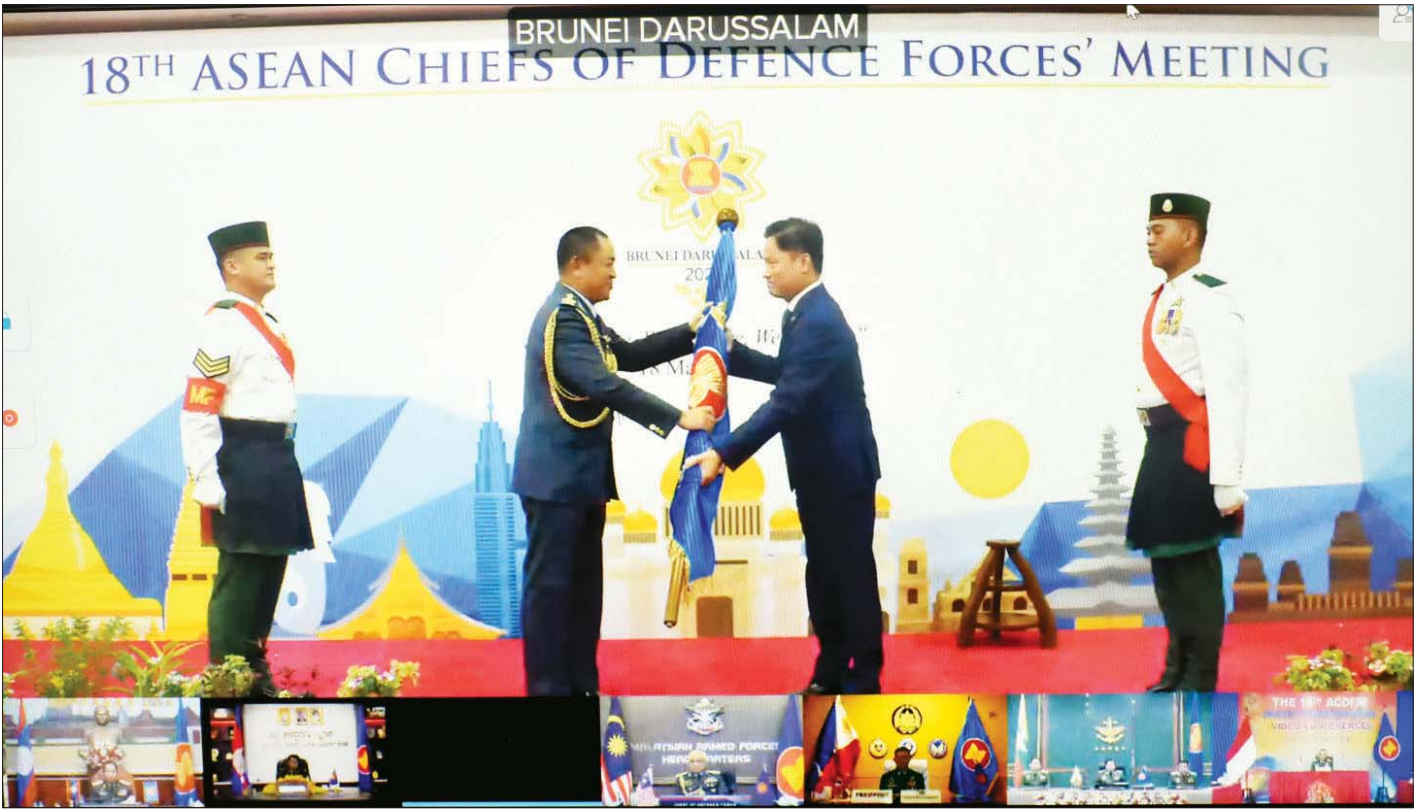
ဘရူနိုင်းနိုင်ငံ ဘုရင့်တပ်မတော်မှ တပ်မတော်ကာကွယ်ရေးဦးစီးချုပ်က အလှည့်ကျဥက္ကဋ္ဌအဖြစ် တာဝန်ယူဆောင်ရွက်မည့် ကမ္ဘောဒီးယားဘုရင့်တပ်မတော်မှ တပ်မတော်ကာကွယ်ရေးဦးစီးချုပ်ထံသို့ ဥက္ကဋ္ဌ တာဝန်များအား လွှဲပြောင်းပေးအပ်စဉ်။

တပ်မတော်ကာကွယ်ရေးဦးစီးချုပ် ဗိုလ်ချုပ်မှူးကြီး မင်းအောင်လှိုင်က ဆွေးနွေးရာတွင် အစည်းအဝေးသို့ ပါဝင်တက်ရောက်လာကြသူများအားလုံး ကမ္ဘာလုံးဆိုင်ရာကပ်ရောဂါ COVID-19 ဖြစ်ပွားနေသည့် အကျပ်အတည်းကာလတွင် ဘေးအန္တရာယ်အပေါင်းမှ ကင်းဝေးကြပါစေကြောင်း၊ မိမိတို့ အာဆီယံဒေသကြီးသည် ကမ္ဘာ့အင်အားကြီးနိုင်ငံများ အင်အားပြိုင်ဆိုင်မှု၊ ပထဝီအနေအထားအရ အချက်အချာကျမှုတို့ကြောင့် လက်ရှိကာလတွင် သမားရိုးကျလုံခြုံရေးဆိုင်ရာ စိန်ခေါ်မှုများအပြင် ရာသီဥတုပြောင်းလဲမှု၊ အရင်းအမြစ်ရှားပါးလာမှု၊ သဘာဝဘေးအန္တရာယ်၊ ပုံမှန်မဟုတ်သော ရွှေ့ပြောင်း အလုပ်သမားကိစ္စ၊ အစာရေစာရှားပါးမှု၊ လူမှောင်ခိုကုန်ကူးမှု၊ မူးယစ်ဆေးရောင်းဝယ်ဖောက်ကားမှု၊ သတင်းအချက်အလက်လုံခြုံရေး၊ ပင်လယ်စားပြေမှု၊ နယ်စပ်ဖြတ်ကျော် ရာဇဝတ်မှုများအပါအဝင် အကြမ်းဖက်မှုနှင့် ကပ်ရောဂါကူးစက်ပြန့်ပွားမှုကဲ့သို့သော သမားရိုးကျမဟုတ်သည့် လုံခြုံရေးဆိုင်ရာ စိန်ခေါ်မှုများနှင့်လည်း ရင်ဆိုင်နေရလျက်ရှိကြောင်း။