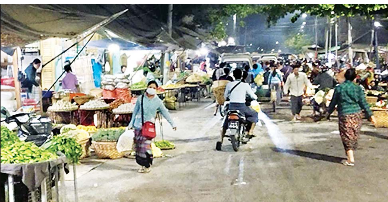
စက်အင်အားများဖြင့် ရှင်းလင်း တွင် အုပ်ချုပ်မှုယန္တရား ပုံမှန် ခြင်းများ ဆောင်ရွက်ပေးခဲ့သည့် ပြန်လည် လည်ပတ်နိုင်ရေး အပြင် ရပ်ကွက်၊ ကျေးရွာများ အတွက် ရပ်ကွက်၊ ကျေးရွာ စီမံ အုပ်ချုပ်ရေးရုံးများ ပြန်လည် ထိုသို့ ဆောင်ရွက်ပေးခဲ့မှု ဖွင့်လှစ်နိုင်ရေး ဆောင်ရွက်ပေး ကြောင့် မန္တလေးမြို့ပေါ်နှင့် မြို့နယ်များအတွင်း၌ ယခုအခါ လျက်ရှိသည်။

နေပြည်တော် မတ် ၁၈ မန္တလေးတိုင်းဒေသကြီး မြို့နယ် အချို့တွင် CDM လှုပ်ရှားမှုကို အခြေခံ၍ ဆူပူအကြမ်းဖက်မှု လုပ်ငန်းများ ဆောင်ရွက်၍ လူထု အုံကြွမှုများ ဖြစ်ပေါ်စေရေး နည်းမျိုးစုံဖြင့် ဆောင်ရွက်လျက် ရှိသော်လည်း လုံခြုံရေးတပ်ဖွဲ့ဝင် များက အများပြည်သူများ လုံခြုံမှု ရှိပြီး စိတ်အေးချမ်းသာစွာဖြင့် ပုံမှန်အတိုင်း လှုပ်ရှားသွားလာနိုင် ရေးအတွက် နေ့ညမပြတ် ပတ်ကင်း၊ လှည့်ကင်းများဖြင့် စနစ်တကျဆောင်ရွက်ခြင်း၊ ဆူပူ အကြမ်းဖက်သူများကို တရား ဥပဒေနှင့်အညီ ဖမ်းဆီးထိန်းသိမ်း ခြင်း၊ လမ်းများတွင် ပိတ်ထားသည့် အတားအဆီးများကို တပ်မတော် သားများနှင့် မြန်မာနိုင်ငံ ရဲတပ်ဖွဲ့ဝင်များက လူအင်အား၊