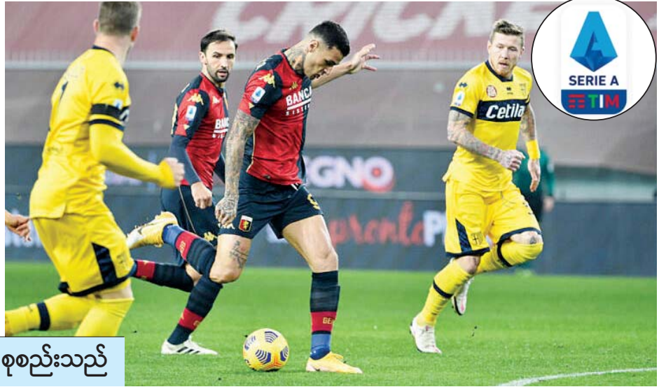
■ မိုးဇက် - စုစည်းသည်