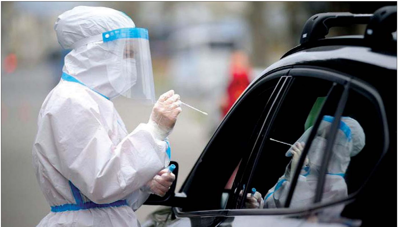
အီတလီနိုင်ငံ ဖလော်ရန်ရှီ ကိုဗစ်-၁၉ စစ်ဆေးရေးစင်တာတစ်ခုတွင် အီတလီ ကြက်ခြေနီအဖွဲ့ဝင်တစ်ဦးက ကိုဗစ်- ၁၉ ဗိုင်းရပ်စ် စစ်ဆေးရန် ယာဉ်မောင်းထံမှ တို့ဖတ်နမူနာ ရယူနေသည်ကို တွေ့ရစဉ်။

“ကျန်းမာရေးဆိုင်ရာ အရေးပေါ်အခြေအနေ စတင်ပြီး တစ်နှစ်ကျော်ကြာပြီး နောက် မိမိတို့ဟာ ကံမကောင်းစွာနဲ့ပဲ ကိုရိုနာဗိုင်းရပ်စ်ကူးစက်မှု လှိုင်းဂယက် သစ်ဖြစ်ပွားမှုနဲ့ ရင်ဆိုင်နေရတယ်လို့ ဒရာဂီက ပြောကြားလိုက်ပါတယ်။ ပြီးတော့လည်း သူက လွန်ခဲ့တဲ့နှစ်နှစ်အတွင်းမှာ ဘာတွေဖြစ်ပျက်ခဲ့လဲဆိုတာ မိမိရဲ့မှတ်ဉာဏ်ထဲမှာ ထင်ရှားနေတုန်းပဲ။ နောက်တစ်ကြိမ် ကိုရိုနာဗိုင်းရပ်စ် ကူးစက်မှု ထပ်မံဖြစ်ပွားဖို့ မိမိတို့တွေအနေနဲ့ ကာကွယ်လို့ ရတာ အကုန်လုပ်သွား မယ်လို့ ပြောကြားလိုက်ပါတယ်”