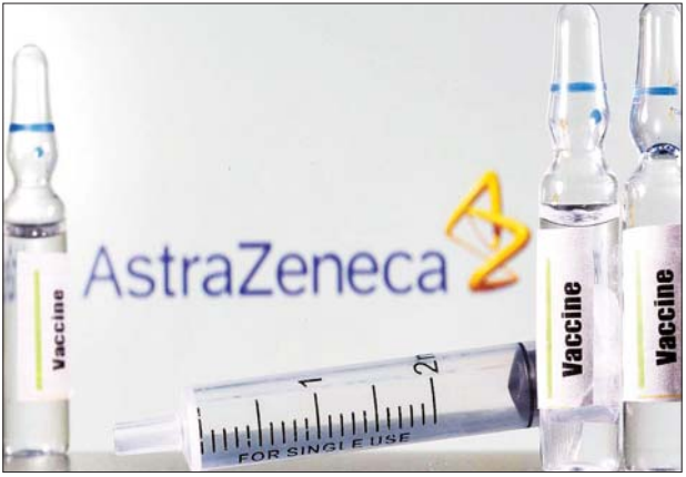
အက်စ်ထရာဇီကာ ကိုဗစ်-၁၉ ကာကွယ်ဆေးကို တွေ့ရစဉ်။

ဂျီနီဗာ မတ် ၁၈ သွေးကြောပိတ်ခြင်းနှင့် ပတ်သက်ပြီး စိုးရိမ်ပူပန်မှုများ ကမ္ဘာတစ်ဝန်း မြင့်တက်လာပြီးနောက် ကမ္ဘာ့ကျန်းမာရေးအဖွဲ့က ၎င်း၏ ကျွမ်းကျင်သူများသည် အက်စ်ထရာဇီကာကိုဗစ်-၁၉ ကာကွယ်ဆေး၏ ဘေးကင်းလုံခြုံသည့် အချက်အလက်များကို ပြန်လည်သုံးသပ်လျက်ရှိကြောင်း မတ် ၁၇ ရက်က ပြောကြားလိုက်သော်လည်း ကာကွယ်ဆေးထိုးလုပ်ငန်းများကို ဆက်လက်ဆောင်ရွက်ကြရန် တိုက်တွန်းပြောကြားလိုက်သည်။