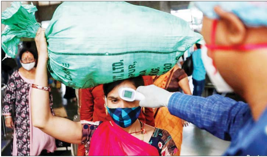
အန္တိယနိုင်ငံ မွမ်ဘိုင်ရှိ ဘူတာရုံတစ်ခုတွင် ကျန်းမာရေးဝန်ထမ်းတစ်ဦးက ခရီးသွားပြည်သူတစ်ဦးကို အပူချိန်တိုင်း စစ်ဆေးပေးနေသည်ကို တွေ့ရစဉ်။

နယူးဒေလီ မတ် ၁၈ အန္တိယဝန်ကြီးချုပ် နာရိုဒရာမိုဒီက ကိုရိုနာဗိုင်းရပ်စ် စစ်ဆေးမှုများကို တိုးမြှင့်လုပ်ဆောင်ကြရန်နှင့် ဒုတိယအကြိမ် ကိုရိုနာဗိုင်းရပ်စ်ကူးစက်ဖြစ်ပွားလာနိုင်မှုကို တားဆီးရန် ဒေသတွင်းတားဆီးကန့်သတ်မှုများပြုလုပ်ရန် တိုက်တွန်းပြောကြားလိုက်သည်။