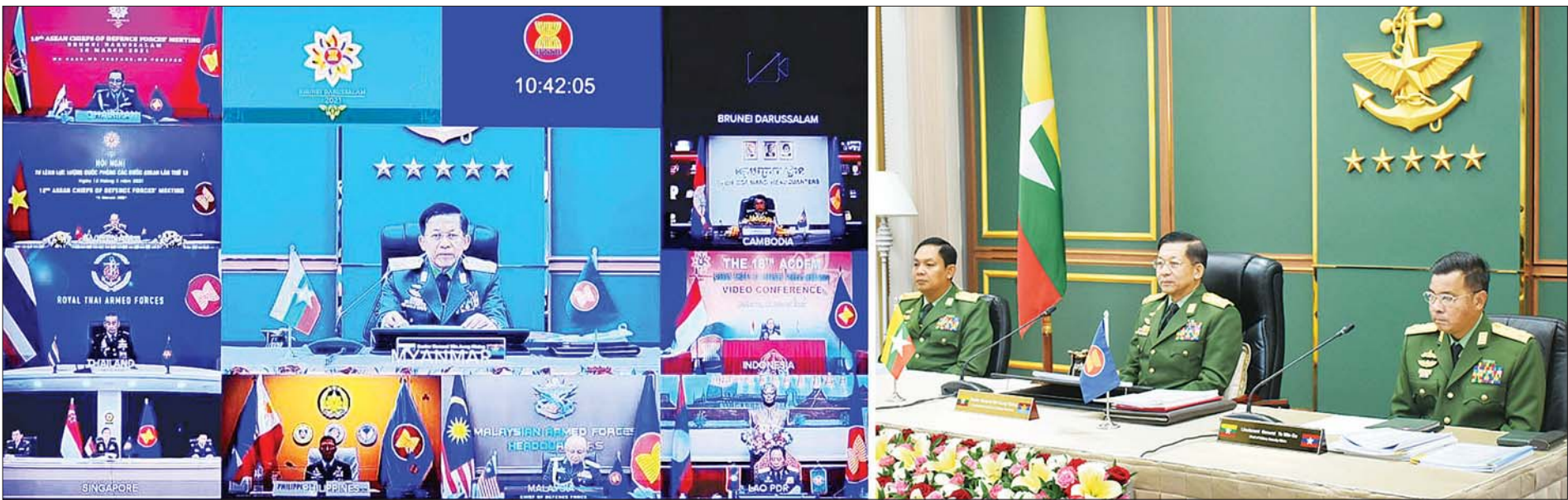
နိုင်ငံတော်စီမံအုပ်ချုပ်ရေးကောင်စီဥက္ကဋ္ဌ တပ်မတော်ကာကွယ်ရေးဦးစီးချုပ် ဗိုလ်ချုပ်မှူးကြီး မင်းအောင်လှိုင် Video Conferencing စနစ်ဖြင့် ကျင်းပသည့် (၁၈) ကြိမ်မြောက် အာဆီယံတပ်မတော် ကာကွယ်ရေးဦးစီးချုပ်များ အစည်းအဝေး (ACDFM-18) သို့ တက်ရောက်စဉ်။

ကျရောက်သွားခဲ့ချိန်တွင်လည်း အခြားတိုင်းရင်းသားများနှင့်အတူ ဆုံးရှုံးထားသော လွတ်လပ်ရေးကို ပြန်လည်ရယူရာတွင်လည်း ကောင်း၊ ရရှိပြီးသောလွတ်လပ်ရေးနှင့် အချုပ်အခြာအာဏာ တည်တံ့ ရေးတို့တွင်လည်းကောင်း စုပေါင်းလက်တွဲပါဝင်ခဲ့ကြပြီး ဥမကွဲ သိုက်မပျက် ပြည်ထောင်စုစိတ်ဓာတ်ဖြင့် နေထိုင်လာခဲ့ကြပါသည်။ ပြည်ထောင်စုအတွင်း မှီတင်းနေထိုင်လျက်ရှိသော အခြားတိုင်းရင်း သား မျိုးနွယ်စုများကဲ့သို့ပင် မွန်တိုင်းရင်းသားတို့သည် ရှည်လျား လှသောသမိုင်းစဉ်နှင့် အဆင့်မြင့်သော ယဉ်ကျေးမှုတို့ကို ပိုင်ဆိုင်သည့် လူမျိုးများဖြစ်ပါသည်။ ထိုကဲ့သို့ ကောင်းမြတ်သည့် သမိုင်းအစဉ် အလာကို ဆက်လက်ထိန်းသိမ်း၍ စာမျက်နှာ ၃ ကော်လံ ၁ *