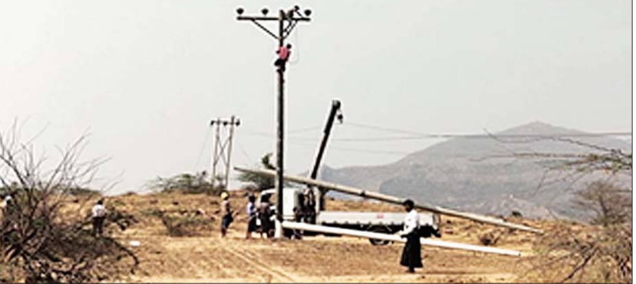
ဆူပူအကြမ်းဖက်သူများ ဖြိုလှဲခဲ့သည့် မီးတိုင်များအား ပြန်လည်စိုက်ထူပြင်ဆင်ကြစဉ်။

ခွဲကြောင်း သိရှိရသည်။ အဆိုပါ ဖျက်ဆီးခဲ့သည့် ဓာတ်မီးတိုင်များကို အစားထိုး ပြင်ဆင်နိုင်ရေးအတွက် သက်ဆိုင်ရာက အမြန်ဆုံးဆောင်ရွက်ပေး လျက်ရှိကြောင်းနှင့် ယခုကဲ့သို့ အဖျက်အမှောင့်လုပ်ရပ်များ လုပ်ဆောင်ခဲ့သူများအား အမြန်ဆုံး ဖော်ထုတ်ဖမ်းဆီးအရေးယူ သွားမည်ဖြစ်ကြောင်း သတင်းရရှိ သည်။ သတင်းစဉ်