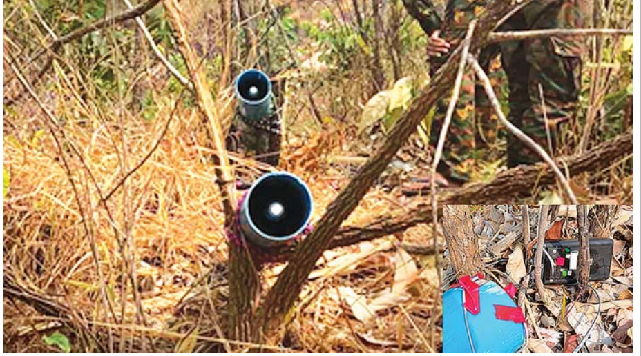
ချိန်ကိုင်စနစ်ဖြင့် ပစ်ခတ်ရန် ချိန်ရွယ်ထားသည့် ၁၀၇ မမ ရှော့တိုက်ခွဲများကို တွေ့ရစဉ်။

အလားတူ မော်လမြိုင်မြို့နယ်အတွင်း လုံခြုံရေးလုပ်ငန်းများ ဆောင်ရွက်နေသည့် တပ်ဖွဲ့ဝင်များသည် လုံခြုံရေးလုပ်ငန်းများ ဆောင်ရွက်စဉ် ယနေ့နံနက် ၈ နာရီခွဲခန့်တွင် (စိစစ်ဆဲ)အကြမ်းဖက်အဖွဲ့က မော်လမြိုင်မြို့ရှိ ရွှေနတ်တောင်ပေါ်တွင် လူနေရပ်ကွက်များကို ပစ်ခတ်ရန် ချိန်ရွယ်ထားသည့် အချိန်ကိုင်စနစ်ဖြင့် ပစ်ခတ်ရန် စီမံထားသော ၁၀၇ မမ ရှော့တိုက်ခွဲ ၂ လုံးတွေ့ရှိခဲ့ရသဖြင့် အများပြည်သူများ အန္တရာယ်