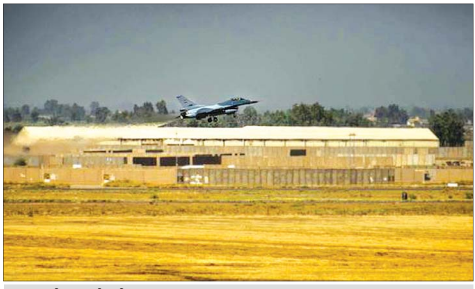
ဘာလတ် လေတပ်စခန်း။

နေရာဟုလည်း နာမည်ကြီးသည်။ အဆိုပါစခန်းတွင် အမေရိ ကန် ကျွမ်းကျင်သူများနှင့် အကြံပေးများ နေထိုင်သည်ဟု သိရသည်။ အက်ဖ်-၁၆ တိုက် လေယာဉ် ထိန်းသိမ်းရေးအတွက် အဆိုပါစခန်းတွင် အမေရိကန် ကုမ္ပဏီမှ ကျွမ်းကျင်သူများနှင့် အကြံပေးများ နေထိုင်သည်ဟု သိရသည်။ စစ်သွေးကြွများက ယင်းစခန်းကို မကြာခဏ တိုက် ခိုက်မှုကြောင့် အမေရိကန်တပ်ဖွဲ့ ဝင်များသည် လွန်ခဲ့သည့် တစ်နှစ်ကျော်ကတည်းက ယင်း ဒေသမှ ဆုတ်ခွာခဲ့ကြသည်။