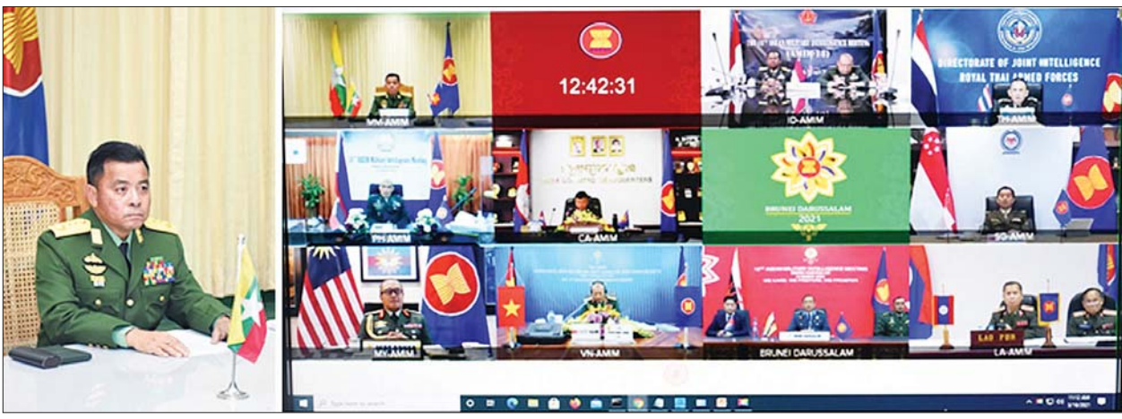
(၁၈) ကြိမ်မြောက် အာဆီယံတပ်မတော်ထောက်လှမ်းရေးမှူးချုပ်များ အစည်းအဝေးကျင်းပ

(နိုင်ငံတော်စီမံအုပ်ချုပ်ရေးကောင်စီဥက္ကဋ္ဌ၊ တပ်မတော်ကာကွယ်ရေးဦးစီးချုပ် ဗိုလ်ချုပ်မှူးကြီး မင်းအောင်လှိုင် ၁-၃-၂၀၂၁ ရက်နေ့တွင် နိုင်ငံတော်စီမံအုပ်ချုပ်ရေးကောင်စီအစည်းအဝေး၌ ပြောကြားသည့် အမှာစကားမှ ကောက်နုတ်ချက်)