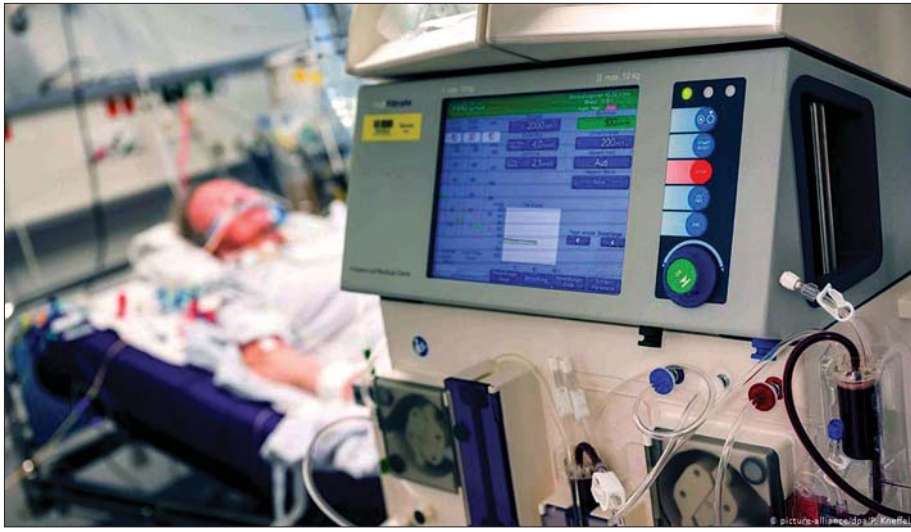
အထူးကြပ်မတ်ကုသဆောင်တွင် ကိုဗစ်-၁၉ ရောဂါသည်တစ်ဦး ကုသမှု ခံယူနေစဉ်။

ဟာ ကိုဗစ်-၁၉ ကူးစက်ခံခဲ့ရပြီး အထူးကြပ်မတ်ကုသဆောင်မှာ အဲဒီကပ်ရောဂါကို အဆုံးသတ်နိုင်ခဲ့ပါတယ်။ ဧပြီ ၂၉ ရက်မှာ အမေရိကန် လေယာဉ်ထုတ်လုပ်ရေး နာမည်ကြီးကုမ္ပဏီကြီးဖြစ်တဲ့ ဘိုးရင်းဟာ အလုပ်အကိုင်ပေါင်း ၁၆၀၀၀ ခန့်ကို လျှော့ချခဲ့ပါတယ်။ တခြား လေကြောင်းလိုင်းများ၊ ကားထုတ်လုပ်ရေးများ၊ ခရီးသွားကဏ္ဍများနဲ့ စတိုးဆိုင်တွေဟာလည်း အရှုံးတွေနဲ့ ရင်ဆိုင်ခဲ့ရပြီး ဝန်ထမ်းတွေ လျှော့ချခဲ့ရပါတယ်။