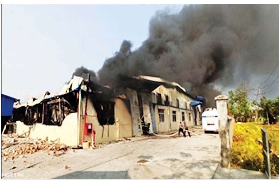
လှိုင်သာယာစက်မှုဇုန် (၁) တွင် မီးလောင်မှု ဖြစ်ပွားစဉ်။

ထပ်မံရောက်ရှိပြီး စုစုပေါင်း မီးသတ်ယာဉ် ၇ စီး၊ ၄ နာရီ ၂၃ မိနစ်တွင် မီးထိန်းနိုင်ခဲ့ပြီး ညနေ ၁၀၊ အရန် ၁၀ ဦးတို့ဖြင့် မီးငြိမ်းသတ်ရေး ၅ နာရီ မိနစ် ၄၀ တွင် မီးငြိမ်းသတ်နိုင်ခဲ့ကြောင်း လုပ်ငန်းများ ဆက်လက်ဆောင်ရွက်ခဲ့ရာ ညနေ ၁၀၊ အရန် ၁၀ ဦးတို့ဖြင့် မီးငြိမ်းသတ်ရေး သိရသည်။ သတင်းစဉ်