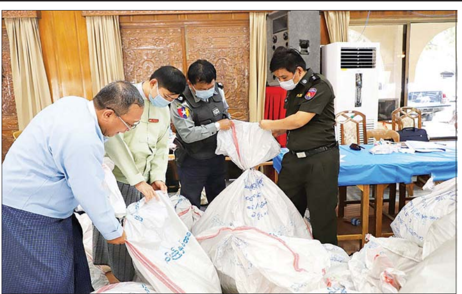
မဲလက်မှတ်များ မြေပြင်စစ်ဆေးစဉ်။