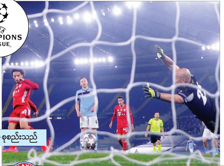
မိုးဇက် - စုစည်းသည်