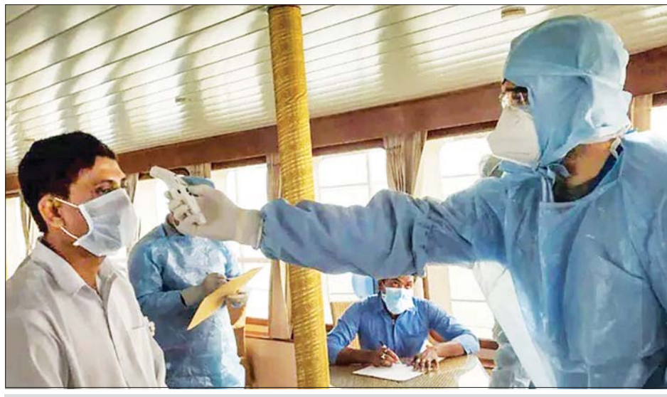
အိန္ဒိယနိုင်ငံတွင် ကိုဗစ်-၁၉ ရှိ၊ မရှိ အပူချိန်တိုင်း စစ်ဆေးနေသည်ကို တွေ့ရစဉ်။

ကျန်းမာရေးဝန်ကြီးဌာန၏ ထုတ်ပြန်ချက်အရ ၇၇၁၆ ဦး ဆေးရုံမှ ဆင်းလာမှုနှင့်အတူ