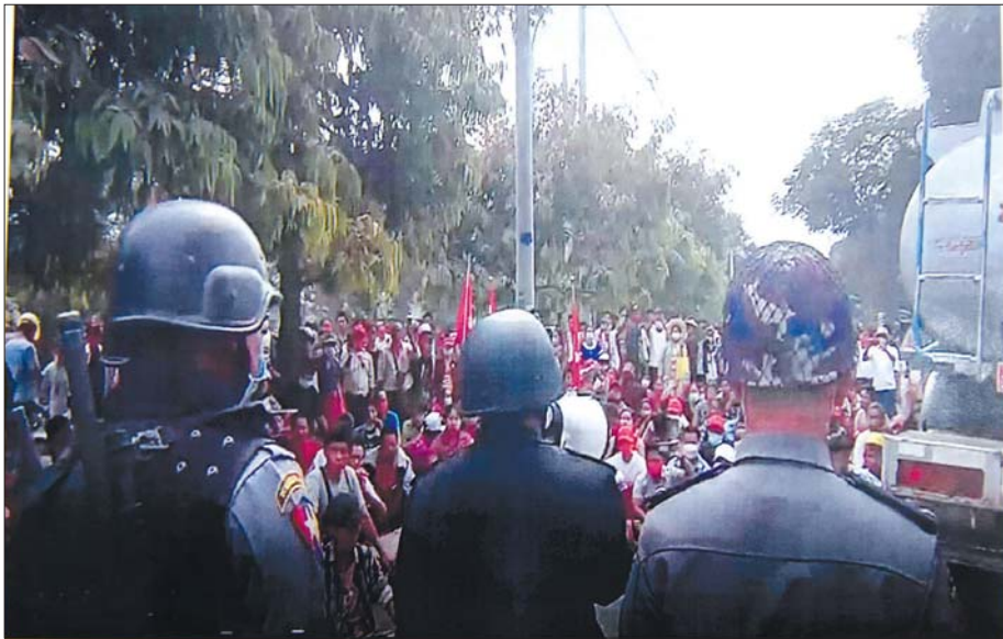
မြန်မာနိုင်ငံရဲတပ်ဖွဲ့မှ သတိပေးတားမြစ်စဉ်။

ရဲရဲတောက်ရှာနယ် သတင်းဌာနမှ အယ်ဒီတာချုပ် ဦးနေလင်းက စမ်းချောင်းမြို့တွင် ဆန္ဒပြတုံ့သုတေသန ထုတ်ပေးရာ ဆရာတော်ကြီးရဲ့ ရုပ်ပုံကို ကပ်ပြီးတော့ ဆန္ဒပြပါတယ်။ အဲဒီလိုဆန္ဒပြတုံ့အခါမှာ ၈၈ ရာခိုင်နှုန်းကျော်ရှိတဲ့ ဗုဒ္ဓဘာသာဝင်တွေ စိတ်နှလုံးမချမ်းမမြေ့ဖြစ်ရပါတယ်။ အဲဒီအချိန်မှာပဲ ပြည်ထဲရေးက တရားခံတွေကို ဖမ်းဆီးလိုက်တဲ့သတင်းထွက်လာတဲ့အခါမှာ ကျွန်တော်တို့ Facebook မှာကြည့်ရင် သိပါတယ်။ နစက လက်ထက်မှာ ဗိုလ်ချုပ်မှူးကြီး မင်းအောင်လှိုင် ရုပ်ပုံကို လမ်းမှာခင်းပြီး တက်နင်းရင်တောင် ဘာမှ အရေးမယူဘဲနဲ့ ဆရာတော်ကြီးပုံကိုကပ်လို့ အရေးယူတယ်။ ငါတို့သာသနာတော့ စိတ်အေးချမ်းသာရ ပြီး အဲဒီလိုမျိုးရေးသားကြတယ်။ ဆရာတော်ကြီးတွေ ကိုယ်တိုင်ကတော့ ဗုဒ္ဓဘာသာရဲ့ လွတ်လပ်တဲ့ အချိန် ရောက်ပြီထင်တယ်။ လူထုအနေနဲ့ အဲဒီလူတွေကို ဘယ်လိုအပြစ်ပေးပြီး အရေးယူထားပြီးပြီလဲ ဆိုတာကို သိချင်ပါတယ်။ ဒါကြောင့်မို့လို့ အရေးယူခဲ့တယ်ဆိုရင်လည်း ပြတ်ပြတ်သားသား အရေးယူမယ်ဆိုတာကိုပဲ ကြားနေရပါတယ်။ အဲဒီတော့ သူတို့ကိုဘယ်လို အရေးယူတယ်ဆိုတာ အခုအရေးပေါ်ကာလ နိုင်ငံတော်ကြီးက အရေးပေါ်ခတ်ပေါ်မှာ ပက်လက်လန်နေတဲ့အချိန်မှာ အခုဥပဒေနဲ့ ပြတ်သားထိရောက်စွာ အပြစ်ပေးစေချင်ပါတယ်။ ပြီးတော့လည်း အဲဒီဟာကို အရေးပေါ်ဥပဒေနဲ့အညီ အမြန်ဆုံးအရေးယူပြီးတော့ သတင်းထုတ်ပြန်တဲ့ အချိန်အတွင်းမှာပဲ ဘယ်လိုဆောင်ရွက်ခဲ့တယ် ဆိုတာမျိုး ထုတ်ပြန်ရင် လူထုရဲ့ သတင်းလိုအပ်ချက်လည်း အဆင်ပြေမယ်။ နောက်ပြီးတော့ အရေးပေါ်ကာလ အရေးပေါ်ဖြစ်နေတဲ့ နိုင်ငံကြီးလည်း စည်းချက်မှန်မယ်။ အဲဒီလိုအစီအစဉ်မျိုး အဲဒီလို တရားခံရုံးမျိုးနဲ့ ဆောင်ရွက်လို့မရနိုင်ဘူးလား။ ဆောင်ရွက်ဖို့အစီအစဉ်ရော မရှိဘူးလားဟု မေးမြန်းသည်။