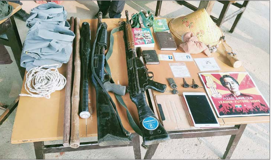
သဇင်မိုးလက်ဖက်ရည်ဆိုင်အတွင်းမှ ပြန်လည်သိမ်းဆည်းရမိသည့် သေနတ် နှစ်လက်နှင့် ပစ္စည်းများ။

သဖြင့် ယာဉ်ကို ရပ်တန့်ထားခဲ့ပြီး တပ်ဖွဲ့ဝင်များသည် မန္တလေး-မိုးကုတ် ကားလမ်းအရှေ့ဘက် ၁ မိုင်ခန့်အကွာ တောင်ပေါ်သို့ တိမ်းရှောင်ခဲ့ရကြောင်း။ ဖြစ်စဉ်ဖြစ်ပွားခဲ့သော နေရာသို့ လုံခြုံရေးတပ်ဖွဲ့ဝင်များပါဝင်သော ပူးပေါင်းအဖွဲ့က နယ်မြေရှင်းလင်း၍ သွားရောက်ရှာဖွေခဲ့ရာ ညနေ ၄ နာရီ ၁၅ မိနစ်တွင်