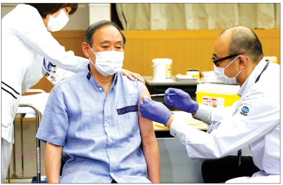
ဂျပန်ဝန်ကြီးချုပ် ကိုဗစ် -၁၉ ကာကွယ်ဆေးထိုးနှံမှုခံယူနေစဉ်။

ယုံကြည်ကြောင်း၊ ထို့ပြင် လူနာ များ ရောဂါအပြင်းအထန်ခံစား ရခြင်းမှ ကာကွယ်ပေးနိုင်မည်ဟု လည်းယုံကြည်ကြောင်း ၎င်းက ဆက်လက် ပြောကြားခဲ့သည်။ မကြာမီအချိန်အတွင်း ဂျပန် ပြည်သူများအားလုံး ကာကွယ် ဆေး ထိုးနှံပေးနိုင်တော့မည်ဟု ၎င်းက ဆက်လက်ပြောကြားခဲ့ သည်။ ဂျပန်ပြည်သူများ ကိုဗစ်-၁၉ ကာကွယ်ဆေးကို လိုလို လားလားထိုးနှံမှု ခံယူကြရန် သတင်းအချက်အလက်များ မျှဝေ ပေးမည်ဟုလည်း သိရသည်။ အင်န်အိတ်ချ်ကေ