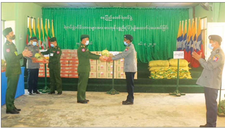
သားများ၊ မြန်မာနိုင်ငံရဲတပ်ဖွဲ့ဝင်များနှင့် မိသားစုဝင်များ၊ ဌာနဆိုင်ရာ ဝန်ထမ်းများအား ဆန်၊ ဆီ၊ ဆား၊ ပဲနှင့် စားသောက်ဖွယ်ရာများ ပေးအပ်လျက်ရှိရာ တာဝန်ရှိသူများက လက်ခံ ဝင်များအတွက် အလှူရှင်များက စားသောက်ဖွယ်ရာ ရယူခဲ့ကြကြောင်း သတင်းရရှိသည်။ သတင်းစဉ်

ပေးအပ်လျက်ရှိသည်။ ထိုသို့ ပေးအပ်လျက်ရှိရာ ယနေ့တွင် နေပြည်တော်ကောင်စီနယ်မြေအတွင်းရှိ မြန်မာနိုင်ငံ ရဲတပ်ဖွဲ့ဝင်များနှင့် မိသားစုဝင်များအတွက် နေပြည် တော် တိုင်းစစ်ဌာနချုပ်မှ တာဝန်ရှိသူများက လည်းကောင်း၊ စစ်ကိုင်းတိုင်းဒေသကြီး ကလေးခရိုင်၊ မော်လိုက်ခရိုင်၊ ခန္တီးခရိုင်နှင့် ချင်းပြည်နယ် ဟားခါး၊ တီးတိန်၊ ဖလမ်း၊ တွန်းဇံ၊ ထန်တလန်မြို့နယ်အတွင်းရှိ မြန်မာနိုင်ငံရဲတပ်ဖွဲ့ဝင်များနှင့် မိသားစုဝင်များ အတွက် အနောက်မြောက်တိုင်းစစ်ဌာနချုပ်မှ တာဝန်ရှိသူများက သွားရောက်တွေ့ဆုံ၍ ဆန်၊ ဆီ၊ ဆား၊ ပဲ လေးမျိုးနှင့် စားသောက်ဖွယ်ရာများကို ပေးအပ်ကာ လိုအပ်သည်များ ညှိနှိုင်းဆောင်ရွက် ပေးသည်။ ထို့ပြင် နိုင်ငံတော်ကာကွယ်ရေးနှင့် လုံခြုံရေး တာဝန်များကို ထမ်းဆောင်လျက်ရှိသည့် တပ်မတော်