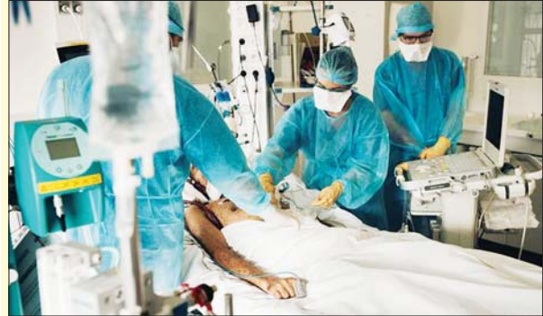
ကိုဗစ်-၁၉ ကူးစက်ဖြစ်ပွားနေသူတစ်ဦးအား အထူးကြပ်မတ် ကုသဆောင်တွင် ကုသနေသည်ကို တွေ့ရစဉ်။