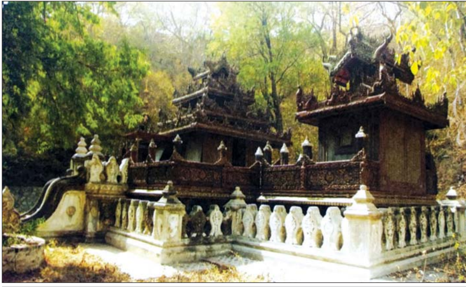
အရိယဝံသကျောင်း

မြန်မာနိုင်ငံသည် အနုပညာလက်ရာယဉ်ကျေးမှု အထွန်းကားဆုံးနေရာတစ်ခုဟု ဆိုနိုင်ပါသည်။ အနုပညာဆိုင်ရာ ရှေးလက်ရာများကို လေ့လာမည် ဆိုပါက လေ့လာ၍ မကုန်နိုင်ပေ။ ရှေးဟောင်း သစ်သားကျောင်းတော်ကြီးတွေ များစွာရှိသည့် အနက် သင်္ဃာတင်ကျောင်းတော်ကြီးလည်း အပါအဝင်ဖြစ်ပါသည်။ သင်္ဃာကျောင်းတိုက်ဟု ဆိုလိုက်သည်နှင့် မြန်မာစာပေသမိုင်းတွင် ထင်ရှားကျော်ကြားသော သင်္ဃာဆရာတော်ကြီးကို လူတိုင်းသိကြပေလိမ့်မည်။ သင်္ဃာပုံပြင်များဆို လူသိများလှပါသည်။ သင်္ဃာကျောင်းတော်ကြီး သည် မန္တလေးမြို့ ဒေဝန်းအနောက်ရပ်ကွက် ချမ်းအေးသာစံမြို့နယ်တွင် တည်ရှိပြီး သင်္ဃာ ချောင်း၏ အရှေ့ဘက်တွင် တည်ရှိပါသည်။