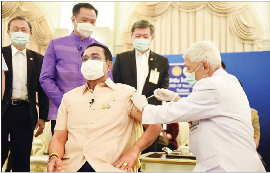
ထိုင်းဝန်ကြီးချုပ် ပရာယုဒ်ချန်အိုချာ ကိုဗစ်-၁၉ ကာကွယ်ဆေးထိုးနှံမှု ခံယူနေသည်ကို တွေ့ရစဉ်။

ထိုင်းဝန်ကြီးချုပ် ပရာယုဒ်ချန်အိုချာသည် အက်စ်ထရာဇီကာ ကိုဗစ်-၁၉ ကာကွယ်ဆေးကို မတ် ၁၆ ရက်က ပထမဆုံး ထိုးနှံမှုခံယူခဲ့သည်။ ပရာယုဒ်သည် လွန်ခဲ့သော သောကြာနေ့က ကိုဗစ်-၁၉ ကာကွယ်ဆေးထိုးခံရန် စီစဉ်ခဲ့သည်။ သို့သော် လည်း ဥရောပရှိ အက်စ်ထရာဇီကာ ကိုဗစ်-၁၉ ကာကွယ်ဆေးထိုးနှံမှု ခံယူသူတချို့က သွေးကြော