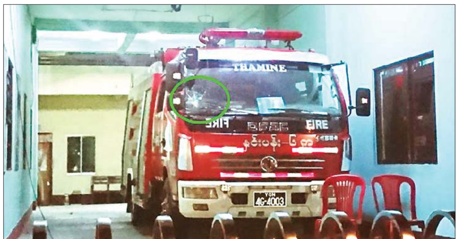
ဆူပူအကြမ်းဖက်သူများ၏ ဖျက်ဆီးမှုကြောင့် ရှေ့လေကာမှန်ကွဲသွားသည့် မီးသတ်ယာဉ်ကို တွေ့ရစဉ်။