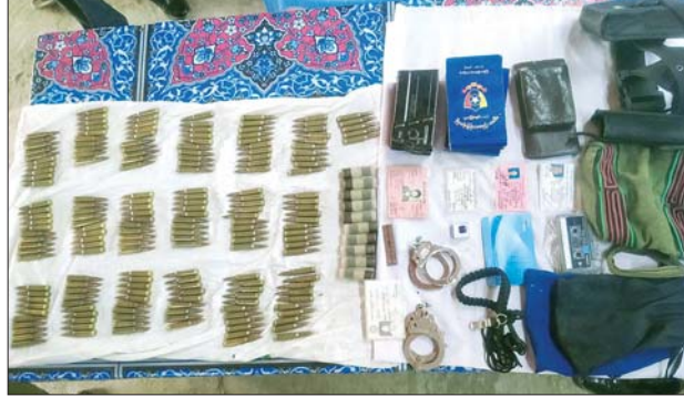
ပြန်လည်တွေ့ရှိခဲ့သည့် ကျည်များနှင့် ဆက်စပ်ပစ္စည်းများ။

ကျေးရွာ သပိတ်ကျင်းမြို့နယ်နေသူ အမျိုးသား ၂ ဦး(စိစစ်ဆဲ)ကို ဖမ်းဆီးထိန်းသိမ်းနိုင်ခဲ့ပြီး လုံခြုံရေး တပ်ဖွဲ့ဝင်များ ကျန်ရှိခဲ့သည့် Light Truck ယာဉ်မှာ ဆူပူအကြမ်းဖက်လူအုပ်စု၏ ဖျက်ဆီးခြင်းခံခဲ့ရကြောင်း။ ဖြစ်စဉ်တွင် ပျောက်ဆုံးလျက်ရှိသည့် သေနတ် ၂ လက် ပြန်လည်သိမ်းဆည်းရရှိရေးအတွက် လုံခြုံ