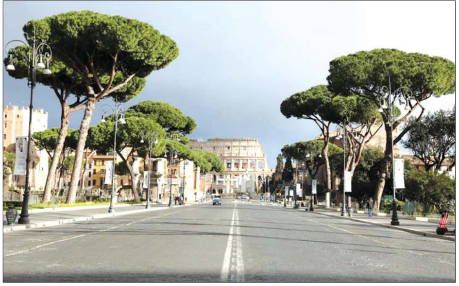
အီတလီနိုင်ငံ ရောမမြို့တွင် လူသူရှင်းလင်းနေသည့်လမ်းမကြီးကို တွေ့ရစဉ်။

နောက်ထပ်သေဆုံးသူ ၃၅၄ ဦး အပါအဝင် စုစုပေါင်းသေဆုံးသူအရေအတွက်မှာ ၁၀၂၄၉၉ ဦး ရှိသည်။ ပြန်လည်ကျန်းမာလာသူအရေအတွက်မှာ လည်း ၂ ဒသမ ၆ သန်း ရှိလာပြီဖြစ်သည်။ အီတလီ နိုင်ငံတွင် ကိုဗစ်-၁၉ ကာကွယ်ဆေးထိုးနှံမှုများ ဆက်လက်ဆောင်ရွက်နေပြီး လူပေါင်း ၆ ဒသမ ၇ သန်းရှိပြီး နှစ်ကြိမ်တိုင်ကာကွယ်ဆေးထိုးပြီးသူ အရေအတွက်မှာ နှစ်သန်းရှိသည်ဟု သိရသည်။ ဆင်ဟွာ