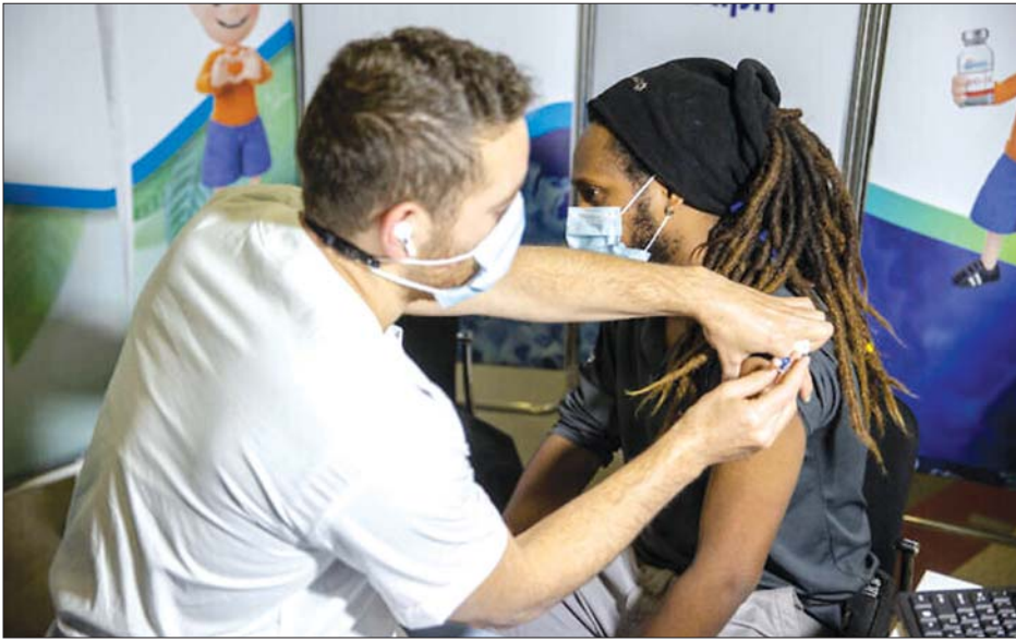
အစ္စရေးနိုင်ငံ ဂျေရုဆလင်မြို့၌ မတ် ၁၁ ရက်က ကိုဗစ် -၁၉ ကာကွယ်ဆေးထိုးပေးနေစဉ်။

အစ္စရေးတွင် ကိုဗစ်-၁၉ ကူးစက်ခံရပြီးနောက် ပြန်လည် ကျန်းမာလာသူ ၇၈၄၅၆၆ ဦးရှိ သည်ဟုသိရသည်။ အစ္စရေးနိုင်ငံ သည် ကမ္ဘာပေါ်တွင် အလျင်မြန် ဆုံး ကိုဗစ် -၁၉ ကာကွယ်ဆေး