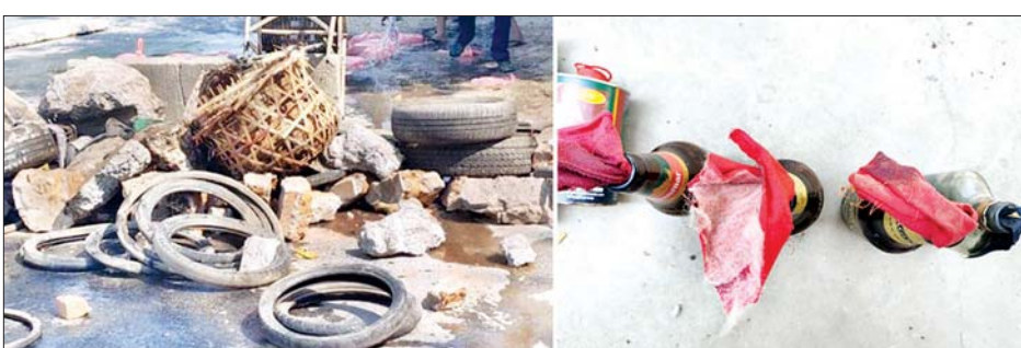
အောင်လံမြို့နယ် အကြမ်းဖက်ဆူပူသူလူစုလူဝေးပြုလုပ်သူများထံမှ သိမ်းဆည်းရမိသည့်ပစ္စည်းများ။

နေပြည်တော် မတ် ၁၅ အောင်လံမြို့နယ် မြို့မရဲစခန်းကို ဆူပူအကြမ်းဖက်သူ လူစုလူဝေး က အကြမ်းဖက် ရန်ပြုလာသဖြင့် ဖြိုခွဲထိန်းသိမ်းခဲ့ရာ ရဲတပ်ဖွဲ့ဝင် ၅ ဦး ထိခိုက် ဒဏ်ရာရရှိခဲ့ပြီး အကြမ်းဖက်သူ အမျိုးသား ၂ ဦး သေဆုံး၊ ၅ ဦး ဒဏ်ရာရရှိခဲ့ ကြောင်း မြန်မာနိုင်ငံ ရဲတပ်ဖွဲ့၏ သတင်းထုတ်ပြန်ချက်အရ သိရ သည်။