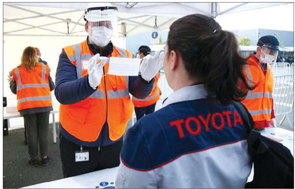
ပြင်သစ်နိုင်ငံမြောက်ပိုင်း တိုယိုတာကားကုမ္ပဏီတွင် ကိုဗစ်-၁၉ ကာကွယ်ဆေးနည်းလမ်းများ ပညာပေး ရှင်းလင်းနေစဉ်။