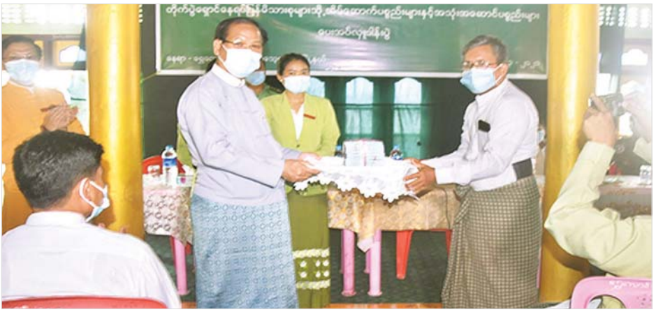
ဘဒ္ဒန္တအာစရအား ဖူးမြော်ကြည်ညိုကာ လှူဖွယ် လှည့်လည်ကြည့်ရှုခဲ့ကြောင်း သတင်းရရှိသည်။ ပစ္စည်းများ ဆက်ကပ်လှူဒါန်းပြီး ကျေးရွာအတွင်း သတင်းစဉ်

ရှေးဦးစွာ ပြည်နယ် စီမံအုပ်ချုပ်ရေးကောင်စီဥက္ကဋ္ဌ ဒေါက်တာအောင်ကျော်မင်းက အဖွဲ့အမှတ်စကားပြောကြားသည်။ ထို့နောက် တိုက်ပွဲရှောင်နေရပ်ပြန်ပြည်သူများအတွက် ရခိုင်ပြည်နယ်စီမံအုပ်ချုပ်ရေးကောင်စီနှင့် တပ်မတော်(ကြည်း၊ ရေ၊လေ)မိသားစုများက ထောက်ပံ့ပေးအပ်သည့် အလှူငွေကျပ် သိန်း ၉၀၊ အိမ်ဆောက်ပစ္စည်းများနှင့် အိမ်အသုံးအဆောင်ပစ္စည်းများကို ထောက်ပံ့ပေးအပ်ကာ ရွှေလောင်းတင်ကျေးရွာ အုပ်ချုပ်ရေးမှူးက ကျေးဇူးတင်စကား ပြန်လည်ပြောကြားသည်။ ဆက်လက်၍ ပြည်နယ် စီမံအုပ်ချုပ်ရေးကောင်စီဥက္ကဋ္ဌနှင့် အဖွဲ့ဝင်များသည် သာသနာ့မူလမဟာသီရိဘုန်းတော်ကြီးကျောင်း ဆရာတော်