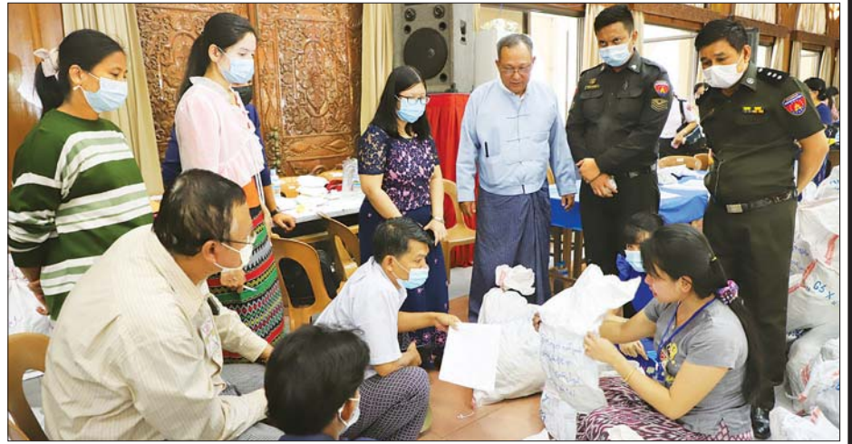
မဲလက်မှတ်များ မြေပြင်စစ်ဆေးစဉ်။