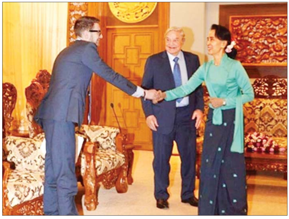
ဂျော့ဆိုးရော့စ်နှင့် ၎င်း၏သား ဒုတိယဥက္ကဋ္ဌဖြစ်သူ အလက်ဇန္ဒားဆိုးရော့စ်တို့သည် ၁၁-၁-၂၀၁၇ ရက်တွင် မြန်မာနိုင်ငံသို့ရောက်ရှိလာပြီး ဒေါ်အောင်ဆန်းစုကြည်နှင့် နေပြည်တော်၌ တွေ့ဆုံစဉ်။