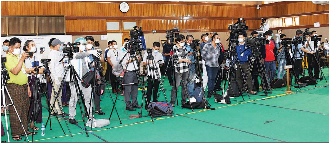
နိုင်ငံတော်စီမံအုပ်ချုပ်ရေးကောင်စီ သတင်းထုတ်ပြန်ရေးအဖွဲ့၏ သတင်းစာရှင်းလင်းပွဲသို့ တက်ရောက်လာသော သတင်းမီဒီယာများကို တွေ့ရစဉ်။

ဆက်လက်၍ VOM သတင်းဌာနမှ သတင်းထောက် ဦးမောင်မောင်ထွန်း က ယခုဖြစ်စဉ်တွင် သတင်းသမားများကို ဖမ်းဆီးထားသည်မှာ ၃၀ ခန့် ရှိသွားပြီ ဖြစ်ကြောင်း၊ ၁၀ ဦးခန့်ကို အမှုဖွင့်ထားပြီး သတင်းစာတိုက် ၆ ခု ပိတ်ထားကြောင်း၊ ထုတ်ဝေခွင့် ရပ်ထားသည်များလည်းရှိကြောင်း၊ ထိုကိစ္စများသည် လွတ်လပ်စွာပြောဆိုခွင့်ကို ပိတ်ပင်ခြင်း ဖြစ်၍ နိုင်ငံတကာအလယ်တွင် အရှက်ရစရာဖြစ်ကြောင်း၊ ဒီမိုကရေစီဖက်ဒရယ်စနစ်ကို အခြေခံသည့် ပြည်ထောင်စုကို ၂၀၀၈ ခုနှစ် ဖွဲ့စည်းပုံအခြေခံဥပဒေနှင့်အညီ သွားနေပါသည်ဆိုသည့် နိုင်ငံတော်စီမံအုပ်ချုပ်ရေးကောင်စီ အနေဖြင့် လူ့အခွင့်အရေးကို ချိုးဖောက်သည်ဟု ယူဆပါသလား၊ သတင်းလွတ်လပ်ခွင့်အနေဖြင့် မည်သို့ လုပ်ဆောင်ပေးသလဲ သိလိုကြောင်း မေးမြန်းသည်။