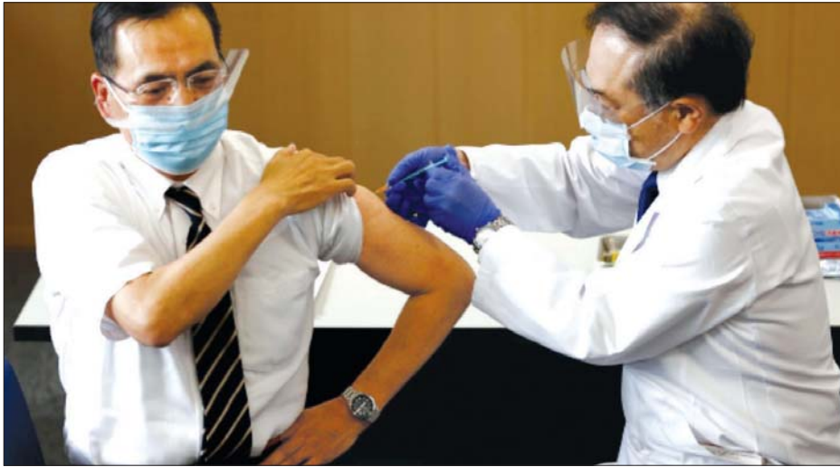
ဂျပန်နိုင်ငံတွင် ဖေဖော်ဝါရီ ၁၇ ရက်က ကိုဗစ်-၁၉ ကာကွယ်ဆေး ထိုးနှံပေးနေစဉ်။

ကာကွယ်ဆေးနှင့် ပတ်သက်သည့် အကြောင်း အရာများကို ပြောကြားပြီးနောက် ကာကွယ်ဆေး ထိုးနှံမှုခံယူမည့်သူအရေအတွက် များပြားလာရန် လည်း ၎င်းကမျှော်လင့်ထားသည်။ ကာကွယ်ဆေးထိုး ပြီးနောက် ဘေးထွက်ဆိုးကျိုးအနေဖြင့် ကိုယ်လက် မအီမသာဖြစ်ပါက အလုပ်မှခွင့်ယူနိုင်ရန်နှင့် ကာကွယ်ဆေးထိုးသွားရန်အတွက် ခွင့်ပေးရန်တို့ကို အစိုးရက စဉ်းစားနေသည်ဟု ၎င်းက ဆက်လက်