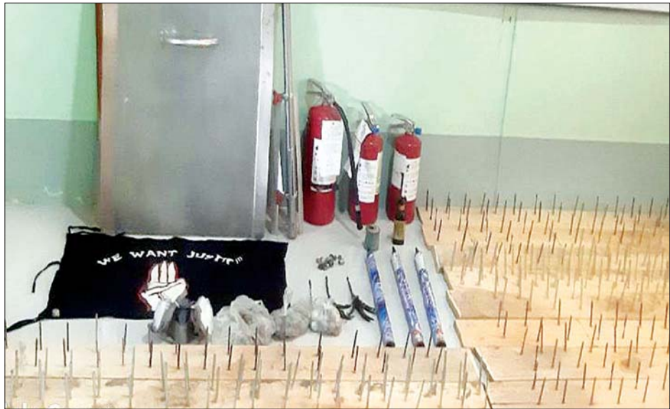
ကြို့ပင်ကောက်မြို့နယ် အကြမ်းဖက်ဆူပူဆန္ဒပြသူ လူစုလူဝေးများထံမှ သိမ်းဆည်းရမိသည့်ပစ္စည်းများ။

ယင်းနေရာသို့ ရောက်ရှိ၍ လူစုခွဲနိုင်ရေး ဆောင်ရွက်နေစဉ် ရွှေပြည်သာလမ်းအတွင်းမှ ဝှမ်းဂျီ