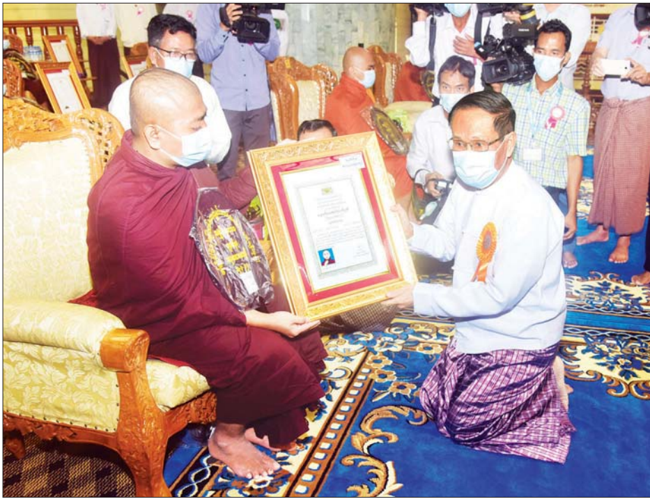
ပြည်ထောင်စုဝန်ကြီး ဦးကိုကို ဓမ္မာစရိယ၊ ပါဠိပထမပြန် စာမေးပွဲများတွင် ဂုဏ်ထူးဖြင့်အောင်မြင်သော အထူးအောင်သံဃာတော်အား ဘွဲ့တံဆိပ်တော်နှင့် အောင်လက်မှတ် ဆက်ကပ်လှူဒါန်းစဉ်။

ယင်းနောက် သာသနာရေးနှင့် ယဉ်ကျေးမှုဝန်ကြီးဌာန ပြည်ထောင်စုဝန်ကြီး ဦးကိုကိုက သာသနာရေးဆိုင်ရာများကို လျှောက်ထားရာတွင် မြတ်စွာဘုရားရှင်၏ သာသနာတော်မြတ်ကြီး၌ လေ့လာသင်ကြားရေး ပရိယတ္တိသာသနာ လိုက်နာကျင့်သုံးရေး ပဋိပတ္တိသာသနာ ထိုးထွင်းသိမြင်ရေး ပဋိပတ္တိဝေဓာသနာဟူ၍ သာသနာတော်သုံးရပ် ရှိသည်တွင် ပရိယတ္တိသာသနာတော်သည် အခြေခံအရင်းအမြစ် ကျလှပါကြောင်း၊ သို့သော်ကြောင့် ပရိယတ္တိသာသနာတော်ကြီးတိုးတက်စည်ပင်ပြန့်ပွား