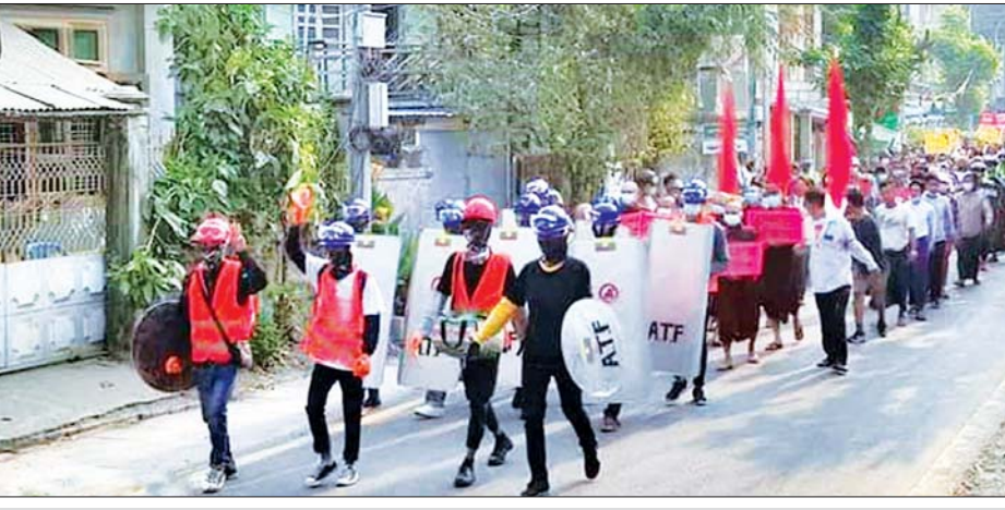
မြင်းခြံမြို့နယ်တွင် ဆန္ဒပြသူလူအုပ်စုအား တွေ့ရစဉ်။

နေပြည်တော် မတ် ၁၅ မြင်းခြံမြို့တွင် ဆူပူအကြမ်းဖက်သူလူစုလူဝေးအား ဖြိုခွဲစဉ် ဆူပူ အကြမ်းဖက်သူ ၂ ဦးသေဆုံးခဲ့ကြောင်း မြန်မာနိုင်ငံရဲတပ်ဖွဲ့၏ သတင်းထုတ်ပြန်ချက်အရ သိရသည်။ ယင်းသတင်းထုတ်ပြန်ချက်အရ ဆူပူအကြမ်းဖက်မှုလုပ်ငန်းများကို နည်းမျိုးစုံဖြင့် ဆောင်ရွက်လာကြသော လူစုလူဝေးများသည် အများပြည်သူ လူထု၏မျက်နှာကို ထောက်ရှုမှုမရှိဘဲ မိမိတို့အား ကြိုးကိုင်ခြယ်လှယ် သွေးထိုးလှုံ့ဆော်နေသော NLD ပါတီ၏နောက်ကွယ်မှ ညွှန်ကြားချက်အတိုင်း နေရာဒေသအများအပြားတွင် အဖျက်အမှောင့် လုပ်ငန်းများကို ဆက်လက်ဆောင်ရွက်လျက်ရှိနေကြောင်း။ မြင်းခြံမြို့၊ အမှတ်(၇) ရပ်ကွက်၊ သုဓမ္မလမ်းဆုံ၌ ဦးဆောင်သူ (စိစစ်ဆဲ) ဆူပူအကြမ်းဖက်သူအင်အား (၆၀၀) ကျော်ခန့်သည် ယနေ့ နံနက် ၁၀ နာရီခန့်က အကြောင်းမဲ့ ဆူပူအော်ဟစ်၍ အနီးပတ်ဝန်းကျင်ရှိ အဆောက်အအုံများကို မီးပုလင်းများဖြင့် မီးရှို့ရန် ကြံစည်လာပြီး ဆူပူအကြမ်းဖက်သူအများစုအနေဖြင့် အရက်/မူးယစ်ဆေးဝါး သုံးစွဲထားကြသည့်