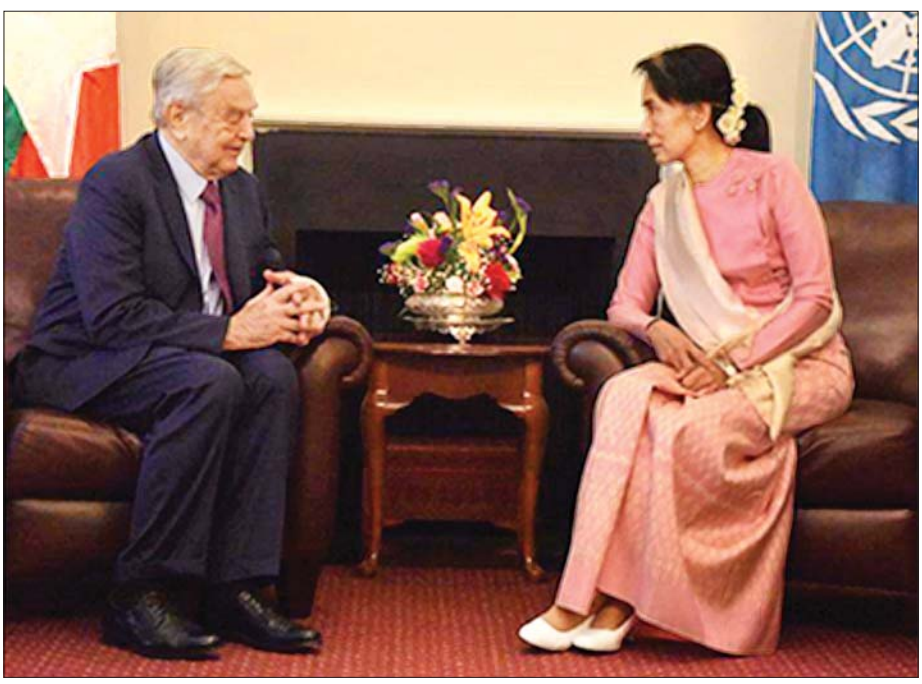
၂၀၁၆ ခုနှစ်၊ စက်တင်ဘာလ ၂၄ ရက်တွင် ဂျော့ဆိုးရော့စ်နှင့် ဒေါ်အောင်ဆန်းစုကြည်တို့ အမေရိကန်ပြည်ထောင်စု၊ နယူးယောက်၌ တွေ့ဆုံဆွေးနွေးစဉ်။

သို့ဖြစ်၍ အဆိုပါငွေကြေးများသည် CDM လှုပ်ရှားမှုအထောက်အပံ့အဖြစ် စီးဆင်းသွားနိုင်သည့်အတွက် Open Society Myanmar မှ ဒေါ်ဖြူပပသော်အား ၂၀၂၁ ခုနှစ်၊ မတ်လ ၁၂ ရက်မှစ၍ စစ်ဆေးမေးမြန်းလျက်ရှိပါသည်။ ကျန်ရှိသည့် အောက်ပါပုဂ္ဂိုလ် ၁၁ ဦးအား အချိန်မီ ဖမ်းဆီးထိန်းသိမ်း၍ စစ်ဆေးမေးမြန်းရန် ဆောင်ရွက်လျက်ရှိပါသည်။