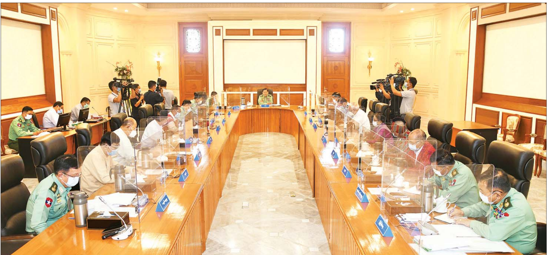
နိုင်ငံတော်စီမံအုပ်ချုပ်ရေးကောင်စီဥက္ကဋ္ဌ၊ တပ်မတော်ကာကွယ်ရေးဦးစီးချုပ် ဗိုလ်ချုပ်မှူးကြီး မင်းအောင်လှိုင် နိုင်ငံတော်စီမံအုပ်ချုပ်ရေးကောင်စီ အစည်းအဝေးတွင် အမှာစကားပြောကြားစဉ်။