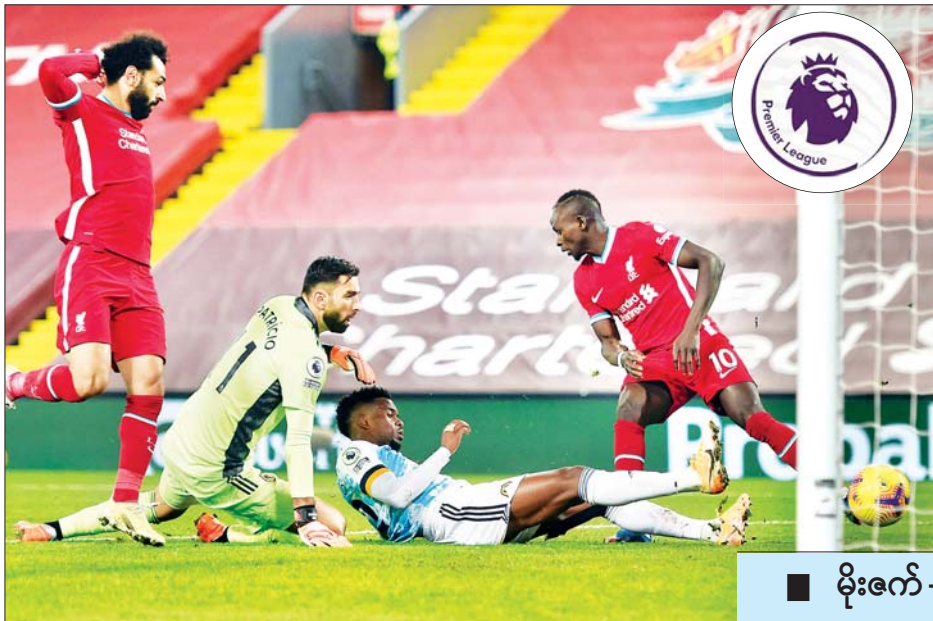
မိုးဇက် - စုစည်းသည်