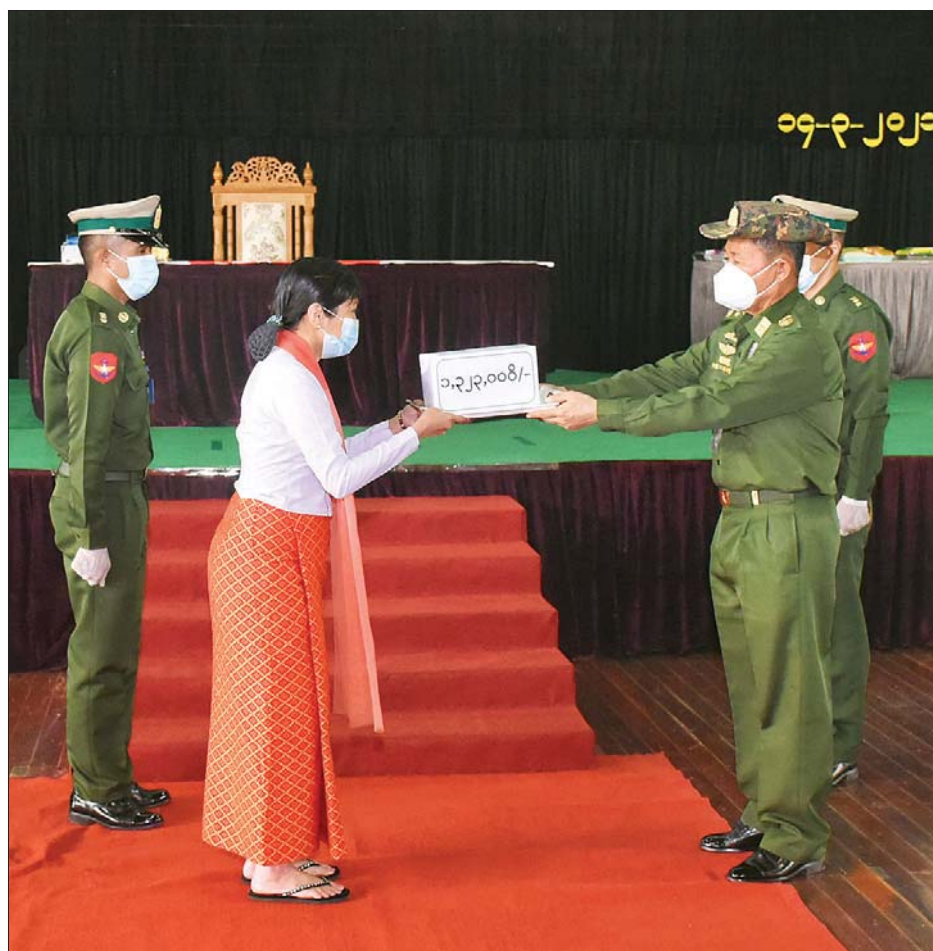
နိုင်ငံတော်စီမံအုပ်ချုပ်ရေးကောင်စီ ဒုတိယဥက္ကဋ္ဌ ဒုတိယတပ်မတော်ကာကွယ်ရေးဦးစီးချုပ် ကာကွယ်ရေးဦးစီးချုပ် (ကြည်း) ဒုတိယဗိုလ်ချုပ်မှူးကြီး စိုးဝင်း ထောက်ပံ့ငွေများ ပေးအပ်စဉ်။

စရိုက်ဆန်စွာ အကြမ်းဖက်ဖြစ်စဉ် များ၌ လုံခြုံရေးတပ်ဖွဲ့ဝင်များ ဥပဒေနှင့်အညီ အဓိကရုဏ်း နှိမ်နင်းလူစုခွဲမှုအပေါ် အင်အား သုံးဖြိုခွဲခြင်းအဖြစ် တစ်ဖက်သတ် ဖော်ပြစွပ်စွဲနေမှုအခြေအနေများ၊ လုံခြုံရေးတပ်ဖွဲ့ဝင်များအနေဖြင့် မင်းမဲ့စရိုက်ဆန်သော အကြမ်း ဖက်လုပ်ရပ်များအား ဖြေရှင်း ဆောင်ရွက်ရာတွင် ပြည်ထဲရေး ဝန်ကြီးဌာနမှ ထုတ်ပြန်သည့် ၁၉၅၆ ခုနှစ်၊ ရုန်းရင်းဆန်ခတ်မှု လက်စွဲ၊ မြန်မာနိုင်ငံ ရတပ်ဖွဲ့၏ (၂၀၁၅) ခုနှစ် ထုတ်ပြန်သည့် လူစုလူဝေးအား ကြီးကြပ် ထိန်းသိမ်းခြင်းလက်စွဲပါ စည်း မျဉ်း စည်းကမ်းဥပဒေအတိုင်း ဆောင်ရွက်မှု အခြေအနေများကို လည်းကောင်း၊ ဖေဖော်ဝါရီ ၅ ရက် မှ ၂၂ ရက်အထိ ငြိမ်းချမ်းစွာ ဆန္ဒ ဖော်ထုတ်မှုအပေါ် လုံခြုံရေး တပ်ဖွဲ့ဝင်များ၏ ကိုင်တွယ်မှုနှင့် ဖေဖော်ဝါရီ ၂၃ ရက်နောက်ပိုင်း လူတစ်ဦးချင်းစီ၏ အခွင့်အရေး ဆုံးရှုံးသည်အထိ လူ့အသက်နှင့် အရက်သိက္ခာ ကျဆင်းစေပြီး မိသားစုဘဝများပါ လူ့အသိုင်း အပိုင်းအတွင်း မသွားရ၊ မလာရ ဖြစ်စေသည့် မျက်ခုံးမွေးရိတ်ခြင်း၊ လေးကွက်ကျား ကတုံးရိတ်ခြင်း၊ လည်ပင်းစာတန်းဆွဲ၍ ရပ်ကွက် အတွင်းလှည့်လည်စေခြင်းအပြင် လူအုပ်စုဖြင့် အဓမ္မဖမ်းချုပ်၍ နဖူး၊ ပါးများတွင် တက်တူးရေးထိုး ခြင်း၊ ရပ်ကွက်အတွင်း အဓမ္မခြိမ်း ခြောက်အကျပ်ကိုင်ခြင်း၊ CDM