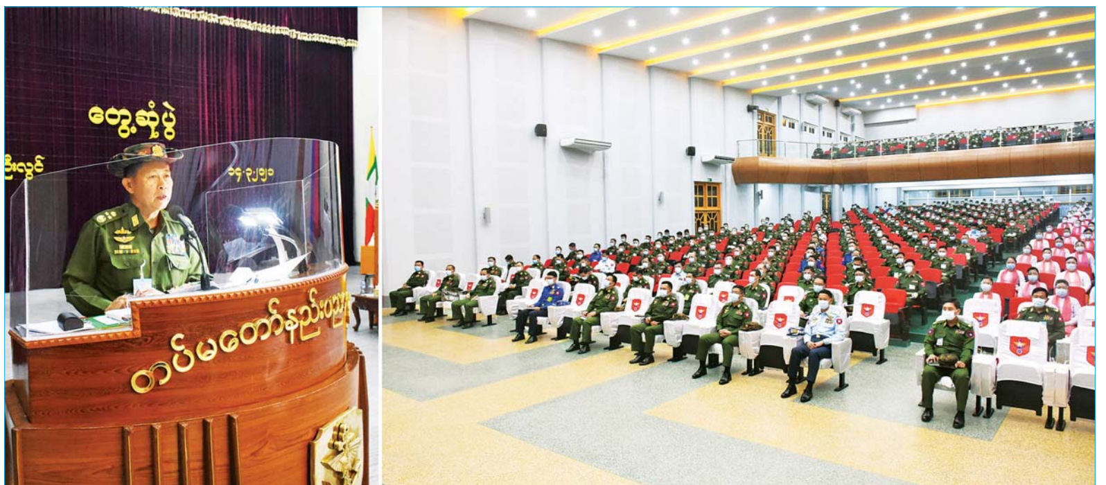
နိုင်ငံတော်စီမံအုပ်ချုပ်ရေးကောင်စီ ဒုတိယဥက္ကဋ္ဌ ဒုတိယတပ်မတော်ကာကွယ်ရေးဦးစီးချုပ် ကာကွယ်ရေးဦးစီးချုပ်(ကြည်း) ဒုတိယဗိုလ်ချုပ်မှူးကြီး စိုးဝင်း ပြင်ဦးလွင်မြို့ တပ်မတော်နည်းပညာတက္ကသိုလ်၌ သင်တန်းသားအရာရှိများ၊ သန္ဓေအရာရှိ စစ်သည်မိသားစုများအား တွေ့ဆုံအမှာစကားပြောကြားစဉ်။

နေပြည်တော် မတ် ၁၄ နိုင်ငံတော်စီမံ အုပ်ချုပ်ရေး ကောင်စီ ဒုတိယဥက္ကဋ္ဌ ဒုတိယ တပ်မတော်ကာကွယ်ရေး ဦးစီး ချုပ် ကာကွယ်ရေးဦးစီးချုပ် (ကြည်း) ဒုတိယဗိုလ်ချုပ်မှူးကြီး စိုးဝင်းသည် ယနေ့ နံနက်ပိုင်း တွင် ပြင်ဦးလွင်မြို့ နယ်မြေခံတပ် နှင့် တပ်မတော်နည်းပညာ တက္ကသိုလ်တို့ရှိ သင်တန်းသား အရာရှိများ၊ သန္ဓေအရာရှိ၊ စစ်သည်များနှင့် မိသားစုများအား သီးခြားစီတွေ့ဆုံ၍ အားပေးအမှာ စကား ပြောကြားသည်။ အဆိုပါ တွေ့ဆုံပွဲများသို့ ကာကွယ်ရေးဦးစီးချုပ်(ကြည်း) မှ ဒုတိယဗိုလ်ချုပ်ကြီး အောင်ဇော် အေး၊ ကာကွယ်ရေးဦးစီးချုပ်ရုံး စာမျက်နှာ ၃ ကော်လံ ၁ ●