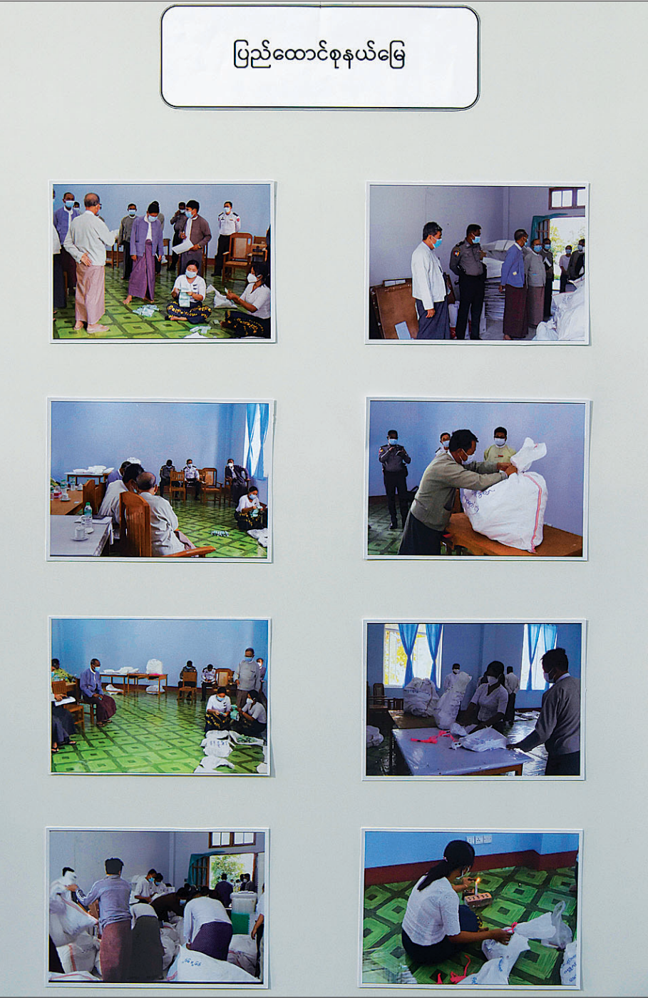
ပြည်ထောင်စုနယ်မြေ