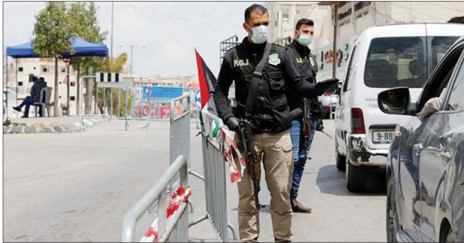
စစ်ဆေးရေးဂိတ်တွင် စောင့်ကြပ်နေကြသည့် ပါလက်စတိုင်းလိုခြံရေးတပ်ဖွဲ့ဝင်များကို တွေ့ရစဉ်။

ကြာပိတ်ပင်သွားမည်ဟု တရားဝင်ထုတ်ပြန်ချက်အရ သိရသည်။ ငါးရက်တာ အသွားအလာပိတ်ဆို့