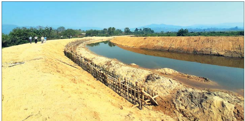
သန်းထွန်းအေး (ပြန်/ဆက်)

ယခင်က မိုးရာသီကာလများတွင် နမ့်မယ်ဟုတ်ချောင်းနှင့် နမ့်ဟိုင်းချောင်းတို့တွင် ရေကြီးရေလျှံမှုများဖြစ်ပေါ်သည့်အတွက် ဒေသခံတောင်သူများ၏ စိုက်ပျိုးမြေများ ရေလွှမ်းမှုများနှင့် ကြုံတွေ့ရပြီး ယခုအခါ အဆိုပါချောင်းများတွင် သဲနန်းပြန်လည်တူးဖော်ခြင်းနှင့် တုတ်တန်းရိုက် သဲအိတ်ချကာရံခြင်းလုပ်ငန်းကို ဆောင်ရွက်ပြီးစီးပြီဖြစ်သည့် အတွက် ဒေသခံတောင်သူများ၏ စိုက်ပျိုးမြေ ဧက ၆၆၀ ခန့်ကို ရေကြီးရေလျှံမှုမှ ကာကွယ်ပေးနိုင်မည်ဖြစ်ကြောင်း သိရသည်။