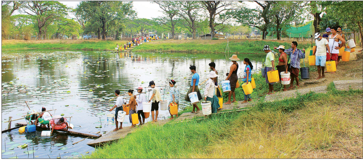
ညောင်ကုန်းရပ်ကွက်ရှိ မဟာသင်္ကြန် ရေကန်ကြီး၌ သောက်သုံးရေအတွက် ဒေသခံများ တန်းစီခပ်ယူနေကြစဉ်။