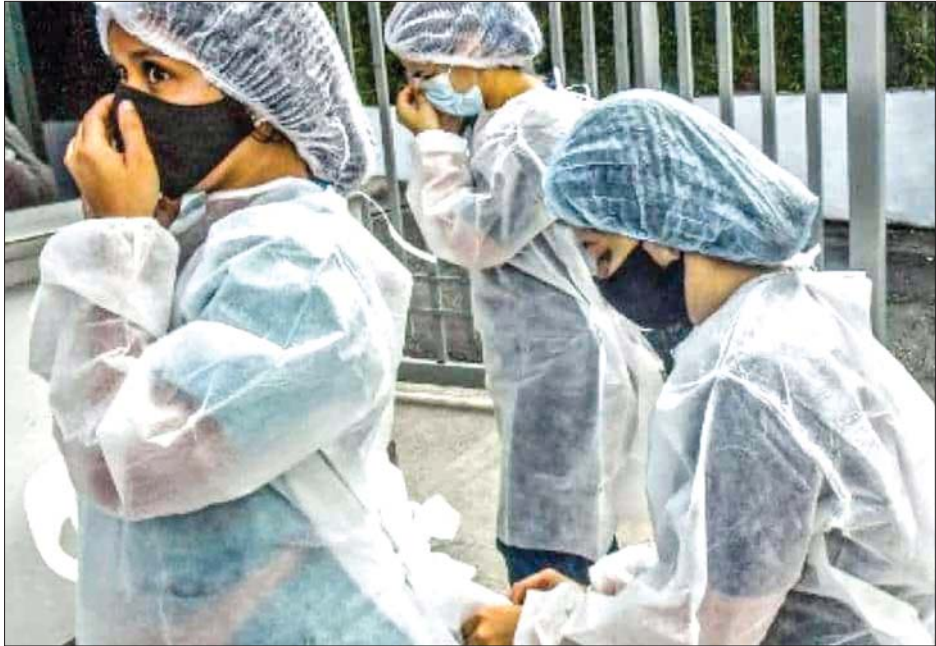
အကာအကွယ်ဝတ်စုံများ ဝတ်ဆင်နေကြသည့် သူနာပြုများကို တွေ့ရစဉ်။

ကြောင်း သူနာပြုကောင်စီက ပြောသည်။ တစ်ကမ္ဘာလုံးအနှံ့ သူနာပြုပြုတ်လပ်မှုမှာလည်း ၁၃ သန်းနီးပါး ရှိသည်ဟု အပြည်ပြည်ဆိုင်ရာ သူနာပြုကောင်စီက ပြောသည်။ ယင်းဖြစ်ရပ်များကြောင့် အစိုးရများအနေဖြင့် သူနာပြုများအတွက် လုပ်ငန်းခွင်အခြေအနေ ပိုမိုကောင်းမွန်အောင် လုပ်ဆောင်ပေးရန်လိုအပ်သည်ဟု တိုက်တွန်းထားသည်။ သူနာပြု အသက်မွေးဝမ်းကျောင်း လုပ်ငန်းအခြေအနေနှင့် ပတ်သက်ပြီး နက်နက်ရှိုင်းရှိုင်းစိုးရိမ်မိသည်ဟု အပြည်ပြည်ဆိုင်ရာ သူနာပြုကောင်စီဥက္ကဋ္ဌဖြစ်သူ အန်နက်တီ ကန်နက်ဒီက ပြောသည်။ အင်န်အိတ်ချ်က