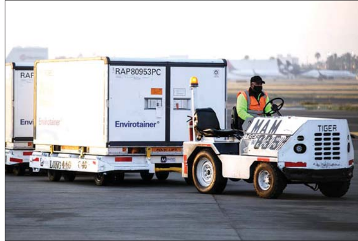
တတိယအကြိမ်ပေးပို့လာသည့် ကိုဗစ်-၁၉ ကာကွယ်ဆေးများ သယ်ဆောင်လာသည်ကို တွေ့ရစဉ်။

က ပြောသည်။ ပေးပို့လိုက်သည့် ကာကွယ်ဆေးများ မက္ကဆီကိုစီးတီးရှိ လေဆိပ်သို့ မတ် ၁၄ ရက်တွင် ရောက်ရှိလာသည်ဟု သိရသည်။