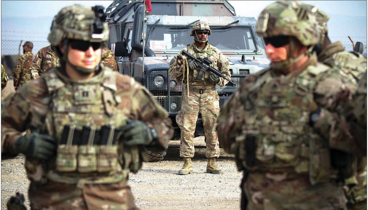
အမေရိကန်တပ်ဖွဲ့ဝင်များကို တွေ့ရစဉ်။

ယခုအခါ အမေရိကန်ဘက်မှ တပ်ဖွဲ့ဝင်များ အာဖဂန်မြေပေါ်မှ ရုပ်သိမ်းပေးမည့်အရေးမှာ အချိန်ကာလနောက်ဆုတ်သွားရန် အလားအလာရှိ သည်ဟု ၎င်းက ပြောကြားခဲ့သည်။ အမေရိကန် သမ္မတဟောင်း ဘားရက်အိုဘားမားနှင့် ဒေါ်နယ်ထရမ်တို့လိုပင် သမ္မတဂျိုးဘိုင်ဒင်သည် အာဖဂန်စစ်ပွဲပြီးဆုံးသွားစေရန်အတွက် ရည်ရွယ် သည်။ အာဖဂန်စစ်ပွဲမှာ အမေရိကန် ဒေါ်လာ ထရီလီယံနှင့်ချီကာကုန်ကျပြီး အမေရိကန်တပ်ဖွဲ့ ဝင် ၂၀၀၀ ကျော်၏ အသက်များ ဆုံးရှုံးခဲ့ရသည်။ ထို့ပြင် အရပ်သား တစ်သိန်း၏ အသက်များလည်း ဆုံးရှုံးခဲ့ရသည်။ ယခုအခါ သမ္မတဂျိုးဘိုင်ဒင်ကို စစ်ရေး ထိပ်တန်းအကြံပေးပုဂ္ဂိုလ်များက အာဖဂန် မြေပေါ်မှ တပ်ဖွဲ့ဝင်များ ပြန်လည်ဆုတ်ခွာလျှင် ဖြစ်ပေါ်လာမည့် အကျိုးဆက်များကို ရှင်းပြမည် ဖြစ်သကဲ့သို့ ပါတီနှစ်ခုစလုံးမှ လွှတ်တော်အမတ်များ