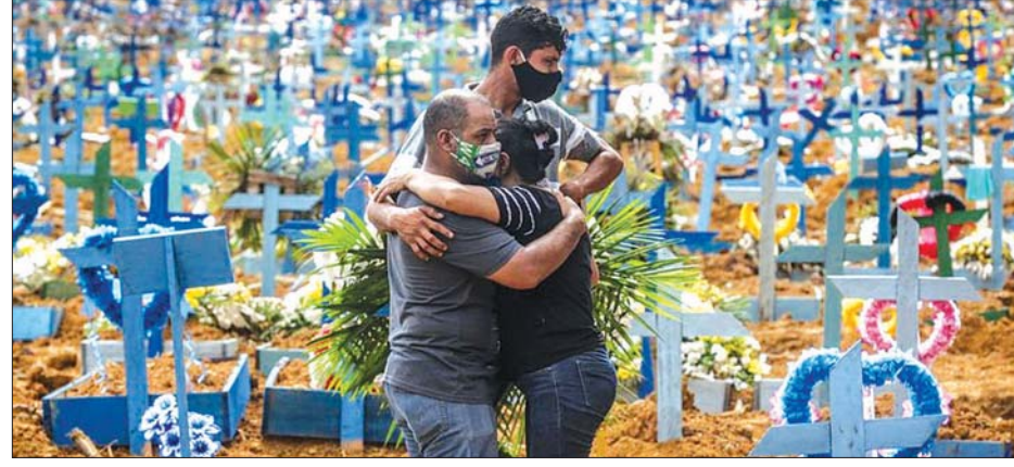
ဘရာဇီးနိုင်ငံ ကိုဗစ်-၁၉ ဖြစ်စဉ်တွင် သေဆုံးခဲ့သူမိသားစုများကြား တစ်ဦးနှင့်တစ်ဦး အားပေးနေသည်ကို တွေ့ရစဉ်။

ပြောကြားလိုက်သည်။ ကိုဗစ်-၁၉ ဆိုင်ရာ ကျွမ်းကျင် ပညာရှင် အကြံပေးအဖွဲ့အကြီး အကဲ ဖြစ်သူ မစ္စတာ အိုမီ ရှိဂီရက မတ် ၁၀ ရက်က အောက်လွတ် တော်တွင် ကျင်းပခဲ့သည့် ကျန်းမာရေး၊ အလုပ်သမား ရေးနှင့် လူမှုဖူလုံရေး ကော်မတီ အစည်းအဝေးတစ်ခုတွင် ထိုသို့ ပြောကြားလိုက်ခြင်း ဖြစ်သည်။ မူလ ကိုဗစ်-၁၉ နေရာတွင် ပီပြောင်း ကိုဗစ်-၁၉ မျိုးစိတ် သစ် အစားထိုးနေရာယူသည့် ဖြစ်စဉ်များ စတင်နေသည်မှာ သေချာကြောင်း ၎င်းက ပြောကြားလိုက်သည်။ ထို့အပြင် မကြာခင် အချိန် အတွင်းတွင် မျိုးရိုးဗီဇ ပြောင်းအမျိုးအစား ကူးစက်မှု များ၏ အဓိကအကြောင်း ရင်းဖြစ်လာမည်ဟု ၎င်းက ဆက်လက် ပြောကြားလိုက် သည်။ အင်န်အိတ်ချ်ကေ