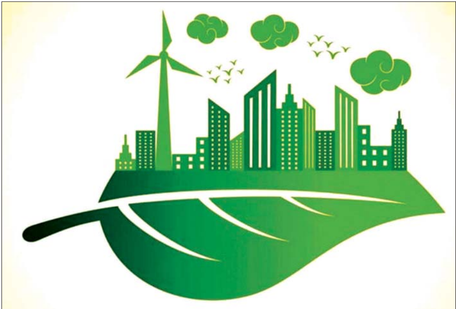
သဘာဝပတ်ဝန်းကျင်နှင့် လိုက်လျောညီထွေဖြစ်သည့် ကမ္ဘာကြီးကို ဖော်ညွှန်းထားသော ကိုယ်စားပြု ဖော်ပြထားသည့် ပုံတစ်ပုံ။

ယခုအချိန်အထိ ကမ္ဘာလုံးဆိုင်ရာ သဘာဝ ပတ်ဝန်းကျင်အပေါ် ဘဏ္ဍာငွေသုံးစွဲမှုသည် ရာသီ