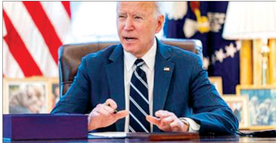
အမေရိကန် သမ္မတ ဂျိုးဘိုင်ဒင်

ပြည်သူများ အနေဖြင့် ပါးစပ်၊ နှာခေါင်းစည်း တပ်ဆင်ရန်၊ လူမှုဝေးကွာ အလေ့အကျင့်များ ဆက်လက် ကျင့်သုံးရန်နှင့် ကျန်းမာရေး ဂရုစိုက်ကြရန် လည်း တိုက်တွန်းခဲ့သည်။ အင်န်အိတ်ချ်ကေ