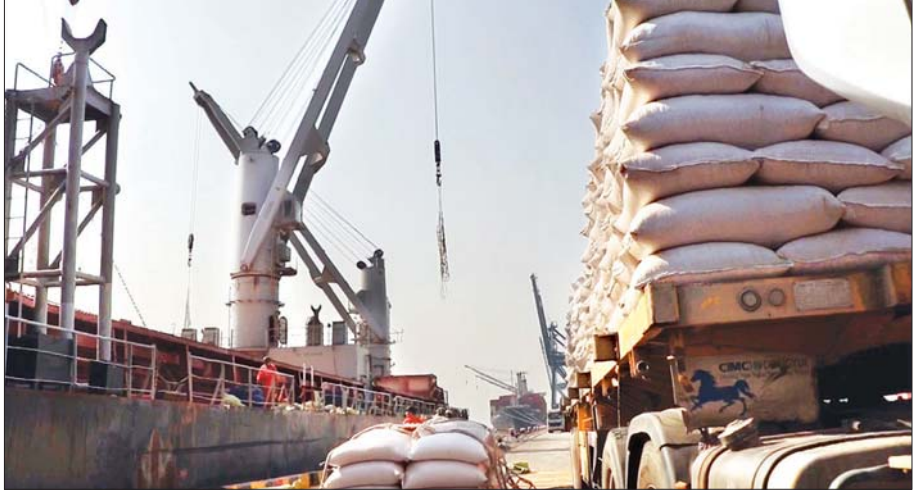
ကုန်စည်စီးဆင်းမှုလုပ်ငန်း ပုံမှန်အတိုင်းဆောင်ရွက်လျက်ရှိရာ ပြည်ပသို့တင်ပို့မည့်ဆန်များကို သင်္ဘော ပေါ်သို့ တင်ဆောင်နေစဉ်။