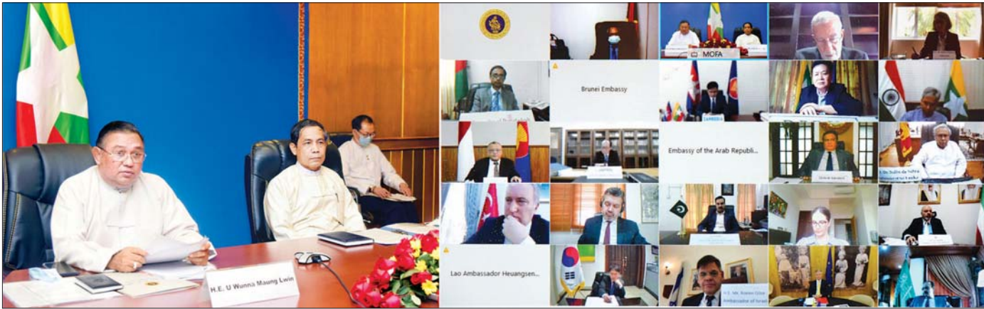
ပြည်ထောင်စုဝန်ကြီး ဦးဝဏ္ဏမောင်လွင်နှင့် ဦးကိုလှိုင်တို့က မြန်မာနိုင်ငံ၌ လက်ရှိဖြစ်ပေါ်လျက်ရှိသော အခြေအနေများနှင့်ပတ်သက်၍ မြန်မာနိုင်ငံအခြေစိုက် ပြည်ပသံရုံးများမှ သံအမတ်ကြီးများ၊ သံတမန်များနှင့် ကုလသမဂ္ဂ လက်အောက်ခံအဖွဲ့အစည်းအများမှ အကြီးအကဲများအား ဗီဒီယိုကွန်ဖရင့်စနစ်ဖြင့် ရှင်းလင်းပြောကြားစဉ်။