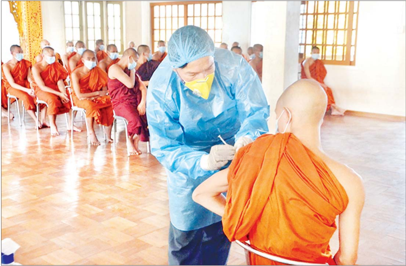
ဆရာတော်တစ်ပါးအား ကိုဗစ်-၁၉ ကာကွယ်ဆေး ထိုးနှံပေးစဉ်။

ထိုသို့ဆောင်ရွက်ပေးလျက်ရှိရာ ယနေ့တွင် ရှမ်းပြည်နယ်(မြောက်ပိုင်း) လားရှိုးမြို့နယ်၊ လောကီကိုင်မြို့နယ်၊ ကွမ်းလုံမြို့နယ်၊ ကွတ်ခိုင် မြို့နယ်၊ နမ့်ဆန်မြို့နယ်၊ မိုင်းရယ်မြို့နယ်၊ မန်တုံ မြို့နယ်၊ နမ့်ခမ်းမြို့နယ်၊ သီပေါမြို့နယ်၊ နောင်ချို မြို့နယ်၊ ကျောက်မဲမြို့နယ်၊ ဟိုပန်းမြို့နယ်၊ မိုးမိတ် မြို့နယ်နှင့် မဘိမ်းမြို့များရှိ ဌာနဆိုင်ရာဝန်ထမ်းများနှင့် ဒေသခံတိုင်းရင်းသားပြည်သူများအား သတ်မှတ် နေရာအသီးသီး၌ လည်းကောင်း၊ ရှမ်းပြည်နယ် (တောင်ပိုင်း) တောင်ကြီးမြို့၊ ဟိုပုံးမြို့နယ်၊ ရပ်စောက် မြို့နယ်၊ ပင်းတယမြို့နယ်၊ ကလေးမြို့နယ်၊ စာမျက်နှာ ၁၁ ကော်လံ ၁ *