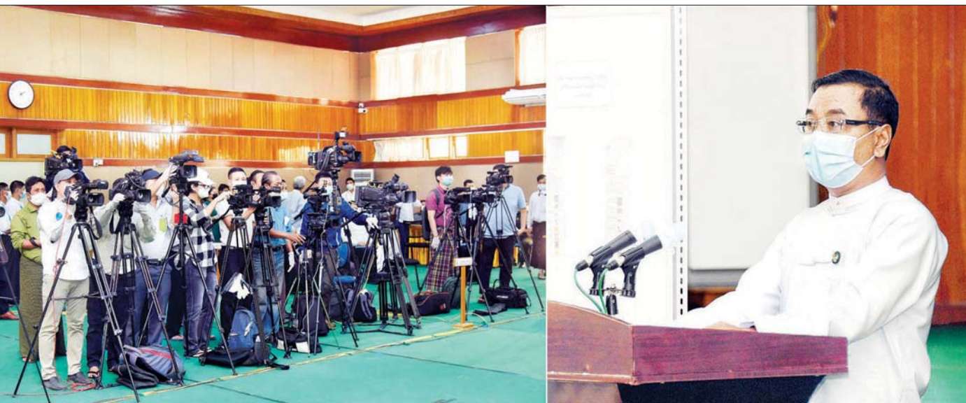
နိုင်ငံတော်စီမံအုပ်ချုပ်ရေးကောင်စီ၊ သတင်းထုတ်ပြန်ရေးအဖွဲ့ခေါင်းဆောင် ဗိုလ်မှူးချုပ် ဇော်မင်းထွန်း သတင်းမီဒီယာများ၏ မေးမြန်းမှုများကို ပြန်လည် ဖြေကြားစဉ်။