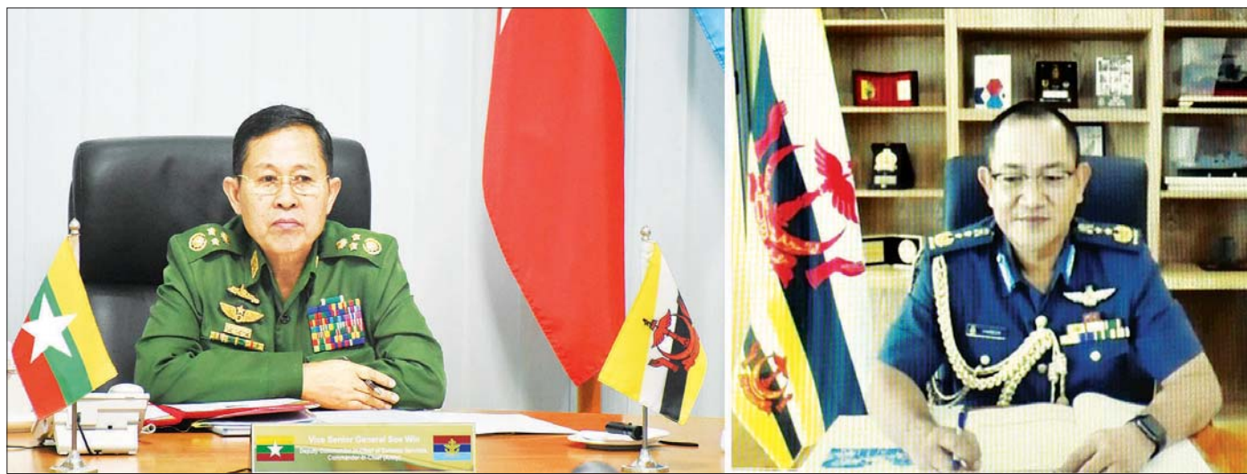
နိုင်ငံတော်စီမံအုပ်ချုပ်ရေးကောင်စီ ဒုတိယဥက္ကဋ္ဌ ဒုတိယတပ်မတော်ကာကွယ်ရေးဦးစီးချုပ် ကာကွယ်ရေးဦးစီးချုပ်(ကြည်း) ဒုတိယဗိုလ်ချုပ်မှူးကြီး စိုးဝင်းနှင့် ဘရူနိုင်း ဘုရင့်တပ်မတော်ကာကွယ်ရေးဦးစီးချုပ် Major General Dato Seri Pahlawan Haji Hamzah bin Haji Sahat တို့ ဗီဒီယိုကွန်ဖရင့်စနစ်ဖြင့် တွေ့ဆုံဆွေးနွေးစဉ်။

“နိုင်ငံတော်စီမံအုပ်ချုပ်ရေးကောင်စီဥက္ကဋ္ဌက ပြည်သူ့ကို ပြောကြားတဲ့ မိန့်ခွန်းမှာ “ကျွန်တော်တို့အနေနဲ့ နိုင်ငံတော်ကို ခေတ္တထိန်းသိမ်းပေးထားတဲ့ကာလအတွင်းမှာ နိုင်ငံခြားရေးမူဝါဒ၊ အုပ်ချုပ်ရေးနဲ့ ပတ်သက်တဲ့မူဝါဒ၊ စီးပွားရေးနဲ့ပတ်သက်တဲ့ မူဝါဒများ လုံးဝပြောင်းလဲသွားမှာ မဟုတ်ပါဘူး။ လက်ရှိသွားနေတဲ့ နိုင်ငံရေးလမ်းစဉ်အတိုင်း ဆက်လက်ဆောင်ရွက်သွားမှာ ဖြစ်ပါတယ်။ ကျွန်တော်တို့နိုင်ငံရဲ့ နိုင်ငံခြားရေးမူဝါဒနဲ့ ဖွဲ့စည်းပုံအခြေခံဥပဒေ (၂၀၀၈ ခုနှစ်) အတိုင်း မပြောင်းလဲဘဲ ဆက်လက်တည်ရှိပါမယ်။ ကမ္ဘာ့နိုင်ငံတိုင်းနဲ့ နိုင်ငံအချင်းချင်း မိတ်ဝတ်မပျက် ပေါင်းဖက်ဆက်ဆံရေးကို ရှေးရှုသွားမှာဖြစ်ပါတယ်” ဟု အလေးအနက် ထည့်သွင်းပြောကြားထားခဲ့”