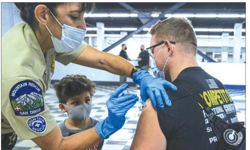
လော့စ်အိန်ဂျလစ်တွင် ကိုဗစ်-၁၉ ကာကွယ်ဆေးထိုးပေးနေသည်ကို တွေ့ရစဉ်။

ဈေးဝယ်စင်တာကြီးများတွင်လည်း ဝင်ဆွဲသည့် ပမာဏ၏ ၅၀ ရာခိုင်နှုန်းကို ခွင့်ပြုပေးမည်ဖြစ်သည်။ ဒေသတွင်းကျောင်းများတွင်လည်း ၇ တန်းမှ ၁၂ တန်းအထိ ကျောင်းသားများအတွက် ကျောင်းပြန် လည်ဖွင့်လှစ်ခွင့်ပေးထားခဲ့သည်။ ကာကွယ်ဆေး နှစ်ကြိမ်တိုင် အပြည့်အဝထိုးပြီးသူများအနေဖြင့် ပါးစပ်၊ နှာခေါင်းစည်းတပ်ဆင်စရာမလိုဘဲ လူအနည်း ငယ်စုဝေးခွင့်ရှိသည်ဟု သိရသည်။ ဆင်ဟွာ