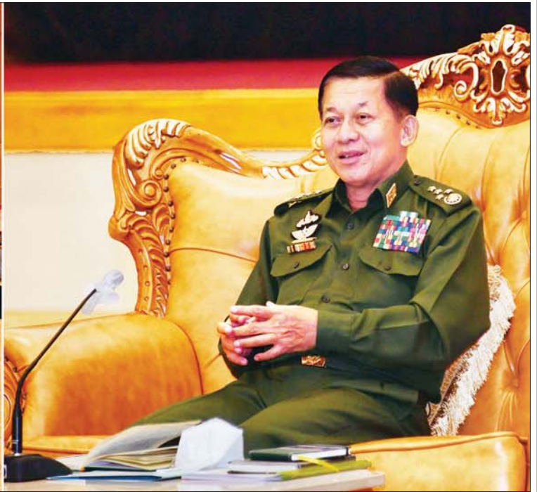
နိုင်ငံတော်စီမံအုပ်ချုပ်ရေးကောင်စီဥက္ကဋ္ဌ တပ်မတော်ကာကွယ်ရေးဦးစီးချုပ် ဗိုလ်ချုပ်မှူးကြီး မင်းအောင်လှိုင် မြန်မာနိုင်ငံကုန်သည်များနှင့် စက်မှုလက်မှုလုပ်ငန်းရှင်များအသင်းချုပ်နှင့် ညီနောင်အသင်းများမှ လုပ်ငန်းရှင်များနှင့်တွေ့ဆုံ၍ နိုင်ငံစီးပွားရေး ပြန်လည်တိုးတက်ကောင်းမွန်ရေးဆိုင်ရာများ ဆွေးနွေးပြောကြားစဉ်။ (၃-၂-၂၀၂၁ ရက်)

ဖေဖော်ဝါရီလ ၂၇ ရက်နေ့ မွန်းလွဲပိုင်းက မလေးရှားနိုင်ငံမှာ ရောက်ရှိနေပြီး နေရပ်ပြန်ဖို့ အခက်အခဲတွေ့နေကြတဲ့ မြန်မာနိုင်ငံသား တစ်ထောင်ကျော်တို့ဟာ တပ်မတော် စစ်ရေယာဉ် (မုတ္တမ)၊ ပင်လယ်သွားဆေးရုံရေယာဉ် (သံလွင်) နဲ့ စစ်ရေယာဉ်(ဆင်ဖြူရှင်)တို့ကို စီးနင်းရင်း ပြန်လည်ရောက်ရှိလာခဲ့တဲ့ မြင်ကွင်းတစ်ခုပဲ ဖြစ်ပါတယ်။