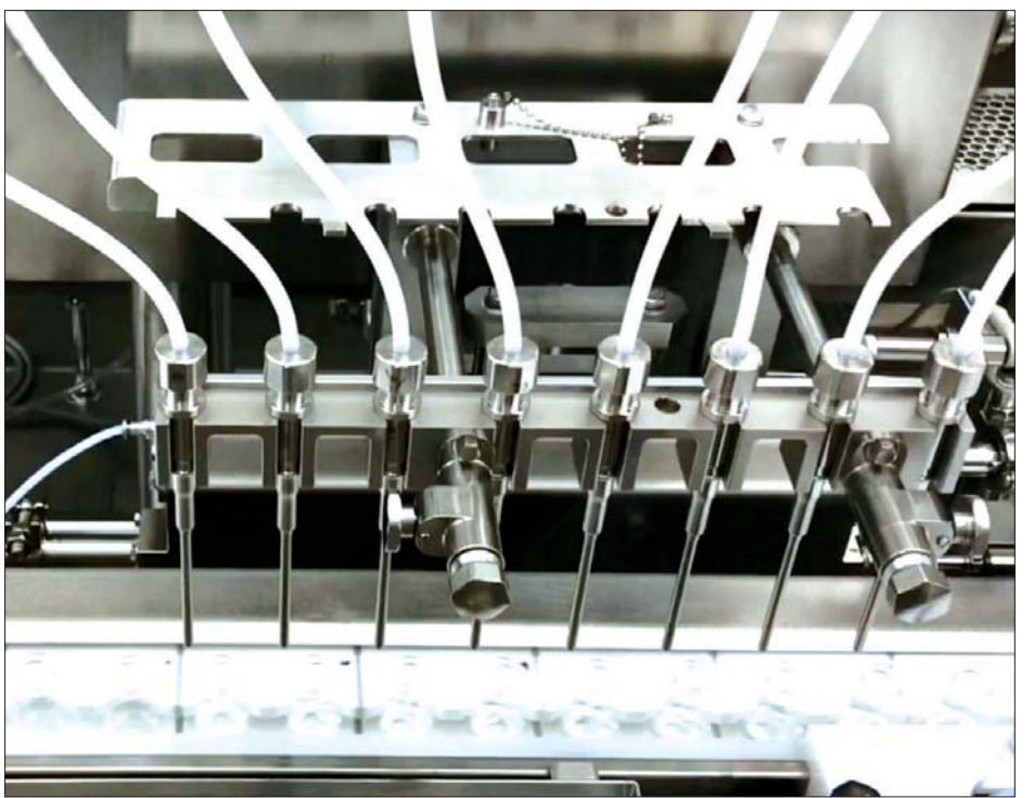
ဒိုင်ချီ ဆန်ကျိုတွင် ကိုဗစ်-၁၉ ကာကွယ်ဆေးထုတ်လုပ်နေသည်ကို တွေ့ရစဉ်။