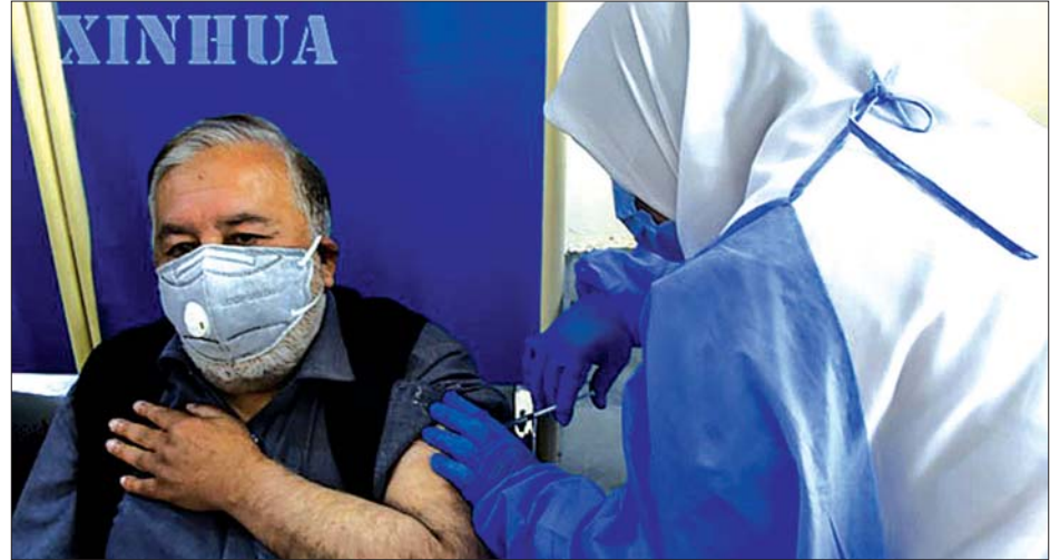
ပါကစ္စတန်တွင် သက်ကြီးရွယ်အိုတစ်ဦးအား ကာကွယ်ဆေး ထိုးနှံပေးနေသည်ကိုတွေ့ရစဉ်။