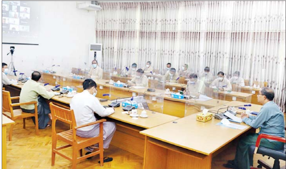
တစ်ကေချင်း၊ တောင်သူတစ်ဦးချင်းစီ၏ ထုတ်လုပ်မှုစွမ်းအား တိုးတက်ရေးအတွက် မြစ်ရေတင်လုပ်ငန်းများက ပံ့ပိုးပေးနိုင်ရေး လုပ်ငန်းညှိနှိုင်းအစည်းအဝေး ကျင်းပစဉ်။

စိုက်ပျိုးရေးနှင့် မွေးမြူရေးကို အခြေခံသည့်