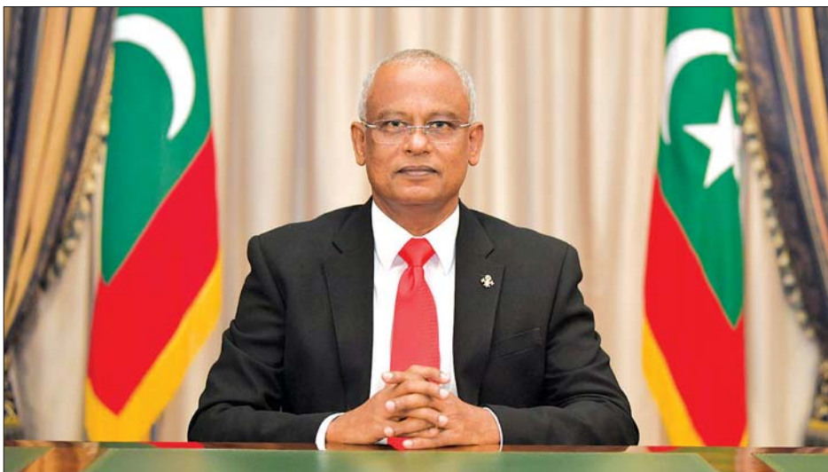
မော်လဒိုက်နိုင်ငံ သမ္မတ အိဘရာဟင်မိုဟာမက် ဆိုလီ။

များအပါအဝင် တစ်ဦးတစ်ယောက်ချင်းစီကို ကာကွယ်ဆေးအခမဲ့ရရှိရေးဖြစ်ကြောင်း သမ္မတက ဆက်လက်ပြောကြားလိုက်သည်။ မော်လဒိုက်အစိုးရသည် တတိယအဆင့် ဆေးရုံ ငါးခုတည်ဆောက်ခြင်းနှင့် အက်ခူနှင့် ကူလ်ဟက် ဟုတ်ဖူရီမြို့များရှိ ဆေးရုံများကို အဆင့်မြှင့်တင် ခြင်းအပါအဝင် ဗဟိုလုပ်ကိုင်ခွင့်ပြုမှုမှတစ်ဆင့် ကျန်းမာရေးကဏ္ဍများတွင် အားနည်းချက်များကို ကိုင်တွယ်ရန် လုပ်ကိုင်လျက်ရှိကြောင်း သမ္မတက အသိပေးပြောကြားသည်။ ထို့အပြင် ကျန်းမာရေးဝန်ထမ်းများနှင့် ရှေ့တန်း မှအလုပ်သမားများကို ကပ်ရောဂါတိုက်ဖျက်ရေးတွင် ၎င်းတို့၏ စုပေါင်းဆောင်ရွက်မှုအတွက် ကျေးဇူး တင်ကြောင်းလည်း သမ္မတက ပြောကြားလိုက် သည်။ ဆင်ဟွာ