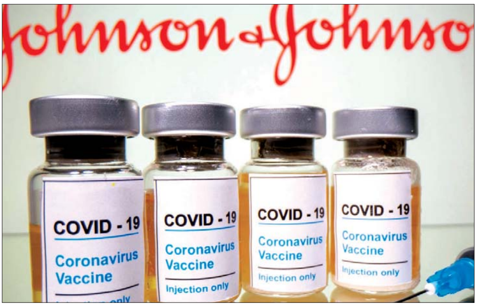
ဂျေအင်န်ဂျေကုမ္ပဏီမှ ကိုဗစ်-၁၉ ကာကွယ်ဆေးကို တွေ့ရစဉ်။