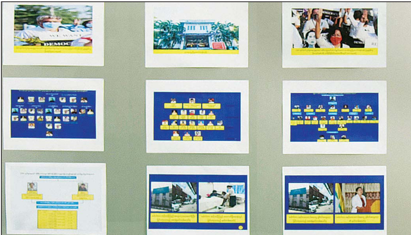
CDM နှင့်ပတ်သက်ပြီး အရေးယူဆောင်ရွက်ချက်များ ပြသထားစဉ်။