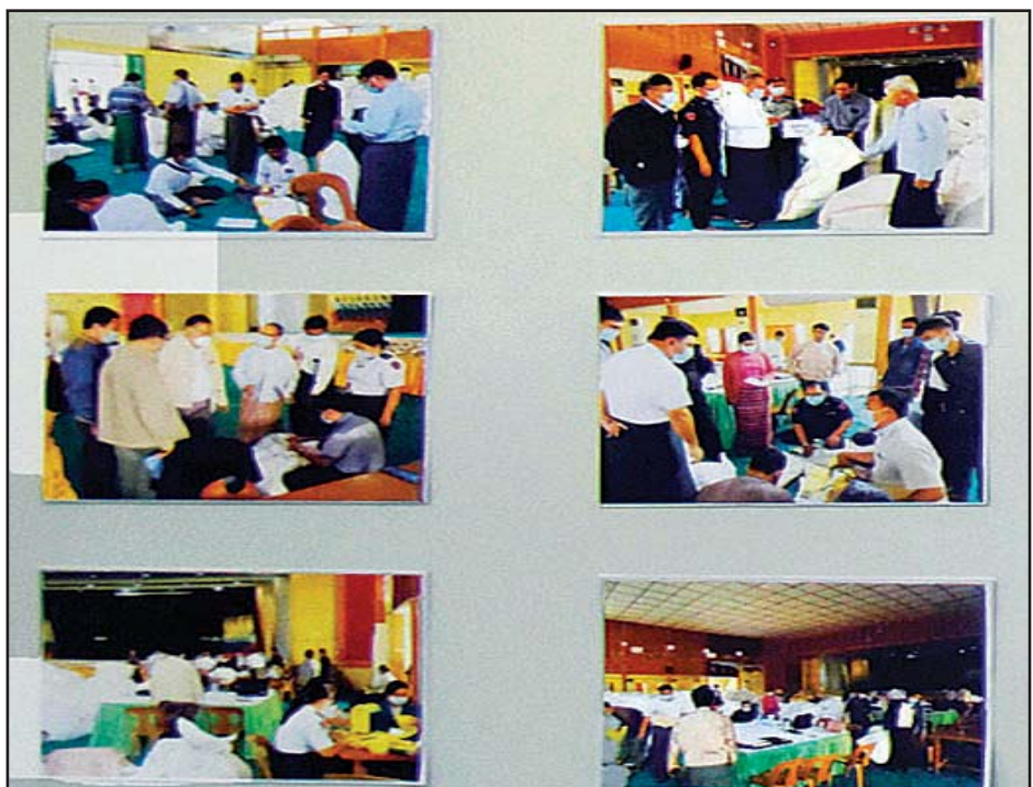
မန္တလေးတိုင်းဒေသကြီးတွင် မဲလက်မှတ်များ မြေပြင်စစ်ဆေးမှု မှတ်တမ်းဓာတ်ပုံများ ပြသထားစဉ်။