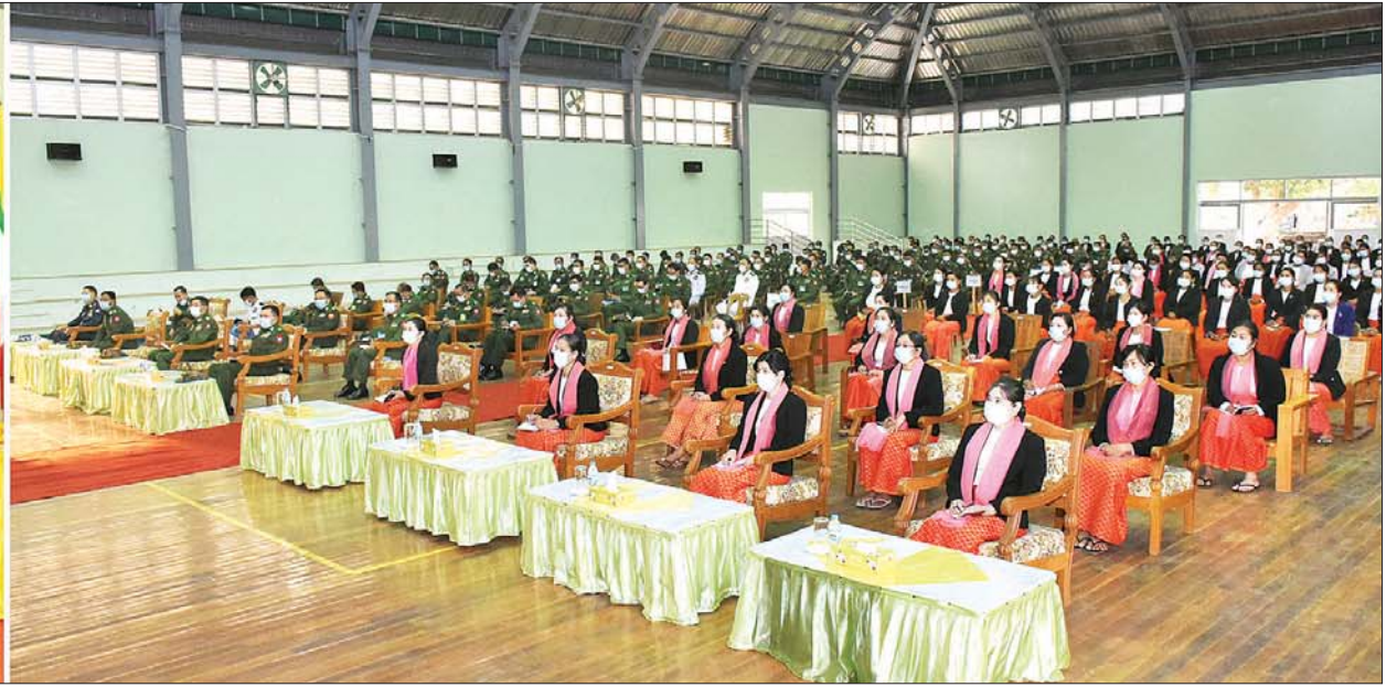
နိုင်ငံတော်စီမံအုပ်ချုပ်ရေးကောင်စီ ဒုတိယဥက္ကဋ္ဌ ဒုတိယတပ်မတော်ကာကွယ်ရေးဦးစီးချုပ် ကာကွယ်ရေးဦးစီးချုပ်(ကြည်း) ဒုတိယဗိုလ်ချုပ်မှူးကြီး စိုးဝင်း ရှမ်းပြည်နယ်(တောင်ပိုင်း) ကလောတပ်နယ်နှင့် အောင်ပန်းတပ်နယ်မှ အရာရှိ/စစ်သည် မိသားစုဝင်များအား တွေ့ဆုံအမှာစကားပြောကြားစဉ်။

နေပြည်တော် မတ် ၁၁ နိုင်ငံတော်စီမံအုပ်ချုပ်ရေးကောင်စီ ဒုတိယဥက္ကဋ္ဌ ဒုတိယတပ်မတော် ကာကွယ်ရေးဦးစီးချုပ် ကာကွယ်ရေးဦးစီးချုပ်(ကြည်း) ဒုတိယဗိုလ်ချုပ်မှူးကြီး စိုးဝင်းသည် ယနေ့ညနေပိုင်းတွင် ရှမ်းပြည်နယ်(တောင်ပိုင်း)၊ ကလောမြို့ရှိ တပ်နယ်ခန်းမ၌ ကလောတပ်နယ်နှင့် အောင်ပန်းတပ်နယ်မှ အရာရှိ/စစ်သည် မိသားစုဝင်များအား တွေ့ဆုံအမှာစကား