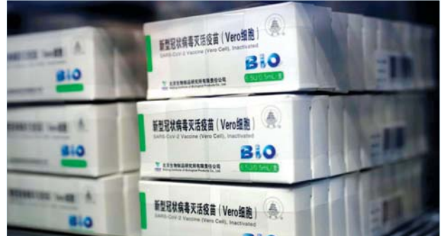
တရုတ်နိုင်ငံ၏ ကာကွယ်ဆေးများကို တွေ့ရစဉ်။

နိုင်ငံတကာငွေကြေးရန်ပုံငွေအဖွဲ့၏ အကူအညီကို ရရှိရန် တရုတ်နိုင်ငံသို့ ပေးရန်ရှိသည့် ကွန်ဂိုနိုင်ငံ၏ ကြေးမြီကို ၂၀၁၉ ခုနှစ်က ပြန်လည်ပြင်ဆင်ခဲ့သည်။ အသက် ၃၆ နှစ်ရှိ သမ္မတ ဒန်းနစ် ဆက်ဆိုဒ်ဆိုသည် မတ် ၂၁ ရက်တွင် ပြန်လည်ရွေးကောက်ပွဲတွင် ပရန်စိတ်အားထက်သန်လျက်ရှိသည်။ ကျန်းမာရေးဝန်ကြီး လိုင်ဒီယာက ကိုဗစ်-၁၉ ကာကွယ်ဆေးများကို လာမည့်ရက်များတွင် စတင်ထိုးပေးနိုင်တော့မည်ဖြစ်ကြောင်းနှင့် အထူးသဖြင့် ကျန်းမာရေးဝန်ထမ်းများ