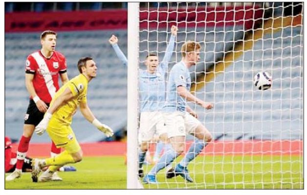
မန်စီးတီးကစားသမားများ ဆောက်သမ်တန်အသင်းဘက်သို့ ဂိုးသွင်းယူရန် ကြိုးပမ်းမှုကို တွေ့ရစဉ်။

ပရီမီယာလိဂ်ပွဲစဉ် (၃၃) ၏ ပွဲကြိုအဖြစ် မန်စီးတီးအသင်းနှင့် ဆောက်သမ်တန်အသင်းတို့ပွဲစဉ်ကို မတ် ၁၁ ရက် နံနက်အစောပိုင်းက မန်စီးတီးအိမ်ကွင်း၌ ယှဉ်ပြိုင်ကစားခဲ့ရာ မန်စီးတီးအသင်းက ငါးဂိုး-နှစ်ဂိုးဖြင့် အနိုင်ရရှိခဲ့သည်။ မန်စီးတီးအသင်းအတွက် ဂိုးများကို ဒီဘရိုင်း၊ မာရက်စ်၊ ဂန်ဒိုဂန်တို့က သွင်းယူပေးနိုင်ခဲ့သည်။ မန်စီးတီးအသင်းသည် ယခုပွဲစဉ်ကို အနိုင်ရရှိမှုကြောင့် ပရီမီယာလိဂ် ၂၉ ပွဲကစားပြီး ၆၈ မှတ်ဖြင့် အမှတ်ပေးဇယားကို ဆက်လက်ဦးဆောင်ထားသည်။ ထို့အပြင် ဒုတိယနေရာမှာ မြို့ခံပြိုင်ဘက် မန်ယူအသင်းကိုလည်း ၁၄ မှတ်အထိ ဖြတ်ထားနိုင်ပြီဖြစ်သည့်အတွက် ချန်ပီယံဖြစ်ခွင့်နှင့် နီးစပ်လာခဲ့ပြီဖြစ်သည်။ မန်စီးတီးအသင်းသည် မတ် ၁၄ ရက်တွင် ပရီမီယာလိဂ်ပြိုင်ပွဲအဖြစ် ဖူလ်ဟမ်အသင်းနှင့် ယှဉ်ပြိုင်ကစားရမည်ဖြစ်ပြီး ဆောက်သမ်တန်အသင်းက ဘရီဂျင်တန်အသင်းနှင့် ယှဉ်ပြိုင်ကစားရမည်ဖြစ်သည်။