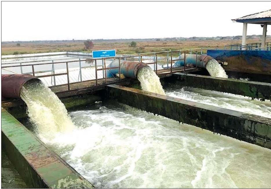
မရှိ ဂျိုးဖြူရေများ ရန်ကုန်မြို့သို့ ရောက်ရှိရန် ဝန်ထမ်းများသည် မိမိတို့တာဝန်ကျရာ နေရာ အသီးသီး၌ အချိန်ပြည့်တာဝန်များ ထမ်းဆောင်ကြရ သည်။

ရေအရင်းအမြစ်များဖြစ်သည့် ရေလှောင်ကန်ကြီး များနှင့် ရေသန့်စင်စက်ရုံများသည် ရန်ကုန်မြို့ပြင် ဝေးရာအရပ်တွင်တည်ရှိသည်။ ဤမြို့ရေပို့ကိုင်လှိုင်း သည် ၄၃ မိုင်ရှည်လျားပြီး ဤမြို့ရေသည် ရန်ကုန် မြို့သို့ရောက်ရှိရန် ၄၃ မိုင်ခရီးကို ဖြတ်သန်းရသည်။ လမ်းခရီးတွင် အနှောင့်အယှက်ကင်းစွာ ရေဆုံးရှုံးမှု