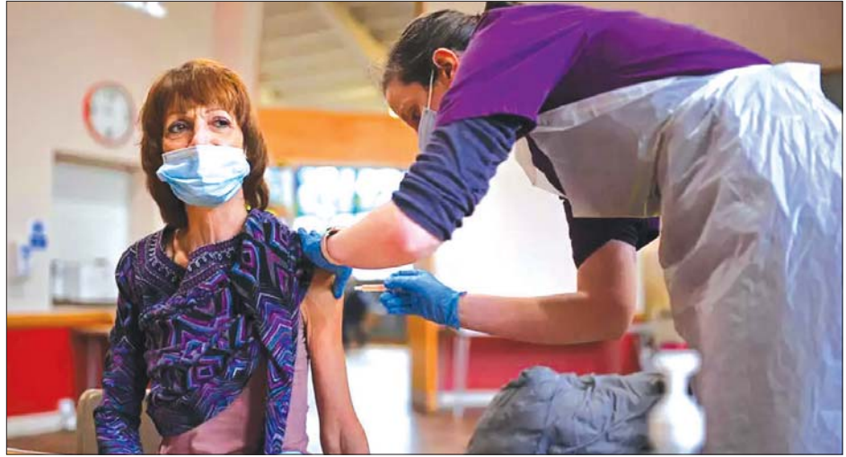
အင်္ဂလန်နိုင်ငံတွင် ကိုဗစ်-၁၉ ကာကွယ်ဆေးထိုးပေးနေသည်ကို တွေ့ရစဉ်။