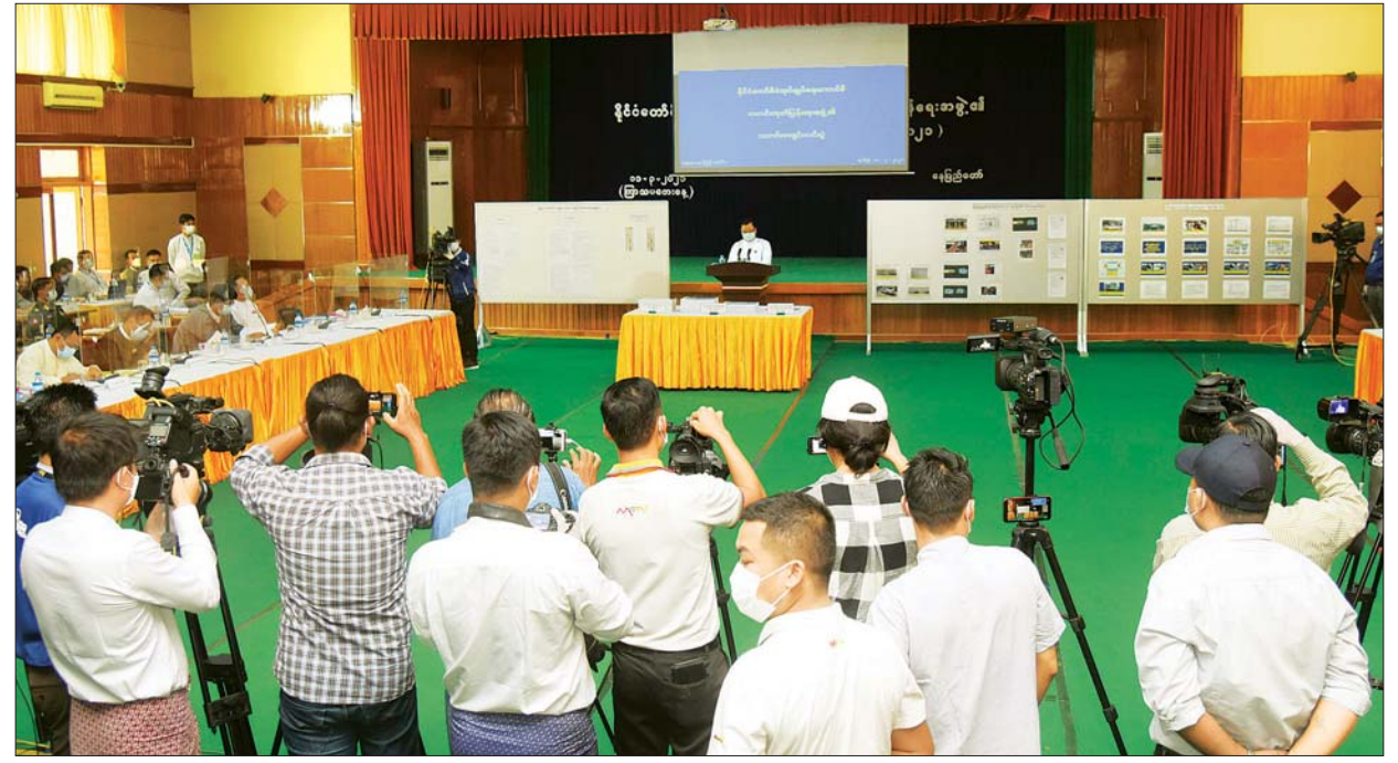
နိုင်ငံတော်စီမံအုပ်ချုပ်ရေးကောင်စီ၊ သတင်းထုတ်ပြန်ရေးအဖွဲ့ ခေါင်းဆောင် ဗိုလ်မှူးချုပ် ဇော်မင်းထွန်း သတင်းမီဒီယာများ၏ မေးမြန်းမှုများကို ပြန်လည်ဖြေကြားစဉ်။ သတင်းစဉ်

နေပြည်တော် မတ် ၁၁ နိုင်ငံတော်စီမံအုပ်ချုပ်ရေးကောင်စီ၊ သတင်းထုတ်ပြန်ရေးအဖွဲ့ ခေါင်းဆောင် ဗိုလ်မှူးချုပ် ဇော်မင်းထွန်းက လက်ရှိနိုင်ငံရေး ဖြစ်ပေါ်ပြောင်းလဲမှုအခြေအနေများနှင့် စပ်လျဉ်း၍ သတင်းစာရှင်းလင်းပွဲကို ယနေ့မုန်းလွဲပိုင်းတွင် ပြန်ကြားရေးဝန်ကြီးဌာန၌ ကျင်းပပြုလုပ်ပြီး သတင်းမီဒီယာများ၏ သိရှိလိုသည့် မေးမြန်းမှုများကို ပြန်လည်ဖြေကြားသည်။ သတင်းစာရှင်းလင်းပွဲမစတင်မီ တက်ရောက်လာကြသူများအား COVID-19 ရောဂါ ကြိုတင်ကာကွယ်ရေးအတွက် တာဝန်ရှိသူများက လိုအပ်သည့် ကျန်းမာရေးဆိုင်ရာများ ဆောင်ရွက်ပေးပြီး သတိမှတ်အကွာအဝေးအတိုင်း နေရာချထားပေးသည်။ ထို့နောက် နိုင်ငံတော်စီမံအုပ်ချုပ်ရေးကောင်စီ၊ သတင်းထုတ်ပြန်ရေးအဖွဲ့ ခေါင်းဆောင် ဗိုလ်မှူးချုပ် ဇော်မင်းထွန်းက ရှင်းလင်းပြောကြားရာတွင် နိုင်ငံတော်စီမံအုပ်ချုပ်ရေးကောင်စီ၏ ဖေဖော်ဝါရီလ တစ်လတာအတွင်း နိုင်ငံတော်အေးချမ်းသာယာရေး၊ တရားဥပဒေစိုးမိုးရေးနှင့် ဖွံ့ဖြိုးတိုးတက်ရေးတို့အတွက် ကဏ္ဍပေါင်းစုံ ဖွံ့ဖြိုးတိုးတက်လာစေရန် ဆောင်ရွက်ချက်များ၊ ငြိမ်းချမ်းစွာဆန္ဒပြမှုအသွင်မှ အကြမ်းဖက် ဆူပူမှုအသွင်(Riot)၊ ၎င်းမှ မင်းမဲ့စရိုက် ဆန်သောလူအုပ်စု (Anarchy Mob) အသွင်သို့ စာမျက်နှာ ၈ ကော်လံ ၁ *