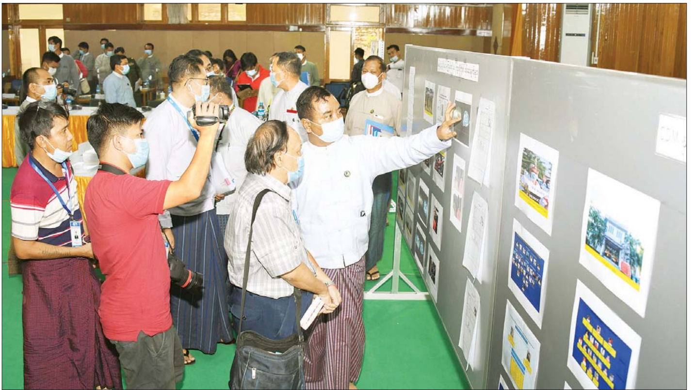
နိုင်ငံတော်စီမံအုပ်ချုပ်ရေးကောင်စီ၊ သတင်းထုတ်ပြန်ရေးအဖွဲ့ခေါင်းဆောင် ဗိုလ်မှူးချုပ် ဇော်မင်းထွန်း သတင်းစာရှင်းလင်းပွဲတွင် ခင်းကျင်းပြသထားသည့် သတင်းစဉ် များကို တက်ရောက်လာကြသူများအား လိုက်လံရှင်းလင်းပြသစဉ်။

CDM လုပ်ဆောင်မှုများကြောင့် ကျန်းမာရေး ကဏ္ဍတွင် ပြည်သူ့လူထု အခက်အခဲ ဖြစ်ခဲ့မှုများနှင့် တပ်မတော်ဆေးရုံများ၊ ပြည်သူ့ဆေးရုံများတွင် တပ်မတော်ဆေးဝန်ထမ်း တပ်ဖွဲ့ဝင်များက ကျန်းမာရေးဆောင်ရွက်ပေးမှု အခြေအနေများ၊ CDM တွင်ပါဝင်လှုပ်ရှားနေသည့် နိုင်ငံဝန်ထမ်းများကို