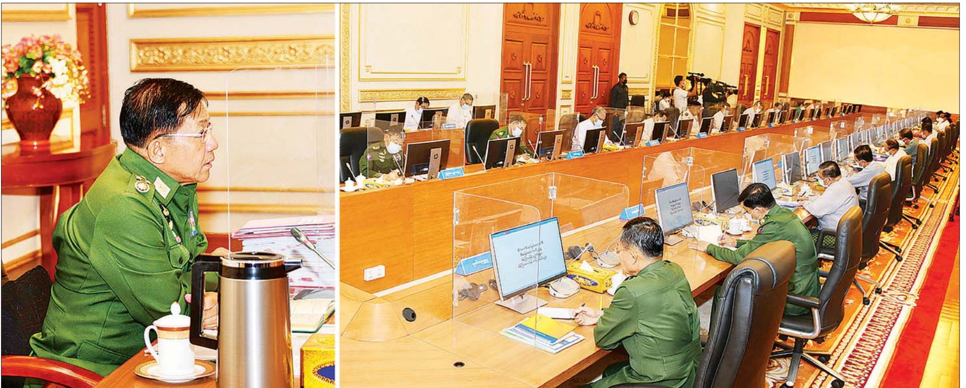
နိုင်ငံတော်စီမံအုပ်ချုပ်ရေးကောင်စီဥက္ကဋ္ဌ၊ တပ်မတော်ကာကွယ်ရေးဦးစီးချုပ် ဗိုလ်ချုပ်မှူးကြီးမင်းအောင်လှိုင် နိုင်ငံတော်စီမံအုပ်ချုပ်ရေးကောင်စီ စီမံခန့်ခွဲရေးကော်မတီအစည်းအဝေး (၃/၂၀၂၁) တွင် အမှာစကားပြောကြားစဉ်။

နေပြည်တော် မတ် ၁၁ နိုင်ငံတော်စီမံအုပ်ချုပ်ရေးကောင်စီ စီမံခန့်ခွဲရေးကော်မတီအစည်းအဝေး (၃/၂၀၂၁) ကို ယနေ့ မွန်းလွဲပိုင်းတွင် နေပြည်တော်ရှိ နိုင်ငံတော်စီမံအုပ်ချုပ်ရေးကောင်စီဥက္ကဋ္ဌရုံး အစည်းအဝေးခန်းမ၌ ကျင်းပရာ နိုင်ငံတော်စီမံအုပ်ချုပ်ရေးကောင်စီဥက္ကဋ္ဌ၊ တပ်မတော်ကာကွယ်ရေးဦးစီးချုပ် ဗိုလ်ချုပ်မှူးကြီးမင်းအောင်လှိုင် တက်ရောက်အမှာစကားပြောကြားသည်။ အစည်းအဝေးသို့ နိုင်ငံတော်စီမံအုပ်ချုပ်ရေးကောင်စီဒုတိယတပ်မတော်ကာကွယ်ရေးဦးစီးချုပ်၊ ကာကွယ်ရေးဦးစီးချုပ် (ကြည်း)၊ ဒုတိယဗိုလ်ချုပ်မှူးကြီးစိုးဝင်း၊ ပြည်ထောင်စုဝန်ကြီးများ ဖြစ်ကြသည့် ဗိုလ်ချုပ်ကြီး မြထွန်းဦး၊ ဒုတိယဗိုလ်ချုပ်ကြီးစိုးထွန်း၊ ဦးဝဏ္ဏမောင်လွင်၊ စာမျက်နှာ ၃ ကော်လံ ၁ ❖