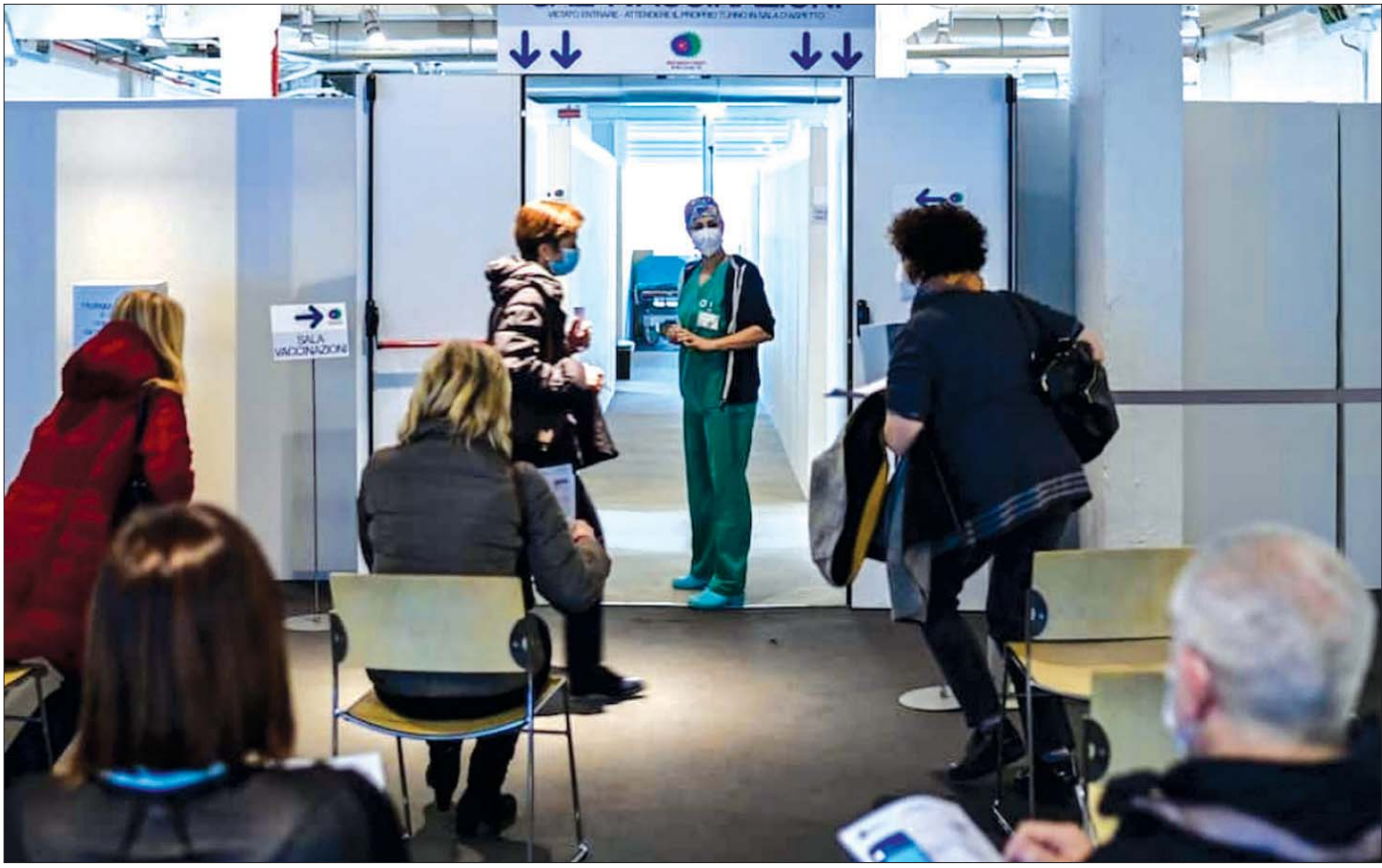
မိလန်မြို့ရှိ ကိုဗစ် -၁၉ ကာကွယ်ဆေးထိုးပေးရာစင်တာတွင် စောင့်ဆိုင်းနေကြသူများကို တွေ့ရစဉ်။

အမေရိကန်နှင့် ဗြိတိန်နိုင်ငံတို့နှင့် ပတ်သက်၍ ဥရောပသမဂ္ဂအဖွဲ့ကြီး၏ ချဉ်းကပ်မှုကို ၎င်းက ဆန့်ကျင်ပြောဆိုခဲ့ပြီး ဥရောပသမဂ္ဂ အဖွဲ့ဝင်နိုင်ငံများအတွင်း ထုတ်လုပ်သည့် ကာကွယ်ဆေးကို တင်ပို့ရာတွင် ကန့်သတ် ပိတ်ဆို့မှုများ သိသိသာသာပြုလုပ်ရန် အချက်ပြခဲ့သည်။ ဗြိတိန်အစိုးရ၏ မတ်လ ၁၀ ရက် ပြောကြားချက်အပေါ်တွင် ၎င်းက ပြင်းပြင်း