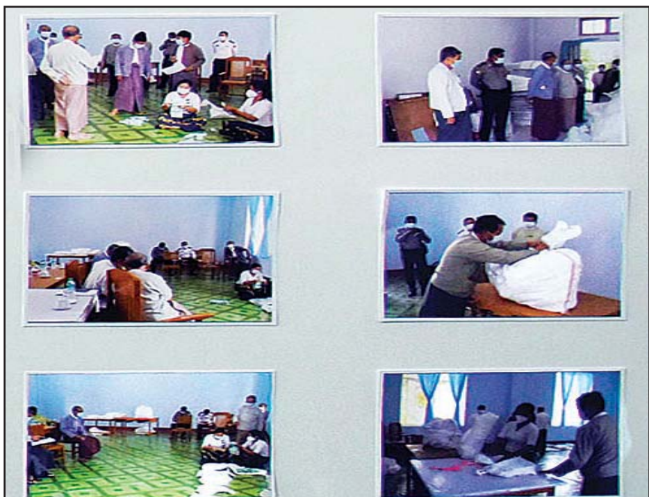
ပြည်ထောင်စုနယ်မြေတွင် မဲလက်မှတ်များ မြေပြင်စစ်ဆေးမှုမှတ်တမ်းဓာတ်ပုံများ ပြသထားစဉ်။