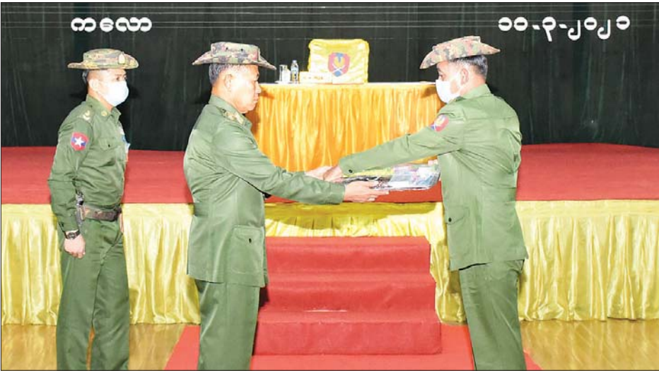
နိုင်ငံတော်စီမံအုပ်ချုပ်ရေးကောင်စီ ဒုတိယဥက္ကဋ္ဌ၊ ဒုတိယတပ်မတော်ကာကွယ်ရေးဦးစီးချုပ်၊ ကာကွယ်ရေးဦးစီးချုပ်(ကြည်း) ဒုတိယဗိုလ်ချုပ်မှူးကြီး စိုးဝင်း လက်ဆောင်ပစ္စည်းပေးအပ်စဉ်။

ရွေးကောက်ပွဲ ဖြီးစီးသည့် နောက်ပိုင်းအခြေအနေများအား လည်းကောင်း၊ မဲပေးခွင့်ရှိသူ ၃၉ ဒသမ ၄ သန်းကျော်အနက် ၁၀ ဒသမ ၄ သန်းအထိ ကြီးမားစွာ မဲစာရင်းမှားယွင်းခြင်း ဖြစ်ပေါ်ခဲ့သည့် အခြေအနေများ၊ နှစ်နာသို့ ပြည်သူများနှင့် ပါတီများမှ ပြည်ထောင်စု ရွေးကောက်ပွဲ ကော်မရှင်ထံသို့ အဆိုပါမဲစာရင်းမှားယွင်းမှုဖြစ်ပေါ်ခဲ့သည့် အခြေအနေများကို ပွင့်လင်းမြင်သာစွာ ရှင်းလင်းပေးရန် အကြိမ်ကြိမ် တောင်းဆိုခဲ့မှု အခြေအနေများ၊ တောင်းဆိုချက်အပေါ် ဦးလှသိန်းဦးဆောင်သည့် ပြည်ထောင်စုရွေးကောက်ပွဲ ကော်မရှင်မှ လျစ်လျူရှုမှု အခြေအနေများ၊ ဒုတိယအကြိမ်လွှတ်တော်အတွင်း မဲစာရင်းမှားယွင်းခြင်း ဖြစ်ပေါ်နေမှုကို ဆွေးနွေးနိုင်ရေး အထူးအစည်းအဝေး တောင်းဆိုမှုကို လည်း ပြည်ထောင်စုလွှတ်တော် နာယကမှ ပယ်ချခဲ့မှု အခြေအနေများ၊ နောက်ဆုံးအဆင့် အမျိုးသား ကာကွယ်ရေးနှင့် လုံခြုံရေးကောင်စီ၌ ရှင်းလင်းဆွေးနွေးခွင့်ပြုရန် ၂ ကြိမ် တိုင်တိုင် တောင်းဆိုမှုကို နိုင်ငံတော်သမ္မတ ဦးဝင်းမြင့်က လုံးဝလက်မခံဘဲ ပယ်ချခဲ့သည့် အပြင် ကိုယ်ရေးစာဖြင့် မဲစာရင်းမှားယွင်းမှုများ စိစစ်ပေးရန်၊ စိစစ်ရာတွင် UEC အသစ်ဖွဲ့စည်း၍ ဆောင်ရွက်ပေးရန် စိစစ်ဆဲကာလအတွင်း လွှတ်တော်အသစ် ခေါ်ယူမှု ဆိုင်းငံ့ပေးရန်၊ နိုင်ငံတော်သမ္မတမှ ယခုတင်ပြချက်အပေါ်အချိန်မီ ဖြေရှင်းပေးနိုင်ရေးတောင်းဆိုခဲ့မှုအပေါ်တွင် လည်း လက်မခံသည့် အခြေအနေ