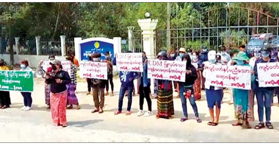
စာသားပါ ဆိုင်းဘုတ်များ၊ ကြွေးကြော်သံများဖြင့် ဆန္ဒထုတ်ဖော်ခဲ့ကြကြောင်း သတင်းရရှိသည်။ သတင်းစဉ်

နေပြည်တော် မတ် ၈ ရှမ်းပြည်နယ် (အရှေ့ပိုင်း)၊ တာချီလိတ်မြို့ ခရိုင် ပြည်သူ့ဆေးရုံမှ ဆရာဝန်၊ သူနာပြုများနှင့် ကျန်းမာရေး ဝန်ထမ်းများသည် ဒေသခံပြည်သူများ၏ ကျန်းမာရေးစောင့်ရှောက်မှု လုပ်ငန်းများကို ဆောင်ရွက်ခြင်းမပြုဘဲ CDM တွင် ပါဝင်ပြီး တာဝန်ပျက်ကွက် လျက်ရှိကြောင်း သိရသည်။ အဆိုပါဖြစ်စဉ်ကြောင့် ဒေသခံပြည်သူလူထု၏ ကျန်းမာရေးလုပ်ငန်းများကို ဆောင်ရွက်ပေးရန် အခက်အခဲများ ဖြစ်ပေါ်နေသည့်အတွက် ဒေသခံ ပြည်သူများက ယနေ့နံနက်ပိုင်းတွင် “တာချီလိတ်မြို့ ပြည်သူ့ဆေးရုံကြီး အမြန်ဖွင့်ပေးရေး၊ ကျင့်ဝတ်နှင့် မညီသော ဆရာဝန်များအလိုမရှိ CDM ပြုလုပ်သော ကျန်းမာရေးဝန်ထမ်းများ အလိုမရှိ” စသည့်