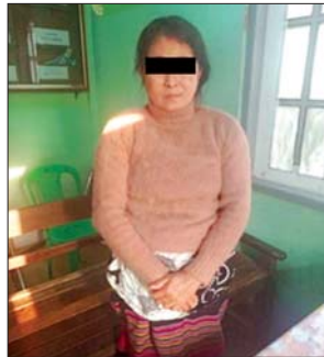
ဒေါ်ရီရီချို