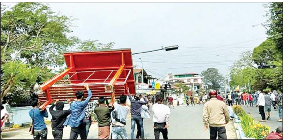
အတားအဆီးများချ၍ လမ်း ကျောက်ခဲများ၊ လေးခွများ၊ တူမီးများဖြင့် ပြန်လည်ပစ်ခတ်ခိုက်ခိုက်ခြင်းများ ဆောင်ရွက်

လုံခြုံရေး တပ်ဖွဲ့ဝင်များသည် မြစ်ကြီးနားမြို့ တပင်ရွှေထီးလမ်းမပေါ်တွင် လုံခြုံရေးဆောင်ရွက်နေစဉ် ယနေ့နံနက်ပိုင်းတွင် အောင်နန်းချပ် ကျောင်းဝင်းအတွင်း၌ ဆူပူဆန္ဒပြလိုသူ အင်အား ၂၅၀ ကျော်ခန့် စတင်စုဝေးကာ တပင်ရွှေထီးလမ်းပေါ်သို့ တက်ရောက်လာသဖြင့် လုံခြုံရေးတပ်ဖွဲ့ဝင်များက လူစုခွဲရန် ဥပဒေလုပ်ထုံး လုပ်နည်းနှင့်အညီ အသိပေးဆောင်ရွက်ခဲ့သော်လည်း ဆူပူသူလူအုပ်စုမှ