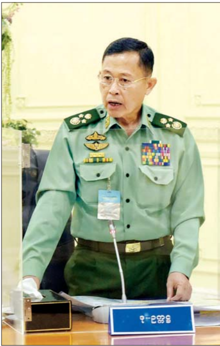
နိုင်ငံတော်စီမံအုပ်ချုပ်ရေးကောင်စီ ဒုတိယဥက္ကဋ္ဌ ဒုတိယဗိုလ်ချုပ်မှူးကြီး စိုးဝင်း ရှင်းလင်းတင်ပြစဉ်။

ယင်းနောက် ကောင်စီဝင်များဖြစ်ကြသည့် နိုင်ငံတော်စီမံအုပ်ချုပ်ရေးကောင်စီ ဒုတိယဥက္ကဋ္ဌ ဒုတိယဗိုလ်ချုပ်မှူးကြီး စိုးဝင်း၊ ဦးသိန်းညွန့်၊ မန်းငြိမ်းမောင်၊ Jeng Phang နော်တောင်၊ ဦးခင်မောင်ဆွေနှင့် ဒေါ်အေးနုစိန်တို့က လူမှုကွန်ရက်စာမျက်နှာများမှ