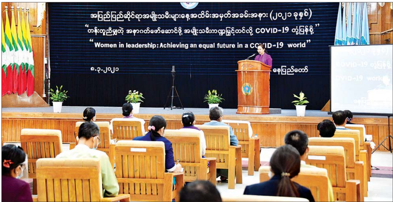
ပြည်ထောင်စုဝန်ကြီး ဒေါက်တာသက်သက်ခိုင် အပြည်ပြည်ဆိုင်ရာအမျိုးသမီးများနေ့ အထိမ်းအမှတ်အခမ်းအနား (၂၀၂၁ ခုနှစ်) တွင် အမှာစကားပြောကြားစဉ်။

အမျိုးသမီးအဖွဲ့အစည်းများအနေဖြင့်လည်း အစိုးရဦးဆောင်သည့် ကော်မတီအတွင်း ပူးပေါင်းဆောင်ရွက်နိုင်မည် ဖြစ်ကြောင်း၊ မြန်မာနိုင်ငံလုံးဆိုင်ရာ အမျိုးသမီးကော်မတီအနေဖြင့် အမျိုးသမီးများ