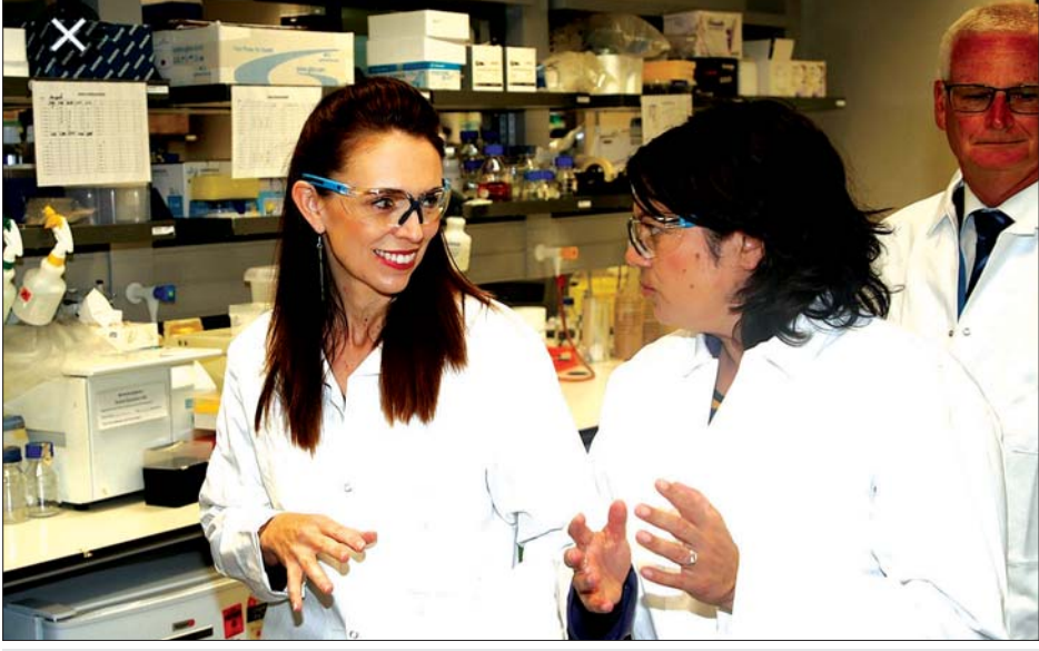
နယူးဇီလန်ဝန်ကြီးချုပ် ဂျက်စင်ဒါအာဒန်ကို တွေ့ရစဉ်။

ဆေး စုစုပေါင်း ၁၀ သန်းသည် ပြည်သူ့ငါးသန်းကို နှစ်ကြိမ်ဆေးထိုးပေးရန် လိုလောက်မှုရှိကြောင်း ၎င်းက ဆက်လက်ပြောကြားသည်။ နယူးဇီလန် အစိုးရသည် ကာကွယ်ဆေး ၁ ဒသမ ၅ သန်း နီးပါး ရရှိရန် ဖိုက်ဇာကုမ္ပဏီနှင့် သဘောတူညီထားရာ လူပေါင်း ၇၅၀၀၀၀ အတွက် လိုလောက်မှုရှိသည်။ ထို့ကြောင့် နယူးဇီလန်နိုင်ငံသားအားလုံး တူညီသည့် ကိုဗစ် -၁၉ ကာကွယ်ဆေးကိုထိုးနှံရန် အခွင့်အရေး ရှိသည်ဟု အာဒန်က ပြောသည်။ လူတစ်ဦးကာကွယ်ဆေးထိုးပြီးတိုင်း ကိုဗစ် -၁၉ ကန့်သတ်ချက်များ ဖြေလျှော့ပေးရန် အချိန်နီးကပ် လေဖြစ်ကြောင်း ဝန်ကြီးချုပ်က ပြောသည်။ ပိုလျှံသည့် ကာကွယ်ဆေးများကိုလည်းပစ်ဖိတ်ဒေသ နှင့်ဖွံ့ဖြိုးဆဲနိုင်ငံများသို့ လှူဒါန်းသွားမည်ဟု ၎င်းက ဆက်လက်ပြောကြားခဲ့သည်။ ဆင်ဟွာ