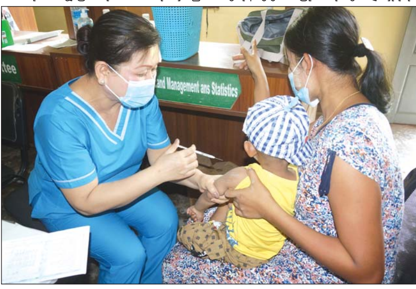
ကလေးငယ်တစ်ဦးအား ကာကွယ်ဆေး ထိုးပေးနေစဉ်။

အသီးသီး၌ အခြေပြု၍ ဆောင်ရွက်ပေးနေပြီး ကိုယ်ဝန်ဆောင်မိခင်များနှင့် အသက် ၂ နှစ်အောက် ကလေးငယ်များအား အဆုတ်ရောဂါကာကွယ်ဆေး၊ ငါးမျိုးစပ်၊ ဆုံဆုံ၊ ကြက်ညှာ၊ အသည်းရောင်အသားဝါ၊ ဦးနှောက် အမြှေးရောင်၊ နမိုးနီးယား ကာကွယ်ဆေးများ၊ ပိုလီယိုသောက်ဆေးနှင့် ထိုးဆေး၊ မေးခိုင်ရောဂါ ကာကွယ်ဆေးနှင့် ဝမ်းရောဂါကာကွယ်ဆေးများကို ထိုးနှံတိုက်ကျွေးခဲ့ကြောင်း သိရသည်။ မောင်တောမြို့နယ်အတွင်း၌ ကာကွယ်ဆေးများ ထိုးနှံတိုက်ကျွေးခြင်းကို ကျန်းမာရေးနှင့် အားကစားဝန်ကြီးဌာန၏ ကိုဗစ်-၁၉ ရောဂါကာကွယ်ရေး ညွှန်ကြားချက်များနှင့်အညီ မတ် ၈ ရက်မှ ၁၆ ရက်အထိ ဆောင်ရွက်ပေးသွားမည်ဖြစ်ပြီး ထိုရက်များအတွင်း ကာကွယ်ဆေး မထိုးနှံလိုက်ရသည့် ကလေးငယ်များကိုလည်း အပတ်စဉ် တနင်္လာနေ့တိုင်းတွင် မြို့နယ် မိခင်နှင့် ကလေးစောင့်ရှောက်ရေး အသင်းအဖွဲ့ရုံး၌ ထိုးနှံပေးမည်ဖြစ်ကြောင်း သိရသည်။ ခရိုင်(ပြန်/ဆက်)