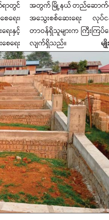
အဆောက်အအုံတည်ဆောက်ရာတွင် လုပ်ငန်းများ အရည်အသွေး ပြည့်မီစေရေး၊ သတ်မှတ်ကာလအတွင်း အချိန်မီပြီးစီးရေးနှင့် လုပ်ငန်းခွင်အတွင်း အန္တရာယ်ကင်းရှင်းစေရေးအတွက် မြို့နယ် တည်ဆောက်ရေးနှင့် အရည်အသွေးစစ်ဆေးရေး လုပ်ငန်းကော်မတီမှ တာဝန်ရှိသူများက ကြီးကြပ်ဆောင်ရွက်ပေးလျက်ရှိသည်။

အဆိုပါ အားကစားရုံတည်ဆောက်ရာတွင် လုပ်ငန်းများ အရည်အသွေး ပြည့်မီစေရေး၊ သတ်မှတ်ကာလအတွင်း အချိန်မီပြီးစီးရေးနှင့် လုပ်ငန်းခွင်အတွင်း အန္တရာယ်ကင်းရှင်းစေရေးအတွက် မြို့နယ် တည်ဆောက်ရေးနှင့် အရည်အသွေးစစ်ဆေးရေး လုပ်ငန်းကော်မတီမှ တာဝန်ရှိသူများက ကြီးကြပ်ဆောင်ရွက်ပေးလျက်ရှိသည်။ မျိုးညွန့်ရွှေ(မိုးနဲ)