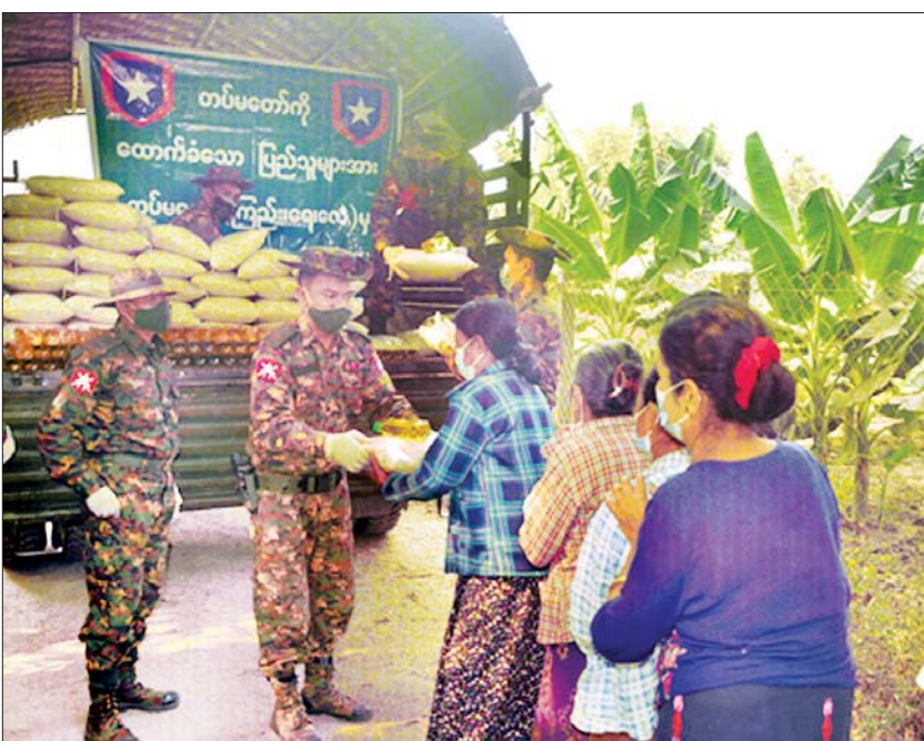
သတင်းစဉ်

နေပြည်တော် မတ် ၈ COVID-19 ရောဂါ ကာကွယ်၊ ထိန်းချုပ်၊ ကုသမှုလုပ်ငန်းများ ဆောင်ရွက်နေစဉ် ကာလအတွင်း သွားလာမှုကန့်သတ်ချက်များကြောင့် ဒေသခံပြည်သူများစားရေးအခင်မြေစေရန်အတွက် နယ်မြေခံတပ်မတော်သားများက ဆန်၊ ဆီနှင့် စားသောက်ဖွယ်ရာများကို အိမ်အရောက် လိုက်လံပေးဝေလှူဒါန်းလျက်ရှိသည်။ ယနေ့တွင် မန္တလေးတိုင်းဒေသကြီး ပုသိမ်ကြီးမြို့နယ် နှမ်းကြေးရွာရှိ အိမ်ထောင်စုများအတွက် ဆန်နှင့် ဆီများကို အလယ်ပိုင်းတိုင်း စစ်ဌာနချုပ်မှ တာဝန်ရှိသူများက ပြည်သူများ၏ လက်ဝယ်အရောက် သွားရောက်ပေးအပ်ခဲ့ကြောင်း သတင်းရရှိသည်။