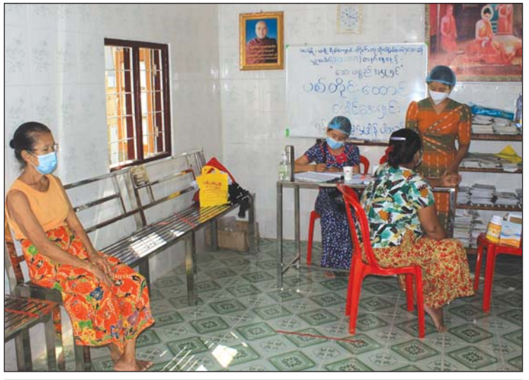
ဆေးခန်းတွင် လာရောက်ပြသ ဆေးကုသနေသည့် ပြည်သူများ။

အခမဲ့ ကုသနိုင်တယ်ဆိုလို့ လာပြတာဖြစ်ပါတယ်"ဟု ဆေးခန်းသို့ လာရောက်ပြသသည့် အဘွားတစ်ဦးက ပြောသည်။ ဒလမြို့နယ်၌ ကိုဗစ်-၁၉ ကပ်ရောဂါကာလအတွင်း ဖျားနာရောဂါများ ကုသသည့် အခမဲ့ဆေးခန်းတစ်ခုကို ဖွင့်လှစ်၍ ပြည်သူများအား ကျန်းမာရေး စောင့်ရှောက်မှုများ ဆောင်ရွက်ပေးခဲ့သော်လည်း လက်ရှိအချိန်တွင် ဖွင့်လှစ်နိုင်ခြင်း မရှိတော့၍ ပြည်သူများအနေဖြင့် အခက်အခဲများ ကြုံတွေ့ရလျက်ရှိသဖြင့် ယခု ပြည်သူ့လူထုအခြေပြု အခမဲ့ဆေးခန်းကို ဖွင့်လှစ်ခြင်းဖြစ်ကြောင်း သိရသည်။ နိုင်လင်းကျော်(ပြန်/ဆက်)