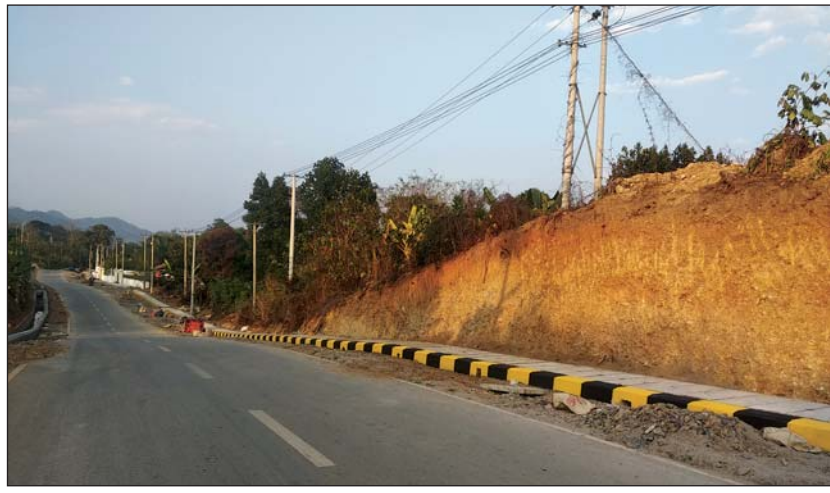
မယ်စွဲမြို့ ဗိုလ်ချုပ်လမ်း၌ ပလက်ဖောင်းတည်ဆောက်ခြင်းလုပ်ငန်း ဆောင်ရွက်နေစဉ်

ပလက်ဖောင်းတည်ဆောက်ခြင်း လုပ်ငန်းကို ကျပ် ၁၂၄ ဒသမ ၄၆ သန်းဖြင့်လည်းကောင်း၊ အမှိုက်ကျင်းဘီးတားတုံး(၂၀x၃၀)ပေ ပြုလုပ် ခြင်း လုပ်ငန်းကို ကျပ် ၉ ဒသမ ၈ သန်းဖြင့် လည်းကောင်း၊ တုန်းကြီးကျောင်းအဝင်တံတား ချဲ့ခြင်း(၁၆x၆x၈)ပေ လုပ်ငန်းကို ကျပ် ၃ ဒသမ ၄၃ သန်းဖြင့်လည်းကောင်း၊ ရုံးခြံစည်းရိုး အရှည် ၁၈၈ ပေ ပြုပြင်ခြင်းလုပ်ငန်းကို ကျပ် ၇ ဒသမ ၈၄ သန်းဖြင့်လည်းကောင်း တာဝန်ယူ ဆောင် ရွက်လျက်ရှိရာ လုပ်ငန်းများ ၉၁ ရာခိုင်နှုန်း ပြီးစီးနေပြီဖြစ်ကြောင်း သိရသည်။ ထို့အပြင် ရေပေးဝေရေး လုပ်ငန်းများကို အောင်မောင်းကုမ္ပဏီက ဆောင်ရွက်လျက်ရှိရာ လုပ်ငန်း ၅၀ ရာခိုင်နှုန်းခန့်၊ အခြား ဒေသဖွံ့ဖြိုး ရေးလုပ်ငန်းများကို သီရိဒေါက်ကုမ္ပဏီက ဆောင် ရွက်လျက်ရှိရာ လုပ်ငန်း ၂၄ ရာခိုင်နှုန်းခန့် ပြီးစီးနေပြီဖြစ်ကြောင်း သိရသည်။ ပန်းခြံလုပ်ငန်းကို ကယားလှကုမ္ပဏီနှင့် လမ်းမီးတပ်ဆင်ခြင်းလုပ်ငန်းများကို Lighting Specialist ကုမ္ပဏီတို့က ဆောင်ရွက်မည် ဖြစ်ပြီး လက်ရှိအချိန်တွင် လုပ်ငန်းဆောင်ရွက် နိုင်ခြင်းမရှိသေးကြောင်း သိရသည်။ ဝတ်ရည်(ပြန်/ဆက်)