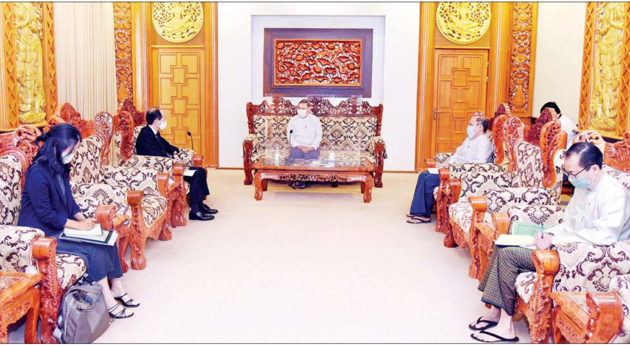
နိုင်ငံခြားရေးဝန်ကြီးဌာန ပြည်ထောင်စုဝန်ကြီး ဦးဝဏ္ဏမောင်လွင် မြန်မာနိုင်ငံဆိုင်ရာ ဂျပန်သံအမတ်ကြီးအား လက်ခံတွေ့ဆုံစဉ်။ သတင်းစဉ်

ထို့ပြင် ပြည်ထောင်စုဝန်ကြီးက မြန်မာနိုင်ငံ၏ လတ်တလော ဖြစ်ပေါ်တိုးတက်မှု အခြေအနေနှင့် စပ်လျဉ်း၍ ၂၀၂၀ ပြည့်နှစ်၊ နိုဝင်ဘာ ၈ ရက်တွင် မြန်မာနိုင်ငံ၌ ကျင်းပခဲ့သည့် အထွေထွေရွေးကောက်ပွဲတွင် မဲသမားမူဖြစ်ပွားခဲ့သည့်အခြေအနေ၊ ပြည်ထောင်စုရွေးကောက်ပွဲ ကော်မရှင်အသစ်မှ မဲစာရင်းများ စိစစ်နေသည့်အခြေအနေ၊ နိုင်ငံတော် စီမံအုပ်ချုပ်ရေးကောင်စီ၏ ရှေ့လုပ်ငန်းစဉ် (၅) ရပ်၊ ပြည်သူများ၏ လုံခြုံရေးအတွက် တရားဥပဒေစိုးမိုးရေးကို သက်ဆိုင်ရာလုံခြုံရေး အဖွဲ့များမှ အင်အားသုံးမှုကို အတတ်နိုင်ဆုံး ထိန်းထိန်းသိမ်းသိမ်းဖြင့် ဆောင်ရွက်နေမှုတို့ကို ရှင်းလင်းအသိပေး ပြောကြားခဲ့သည်။