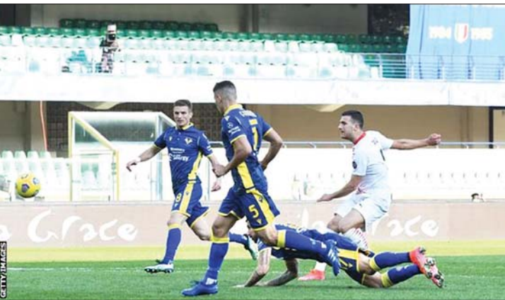
အေစီမီလန်အသင်းမှ ဒါးလော့ ဗီရိုနာအသင်းဘက်သို့ ဂိုးသွင်းယူရန် ကြိုးပမ်းမှုကို တွေ့ရစဉ်။