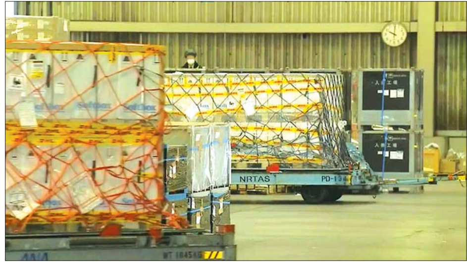
ကာကွယ်ဆေးများ သိုလှောင်ရုံသို့ ရွှေ့ပြောင်းသယ်ယူနေစဉ်။