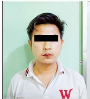
မျိုးမြင့်လှိုင်

ယင်း သတင်းထုတ်ပြန်ချက်အရ မတ် ၃ ရက် နံနက် ၁၀ နာရီခန့်တွင် မုံရွာမြို့ မြဝတီရပ်ကွက်တွင် ဆူပူဆန္ဒပြသူများက လမ်းပိတ်ဆို့၍ အတားအဆီးများ ချထားရန်အတွက် ရပ်ကွက်အတွင်းရှိ အခြေခံပညာမူလတန်းကျောင်း (ဒေါင်းကျောင်း) မှ စာသင်ခန်းများကို ၎င်းတို့သဘောဖြင့် သယ်ထုတ်ကာ လမ်းအား