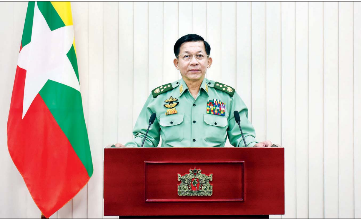
နိုင်ငံတော်စီမံအုပ်ချုပ်ရေးကောင်စီဥက္ကဋ္ဌ တပ်မတော်ကာကွယ်ရေးဦးစီးချုပ် ဗိုလ်ချုပ်မှူးကြီး မင်းအောင်လှိုင် ၂၀၂၁ ခုနှစ်၊ မတ်လ (၈)ရက်နေ့တွင်ကျရောက်သည့် အပြည်ပြည်ဆိုင်ရာအမျိုးသမီးများနေ့ အထိမ်းအမှတ်အခမ်းအနားသို့ ပေးပို့သည့် အမှာစကားပြောကြားစဉ်။

ကျွန်တော်တို့နိုင်ငံမှာ မြန်မာနိုင်ငံလုံးဆိုင်ရာ အမျိုးသမီး ကော်မတီနဲ့ ဒေသဆိုင်ရာကော်မတီအဆင့်ဆင့်ဖွဲ့စည်းပြီး အမျိုးသမီး များရဲ့ အခန်းကဏ္ဍတိုးတက်မြင့်မားရလေအောင် ကြိုးစားအကောင် အထည်ဖော် ဆောင်ရွက်လျက်ရှိပါတယ်။ ဒီလိုလုပ်ဆောင်ရာမှာ အမျိုးသမီးများ ဖွံ့ဖြိုးတိုးတက်ရေးဆိုင်ရာ အမျိုးသားအဆင့် မဟာ