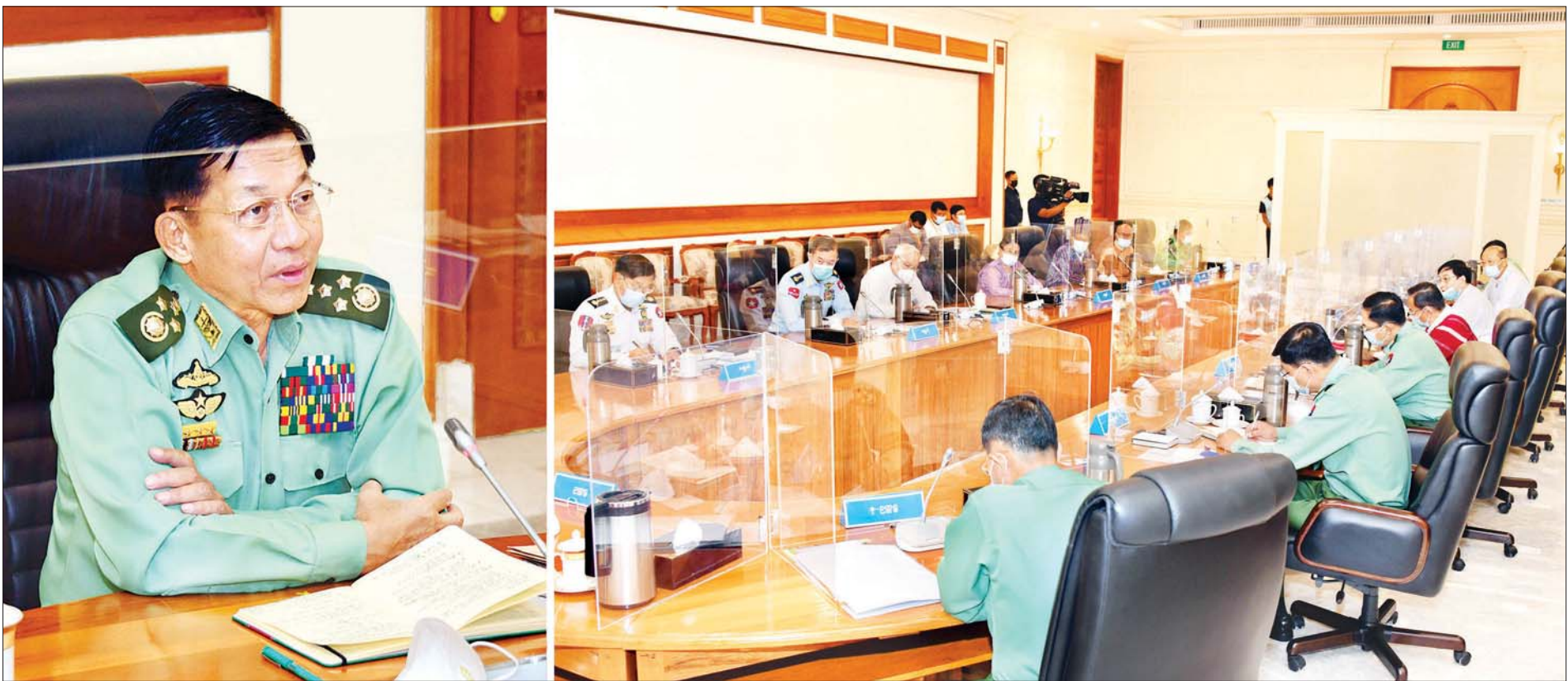
နိုင်ငံတော်စီမံအုပ်ချုပ်ရေးကောင်စီဥက္ကဋ္ဌ၊ တပ်မတော်ကာကွယ်ရေးဦးစီးချုပ် ဗိုလ်ချုပ်မှူးကြီး မင်းအောင်လှိုင် နိုင်ငံတော်စီမံအုပ်ချုပ်ရေးကောင်စီ အစည်းအဝေးတွင် အမှာစကားပြောကြားစဉ်။ သတင်းစဉ်