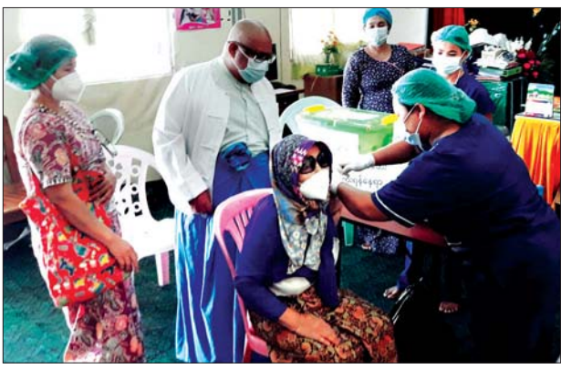
ရန်ကုန်တောင်ပိုင်းခရိုင် ဒလမြို့နယ်တွင် မတ် ၃ ရက်က အသက် ၆၅ နှစ်နှင့်အထက် သက်ကြီးဘိုးဘွားများအား ကိုဗစ်-၁၉ ကာကွယ်ဆေးထိုးနှံပေးစဉ်။ (အသက် ၆၅ နှစ်နှင့်အထက် သက်ကြီးဘိုးဘွားများအား မတ် ၅ ရက်အထိ ကိုဗစ်-၁၉ ကာကွယ်ဆေး ထိုးနှံပေးသွားမည် ဖြစ်ကြောင်း သိရသည်။) မောင်ယဉ်ဦး(ဒလ)