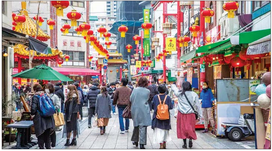
ဂျပန်နိုင်ငံ တိုကျိုမြို့ရှိ လမ်းမတစ်ခုထက်တွင် လူများ သွားလာလှုပ်ရှားနေသည်ကို တွေ့ရစဉ်။

တရုတ်နိုင်ငံသည် လတ်တလောတွင် ဈေးကွက်အခြေအနေအရ ၎င်းတို့၏ ပြည်တွင်းထုတ် လေးခုမြောက် ကိုဗစ်-၁၉ ကာကွယ်ဆေး ကို ခွင့်ပြုချက်ပေးထားကြောင်း သိရသည်။ ဖေဖော်ဝါရီလကုန်ပိုင်း အထိ တရုတ်နိုင်ငံတစ်ဝန်း ကိုဗစ်-၁၉ ကာကွယ်ဆေးအလုံးပေါင်း ၅၂ သန်းကျော် ထိုးနှံပေးထားပြီးဖြစ်ကြောင်းနှင့် တရုတ်နိုင်ငံက နိုင်ငံပေါင်း ၆၉ နိုင်ငံနှင့် နိုင်ငံတကာအဖွဲ့အစည်းနှစ်ခုသို့ ကာကွယ် ဆေးများ ထောက်ပံ့ပေးကြောင်း တရုတ်ပြည်သူ့နိုင်ငံရေး အတိုင်ပင်ခံညီလာခံ၏ (၁၃) ကြိမ်မြောက် အမျိုးသားကော်မတီ စတုတ္ထအစည်းအဝေးမှ ပြောရေးဆိုခွင့်ရှိသူ ဂိုဝေမင်းက မတ်လ ၃ ရက်တွင် ပြုလုပ်သည့် သတင်းစာရှင်းလင်းပွဲတွင် ပြောကြားခဲ့ သည်။ ဆင်ဟွာ