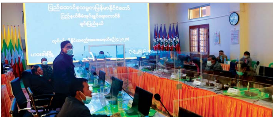
များအပေါ် ပြည်နယ်စီမံ အုပ်ချုပ် မှုးနှင့် အဖွဲ့ဝင်များက ပေါင်းစပ် ကြောင်း သိရသည်။ ရေးကောင်စီ ဥက္ကဋ္ဌ၊ အတွင်းရေး ညှိနှိုင်း ဆောင်ရွက်ပေးခဲ့ ခရိုင် (ပြန်/ဆက်)