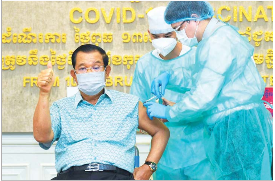
ကမ္ဘောဒီးယားနိုင်ငံ ဝန်ကြီးချုပ် ဆမ်ဒက်ဟွန်ဆန် ကိုဗစ်-၁၉ ကာကွယ်ဆေးထိုးမှု ခံယူနေသည်ကို တွေ့ရစဉ်။