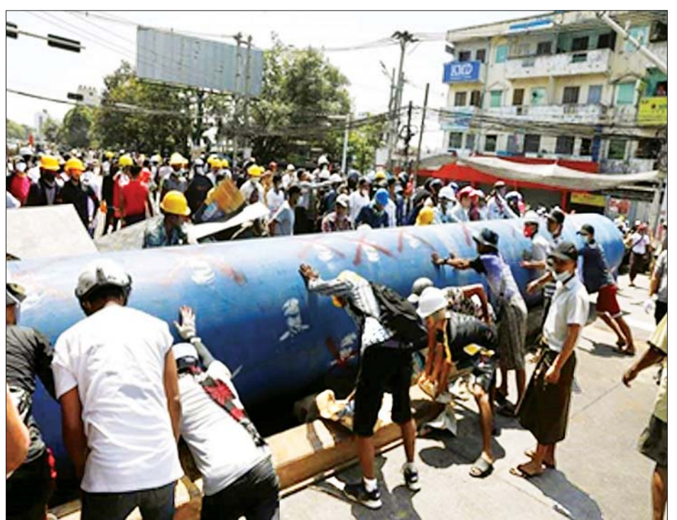
ရန်ကုန်တိုင်းဒေသကြီးအတွင်း လမ်းများပိတ်ဆို့၍ ဆူပူအကြမ်းဖက်ဆန္ဒပြသူများကို တွေ့ရစဉ်။

နိုင်ငံရေးသမားအများစုအနေဖြင့် အန္တရာယ်ကင်းလွတ်သည့် နေရာများတွင် ပုန်းခိုကာ လူငယ်ထုကို လမ်းပေါ်ထွက်စေပြီး လုံခြုံရေးတပ်ဖွဲ့ဝင်များနှင့်