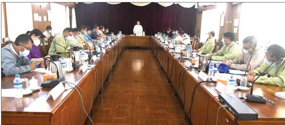
ရန်ကုန်တိုင်းဒေသကြီး လယ်ယာမြေနှင့် အခြားမြေများ သိမ်းဆည်းခြင်းခံရမှုများ ပြန်လည်စိစစ်ရေးကော်မတီနှင့် တိုင်းဒေသကြီး လယ်ယာမြေစီမံခန့်ခွဲမှု အဖွဲ့များ၏ လုပ်ငန်းညှိနှိုင်းအစည်းအဝေး ကျင်းပစဉ်။

ရန်ကုန် မတ် ၄ ရန်ကုန်တိုင်းဒေသကြီး လယ်ယာမြေနှင့် အခြားမြေများ သိမ်းဆည်းခြင်းခံရမှုများ ပြန်လည်စိစစ်ရေးကော်မတီနှင့် တိုင်းဒေသကြီးလယ်ယာမြေစီမံခန့်ခွဲမှုအဖွဲ့များ၏ လုပ်ငန်းညှိနှိုင်းအစည်းအဝေးကို မတ် ၂ ရက်က တိုင်းဒေသကြီးစီမံအုပ်ချုပ်ရေး ကောင်စီ ဥက္ကဋ္ဌရုံး အစည်းအဝေးခန်းမ၌ ပြုလုပ်သည်။(ယာပုံ) ရေးဦးစွာ တိုင်းဒေသကြီး စီမံအုပ်ချုပ်ရေး ကောင်စီဥက္ကဋ္ဌ ဦးလှစိုးက အမှာစကားပြောကြားပြီး တိုင်းဒေသကြီး လယ်ယာမြေစီမံခန့်ခွဲရေးနှင့် စာရင်းအင်းဦးစီးဌာန ဦးစီးမှူး ဦးသိန်းဦးက လျော်ကြေးပေးပြီးဖြစ်သည့် ကိစ္စရပ်များတွင် ယနေ့ ခေတ်အခြေအနေအရ သိမ်းဆည်းစဉ်ကာလ လျော်ကြေးနည်းပါးနေ၍ ထပ်မံတောင်းဆိုလာသည့် ကိစ္စရပ်များ၊ မြေပြင်၌ ကျူးကျော်ဝင်ရောက်နေသူရှိ၍ ဖြေရှင်းရန် ခက်ခဲသည့် ကိစ္စရပ်များ၊ အမှုတွဲအလိုက် အဆင့်ဆင့်သော စိစစ်ရေးအဖွဲ့များက စိစစ်သုံးသပ် ပြီးသည့် လယ်ယာမြေနှင့် အခြားမြေများ သိမ်းဆည်းခြင်းခံရမှု အမှုတွဲများ၊ မြို့ပြတိုးချဲ့ခြင်းနှင့် စက်မှုဇုန်များရှိ မြေယာပြဿနာများ၊ တိုင်းဒေသကြီး လယ်ယာမြေ စီမံခန့်ခွဲမှုအဖွဲ့က ဦးဆောင်၍ လုပ်ကိုင်ခွင့်ရကုမ္ပဏီများနှင့် တောင်သူလယ်သမားများ သုံးပွင့်ဆိုင်ညှိနှိုင်းဆွေးနွေးပြီး နှစ်ဦးနှစ်ဖက် နစ်နာမှုမရှိစေရေးအတွက် ဖြေရှင်းပေးရမည့်ကိစ္စ