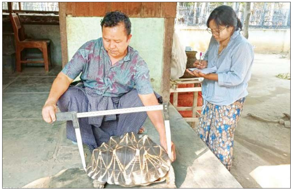
လောကနန္ဒာဘေးမဲ့တောဥယျာဉ်အတွင်းရှိ ကမ္ဘောဇအကြီးဆုံးကြယ်လိပ်ကို တိုင်းတာမှတ်တမ်းတင်စဉ်။