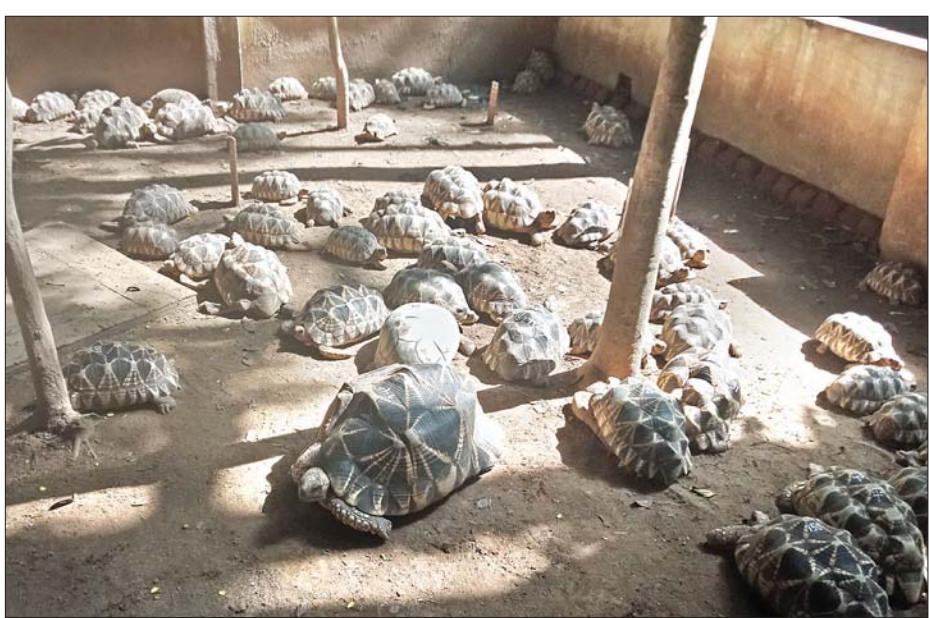
လောကနန္ဒာဘေးမဲ့တောဥယျာဉ်အတွင်း ကမ္ဘာ့အကြီးဆုံးကြယ်လိပ်ကို အခြားကြယ်လိပ်များနှင့်အတူ တွေ့ရစဉ်။