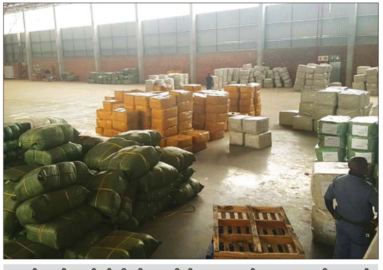
တောင်အာဖရိကတွင် ဖမ်းဆီးရမိသော ကိုဗစ်-၁၉ ကာကွယ်ဆေးအတုများကို တွေ့ရစဉ်။