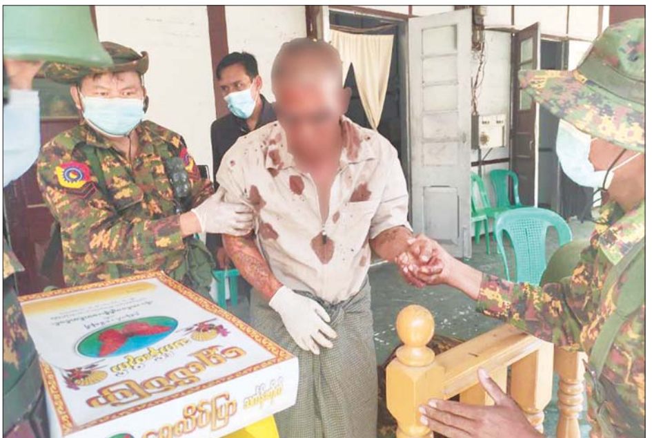
ကား လိုအပ်သော ကျန်းမာရေး ကုသမှုများ ဆောင်ရွက်ပေးလျက် ရှိကြောင်း၊ ဖြစ်စဉ်နှင့် ပတ်သက်၍ သံဃာတော် အစစ်အမှန်အား သာမန်လူကဲ့သို့ သဘောထား ဆောင်ရွက်ခြင်း၊ အရပ်ဝတ်လဲခြင်း များဖြင့် သာသနာတော်အား ထိခိုက်ညှိုးနွမ်းအောင် ပြုမူလုပ်

မော်တော်ယာဉ်ဖြင့် လာရောက် စဉ် ဆူပူဆန္ဒပြသူလူအုပ်စု နောက်သို့ ရောက်ရှိခဲ့ကြောင်း၊ မော်တော်ယာဉ်ကို ဆက်လက် မောင်းနှင်လာစဉ် လူအုပ်စုက မော်တော်ယာဉ်နောက်မှ လိုက်ပါလာပြီး ယာဉ်ပေါ်မှ လူအုပ်စုအတွင်းသို့ သေနတ်ဖြင့် ပစ်ခတ်သွားကြောင်း ကောလာဟလ ထုတ်လွှင့်ကာ မော်တော်ယာဉ်ကို ပိတ်ဆို့ဖမ်းဆီးပြီး ယာဉ်အား ထုခွဲဖျက်ဆီးခြင်း၊ ယာဉ်ပေါ်ပါ သံဃာတော်အား ရိုက်နှက်ခြင်းတို့ ပြုလုပ်ခဲ့ပြီး အထက(၂)အနီးတွင် လူဝတ်လဲကာ ထိန်းသိမ်း၍ ယနေ့ နံနက်တွင် တောရကျောင်းရှေ့သို့ ကားဖြင့် လာရောက်ပို့ဆောင်ခဲ့ကြောင်း သိရသည်။