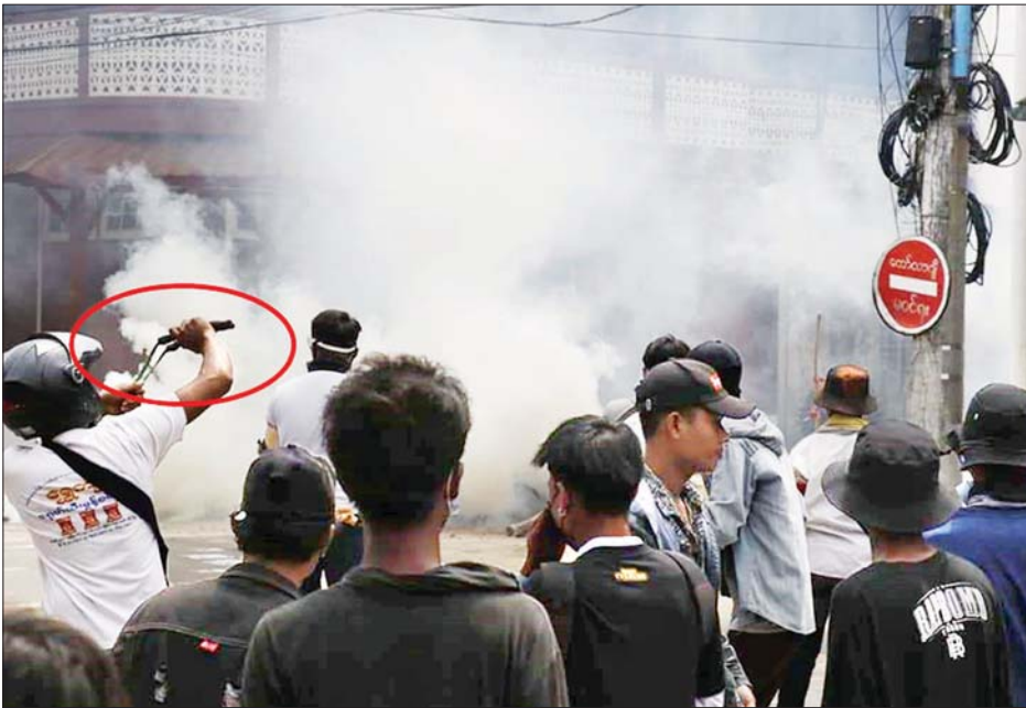
ရန်ကုန်တိုင်းဒေသကြီးအတွင်း ဆူပူအကြမ်းဖက် ဆန္ဒပြသူများကို တွေ့ရစဉ်။