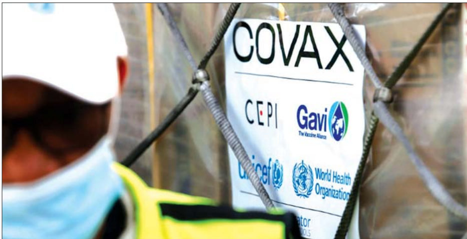
ကိုဗစ်အစီအစဉ်ကပထမဆုံး ပေးပို့လိုက်သော ကိုဗစ်-၁၉ ကာကွယ်ဆေးကို တွေ့ရစဉ်။

ဥရောပရဲ့ ကာကွယ်ဆေးဖြန့်ဝေမှု သို့သော်လည်း အကိတ်ထရပ်ဇီကာကွယ်ဆေးကို ကတိပေးထားတဲ့ ကာကွယ်ဆေး ပမာဏရဲ့ တစ်ဝက်ပဲ ပို့ပေးနိုင်တော့မယ်လို့ ပြောလိုက်တဲ့အခါမှာတော့ ဥရောပရဲ့ ကာကွယ်ဆေးဖြန့်ဝေမှုမှာ ဒုက္ခသုက္ခတွေနဲ့ ရင်ဆိုင်ခဲ့ရပါတယ်။ ဥရောပနိုင်ငံတွေဟာ ကာကွယ်ဆေးဖြန့်ဝေမှု ပြတ်လပ်သွားတဲ့ကိစ္စနဲ့ ပတ်သက်ပြီး အတော်လေး မကျေနပ်ဖြစ်ခဲ့ကြပါတယ်။