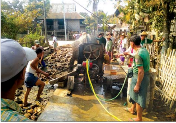
စစ်ကိုင်းတိုင်းဒေသကြီး အင်းတော်မြို့နယ် မော်လူးမြို့ မင်းရာဇာရပ်ကွက် ယုဇနလမ်းနှင့်သစ်ခွလမ်းတို့ကို မတ် ၃ ရက်က ကိုယ့်အားကိုယ်ကိုး ကွန်ကရစ် ခင်းခြင်းလုပ်ငန်း ဆောင်ရွက်စဉ်။ (မော်လူးမြို့ပေါ်ရပ်ကွက် စည်ပင်သာယာနယ်နိမိတ်လမ်းပိုင်းများ ဖွံ့ဖြိုးတိုးတက်ရေးအတွက် ၂၀၂၀-၂၀၂၁ ဘဏ္ဍာနှစ် မော်လူးမြို့ စည်ပင်သာယာရေးအဖွဲ့မှ ဘီလပ်မြေအိတ် ၈၅၀ ပံ့ပိုးကူညီမှုဖြင့် သစ်ခွလမ်း အရှည်၂၂၄ ပေနှင့် ယုဇနလမ်း အရှည်၂၇၄ ပေတို့ကို ဖေဖော်ဝါရီ ၇ ရက်မှစတင်၍ ကိုယ့်အားကိုယ်ကိုး ကွန်ကရစ်ခင်းခြင်း လုပ်ငန်းများ တစ်ပြိုင်တည်းဆောင်ရွက်ခဲ့ရာ မတ် ၃ ရက်တွင် လုပ်ငန်းများအားလုံး ပြီးစီးအောင် ဆောင်ရွက်နိုင်ခဲ့ကြောင်း သိရသည်။)