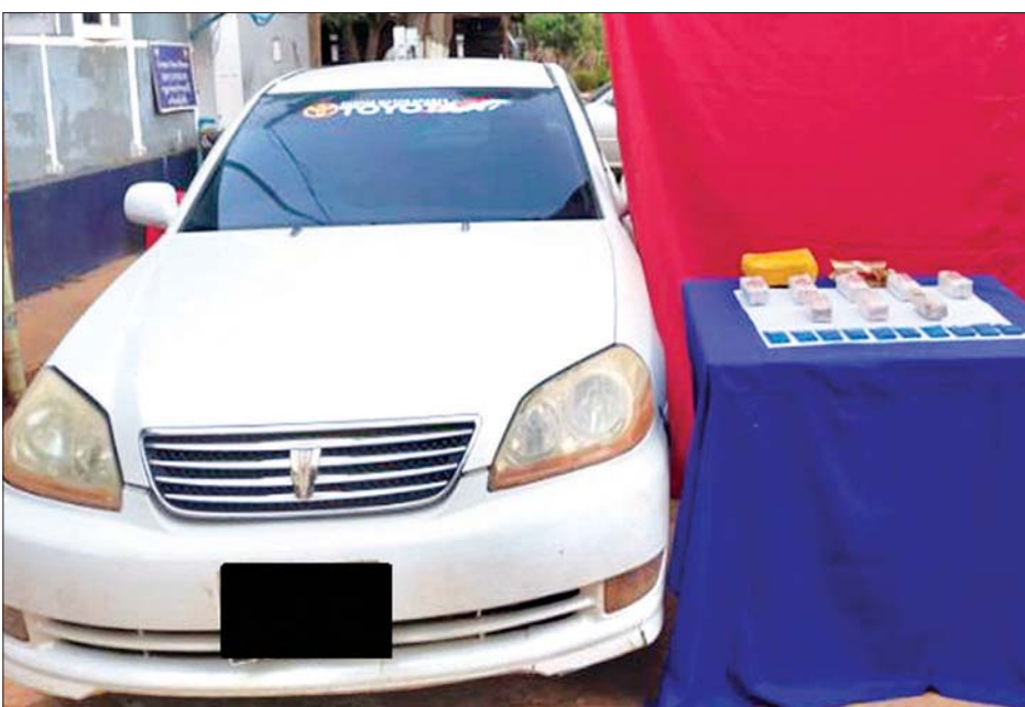
ဆီဆိုင်မြို့နယ်တွင် သိမ်းဆည်းရမိသည့် စိတ်ကြွေးသွပ်ဆေးပြားများနှင့် မော်တော်ယာဉ်အား တွေ့ရစဉ်။

ထိပ်တိုက်တွေ့ဆုံစေကာ အကြမ်းဖက်လုပ်ရပ်များ ပြည်သူလူထုများအနေဖြင့် ထိန်းသိမ်းဆောင်ရွက်ကြ ဖြစ်ပေါ်စေရန် ဆောင်ရွက်နေမှုများအပေါ် မိဘ ရန် အသိပေးထားကြောင်း သိရသည်။ သတင်းစဉ်