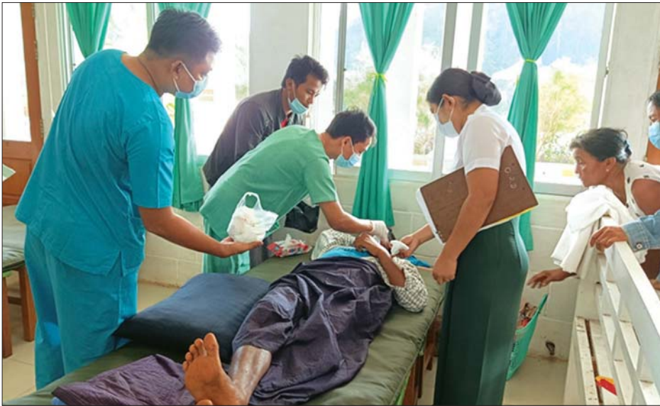
မော်လမြိုင်မြို့နယ် နယ်မြေခံတပ်မတော်ဆေးရုံ၌ ဒေသခံပြည်သူများအား ကျန်းမာရေးဆေးကုသပေးစဉ်။

နေပြည်တော် မတ် ၄ တိုင်းဒေသကြီးနှင့် ပြည်နယ်များရှိ တိုင်းရင်းသား ပြည်သူများ၏ ကျန်းမာရေးဆိုင်ရာ အခက်အခဲများကို တစ်ထောင့်တစ်နေရာမှ အထောက်အကူပြုစေရန်အတွက် မြို့နယ်အသီးသီးရှိ တပ်မတော် ဆေးရုံများနှင့် ယာယီကုသရေးဆေးရုံများတွင် ကျန်းမာရေးစောင့်ရှောက်မှုများကို ဆောင်ရွက်ပေးလျက်ရှိရာ ဖေဖော်ဝါရီ ၅ ရက်မှ ယနေ့အထိ ပြင်ပလူနာ ၄၆၅၈ ဦး၊ အတွင်းလူနာ ၃၆၀၁ ဦးကို တပ်မတော်မှ ပါရဂူများ၊ ဆေးမှူးများ၊ သူနာပြုများဖြင့် ကျန်းမာရေးစစ်ဆေးပေးခြင်း၊ ခွဲစိတ်ရန် လိုအပ်သည့် လူနာများအား ခွဲစိတ်ပေးခြင်း၊ ဆေးရုံတက်ရောက်ကုသရန် လိုအပ်သော လူနာများကို ဆေးရုံတင်ကာ ကျန်းမာရေး စောင့်ရှောက်ပေးခြင်းများ ဆောင်ရွက်ပေးသည့် အပြင် ဆေးရုံတက်လူနာများနှင့် လူနာစောင့်ရှောက်ရေး နေထိုင်စားသောက်ရေး အဆင်ပြေစေရန် အတွက်ကိုပါ စီမံဆောင်ရွက်ပေးသည်။ ထိုသို့ လာရောက်ကုသမှု