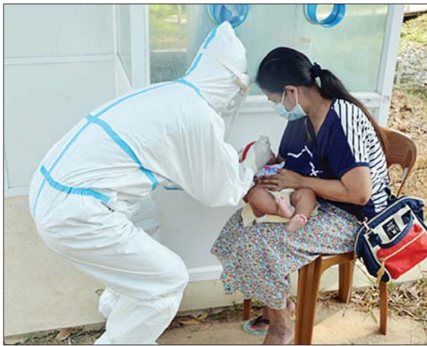
ပို့ဆောင်နိုင်ရေးလိုအပ်သည်များ ဆက်လက်ကူညီဆောင်ရွက်ပေးသွားမည်ဖြစ်ကြောင်း သိရှိရသည်။ သတင်းစဉ်

နိုင်ငံတော်စီမံအုပ်ချုပ်ရေးကောင်စီဥက္ကဋ္ဌ တပ်မတော်ကာကွယ်ရေးဦးစီးချုပ် ဗိုလ်ချုပ်မှူးကြီး မင်းအောင်လှိုင်၏ လမ်းညွှန်မှာကြားချက်အရ မလေးရှားနိုင်ငံမှ ရေကြောင်းခရီးဖြင့် ဖေဖော်ဝါရီ ၂၇ ရက်တွင် ပြန်လည်ရောက်ရှိလာသည့် မြန်မာနိုင်ငံသား ၁၀၈၆ ဦးကို ရန်ကုန်တိုင်းဒေသကြီး လှိုင်မြို့နယ် စစ်ကြောရေးနှင့် တည်းခိုရေးစခန်းရှိ COVID-19 ရောဂါ သီးသန့်စောင့်ကြည့်ရမည့်သူများထားရှိသည့် Quarantine Center တွင်ထားရှိပြီး လိုအပ်သည့် ဆေးဝါးကုသပေးမှုများ ဆောင်ရွက်ပေးလျက်ရှိသည်။ (ယာပုံ)