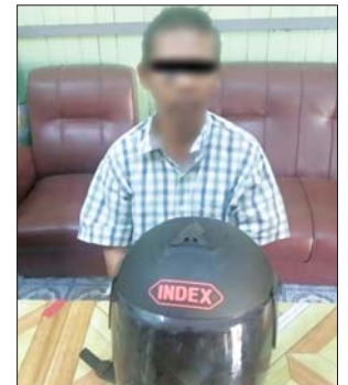
ရိတ်ခြင်းများဖြင့် မျက်နှာကို အဝတ်စည်းလျက် ယာမျက်လုံး အောက် ဖူးယောင်ဒဏ်ရာတို့ဖြင့် ပြန်လည်ရှာဖွေတွေ့ရှိခဲ့ကြောင်း။ ဆန္ဒပြသူ လူအုပ်စုအနေဖြင့် တာဝန် ထမ်းဆောင်နေသော ပြည်သူ့ဝန်ထမ်းကို ဖမ်းဆီးချုပ် နှောင်ခြင်းအတွက် အမှုဖွင့် အရေးယူနိုင်ရေး ဆောင်ရွက် လျက်ရှိကြောင်း ဖော်ပြထား သတင်းစဉ်

ကြောင်း။ ဆူပူဆန္ဒပြသူ လူစုလူဝေးကို လုံခြုံရေး တပ်ဖွဲ့ဝင်များက သွားရောက်၍ လူစုခွဲရန် ဥပဒေနှင့် အညီ အကြိမ်ကြိမ်မေတ္တာရပ်ခံ အသိပေးပြောကြားခဲ့သော်လည်း လိုက်နာမှုမရှိဘဲ ဆက်လက် ဆောင်ရွက်နေသဖြင့် လုံခြုံရေး တပ်ဖွဲ့ဝင်များက အကာအရံ အတားအဆီးများကို ဖယ်ရှား ရှင်းလင်းကာ ဒဿမ ၁၂ ဗို့ ပြောင်းချော သေနတ်ဖြင့် ခြောက်လှန့်ပစ်ခတ်လူစုခွဲခဲ့ရာမှ နံနက် ၉ နာရီ ကျော်ခန့်တွင် လူစုကွဲသွားခဲ့ကြောင်း။ ဖြစ်စဉ် ဖြစ်ပွားနေစဉ် ဆူပူ အော်ဟစ်ဆန္ဒပြသူ လူအုပ်စုနှင့် လုံခြုံရေးတပ်ဖွဲ့ဝင်များ စတင် ထိတွေ့ချိန် အနီး၌ သတင်းရယူ နေသော နယ်မြေခံရဲတပ်ဖွဲ့ဝင်(၁) ဦးကို လူအုပ်စုအတွင်းမှ လူအချို့ က အဓမ္မအင်အားသုံး ဖမ်းဆီးပြီး မျက်နှာကို အဝတ်ဖြင့်စည်း၍ ယာဉ်ပေါ်တွင် ထိန်းသိမ်းခေါ် ဆောင်သွားခဲ့ကြောင်း။ ဖမ်းဆီးခေါ်ဆောင်ခံရသည့် တပ်ဖွဲ့ဝင်ကို ပြန်လည်ခေါ်ဆောင် နိုင်ရေး ရှာဖွေနေစဉ် မွန်းလွဲ ၁၂ နာရီခွဲတွင် ကင်ပွန်းတန်းလမ်းဆုံ ဆောက်လုပ်ရေး ဝင်းထိပ်တွင် ၎င်းတပ်ဖွဲ့ဝင်၏ ဆံပင်အား ကွက်ကျားတုံးခြင်း၊ မျက်ခုံးမွေး