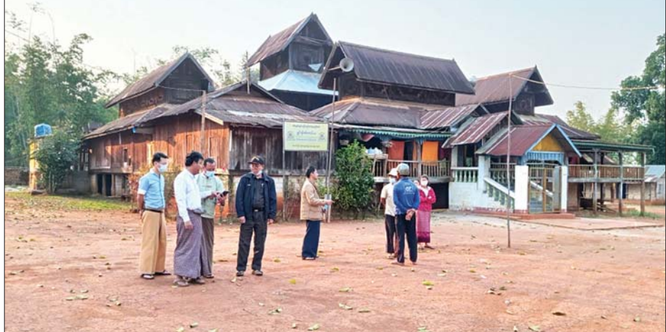
ခရီးစဉ်ဒေသအဖြစ် ဖော်ဆောင်မည့် လွယ်လမ်းကျေးရွာသို့ တာဝန်ရှိသူများ သွားရောက်လေ့လာစဉ်။