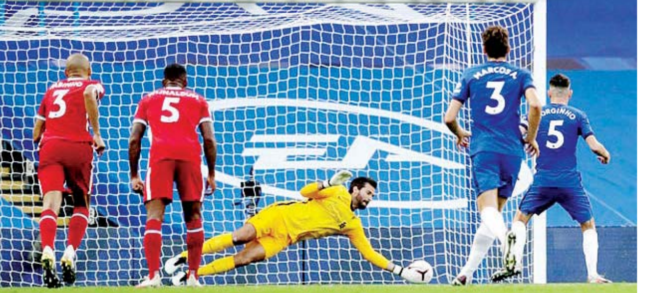
ပထမအကျော့ပွဲစဉ်တွင် ချယ်ဆီးကစားသမားများ၏ ဂိုးသွင်းယူရန် ကြိုးပမ်းမှုကို လီဗာပူး ဂိုးသမား ကာကွယ်နေစဉ်။