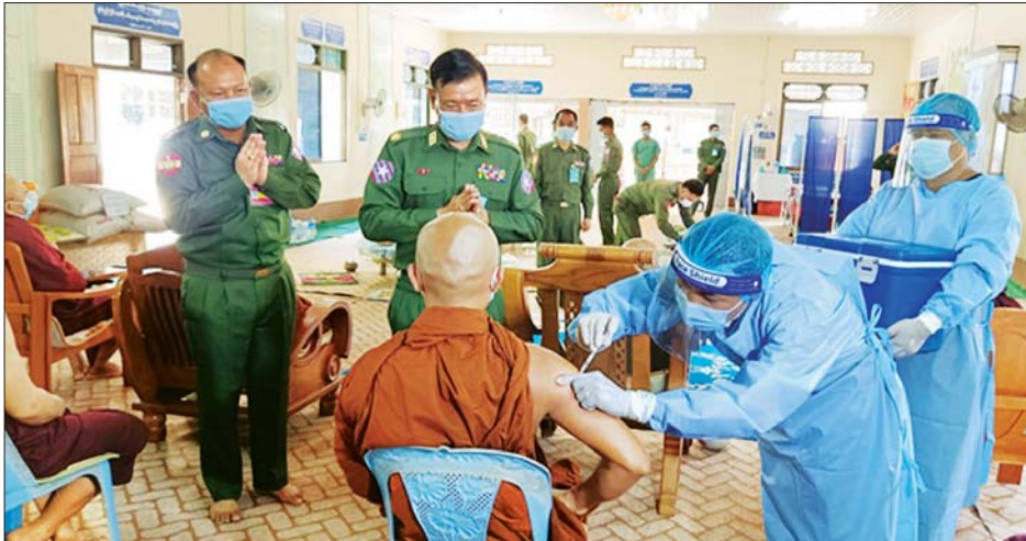
မော်လမြိုင်မြို့ ကော့ခန့်ကျေးရွာ ကော့ခန့်ကျေးကျောင်းတိုက်တွင် ဆရာတော်များအား COVID-19 ကာကွယ်ဆေး ထိုးနှံပေးစဉ်။

ဆောင်ရွက်ပေးနေမှုများကို တိုင်းမှူး ဗိုလ်မှူးချုပ် ကိုကိုမောင်နှင့် အဖွဲ့ဝင်များက သွားရောက်ကြည့်ရှု ဖူးမြော်ကြည့်ကြည့်ပြီး သံဃာတော်များအား နေ့ဆန်းဆက်ကပ်လှူဒါန်းသည်။ အလားတူ စစ်ကိုင်းတိုင်းဒေသကြီး မုံရွာမြို့ တိုင်းဒေသကြီး၊ ပြည်သူ့ကျန်းမာရေးဦးစီးဌာနမှ ဝန်ထမ်းများနှင့် မိသားစုဝင် ၄၃၀ တို့ကို တိုင်းဒေသ ကြီး၊ ပြည်သူ့ကျန်းမာရေးဦးစီးဌာနရုံး အစည်းအဝေး ခန်းမ၌ COVID-19 ရောဂါ ကာကွယ်ဆေးထိုးနှံ နေမှုများကို တိုင်းဒေသကြီး စီမံအုပ်ချုပ်ရေးကောင်စီ ဥက္ကဋ္ဌ ဦးမောင်မောင်လင်းနှင့် တိုင်းမှူး ဗိုလ်မှူးချုပ် ဖြိုးသန့်နှင့် အဖွဲ့ဝင်များက သွားရောက်ကြည့်ရှု အားပေးသည်။ ထို့နောက် တိုင်းဒေသကြီးစီမံအုပ်ချုပ်ရေး ကောင်စီဥက္ကဋ္ဌ၊ တိုင်းမှူးနှင့် အဖွဲ့ဝင်များသည် မုံရွာ မြို့ရှိ ပြည်သူ့ဆေးရုံကြီး (ခုတင်-၅၀၀)၌ ဆေးရုံ တက်ရောက်ကုသလျက်ရှိသည့် လူနာများနှင့်