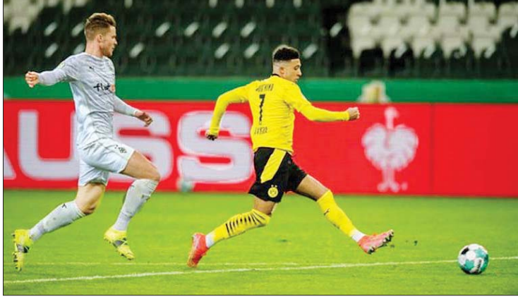
ဂလာဘတ်အသင်းဘက်သို့ ဒေါ့မွန်အသင်းမှ ဆန်ချီ ဂိုးသွင်းယူရန် ကြိုးပမ်းမှုကို တွေ့ရစဉ်။