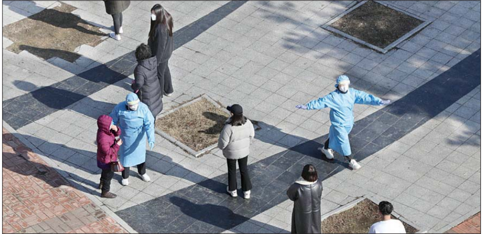
တောင်ကိုရီးယားနိုင်ငံတွင် ကိုဗစ်-၁၉ စစ်ဆေးမှုခံယူရန် သတ်မှတ်စည်းကမ်းများကို လိုက်နာပြီး လူများ စီတန်းနေသည်ကို တွေ့ရစဉ်။

ချိုလီနိုင်ငံတွင် ကိုဗစ်-၁၉ အတည်ပြုဖြစ်ပွား သူပေါင်း ၈၃၅၅၁ ဦးရှိပြီး ကိုဗစ်- ၁၉ ကြောင့် သေဆုံးသူ ၂၀၆၈၄ ဦးရှိလာခဲ့ကြောင်း ကျန်းမာရေး ဝန်ကြီးဌာန သတင်းထုတ်ပြန်ချက်များအရ သိရ သည်။ ဆင်ဟွာ