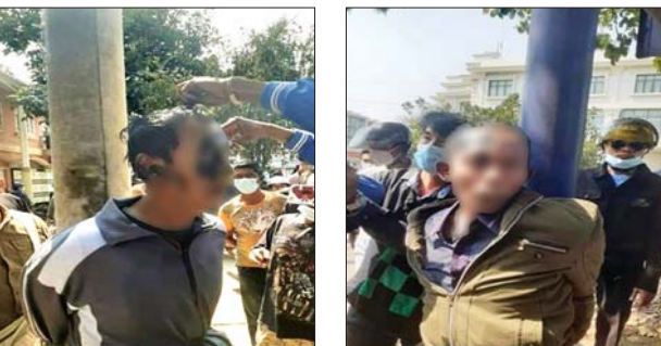
ဆူပူဆန္ဒပြသူများ၏ ဖမ်းဆီးခြင်းခံရသည့် ရဲတပ်ဖွဲ့ဝင်နှစ်ဦး။

ဆန္ဒပြလူစုလူဝေးများအနေဖြင့် နေရာအနှံ့ ပြုမူလုပ်ဆောင်နေမှုများသည် အကြမ်းဖက်ပုံသဏ္ဍာန်သို့ ပြောင်းလဲလုပ်ဆောင်လာနေသည်ကို တွေ့မြင်ရပါသဖြင့် ဆောင်ရွက်နေသည့် ပုံသဏ္ဍာန်အပေါ် မူတည်၍ လုံခြုံရေးတပ်ဖွဲ့ဝင်များအနေဖြင့် အဓိကရုဏ်းဖြိုခွင်းခြင်း လုပ်ငန်းစဉ်များကို ထိရောက်စွာ ဆက်လက်ဆောင်ရွက်လျက် ရှိကြောင်း သိရသည်။ သတင်းစဉ်