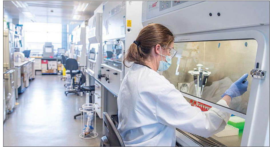
အင်္ဂလန်တွင် ကိုဗစ်-၁၉ ကာကွယ်ဆေးကို ဆေးဝန်ထမ်းတစ်ဦးက စမ်းသပ်နေသည်ကို တွေ့ရစဉ်။

ဗြိတိန်အစိုးရ၏ လေ့လာမှုတစ်ခုတွင် ဖိုက်ဇာနှင့် အက်စ်ထရာဇီကာ ကိုဗစ်-၁၉ ကာကွယ်ဆေးနှစ်မျိုး လုံးသည် အသက် ၈၀ ကျော်အရွယ် သက်ကြီးရွယ်အိုများ၏ ကိုဗစ်-၁၉ ဖြစ်ပွားခြင်းကြောင့် ဆေးရုံ တက်ရောက်ရခြင်းကို ၈၀ ရာခိုင်နှုန်းကျော် ထိရောက်စွာ ကာကွယ်ပေးနိုင်ကြောင်း ဖော်ပြထားသည်။