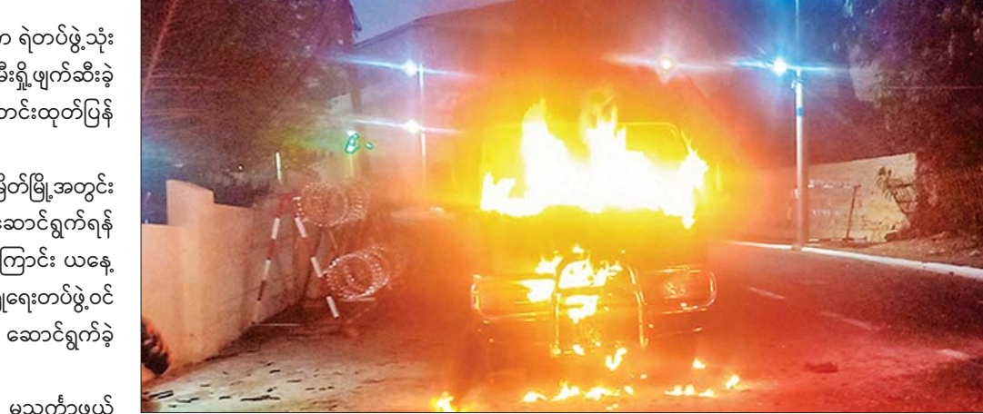
ရဲတပ်ဖွဲ့ပိုင်ယာဉ်အမှတ် (1C/ 2621)၊ Faw ယာဉ်၏ အပစ်ခံရမှုကြောင့် ယာဉ်၏ဦးခေါင်းပိုင်း မီးလောင်မော်တော်ယာဉ်ခေါင်းခန်းအတွင်းသို့ မီးကွင်းများ ကျွမ်းမူဖြစ်ပွားခဲ့ရာ မီးသတ်ယာဉ်(နှစ်စီး)ဖြင့် မီးငြိမ်းပစ်ထည့်ကာ ထွက်ပြေးသွားခဲ့ကြောင်း။ မီးကွင်းများ သတ်ခဲ့ရကြောင်း။ မီးကွင်းပစ်ထွက်ပြေးသူများကို

ထိုသို့ဆောင်ရွက်နေစဉ် မသင်္ကာဖွယ်လူ(နှစ်ဦး) (စိစစ်ဆဲ)သည် မော်တော်ဆိုင်ကယ်ဖြင့် မြိတ်မြို့ ဈေးတန်းရပ်ကွက် ရုံးတောင်လမ်းရှိ မြိတ်ခရိုင်ရဲတပ်ဖွဲ့မှူးရုံးရှေ့တွင် (အရန်) ထားရှိသည့်