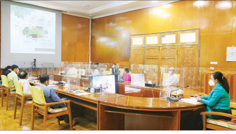
လူမှုဝန်ထမ်း၊ ကယ်ဆယ်ရေးနှင့် ပြန်လည်နေရာချထားရေးဝန်ကြီးဌာန၏ အာဆီယံနှင့် ပူးပေါင်းဆောင်ရွက်မှုများဆိုင်ရာ အစည်းအဝေးကျင်းပစဉ်။

နေပြည်တော် မတ် ၃ လူမှုဝန်ထမ်း၊ ကယ်ဆယ်ရေးနှင့် ပြန်လည်နေရာချထားရေးဝန်ကြီးဌာန၏ အာဆီယံနှင့် ပူးပေါင်းဆောင်ရွက်မှုများဆိုင်ရာ ညှိနှိုင်းဆွေးနွေးပွဲကို ယနေ့ နံနက်ပိုင်းတွင် ယင်းဝန်ကြီးဌာန အစည်းအဝေးခန်းမ၌ ကျင်းပသည်။