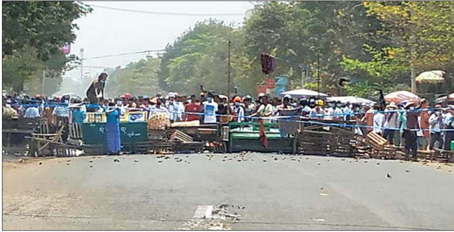
ခွဲကြောင်း။ ပို့ဆောင်ထားရှိကာ သက်ဆိုင်ရာ ဆက်လက်ဆောင်ရွက်သွားမည်ဖြစ်စဉ်တွင် သေဆုံးသူ ရဲစခန်း၌ (သေမှုသေခင်း) ရေးဖွင့် ဖြစ်ကြောင်း သိရသည်။ အမျိုးသား(နှစ်ဦး)အား ဆေးရုံသို့ ပြီး လုပ်ထုံးလုပ်နည်းနှင့် အညီ သတင်းစဉ်

အကြမ်းဖက်ဆန့်ကျင်မှုများသည် အခြေအနေများအရ လုံခြုံရေးတပ်ဖွဲ့ဝင်များအနေဖြင့် မီးခိုးဖုံး၊ ဒဿမ ၁၂ ဗို့ ပြောင်းချောသေနတ်များအသုံးပြုကာ ပစ်ခတ်လူစုခွဲခဲ့ရကြောင်း၊ ပစ်ခတ်စဉ်တွင် လုံခြုံရေးတပ်ဖွဲ့ဝင်များအနေဖြင့် ဆူပူဆန္ဒပြသူ လူစုအုပ်စုအတွင်း နီးကပ်စွာတည်ရှိနေမှုကြောင့် ဆူပူဆန္ဒပြသူ အမျိုးသား (နှစ်ဦး) (စိစစ်ဆဲ) မှာ ရရှိသော ဒဏ်ရာဖြင့် သေဆုံးခဲ့ပြီး လုံခြုံရေးတပ်ဖွဲ့ဝင်(တစ်ဦး)မှာ ဆန္ဒပြသူလူအုပ်စုအတွင်းမှ ပစ်ခတ်သည့် ဂျင်ကလီ ထိမှန်ဒဏ်ရာရရှိ