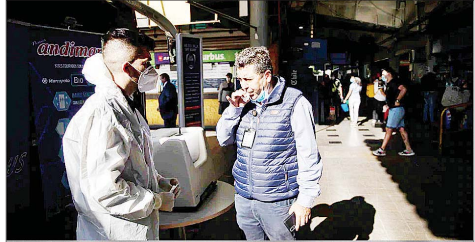
ချိုလီနိုင်ငံ ဆန်တီယာဂိုတွင် အမျိုးသားတစ်ဦး ခရီးဝေးသွားရန် ဘတ်စ်ကားမှတ်တိုင်တွင် ကိုဗစ်-၁၉ အမြန်စစ်ဆေးမှုကို ခံယူနေသည်ကို တွေ့ရစဉ်။

နိုင်ငံအတွင်း ကိုဗစ်-၁၉ စစ်ဆေးမှုပေါင်း ၆ ဒသမ ၇၁ သန်းကျော်ပြုလုပ်ခဲ့သည်။ ၎င်းတို့အနက် ၆၅၅၉၅၂၀ မှာ ကိုဗစ်-၁၉ ကင်းစင်ကြောင်းသိရှိပြီး ၆၅၈၆၇ ဦးကို စမ်းသပ်စစ်ဆေးလျက်ရှိကြောင်း သိရသည်။ ဖေဖော်ဝါရီ ၂၆ ရက်က ကိုဗစ်-၁၉ ကာကွယ်ဆေးအမြောက်အမြား စတင်ထိုးနှံပေးခဲ့ သည့်အချိန်ကတည်းကစကာ နိုင်ငံအတွင်း ကိုဗစ်- ၁၉ ကာကွယ်ဆေးပထမအကြိမ်ထိုးနှံပြီးသူ ၈၇၄၂၈ ဦးအထိ ရှိလာပြီဖြစ်သည်။ ဆင်ဟွာ