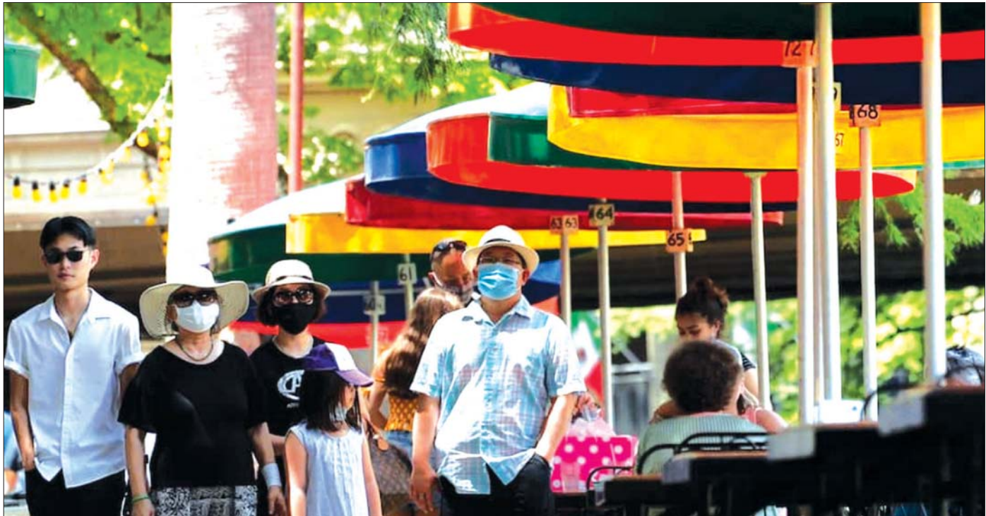
ဇွန်လအတွင်း တက္ကဆက်ပြည်နယ် ဆန်အန်တိုနီယိုမြို့တွင် ပါးစပ်၊ နှာခေါင်းစည်းတပ်၍ သွားလာနေကြသူများကို တွေ့ရစဉ်။

ယခု သီတင်းပတ်အတွင်း အမေရိကန်ပြည်ထောင်စုတွင် ကိုဗစ် -၁၉ ကူးစက်မှုများ ပုံမှန်ကျဆင်းလာပြီး ဒုတိယလူဦးရေအထူထပ်ဆုံးပြည်နယ်ဖြစ်သည့် တက္ကဆက်ပြည်နယ်တွင်မူကား စက်မှုအနည်းငယ် တိုးလာသည်ကို တွေ့ရသည်။ မတ်လ ၂ ရက်တွင် တက္ကဆက်ပြည်နယ်၌ ကိုဗစ် -၁၉ ကြောင့် ဆေးရုံတက်ရောက်ကုသမှုခံယူ နေကြသူ ၆၀၀၀ ကျော်ရှိသည်။ လူပေါင်း ၁၇၀၀ မှာ အထူးကြပ်မတ်ကုသဆောင်တွင် ကုသမှုခံယူနေကြရသည်။ မတ် ၂ ရက်တွင် မစ္စစ္စီပီ အုပ်ချုပ်ရေးမှူး တိပ်ရိုက်က ပြည်နယ်အတွင်း မဖြစ်မနေ ပါးစပ်၊ နှာခေါင်းစည်း တပ်ဆင်ရမည့်အမိန့်ကို ရုပ်သိမ်းပေးခဲ့သည်။ ပြည်နယ်အတွင်း ဆေးရုံတက်ရောက်ကုသမှုခံယူနေရသူအရေအတွက်မှာ ကျဆင်းလာပြီ