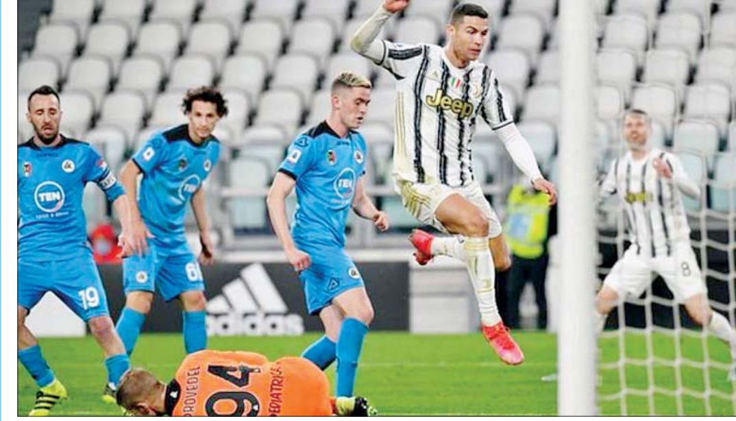
စပီဇီယာအသင်းဘက်သို့ ဂျူဗင်တပ်စ်တိုက်စစ်ကစားသမား စီရော်နယ်ဒို ဂိုးသွင်းယူရန် ကြိုးပမ်းမှုကို တွေ့ရစဉ်။

အင်အားအတောင့်တင်းဆုံးပုံစံကို အသုံးပြုပြီး အနိုင်ရရှိရေးဦးတည်လာခဲ့သည့် အသင်းနှစ်သင်းဖြစ်သောကြောင့် ပထမပိုင်းပွဲချိန်အတွင်း အပြန်အလှန်ထိုးဖောက်မှုများရှိခဲ့သော်လည်း ဂိုးအဖြစ် ပြောင်းလဲခြင်းမရှိခဲ့ပေ။ ဂျူဗင်တပ်စ် အသင်းအတွက် ဦးဆောင်ဂိုးကို ဒုတိယပိုင်းပွဲချိန် ၆၂ မိနစ်တွင် ဘာနာဒက်ချီ၏ ဖန်တီးပေးမှုမှတစ်ဆင့် မိုရာတာက သွင်း ယူပေးနိုင်ခဲ့သည်။ ဒုတိယပိုင်းကို ၇၁ မိနစ်တွင် ချီယေဆာက သွင်းယူပေးနိုင်ခဲ့သည်။ ဂျူဗင်တပ်စ်အသင်းအတွက် တတိယ မြောက်ဂိုးကို ဒုတိယပိုင်းပွဲချိန်ပြီးဆုံးခါနီးတွင် စီရော်နယ်ဒိုက သွင်းယူပေးနိုင်ခဲ့သည်။ ၎င်းသည် ယခုပွဲစဉ်တွင် တစ်ဂိုး သွင်းယူနိုင်ခဲ့သောကြောင့် ယခုနှစ်ရာသီစီးရီးအေတွင် သွင်းဂိုး ၂၀ အထိ ရှိလာပြီဖြစ်သည်။ ထို့အပြင် စီရော်နယ်ဒိုသည် ဥရောပထိပ်တန်းလိဂ်ငါးခု၌ ၁၂ ရာသီတွင် ဂိုး ၂၀ နှင့်အထက် သွင်းယူနိုင်သည့် ကစားသမားတစ်ဦးအဖြစ်လည်း မှတ်တမ်းဝင်ခဲ့သည်။