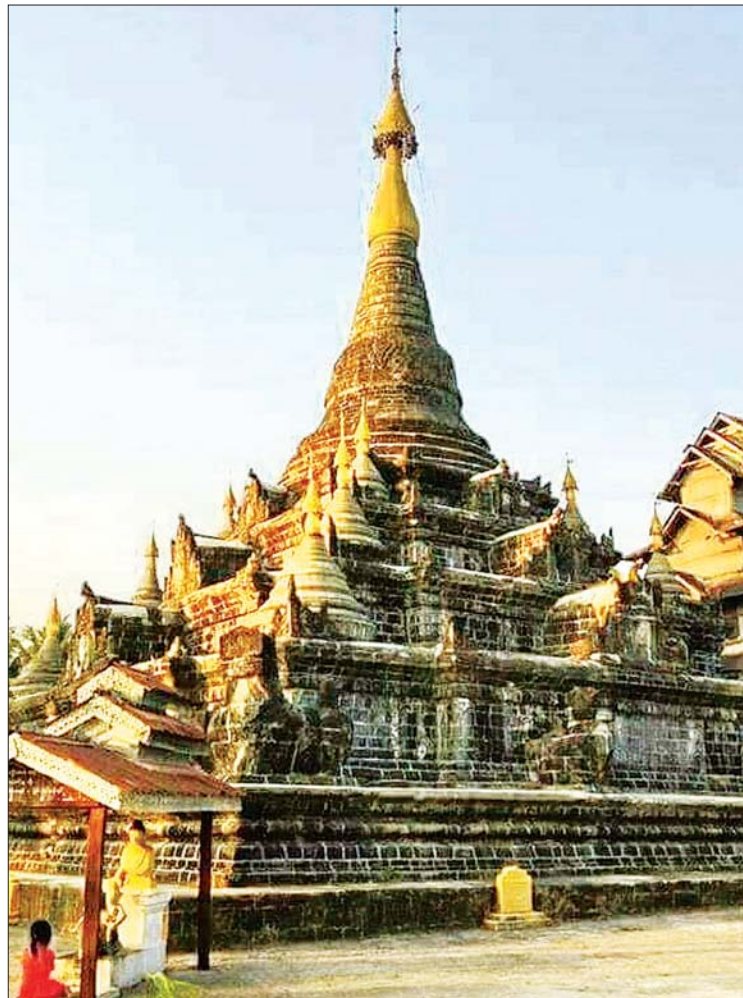
လောကမာရ်အောင်စေတီအား ဖူးတွေ့ရစဉ်။

မြောက်ဦးမြို့ရှိ ဘုရားစေတီများသည် အများအားဖြင့် ကျောက်ဆစ်ပိသုကာ လက်ရာများဖြစ်နေ၍ သကျမာရ်အောင် ဘုရားစေတီ ကျောက်ဆစ်လက်ရာ ဖြစ်နေ သည်။ ဤစေတီတော်ကြီးအား ဖူးမြော် မြင်ရခြင်းဖြင့် ရှေးရခိုင်တို့၏ ကျောက်ဆစ်ပိ