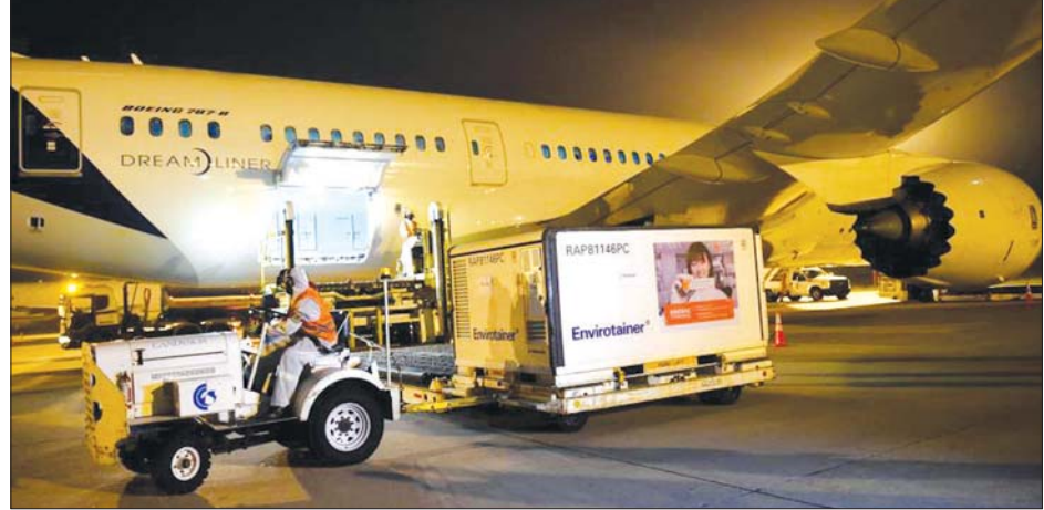
တရုတ်နိုင်ငံမှ ပေးပို့သည့်ကာကွယ်ဆေးများ ဥရုဂွေးနိုင်ငံသို့ ရောက်ရှိလာသည်ကို တွေ့ရစဉ်။