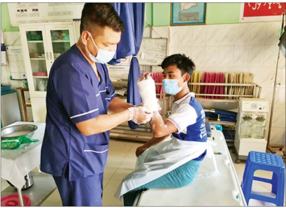
သာစည်မြို့နယ် ဆေးရုံ၌ ဒေသခံပြည်သူတစ်ဦး တက်ရောက်ဆေးကုသမှုခံယူနေစဉ်။

ယနေ့တွင် ခွဲစိတ်ကုသမှုဆိုင်ရာ ရောဂါ၊ သွားနှင့် ခံတွင်းရောဂါ၊ အရိုးအကြောရောဂါ၊ အစာအိမ်ရောဂါ၊ မျက်စိရောဂါ၊ နား၊ နှာခေါင်း၊ လည်ချောင်းရောဂါ၊ သားဖွားမီးယပ်ရောဂါ၊ သွေးတိုးရောဂါ၊ နှလုံးရောဂါ၊ အထွေထွေရောဂါတို့နှင့် ပတ်သက်၍ လိုအပ်သည့် ကျန်းမာရေးစစ်ဆေးကုသပေးခြင်းများ ဆက်လက် ဆောင်ရွက်ပေးပြီး ခွဲစိတ်ကုသရန် လိုအပ်သော လူနာများအား ခွဲစိတ်ကုသပေးခြင်းများ ဆောင်ရွက်ပေးခဲ့ကြောင်းနှင့် ဒေသခံပြည်သူများအနေဖြင့်လည်း အထူးပင်ကျေးဇူးတင် ဝမ်းမြောက်လျက်ရှိကြောင်း သိရသည်။ ထိုသို့ ဆောင်ရွက်ပေးနေမှုများကို တိုင်းစစ်ဌာနချုပ်အသီးသီးရှိ တာဝန်ရှိသူများက သွားရောက်ကြည့်ရှု၍ ဒေသခံပြည်သူများအား ဆေးကုသပေးထားမှုအခြေအနေများ၊ ကျန်းမာရေးတိုးတက်ကောင်းမွန်မှု အခြေအနေများကို ရင်းရင်းနှီးနှီး မေးမြန်းအားပေးစကား ပြောကြားပြီး စားသောက်ဖွယ်ရာများပေးအပ်ကာ ဆေးရုံများအတွင်း လိုက်လံကြည့်ရှုပြီး လိုအပ်သည်များ ညှိနှိုင်းဖြည့်ဆည်းဆောင်ရွက်ပေးခဲ့ကြောင်း သတင်းရရှိသည်။ သတင်းစဉ်