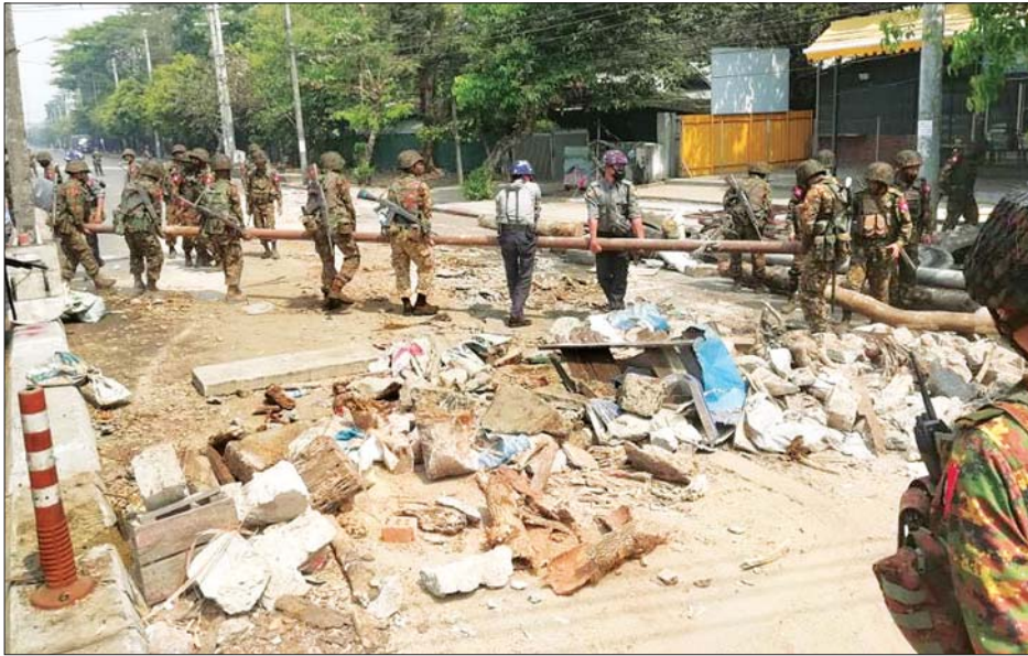
လုံခြုံရေးတပ်ဖွဲ့ဝင်များက ဆူပူဆန္ဒပြသူများ ပိတ်ဆို့ထားသည့်လမ်းကို ဖယ်ရှားရှင်းလင်းစဉ်။

ယနေ့တွင် တိုင်းဒေသကြီးနှင့် ပြည်နယ်အများစုတွင် လမ်းပေါ်ထွက်၍ ဆန္ဒပြသော လူစုလူဝေးအနေဖြင့် သိသာစွာ လျော့နည်းခဲ့သော်လည်း အချို့သော ဒေသများတွင် မတည်မငြိမ်ဖြစ်စေရေးအတွက် ဆက်လက်ဆောင်ရွက်လျက်ရှိရာ ရန်ကုန်တိုင်း