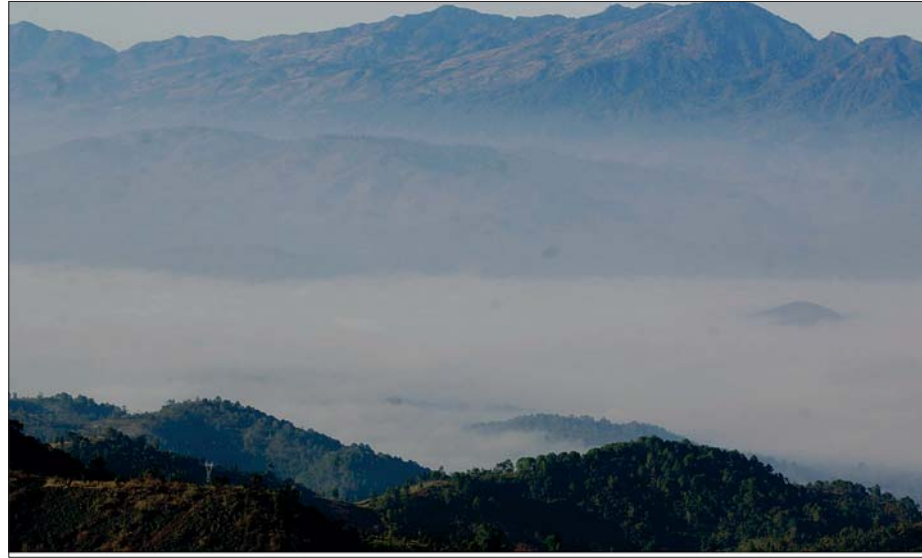
လွိုင်လင်တောင်ချွန်းပေါ်မှ မြင်တွေ့ရသော တိမ်ပင်လယ်။

ကိုဗစ်-၁၉ အလွန်ကာလများတွင် မြန်ပြည်တစ်လွှား ချစ်မိတ်ဆွေများမှ လွိုင်လင်တောင်ချွန်းပေါ်သို့ တောင်တက်ခရီးစဉ်တစ်ခု စီစဉ်ဆောင်ရွက်ပြီး ဒေသန္တရဗဟုသုတများရရှိစေရန်နှင့် တောတောင်ရေမြေ သဘာဝအလှများ ကြည့်ရှုခံစားကာ ကိုယ်ကျန်းမာ စိတ်ချမ်းသာစွာဖြင့် လူ့ဘောင်ကောင်းကျိုး သယ်ပိုးနိုင်ကြပါစေကြောင်း တောင်ချွန်းတောင်ပေါ် စေတီတော်နှစ်ဆူတံပိုး ပြည်သူအများ ကျန်းမာချမ်းသာပြီး ကပ်ရောဂါဘေးအန္တရာယ်မှ ကင်းဝေးကြပါစေကြောင်း ဦးခိုက်ပူဇော် ဆုတောင်းမေတ္တာပို့သလိုက်ရပါသည်။ ။