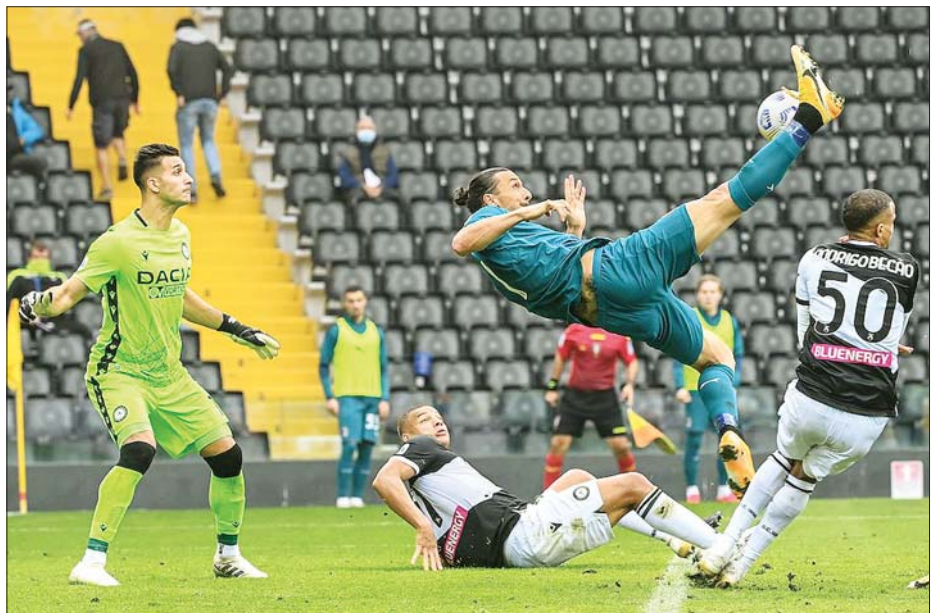
အေစီမီလန်အသင်းနှင့် အူဒီးနိုစ်အသင်းတို့ ပထမအကျော့ တွေ့ဆုံယှဉ်ပြိုင်ကစားစဉ်။

အမှတ်ပေးဇယားရပ်တည်မှုတွင် အေစီမီလန် အသင်း စီးရီးအေ (၂၄) ပွဲကစားပြီး ၅၂ မှတ်ဖြင့် အဆင့် (၂) နေရာတွင် ရပ်တည်နေပြီး အူဒီးနိုစ် အသင်းက (၂၄) ပွဲကစားပြီး ၂၈ မှတ်ဖြင့် အဆင့် (၁၂) နေရာတွင် ရပ်တည်နေသည်။ အေစီမီလန် အသင်းသည် ဦးဆောင်သူ အင်တာမီလန်အသင်းနှင့် ရမှတ်ကွာဟမှု လျော့ချနိုင်ရန်အတွက် ယခုပွဲစဉ်ကို အနိုင်ရရှိရေးကိုသာ ဦးတည်လာဖွယ်ရှိနေသည်။ အူဒီးနိုစ်အသင်းကလည်း အမှတ်ပေးဇယား အထက် ပိုင်းသို့ တက်လှမ်းနိုင်ရန်အတွက် ယခုပွဲစဉ်ကို အနိုင် ရရှိအောင် အားစိုက်ကစားလာဖွယ်ရှိနေသည်။