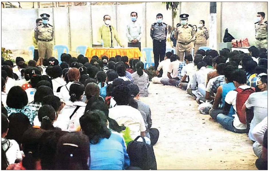
ဖြစ်ပြီး ယနေ့နံနက်ပိုင်းတွင် ရန်ကုန်တိုင်းဒေသကြီး စီမံအုပ်ချုပ်ရေးကောင်စီ၏ စီစဉ်ပေးမှုဖြင့် တိုင်းဒေသကြီး သယ်ယူပို့ဆောင်ရေး ကြီးကြပ်ကွပ်ကဲမှု အာဏာပိုင်အဖွဲ့ (YRTA)မှ YBS မော်တော်ယာဉ်ကြီး ကိုးစီးဖြင့် ချက်အရ သိရသည်။ မြန်မာနိုင်ငံရဲတပ်ဖွဲ့၏ သတင်းထုတ်ပြန်ချက်အရ သိရသည်။ သတင်းစဉ်

ရန်ပြုလာပြီး လုံခြုံရေးတပ်ဖွဲ့အနေဖြင့် နီးကပ်စွာထိပ်တိုက်ရင်ဆိုင်ကာ ရန်ပြုခံရသည့်အခြေအနေသို့ ရောက်ရှိလာခဲ့သဖြင့် နိုင်ငံတော်နှင့် ပြည်သူ့လူထု၏ အကျိုးစီးပွားကို ဦးတည်ပြီး မဖြစ်မနေ ထိန်းသိမ်းရန်လိုအပ်သဖြင့် ဥပဒေနှင့်အညီ ခေတ္တထိန်းသိမ်းခဲ့ရသည်။ ထိုကဲ့သို့ ထိန်းသိမ်းထားသူများမှာ ကမာရွတ်မြို့နယ် လှည်းတန်း၊ သာကေတ၊ တာမွေစမ်းချောင်း၊ တောင်ဥက္ကလာပ၊ ဒဂုံမြို့သစ် (မြောက်ပိုင်း)၊ လှိုင်၊ ကျောက်တံတား၊ ဗိုလ်တထောင်၊ မရမ်းကုန်း၊ ဗဟန်း၊ မြောက်ဥက္ကလာပ၊ မင်္ဂလာတောင်ညွန့်၊ သစ်ခဲးကျွန်း၊ ကြည့်မြင်တိုင်မြို့နယ်များမှ အမျိုးသား ၂၂၄ ဦး၊ အမျိုးသမီး ၂၈၇ ဦး၊ စုစုပေါင်း ၅၁၁ ဦးတို့