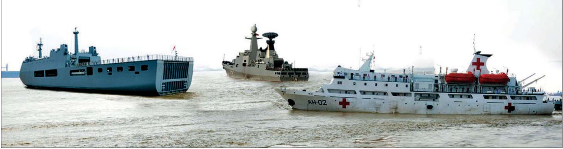
မလေးရှားနိုင်ငံရောက် မြန်မာနိုင်ငံသားများအား ခေါ်ဆောင်လာသည့် စစ်ရေယာဉ် (မုတ္တမ)၊ ပင်လယ်သွား ဆေးရုံရေယာဉ် (သံလွင်) နှင့် စစ်ရေယာဉ် (ဆင်ဖြူရှင်) တို့ကို တွေ့ရစဉ်။

ယခုခရီးစဉ်သည် မြန်မာနိုင်ငံ ရန်ကုန်မြို့မှ မလေးရှားနိုင်ငံ လူမွတ်ရေတပ်ဆိပ်ကမ်းအထိ မြန်မာ့ပင်လယ်၊ အန်ဒမန်ပင်လယ်၊ မာလတ္တာ ရေလက်ကြားတို့ကို ဖြတ်သန်း ကာ အသွားအပြန် ၁၂ ရက်ကြာ မိုင်ပေါင်း ၂၀၀၀ ကျော် အထွာပြင် ကျယ်တွင် ခရီးနှင့်ခွဲကြရခြင်းဖြစ်သည်။ အတား အဆီး အနှောင့်အယှက်၊ အဖျက်စကားများနှင့် မလိုမုန်းထားမှုများက ပင်လယ်ရေလှိုင်းများသဖွယ် မည်သို့ပင် ရိုက်ခတ်နေကြစေကာမူ မိမိနိုင်ငံသူ နိုင်ငံသားများ၊ တိုင်းရင်းသူတိုင်းရင်းသား မိသားစု ဝင်များအပေါ် ထားရှိသည့် မေတ္တာ၊ ကရုဏာ၊ စေတနာတို့က အထွာပြင်ကျယ်မှ ရေလှိုင်းများ ထက် ကျော်လွန်ခဲ့ပါချေပြီ။ ။