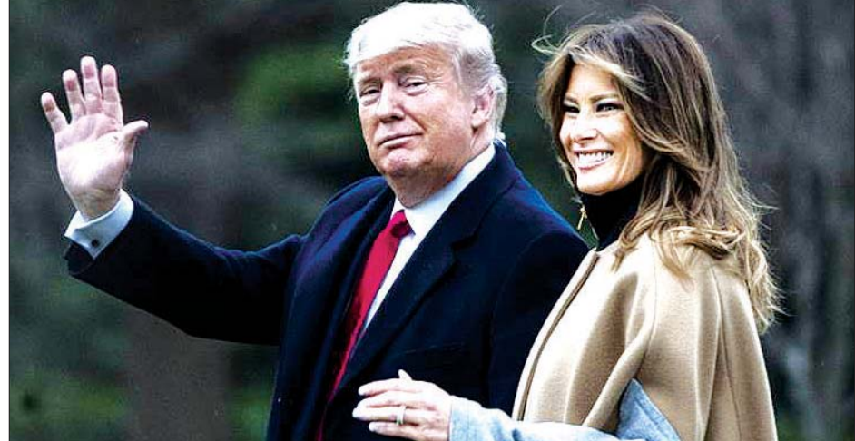
အမေရိကန်သမ္မတဟောင်း ဒေါ်နယ်ထရမ်နှင့် သမ္မတကတော် မယ်လန်ယာထရမ်တို့ကို တွေ့ရစဉ်။