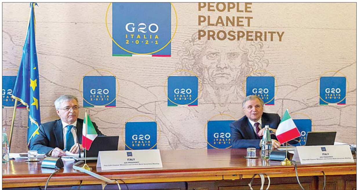
ဂျီ-၂၀ အစည်းအဝေးတွင် တက်ရောက်မည့် အီတလီနိုင်ငံမှ တာဝန်ရှိသူများကို တွေ့ရစဉ်။

လွန်ခဲ့တဲ့နှစ်က ဂျီ-၂၀ အဖွဲ့ဟာ ဆင်းရဲတဲ့နိုင်ငံတွေအတွက် အတိုးကြေးမြီကို ရပ်ဆိုင်းပေးခဲ့ပြီး အတိုးပေးရမယ့်နေ့ကို ၂၀၂၁ ခုနှစ် ဇွန်လ ၃၀ ရက်အထိ တိုးမြှင့်ပေးလိုက်ပါတယ်။ သို့သော်လည်း