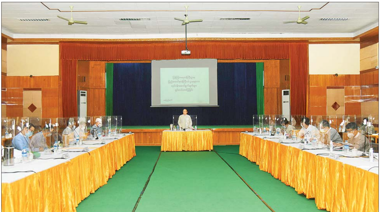
ပြည်ထောင်စုဝန်ကြီး ဦးချစ်နိုင် ပြန်ကြားရေးဝန်ကြီးဌာန လုပ်ငန်းညှိနှိုင်းအစည်းအဝေးတွင် အမှာစကားပြောကြားစဉ်။ သတင်းစဉ်

ထို့နောက် ဒုတိယဝန်ကြီးနှင့် ဌာနဆိုင်ရာအကြီးအကဲများက ဖေဖော်ဝါရီလအတွင်း ဆောင်ရွက်ခဲ့မှုများကို သုံးသပ်တင်ပြပြီး မတ်လ အတွက် ဆောင်ရွက်သွားမည့်အစီအမံများကို တင်ပြဆွေးနွေးကြသည်။ ယင်းနောက် ပြည်ထောင်စုဝန်ကြီးက နိဂုံးချုပ်အမှာစကား ပြောကြားပြီး အစည်းအဝေးကို ရုပ်သိမ်းလိုက်သည်။ သတင်းစဉ်