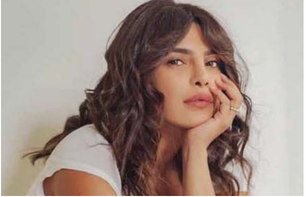
ဘောလိဂ်ဝန်ထမ်းမင်းသမီး ပရိယာဇ်က ပြော