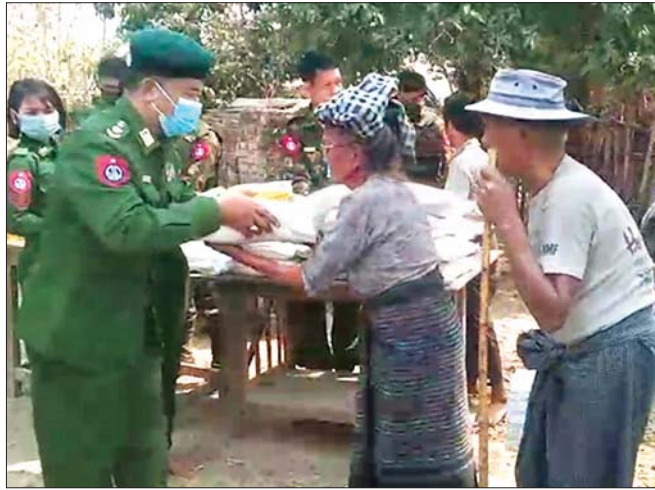
မကွေးမြို့နယ် ပုဂံမျှော်ကျေးရွာ ဒေသခံများအတွက် စားသောက်ဖွယ်ရာများ ပေးအပ်စဉ်။

ကိုဗစ်- ၁၉ ရောဂါ ကာကွယ်၊ ထိန်းချုပ်၊ ကုသမှုလုပ်ငန်းများ ဆောင်ရွက်နေစဉ်ကာလ အတွင်း သွားလာမှု ကန့်သတ်ချက်များကြောင့် ဒေသခံပြည်သူများ စားရေးအစာပြင်ဆင်ရေး အတွက် နယ်မြေခံတပ်မတော်သားများက ဆန်၊ ဆီနှင့် စားသောက်ဖွယ်ရာများကို အိမ်အရောက် လိုက်လံ ပေးဝေလှူဒါန်းလျက်ရှိသည်။