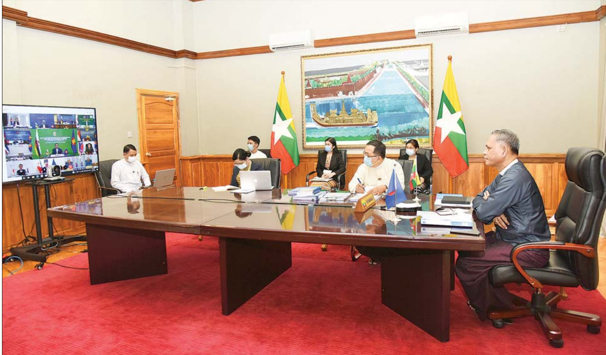
ပြည်ထောင်စုဝန်ကြီး ဦးအောင်နိုင်ဦး (၂၇) ကြိမ်မြောက် အာဆီယံစီးပွားရေးဝန်ကြီးများ သီးသန့်အစည်းအဝေးသို့ တက်ရောက်စဉ်။ သတင်းစဉ်

နေပြည်တော် မတ် ၂ (၂၇) ကြိမ်မြောက် အာဆီယံ စီးပွားရေးဝန်ကြီးများ သီးသန့် အစည်းအဝေးကို ယနေ့တွင် ဗီဒီယိုကွန်ဖရင့်စနစ်ဖြင့် ကျင်းပ ရာ ရင်းနှီးမြှုပ်နှံမှုနှင့် နိုင်ငံခြား စီးပွားဆက်သွယ်ရေးဝန်ကြီးဌာန ပြည်ထောင်စုဝန်ကြီး ဦးအောင် နိုင်ဦး နေပြည်တော်မှ ပါဝင် တက်ရောက်သည်။ ဦးစားပေးလုပ်ငန်းများ အစည်းအဝေး ပထမပိုင်း အနေဖြင့် အာဆီယံစီးပွားရေး ဝန်ကြီးများနှင့် အာဆီယံ စီးပွားရေး အကြံပေးကောင်စီတို့ တွေ့ဆုံဆွေးနွေးသည်။ ထိုသို့ တွေ့ဆုံရာတွင် အာဆီယံ စီးပွားရေး အကြံပေးကောင်စီ၏ အလှည့်ကျ ဥက္ကဋ္ဌဖြစ်သည့် ဘရူနိုင်းဒါရဆလမ်နိုင်ငံမှ Dr. Ar. Siti Rozaimeryanty DSLJ Haji Abd Rahman နှင့် နိုင်ငံအလိုက် အဖွဲ့ဝင်များက အာဆီယံ စီးပွားရေး အကြံပေးကောင်စီ၏ ၂၀၂၁ ခုနှစ် ဦးတည်ချက်ဖြစ်သည့် ပြန်လည်ထူထောင်ရေး၊ ပိုမို ကြံ့ခိုင်ရေးနှင့် အတူတကွပူးပေါင်း ဆောင်ရွက်ရေးဖြင့် ၂၀၂၁ ခုနှစ် အတွင်း ဆောင်ရွက်မည့် ဦးစား ပေး လုပ်ငန်းများကို ရှင်းလင်း တင်ပြသည်။ ထို့နောက် အာဆီယံစီးပွား ရေး အကြံပေးကောင်စီအဖွဲ့ဝင်၊ မြန်မာနိုင်ငံ ကုန်သည်များနှင့် စက်မှုလက်မှု လုပ်ငန်းရှင်များ အသင်းချုပ်ဥက္ကဋ္ဌ ဦးဇော်မင်းဝင်း က မြန်မာနိုင်ငံ၏ လက်ရှိ ကုန်သွယ်မှုနှင့် ရင်းနှီးမြှုပ်နှံမှု အခြေအနေများကို တင်ပြသည်။ ပူးပေါင်းဆောင်ရွက် ဆက်လက်၍ ဝန်ကြီးများက အာဆီယံစီးပွားရေး အသိုက် အဝန်း အကောင်အထည်ဖော်ရာ တွင် အစိုးရ-ပုဂ္ဂလိက ပူးပေါင်း ဆောင်ရွက်မှုသည် အရေးကြီး ကြောင်း၊ ဒေသတွင်း ကိုဗစ်-၁၉