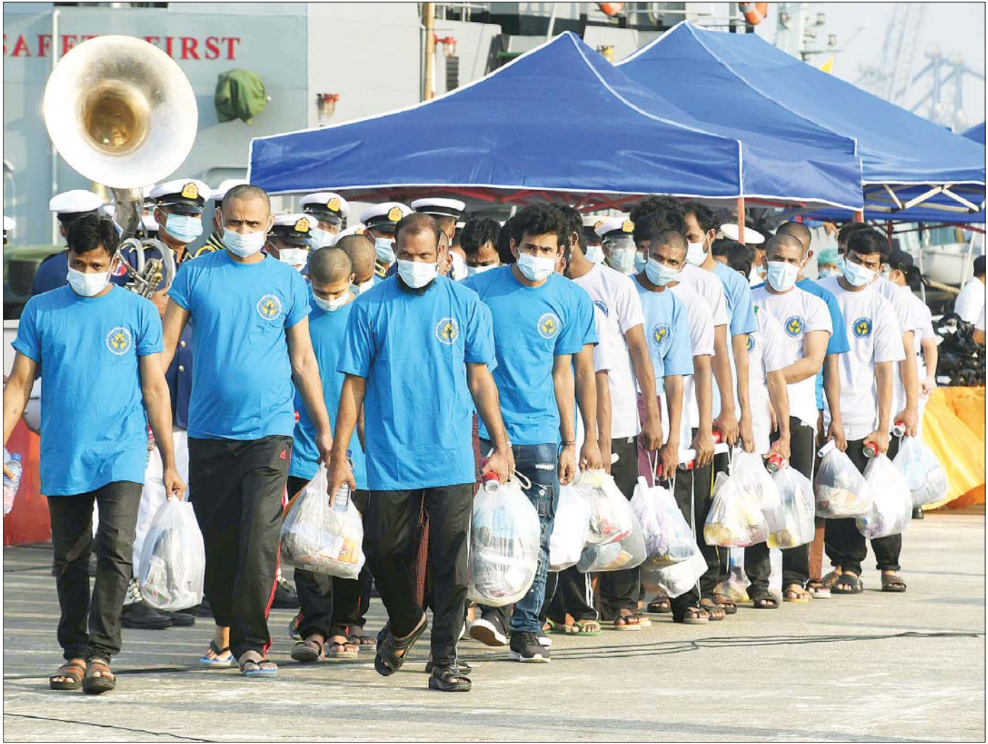
မြန်မာ့တပ်မတော်ရေယာဉ်များဖြင့် မလေးရှားနိုင်ငံမှ ပြန်လည်ရောက်ရှိလာသည့် မြန်မာနိုင်ငံသားများကို တွေ့ရစဉ်။

မလေးရှားနိုင်ငံတွင် ရောက်ရှိနေပြီး ယခင်ကာလကတည်းက အကြောင်းအမျိုးမျိုးကြောင့် မြန်မာနိုင်ငံသို့ ပြန်လာရန် အခက်အခဲများကြုံတွေ့နေရသည့် မြန်မာနိုင်ငံသားများကို ခေါ်ဆောင်ရန် မြန်မာ့တပ်မတော်မှ စစ်ရေယာဉ်သုံးစင်း မြန်မာနိုင်ငံမှ ဖေဖော်ဝါရီလ ၁၅ ရက်နေ့တွင် စတင်ထွက်ခွာသွားပြီးနောက်တွင် သတင်းမျိုးစုံတို့ ပလူပျံအောင် ထွက်ပေါ်လာသည်။ အခြေအမြစ်မရှိသည့် သတင်းများပါသလို သတင်းအမှန်ကို ပုံဖျက်ထားသည့် သတင်းမျိုးလည်းပါသည်။ အဓိကရည်ရွယ်ချက်မှာ တပ်မတော်၏ အားထုတ်ကြိုးပမ်းမှုကို အများအပြားသွင်းသိမ်းအောင် ကြိုးပမ်းကြခြင်းဖြစ်သည်။ နေရပ်ပြန်လိုသူ မြန်မာများအား ပြန်လည်ခေါ်ဆောင်မှုကို မလေးရှားတရားရုံးက ခွင့်မပြုသဖြင့် မြန်မာစစ်တပ် အရှက်ကွဲသွားပြီဖြစ်ကြောင်း၊ ရေကြောင်းခရီးဖြင့် ပြန်လည်ခေါ်ယူမည့် အစီအစဉ်အပေါ် စိုးရိမ်ကြောင်းကို ကုလသမဂ္ဂ ဒုက္ခသည်များဆိုင်ရာ မဟာမင်းကြီးရုံးက ထုတ်ဖော်ပြောကြားကြောင်း၊ မြန်မာနိုင်ငံသို့ ပြန်လည်ခေါ်ယူမည့်သူများမှာ မြန်မာနိုင်ငံသားများ မဟုတ်ဘဲ ဘင်္ဂါလီများသာဖြစ်ကြောင်း၊ မြန်မာနိုင်ငံပြင်ပမှ လူများကို ပြန်လည်ခေါ်ယူခြင်းကြောင့် ကိုဗစ်-၁၉ ရောဂါပိုးပါလာပြီး ကူးစက်ပြန့်ပွားနိုင်ကြောင်း စသည်တို့ကို သတင်းဌာနများ၏ သတင်းများ၊ အွန်လိုင်းအတင်းအဖျင်းများ အဖြစ်ပေါ်ထွက်လာခြင်းဖြစ်သည်။