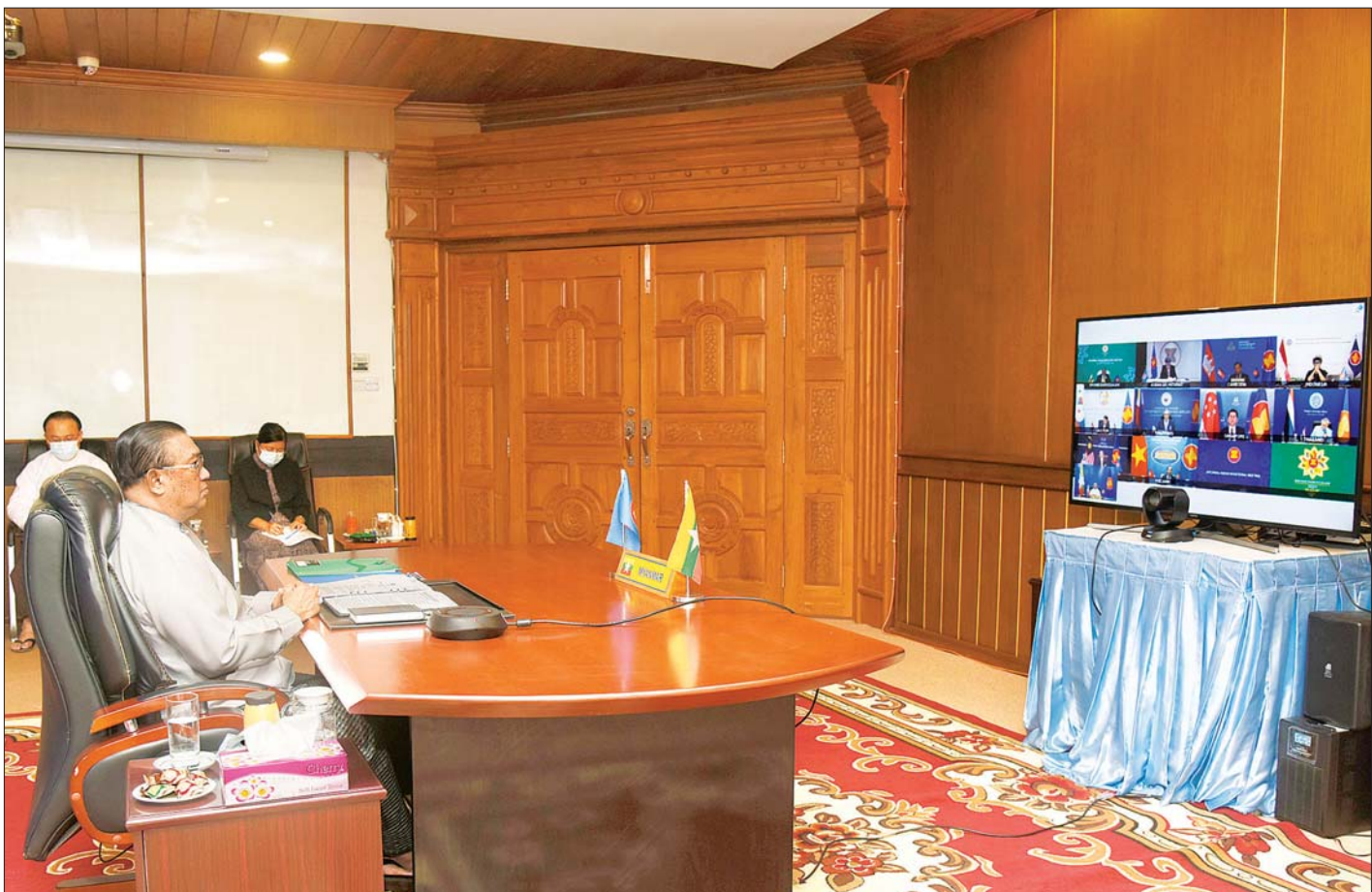
ပြည်ထောင်စုဝန်ကြီး ဦးဝဏ္ဏမောင်လွင် ဗီဒီယိုကွန်ဖရင့်ဖြင့် ကျင်းပသည့် အာဆီယံနိုင်ငံခြားရေးဝန်ကြီးများ အလွတ်သဘောအစည်းအဝေးသို့ တက်ရောက်စဉ်။