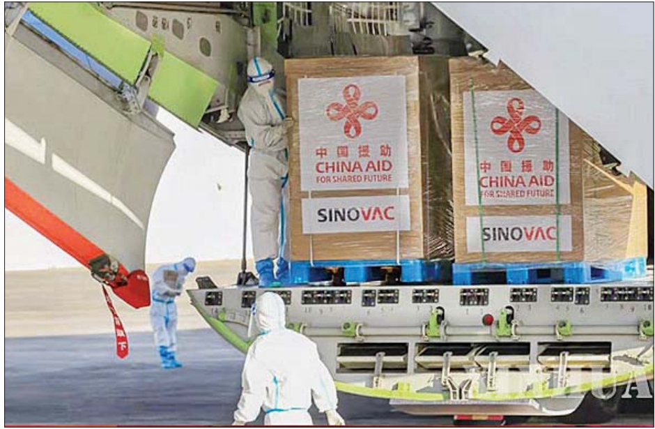
ဖိလစ်ပိုင်နိုင်ငံသို့ ရောက်ရှိလာသော ကိုဗစ်-၁၉ ကာကွယ်ဆေးများကိုတွေ့ရစဉ်။