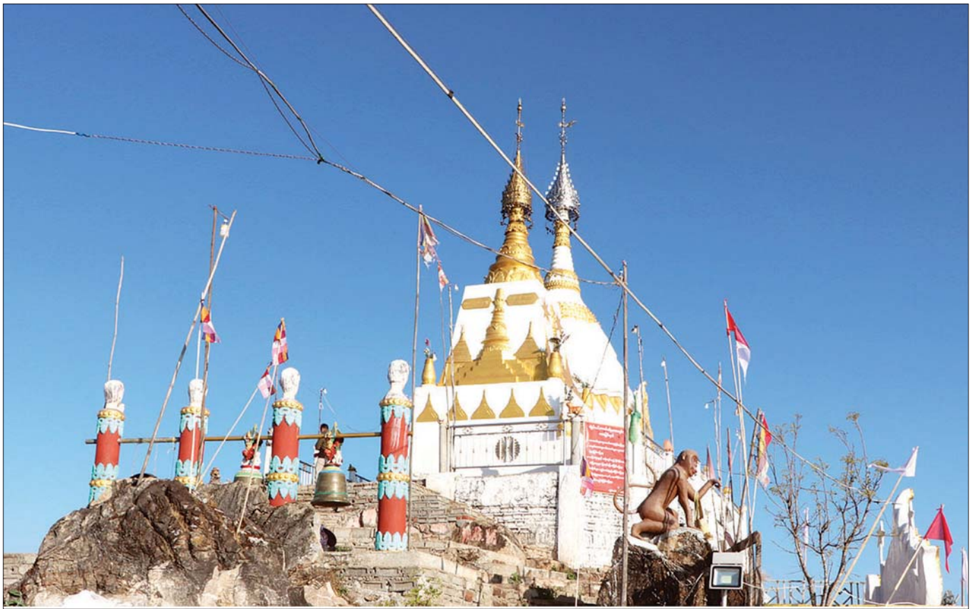
လွိုင်လင်တောင်ချွန်းပေါ်တွင် တည်ထားသော စေတီတော်နှစ်ဆူကို ဖူးတွေ့ရစဉ်။

၂၀၂၀ ပြည့်နှစ်မှ ၂၀၂၁ ခုနှစ်သို့ နှစ်သစ်ကူးသည့် အခါသမယတွင် စာရေးသူသည် လူသစ်၊ စိတ်သစ်၊ အားမာန်သစ်ဖြင့် စိတ်အပန်းဖြေစရာ လွိုင်လင်တောင်ချွန်းပေါ်ရှိ စေတီတော်နှစ်ဆူကို ဦးခိုက်ပူဇော်ရန်နှင့် ကျန်းမာရေးအရ တောင်တက်ခရီးကို အစပြုခဲ့ပါသည်။ ၂၀၂၁ ခုနှစ် ဇန်နဝါရီ ၂ ရက်နေ့ နံနက်၆:၀၀ နာရီ