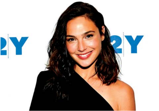
Wonder Woman မင်းသမီး ဂယ်ဂါဒေါ့။