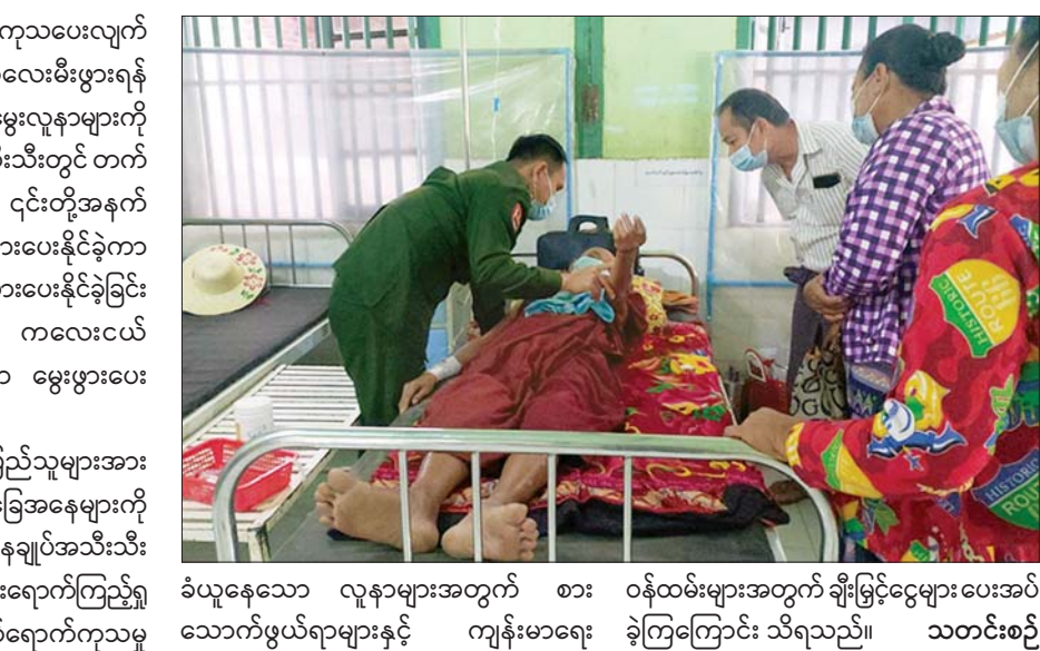
ခံယူနေသော လူနာများအတွက် စားဝန်ထမ်းများအတွက် ချီးမြှင့်ငွေများ ပေးအပ်သောကံဖွယ်ရာများနှင့် ကျန်းမာရေး ခြုံကြေကြောင်း သိရသည်။ သတင်းစဉ်

ဆေးရုံတက်ရောက်ကုသရန် လိုအပ်သော လူနာများကို ဆေးရုံတင်ကာ ကျန်းမာရေးစောင့်ရှောက်ပေးခြင်းများ ဆောင်ရွက်ပေးသည့်အပြင် ဆေးရုံတက်လူနာများနှင့် လူနာစောင့်ရှောက်ရေးအတွက်ပါ စီမံဆောင်ရွက်ပေးလျက် ရှိသည်။ (ယာယီ) ထိုသို့ လာရောက်ကုသမှုခံယူလျက် ရှိသည့် လူနာများအနက် အကြီးစား ခွဲစိတ်ကုသရန် လိုအပ်သူ ၁၈၅၀ ၊ အသေးစား ခွဲစိတ်ကုသရန် လိုအပ်သူ ၉၉၉ ဦး စုစုပေါင်း ၂၈၄၉ ဦးတို့ကို ခွဲစိတ်ကုသပေးနိုင်ခဲ့ပြီး စိုးရိမ်ဖွယ်ရာရှိသည့် လူနာများကိုလည်း ပါရဂူများ၊ ဆေးမှူးများဖြင့် အထူးကြပ်မတ် ကုသပေးလျက် ရှိသည်။ ၎င်းအပြင် ကလေးမီးဖွားရန် အခက်အခဲဖြစ်နေသည့် မွေးလူနာများကို တပ်မတော် ဆေးရုံအသီးသီးတွင် တက်ရောက်စေလျက်ရှိပြီး ၎င်းတို့အနက် ၁၀၆၇ ဦးကို ခွဲစိတ်မွေးဖွားပေးနိုင်ခဲ့ကာ ၁၈၅၃ ဦးကို သာမန်မွေးဖွားပေးနိုင်ခဲ့ခြင်းကြောင့် ယနေ့အထိ ကလေးငယ် ၂၆၅၀ ကို အောင်မြင်စွာ မွေးဖွားပေးနိုင်ခဲ့သည်။ ယင်းသို့ ဒေသခံပြည်သူများအား ဆေးကုသပေးနေမှု အခြေအနေများကို သက်ဆိုင်ရာ တိုင်းစစ်ဌာနချုပ်အသီးသီးမှ တာဝန်ရှိသူများက သွားရောက်ကြည့်ရှုအားပေးပြီး ဆေးရုံတက်ရောက်ကုသမှု