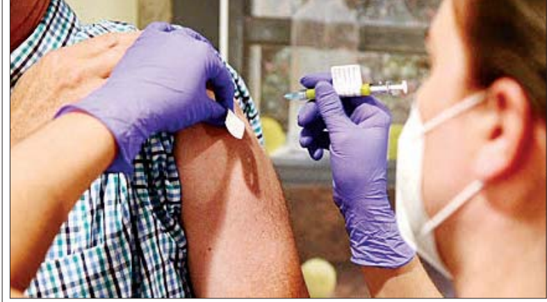
အမေရိကန်တွင် ကိုဗစ်-၁၉ ကာကွယ်ဆေးထိုးပေးနေသည်ကို တွေ့ရစဉ်။

ဝါရှင်တန် မတ် ၂ အသက် ၁၈ နှစ်နှင့် ၎င်းအထက်အရွယ်ရောက်ပြီးသူများအတွက် သင့်တော်သည်ဟု အမေရိကန် အစားအသောက်နှင့် ဆေးဝါးအာဏာပိုင်အဖွဲ့က ခွင့်ပြုချက်ရရှိပြီးနောက်