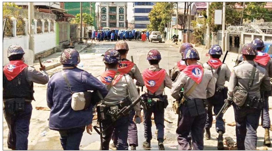
ဆူပူဆန္ဒပြသူများအား လုံခြုံရေးတပ်ဖွဲ့ဝင်များက လူစုကွဲစေရန် ထိန်းသိမ်းမှုများ ဆောင်ရွက်စဉ်။

ဒေသကြီး ကမာရွတ်၊ စမ်းချောင်း၊ လမ်းမတော်နှင့် ရန်ကင်းမြို့နယ်တို့၌ လူစုလူဝေးများ ဖြစ်ပွားခဲ့ရာ လုံခြုံရေးတပ်ဖွဲ့ဝင်များက အသံမြည်ခုံ၊ (ဒေသ ၁၂)ဗို့ ပြောင်းချောသေနတ်၊ မျက်ရည်ယိုဗုံးတို့ဖြင့် ပစ်ခတ်လူစုခွဲခဲ့ရပြီး ဆူပူအော်ဟစ်ဆန္ဒပြသူ အမျိုးသား (၄)ဦး၊ အမျိုးသမီး (၈)ဦး စုစုပေါင်း (၁၂)ဦးတို့ကို ဖမ်းဆီးထိန်းသိမ်းခဲ့ရသည်။