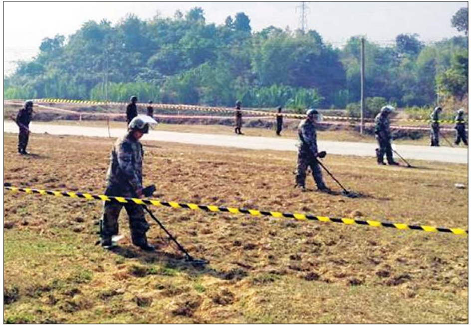
အမ်း-စစ်တွေ ပြည်ထောင်စုကားလမ်းမကြီးတစ်လျှောက် မိုင်းရှင်းလင်းရေး ဆောင်ရွက်စဉ်။