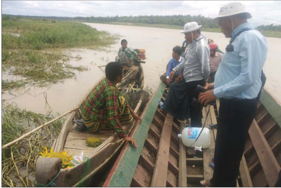
တရားမဝင် ငါးဖမ်းဆီးမှုကို တာဝန်ရှိသူများ စစ်ဆေးဆောင်ရွက်နေစဉ်။

ထို့ပြင် အင်း၊ အိုင် ဧရိယာများအတွင်း၌ရှိသည့် ငါးနေထိုင်တောများကို ခုတ်ထွင်ရှင်းလင်းပြီး လယ်ယာနှင့် အခြားစိုက်ပျိုးမြေများ တိုးချဲ့ ဆောင်ရွက်လာခြင်းများကြောင့် ငါးများနေထိုင်