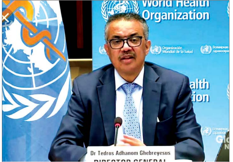
ကမ္ဘာ့ကျန်းမာရေးအဖွဲ့ ညွှန်ကြားရေးမှူးချုပ် တက်ဒရိုစ် အက်ဒါဟန်နွန်ဂီဘာရီယက်ဆု။

လူတစ်ဦးတစ်ယောက်ချင်းစီအနေဖြင့် လူစု လူဝေးကို ရှောင်ရှားရန်၊ လူမှုဝေးကွာအစီအစဉ်များ အတိုင်း နေထိုင်ကြရန်၊ လက်မကြာခဏဆေးရန်၊ ပါးစပ်နှာခေါင်းစည်းများ ဝတ်ဆင်ရန်၊ လေဝင် လေထွက်ကောင်းအောင် နေထိုင်ကြရန် လိုအပ် ကြောင်း ၎င်းကအလေးအနက်ထားကာ ပြောကြားခဲ့ သည်။ အင်န်အိတ်ချ်ကေ