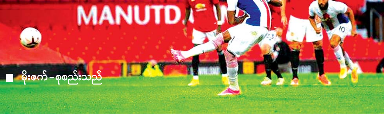
မိုးဇက် - စုစည်းသည်

ပထမအကျော့ပွဲစဉ်တွင် ပဲလေ့စ်အသင်းမှ တိုက်စစ်ကစားသမား မန်ယူအသင်းဘက်သို့ ဂိုးသွင်းယူရန် ကြိုးပမ်းမှုကို တွေ့ရစဉ်။