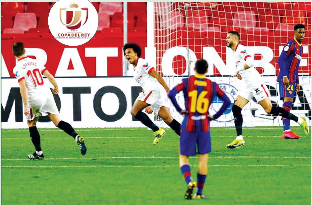
ကိုပါဒယ်ရေးဗလားဆီမီးပိုင်နယ် ပထမအကျော့ပွဲစဉ်တွင် ဆီဗီလာကစားသမားများ ဘာစီလိုနာအသင်းဘက်သို့ ဂိုးသွင်းယူပြီး အောင်ပွဲခံနေမှုကို တွေ့ရစဉ်။

ဘာစီလိုနာအသင်းနဲ့ ဆီဗီလာအသင်းတို့မှ တိုက်စစ်ကစား သမားနှစ်ဦးရဲ့ စွမ်းဆောင်ရည်ကို နှိုင်းယှဉ်ကြည့်သော် ဘာစီလိုနာ အသင်းမှ မက်ဆီက ကိုပါဒယ်ရေးဗလားပြိုင်ပွဲတွင် သုံးပွဲကစား ထားရာ တစ်ဂိုးသွင်းယူပေးထားနိုင်ပြီး ဆီဗီလာအသင်းမှ လုခံ ဒီဂျောင်က ခြောက်ပွဲတွင် သုံးဂိုးသွင်းယူပေးထားနိုင်ပါတယ်။ မက်ဆီ က လာလီဂါ ၂၃ ပွဲတွင် ၁၉ ဂိုးအထိ သွင်းယူပေးထားပြီး ယခုနှစ် ရာသီ လာလီဂါ ဂိုးသွင်းအများဆုံးကစားသမားအဖြစ် ရပ်တည် နေပါတယ်။ ဘာစီလိုနာအသင်းအနေနဲ့ ယခုနှစ်ရာသီ လာလီဂါ ၂၅