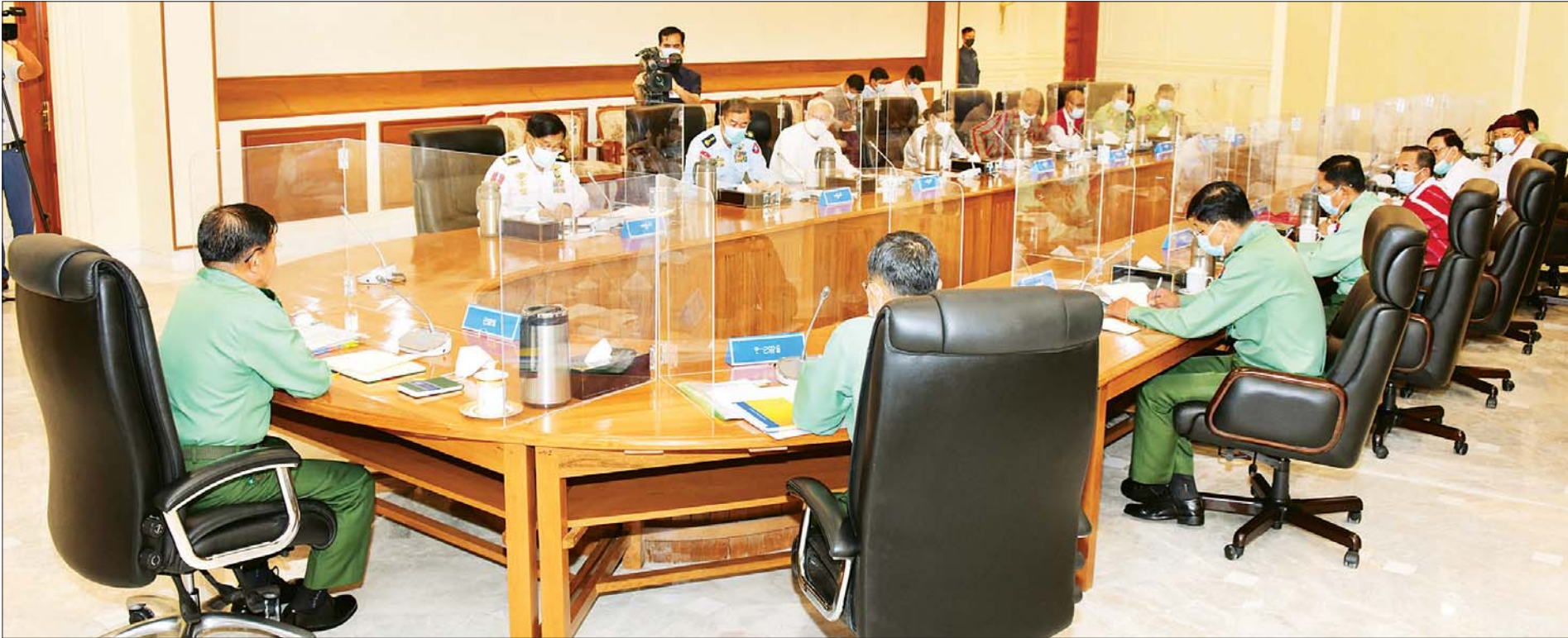
နိုင်ငံတော်စီမံအုပ်ချုပ်ရေးကောင်စီအစည်းအဝေး (၄/၂၀၂၁) ကျင်းပစဉ်။ သတင်းစဉ်

“ရေလိုအပ်မှုများပြားသည့် စပါးအခြေခံ သီးနှံပုံစံများ နေရာတွင် ဈေးကွက်ဝယ်လိုအားရှိသော တန်ဖိုးမြင့် သီးနှံများ စိုက်ပျိုးမှုပုံစံကို ပြောင်းလဲစိုက်ပျိုးရေးအတွက် ဦးစားပေး ဆောင်ရွက်သွားမည်”