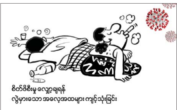
စိတ်ဖိစီးမှုကို လျော့ချဖို့အတွက် အရက်သောက်ခြင်း၊ မူးယစ်ဆေးဝါးသုံးစွဲခြင်း အစရှိတဲ့ လွဲမှားတဲ့အလေ့အထနဲ့ အမှုအကျင့်တွေကို ကျင့်သုံးခြင်း