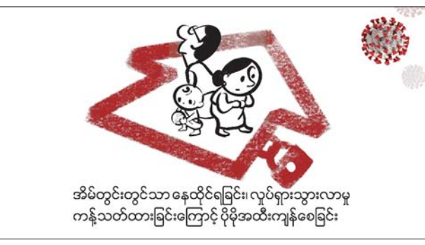
ရောဂါအန္တရာယ်ကြောင့် အိမ်ထဲမှာပဲ နေထိုင်ရခြင်းနဲ့ လှုပ်ရှားသွားလာမှု ကန့်သတ်ထားခြင်းကြောင့် ပိုမိုအထီးကျန်စေခြင်း