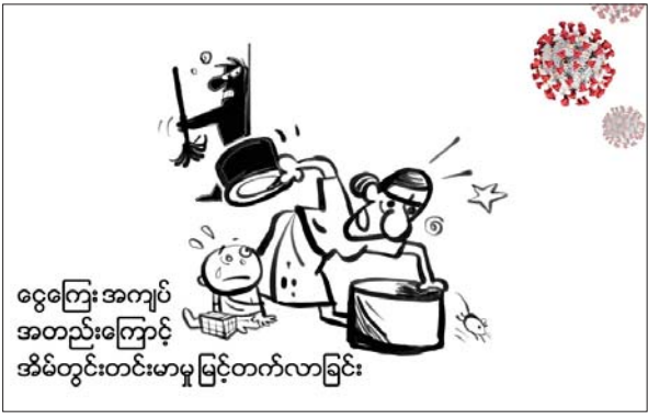
ငွေကြေးအကျပ်အတည်းကြောင့် အိမ်တွင်းတင်းမာမှု မြင့်တက်လာခြင်း

မည်သည့်အကြောင်းပြချက်နှင့်မျှ အိမ်တွင်းအကြမ်းဖက်မှုကို မကျူးလွန်ရ ကိုဗစ်-၁၉ ရောဂါ ကူးစက်ပြန့်ပွားနေစဉ် ကာလအတွင်းမှာ အောက်ပါအကြောင်းအချက်တွေကြောင့် အမျိုးသမီးနှင့် ကလေးငယ်တွေဟာ အိမ်တွင်းအကြမ်းဖက်မှုပုံစံအမျိုးမျိုးကို ပိုမိုတွေ့ကြုံ ခံစားရနိုင်ပါတယ်။