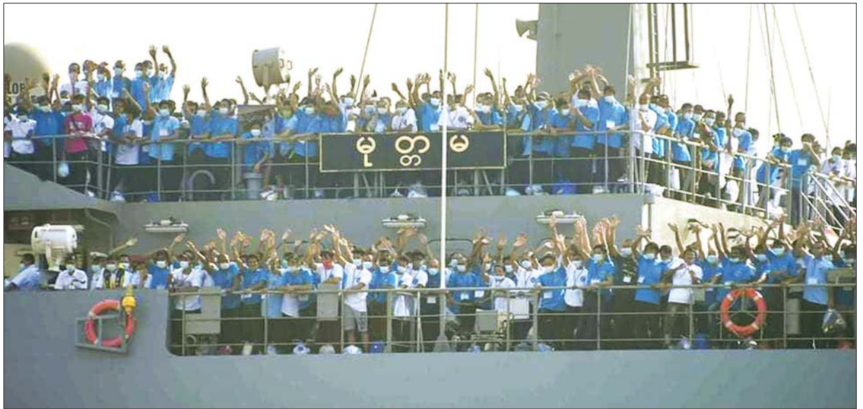
မလေးရှားနိုင်ငံရောက် မြန်မာနိုင်ငံသားများ တပ်မတော်ရေယာဉ်ဖြင့် မြန်မာနိုင်ငံသို့ ပြန်လည်ရောက်ရှိလာစဉ်။

အာဆီယံနိုင်ငံများအနက် မလေးရှားသည် စီးပွားရေးဖွံ့ဖြိုးမှု အားကောင်းသည့်နိုင်ငံများထဲတွင် ပါဝင်သည်။ အရှေ့တောင်အာရှ ဒေသမှ ပေါ်ထွက်လာသော အာရှ၏ စီးပွားရေးကျားတစ်ကောင် လည်းဖြစ်သည်။ ထုံးစံအတိုင်းပင် စီးပွားရေးဖွံ့ဖြိုးသည့် နိုင်ငံဆိုသို့ သူ့လောကီစီးပွားရေး ဖွံ့ဖြိုးသည့်နိုင်ငံများမှ ရွှေ့ပြောင်းအလုပ်သမား များ အမြောက်အမြားဝင်ရောက်ကြသည်။ မြန်မာနိုင်ငံမှ လူငယ် လူရွယ်များစွာတို့လည်း အများအပြားသွားရောက်ကြသည်။ ပင်ပန်း သည့် အလုပ်လုပ်ရသည့်ချင်းတူလျှင်ပင် သူတို့ဆီမှာ အလုပ်လုပ် ရခြင်းက ဝင်ငွေများစွာပိုခြင်းကြောင့်ဖြစ်သည်။ ကျေးလက်ဒေသများ တွင် ထိုင်း၊ မလေးရှားစသည့်နိုင်ငံများသို့ သွားရောက်အလုပ်လုပ် ကိုင်နေကြသည့် သားသမီးများရှိသောအိမ်က သူများအိမ်တွေထက် သိသိသာသာ ထင်ထင်ရှားရှားရှိသည်။ အလုပ်ကောင်းလျှင် ကောင်း သလို သွပ်မိုး၊ အုတ်ပတ်ကား၊ ကြွေပြားခင်း၊ စလောင်းနှင့် ဆိုလာ နှင့် အရောင်အသွေးပြောင်သည်။ ဆိုင်ကယ်စီးတာချင်းတူလျှင်ပင် ပို၍ကောင်းသည့် ဆိုင်ကယ်ကိုစီးနိုင်သည်။ အလှူကြီးအတန်းကြီး ပေးနိုင်သည်။ သို့ဖြင့် မြန်မာကျေးလက်၊ မြို့ရွာများစွာတို့မှ လူငယ် လူရွယ်မောင်မယ်များ ထိုင်းနှင့် မလေးရှားသို့ ရောက်အောင်ထွက်ကြ သည်။ ပြည်ပအလုပ်အကိုင် အေဂျင်စီများကလည်း ကျေးရွာများ အရောက် ကောက်သင်းကောက်သလို လူရှာကြသည်။ သည်အထဲမှာ တရားမဝင် လူပွဲစားများကလည်း ပါဝင်သည်။ သူတို့ကလည်း “အောက်လမ်း” မှ သွားသည့်နည်းဖြင့် ပို့ဆောင်ပေးကြသည်။ လောကီပညာအောက်လမ်းသည် ညစ်ညမ်းကြမ်းတမ်းအောက်တန်း