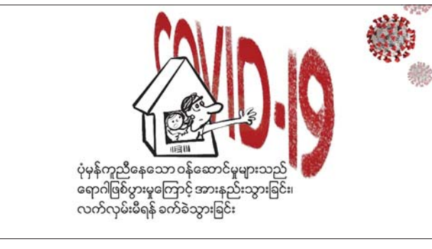
ရောဂါဖြစ်ပွားမှုတွေကြောင့် အကြမ်းဖက်ခံရသူတွေအတွက် ပုံမှန်ထောက်ပံ့မှုပေးနေသော ဝန်ဆောင်မှုတွေ အားနည်းသွားခြင်းနဲ့ ဝန်ဆောင်မှုတွေကို လက်လှမ်းမီရရှိနိုင်ဖို့ ခက်ခဲသွားခြင်း