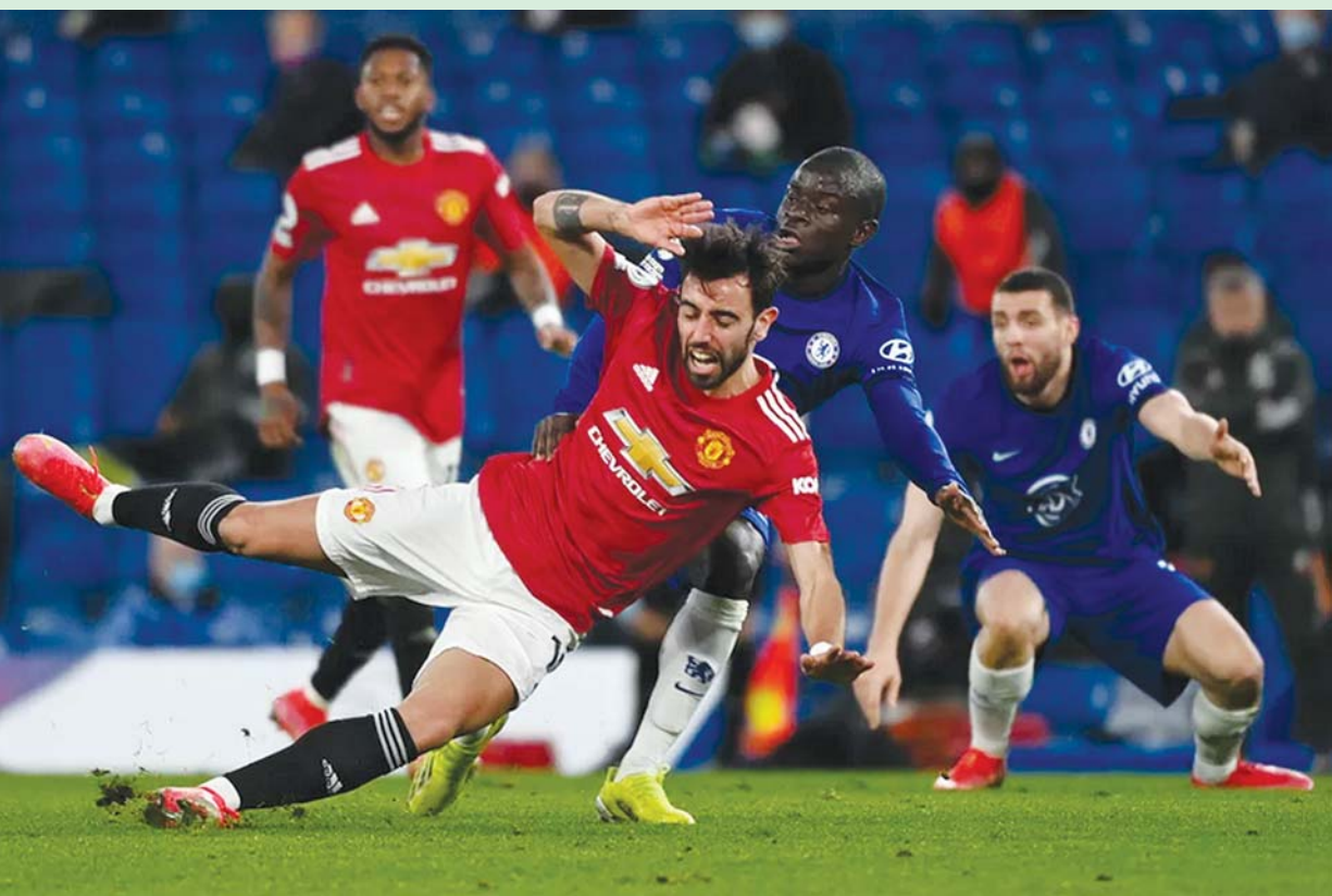
ချယ်ဆီးနှင့် မန်ယူအသင်းတို့ ယှဉ်ပြိုင်ကစားစဉ်။

ချယ်ဆီးနှင့် မန်ယူအသင်းတို့ ယခုပွဲစဉ်ကို သရေကျခဲ့ခြင်းသည် ၁၉၂၁-၂၂ ခုနှစ်နောက်ပိုင်း ပရီမီယာလိဂ်တွင် ပထမဆုံးအကြိမ် နှစ် ကျောစလုံး ရိုးမရှိသရေကျခဲ့ခြင်းဖြစ်ကြောင်း သိရသည်။ ထို့အပြင် ချယ်ဆီးနည်းပြ တူချယ်သည် ၂၀၁၁-၂၀၁၂ ခုနှစ် ရော်ဂျာပြီးနောက် ပရီမီယာလိဂ်တွင် အိမ်ကွင်းလေးပွဲဆက် ရိုးမပေးရအောင် စွမ်း ဆောင်ထားနိုင်သည့် ဒုတိယမြောက် နည်းပြအဖြစ် မှတ်တမ်းဝင် ခဲ့သည်။