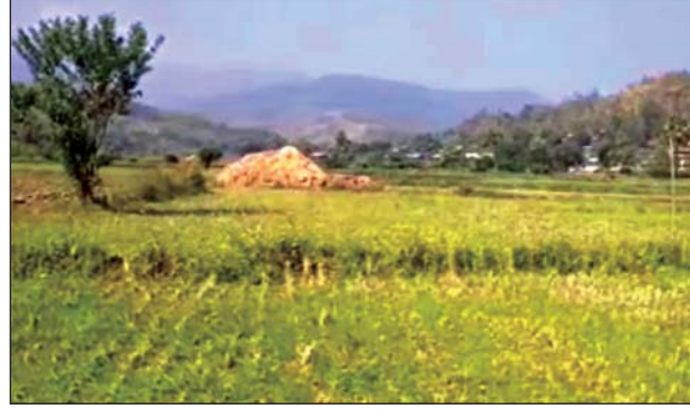
လယ်မြေများတွင် စိုက်ပျိုးအောင်မြင်နေသော ကြက်သွန်ခင်းများ။

ဆေး မတ် ၁ မကွေးတိုင်းဒေသကြီး ဂန့်ဂေါခရိုင် ဆေးမြို့နယ်အတွင်းမှ မိုးစပါး စိုက်ပျိုးသည့် လယ်မြေများတွင် စပါးစိုက်ပျိုးပြီးနောက် သီးထပ်အဖြစ် ကြက်သွန်ဖြူနှင့် ကြက်သွန်နီများကို ဒေသခံတောင်သူများက စိုက်ပျိုး ထားကြရာ မကြာမီ ကြက်သွန်များ ပေါ်တော့မည်ဖြစ်၍ ကြက်သွန်ပေါ် ချိန်တွင် ဈေးကောင်းရရှိရန် တောင်သူများအနေဖြင့် မျှော်လင့်နေကြ ကြောင်း သိရသည်။ လယ်မြေများ၌ သီးထပ်အဖြစ် ကြက်သွန်ဖြူနှင့် ကြက်သွန်နီများ စိုက်ပျိုးရာတွင် အစိုဓာတ်မီသော လယ်မြေများတွင်လည်းကောင်း၊ ရေသွင်းမှုလွယ်ကူသည့် လယ်မြေများတွင်လည်းကောင်း စိုက်ပျိုး ကြကာ ဆောင်းသီးနှံအဖြစ် သီးထပ်စိုက်ပျိုးကြခြင်းဖြစ်သည်။ "စပါးပြီးရင် ဆောင်းသီးနှံအဖြစ် ကြက်သွန်ဖြူကို အဓိကထား စိုက်ပျိုးပါတယ်။ စက်ငှားပြီး ထွန်ရပါတယ်။ ပြီးတော့ သဘာဝမြေဩဇာ၊ အာရုံမြေဩဇာ စတာတွေ ထည့်ပြီး မြေပြင်ပါတယ်။ တစ်ပင်နဲ့တစ်ပင် လေးသစ်တပါးခွာပြီး စိုက်ပါတယ်။ ပြီးရင် ရေသင့်အောင် သွင်းပါတယ်။ တစ်ပတ်အကြာမှာ အပင်ပေါက်တွေကို တွေ့ရပါတယ်။ တစ်ကေစိုက်ပျိုး စရိတ်အနေနဲ့ ကျပ်တစ်သိန်းကျော် ကုန်ကျမှုရှိပါတယ်။ မနစ်က ကြက်သွန်ပေါ်တဲ့အချိန်မှာ ကြက်သွန်ဖြူ တစ်ပိဿာကို ကျပ် ၁၃၅၀ နဲ့ ကြက်သွန်နီ တစ်ပိဿာကို ကျပ် ၅၀၀ ပဲ ရရှိခဲ့ပါတယ်။ လက်ရှိ ပေါက်ဈေးက ကြက်သွန်ဖြူတစ်ပိဿာကို ကျပ် ၂၃၀၀ နဲ့ ကြက်သွန်နီ တစ်ပိဿာကို ကျပ် ၇၀၀ နှုန်းအထိ ရှိနေတော့ ကြက်သွန်ပေါ်ချိန်မှာ လည်း အဲလို ဈေးကောင်းရမယ်လို့ မျှော်လင့်ပါတယ်"ဟု အညာကတင်း ကျေးရွာမှ ကြက်သွန်စိုက်တောင်သူတစ်ဦးက ပြောသည်။ စိုက်ပျိုးထားသော ကြက်သွန်များမှာ မတ်လ နောက်ဆုံးပတ်ခန့်တွင် ထွက်ပေါ်မည်ဖြစ်ပြီး ကြက်သွန်ပေါ်ချိန်၌ ဒေသတွင်း ရောင်းဝယ်ခြင်း အပြင် ချောက်၊ ဆိပ်ဖြူ၊ ပခုက္ကူ စသည့် မြို့များသို့ တင်ပို့ ရောင်းချမှု များလည်းရှိကြောင်း သိရသည်။ (၁၄၄)