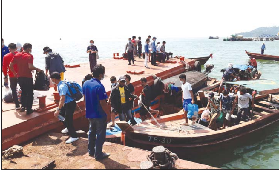
ကျေးသောင်းဆိပ်ကမ်းမှ ပြန်လည်ဝင်ရောက်လာသော မြန်မာရွှေ့ပြောင်းလုပ်သားများ။