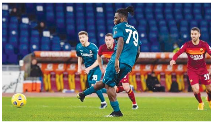
အေစီမီလန်မှ ကက်ဆီ ပယ်နယ်တီဘောလုံးကန်သွင်းစဉ်။