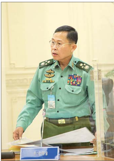
နိုင်ငံတော်စီမံအုပ်ချုပ်ရေးကောင်စီ ဒုတိယဥက္ကဋ္ဌ၊ ဒုတိယတပ်မတော် ကာကွယ်ရေးဦးစီးချုပ်၊ ကာကွယ်ရေးဦးစီးချုပ် (ကြည်း) ဒုတိယဗိုလ်ချုပ်မှူးကြီး စိုးဝင်း ရှင်းလင်းတင်ပြစဉ်။ သတင်းစဉ်

COVID-19 ရောဂါ ကာကွယ်ထိန်းချုပ်ရေးအတွက် ငွေကြေးသုံးစွဲမှုများနှင့် စပ်လျဉ်း၍ ဝန်ကြီးဌာနအချို့မှ စိစစ်တွေ့ရှိချက်များကို တင်ပြရာတွင် COVID-19 ရောဂါ ကာကွယ်ထိန်းချုပ်ရေးသုံးစွဲရန် နိုင်ငံတော်ထည့်ဝင်ငွေနှင့် ပြည်သူ့လူထု လှူဒါန်းငွေများကို အခြားမသက်ဆိုင်သည့် နေရာများတွင် သုံးစွဲထားသည်ကို တွေ့ရကြောင်း၊ ယင်းသို့