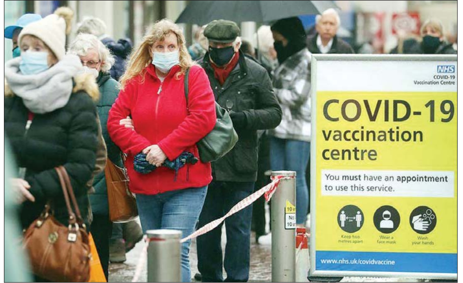
ကာကွယ်ဆေးထိုးပေးရာစင်တာအပြင်ဘက်တွင် စောင့်ဆိုင်းနေကြသူများကို တွေ့ရစဉ်။