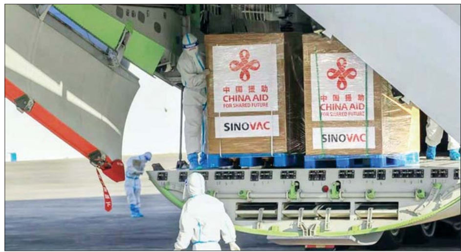
ဖိလစ်ပိုင်နိုင်ငံသို့ ကိုဗစ် -၁၉ ကာကွယ်ဆေးများရောက်ရှိလာသည်ကို တွေ့ရစဉ်။