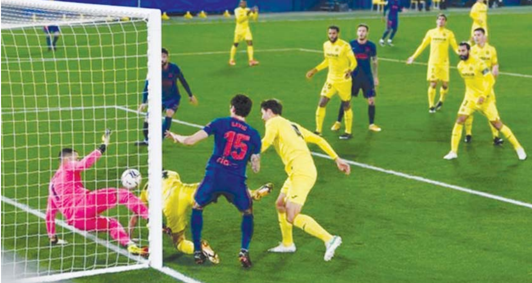
ဗီလာရီးရဲအသင်းဘက်သို့ အက်သလက်တီကို မက်ဒရစ်အသင်း ဂိုးသွင်းယူရန် ကြိုးပမ်းစဉ်။

အေတီမက်အသင်းသည် ယနေ့ပွဲစဉ်ကို အနိုင်ရရှိရန်အတွက် အဓိကကစားသမားများကို အသုံးပြုကာ ပွဲထွက်လာခဲ့ သည်။ ပွဲချိန် ၂၇ မိနစ်တွင် ဗီလာရီးရဲအသင်းမှ ဝီဒရာဇာ ကိုယ့်ဂိုးကိုယ် သွင်းယူမိသလိုဖြစ်ခဲ့၍ အေတီမက်အသင်း ဦးဆောင် ဂိုးရရှိခဲ့သည်။ အေတီမက်အသင်းအတွက် ဒုတိယဂိုးကို ပွဲချိန် ၆၉ မိနစ်တွင် ဖီးလစ်က သွင်းယူပေးနိုင်ခဲ့သည်။ ယနေ့ပွဲစဉ် တွင် အေတီမက်အသင်းသည် ဗီလာရီးရဲအသင်းကို အနိုင်ရရှိခဲ့သည်ဆိုသော်ငြား စုစုပေါင်း ဂိုးကန်သွင်းချက် ခြောက်ကြိမ် သာရှိခဲ့သည်။ ဗီလာရီးရဲအသင်းက ဂိုးကန်သွင်းချက် ၁၉ ကြိမ်အထိ ရှိခဲ့သော်လည်း ရိုးအဖြစ်ပြောင်းလဲခြင်း မရှိသောကြောင့် နှစ်ဂိုး-ဂိုးမရှိဖြင့် ရှုံးနိမ့်ခဲ့ခြင်းဖြစ်သည်။ အေတီမက်အသင်းသည် ယခုနှစ်ရာသီ လာလီဂါ ၂၄ ပွဲကစားပြီး ၁၆ ဂိုးသာ ခွင့်ပြု ပေးထားရသောကြောင့် ခံစစ်အကောင်းဆုံးအသင်းအဖြစ် ရှိနေသည်။ အေတီမက်အသင်းသည် လာမည့်ပွဲစဉ်အဖြစ် အသင်းကြီး ရိုးရဲမက်ဒရစ်အသင်းနှင့် မတ် ၇ ရက်တွင် ယှဉ်ပြိုင်ကစားရမည်ဖြစ်သည်။