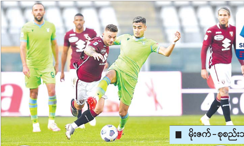
မိုးဇက် - စုစည်းသည်