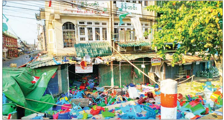
ပဲခူးမြို့ရှိ စိန်ဟင်းကုန်စုံဆိုင်အား ဝင်ရောက်ဖျက်ဆီးထားမှုကို တွေ့ရစဉ်။