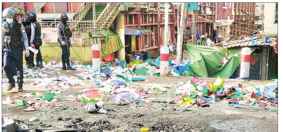
ပဲခူးမြို့အတွင်း အကြမ်းဖက်ဖျက်ဆီးထားမှုများကို တွေ့ရစဉ်။

ရန်ပြုနိုင်ရေး ကြိုးစား ထိုသို့ ထိန်းသိမ်းခံခဲ့ရမှုအပေါ် ကျေနပ်မှုမရှိသည့် လူစုလူဝေးအနေဖြင့် အုတ်ခဲကျိုးများ၊ ကျောက်ခဲများနှင့် လေးခွတို့ကို အသုံးပြုကာ အဓိကရုဏ်းမှ အကြမ်းဖက်မှု အသွင်သဏ္ဍာန် အဖြစ်သို့ ကူးပြောင်းကာ လုံခြုံရေးတပ်ဖွဲ့ဝင်များအား ရန်ပြုနိုင်ရေး ကြိုးစားပြုမူခဲ့သဖြင့် လုံခြုံရေးတပ်ဖွဲ့ဝင်များအနေဖြင့် ပဲခူးတိုင်းဒေသကြီး စီမံအုပ်ချုပ်မှုကောင်စီရုံးအရှေ့အထိ အဆင့်ဆင့် ပြန်လည်ဆုတ်ခွာခဲ့ရပြီး လူစု