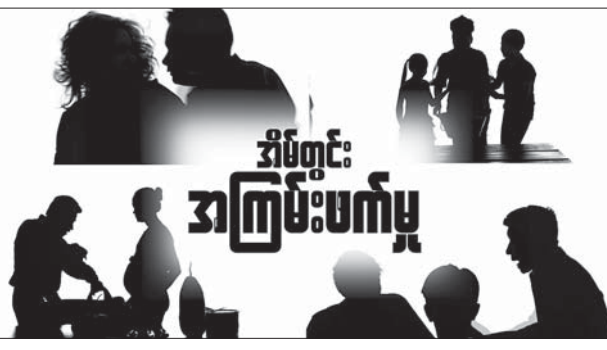
အဲဒါကြောင့် မိမိပတ်ဝန်းကျင်မှာ အိမ်တွင်းအကြမ်းဖက်မှု ဖြစ်ပွားနေတာကို သိရှိတွေ့မြင်ပါက တိတ်ဆိတ်မနေဘဲ ပူးပေါင်းကူညီ ဆောင်ရွက်ပေးပါ