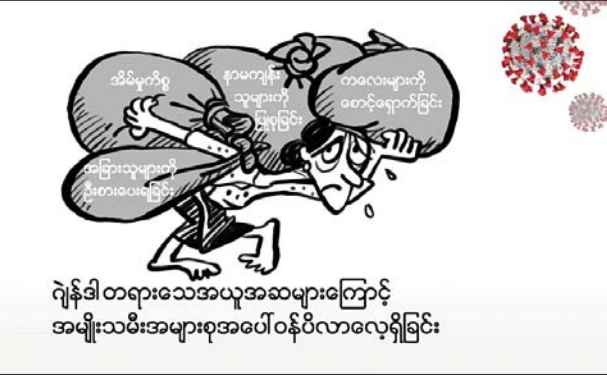
အိမ်မှုကိစ္စတွေဟာ အမျိုးသမီးတွေနဲ့ပဲ သက်ဆိုင်တယ်၊ ကလေးနဲ့ နာမကျန်းသူတွေကို ပြုစုစောင့်ရှောက်ဖို့က အမျိုးသမီးတွေရဲ့ တာဝန်ပဲဖြစ်တယ် အစရှိတဲ့ ဂျွန်ဒါ တရားသေ အယူအဆများကြောင့် အမျိုးသမီးအများစုအပေါ်မှာ ဝန်ပိလာလေ့ရှိခြင်း