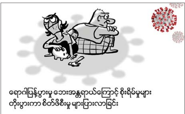
ရောဂါပြန့်ပွားမှု ဘေးအန္တရာယ်ကြောင့် စိုးရိမ်မှုများ တိုးပွားကာ စိတ်ဖိစီးမှု များပြားလာခြင်း