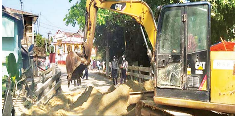
ပုသိမ်မြို့ရှိ လမ်းများ၌ ဆူပူဆန္ဒပြသူများ ပြုလုပ်ထားသည့် အတားအဆီးများကို ရှင်းလင်းဖယ်ရှားပေးစဉ်။

အလားတူ ပဲခူးတိုင်းဒေသကြီး တောင်ငူမြို့တွင် လူစုလူဝေးများ ဖြစ်ပွားခဲ့၍ လုံခြုံရေးတပ်ဖွဲ့ဝင်