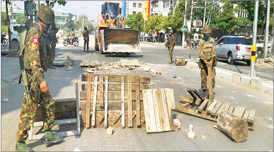
မန္တလေးမြို့ပေါ်လမ်းများ၌ ဆူပူဆန္ဒပြသူများ ပြုလုပ်ထားသည့် အတားအဆီးများကို ရှင်းလင်းဆောင်ရွက်စဉ်။

လူငယ်ထုအနေဖြင့် မိမိတို့၏ အနာဂတ်မျှော်မှန်းချက်များ မပျက်ပြားစေရေးအတွက် ယခုဖြစ်ပွားနေသည့် နိုင်ငံတော်ဆန့်ကျင်ရေး အဖွဲ့အစည်းများတွင် စည်းရုံးမှုမခံရရေးအတွက် လူငယ်များ၏ မိဘဆွေမျိုးများက ဝိုင်းဝန်းထိန်းသိမ်းကြပ်မတ်ပေးကြရန် အေးချမ်းသာယာလုံခြုံစွာနေထိုင်လိုသူ ပြည်သူ့လူထုအများစုက လိုလားလျက်ရှိကြောင်း ဖော်ပြပါရှိသည်။ သတင်းစဉ်