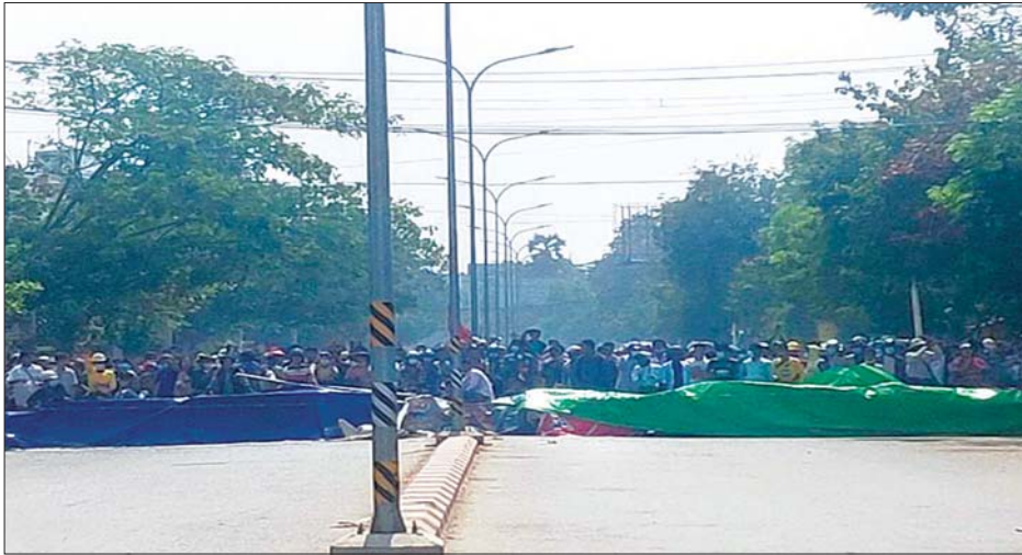
မုံရွာမြို့ မြန်မာ့စီးပွားရေးဘဏ်ရှေ့ လူစုလူဝေးဖြင့် ပိတ်ဆို့နေမှုကို ဖေဖော်ဝါရီ ၂၇ ရက်က တွေ့ရစဉ်။

၂၀၂၁ ခုနှစ်၊ ဖေဖော်ဝါရီ ၂၇ ရက် နံနက်ပိုင်း တွင် ရန်ကုန်တိုင်းဒေသကြီး၊ ကမာရွတ်မြို့နယ် လှည်းတန်းလမ်းဆုံ၊ စမ်းချောင်းမြို့နယ် မြေနီကုန်း ဂုံးတံတားအောက်၊ ဒဂုံမြို့သစ်မြောက်ပိုင်း ပင်လုံ ရင်ပြင်၊ တာမွေမြို့နယ် ၅ ခုဆုံ၊ ကျောက်တံတား မြို့နယ် မြို့တော်ခန်းမအနီး၊ ဗဟန်းမြို့နယ် Ocean Center ရှေ့၊ စင်ကာပူသံရုံးရှေ့၊ အင်းလျားမြို့ လမ်းထိပ်၊ ကမာရွတ်မြို့နယ် အင်းစိန်လမ်း၊ စံရိပ်ငြိမ် မှတ်တိုင်အနီးတို့တွင် လူစုလူဝေးများဖြစ်ပွားခဲ့ရာ လုံခြုံရေးတပ်ဖွဲ့ဝင်များအနေဖြင့် အကြိမ်ကြိမ်သတိ ပေးတားမြစ်ခဲ့သော်လည်း လူစုကွဲမှုမရှိသဖြင့် နေရာ အချို့တွင် အသံမြည်ပုံဖြင့် ပစ်ခတ်လူစုခွဲခဲ့ပြီး ဆူပူ အော်ဟစ်ဆန္ဒပြသူ အမျိုးသား ၁၀၆ ဦး၊ အမျိုးသမီး ၆၀ စုစုပေါင်း ၁၆၆ ဦးတို့ကို ဖမ်းဆီးထိန်းသိမ်းခဲ့ပြီး