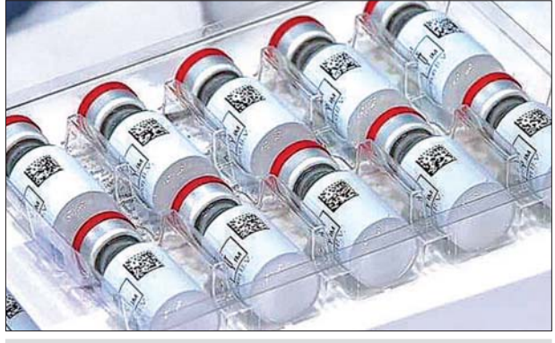
ဂျေအင်န်ဂျေ ကိုဗစ်-၁၉ ကာကွယ်ဆေးများကို တွေ့ရစဉ်။

သို့မဟုတ် ၁၈ နှစ်နှင့်အထက် အသက်ကြီးပိုင်းများကို ထိုးနှံပေးလျှင် ပိုမိုထိရောက်မှုရှိကြောင်း မှတ်ချက်ပြုကြသည်။ အက်ဖီဒီအေက အဆိုပါ ဂျေအင်န်ဂျေ ကာကွယ်ဆေးကို မကြာမီ ခွင့်ပြုပေးတော့မည်ဖြစ်သည်။ အကယ်၍ ခွင့်ပြုခဲ့မည်ဆိုပါ