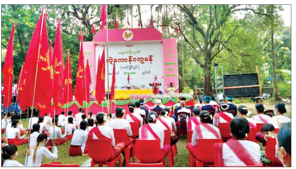
သွားရန်ရည်ရွယ်၍ ကျင်းပရခြင်း ဖြစ်ကြောင်း ဥက္ကဋ္ဌ၏မိန့်ခွန်းတွင် ဖော်ပြထားသည်။ အဆိုပါ အခမ်းအနားသို့ မွန်တိုင်းရင်းသားများ အပါအဝင် ကရင်နှင့် ပအိုဝ်းတိုင်းရင်းသား များလည်း တက်ရောက်ခဲ့ကြကြောင်း သိရသည်။ ဝင်းမင်းသန်း(ပြန်/ဆက်)

ရေရှည်ဖွံ့ဖြိုး တိုးတက်အောင် ကြိုးပမ်း မြှင့်တင်သွားရန်၊ မွန်လူမျိုးတို့၏ ဇာတိသွေး၊ ဇာတိမာန် အစဉ်နိုးကြား တက်ကြွပြီး စည်းလုံးညီညွတ်နေရန်နှင့် တိုင်းရင်းသားလူမျိုးများအားလုံး အစဉ် စည်းလုံးညီညွတ်အောင် ကြိုးပမ်းသွားရန်၊ တိုင်းရင်းသားလူမျိုးတို့၏ ကိုယ်ပိုင်ပြဋ္ဌာန်းခွင့်နှင့် တန်းတူညီမျှအခွင့်အရေး အပြည့်အဝရရှိရန်နှင့် စစ်မှန်သော ဖက်ဒရယ်ပြည်ထောင်စု မဖြစ်မနေ တည်ဆောက်ရေးအတွက် ကြိုးပမ်းဆောင်ရွက်