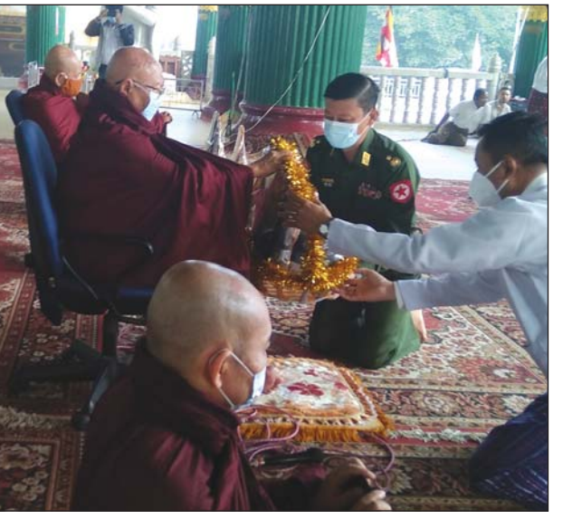
ရန်ကုန်တိုင်း စစ်ဌာနချုပ်တိုင်းမှူး ဗိုလ်ချုပ်ညွှန်ကြားရေးမှူးချုပ် အင်းစိန်ရွာမဆရာတော်ကြီးထံ လှူဖွယ်ဝတ္ထုများ ဆက်ကပ်စဉ်။

မျိုးမင်းသိန်း(မရမ်းကုန်း)