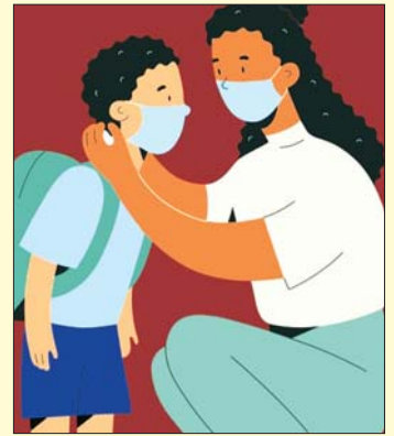
လုံးဝ မေ့လို့မရပါဘူး။

သူငယ်ချင်းအချင်းချင်း ဆော့ကစားတဲ့အခါ အဝေးကလှမ်းပြီး ဆော့ကစားနိုင်တဲ့ စားနည်းတွေကို စဉ်းစားရွေးချယ်ထားဖို့လိုအပ်ပြီး အစားအသောက်တွေကို စားသောက်တဲ့အခါမှာလည်း ကိုယ့်တစ်ဦးချင်း သီးသန့်စားသောက်ကြဖို့ မမက အကြံပေးပါရစေ။ ဒါမှသာ ကိုဗစ်ရောဂါကို ကလေးတို့ ကာကွယ်နိုင်မှာပါ။ စကားပြောတဲ့အခါ၊ နှာချေတဲ့အခါ၊ ချောင်းဆိုးတဲ့အခါတိုင်း အကာအကွယ်တွေနဲ့ လုပ်ဆောင်သင့်ပြီး လူများများရှိတဲ့နေရာမှာ မက်စတပ်သွားဖို့လည်း