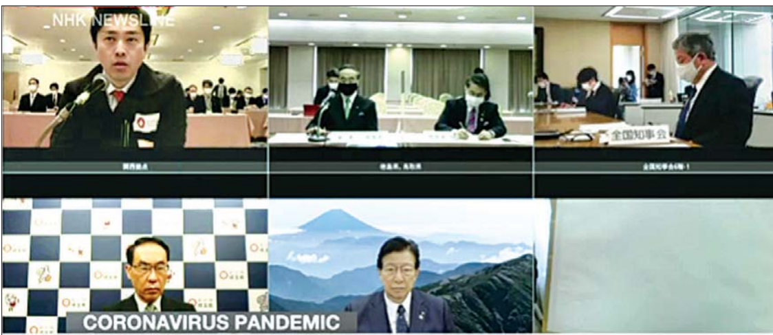
ဂျပန်ခရိုင်အုပ်ချုပ်ရေးမှူးများ အွန်လိုင်းအစည်းအဝေးကျင်းပနေသည်ကို တွေ့ရစဉ်။

အိုဆာကာအုပ်ချုပ်ရေးမှူး ယူရှိမူရာဟိရိုမိက ကိုဗစ်-၁၉ ဆိုင်ရာ ကူးစက်မှုကို အဆိုးမှအကောင်းဘက်သို့ ရောက်ရှိရန်အတွက် ကိုဗစ်-၁၉ ဆိုင်ရာ ကာကွယ်ခြင်းများသည် အလွန်အရေးကြီးကြောင်း ပြောကြားလိုက်သည်။