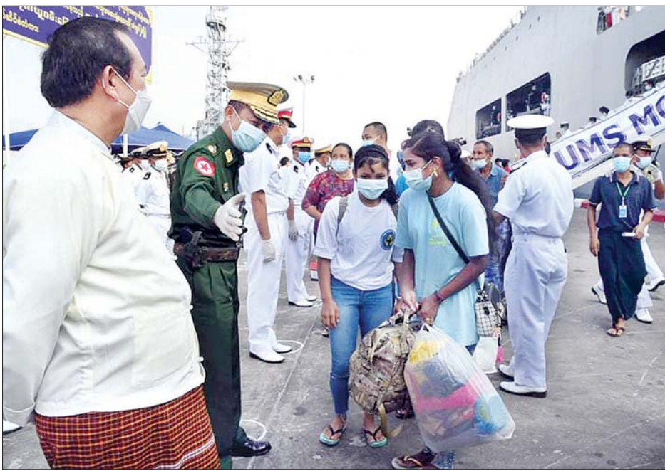
မလေးရှားနိုင်ငံမှ ပြန်လည်ရောက်ရှိလာသည့် မြန်မာနိုင်ငံသားများကို တာဝန်ရှိသူများက ကြိုဆိုကြစဉ်။