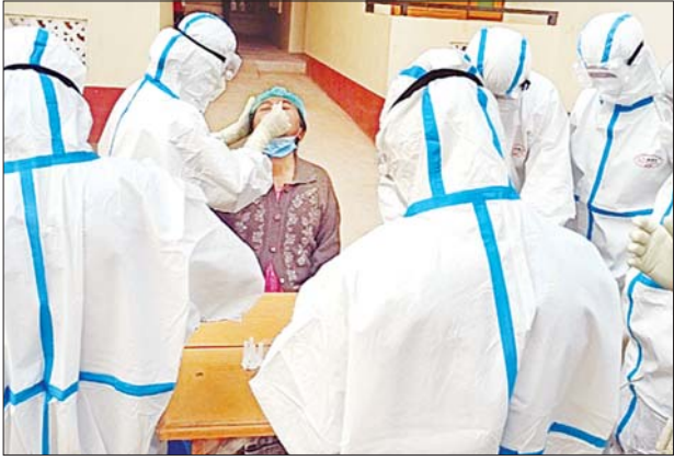
ကန်သတ်စောင့်ကြည့်ရေးစခန်းဝင်ရောက်နေသူများအား ကိုဗစ်-၁၉ ရောဂါ ရှိ၊ မရှိ စစ်ဆေးပေးစဉ်။

(၂၆-၂-၂၀၂၁)ရက်နေ့၊ ည (၈:၀၀)နာရီမှ (၂၇-၂-၂၀၂၁)ရက်နေ့၊ ည (၈:၀၀)နာရီအတွင်း ဓာတ်ခွဲခွဲစစ်မှုစုစုပေါင်း (၁,၁၁၀)ခုအား စစ်ဆေးပြီးစီးခဲ့ရာ COVID-19 ရောဂါ ဓာတ်ခွဲအတည်ပြုလူနာသစ် (၁၅)ဦး တွေ့ရှိရပါသည်။ သို့ဖြစ်ပါ၍ ယနေ့အထိ ဓာတ်ခွဲခွဲစစ်မှုစုစုပေါင်း(၂,၄၈၉,၈၈၄) ခုအား စစ်ဆေးခဲ့ပြီး COVID-19 ဓာတ်ခွဲအတည်ပြုလူနာ စုစုပေါင်း (၁၄၁,၈၉၀) ဦး ရှိပြီ ဖြစ်ပါသည်။ ယနေ့တွင် ဆေးရုံဆင်းခွင့်ရရှိသူ (၁၉) ဦး ဖြစ်သဖြင့် ယနေ့အထိ စုစုပေါင်း(၁၃၁,၄၅၄) ဦး ဆေးရုံမှ ဆင်းခွင့်ရရှိပြီး ဖြစ်ပါသည်။ COVID-19 ရောဂါဖြင့် ထပ်မံသေဆုံးသူ (၁) ဦး ရှိသဖြင့် ယနေ့အထိ သေဆုံးသူစုစုပေါင်း(၃,၁၉၉) ဦး ရှိပါသည်။ ** ပြည်သူ့လူထုအနေဖြင့် COVID-19 ရောဂါကူးစက်ပြန့်ပွားမှုကို ထိန်းချုပ်နိုင်ရေးအတွက် - • နေအိမ်ပြင်ပသို့ သွားရောက်ရန်ရှိပါက ပါးစပ်နှင့် နှာခေါင်းစည်း (Mask) ကို မဖြစ်မနေ စနစ်တကျ တပ်ဆင်ခြင်း၊ လက်ကို မကြာခဏဆေးကြောခြင်း၊ တစ်ဦးနှင့်တစ်ဦး ခပ်ခွာခွာနေထိုင်ခြင်းတို့ကို အထူးဂရုပြု ပူးပေါင်းဆောင်ရွက်ကြပါရန်၊ • ကျန်းမာရေးနှင့်အားကစားဝန်ကြီးဌာနမှ ထုတ်ပြန်ထားသည့် “ရုံးလုပ်ငန်းဌာနများတွင် COVID-19 ရောဂါကာကွယ်ရန်အတွက် ဆောင်ရွက်ရမည့် လုပ်ငန်းလမ်းညွှန်” နှင့် “တစ်ဦးကိုတစ်ဦး အသိပေးခြင်း/ သတိပေးခြင်း မိသားစုစီမံချက်” အတိုင်း COVID-19 ရောဂါ ကာကွယ်ရေးနည်းလမ်းများအား အသိပေးခြင်းနှင့် သတိပေးခြင်းတို့ကို လူတိုင်း၊ မိသားစုတိုင်းမှ တက်ကြွစွာ ပူးပေါင်းပါဝင် ဆောင်ရွက် ကြပါရန် မေတ္တာရပ်ခံပါသည်။ ကျန်းမာရေးနှင့်အားကစားဝန်ကြီးဌာန