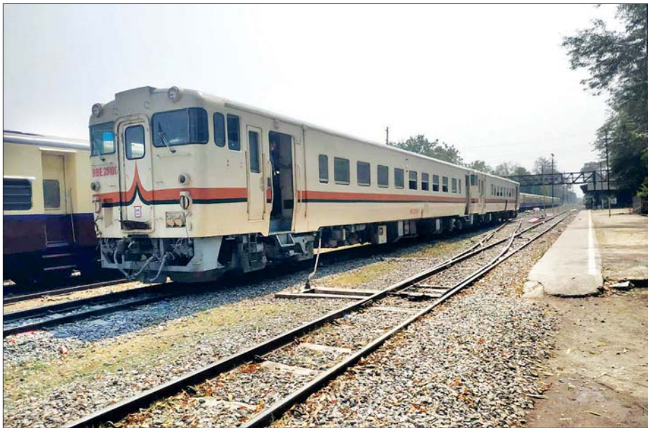
ပျော်ဘွယ်လမ်းပိုင်း (၆၂)မိုင် အတွင်းရှိ ရထားလမ်းကြံ့ခိုင်မှု၊ ဘူတာ (၁၆)ဘူတာတို့၏ လုပ်ငန်းဆောင်ရွက်မှုတို့ကို ကြည့်ရှုစစ်ဆေး၍ လိုအပ်သည်များ ဖြည့်ဆည်းပေးသည်။ အလားတူ ဖေဖော်ဝါရီ ၂၇ ရက်တွင် မြန်မာ့မီးရထားမှ (အထက်မြန်မာပြည်)နှင့် တိုင်းအဆင့်

ထိုသို့ဆောင်ရွက်လျက်ရှိရာတွင် မြန်မာ့မီးရထား ရုံးချုပ်မှ ဌာနအကြီးအကဲများနှင့် တာဝန်ရှိသူများ တိုင်းအဆင့်အရာထမ်းများသည် ဖေဖော်ဝါရီ ၂၆ ရက် တွင် ပြေးဆွဲသောခရီးတို RBE ရထားဖြင့် တောင်ငူ-ပျဉ်းမနားလမ်းပိုင်း (၅၅)မိုင်အတွင်း လိုက်ပါ၍ ရထားသံလမ်းနှင့် တံတားများ၏ကြံ့ခိုင်မှု ဆက်သွယ်ရေးနှင့် အချက်ပြစနစ်များ၏အခြေအနေ၊ ဘူတာ (၁၅)ဘူတာတို့၌ ဝန်ထမ်းများ၏ တာဝန်ထမ်းဆောင်မှုများကို စစ်ဆေးကာ လိုအပ်သည်များကို ဖြည့်ဆည်း မှာကြားသည်။ ဆက်လက်၍ ၎င်းအဖွဲ့သည် ဖေဖော်ဝါရီ ၂၇ ရက်တွင် RBE ရထားဖြင့် ပျဉ်းမနား-