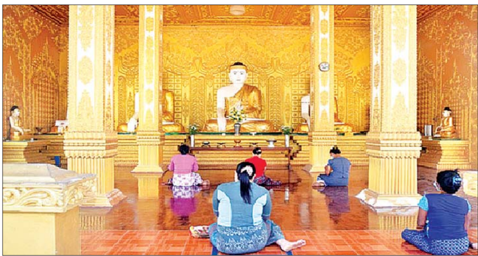
ပုသိမ်မြို့ရှိ သမိုင်းဝင် ရွှေမုဋ္ဌာမဟာစေတီတော်မြတ်ကြီး၌ လာရောက်ဖူးမြော်ကုသိုလ်ယူသူများကို တွေ့ရစဉ်။

တိုင်းဒေသကြီး အသီးသီးရှိ ဘုရား၊ စေတီပုထိုးများ၌ ဘုရားဖူးလာ သံဃာတော်များ၊ သာသနာ့နယ်ဝင် သီလရှင်များနှင့် မိဘပြည်သူများသည် ကိုဗစ်-၁၉ စည်းမျဉ်း၊ စည်းကမ်းများနှင့်အညီ ဖူးမြော်ကြည်ညို ကုသိုလ်ယူလျက်ရှိကြသည်။ ထို့ပြင် နိုင်ငံတစ်ဝန်းရှိ အစွဲလမ်းဘာသာရေး ကျောင်းများ၊ ခရစ်ယာန်ဘာသာရေးကျောင်းများနှင့် ဟိန္ဒူဘာသာရေးကျောင်းများကိုလည်း သက်ဆိုင်ရာ ဘာသာများအလိုက် အများပြည်သူဝတ်ပြုကြည်ညို နိုင်ရေးအတွက် ကိုဗစ်-၁၉ စည်းမျဉ်း၊ စည်းကမ်း များနှင့်အညီ ဖွင့်လှစ်ထားရှိရာ သက်ဆိုင်ရာ ဘာသာဝင်များက စည်းမျဉ်း၊ စည်းကမ်းများနှင့်အညီ စိတ်အေးချမ်းသာစွာ လာရောက်ဝတ်ပြုလျက် ရှိကြောင်း သတင်းရရှိသည်။