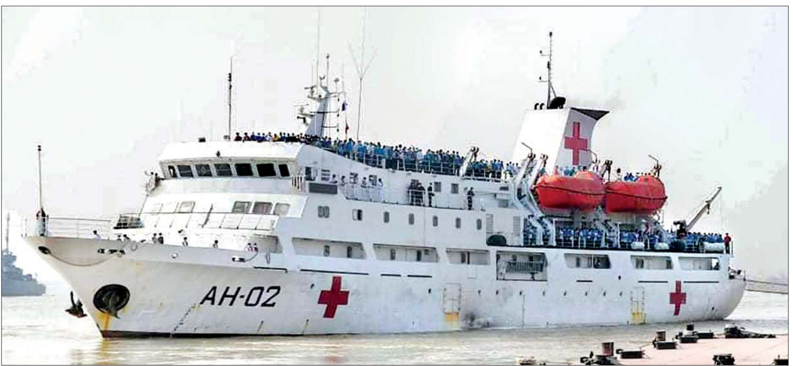
မလေးရှားနိုင်ငံရောက် မြန်မာနိုင်ငံသားများ တပ်မတော်ရေယာဉ်ဖြင့် မြန်မာနိုင်ငံသို့ ပြန်လည်ရောက်ရှိလာစဉ်။

နေပြည်တော် ဖေဖော်ဝါရီ ၂၇ နိုင်ငံတော် စီမံအုပ်ချုပ်ရေး ကောင်စီဥက္ကဋ္ဌ တပ်မတော် ကာကွယ်ရေး ဦးစီးချုပ် ဗိုလ်ချုပ်မှူးကြီး မင်းအောင်လှိုင် က COVID-19 ရောဂါဖြစ်ပွားနေ သည့် ကာလအတွင်း နိုင်ငံရပ်ခြား တွင် ကာလရှည်ကြာစွာ ပိတ်မိ ဒုက္ခခံနေရသည့် မြန်မာနိုင်ငံ သားများအနေဖြင့် မိမိတို့မြန်မာ နိုင်ငံသို့ ပြန်လာသင့်ကြောင်း၊ အဆိုပါ ပြည်ပရောက် မြန်မာ နိုင်ငံသားများအား အမြန်ဆုံး ပြန်လည်ခေါ်ဆောင်နိုင်ရေး စီမံ ဆောင်ရွက် သွားရမည်ဖြစ် ကြောင်း ဖေဖော်ဝါရီ ၂ ရက်တွင် နိုင်ငံတော်သမ္မတ အိမ်တော် အစည်းအဝေးခန်းမ၌ ကျင်းပ ပြုလုပ်ခဲ့သည့် ပြည်ထောင်စု အစိုးရအဖွဲ့ အစည်းအဝေး၌ စာမျက်နှာ ၄ ကော်လံ ၁ ◆