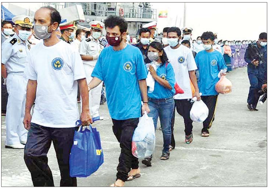
ပြန်လည်ရောက်ရှိလာသော မြန်မာနိုင်ငံသားများကို တွေ့ရစဉ်။

◆ ရှေ့ဖို့မှ လမ်းညွှန် မှာကြားခဲ့သဖြင့် မလေးရှားနိုင်ငံတွင် ရောက်ရှိနေပြီး ယခင်ကာလကတည်းက အကြောင်းအမျိုးမျိုးကြောင့် မြန်မာနိုင်ငံသို့ပြန်လာရန် အခက်အခဲများ ကြုံတွေ့နေရသည့် မြန်မာနိုင်ငံသားများအား ခေါ်ဆောင်ရန် တပ်မတော်မှ စစ်ရေယာဉ် (မုတ္တမ)၊ ပင်လယ်သွားဆေးရုံရေယာဉ်(သံလွင်)နှင့် စစ်ရေယာဉ် (ဆင်ဖြူရှင်) တို့သည် ဖေဖော်ဝါရီလ ၁၅ ရက်တွင် ရန်ကုန်မြို့မှ မလေးရှားနိုင်ငံ လူမွတ်(Lumut)ရေတပ်ဆိပ်ကမ်းသို့ စတင်ထွက်ခွာခဲ့သည်။ မြန်မာ့တပ်မတော်မှ စစ်ရေ