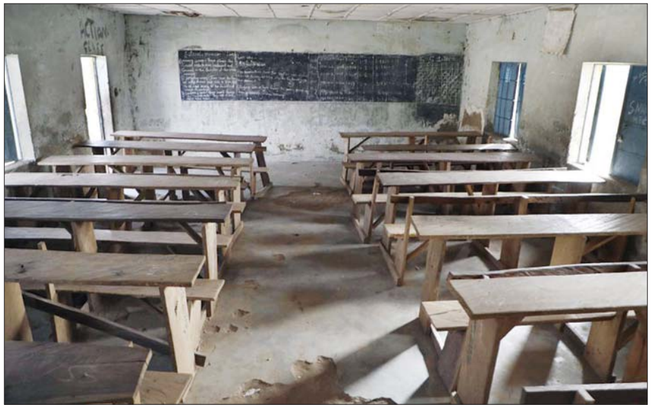
ကျောင်းသူများကို ပြန်ပေးဆွဲသွားပြီးနောက် စာသင်ခန်းအလွတ်ကို တွေ့ရစဉ်။

က ပြောသည်။ လက်နက်ကိုင် အုပ်စုများသည် ကလေးများကို ဖမ်းဆီးကာ ပြန်ပေးငွေ ရရှိနိုင်ရေးအတွက် လုပ်ဆောင်နေကြသည်။ ၂၀၁၄ ခုနှစ်ကလည်း စစ်သွေးကြွအုပ်စုဖြစ်သည့် ဘိုကိုဟာရမ်တို့သည် တိုင်းပြည်၏ အရှေ့မြောက်ပိုင်းတွင် ကျောင်းသူ ၂၀၀ ကျော်ကို ပြန်ပေးဆွဲသွားခဲ့ဖူးသည်။ ၂၀၂၀ ဒီဇင်ဘာလအတွင်း ကလည်း ကျောင်းသား ၃၀၀ ကျော်ကို အိမ်ဆောင်မှ ဖမ်းဆီးခေါ်ဆောင်သွားခဲ့ပြီး ၎င်းတို့ထဲမှ အများစုမှာ ပြန်လည်လွှတ်မြောက်လာခဲ့သည်။ ဆင်ဟွာ