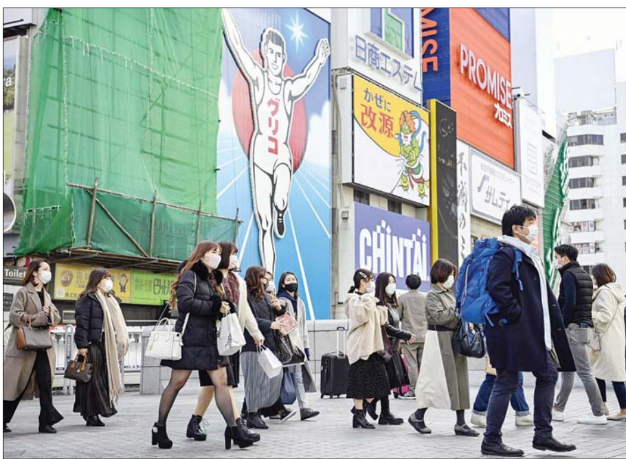
အိဆာကာတွင် ပါးစပ်၊ နှာခေါင်းစည်း တပ်ဆင်ကာ သွားလာလှုပ်ရှားနေကြသူများကို တွေ့ရစဉ်။

လူနာဦးရေ ကျဆင်းလာ ပြီးခဲ့သည့်လအတွင်းမှစတင်ကာ ဂျပန်အစိုးရသည် အရေးပေါ်အခြေအနေ ကြေညာခဲ့သည်။ ပြည်သူများအနေဖြင့် မလိုအပ်ဘဲ အပြင်မထွက်ကြရန် အာဏာပိုင်များက တိုက်တွန်းခဲ့ပြီး စားသောက်ဆိုင်များ၊ အရက်ဆိုင်များအနေဖြင့်လည်း ဆိုင်ဖွင့်ချိန်ကို လျှော့ချပေးရန်အတွက် အာဏာပိုင်များက တောင်းဆိုခဲ့သည်။ အိဆာကာ၊ ဖူကူအိုကာ၊ ကျိုတို၊ အိုဗားနိုနှင့် ဖူကူအိုကာတို့မှ အုပ်ချုပ်ရေးမှူးများသည် စီစဉ်ထားသည့်ထက် အချိန်စောစီးစွာ အရေးပေါ်အခြေအနေ ကြေညာထားမှုကို အဆုံးသတ်ပေးရန်အတွက် ဗဟိုအစိုးရထံ တောင်းဆိုခဲ့ကြသည်။ ကိုဗစ်-၁၉ ကူးစက်မှုများ၊ ကိုဗစ်-၁၉ ကြောင့် ဆိုးရွားစွာ ဝေဒနာခံစားရပြီး ဆေးရုံတက်ကုသမှုခံယူနေရသည့် လူနာဦးရေမှာ ကျဆင်းလာသည့်အတွက် အရေးပေါ်အခြေအနေ ကြေညာမှုကို ရုပ်သိမ်းပေးရန် တောင်းဆိုခဲ့ကြသည်။