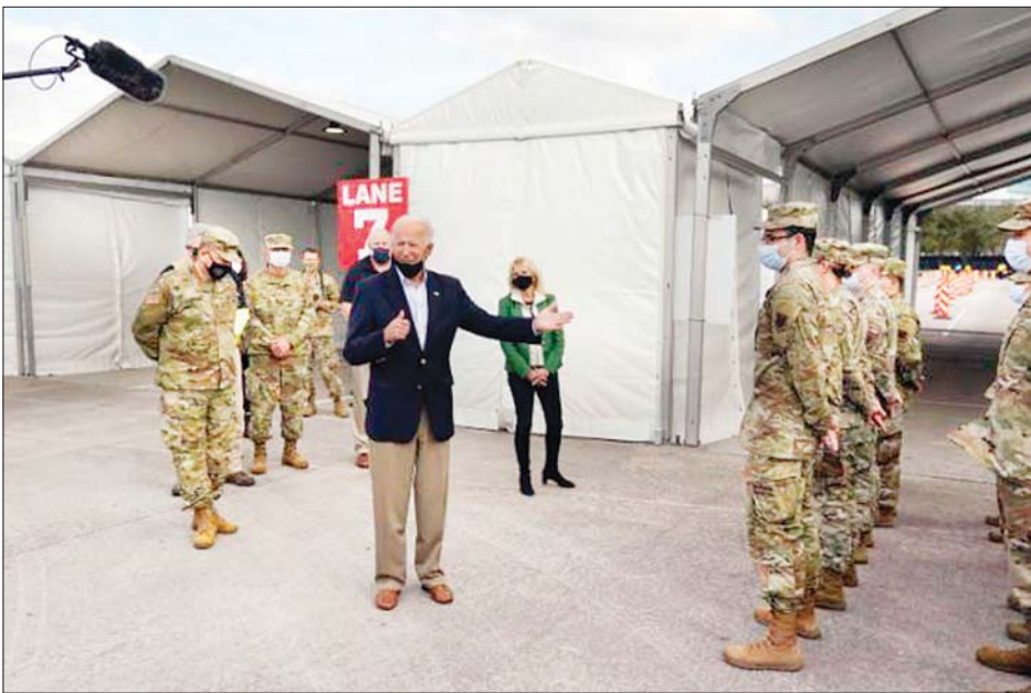
ဟူစတန်မြို့ရှိ ကိုဗစ် - ၁၉ ကာကွယ်ဆေးထိုးသည့် စင်တာသို့ အမေရိကန်သမ္မတ ဂျိုးဘိုင်ဒင် ဖေဖော်ဝါရီ ၂၆ ရက်က ရောက်ရှိလာစဉ်။