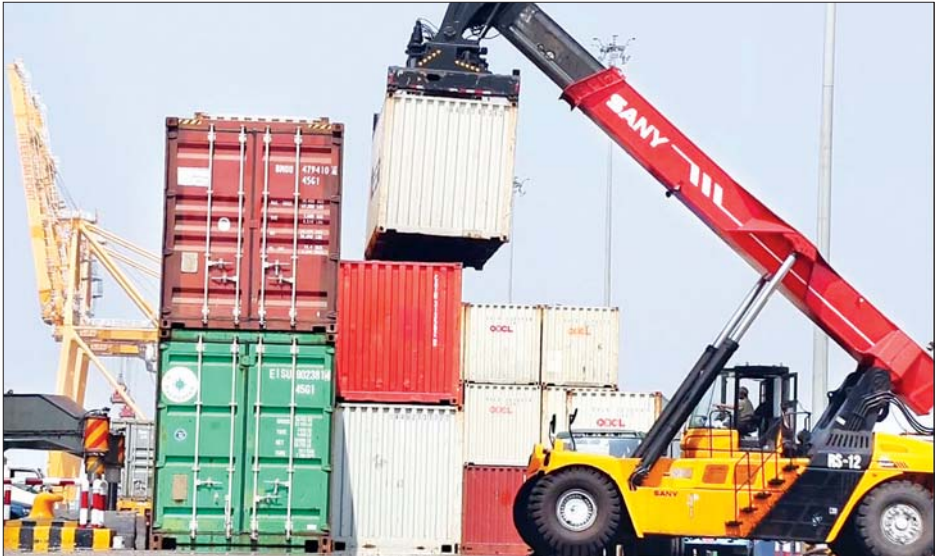
ကွန်တိန်နာဆိပ်ကမ်း၌ ကွန်တိန်နာများကို သယ်ဆောင်နေစဉ်။

သိရှိရသည်။ ပြည်ပပို့ကုန်များ ဖြစ်သည့် ဆန်၊ ပဲ၊ ပြောင်း၊ နှမ်း စသည့် ပြည်ပပို့ကုန်တင်ပို့ခြင်း လုပ်ငန်းများကိုလည်း နေ့ည မပြတ် ဆောင်ရွက်လျက်ရှိ ကြောင်း သိရသည်။ ရောင်းဝယ်ဖောက်ကားလျက်ရှိ CDM ပါဝင်လှုပ်ရှားသူများနှင့် အဖျက်အမှောင့်များ လုပ်ကိုင် လုပ်ဆောင်နေသူ လူတစ်စုက နိုင်ငံတစ်ဝန်းလုံး မြို့နယ်အသီး သီးရှိ ဈေးများ၊ စတိုးဆိုင်ခန်း များ၊ ဘဏ်များ ပိတ်ထားကြောင်း ကောလာဟလ သတင်းများ ထုတ်လွှင့်လျက်ရှိသည်။ ထိုသို့ ကောလာဟလ သတင်းများ ထွက်ပေါ်ခဲ့သော်လည်း နိုင်ငံ တစ်ဝန်းလုံး မြို့နယ်အသီးသီးရှိ ဈေးများ၊ စတိုးဆိုင်ခန်းများမှာ မိမိတို့၏ မိသားစုစားဝတ်နေရေး အတွက် ပုံမှန်အတိုင်း အေးချမ်း စွာ ရောင်းဝယ်ဖောက်ကားလျက် ရှိကြသည်။ ထို့ပြင် မြန်မာ့စီးပွားရေး ဘဏ်များနှင့် ဘဏ်ခွဲများတွင် ပင်စင်လာရောက် ထုတ်ယူကြ မည့် အငြိမ်းစားဝန်ထမ်းများ လွယ်ကူချောမွေ့စွာ ထုတ်ယူ နိုင်စေရန်အတွက် သက်ဆိုင်ရာ ဘဏ်များ၌ လုံခြုံရေးများဖြင့် ဆောင်ရွက်ပေးလျက်ရှိပြီး နိုင်ငံ ဝန်ထမ်းများ၏ လုပ်ခလစာ ထုတ်ယူရက် ဖြစ်သဖြင့် အငြိမ်းစား ဝန်ထမ်းများအပြင် နိုင်ငံဝန်ထမ်းများပါ သက်ဆိုင်ရာ ဘဏ်အသီးသီး၌ ၎င်းတို့၏လုပ်ခ လစာများ အဆင်ပြေချောမွေ့စွာ လာရောက်ထုတ်ယူခဲ့ကြကြောင်း သတင်းရရှိသည်။