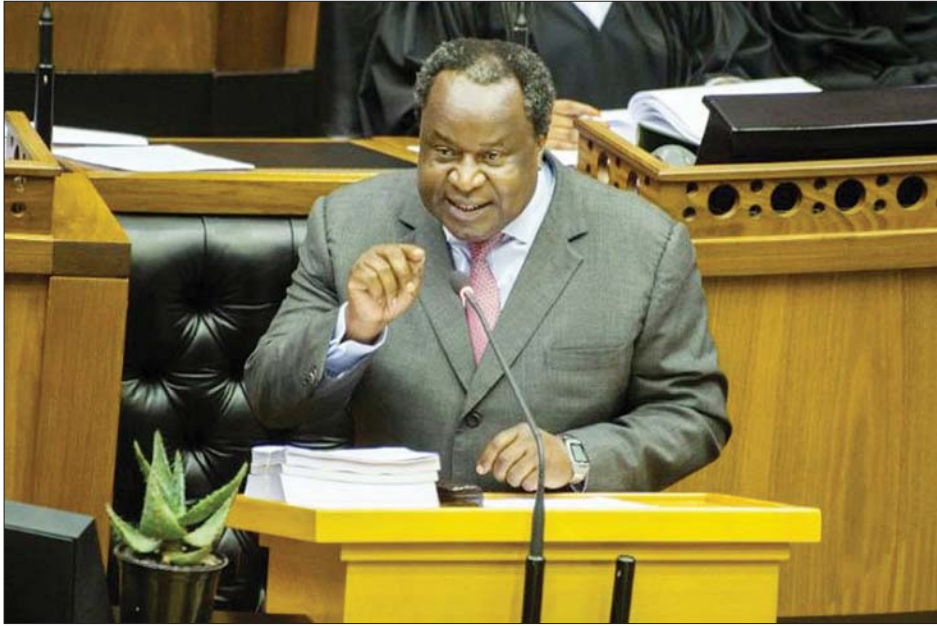
တောင်အာဖရိက ဘဏ္ဍာရေးဝန်ကြီး တီတိုဘိုဝီနီ

တောင်အာဖရိကအစိုးရဟာ ဖေဖော်ဝါရီ ၂၄ ရက် က ကိုဗစ်-၁၉ ကာကွယ်ဆေးဝယ်ယူဖို့ အမေရိကန် ဒေါ်လာ ၆၈၈ သန်း ခွဲဝေသုံးစွဲဖို့ စီစဉ်ခဲ့တယ်လို့ ကြေညာခဲ့ပါတယ်။ ပြီးတော့ လူငယ်တွေ အလုပ်အကိုင်ရရှိဖို့အတွက်လည်း အမေရိကန် ဒေါ်လာ ၇၅၆ သန်းကို ရင်းနှီးသွားမယ်လို့ လွှတ်တော်ကိုပြောတဲ့ ၂၀၂၁ ဘဏ္ဍာငွေသုံးစွဲရေး ဆိုင်ရာ နှစ်စဉ်အမျိုးသားဘတ်ဂျက်မိန့်ခွန်းမှာ ဘဏ္ဍာရေးဝန်ကြီး တီတိုဘိုဝီနီက ပြောကြားခဲ့ပါတယ်။ ဒါဟာ ကိုဗစ်-၁၉ ကြောင့် အထိနာနေတဲ့ နိုင်ငံရဲ့ စီးပွားရေးကို ပြန်လည်ကျားကန်ရာမှာ ကောင်းမွန်တဲ့လုပ်ဆောင်ချက် ဖြစ်ပါတယ်။