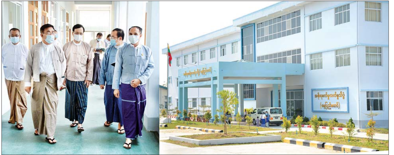
ပြည်ထောင်စုဝန်ကြီး ဒေါက်တာညွန့်ဖေ အစိုးရစက်မှုလက်မှုသိပ္ပံ (နေပြည်တော်) နည်းပညာနှင့် သက်မွေးပညာသင်တန်းကျောင်းများ ပြန်လည်ဖွင့်လှစ်နိုင်ရေး ပြင်ဆင်ထားရှိမှုအခြေအနေများ ကြည့်ရှုစစ်ဆေးစဉ်။

ထို့နောက် ဆရာ ဆရာမများက မိမိတို့၏အခက်အခဲများနှင့်