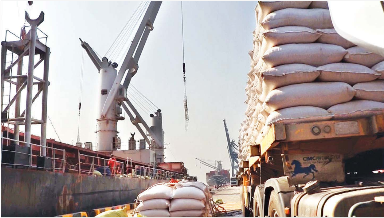
ပြည်ပသို့တင်ပို့မည့် ဆန်များကို သင်္ဘောပေါ်သို့ တင်ဆောင်နေစဉ်။

နေပြည်တော် ဖေဖော်ဝါရီ ၂၆ ရန်ကုန်မြို့ရှိ သီလဝါဆိပ်ကမ်း ဒေသတွင် စက်သုံးဆီ တင်ချ ပြုလုပ်နိုင်သည့် ဆိပ်ခံတံတား စုစုပေါင်း ခြောက်စင်းရှိပြီး အဆိုပါ ဆိပ်ခံတံတားများရှိ သို့လှောင်ကန်များတွင် ဒီဇယ်ဆီ ဂါလန်သန်းပေါင်း ၆၁၀ ဒသမ ငြိမ်နှင့် ဓာတ်ဆီဂါလန်သန်းပေါင်း ၈၃ ဒသမ ၇၀၀ တို့ကို ထိန်းသိမ်းထားနိုင်သည်။