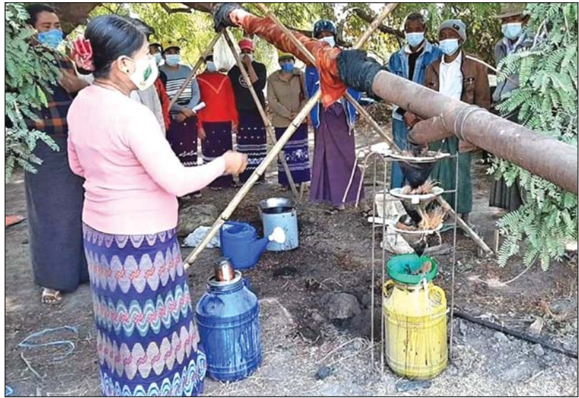
စပါးခွဲပေါင်းခံရည်ထုတ်လုပ်မှုကို တောင်သူများအား လက်တွေ့ ပညာပေးပြသစဉ်