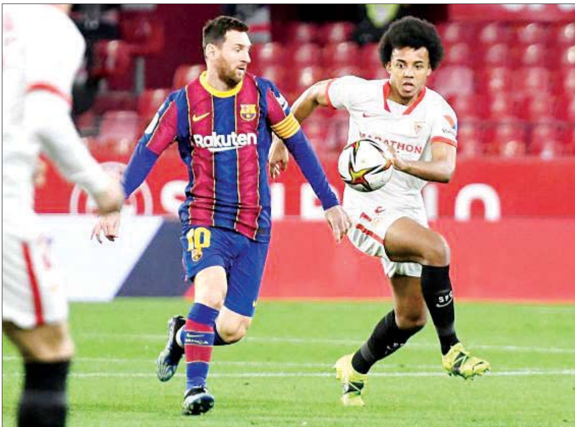
ကိုပါဒယ်ရေးဖလားပြိုင်ပွဲတွင် ဆီဗီလာနှင့် ဘာစီလိုနာအသင်းတို့ ယှဉ်ပြိုင်ကစားစဉ်။

ယခုတစ်ပတ် စနေနေ့ လာလီဂါ (၂၅) မှာတော့ တန်းဆင်းစုအထက်နား ရပ်တည်နေတဲ့ အီဘာ၊ ဘာစီလိုနာ၊ ဆီဗီလာစတဲ့အသင်းတွေ ပါဝင်နေတာကြောင့် စိတ်ဝင်စားဖို့ ကောင်းနေပါတယ်။ အီဘာက အမှတ်ပေးဇယား အောက်ဆုံးမှာရပ်တည်နေတဲ့ ဟူစကာ၊ အဆင့် (၃) နေရာက ဘာစီလိုနာနဲ့ အဆင့် (၄) နေရာက ဆီဗီလာအသင်းတို့ ဆုံတွေ့နေတာကြောင့် ဘယ်အသင်းက ရလဒ်ကောင်းပိုင်ဆိုင်သွားမလဲ စောင့်ကြည့်ရမှာ ဖြစ်ပါတယ်။