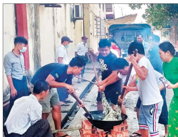
သတင်းနှင့်စာနယ်ဇင်းလုပ်ငန်း(ရန်ကုန်)မိသားစုဝင်များ စုပေါင်း ထမနဲထိုးပြိုင်ပွဲ ကျင်းပနေစဉ်။

ရန်ကုန် ဖေဖော်ဝါရီ ၂၆ ပြန်ကြားရေးဝန်ကြီးဌာန သတင်းနှင့်စာနယ်ဇင်းလုပ်ငန်းအောက်ရှိ သတင်းနှင့်စာနယ်ဇင်းလုပ်ငန်း (ရန်ကုန်)၊ ကြေးမုံသတင်းစာတိုက်နှင့် မြန်မာ့အလင်းသတင်းစာတိုက် ဝန်ထမ်းမိသားစုများသည် ဖေဖော်ဝါရီ ၂၆ ရက် (တပို့တွဲလပြည့်နေ့) မွန်းလွဲပိုင်းတွင် စုပေါင်းထမနဲထိုးပြိုင်ပွဲကို ဗဟန်းမြို့နယ်အတွင်းရှိ မြန်မာ့အလင်းသတင်းစာတိုက်၌ ကျင်းပသည်။