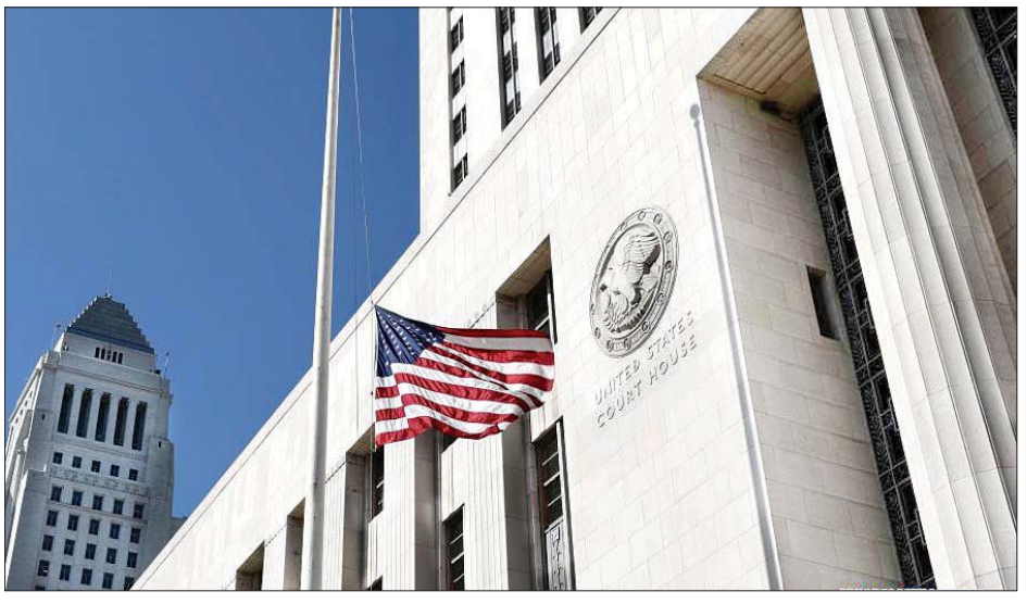
အမေရိကန်ပြည်ထောင်စု ကယ်လီဖိုးနီးယားပြည်နယ် လော့စ်အိန်ဂျလိစ်ရှိ မြို့တော်ခန်းမရှေ့တွင် အမေရိကန်အလံကို တိုင်တစ်ဝက်လွင့်ထူထားသည်ကိုတွေ့ရစဉ်။