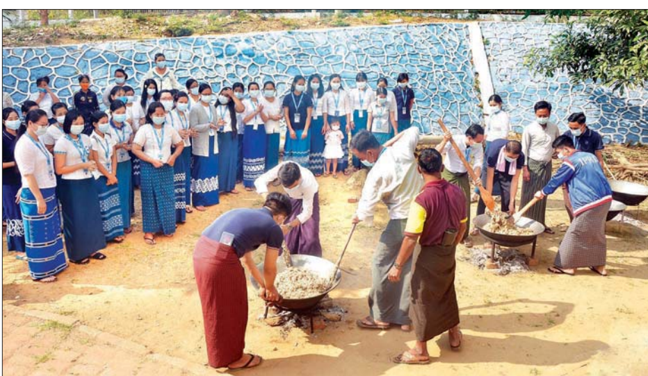
ကျောင်းများသို့ လှူဒါန်းဆက်ကပ် ဝေငှပေးခြင်းတို့ကို စုပေါင်း ခွဲကြောင်း သတင်းရရှိသည်။

နေပြည်တော် ဖေဖော်ဝါရီ ၂၆ ပြန်ကြားရေးနှင့်ပြည်သူ့ဆက်ဆံရေးဦးစီးဌာနသည် ဝန်ထမ်းများအချင်းချင်း၊ ချစ်ခင်စည်းလုံးမှု၊ တစ်ဦးအပေါ်တစ်ဦး နားလည်မှုနှင့် ပူးပေါင်းဆောင်ရွက်မှုများ ပိုမိုဖြစ်ပေါ်စေရေးအတွက် မြန်မာ့ရိုးရာ ထမနဲထိုးပွဲများကို နှစ်စဉ် ကျင်းပခဲ့ရာ ဖေဖော်ဝါရီ ၂၆ ရက် (တပို့တွဲလပြည့်နေ့) တွင် ရိုးရာမပျက် ထမနဲထိုးပွဲကျင်းပ၍ ပျော်ရွှင်ကြည်နူးလျက်ရှိသည်။