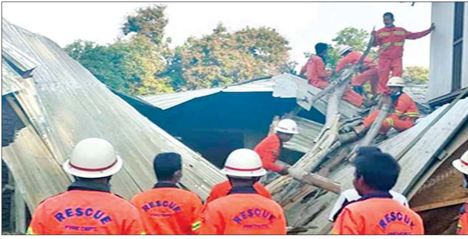
ရဲပြန်ကြား

နေပြည်တော် ဖေဖော်ဝါရီ ၂၆ မန္တလေးတိုင်း ဒေသကြီး ညောင်ဦးမြို့ (၅)ရပ်ကွက် ညောင်ဦး - ပုဂံကားလမ်းဘေးရှိ နှစ် ၁၀၀ သက်တမ်းခန့်ရှိ ညောင်ပင်သည် ဖေဖော်ဝါရီ ၂၅ ရက် နံနက် ၆ နာရီက ကျိုးကျပ်မိမှုကြောင့် နေအိမ် တစ်လုံး အမိုးပျက်စီး ဆုံးရှုံးခဲ့ ကြောင်း သိရသည်။