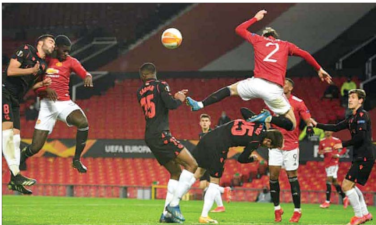
မန်ယူအသင်းမှ တွန်ဇမ်ဘီ ဆိုစီဒက်အသင်းဘက်သို့ ခေါင်းတိုက်ရိုးသွင်းယူရန် ကြိုးပမ်းစဉ်။