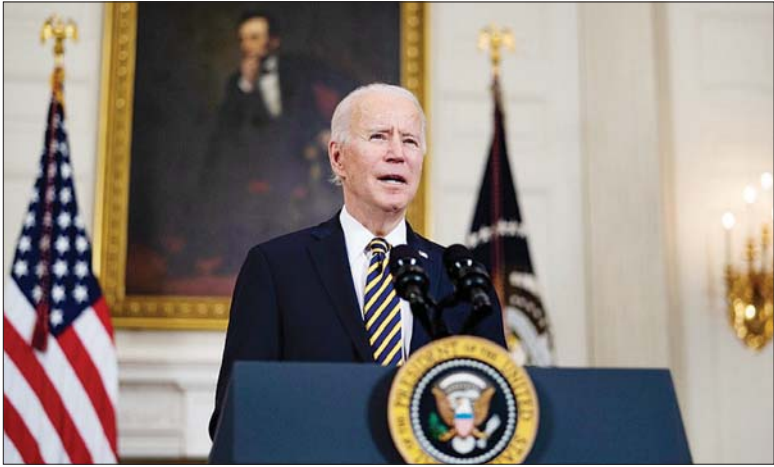
အမေရိကန်သမ္မတ ဂျိုးဘိုင်ဒင်။