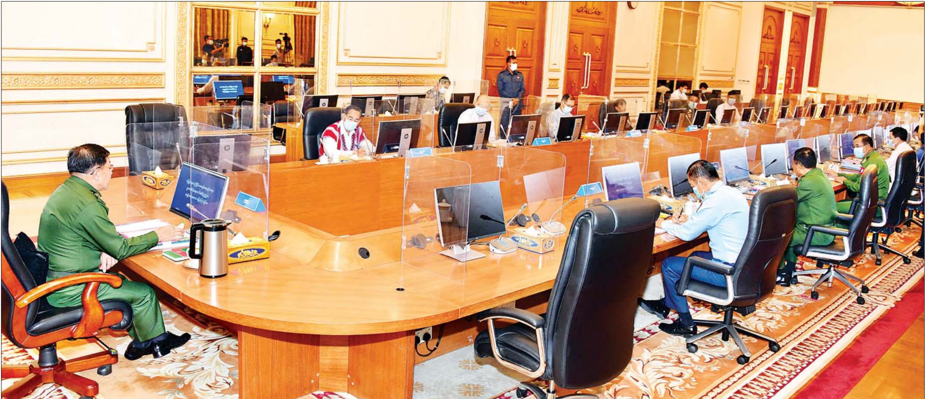
လုံခြုံရေး၊ တည်ငြိမ်အေးချမ်းရေးနှင့် တရားဥပဒေစိုးမိုးရေးကော်မတီဥက္ကဋ္ဌ၊ နိုင်ငံတော်စီမံအုပ်ချုပ်ရေးကောင်စီဥက္ကဋ္ဌ၊ တပ်မတော်ကာကွယ်ရေးဦးစီးချုပ် ဗိုလ်ချုပ်မှူးကြီး မင်းအောင်လှိုင် လုံခြုံရေး၊ တည်ငြိမ်အေးချမ်းရေးနှင့် တရားဥပဒေစိုးမိုးရေးကော်မတီ (၁/၂၀၂၁) အစည်းအဝေးတွင် အမှာစကားပြောကြားစဉ်။

၁၃၈၂ ခုနှစ်၊ တပို့တွဲလဆန်း ၁၅ ရက် (၂၀၂၁ ခုနှစ်၊ ဖေဖော်ဝါရီလ ၂၆ ရက်) Coronavirus Disease 2019 (COVID-19) ရောဂါပိုး ကူးစက်ပျံ့နှံ့မှုကို ဆက်လက်ထိန်းချုပ် ဆောင်ရွက်ရန် လိုအပ်ပါသဖြင့် ပြည်ထောင်စုအဆင့်အဖွဲ့အစည်းများ၊ ပြည်ထောင်စုဝန်ကြီးဌာနများမှ Coronavirus Disease 2019 (COVID-19) ကာကွယ်၊ ထိန်းချုပ်၊ တားဆီးရေးအတွက် ၂၀၂၁ ခုနှစ်၊ ဖေဖော်ဝါရီလ ၂၈ ရက်နေ့အထိ ထုတ်ပြန်ထားသော ပြည်သူ့သို့ ပန်ကြားချက်၊ အမိန့်၊ အမိန့်ကြော်ငြာစာ၊ ညွှန်ကြားချက်များ(ဖြေလျှော့ပေးထားသည့်ကိစ္စရပ်များမပါ) အား ၂၀၂၁ ခုနှစ်၊ မတ်လ ၃၁ ရက်နေ့အထိ ရက်တိုးမြှင့် သတ်မှတ်ဆောင်ရွက်ထားပါကြောင်း အသိပေးကြေညာအပ်ပါသည်။