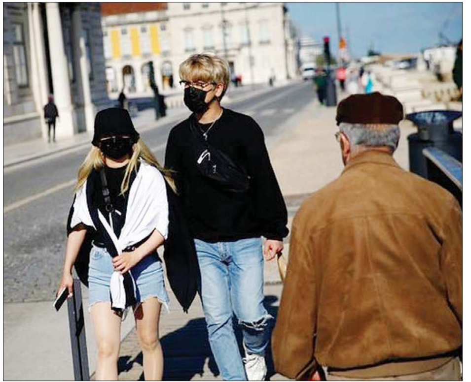
လစ္စဘွန်းမြို့တွင် ပါးစပ်နှာခေါင်းစည်း တပ်ဆင်ကာ သွားလာနေကြသူများကို တွေ့ရစဉ်။

ပေါ်တူဂီနိုင်ငံအတွင်း မကြာ သေးမီရက်များအတွင်း ကူးစက်မှု