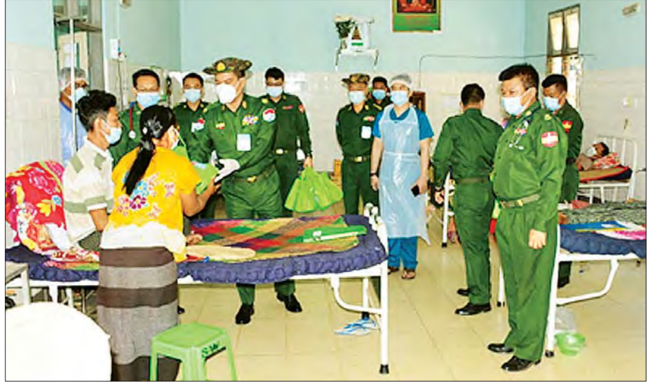
ထားဝယ်မြို့ တပ်မတော်ဆေးရုံတွင် တက်ရောက်ဆေးကုသမှု ခံယူနေသည့် ဒေသခံပြည်သူများအား ကမ်းရိုးတန်း ဒေသ တိုင်းစစ်ဌာနချုပ် တိုင်းမှူး ဗိုလ်ချုပ် စောသန်းလှိုင်က စားသောက်ဖွယ်ရာများ ပေးအပ်စဉ်။