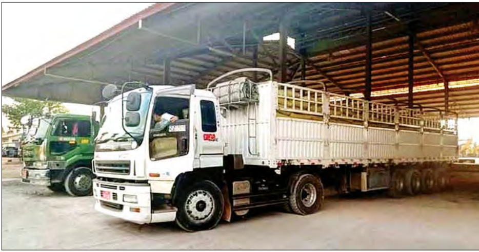
မြဝတီကုန်သွယ်ရေးဇုန်မှ ထွက်ခွာမည့် ပို့ကုန်ယာဉ်များကို တွေ့ရစဉ်။

ယခုအချိန်တွင် ထိုင်းနိုင်ငံဘက်မှ အကောက်ခွန် သက်သာခွင့် ကန့်သတ်ထားသော ကြက်သွန်နီမှ လွဲ၍ ကျန်ပို့ကုန်အမယ်များအတွက် အကောက်ခွန်သက်သာခွင့် ရရှိနိုင်မည့် Form-D ကို ၂၀၂၁ ခုနှစ် ဇန်နဝါရီ ၁ ရက်မှစ၍ Electronic Data Exchange စနစ် အသုံးပြု၍ e-ATIGA Form-D အဖြစ် ပြောင်းလဲအသုံးပြုထုတ်ပေးလျက် ရှိကြောင်း၊ သို့ရာတွင် ဖေဖော်ဝါရီ ၇ ရက်က မြန်မာနိုင်ငံသို့ နည်းပညာပိုင်းဆိုင်ရာ ချွတ်ယွင်းမှုနှင့် အင်တာနက်လိုင်းများ ချွတ်ယွင်းမှုတို့ကြောင့် e-ATIGA Form-D အစား Manual Sign ဖြင့် Manual Form-D ၅၁ စောင် ထုတ်ပေးခဲ့ကြောင်း သိရသည်။