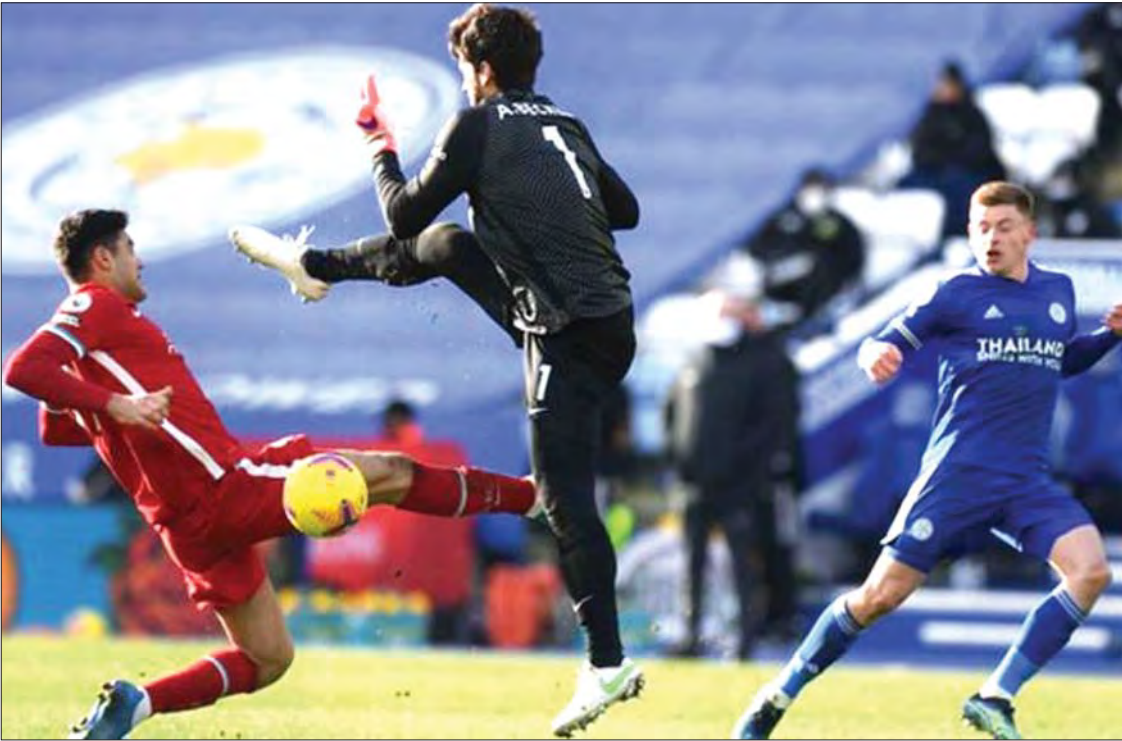
လက်စတာနှင့် လီဗာပူးတို့ ယှဉ်ပြိုင်ကစားစဉ်။