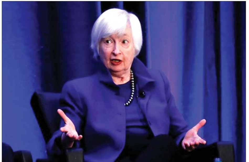
အမေရိကန်ဘဏ္ဍာရေးဝန်ကြီး ဂျက်ဆင်လန်။