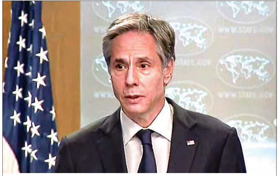
အမေရိကန်နိုင်ငံခြားရေးဝန်ကြီး အန်တိုနီဘလင်ကလင်။