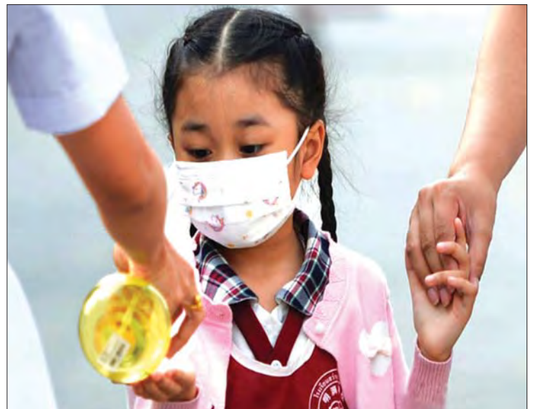
ထိုင်းနိုင်ငံတွင် စာသင်ကျောင်းအတွင်းသို့ ဝင်ရောက်လာသော ကျောင်းသူတစ်ဦးအား ကိုဗစ်-၁၉ ကာကွယ်ဆေးအတွက် လက်ဆေးပေးနေသည်ကို တွေ့ရစဉ်။

ထို့အပြင် ကိုဗစ်-၁၉ ကူးစက်မှုမပြန်လည်ကောင်းမွန်လာသူပေါင်း ၂၁၁၈၀ ရှိလာခဲ့ပြီ ဖြစ်သည်။ ဆင်ယွာ