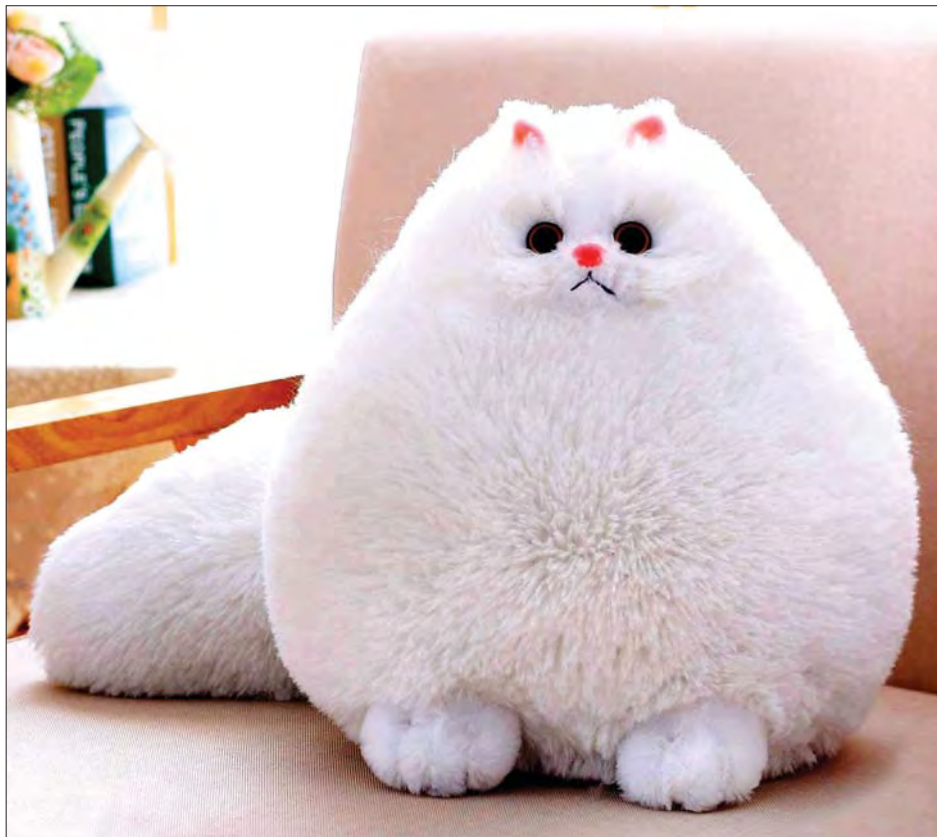
တယ်လို့ သမိုင်းမှတ်တမ်းတွေအရ သိရှိရပါတယ်။

လွန်ခဲ့တဲ့နှစ်သန်းပေါင်း ၃၀ ကျော်ကတည်းက ကြောင်ကလေးတွေရှိကြပြီး ကြောင်ကလေးတွေရဲ့ မျိုးရိုးက ကျားတွေ၊ ခြင်္သေ့တွေ ဖြစ်ပါသတဲ့။ သူတို့ဟာ မိရာဆစ်လို့ခေါ်တဲ့ အသားစားသတ္တဝါမျိုးနွယ်ဖြစ်ပြီး အခုအချိန်အထိ တောကြောင်းရှင်းတွေလည်း ရှိနေပါသေးတယ်။ ဟိုးရှေးရှေးတုန်းကတည်းက ကြောင်ကလေးတွေကို အိမ်မွေးတိရစ္ဆာန်အဖြစ် မွေးမြူခဲ့ကြပြီး အိမ်ပြည်မှာဆိုရင် ကြောင်တစ်ကောင်ကို သတ်မိသွားရင် သေဒဏ်တောင်ပေးခဲ့ကြ