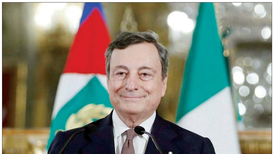
အီတလီဝန်ကြီးချုပ်အဖြစ် ရွေးချယ်ထားသူ မာရီယို။