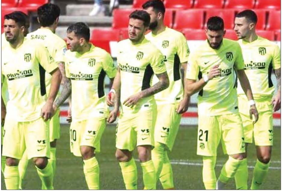
အက်သလက်တီကို မက်ဒရစ် ကစားသမားများ။