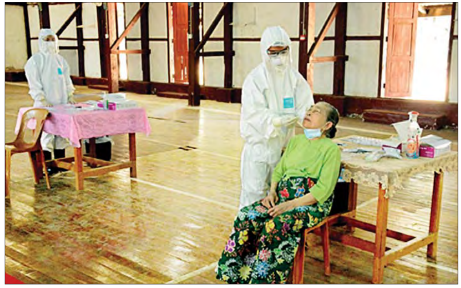
ထားဝယ်မြို့၌ ခရီးသွားပြည်သူတစ်ဦးအား ကျန်းမာရေးစစ်ဆေးဆောင်ရွက်ပေးစဉ်။

များကို တပ်မတော်ဆေးတပ်ဖွဲ့ဝင် များက ဖေဖော်ဝါရီ ၁၀ ရက်မှစတင် ၍ ကူညီစစ်ဆေးပေးခြင်း၊ COVID-19 ရောဂါပိုးမတွေ့ရှိသူများကို ဆေးစစ် ချက်ထောက်ခံစာ ထုတ်ပေးခြင်းများ ဆောင်ရွက်ပေးလျက် ရှိကြောင်း နှင့် တိုင်းရင်းသားပြည်သူများ၏ ကျန်းမာရေးဆိုင်ရာ အခက်အခဲများ ကို တစ်ထောင့်တစ်နေရာမှ အထောက်အကူပြုစေရန်အတွက် မြို့နယ်အသီးသီးရှိ တပ်မတော်ဆေးရုံ များ၌လည်း ယာယီကုသရေးဆေးရုံ များဖွင့်လှစ်၍ ကျန်းမာရေး စောင့် ရောက်မှုများကို နေ့စဉ်ဆောင်ရွက် ပေးလျက်ရှိကြောင်း တပ်မတော် ကာကွယ်ရေးဦးစီးချုပ်ရုံး၏ သတင်း ထုတ်ပြန်ချက်အရ သိရသည်။ သတင်းစဉ်