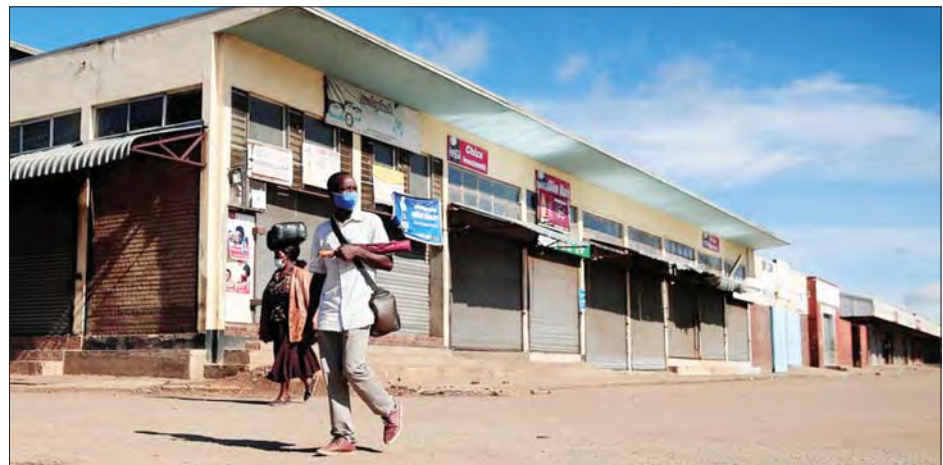
ဇင်ဘာဘွေနိုင်ငံတွင် အသွားအလာပိတ်ဆို့ကန့်သတ်ထားစဉ်အတွင်း ပါးစပ်၊ နှာခေါင်းစည်းတပ်ဆင်ကာ သွားလာနေသူ တစ်ဦးကို တွေ့ရစဉ်။