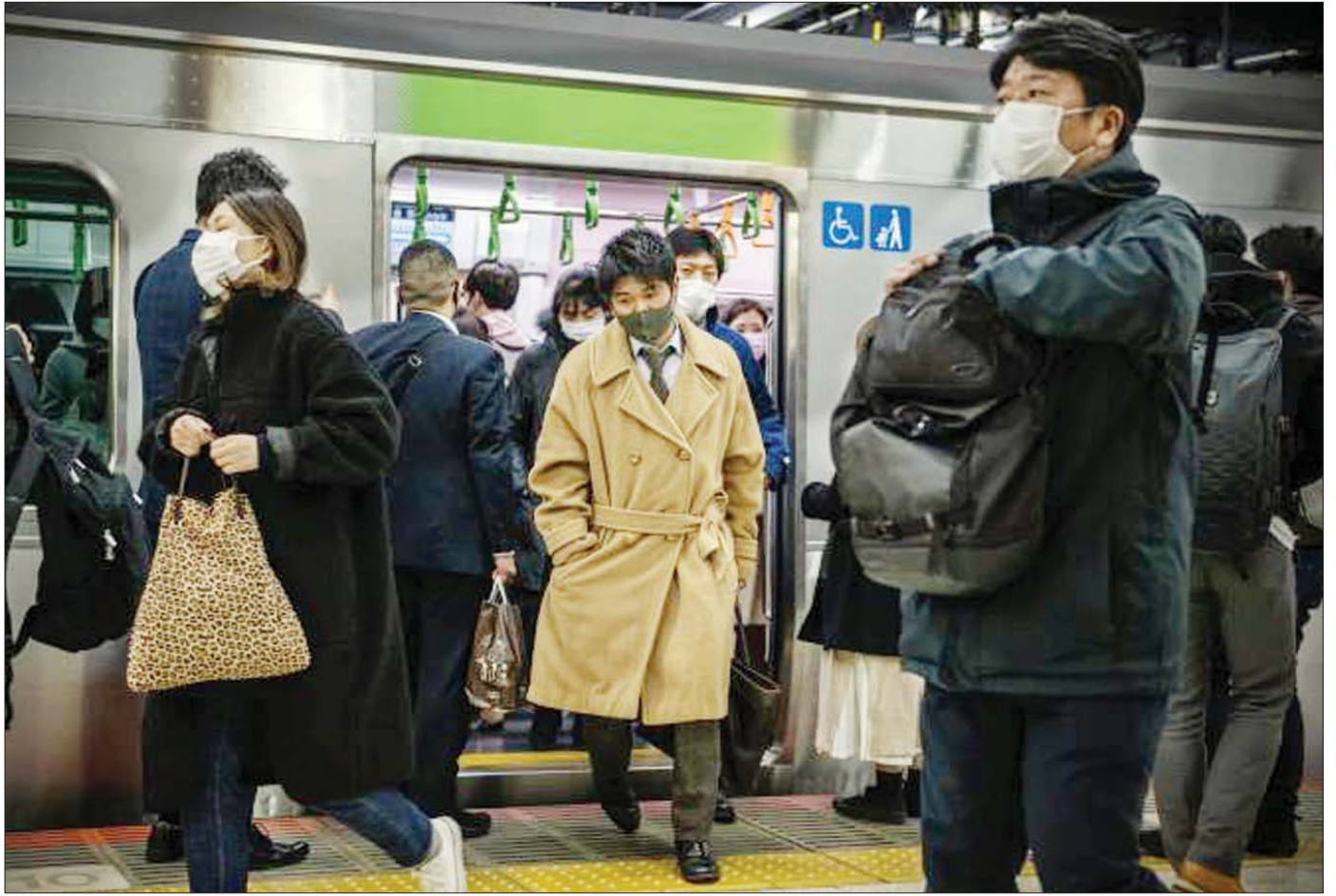
ဂျပန်နိုင်ငံတွင် ပါးစပ်၊ နှာခေါင်းစည်းတပ်ဆင်ထားသော ပြည်သူများ အများပြည်သူသုံးရထားစီးနင်းမှုကို တွေ့ရစဉ်။