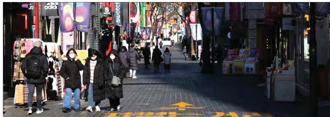
တောင်ကိုရီးယားတွင် ပြည်သူများ ပါးစပ်နှာခေါင်းစည်းဝတ်ဆင်ပြီး ဆိုးလ်မြို့ ဈေးလမ်းတစ်ခု၌ ဖြတ်သန်းသွားလာနေသည်ကို တွေ့ရစဉ်။