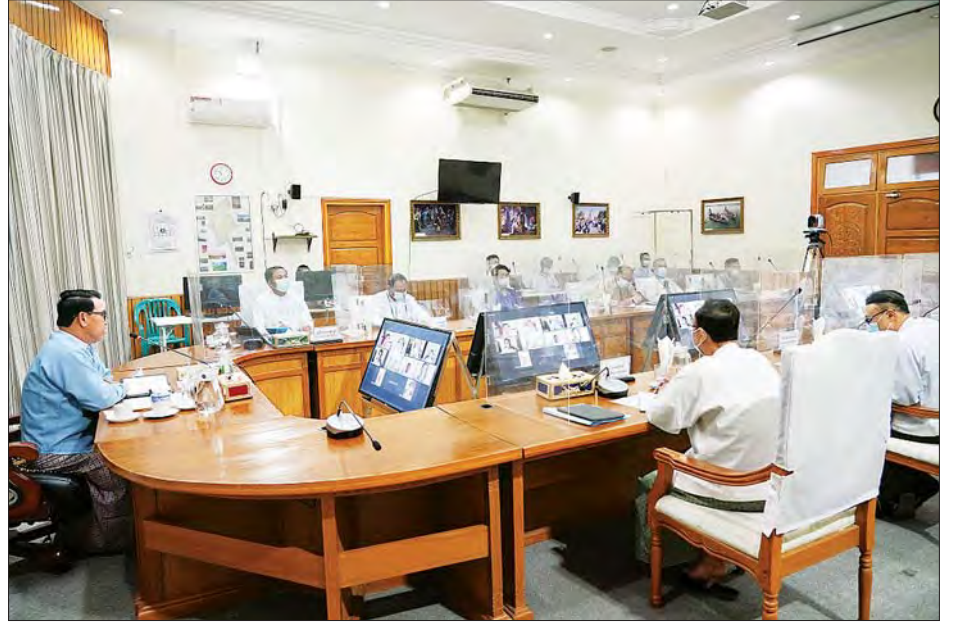
ပြည်ထောင်စုဝန်ကြီး ဦးမောင်မောင်အုန်း မြန်မာနိုင်ငံ ခရီးသွားလုပ်ငန်းအဖွဲ့ချုပ်နှင့် ညီနောင်အသင်းများမှ ဥက္ကဋ္ဌများနှင့် အတွင်းရေးမှူးများအား ဗီဒီယိုကွန်ဖရင့်စနစ်ဖြင့် တွေ့ဆုံစဉ်။