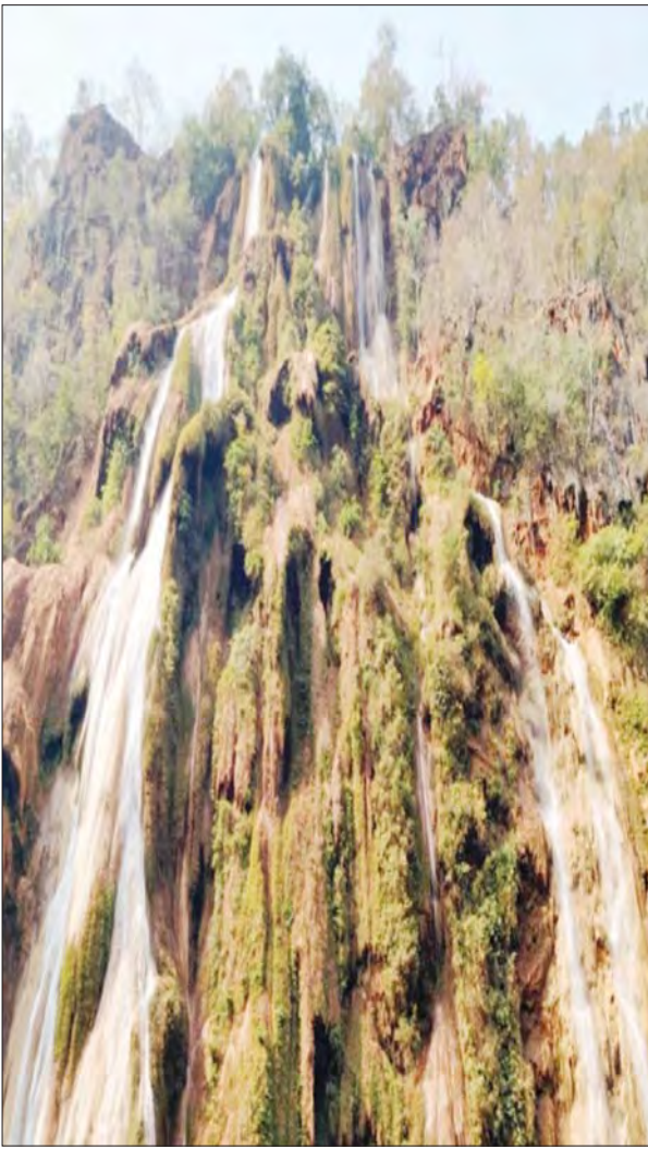
လွှဲပုတ်ရေတံခွန်။

လွှဲပုတ်ရေတံခွန်ဟာ တောင်ခြေကနေပြီးအပေါ်ကို မိနစ်အနည်းငယ်ခန့်