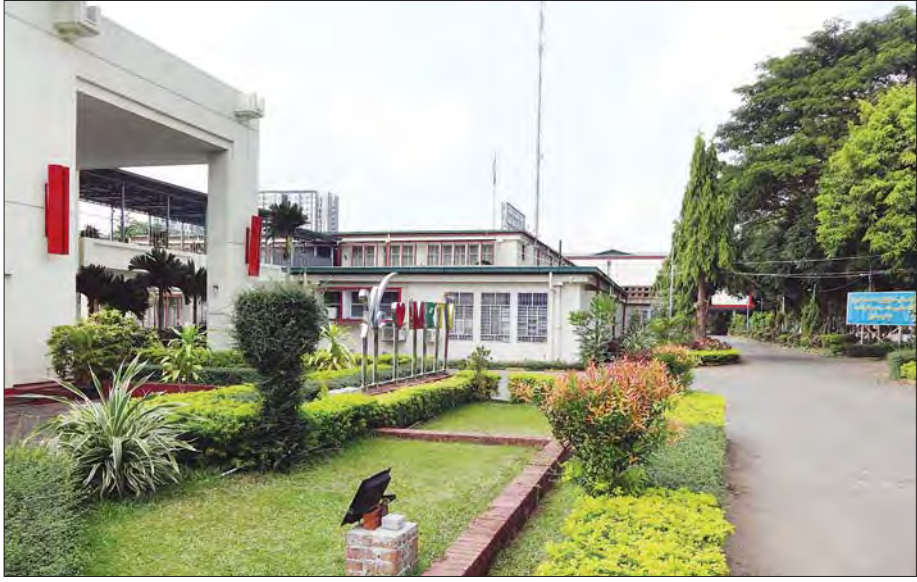
ရန်ကုန်မြို့ရှိ မြန်မာ့အသံနှင့် ရုပ်မြင်သံကြား။

“ကမ္ဘာတစ်ဝန်းမှာ ကူးစက်ပျံ့နှံ့ဖြစ်ပွားခဲ့တဲ့ ကိုဗစ်- ၁၉ ကပ်ရောဂါဟာ မြန်မာနိုင်ငံမှာလည်း ၂၀၂၀ ပြည့်နှစ် မတ်လမှစပြီး ဖြစ်ပွားမှုနဲ့အတူ သွားလာနေထိုင်မှု ကန့်သတ်ချက်တွေ ပြုလုပ်ခဲ့ရပါတယ်။ အဲဒီစိန်ခေါ်မှုတွေကြားက ကိုဗစ်- ၁၉ ဆိုင်ရာ သတင်းအချက်အလက်နဲ့ ပညာပေးအစီအစဉ်တွေ၊ ဖျော်ဖြေရေးအစီအစဉ်တွေအပြင် သင်္ကြန်တွင်းကာလမှာ သင်္ကြန်ရင်ခုန်သံ ဖျော်ဖြေရေးအစီအစဉ်၊ ၂၀၂၀ ပြည့်နှစ် ပါတီစုံဒီမိုကရေစီအထွေထွေ ရွေးကောက်ပွဲ အောင်မြင်စွာကျင်းပနိုင်ရေးအတွက် သတင်းအချက်အလက်၊ အသိပညာ ပေးမှုနဲ့ ဖျော်ဖြေရေးအစီအစဉ်တွေ၊ ၂၀၂၀ ပြည့်နှစ်မှာပဲ တိုက်ဆိုင်စွာကျရောက်လာတဲ့ မြန်မာ့ရုပ်ရှင်ပြည့်သဘင်နှင့် ရန်ကုန်တက္ကသိုလ် ရာပြည့်သဘင် အထိမ်းအမှတ်အခမ်း အနားကြီးတွေအတွက် မူလအစီအစဉ်တွေအပြင် အစီအစဉ်မျိုးစုံဖြင့် တိုးမြှင့်ထုတ်လွှင့် နိုင်ခဲ့ပါတယ်”