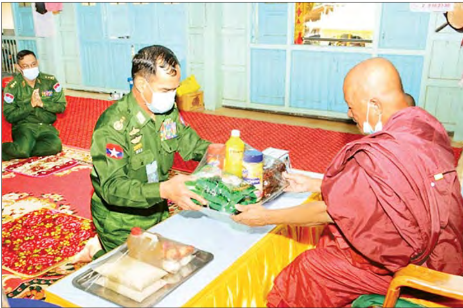
နေပြည်တော် ဖေဖော်ဝါရီ ၁၀

COVID-19 ကူးစက်ရောဂါ ကာကွယ်ထိန်းချုပ်ရေးကာလတွင် ဘုန်းတော်ကြီးကျောင်းများနှင့် သီလရှင်ကျောင်းများတွင် ဆွမ်းကိစ္စများ အဆင်ပြေစေရန်အတွက် တိုင်းစစ်ဌာနချုပ်များအလိုက် လှူဒါန်းလျက်ရှိသည်။