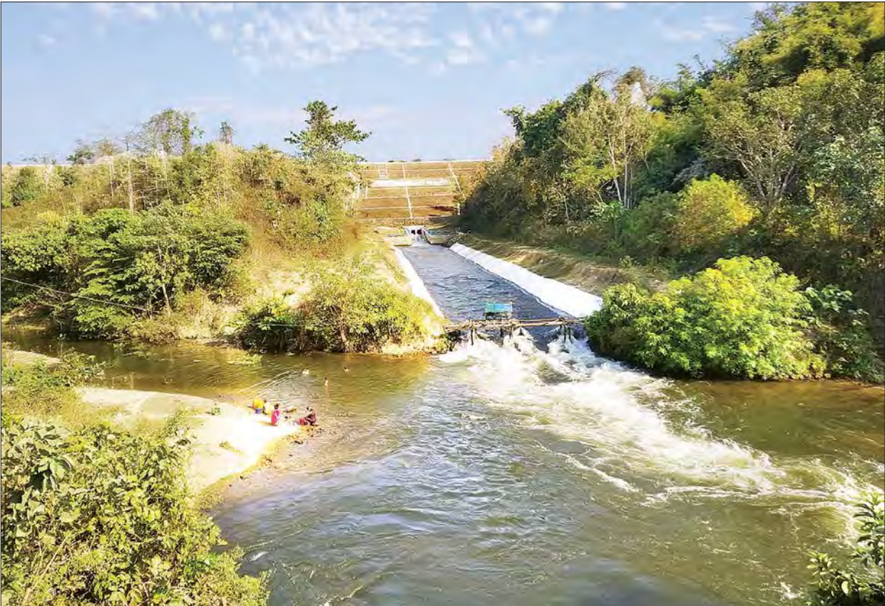
တဘူးလှဆည် သဘာဝအလှနှင့် ရေပေးမြောင်းကို တွေ့ရစဉ်။