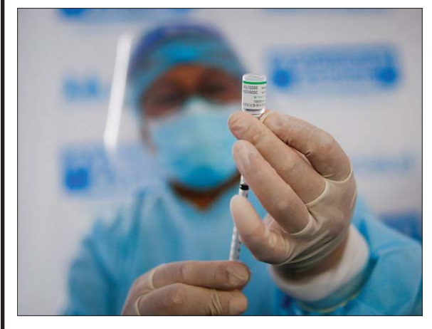
ကိုဗစ်-၁၉ ကာကွယ်ဆေးထိုးပေးရန် လုပ်ဆောင်နေသည်ကို တွေ့ရစဉ်။

ဆော်ပေါလို ဖေဖော်ဝါရီ ၁၀ ဘရာဇီးနိုင်ငံတွင် လွန်ခဲ့သော ၂၄ နာရီအတွင်း ကိုဗစ်-၁၉ ကြောင့် သေဆုံးသူ ၁၃၅၀ ရှိကြောင်း မှတ်တမ်းတင်ဖော်ပြမှုနှင့်အတူ နိုင်ငံအတွင်း စုစုပေါင်းသေဆုံးသူဦးရေသည် ၂၃၃၅၀ ရှိလာပြီ ဖြစ်သည်။ ကျန်းမာရေးဝန်ကြီးဌာန၏ ထုတ်ပြန်ဖော်ပြချက်အရ လွန်ခဲ့သော ၂၄ နာရီအတွင်းက ကိုဗစ်-၁၉ ထပ်မံကူးစက်ဖြစ်ပွားသူ ၅၀၄၈၆ ဦး တိုးလာ မှုနှင့်အတူ စုစုပေါင်းနိုင်ငံအတွင်း ကိုဗစ်-၁၉ ကူးစက်ဖြစ်ပွားသူသည် ၉၅၉၉၅၆၅ ဦးအထိ ရောက်ရှိလာခဲ့သည်။ ကိုရိုနာဗိုက်ကာကွယ်ဆေးနှင့် အက်စ်ထရပ်ဇီကာ ကာကွယ်ဆေးများ ကို အရေးပေါ်သုံးစွဲခွင့်ပြုလိုက်ပြီးနောက် လူပေါင်း လေးသန်းကျော်ကို ကာကွယ်ဆေးထိုးပေးခဲ့ပြီးဖြစ်ကြောင်း အစိုးရက ပြောကြားလိုက်သည်။ ဘရာဇီးဒေသခံ တိုင်းရင်းသားလူဦးရေ ၅၁ ရာခိုင်နှုန်းတို့ကို ကာကွယ်ဆေး ထိုးပေးပြီးဖြစ်ကြောင်း အစိုးရက ပြောကြားလိုက်သည်။ ဆော်ပေါလိုပြည်နယ်သည် ကိုဗစ်-၁၉ ကပ်ရောဂါကူးစက်ဖြစ်ပွားမှု အများဆုံးနေရာတစ်ခုဖြစ်ပြီး ကိုဗစ်-၁၉ ကူးစက်ဖြစ်ပွားသူပေါင်း ၁၈၆၄၉၇၇ ဦးနှင့် စုစုပေါင်းသေဆုံးသူ ၅၅၀၈၇ ဦးရှိကြောင်း သိရသည်။ ဘရာဇီးနိုင်ငံသည် လက်တင်အမေရိကတွင် အကြီးဆုံးစီးပွားရေး တည်ရှိရာ နိုင်ငံဖြစ်ပြီး အမေရိကန်ပြည်ထောင်စုနှင့် အိန္ဒိယပြည်လျှင် ကမ္ဘာတွင် ကိုဗစ်-၁၉ ကူးစက်ဖြစ်ပွားသေဆုံးမှု ဒုတိယအများဆုံး နိုင်ငံ ဖြစ်သည်။