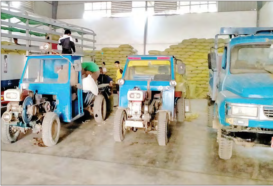
ပဲတီစိမ်းများ ဈေးကွက်ဝင်ရောက်မှုကို တွေ့ရစဉ်။

သုံးခွ ဖေဖော်ဝါရီ ၁၀ ရန်ကုန်တိုင်းဒေသကြီး သုံးခွမြို့နယ်ရှိ ပဲဈေးကွက်အတွင်းသို့ ပဲတီစိမ်းအသစ်များ စတင်ဝင်ရောက်လျက်ရှိရာ တစ်တင်း (ပိဿာ ၂၀)လျှင် ယနေ့ နံနက်ပိုင်းက ပေါက်ဈေးမှာ ငွေကျပ် ၄၃၅၀၀ ဖြစ်ကြောင်း သုံးခွမြို့ အမှတ် (၄) ရပ်ကွက်ရှိ Bright Light ပဲဈေးခုံ ရောင်းဝယ်ရေးကုမ္ပဏီမှ တာဝန်ရှိသူ တစ်ဦးက ပြောကြားသည်။