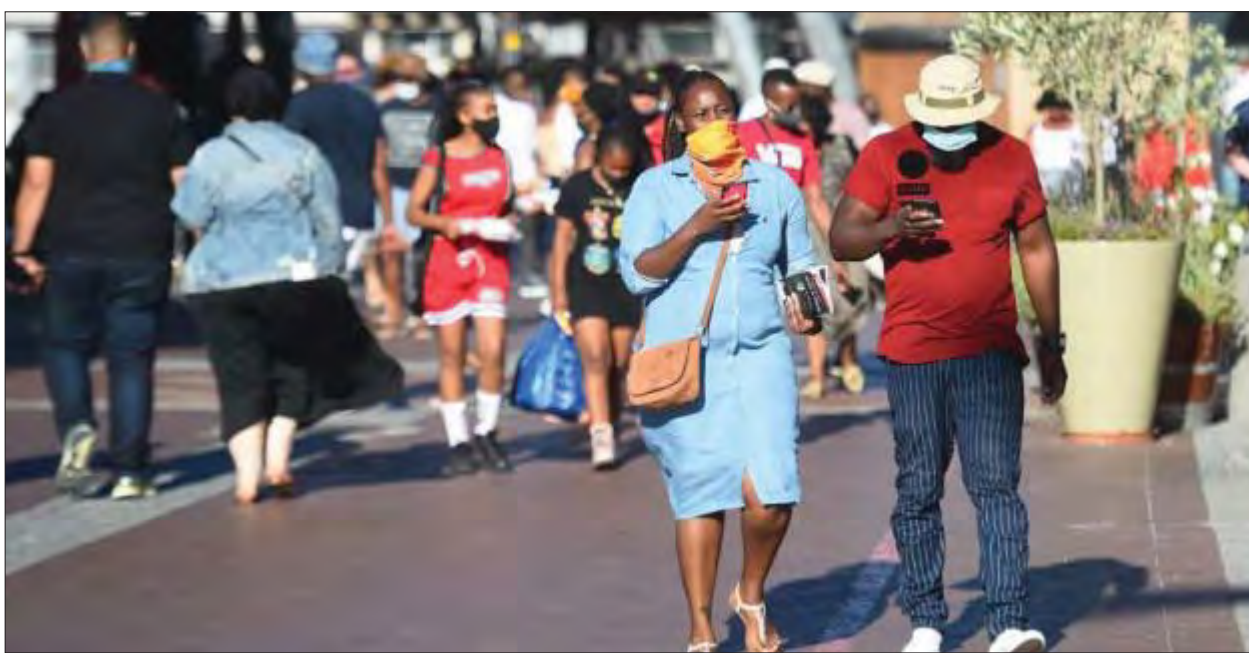
ကီရီဘီတောင်မြို့တွင် အများပြည်သူများ နှာခေါင်းစည်းတပ်ဆင်သွားလာနေသည်ကို တွေ့ရစဉ်။

ကိုဗစ်-၁၉ ကူးစက်မှုအများဆုံးမှာ အာဖရိက မြောက်ပိုင်းဖြစ်ကြောင်း အာဖရိကသမဂ္ဂ ကျန်းမာရေးစောင့် ရှောက်မှု ကော်မရှင်အဖွဲ့က ပြောကြား လိုက်သည်။ တောင်အာဖရိက နိုင်ငံသည် ကိုဗစ်-၁၉ ကူးစက်မှု အများဆုံးနိုင်ငံ တစ်နိုင်ငံဖြစ်ပြီး ၁ ဒသမ ၅ သန်းနီးပါး ကိုဗစ်-၁၉ ကူးစက်ဖြစ်ပွားလျက်ရှိကာ ၄၆၀၀၀ သေဆုံးကြောင်း သိရ သည်။ မော်ရိုကို၊ တူနီးရှား၊ အီဂျစ်နှင့် အီသီယိုးပီးယားနိုင်ငံတို့သည်လည်း အာဖရိကတိုက်တွင် ကိုဗစ်-၁၉ ကူးစက်မှု အများဆုံးဖြစ်ပွားသည့် နိုင်ငံများဖြစ်ကြောင်း အာဖရိက သမဂ္ဂ ကျန်းမာရေးစောင့်ရှောက်မှု ကော်မရှင်အဖွဲ့က ပြောကြားလိုက် သည်။