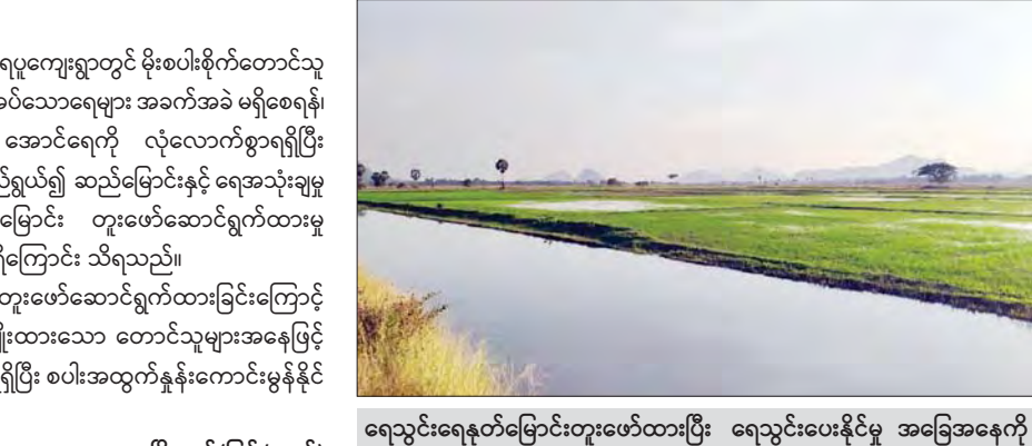
ရေသွင်းရေနုတ်မြောင်းတူးဖော်ထားပြီး ရေသွင်းပေးနိုင်မှု အခြေအနေကို တွေ့ရစဉ်။

လှိုင်ဘွဲ့ ဖေဖော်ဝါရီ ၁၀ ကရင်ပြည်နယ် လှိုင်ဘွဲ့မြို့နယ်အထက် ရေပူကျေးရွာတွင် မိုးစပါးစိုက်တောင်သူ များအနေဖြင့် မိုးစပါးစိုက်ပျိုးရာတွင် လိုအပ်သောရေများ အခက်အခဲ မရှိစေရန်၊ မိုးစပါးနှင့် ရေကျနေောက်ကျစပါးများ အောင်ရေကို လုံလောက်စွာရရှိပြီး စပါးအထွက်နှုန်း ပိုမိုကောင်းမွန်စေရန် ရည်ရွယ်၍ ဆည်မြောင်းနှင့် ရေအသုံးချမှု စီမံခန့်ခွဲရေးဦးစီးဌာနမှ ရေသွင်းရေနုတ်မြောင်း တူးဖော်ဆောင်ရွက်ထားမှု ကြောင့် တောင်သူများအဆင်ပြေလျက်ရှိကြောင်း သိရသည်။ အဆိုပါ ရေသွင်းရေနုတ်မြောင်း တူးဖော်ဆောင်ရွက်ထားခြင်းကြောင့် မိုးစပါးနှင့် ရေကျနေောက်ကျ စပါးစိုက်ပျိုးထားသော တောင်သူများအနေဖြင့် စပါးဧက ၄၅၀ ကို ရေအလုံအလောက်ရှိရပြီး စပါးအထွက်နှုန်းကောင်းမွန်နိုင် ကြောင်း သိရသည်။