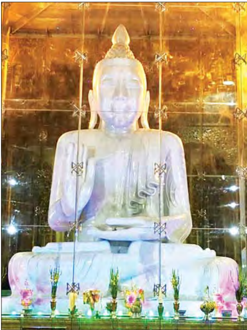
အင်းစိန်မြို့နယ် မင်းဓမ္မကုန်းတော်ပေါ်ရှိ လောကချမ်းသာ အဘယလာဘမုနိ (စကျင်) ဗုဒ္ဓရုပ်ပွားတော်မြတ်ကြီးကို ဖူးတွေ့ရစဉ်။

ရန်ကုန် ဖေဖော်ဝါရီ ၁၀ ရန်ကုန်တိုင်းဒေသကြီး အင်းစိန်မြို့နယ်ရှိ မင်းဓမ္မ ကုန်းတော်ပေါ်တွင် တည်ထားကိုးကွယ်ပူဇော်တော်မူ သော လောကချမ်းသာ အဘယလာဘမုနိ (စကျင်) ဗုဒ္ဓရုပ်ပွားတော်မြတ်ကြီးကို ဖေဖော်ဝါရီ ၉ ရက်က မြို့နယ် သံဃာ့အဖွဲ့၏ ဩဝါဒဗဟိုက ဆရာတော် သံဃာတော် အရှင်သူမြတ်များက အနေကဇာတင်ပြီး ရဟန်းရှင်လူ ပြည်သူအများ ကြည်ညိုဖူးမြော်ပူဇော်နိုင်ရန် ပြန်လည်ဖွင့်လှစ်သည်။ ဂေါပကအဖွဲ့ဝင်များက ကျန်းမာရေးဆိုင်ရာ စည်းကမ်းချက်များနှင့်အညီ နံနက် ၆ နာရီမှ မွန်းလွဲ ၁ နာရီအထိနှင့် ညနေ ၃ နာရီမှ ၆ နာရီအထိ အချိန် နှစ်ပိုင်းခွဲ၍ ရဟန်းရှင်လူ ပြည်သူများအား ကြည်ညို ဖူးမြော် ပူဇော်ခွင့်ပေးထားကြောင်း သိရသည်။ လောကချမ်းသာ အဘယလာဘမုနိ (ကျောက် တော်ကြီး) ဗုဒ္ဓရုပ်ပွားတော်မြတ်ကြီး ရင်ပြင်၌ ကျန်းမာရေးနှင့် အားကစားဝန်ကြီးဌာန၏ စည်းကမ်း ချက်များအတိုင်း ဂေါပကအဖွဲ့ဝင်များက အတက်/ အဆင်းလမ်းများ သတ်မှတ်ထားပြီး လက်ဆေးရန် လက်ဆေးဘေစင်၊ ဆပ်ပြာရည်များ နေရာမလပ် စီစဉ်ဆောင်ရွက်ပေးထားကြောင်း သိရသည်။ ရွှေမြိုင်မောင်ဖုန်း