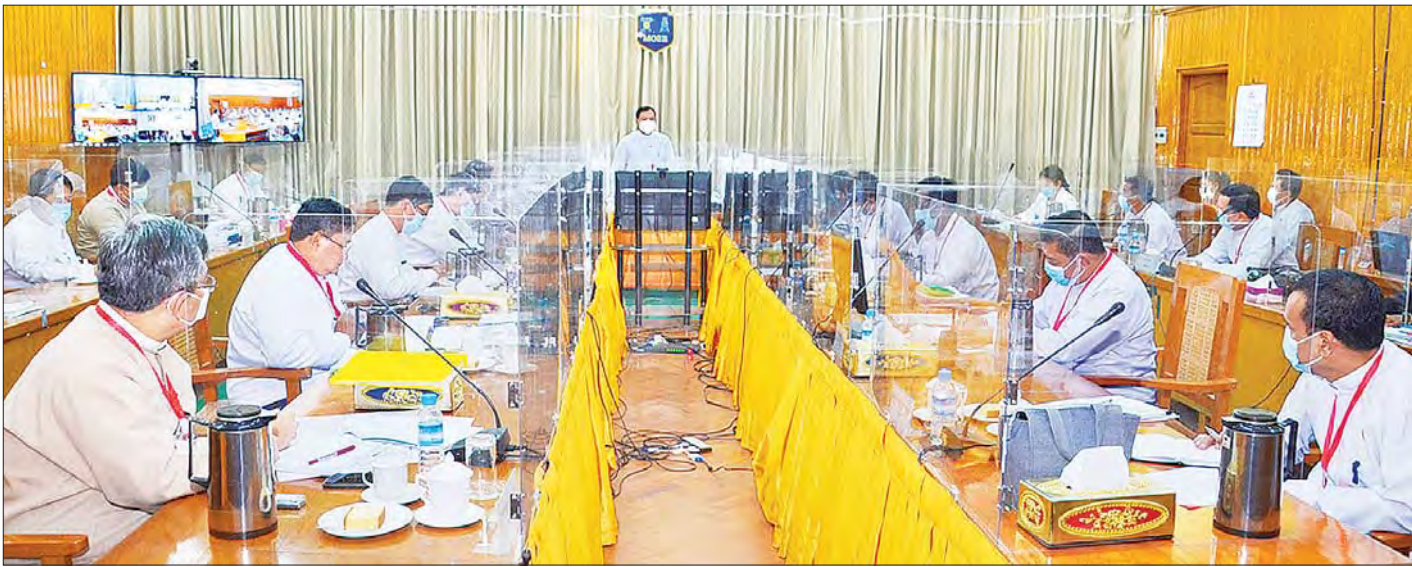
ပြည်ထောင်စုဝန်ကြီး ဦးအောင်သန်းဦး လျှပ်စစ်နှင့် စွမ်းအင်ဝန်ကြီးဌာန၏ လက်ရှိလုပ်ငန်းဆောင်ရွက်နေမှုအခြေအနေများနှင့် ပတ်သက်သည့် လုပ်ငန်းညှိနှိုင်းအစည်းအဝေး တွင် အမှာစကားပြောကြားစဉ်။