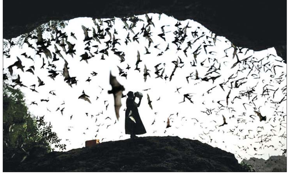
လင်းနီများကို သုတေသနပြု လေ့လာနေသည်ကို တွေ့ရစဉ်။

ဖေဖော်ဝါရီ ၅ ရက်က ဖော်ပြလိုက် သည်။ သတ္တဝါတို့၏ တည်နေရာလိုအပ် ချက်များကို အခြေခံကာ လင်းနီ