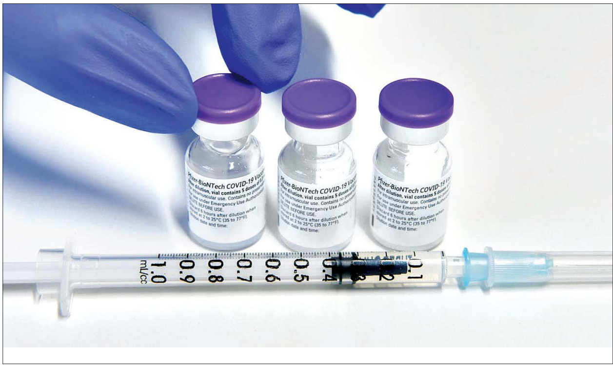
ဂျာမနီနိုင်ငံ ဖရေဆင်ရှိ ကိုဗစ်ကာကွယ်ဆေးထိုးဌာနတွင် ဖိုက်ဇာဘိုင်ရွန်တက်ခီကာကွယ်ဆေးများကို တွေ့ရစဉ်။