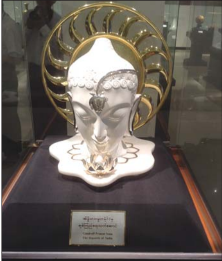
နေပြည်တော် အမျိုးသားပြတိုက်ရှိ နိုင်ငံတော်သမ္မတ လက်ဆောင်ပစ္စည်းပြခန်းမှ ပစ္စည်းတစ်ခု

ထို့အတူ ဌာနရည်မှန်းချက်တွင် ပြတိုက်နှင့် စာကြည့် တိုက်များ တိုးချဲ့ တည်ဆောက်ဖွင့်လှစ်၍ ပညာပေးရေး