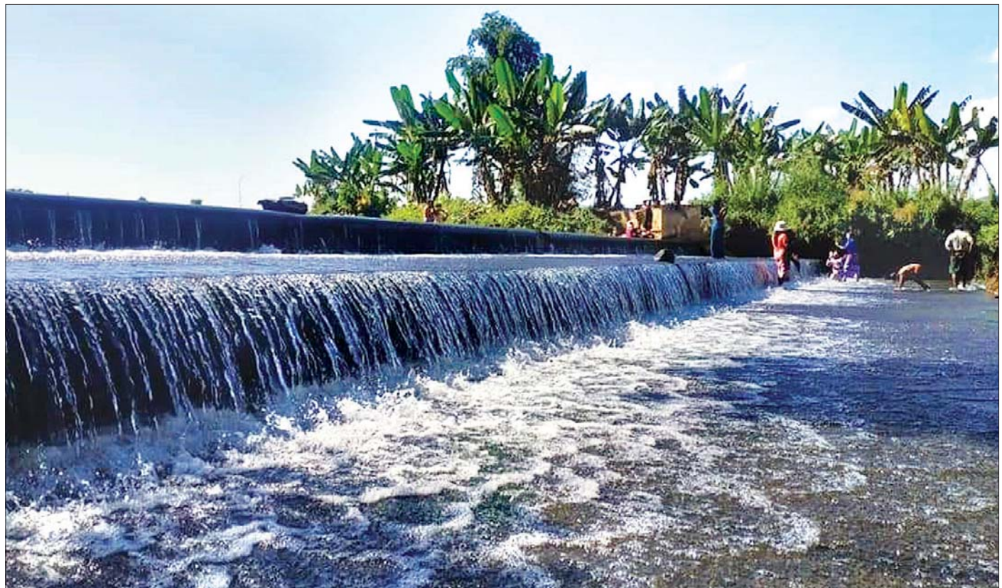
လက်ပံကြီးတော ရေလွှဲဆည် (နန်းလှိုင်) ကို တွေ့ရစဉ်။

မြန်ပြည်တစ်လွှား ပြတိုက်များ ဆောင်းပါး စာ >> ၂၀