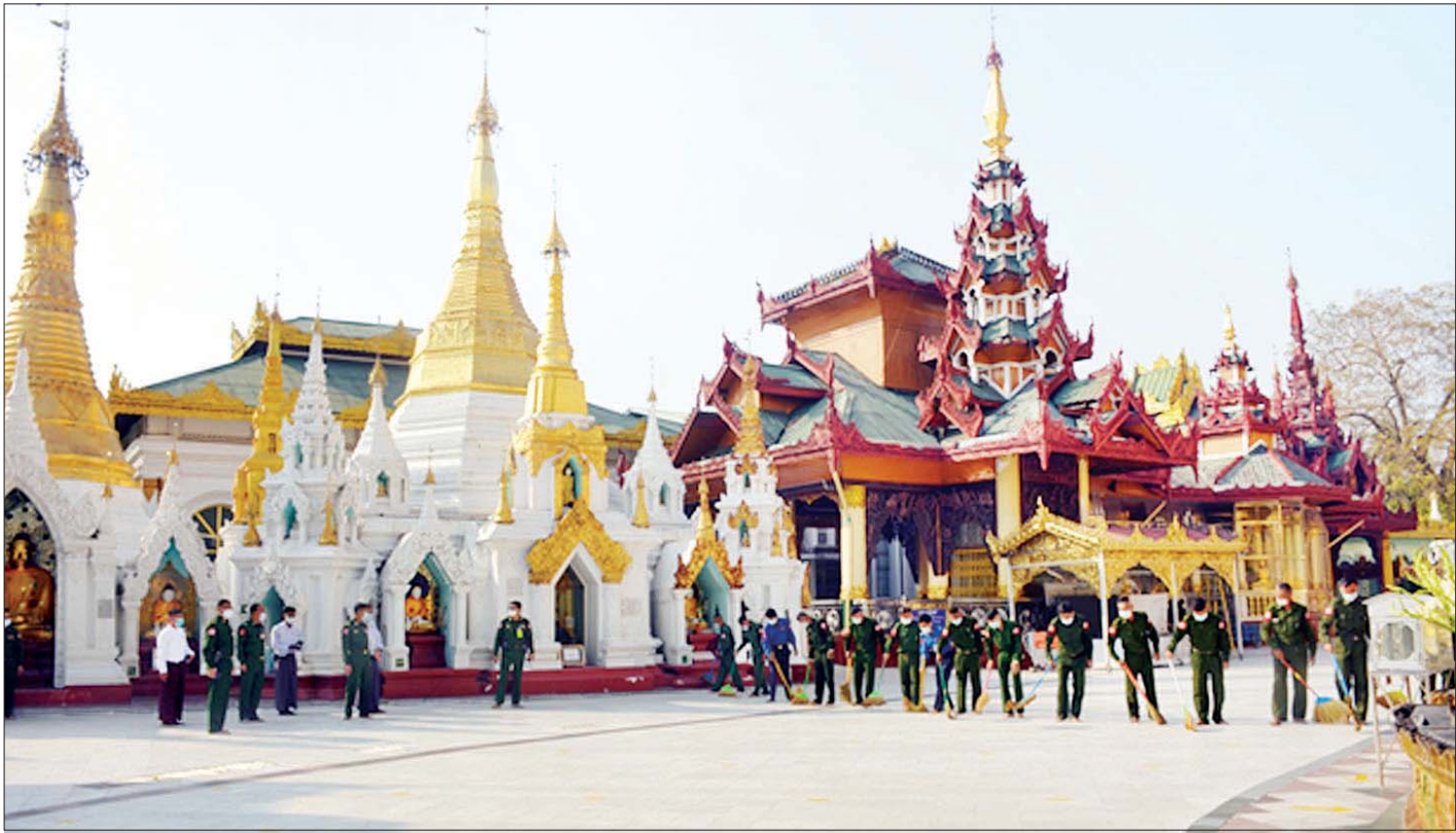
ရွှေတိဂုံစေတီတော်ကြီး၏ ရင်ပြင်တော်၌ တပ်မတော်သားများ စုပေါင်းသန့်ရှင်းရေး ဆောင်ရွက်စဉ်။

အလားတူ နေပြည်တော်ကောင်စီနယ်မြေ ပုဗ္ဗသီရိ မြို့နယ်အတွင်းရှိ ဥပ္ပတိတသန္တီစေတီတော်မြတ်ကြီး၊ ရှမ်းပြည်နယ် (မြောက်ပိုင်း)၊ ရှမ်းပြည်နယ်(တောင်ပိုင်း)၊ ရှမ်းပြည်နယ်(အရှေ့ပိုင်း)၊ မွန်ပြည်နယ်၊ ကရင်ပြည်နယ်၊