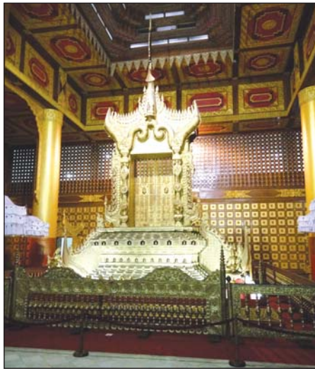
ရန်ကုန်အမျိုးသားပြတိုက်တွင် ပြသထားသည့် သီဟာသနပလ္လင်

ရန်ကုန်တိုင်းဒေသကြီး ဒဂုံမြို့နယ် ပြည်လမ်း အမှတ် (၆၆/၇၄)တွင် တည်ရှိသည့် လက်ရှိ အမျိုးသားပြတိုက် (ရန်ကုန်)သည် အထပ်ငါးထပ်ပါဝင်၍ အလျား ပေ ၃၈၀ နှင့် အနံ ပေ ၂၀၀ ရှိသည်။ ယင်းပြတိုက်ကို ၁၉၉၀ ပြည့်နှစ်