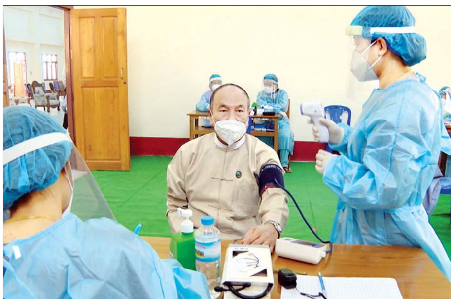
ပြည်ထောင်စုဝန်ကြီး ဦးချစ်နိုင် ကိုဗစ်-၁၉ ကာကွယ်ဆေး ထိုးနှံမှုခံယူစဉ်။