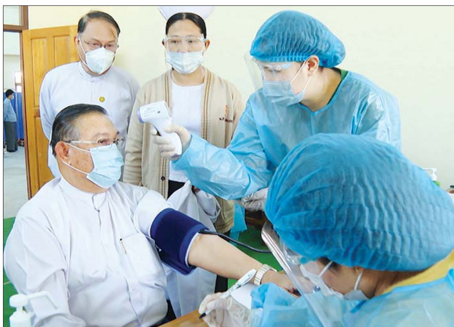
ပြည်ထောင်စုဝန်ကြီး ဦးဝဏ္ဏမောင်လွင် ကိုဗစ်-၁၉ ကာကွယ်ဆေး ထိုးနှံမှုခံယူစဉ်။