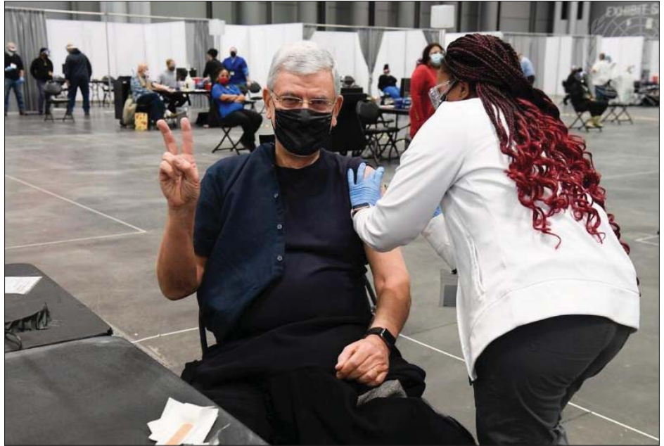
(၇၅)ကြိမ်မြောက် ကုလသမဂ္ဂအထွေထွေညီလာခံဥက္ကဋ္ဌ ဗော်ကန်ဘော့စ်ကားရ်သည် နယူးယောက်ရှိ ဂျာဗစ်စင်တာသို့ ရောက်ရှိပြီး ကိုဗစ်-၁၉ ကာကွယ်ဆေးအထိုးခံနေသည်ကို တွေ့ရစဉ်။