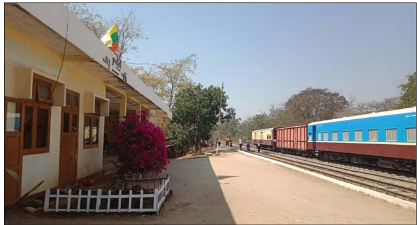
နွားထိုးကြီးဘူတာသို့ ဝင်ရောက်လာသော ပုဂံ-မန္တလေး လော်ကယ်ရထားတစ်စင်း။

ကားရထားများမှာမူ လက်ရှိအချိန်အထိ ညွှန်ကြားချက်မရသေးသဖြင့် ပြေးဆွဲခြင်းမရှိသေးကြောင်း သိရသည်။ မြေးမြင်းမောင်