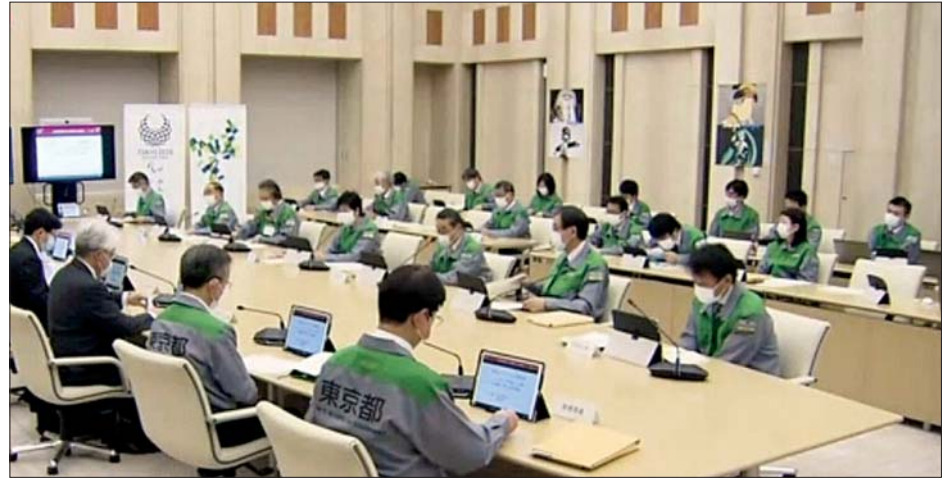
တိုကျိုမြို့ အုပ်ချုပ်ရေးအဖွဲ့၏ ကိုဗစ်- ၁၉ ကျွမ်းကျင်သူများအဖွဲ့အစည်းအဝေး ပြုလုပ်နေကြစဉ်။

ကိုဗစ်-၁၉ ကူးစက်မှုအရေအတွက်ကို လျော့ချခြင်းအားဖြင့် ကာကွယ်ဆေးထိုးပေးမည့် ဝန်ထမ်းများအတွက် လုံခြုံစိတ်ချရရှိစေရေး အရေးပါကြောင်း ၎င်းအဖွဲ့က ဆက်လက်ပြောကြားခဲ့သည်။ အင်န်အိတ်ချ်ကော့