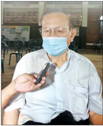
ဦးရာစိုး

ကိုဗစ်-၁၉ ကာကွယ်ဆေးက ကျွန်တော် တို့ ပြည်သူတွေအားလုံး မျှော်လင့်ချက် ဖြစ်ပါတယ်။ ဒီအချိန်က ကိုဗစ်-၁၉ ရောဂါ ကာကွယ် ထိန်းချုပ် ကုသရေးကလေးလည်း ဖြစ်ပါတယ်။ ဒီနေရာမှာတော့ ကျွန်တော်တို့ရဲ့ ထွက်ပေါက်က ကာကွယ်ဆေးပါပဲ။ ကိုဗစ် ကာကွယ်ဆေးကို ထိုးထားတဲ့အတွက်ကြောင့် မို့လို့ ရောဂါဖြစ်ပွားမှုတွေ ကျဆင်းလာမယ်။ ပြည်သူလူထုထဲမှာ ကိုဗစ်-၁၉ ကာကွယ် ဆေးထိုးနှံပေးတာ ဒါပထမဆုံး ဖြစ်ပါတယ်။ ဒါကြောင့်မို့လည်း ပြည်သူလူထု အန္တရာယ် မဖြစ်စေရေးအတွက် သတိထားပြီး ထိုးနှံပေး သွားမှာဖြစ်ပါတယ်။ အားလုံး အဘက်ဘက် က ပြည့်စုံမှ ကာကွယ်ဆေးထိုးနှံမှု စတင်တာ ဖြစ်ပါတယ်။