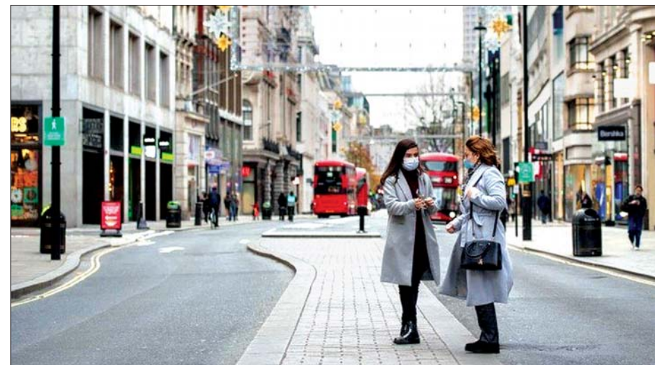
ကိုဗစ် - ၁၉ စည်းကမ်းများတင်းကျပ်ထားသည့် လန်ဒန်မြို့တွင်တစ်နေရာကို တွေ့ရစဉ်။

နှစ်ပေါင်း ၅၁ နှစ်အတွင်း ဇန်နဝါရီလတွင် ရောင်းအားအနိမ့်ဆုံးဟု သိရသည်။ အင်န်အိတ်ချ်ကော့