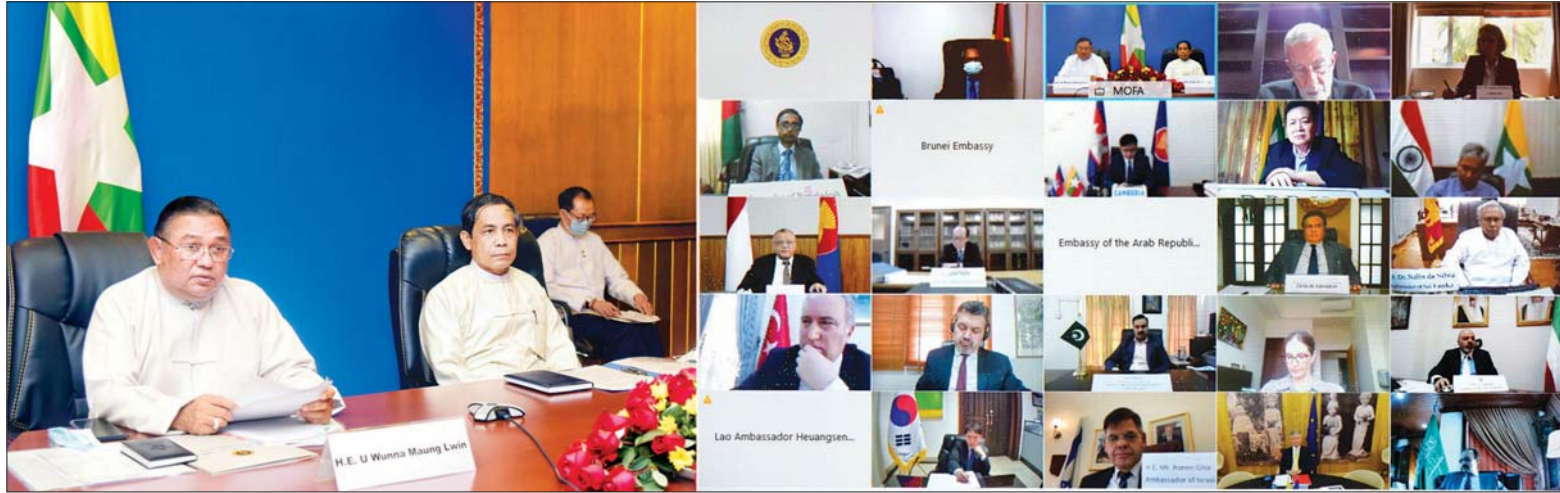
ပြည်ထောင်စုဝန်ကြီး ဦးဝဏ္ဏမောင်လွင်နှင့် ဦးကိုကိုလှိုင်တို့က မြန်မာနိုင်ငံ၌ လက်ရှိဖြစ်ပေါ်လျက်ရှိသော အခြေအနေများနှင့်ပတ်သက်၍ မြန်မာနိုင်ငံအခြေစိုက် ပြည်ပသံရုံးများမှ သံအမတ်ကြီးများ၊ သံတမန်များနှင့် ကုလသမဂ္ဂ လက်အောက်ခံအဖွဲ့အစည်းအများမှ အကြီးအကဲများအား ဗီဒီယိုကွန်ဖရင့်စနစ်ဖြင့် ရှင်းလင်းပြောကြားစဉ်။

မြန်မာနိုင်ငံ၌ လက်ရှိဖြစ်ပေါ်လျက်ရှိသော အခြေအနေများနှင့်ပတ်သက်၍ နိုင်ငံခြားရေးဝန်ကြီးဌာန ပြည်ထောင်စုဝန်ကြီး ဦးဝဏ္ဏမောင်လွင်နှင့် အပြည်ပြည်ဆိုင်ရာ ပူးပေါင်းဆောင်ရွက်ရေးဝန်ကြီးဌာန ပြည်ထောင်စုဝန်ကြီး ဦးကိုကိုလှိုင် တို့က ယနေ့မနက်လွဲပိုင်းတွင် မြန်မာနိုင်ငံအခြေစိုက် ပြည်ပသံရုံးများမှ သံအမတ်ကြီးများ၊ သံတမန်များနှင့် ကုလသမဂ္ဂ လက်အောက်ခံအဖွဲ့အစည်းအများမှ အကြီးအကဲများအား ဗီဒီယိုကွန်ဖရင့်စနစ်ဖြင့် ရှင်းလင်းပြောကြားသည်။