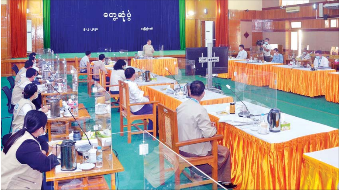
ပြည်ထောင်စုဝန်ကြီး ဦးချစ်နိုင် ပြန်ကြားရေးနှင့် ပြည်သူ့ဆက်ဆံရေးဦးစီးဌာန ရုံးချုပ်နှင့် တိုင်းဒေသကြီး/ပြည်နယ်/ခရိုင် ဦးစီးမှူးများအား Zoom Application စနစ်ဖြင့် တွေ့ဆုံစဉ်။ သတင်းစဉ်