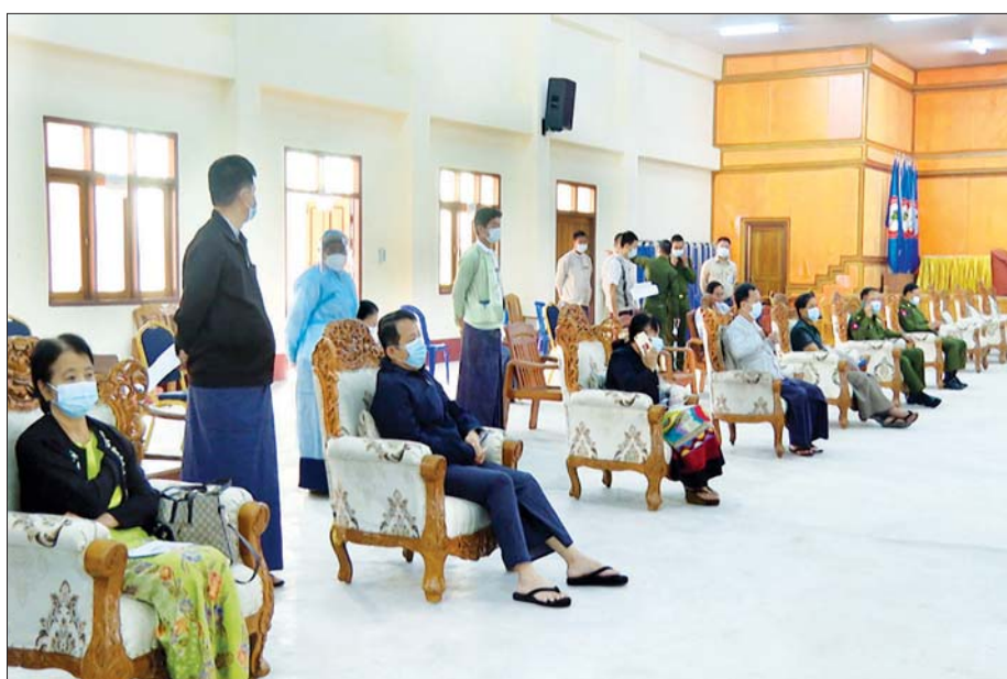
ကိုဗစ်-၁၉ ကာကွယ်ဆေး ထိုးရန် စောင့်ဆိုင်းနေကြသူများကို တွေ့ရစဉ်။