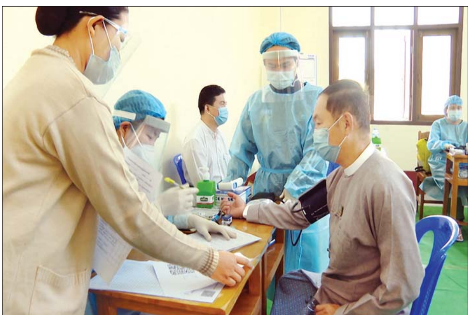
ပြည်ထောင်စုဝန်ကြီး ဦးခင်မောင်ရှိ ကိုဗစ်-၁၉ ကာကွယ်ဆေး ထိုးနှံမှုခံယူစဉ်။