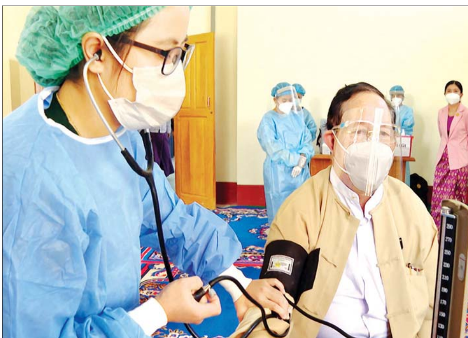
ပြည်ထောင်စုတရားသူကြီးချုပ် ဦးထွန်းထွန်းဦး ကိုဗစ်-၁၉ ကာကွယ်ဆေး ထိုးနှံမှုခံယူစဉ်။