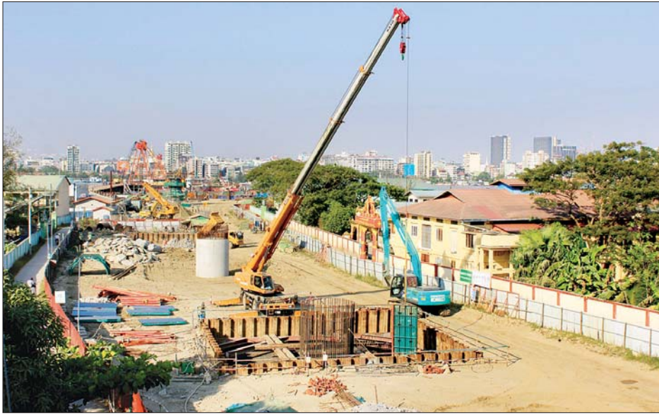
ဒလဘက်ခြမ်း၌ ဘိုးပိုင်တူးဖော်ခြင်းလုပ်ငန်းများ ဆောင်ရွက်နေမှု တွေ့ရစဉ်။

စီးပွားရေးမြို့တော် ရန်ကုန်မြို့ လမ်းမတော်မြို့နယ် ဘုန်းကြီးလမ်းမကြီးနှင့် ရန်ကုန်မြစ်တစ်ဖက်ကမ်းရှိ ဒလ မြို့နယ် ကမာကဆစ်ရပ်ကွက် ဗိုလ်မင်းရောင် လမ်းမကြီး တို့သို့ ဆက်သွယ်တည်ဆောက်လျက်ရှိသော ကိုရီးယား-မြန်မာချစ်ကြည်ရေး(ဒလ)မြစ်ကူးတံတား တည်ဆောက်ရေးလုပ်ငန်းများ ဆက်လက်ဆောင်ရွက်လျက်ရှိကြောင်း၊ လက်ရှိအချိန်တွင် တံတားတစ်စင်းလုံး၏ ၂၅ ရာခိုင်နှုန်း ဆောင်ရွက်ပြီးစီးကြောင်း ဆောက်လုပ်ရေးဝန်ကြီးဌာန တံတားဦးစီးဌာနမှ သိရသည်။