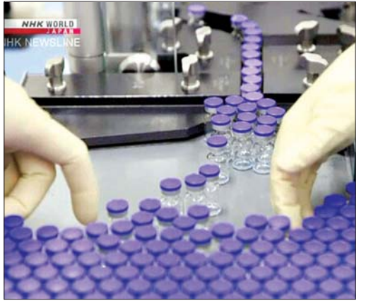
ဖိုက်ဇာကာကွယ်ဆေးများကို တွေ့ရစဉ်။