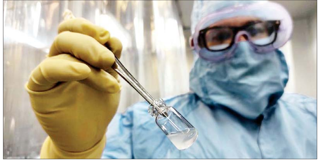
ကျူးဘားနိုင်ငံထုတ် ကိုဗစ်-၁၉ ကာကွယ်ဆေး စမ်းသပ်နေသည်ကို တွေ့ရစဉ်။