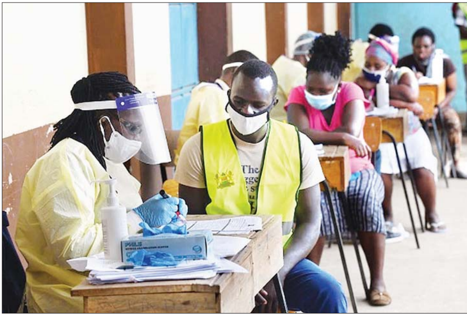
ကင်ညာနိုင်ငံ နိုင်ရီဘီမြို့တွင် ကိုဗစ်-၁၉ ဆေးစစ်ပေးမှုများ လုပ်ဆောင်နေစဉ်။

မှာ အပြန်အလှန် ဆက်သွယ်မှုရှိကြောင်း၊ ထို့ကြောင့် ချမ်းသာသည့်နိုင်ငံများက ၎င်းတို့၏ နယ်စပ်တံခါးများ ပိတ်ထားလျှင်ပင် ၎င်းတို့မှာ ဆင်းရဲသည့် နိုင်ငံများမှ ပြည်သူများနှင့် မတွေ့ဆုံတွေ့ဟု တစ်ထစ်ချမပြောနိုင်ဟု ၎င်းက ဆက်လက်ပြောကြားခဲ့သည်။ ဂျပန်နိုင်ငံသည် အာဖရိကနှင့် ခိုင်မာသည့် ဆက်ဆံရေး ရှိပြီး အရေးပါသည့်အခန်းကဏ္ဍမှ ပါဝင်သည့် နိုင်ငံဖြစ်ကြောင်း ၎င်းက ဆက်လက်ပြောကြားခဲ့သည်။ အခြား ချမ်းသာသည့်နိုင်ငံများတွင် ပိုလျှံနေသည့် ကာကွယ်ဆေးများကို ပြန်လည်လျှော့ဒါန်းနိုင်ရေးအတွက် ဂျပန်နိုင်ငံသည် လွှမ်းမိုးနိုင်မှုရှိမည်ဟုယူဆကြောင်း ၎င်းက ဆက်လက် ပြောကြားခဲ့သည်။ အင်န်အိတ်ချ်ကော့