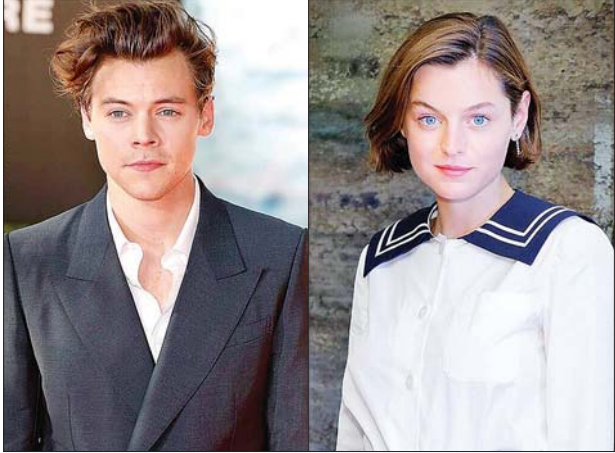
အဆိုတော် ဟယ်ရီစတိုင်းနှင့် သရုပ်ဆောင် အမ်မာကောရင်။