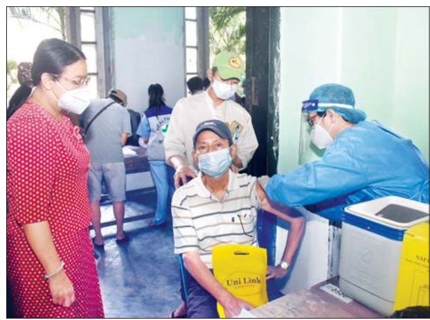
၁၉ ရောဂါ ကုသရေးစင်တာများတွင် တာဝန်ထမ်းဆောင်နေသည့် စေတနာ့ ဝန်ထမ်း စုစုပေါင်း ၂၅၀၀၀ ခန့်ကို ကာကွယ်ဆေး ထိုးနှံပေးခဲ့ကြောင်း သိရသည်။ သတင်း-မင်းသစ်(MNA) ဓာတ်ပုံ-ဇော်မင်းလတ်

ရန်ကုန်တိုင်းဒေသကြီးအတွင်း ကိုဗစ်ကာကွယ်ဆေး ထိုးနှံမည့်သူမှာ ကောက်ယူထားသည့် စာရင်းများ အရ အသက် ၁၈ နှစ်အထက် လူဦးရေ ၅၉ သိန်းကျော်ရှိပြီး အသက် ၆၅ နှစ်အထက် သက်ကြီးဦးရေ သုံးသိန်း ရှစ်သောင်းကျော်ရှိကြောင်း ရန်ကုန် တိုင်းဒေသကြီး ပြည်သူ့ကျန်းမာရေး နှင့် ကုသရေးဦးစီးဌာနမှ သိရ သည်။ ကနဦးအနေဖြင့် ဇန်နဝါရီ ၂၇ ရက်က ကိုဗစ်ကာကွယ်ဆေးကို ရန်ကုန်တိုင်း ဒေသကြီးအတွင်း ကျန်းမာရေးဝန်ထမ်းများနှင့် ကိုဗစ်-