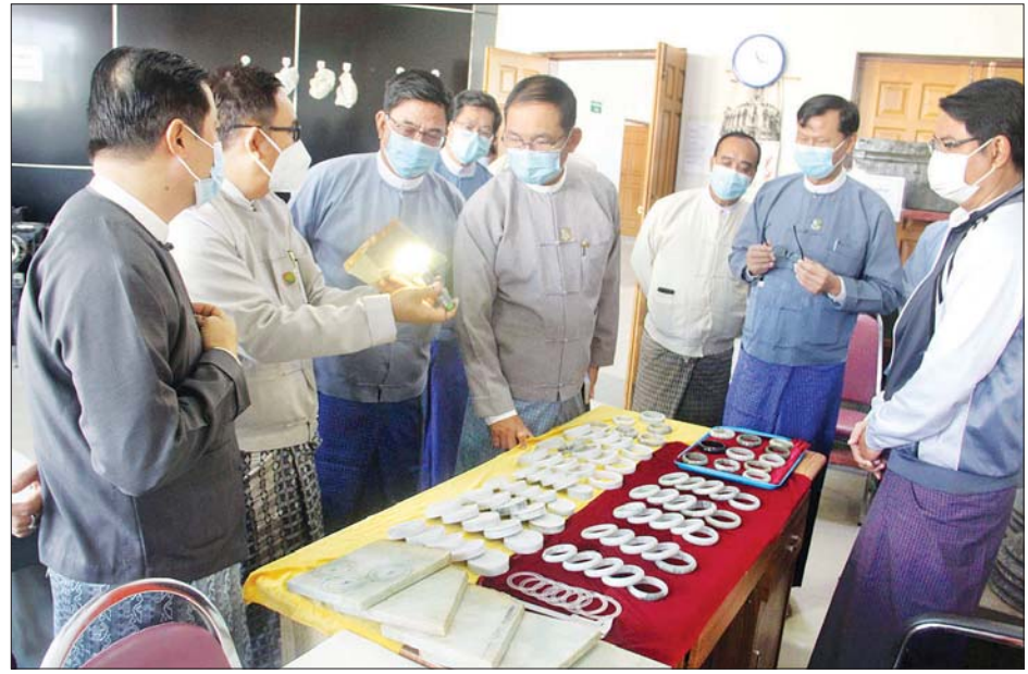
ပြည်ထောင်စုဝန်ကြီး ဦးခင်မောင်ရီ မြန်မာ့ကျောက်မျက်ရတနာသင်တန်းကျောင်းနှင့် မဏိရတနာကျောက်စိမ်းခန်းမတို့ကို ကြည့်ရှုစစ်ဆေးစဉ်။ သတင်းစဉ်

ထိန်းသိမ်းရေး ဝန်ကြီးဌာန သည် အမြဲတမ်းအတွင်းဝန် ဦးခင်မောင်ရီ ဦး၊ တာဝန်ရှိသူများနှင့်အတူ ယနေ့