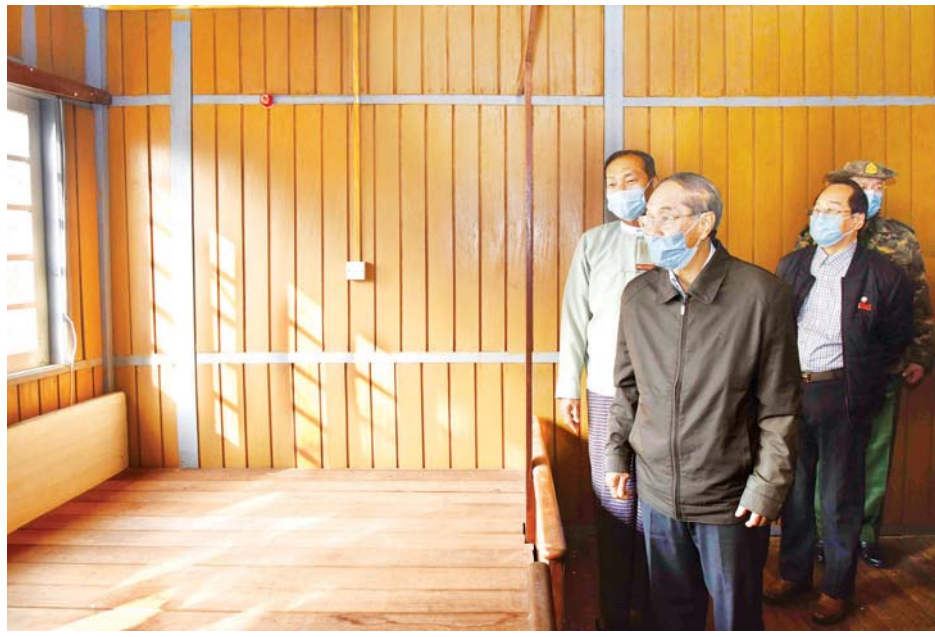
ဒုတိယသမ္မတ ဦးမြင့်ဆွေ မချမ်းဘောမြို့ရှိ ဂူဘားရိပ်သာအတွင်း ကြည့်ရှုစစ်ဆေးစဉ်။ သတင်းစဉ်

ယင်းနောက် ဒုတိယသမ္မတနှင့်အဖွဲ့သည် နောင်မွန်မြို့မှ ပူတာအိုမြို့သို့ တပ်မတော်ရဟတ်ယာဉ်များဖြင့် ရောက်ရှိကြပြီး ထိုမှ တစ်ဆင့် တပ်မတော် အထူးလေယာဉ်ဖြင့် နေပြည်တော်သို့ ညနေပိုင်းတွင် ပြန်လည်ရောက်ရှိကြသည်။ သတင်းစဉ်