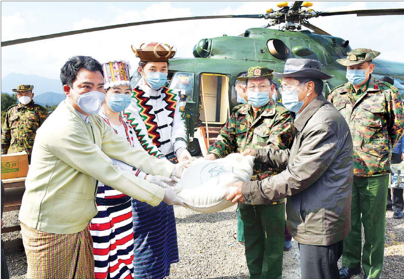
ပူတာအို ဇန်နဝါရီ ၃၀

ကချင်ပြည်နယ် ပူတာအိုမြို့၌ ရောက်ရှိနေသည့် ဒုတိယသမ္မတ ဦးမြင့်ဆွေ သည် ပြည်ထောင်စုဝန်ကြီး ဒုတိယဗိုလ်ချုပ်ကြီး ရဲအောင်၊ ပြည်နယ်ဝန်ကြီးချုပ် ဒေါက်တာခင်အောင်၊ ဒုတိယဝန်ကြီး ဗိုလ်ချုပ်စိုးတင့်နိုင် နှင့် ဒေါက်တာရဲမြင့်ဆွေ၊ မြောက်ပိုင်းတိုင်းစစ်ဌာနချုပ် ဒုတိယတိုင်းမှူး ဗိုလ်မှူးချုပ်အောင်မျိုးဦး၊ ပြည်နယ် အစိုးရအဖွဲ့ လုံခြုံရေးနှင့် နယ်စပ်ရေးရာဝန်ကြီး ဗိုလ်မှူးကြီး ကျော်လင်းအောင်၊ အမြဲတမ်းအတွင်းဝန် များ၊ ညွှန်ကြားရေးမှူးချုပ်များ၊ တာဝန်ရှိသူများနှင့်အတူ ယနေ့ နံနက်ပိုင်းတွင် မော်တော်ယာဉ်များဖြင့် မချမ်းဘော မြို့ရှိ ဂူဘားရိပ်သာသို့ ရောက်ရှိခဲ့ရာ ပူတာအိုခရိုင်အုပ်ချုပ် ရေးမှူး ဦးသန့်ဇင်က ဂူဘားရိပ်သာ၏ သမိုင်းကြောင်းနှင့် ထိန်းသိမ်းရေးလုပ်ငန်းများ ဆောင်ရွက်ထားရှိမှုအခြေအနေ များအား လိုက်လံရှင်းလင်းတင်ပြသည်။