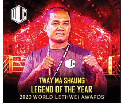
Legend of The Year ဆု ရရှိသည့် တွေ့မရှောင်။

ရန်ကုန် ဇန်နဝါရီ ၃၀ မြန်မာ့ရိုးရာလက်ဝှေ့ပွဲများ စီစဉ်ကျင်းပသည့် World Lethwei Championship (WLC) သည် ၂၀၂၀ ပြည့်နှစ်အတွက် အကောင်းဆုံးဆုများအဖြစ် ချီးမြှင့်မည့် World Lethwei Awards အတွက် ဆုရရှိသူများစာရင်းကို ထုတ်ပြန်ကြေညာလိုက်ပြီ ဖြစ်သည်။