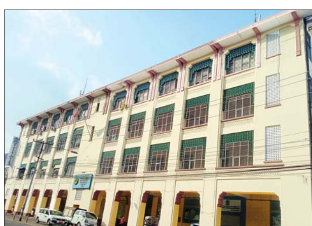
ရန်ကုန်မြို့ပြအမွေအနှစ်အထိမ်းအမှတ် အပြာရောင်ကမ္ဘည်းပြားတပ်ဆင် သည့် မြို့ပြနှင့် အိမ်ရာဖွံ့ဖြိုးရေးဦးစီးဌာန (ယခင်ပြည်သူ့အိုးအိမ်အဖွဲ့ရုံး) အဆောက်အအုံ။

ရန်ကုန် ဇန်နဝါရီ ၃၀ ရန်ကုန်မြို့တော်စည်ပင်သာယာရေး ကော်မတီဦးဆောင်မှုဖြင့် ရန်ကုန်မြို့ပြ အမွေအနှစ် ထိန်းသိမ်းစောင့်ရှောက် ရေးအဖွဲ့နှင့် မြို့ပြနှင့်အိမ်ရာဖွံ့ဖြိုးရေး ဦးစီးဌာနတို့ ပူးပေါင်း၍ ရန်ကုန်မြို့ ဗိုလ်တထောင်မြို့နယ် ဗိုလ်ချုပ် အောင်ဆန်းလမ်းရှိ မြို့ပြနှင့်အိမ်ရာ ဖွံ့ဖြိုးရေးဦးစီးဌာန (ယခင်ပြည်သူ့ အိုးအိမ်အဖွဲ့ရုံး) အဆောက်အအုံကို ရန်ကုန်မြို့ပြအမွေအနှစ် အထိမ်း အမှတ် အပြာရောင်ကမ္ဘည်းပြား တပ်ဆင်သည့်အခမ်းအနားကို ယနေ့ နံနက် ၇ နာရီခွဲတွင် အဆိုပါအဆောက် အအုံမျက်နှာစာ၌ ကျင်းပသည်။