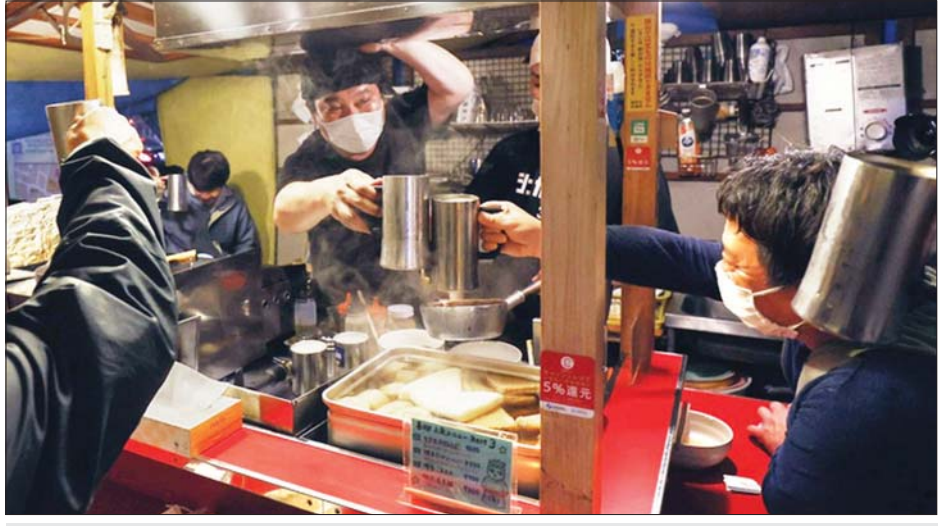
ဂျပန်နိုင်ငံအနောက်တောင်ပိုင်း ဖူကူအိုကာတွင် ဖွင့်လှစ်ရောင်းချနေသော စားသောက်ဆိုင်တစ်ဆိုင်၌ လူများ စားသောက်နေသည်ကိုတွေ့ရစဉ်။