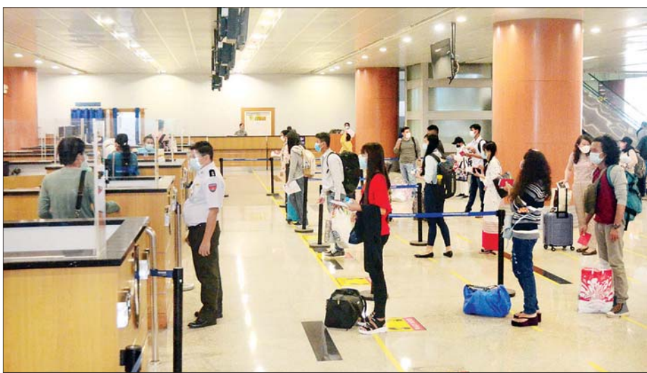
အခန်းကဏ္ဍအလိုက် တာဝန်ယူဆောင်ရွက်ပေးခဲ့သည်။ ပြည်ပနိုင်ငံများတွင် အခက်အခဲကြုံတွေ့နေရသည့် မြန်မာနိုင်ငံသားများအား ပြန်လည်ခေါ်ဆောင်ရန် Coronavirus Disease 2019(COVID-19) ကာကွယ်၊ ထိန်းချုပ်၊ ကုသရေး အမျိုးသားအဆင့် ဗဟိုကော်မတီ၏ လမ်းညွှန်ချက်နှင့်အညီ နိုင်ငံခြားရေးဝန်ကြီးဌာန အနေ ဖြင့် သက်ဆိုင်ရာဝန်ကြီးဌာနများ၊ သက်ဆိုင်ရာနိုင်ငံများရှိ မြန်မာသင်္ဘောသားများ၊ သင်္ဘောကုမ္ပဏီများ၊ အဖွဲ့အစည်းများနှင့် ပူးပေါင်းညှိနှိုင်းဆောင်ရွက်ပေးလျက်ရှိကြောင်း သိရသည်။ သတင်းစဉ်

လိုက်ပါခဲ့ကြသည်။ ထို့ပြင် စင်ကာပူနိုင်ငံတွင် အခက်အခဲကြုံတွေ့နေရ သည့် မြန်မာနိုင်ငံသား ၁၃၂ ဦးကို မြန်မာသင်္ဘောသား စီစဉ်သည့် မြန်မာအမျိုးသားလေကြောင်းလိုင်း (MNA) အထူးစင်းလုံးငှား ကယ်ဆယ်ရေးလေယာဉ်ဖြင့် ပြန်လည် ခေါ်ဆောင်ခွဲရာ ယနေ့ည ၇ နာရီခွဲတွင် ရန်ကုန်အပြည်ပြည် ဆိုင်ရာလေဆိပ်သို့ အဆင်ပြေချောမွေ့စွာ ရောက်ရှိကြ သည်။ (ယာပုံ) ၎င်းတို့ ရန်ကုန်အပြည်ပြည်ဆိုင်ရာလေဆိပ်သို့ ရောက်ရှိချိန်တွင် လူဝင်မှုကြီးကြပ်ရေး၊ ကျန်းမာရေး စီစစ် ရေး၊ သီးသန့်စီစဉ်ပေးသည့်နေရာ / သတ်မှတ် ဟိုတယ် များ၌ အသွားအလာ ကန့်သတ်မှု ၁၄ ရက်နှင့် နေအိမ်တွင် အသွားအလာကန့်သတ်မှု ခုနစ်ရက် နေထိုင်စေရေးတို့ကို အလုပ်သမား၊ လူဝင်မှုကြီးကြပ်ရေးနှင့် ပြည်သူ့အင်အား ဝန်ကြီးဌာန၊ ကျန်းမာရေးနှင့် အားကစားဝန်ကြီးဌာန နှင့် ရန်ကုန်တိုင်းဒေသကြီးအစိုးရအဖွဲ့တို့မှ သက်ဆိုင်ရာ