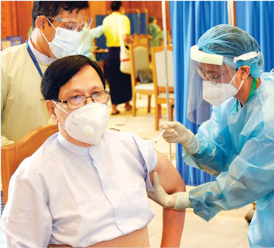
နေပြည်တော် ဇန်နဝါရီ ၃၀

အမျိုးသားလွှတ်တော် ဒုတိယဥက္ကဋ္ဌ ဦးအေးသာအောင်နှင့် တတိယအကြိမ် လွှတ်တော် ပထမပုံမှန်အစည်းအဝေး တက်ရောက်ကြမည့် လွှတ်တော် ကိုယ်စားလှယ်များအား ယနေ့နံနက်ပိုင်းမှစတင်၍ နေပြည်တော်ရှိ လွှတ်တော် အဆောက်အအုံ ထမင်းစားခန်းမဆောင်၌ ကျန်းမာရေးဝန်ထမ်းများက ကိုဗစ်-၁၉ ကာကွယ်ဆေး COVISHIELD ဆက်လက်ထိုးနှံပေးကြသည်။