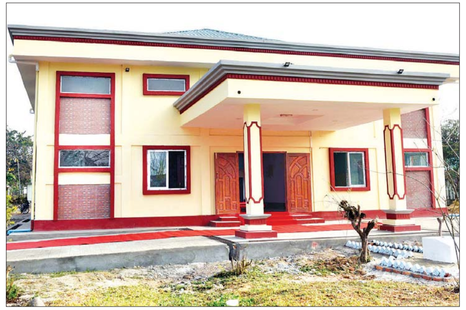
မချမ်းဘောမြို့နယ်ခန်းမ တည်ဆောက်ပြီးစီးမှုကို တွေ့ရစဉ်။ သတင်းစဉ်