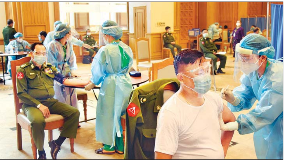
တပ်မတော်သား လွှတ်တော်ကိုယ်စားလှယ်များ ကိုဗစ်-၁၉ ကာကွယ်ဆေး ထိုးနှံစဉ်။