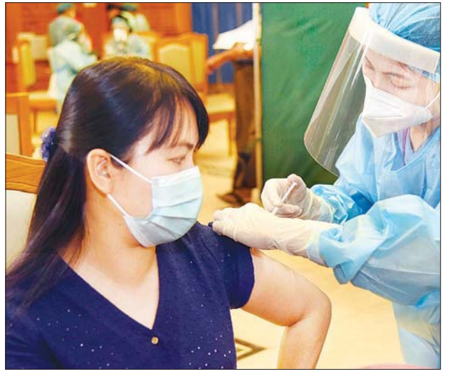
အမျိုးသားလွှတ်တော်ကိုယ်စားလှယ်တစ်ဦး ကိုဗစ် - ၁၉ ကာကွယ်ဆေး ထိုးနှံနေစဉ်။