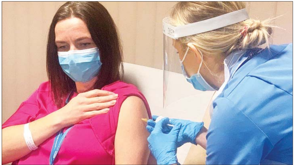
ဂျန်ဆင်နှင့်ဂျန်ဆင် ကိုဗစ်-၁၉ ကာကွယ်ဆေးကို စမ်းသပ်ထိုးနှံနေစဉ်။

ဖိုက်ဇာနှင့် ဘိုင်ရွန်တက်ခီ သို့မဟုတ် မော်ဒါနာတို့လို နှစ်ကြိမ်ထိုးရန် မလိုအပ်သောကြောင့် ဂျန်ဆင်နှင့် ဂျန်ဆင် ကာကွယ်ဆေးသည် ကာကွယ်ဆေးထိုးလုပ်ငန်းကာကွယ် ဆေးပြတ်လပ်မှုကို အရှိန်မြှင့်တင်ပြည့်ဆည်းပေးနိုင်မည် ဟု မျှော်လင့်ရသည်။ အင်န်အိတ်ချ်ကေ