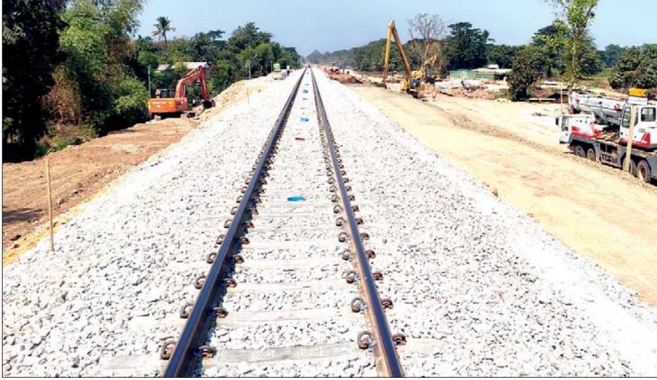
ညောင်လေးပင် - တောင်ငူ ရထားလမ်းပိုင်းအဆင့်မြှင့်တင်ပြီးစီးမှုကို တွေ့ရစဉ်။

မြန်မာနိုင်ငံ၌ ရန်ကုန်တိုင်းဒေသကြီးသည် တီဘီရောဂါ ဖြစ်ပွားမှုများဆုံး ဖြစ်ပြီး လူဦးရေထူထပ်များပြားသော လှိုင်သာယာမြို့နယ်၊ ရွှေပြည်သာ၊ တောင်ဒဂုံမြို့နယ်၊ မင်္ဂလာဒုံမြို့နယ်နှင့် အင်းစိန်မြို့နယ်တို့၌ တီဘီရောဂါဖြစ်ပွားမှု အများဆုံးတွေ့ရှိရကြောင်းသိရသည်။ နိုင်ငံလုံးကျော်(ဒလ)