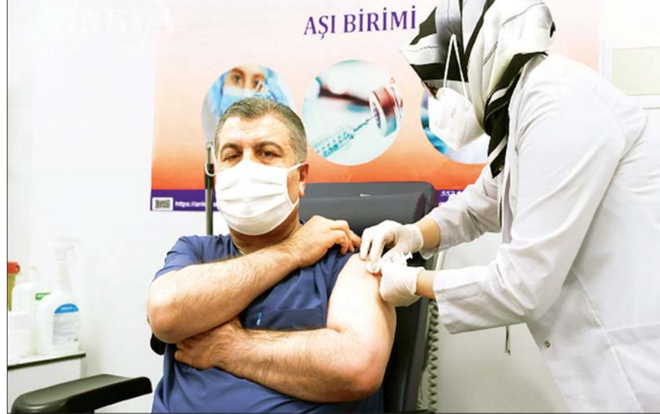
တူရကီကျန်းမာရေးဝန်ကြီး တရုတ်နိုင်ငံထုတ် ကာကွယ်ဆေးထိုးနှံမှုခံယူနေသည်ကို တွေ့ရစဉ်။