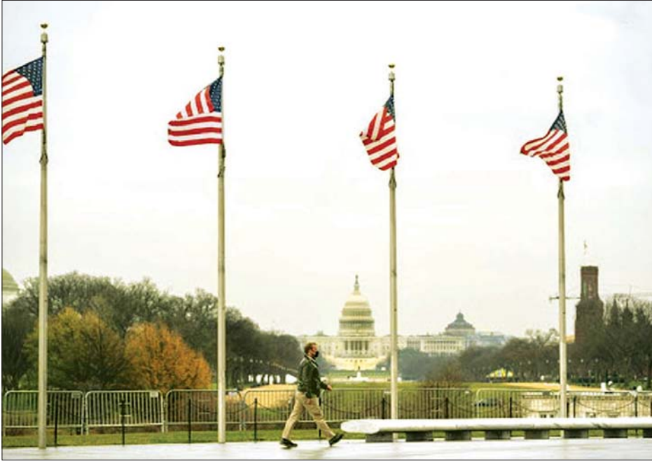
ဝါရှင်တန်ဒီစီရှိ လမ်းပေါ်တွင် ပါးစပ်၊ နှာခေါင်းစည်းတပ်လျက် သွားလာနေသူတစ်ဦးကို တွေ့ရစဉ်။