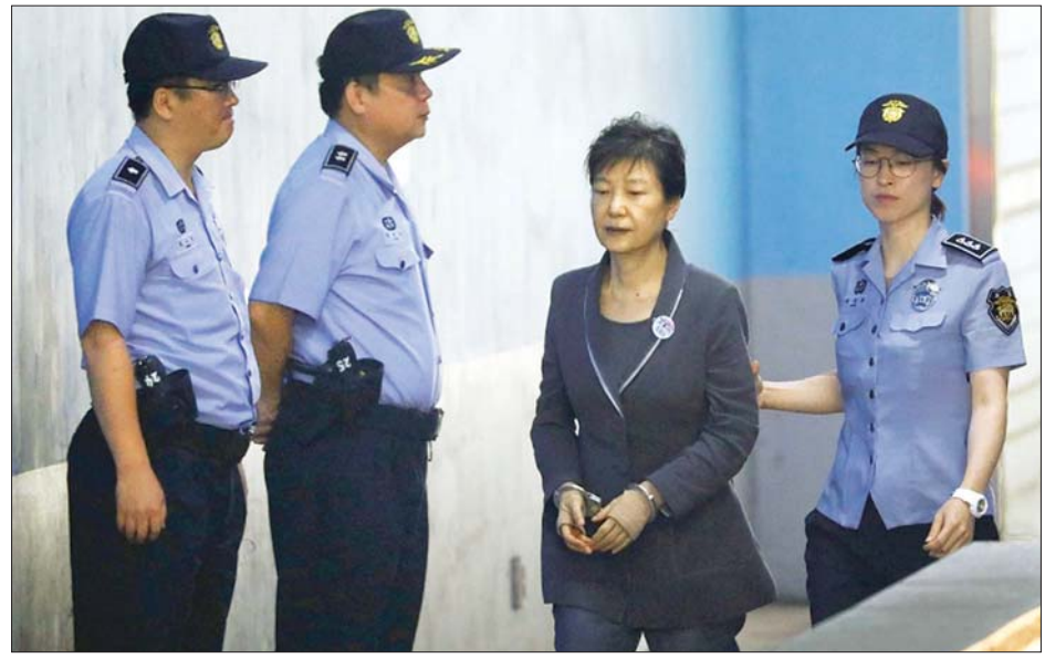
တောင်ကိုရီးယားသမ္မတဟောင်း ပတ်ဂွမ်ဟေးကို ဆိုးလ်မြို့ရှိ တရားရုံး၌ ခေါ်ဆောင်လာစဉ်။

ပတ်ဂွမ်ဟေးသည် ချိုင်ဆွန်ဆီ ချုပ်ကိုင်ထားသည့် ဖောင်ဒေးရှင်း နှစ်ခုသို့ အမေရိကန်ဒေါ်လာ သန်းချီ လှူဒါန်းရန် ဆမ်ဆောင်းကုမ္ပဏီကို အတင်းအကျပ် ဖိအားပေးခဲ့မှုဖြင့် တရားစွဲခံခဲ့ရသည်။