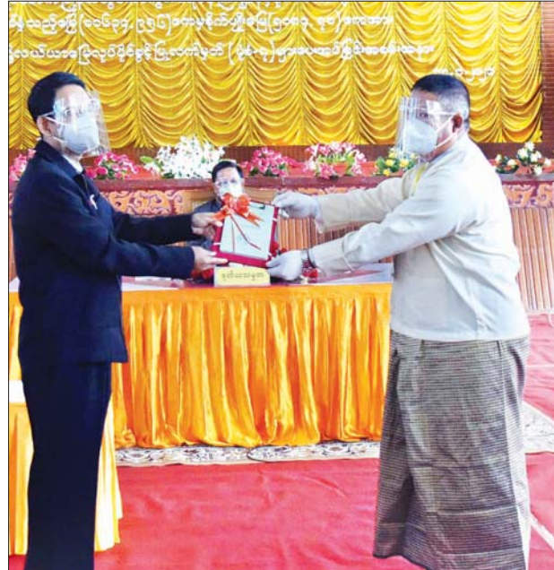
ပြည်ထောင်စုဝန်ကြီး ဒေါက်တာအောင်သူ တောင်သူများကိုယ်စား တောင်သူတစ်ဦးအား လယ်ယာမြေလုပ်ပိုင်ခွင့် လက်မှတ် (ပုံစံ- ၇) များ ပေးအပ်စဉ်။