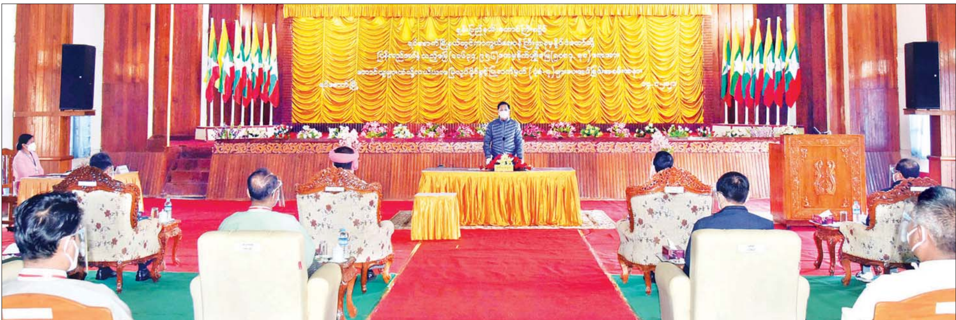
ဒုတိယသမ္မတ ဦးဟင်နရီဗန်ထီးယူ ရှမ်းပြည်နယ်(တောင်ပိုင်း) တောင်ကြီးခရိုင် ရပ်စောက်မြို့နယ်အတွင်း ကာကွယ်ရေးဝန်ကြီးဌာနမှ ပြန်လည်စွန့်လွှတ်အပ်နှံသည့် လယ်ယာမြေများအား တောင်သူများထံသို့ လယ်ယာမြေ လုပ်ပိုင်ခွင့်ပြု လက်မှတ် (ပုံစံ -၇) လွှဲပြောင်းပေးအပ်ခြင်း အခမ်းအနားတွင် အမှာစကားပြောကြားစဉ်။