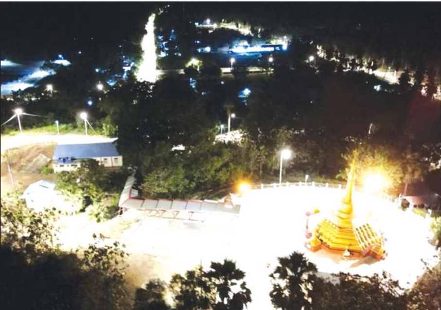
ကိုကိုးကျွန်းမြို့၏ အလင်းရောင်ပြာနေသော ညဘက်မြင်ကွင်း။

နိုင်ငံတော်အစိုးရသည် ရေရှည်တည်တံ့ခိုင်မြဲပြီး ဟန်ချက်ညီသော ဖွံ့ဖြိုးတိုးတက်မှုများ နိုင်ငံတစ်ဝန်း ဖြစ်ထွန်းလာအောင် အစဉ်တစိုက် ဆောင်ရွက်လျက်ရှိသည်။ မြို့ပြနှင့် ကျေးလက်ဒေသများသာမက ဝေလံခေါင်များနေရာဒေသများရှိ ပြည်သူများ၏ လူမှုစီးပွားဘဝအခြေအနေ ဖွံ့ဖြိုးတိုးတက်လာစေရေးကိုပါ ကြိုးပမ်းအကောင်အထည်ဖော် ဆောင်ရွက်လျက်ရှိသည်။ ထို့အပြင် ဖွံ့ဖြိုးတိုးတက်မှု အသီးအပွင့်များကို တိုင်းရင်းသားပြည်သူအားလုံး ရပ်ဝေးဒေသများပါမကျန် ညီတညီမျှတစွာရရှိနိုင်ရန် ကြိုးပမ်းဆောင်ရွက်လျက်ရှိသည်မှာ ယနေ့ကိုကိုးကျွန်းမြို့၏ ဖွံ့ဖြိုးတိုးတက်မှု ပြယုဂ်က သာဓက ပြခဲ့ပြီဖြစ်သည်။