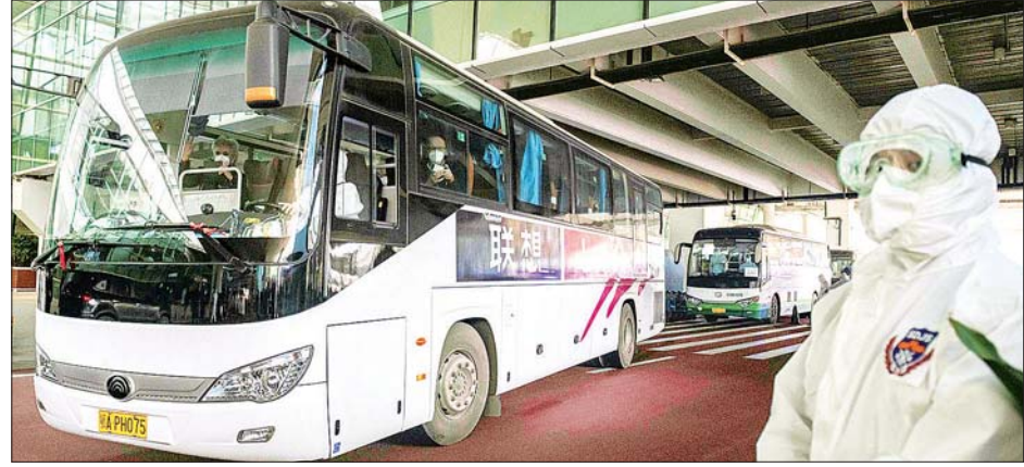
ဂူဟန်သို့ ရောက်ရှိလာသော ကမ္ဘာ့ကျန်းမာရေးအဖွဲ့က စေလွှတ်လိုက်သည့် ကျွမ်းကျင်သူများလိုက်ပါလာသော မော်တော်ယာဉ်။