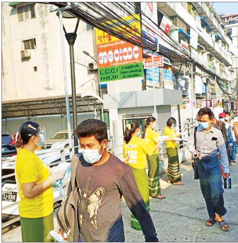
ကမာရွတ်မြို့နယ်၌ ကိုဗစ်-၁၉ ရပ်တန့်ရေး အဝါရောင်လှုပ်ရှားမှုအဖြစ် နှာခေါင်းစည်းများ ဝေငှပေးစဉ်။

ကျန်းမာရေးနှင့် အားကစား ဝန်ကြီးဌာန၊ ရန်ကုန်တိုင်းဒေသကြီး အစိုးရအဖွဲ့တို့ ဦးဆောင်သည့် ကိုဗစ်- ၁၉ ရောဂါရပ်တန့်ရေး လှုပ်ရှားမှုဖြစ် သည့် “STOP COVID-19, Mask တပ်ပါ၊ လက်ဆေးပါ၊ ခပ်ခွာခွာနေပါ၊ တစ်ဦးကို တစ်ဦး အသိပေးပါ၊ သတိ ပေးပါ”ဟူသည့် စာများပါရှိသော အဝါ ရောင် အသိပညာပေးဆိုင်ဘုတ်များ ကို ယနေ့နံနက်ပိုင်းတွင် ပြည်လမ်း၊ မာလာဆောင်အနီး ကမ္ဘောဇဘဏ် စာမျက်နှာ ၉ ကော်လံ ၄