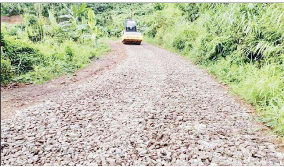
မင်းတပ်-ဘော(၃)-ရှက်-ယာယော-လုပ်ရုံ-ခွဲလုံလမ်း အဆင့်မြှင့်တင်ဆောင်ရွက်စဉ်။

နေပြည်တော် ဇန်နဝါရီ ၁၄ နယ်စပ်ရေးရာဝန်ကြီးဌာန နယ်စပ်ဒေသနှင့် တိုင်းရင်းသား လူမျိုးများ ဖွံ့ဖြိုးတိုးတက်ရေးဦးစီးဌာနမှ ချင်းပြည်နယ် မင်းတပ်မြို့နယ်အတွင်းရှိ မင်းတပ်-ဘော(၃)-ရှက်-ယာယော-လုပ်ရုံ-ခွဲလုံလမ်း မိုင် ၂၀ အနက် ကိုးမိုင်မှာ ကျောက်ချောလမ်း ခင်းကျင်းမှုပြီးစီးပြီး ကျန် ၁၁ မိုင်မှာ နှစ်မိုင်ကို ကျောက်ချောလမ်း ခင်းခြင်းလုပ်ငန်း ဆောင်ရွက်လျက် ရှိသည်။