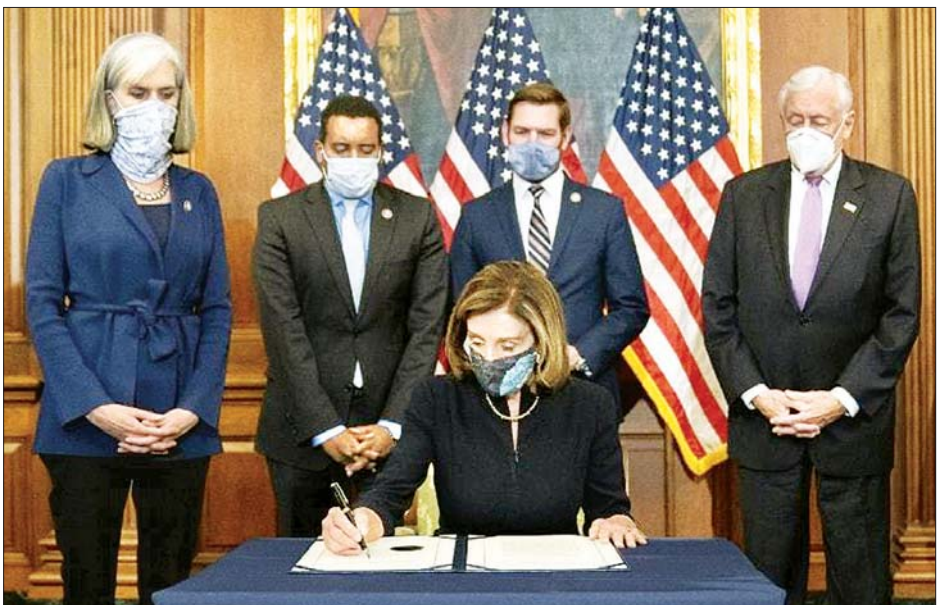
သမ္မတထရမ်ကို စွဲချက်တင်ရန် မဲခွဲဆုံးဖြတ်မှုတွင် ပါဝင်ခဲ့သည့် အောက်လွှတ်တော်ဥက္ကဋ္ဌ နနီစီပယ်လိုစီ။

ပြီးခဲ့သည့် ရက်သတ္တပတ်က အမေရိကန် လွှတ်တော် အဆောက်အအုံ၌ ထရမ်ကို ထောက်ခံသည့် ဆန္ဒပြသူများ ဝင်ရောက်စီးနင်းခဲ့မှုကြောင့် လူ့အချို့ သေဆုံးခဲ့ကာ ယင်းကိစ္စဖြစ်အောင် လှုံ့ဆော်ခဲ့မှုဖြင့် အောက်လွှတ်တော် ဒီမိုကရက်တစ်အမတ်များက သမ္မတထရမ်ကို စွဲချက် တင်ရန် ကြိုးပမ်းခဲ့ခြင်းဖြစ်ကြောင်း သိရသည်။ အင်နီအိတ်ချ်ကော့