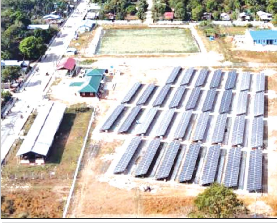
၂၄ နာရီ လျှပ်စစ်ဓာတ်အား ပေးနေသော ဓာတ်အားပေးစက်ရုံကို တွေ့ရစဉ်။ ကျော်စိုး(ကိုကိုးကျွန်း)

သို့ဖြစ်၍ ရန်ကုန်တိုင်းဒေသကြီး ကိုကိုးကျွန်းမြို့နယ် အား ၂၄ နာရီ လျှပ်စစ်ဓာတ်အား သုံးစွဲနိုင်ရေး ကြိုးပမ်း ဆောင်ရွက်ပေးနိုင်ခဲ့မှုသည် နိုင်ငံတော်အစိုးရ၏ ပြည်သူ တို့အတွက် လူမှုစီးပွားဘဝ ဖွံ့ဖြိုးတိုးတက်ရေး ရည်မှန်း ချက်တစ်ရပ်ကို လျှပ်စစ်နှင့် စွမ်းအင်ဝန်ကြီးဌာနနှင့် ရန်ကုန်တိုင်းဒေသကြီး အစိုးရတို့က ပူးပေါင်းဆောင်ရွက် အကောင်အထည်ဖော်ပေးနိုင်ခြင်းဖြစ်သည့်အပြင် အစိုးရ ဌာန အဖွဲ့အစည်းများနှင့် ပြည်ပတို့၏ ပူးပေါင်း ဆောင် ရွက်မှုကြောင့် ဖွံ့ဖြိုးတိုးတက် အောင်မြင်မှု အသီးအပွင့် ရလဒ်တစ်ခုပင် ဖြစ်ပါကြောင်း။ ။