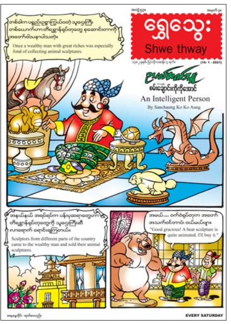
ဆရာကြီးကို အလွန်လေးစား ကြည်ညိုသွားကြပုံ အကြောင်းကို ပညာပေးတင်ဆက်ထားသည့် “တပည့် လိမ္မာ” ကလေးဝတ္ထု၊ ကလေးတို့ပေးပို့သော ကာတွန်း လက်ရာများကို ဖော်ပြပေးထားသည့် “ရွှေသွေးတို့ လက်ရာ” ကဏ္ဍအပါအဝင် အင်္ဂလိပ်စာကဏ္ဍ၊ ကဗျာကဏ္ဍ စုံလင်စွာဖြင့် ဖတ်စရာ မှတ်စရာများ ပါရှိကြောင်း သိရ သည်။ သတင်းစဉ်

ဇန်နဝါရီလ ၁၆ ရက် (စနေနေ့) တွင် ထုတ်ဝေမည့် ရွှေသွေးဂျာနယ်တွင် သစ်သားနှင့် မထုလုပ်ဘဲ ငါးခြောက် နှင့် အခြားပစ္စည်းများကို ရောနှောကာ ကြွက်ရုပ်တုကို ထုလုပ်ထားသည့် ဉာဏ်ရည်ထက်မြက်သော မောင်ညို အကြောင်းကို တင်ဆက်ထားသည့် “ဉာဏ်ထက်သူ” မျက်နှာပုံကားတွန်း၊ ရှမ်းတိုင်းရင်းသားအများစု၏ ရိုးရာ ဟင်းလျာများတွင် အသုံးပြုကြသည့် ရှမ်းပဲပုပ်အကြောင်း ကို တင်ဆက်ထားသည့် “ရှမ်းပဲပုပ်” သုတေသနပါး၊ မြန်မာ့ဆိုင်းဝိုင်းတွင် အသုံးပြုသော လေမှုတ်တူရိယာများ အနက် အဓိကအကျဆုံးနှင့် အသုံးအတွင်ကျယ်ဆုံး တူရိယာဖြစ်သော နှဲအကြောင်းကို ရေးသားထားသည့် “နှဲအကြောင်း သိကောင်းစရာ” သုတေသနပါးကဏ္ဍ၊ ကလေးတို့ စိတ်ကြိုက်အရောင်များကို ရွေးချယ်ပြီး အရောင်များ ခြယ်သန့်ရန် တင်ဆက်ထားသည့် “ဆေးရောင်လှလှမြယ်ကြမယ်” ကဏ္ဍ၊ ကိုဗစ်ကပ်ရောဂါ များကူးစက်မှုကို ကာကွယ်နိုင်ရန်အတွက် ထုတ်ပြန်ထား သည့် စည်းကမ်းချက်များကို မပျံ့မလျှော့ဘဲ ဆက်လက် လိုက်နာရန်လိုအပ်ကြောင်း ပညာပေးတင်ဆက်ထားသည့် “မောင်ထွေးလေးနှင့် ကိုဗစ်” နှစ်မျက်နှာကားတွန်း၊ တပည့်လိမ္မာလေးကြောင့် အိမ်ဖော်အားလုံးတို့သည်