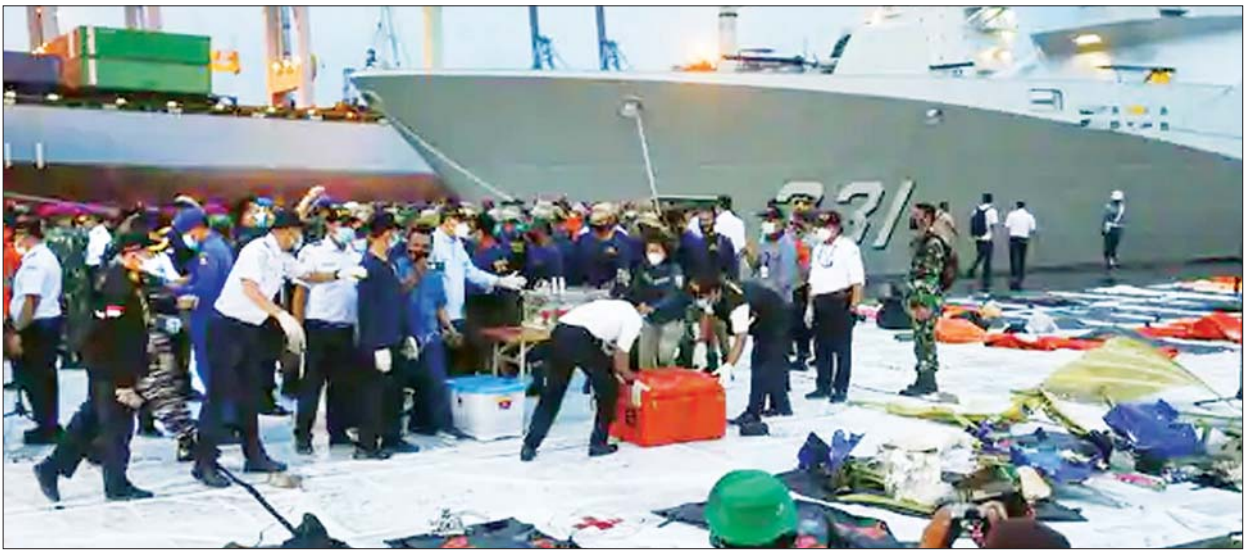
ပျက်ကျခဲ့သည့် လေယာဉ်အပိုင်းအစတွေကို တွေ့ရစဉ်။

အခုချိန်ထိကတော့ သက်ဆိုင်ရာအာဏာပိုင်တွေဟာ ပျံတက်ပြီး လေးမိနစ်အကြာမှာ ပျက်ကျခဲ့တဲ့ သက်တမ်း ၂၆ နှစ်ရှိပြီဖြစ်တဲ့ လေယာဉ်ကြီး ဘာကြောင့် ပျက်ကျခဲ့သလဲဆိုတာကိုတော့ မရှင်းပြနိုင်သေးပါဘူး။ အမေရိကန် အမျိုးသားသယံဇာတဆိုင်ရာဆိုင်ရာ ဘေးအန္တရာယ်