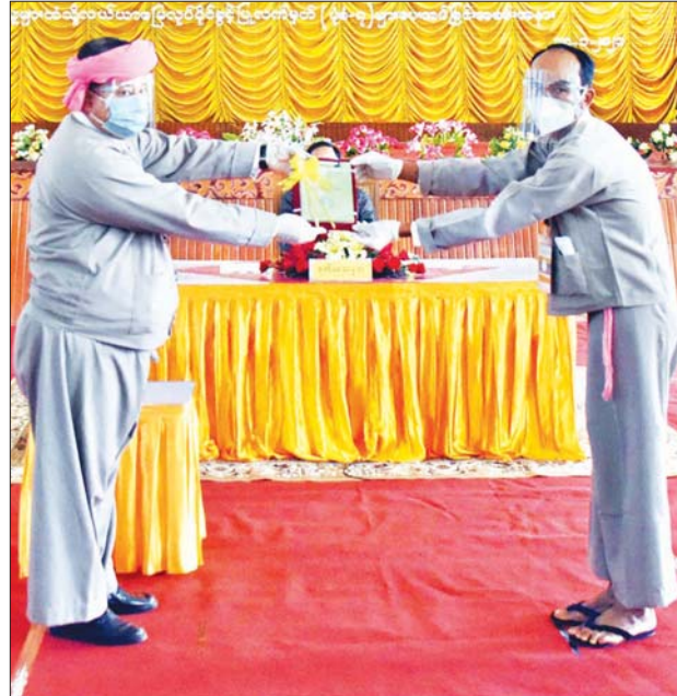
ရှမ်းပြည်နယ်ဝန်ကြီးချုပ် ဒေါက်တာလင်းထွဋ် တောင်သူများကိုယ်စား တောင်သူတစ်ဦးအား လယ်ယာမြေလုပ်ပိုင်ခွင့် လက်မှတ် (ပုံစံ- ၇) များ ပေးအပ်စဉ်။