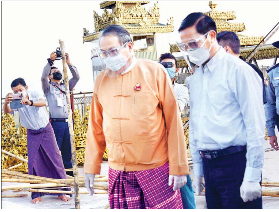
ဒုတိယသမ္မတ ဦးဟင်နရီဗန်ထီးယူ သမိုင်းဝင်ကျိုက်သလုံစေတီတော်ရင်ပြင် မြေထိန်းနံရံ တည်ဆောက်နေမှုကို ကြည့်ရှုစစ်ဆေးစဉ်။

ယခုကဲ့သို့ လယ်ယာမြေလုပ်ပိုင်ခွင့်ပြုလက်မှတ်ရရှိ ကြသည့် တောင်သူများအနေဖြင့် ၂၀၁၂ ခုနှစ် လယ်ယာမြေ ဥပဒေပါ လယ်ယာမြေကို လုပ်ပိုင်ခွင့်နှင့် ယင်းမှပေါ်ထွက်