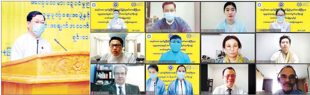
ပြည်ထောင်စုဝန်ကြီး ဦးသိန်းဆွေ လူမှုဖူလုံရေးအဖွဲ့နှင့် ILO တို့ ပူးပေါင်းဆောင်ရွက်လျက်ရှိသည့် သတင်းအချက်အလက်စီမံခန့်ခွဲမှုစနစ်နှင့် e-Services လုပ်ငန်းများ ရှင်းလင်းတင်ပြခြင်း အခမ်းအနားတွင် အဖွင့်အမှာစကားပြောကြားစဉ်။

လူမှုဖူလုံရေးအဖွဲ့သည် လူမှုဖူလုံရေးစီမံကိန်းကို အကောင်အထည်ဖော် ဆောင်ရွက်ရာတွင် မြို့နယ်ပေါင်း ၁၁၆ မြို့နယ်ရှိ အကျိုးဝင် အာမခံအလုပ် သမားပေါင်း ၁ ဒသမ ၃၄ သန်းခန့်၏ ကျန်းမာရေးစောင့်ရှောက်မှုနှင့် အကျိုး ခံစားခွင့်များကို အလုပ်သမားဆေးရုံကြီးသုံးရုံ၊ ရုံးခွဲပေါင်း ၇၈ ရုံး၊ မြို့နယ် ဆေးခန်းပေါင်း ၉၆ ခန်း၊ ဌာနကြီးဆေးခန်း ၅၈ ခန်း၊ PPS စနစ်ဖြင့် (fee for services payment) ဆေးခန်း ရှစ်ခန်း၊ PPS စနစ်ဖြင့် (Capitation payment) ဆေးခန်း ၁၀ ခန်းနှင့် တိုင်းရင်းဆေးကုခန်း တစ်ခန်းအပြင် ရွှေ့လျား ဆေးကုသယာဉ်နှစ်စီးဖြင့် ဆောင်ရွက်လျက်ရှိပါကြောင်း။