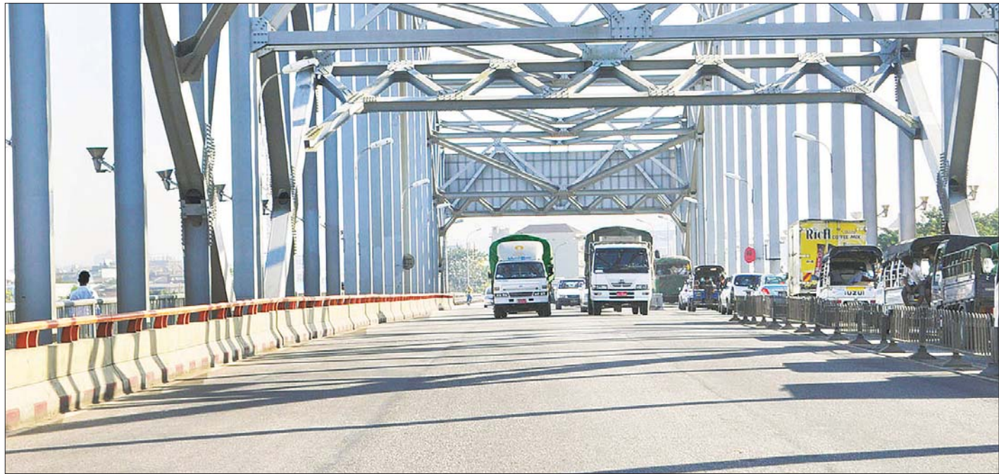
လှိုင်မြစ်ကူး ဘုရင့်နောင်တံတား အမှတ် (၂) ပေါ်မှ ဖြတ်သန်းသွားလာနေသည့် ကုန်တင်ယာဉ်များကို တွေ့ရစဉ်။

ရန်ကုန်မြို့ စက်မှုဇုန်များ၊ ဘုရင့်နောင်ပွဲရုံ၊ သီရိမင်္ဂလာ ဈေးနှင့်ကုန်စည်ဒိုင်များသို့ ဧရာဝတီတိုင်းဒေသ ကြီးနှင့် နယ်မှယာဉ်များ၊ ဆိပ်ကမ်းမှကုန်သွယ်ရေးကုန်များ လုပ်ငန်းခွင်လည်ပတ်မှုကြောင့် လှိုင်မြစ်ကူး တံတားကြီး လေးစင်းနှင့် အင်းစိန်လမ်းမကြီး၊ ဘုရင့်နောင် လမ်းမကြီး၊ ကြည့်မြင်တိုင် ကမ်းနားလမ်းနှင့် ဗိုလ်တထောင် ကမ်းနားလမ်းတစ်လျှောက် စာမျက်နှာ ၃ ကော်လံ ၄ ❖