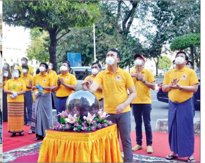
လိုက်နာသွားရန်အတွက် New normal | New Living | New Yangon ဟူ၍ ဆောင်ပုဒ်နှင့်အညီ သတ်မှတ်ဆောင်ရွက်လျက်ရှိကြောင်း၊ အထူးသဖြင့် နှာခေါင်းစည်းတပ်ဆင်ခြင်းကို အလေ့အကျင့်တစ်ခုအဖြစ် ရေရှည်ဆောင်ရွက်ခြင်း