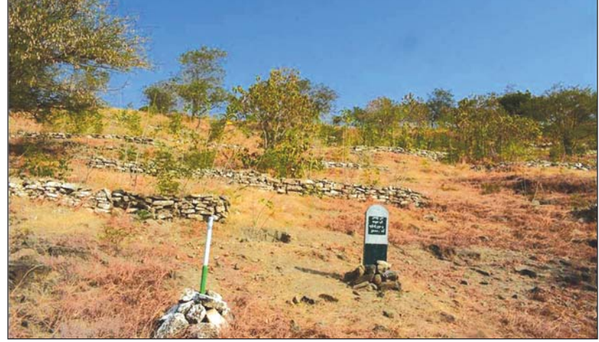
ဗောဓိတစ်ထောင်ဒေသ အထူးစိမ်းလန်းစိုပြည်ရေး လုပ်ငန်းအား တွေ့ရစဉ်