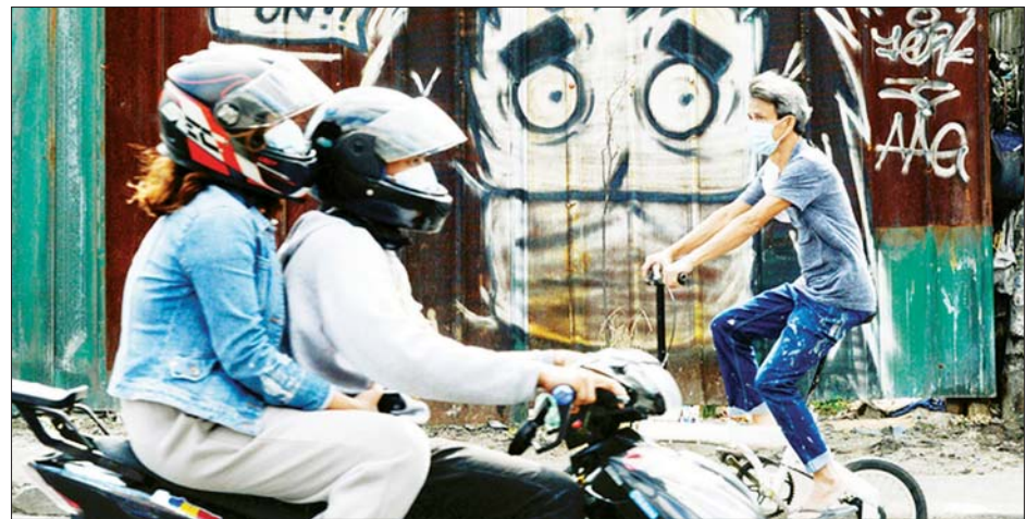
နာခေါင်းစည်းတပ်ဆင်ကာ သွားလာလှုပ်ရှားနေကြသည့် ဖိလစ်ပိုင်ပြည်သူအချို့ကို တွေ့ရစဉ်။

ရောဂါကြောင့်နေ့စဉ်သေဆုံးသူအရေ အတွက် နှစ်ရက်ဆက်တိုက် ၁၀၀ ကျော်ရှိပြီဖြစ်ကြောင်း သိရသည်။ လက်ရှိတွင် ရောဂါပျောက်ကင်း သွားသူ ၃၉၇ ဦးရှိရာ တစ်နိုင်ငံလုံးရှိ