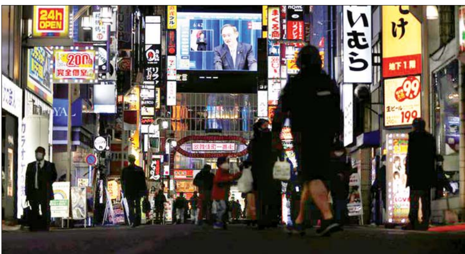
ဂျပန်ဝန်ကြီးချုပ် ဆူဂါ ရိုရှီဟိဒဲးက ဇန်နဝါရီ ၁၃ ရက်တွင် ပြည်သူ့လူထုပါဝင်ရန် ပန်ကြားသည့် သတင်းစာရှင်းလင်းပွဲတစ်ခုပြုလုပ်နေသည်ကို ရုပ်မြင်သံကြားတွင် တွေ့ရစဉ်။

ကြောင်း သိရသည်။ နိုင်ငံတော်အရေးပေါ်အခြေအနေကြေညာချက်အရ ပြည်သူများအနေဖြင့် မလိုအပ်ဘဲ အပြင်ထွက်ခွင့် မရှိသလို ရုံးတက်ရုံးဆင်းလုပ်ရသည့် လုပ်သားထုပ်ဖာဖက်လည်း ဂျပန်နိုင်ငံအထိ လျှော့ချလိုက်သလို