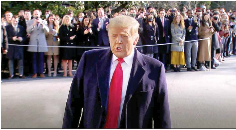
အမေရိကန်သမ္မတ ဒေါ်နယ်ထရမ်။

ပြီးခဲ့သည့်ရက်သတ္တပတ်အတွင်း ၎င်းပြောဆိုခဲ့သည့် မိန့်ခွန်းသည် လုံးဝသင့်လျော်မှန်ကန်သည့် မိန့်ခွန်းဖြစ်ပြီး အောက်လွှတ်တော် ဒီမိုကရက်တစ်အမတ်များက ၎င်းအား ဖြုတ်ချရန် ကြိုးပမ်းခြင်းသည် အလွန်ရယ်စရာကောင်း ကြောင်း၊ ထိုသို့လုပ်ဆောင်မှုကြောင့် လူထု၏ဆူပူအုံကြွမှု