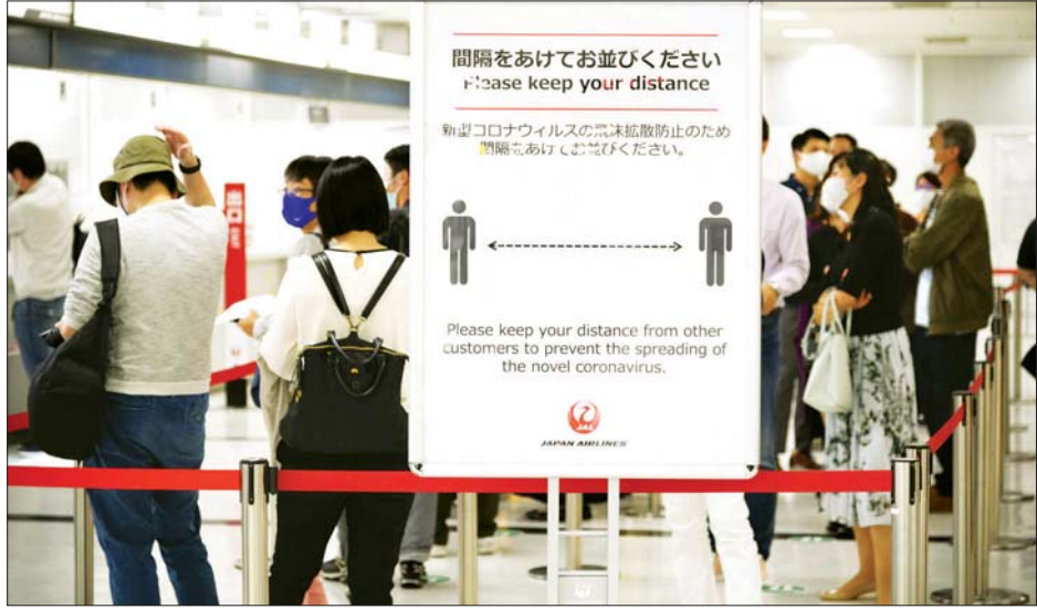
တစ်ဦးနှင့်တစ်ဦး ခပ်ဝေးဝေးနေရန် သတိပေးထားသည့် ဆိုင်းဘုတ်ကို ဂျပန်လေဆိပ်တစ်ခုတွင် တွေ့ရစဉ်။

စင်ကာပူနိုင်ငံမှ အလုပ်ကိစ္စဖြင့်ပြန်လည်ရောက်ရှိလာသော လုပ်ငန်းအကြီးအကဲတစ်ဦးက မိမိအနေဖြင့် ကိုဗစ်-၁၉ ထောက်ခံစာကို ထုတ်ပေးနိုင်သည့် ဆေးရုံကို ရှာဖွေရသည်မှာ အခက်အခဲဖြစ်ကြောင်း ပြောကြားခဲ့သည်။ အဆိုပါကိစ္စမှာ ဝန်ထုပ်ဝန်ပိုးတစ်ခုဖြစ်သော်လည်း လုပ်ဆောင်ရမည့်ကိစ္စဖြစ်သည်ဟု မိမိအနေဖြင့် ယုံကြည်ကြောင်း ပြောကြားခဲ့သည်။ အင်န်အိတ်ချ်က