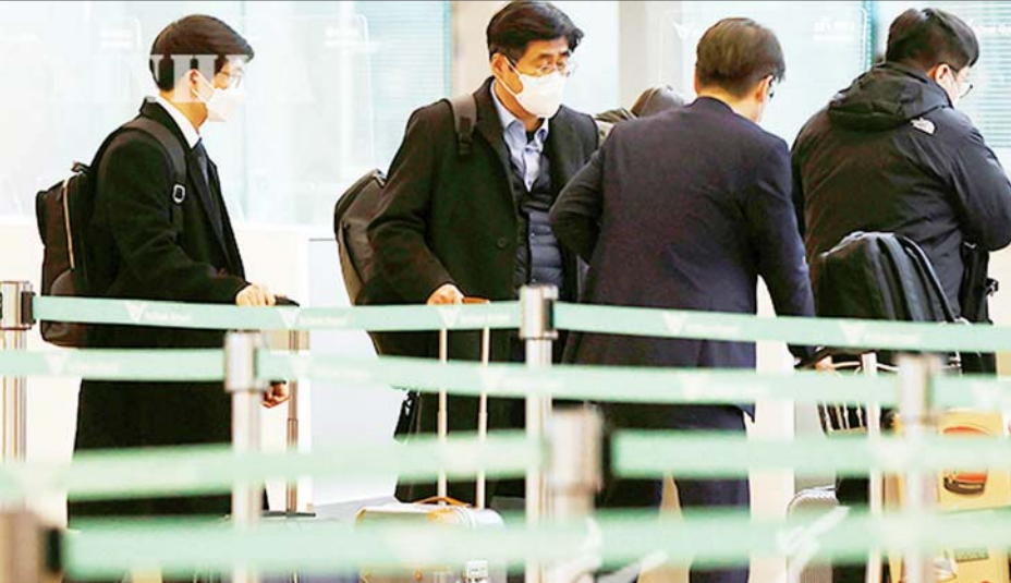
ဇန်နဝါရီ ၆ ရက်က ထိန်းသိမ်းခံ ရေနံတင်သင်္ဘောကိစ္စနှင့်ပတ်သက်၍ ဆွေးနွေးညှိနှိုင်းရန် အီရန်သို့ သွားရောက်သည့် တောင်ကိုရီးယားကိုယ်စားလှယ်အဖွဲ့ကို အင်ချွန်လေဆိပ်၌ တွေ့ရစဉ်။