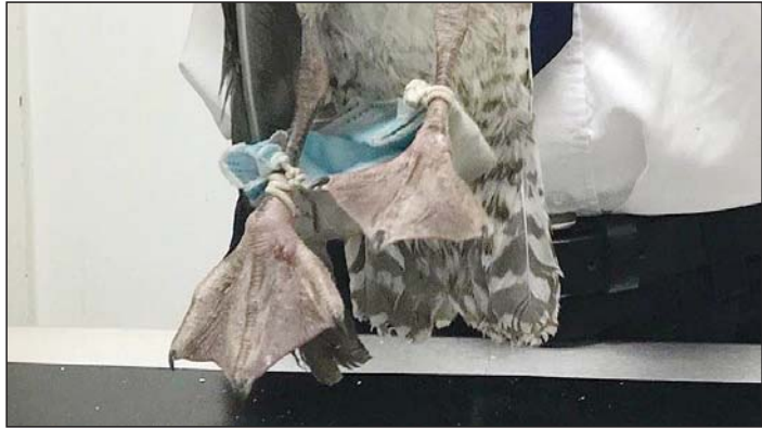
စင်ရော်ငှက်ခြေထောက်တွင် ရစ်ပတ်နေသည့် စွန့်ပစ်နှာခေါင်းစည်းကို တွေ့ရစဉ်။

“စွန့်ပစ်နှာခေါင်းစည်း၊ ရော်ဘာလက်အိတ်နဲ့ အခြားသော အကာအကွယ် စွန့်ပစ်ပစ္စည်းတွေကြောင့် မြစ်တွေနဲ့ပင်လယ်တွေကို ညစ်ညမ်းစေပါတယ်။ လွန်ခဲ့တဲ့ နှစ်အတွင်း ကမ္ဘာ့သမုဒ္ဒရာတွေထဲမှာ စွန့်ပစ်နှာခေါင်းစည်း ၁ ဒသမ ၅ ဘီလီယံကျော်လောက် ရောက်နေပြီလို့ သဘာဝပတ်ဝန်းကျင်ထိန်းသိမ်းရေး အုပ်စုဖြစ်တဲ့ အိုဂျန်းအေးရှားက ပြောပါတယ်”