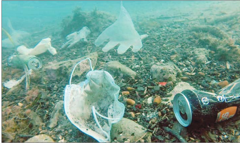
မြေထဲပင်လယ်အတွင်းက ရေငုပ်သမားများ တွေ့ရှိခဲ့သည့် စွန့်ပစ်နှာခေါင်းစည်းနှင့် လက်အိတ်များ။

နောက်ပြီး မိုင်ယာမိကမ်းရိုးတန်းမှာ တွေ့ရှိရတဲ့ ပင်လယ်ငါးတစ်ကောင်ရဲ့ ဗိုက်ထဲမှာလည်း အလားတူပဲ တွေ့ရှိခဲ့ရပါတယ်။ ပြီးခဲ့တဲ့ စက်တင်ဘာလအတွင်းကလည်း မြေထဲပင်လယ်အနီး ရေငန်အိုင်အတွင်းမှာ ကဏန်း