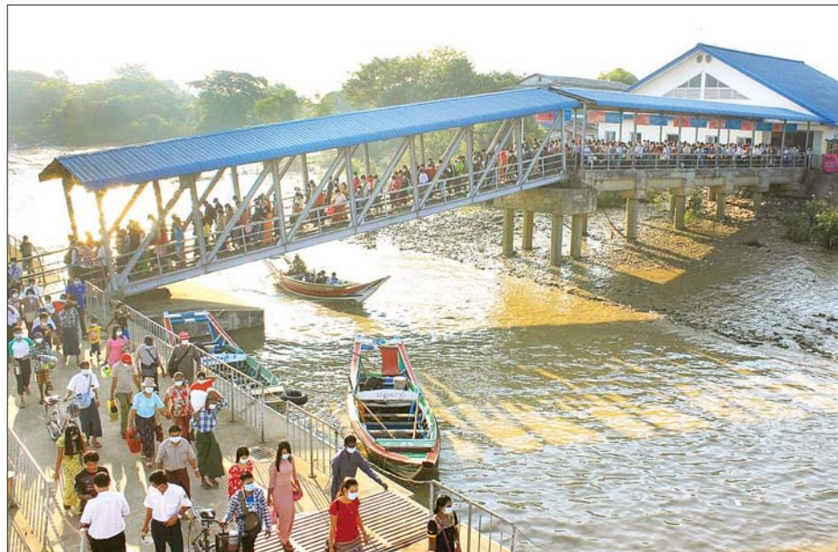
ရန်ကုန်- ဒလ သင်္ဘောစီးခရီးသည်များ။