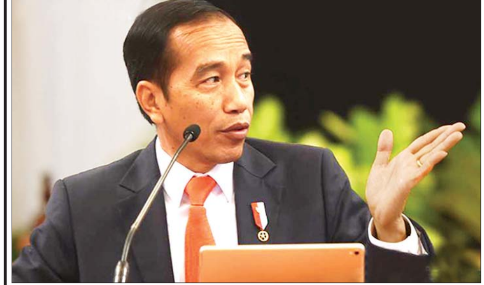
အင်ဒိုနီးရှားသမ္မတ ဂျိုကို ဝီဒိုဒိုကို တွေ့ရစဉ်။

ဂျပန်တစ်နိုင်ငံ အိမ်ထောင်စု တရုတ်နိုင်ငံ ဆီနီဗက် ဘိုင်းရွန်တက်ခံ ကုမ္ပဏီမှ ထုတ်လုပ်သည့် ကိုဗစ်-၁၉