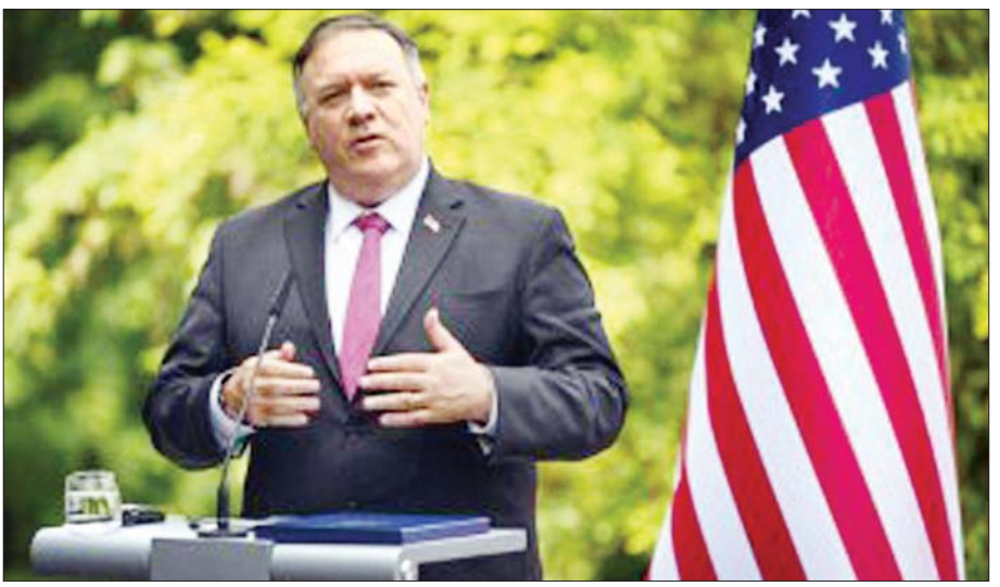
အမေရိကန်နိုင်ငံခြားရေးဝန်ကြီး မိုက်ပွန်ပီအို။

ဆက်စပ်သည့်ပစ္စည်းများ ရောင်းချခြင်းနှင့် တင်ပို့ခြင်းတို့ကို ပိတ်ပင်သွားမည်ဖြစ်သည်။ လူသားချင်း စာနာထောက်ထားမှုကိစ္စရပ်များမှလွဲ၍ စီးပွားရေးဆိုင်ရာ အကူအညီများကိုလည်း ပိတ်ပင်သွားမည်ဖြစ်သည်။ အမေရိကန်သည် ကျူးဘားနိုင်ငံကို အကြမ်းဖက်သမားများအား ကူညီပေးသည့် နိုင်ငံများစာရင်းတွင် ၁၉၈၂ ခုနှစ်က ထည့်သွင်းခဲ့သည်။ သမ္မတအိုဘားမားလက်ထက် ၂၀၁၅ ခုနှစ်တွင် အဆိုပါစာရင်းမှ ပယ်ဖျက်ပေးခဲ့သည်။ နှစ်နိုင်ငံပုံမှန် ဆက်ဆံရေး ထူထောင်နိုင်ရန် ဆွေးနွေးစဉ်အတွင်း ပယ်ဖျက်ပေးခဲ့ခြင်းဖြစ်သည်။ အင်န်အိတ်ချ်က