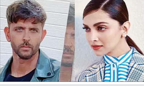
ဘောလီဝုဒ်မင်းသား ရီသီကီရိုရှန်နှင့် မင်းသမီးဒီပီကာ။

ရီသီကီရိုရှန်ရဲ့ ရုပ်ရှင်အသစ်ဖြစ်တဲ့ Fighter ဆိုတဲ့ဇာတ်ကားမှာ ရုပ်ရှင်မင်းသမီး ဒီပီကာပက်ဒူကောန်နှင့်အတူ ရိုက်ကူးသွားမယ်လို့ သိရပါတယ်။ ရီရှန်နဲ့အတူ တွဲပြီးဇာတ်ကားရိုက်ချင်တဲ့ ဒီပီကာရဲ့ဆန္ဒလည်း ပြည့်ဝသွားပြီလို့ ဆိုရမှာပါ။ ရီရှန်ရဲ့ (၄၇) နှစ်မြောက်မွေးနေ့မှာတော့ Fighter ဆိုတဲ့ ရုပ်ရှင်ကားရိုက်သွားမယ် လို့ ပရိသတ်တွေကို အသိပေးခဲ့ပါတယ်။ ဒီဇာတ်ကားဟာ အက်ရှင်ဇာတ်ကားဖြစ်ပြီး ၂၀၂၂ ခုနှစ် စက်တင်ဘာ ၃၀ ရက်မှာ ရုံတင်ပြသနိုင်လိမ့်မယ်လို့ ရက်သတ်မှတ် ထားပါတယ်။ ဒီရုပ်ရှင်ဇာတ်ကားကို ရိုက်ကူးမယ့် ဒါရိုက်တာ ဆစ်ထီဒါအာနန် ကတော့ သူ့သဘောအကျဆုံး မင်းသား၊ မင်းသမီးနဲ့ ရိုက်ရမှာဖြစ်လို့ စိတ်လှုပ်ရှား စရာ အကောင်းဆုံးအချိန်ပဲလို့ ပြောပါတယ်။ ဒီပီကာနဲ့ ခင်ပွန်းသည်ဖြစ်သူ ရစ်ဗီယာဆင်းတို့ နှစ်ဦးစလုံးဟာ ရီရှန်ရဲ့ အက်ရှင်ဇာတ်ကားဖြစ်တဲ့ War ဆိုတဲ့ဇာတ်ကားကို ကြိုက်နှစ်သက်ကြတယ်လို့ ပြောခဲ့ဖူးပါတယ်။ မကြာခင်မှာရိုက်ကူးတော့မယ့် Fighter ရုပ်ရှင်ဇာတ်ကား မှာလည်း ဒီပီကာအတွက် အက်ရှင်အခန်းတွေ အများကြီးပါဝင်လိမ့်မယ်လို့ မျှော်လင့်ထားပါတယ်။ ဘောလီဝုဒ်လီကီဖီ