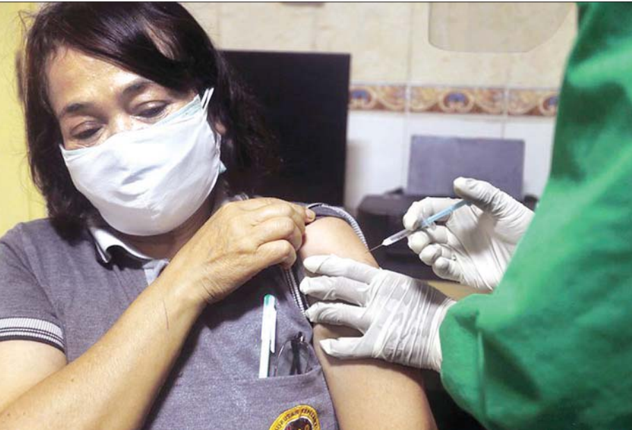
အင်ဒိုနီးရှားနိုင်ငံ ဘာလီတွင် ကိုဗစ်-၁၉ ကာကွယ်ဆေးစမ်းသပ်ထိုးနှံပေးစဉ်။

ပိတ်ဆို့မှု ချမှတ်လိုက်သလို ဇန်နဝါရီ ကြောင့်သေဆုံးသူပေါင်း ၃၇၀၄ ဦး ရှိလာခဲ့သည်။ ကိုဗစ်-၁၉ ကာကွယ်ဆေးထိုး အစီအစဉ်ကို ၂၀၂၀ ပြည့်နှစ် ဒီဇင်ဘာ ၂၀ ရက်ကစတင်လိုက်ပြီးနောက်ပိုင်း တွင် နိုင်ငံလူဦးရေ ၉ ဒီဃမ ၃ သန်း တွင် ၂၀ ရာခိုင်နှုန်း (၁၈၅၄၀၅၅ ဦး) ကာကွယ်ဆေး ထိုးနှံပေးနိုင်ခဲ့သည်။ အစွမ်းတွင်နိုင်ငံတွင် ဇန်နဝါရီ ၁၂ ရက်က ဆရာဆရာမများနှင့် တခြား ပညာရေးဝန်ထမ်းများကို ကာကွယ် ဆေးများ ထိုးနှံပေးခဲ့ကြောင်း သိရ သည်။ နိုင်ငံအတွင်း ကိုဗစ် - ၁၉ ကူးစက်ဖြစ်ပွားသူပေါင်း ၅၀၄၆၉ ဦးအထိရှိခဲ့ကာ၊ ကိုဗစ် - ၁၉ ဆင်ဟွာ