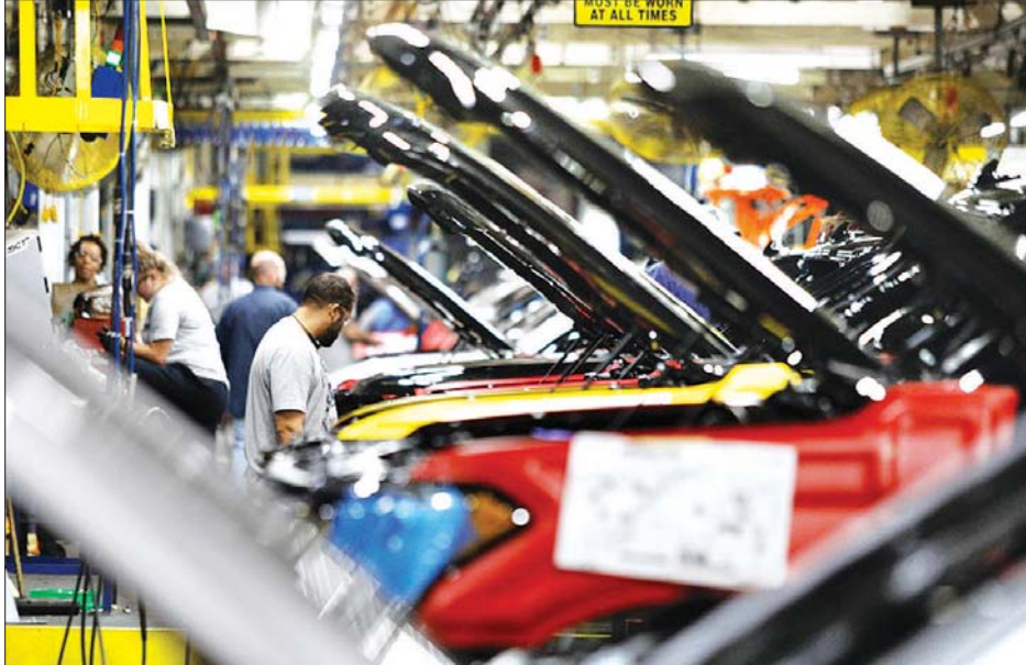
ကင်တပ်ကီပြည်နယ်ရှိ ကားတပ်ဆင်စက်ရုံ၌ ဖွံ့ဖြိုးရေးကုမ္ပဏီက တပ်ဆင်ထုတ်လုပ်မှုကို တွေ့ရစဉ်။

ဆော်ပိုလို ဇန်နဝါရီ ၁၂ အမေရိကန်အခြေစိုက် ဖွံ့ဖြိုးရေးကုမ္ပဏီက ၂၀၂၁ ခုနှစ်တွင် ဘရာဇီးနိုင်ငံ၌ ကျန်ရှိနေသည့် ကားတပ်ဆင်စက်ရုံသုံးရုံကို ပိတ်သိမ်းကာ ထုတ်လုပ်မှုများအားလုံး ရပ်ဆိုင်းမည်ဖြစ်ကြောင်း ဇန်နဝါရီ ၁၁ ရက်တွင် ပြောကြားခဲ့သည်။ လက်တင်အမေရိကန် အကြီးဆုံးဈေးကွက်ဖြစ်သည့် ဘရာဇီးနိုင်ငံရှိ ကားဈေးကွက်ကို အာဂျင်တီးနား၊ ဥရဂွေးနှင့် အခြားဈေးကွက်များမှ ကားတပ်ဆင်စက်ရုံများ ထားရှိမည်ဖြစ်ကြောင်း ဖွံ့ဖြိုးရေးကုမ္ပဏီက သတင်းစာရှင်းလင်းပွဲ၌ ပြောကြားခဲ့သည်။ ကိုဗစ်-၁၉ ရောဂါကျရောက်မှုကြောင့် ကားတပ်ဆင်စက်ရုံများ၏ ကြံ့ကြံခံရပ်တည်နိုင်စွမ်းကို ထိခိုက်စေခဲ့ပြီး အရောင်းကျဆင်းမှုများကြောင့် နှစ်များစွာအတွင်း သိသိသာသာ အရှုံးပေါ်ခဲ့ကြောင်း ကုမ္ပဏီ၏ထုတ်ပြန်ချက်တွင် ဖော်ပြသည်။ ဆော်ပိုလိုနှင့် ဘာဟီယာရှိ စက်ရုံများတွင် ထုတ်လုပ်မှုများ ချက်ချင်းရပ်နားတော့မည်ဖြစ်ပြီး ဟော်ရီဇူတီ စက်ရုံရှိ ထုတ်လုပ်မှုအစား ကားထုတ်လုပ်မှုကို ယခုနှစ်၏ စတင်ပတ်အထိ ဆက်လက်လည်ပတ်မည်ဖြစ်ကြောင်း သိရသည်။ ဖွံ့ဖြိုးရေးကုမ္ပဏီသည် ငြိမ်းချမ်းသည့် ၂၀၁၉ ခုနှစ် ဒီဇင်ဘာလက ဂရိတ်တားဆော်ပိုလိုရှိ ဆော်ဘာနာဒိုဒိုကမ်ပို ကားစက်ရုံ၌ ကားတပ်ဆင်ထုတ်လုပ်မှုကို ပိတ်သိမ်းခဲ့သည်။