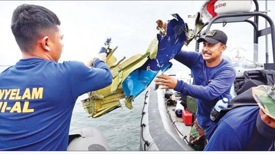
ပျက်ကျလေယာဉ်မှ အပျက်အစီးများကို ရေငုပ်သမားများ ဆယ်ယူနေစဉ်။

ဂျကာတာ ဇန်နဝါရီ ၁၂ အင်ဒိုနီးရှား သီရိပေးလေကြောင်းလိုင်းမှ ဘိုးရင်း ၇၃၇ - ၅၀၀ လေယာဉ်သည် ဇန်နဝါရီ ၉ ရက် က အင်ဒိုနီးရှားနိုင်ငံ ဂျကာတာမြို့ ကမ်းရိုးတန်းရေပြင်တွင် ပျက်ကျခဲ့ရာ ယခုအခါရေငုပ်သမားများသည် လေယာဉ်မှ လေယာဉ်ပျံသန်းမှုခရီးစဉ်မှတစ်ဆင့် (ဘလက်ဘောက်စ်) ကို ဆယ်ယူပြီးဖြစ်သည်ဟု ဒေသတွင်းရုပ်သံတွင် ဖော်ပြထားသည်။ အဆိုပါ လေယာဉ်ပျံသန်းမှု ခရီးစဉ်မှတစ်ဆင့် (ဘလက်ဘောက်စ်) သည် လန်ကန်းကျွန်းနှင့် လာကီကျွန်းတို့ကြား ပင်လယ်ကြမ်းပြင်တွင် တွေ့ရှိခဲ့ခြင်းဖြစ်သည်။ ယင်းဘလက်ဘောက်စ်ကို သင်္ဘောဖြင့် ဂျကာတာဆိပ်ကမ်းသို့ ပေးပို့ခဲ့သည်ဟု သိရသည်။ ပျက်ကျသွားသည့် လေယာဉ်ပေါ်တွင် လူ ၆၂ ဦးပါဝင်ပြီး အင်ဒိုနီးရှားနိုင်ငံ ဂျကာတာရှိ အပြည်ပြည်ဆိုင်ရာလေဆိပ်မှ ပျံတက်ပြီးမကြာမီ ဂျာဗားပင်လယ်အတွင်းသို့ ပျက်ကျခဲ့ခြင်းဖြစ်သည်။ ပျက်ကျလေယာဉ် ရှာဖွေကယ်ဆယ်ရေးလုပ်ငန်းတွင် လူပေါင်း ၃၆၀၀ ပါဝင်ခဲ့သည်။ ထို့ပြင် ရှာဖွေရေးလုပ်ငန်းများ လုပ်ကိုင်နိုင်ရန်အတွက် ရဟတ်ယာဉ် ၁၃ စင်းနှင့် သင်္ဘော ၅၄ စင်းတို့ကို အသုံးပြုခဲ့ကြောင်း သိရသည်။