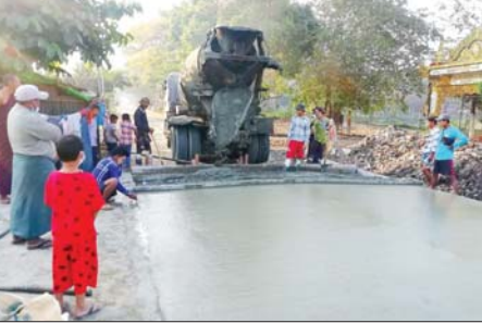
ရွှေပြည်သာမြို့နယ်အတွင်း ကွန်ကရစ်လမ်းခင်း ဆောင်ရွက်နေမှုကို တွေ့ရစဉ်။