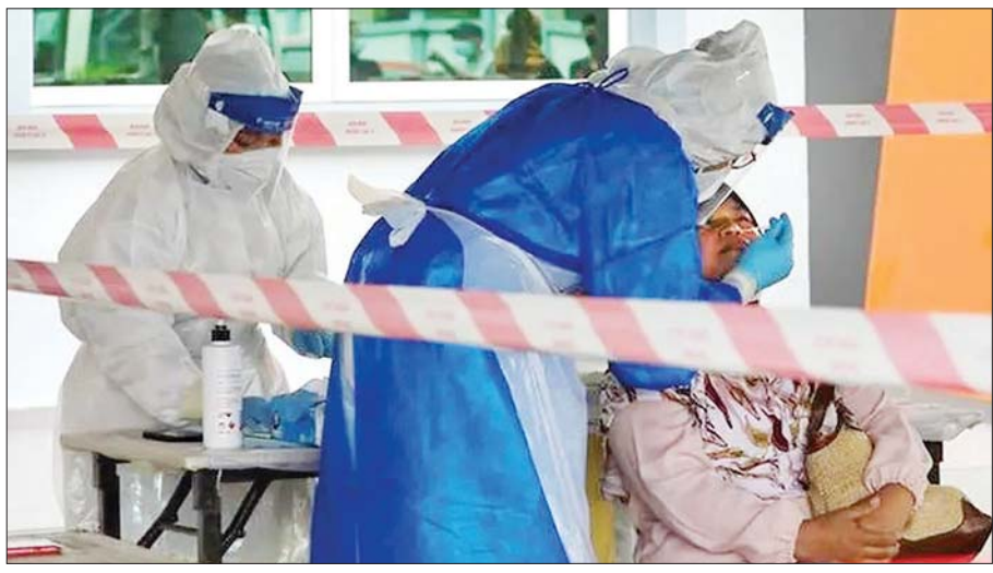
မလေးရှားနိုင်ငံ၌ ကျန်းမာရေးဝန်ထမ်းများက ကိုဗစ် - ၁၉ စစ်ဆေးခြင်း ဆောင်ရွက်စဉ်။

ဘုရင်က တိုက်တွန်းထားသည်။ မလေးရှားနိုင်ငံ တစ်ဝန်းရှိ ကိုဗစ် - ၁၉ ကူးစက်မှု ဆိုးဆိုးရွားရွားဖြစ်ပွားနေသည့် နေရာဒေသ အစိတ်အပိုင်း များတွင် အသွားအလာကန့်သတ်မှုများ ဆောင်ရွက် ထားသည်။ ကိုဗစ်-၁၉ ကန့်သတ်ချက်များတင်းကျပ်စွာ ချမှတ် ဆောင်ရွက်နေသည့် ဧရိယာများတွင် မြို့တော် ကွာလာ လမ်ပူ၊ ပီနန်၊ ဆီလန်ဂေါ၊ မီလက်ကာ၊ ဂျီဟော့နှင့် ဘော့နီယို ကျွန်းမြောက်ပိုင်းရှိ ဆာဘားပြည်နယ်တို့ပါဝင်ကြောင်း သိရသည်။ နေ့စဉ်ရောဂါကူးစက်မှု ဆက်လက်တိုးနေသည့် မလေးရှားနိုင်ငံတွင် မကြာသေးမီ ရက်သတ္တပတ်များ အတွင်း ရေကြီးမှုကြောင့် ထောင်နှင့်ချီသည့်ပြည်သူများမှာ ရေဘေးလွတ်ရာသို့ ရှောင်တိမ်းနေထိုင်ရလျက်ရှိသည်။ ဆင်ဟွာ