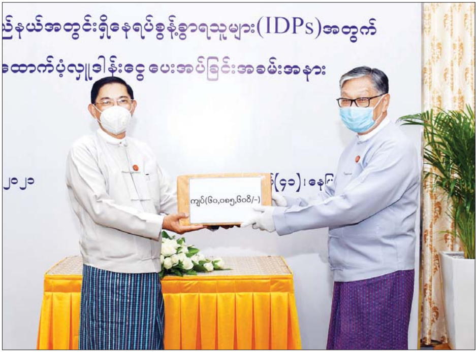
အစိုးရအဖွဲ့ရုံးဝန်ကြီးဌာနနှင့် အထွေထွေအုပ်ချုပ်ရေး ဦးစီးဌာနမှ ပုဂ္ဂိုလ်များအားလုံးကိုလည်း ကျေးဇူးတင်ရှိပါကြောင်း ပြောကြားသည်။

တစ်နည်းအားဖြင့်ဆိုရပါက ပြည်ထောင်စုအတွင်း မှီတင်းနေထိုင်ကြသူများအားလုံးနှင့်ပတ်သက်၍ မိမိတို့ အနေဖြင့် တတ်နိုင်သည့်နေရာမှ ပိုမိုကူညီချင်သည့် ဆန္ဒကို ထုတ်ဖော်ခြင်း ဖြစ်ကြောင်း၊ မိမိတို့သိရှိရသည်မှာ ယခုအချိန်တွင် ဆောင်းရာသီ၏ အအေးဒဏ်ကိုကာကွယ်ရန် အနွေးထည်များနှင့်စောင့်ရှောက် လိုအပ်သည်ဟုပြောသည့် အတွက် လှူဒါန်းခြင်း ဖြစ်ကြောင်း၊ ယခုကဲ့သို့ လှူဒါန်းခွင့်ရသည့်အတွက် ဝမ်းသာပါကြောင်း၊ မိမိတို့၏ လှူဒါန်းငွေကို ထိထိရောက်ရောက် ဖြန့်ဖြူးပေးမည့် ပြည်ထောင်စု