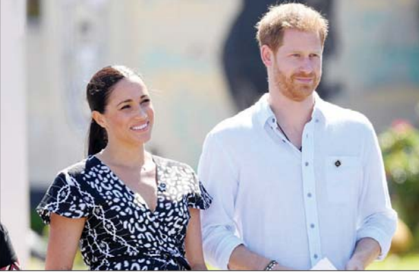
တော်ဝင်မင်းသား ဟယ်ရီနှင့် ဇနီးဖြစ်သူမိဂ်နီမာကယ်။

ဟယ်ရီနဲ့ မိဂ်နီတို့သာ ဇွန် ၂၂ ရက်မှာကျင်းပမယ့်ပွဲကို တက်ရောက်ဖြစ်မယ် ဆိုရင် ဇွန် ၁၀ ရက်မှာ ကျင်းပမယ့် ဖိလစ်မင်းသားကြီးရဲ့ အသက် ၁၀၀ ပြည့် မွေးနေ့ပွဲကို တက်ရောက်ဖို့လည်း အလားအလာပိုများသွားပါပြီ။ ဟယ်ရီတို့ဇနီး မောင်နှံရဲ့ ပြောရေးဆိုခွင့်ရှိသူနဲ့ ဘာကင်ဟမ်နန်းတော်တို့ကတော့ ဘာမှတ်ချက် မှပြောဆိုခဲ့ခြင်း မရှိပါဘူး။ ဆာဆက်မြို့စားနဲ့ မြို့စားကတော်တို့ဟာ ၂၀၂၀ ပြည့်နှစ်မတ်လအတွင်း တော်ဝင်မိသားစုတဝန်ပွဲတွေကို စွန့်လွှတ်တယ်လို့ ကြေညာပြီးတဲ့နောက် အမေရိကန်မှာနေထိုင်ခဲ့ပြီး ပြတိန်နိုင်ငံကို ပြန်လာခဲ့ခြင်း မရှိသေးပါဘူး။ ဟယ်ရီ