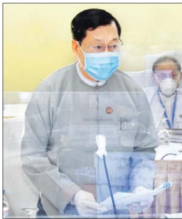
ပြည်ထောင်စုဝန်ကြီး ဦးသိန်းဆွေ