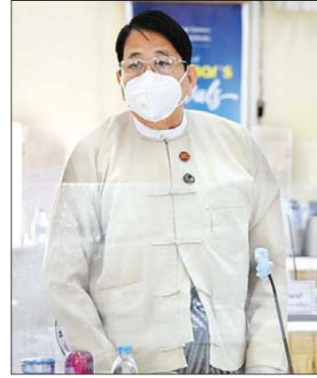
ပြည်ထောင်စုဝန်ကြီး ဒေါက်တာဖေမြင့်