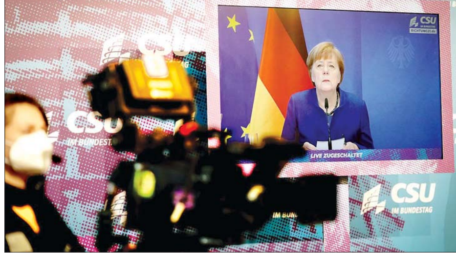
ဂျာမနီဝန်ကြီးချုပ် အင်ဂျလာမာကယ် မိန့်ခွန်းပြောကြားနေစဉ်။

ကပြောသည်။ အမေရိကန် လွှတ်တော်အဆောက်အအုံ အတွင်း အဓိကရုဏ်းဖြစ်မှုပုံရိပ်များကို တွေ့ရသည့်အတွက် စိတ်ဆိုးဝမ်းနည်းမိကြောင်း ဗီဒီယိုကြေညာချက်တွင် အင်ဂျလာမာကယ်က ဖော်ပြခဲ့သည်။ နိုင်ငံဘာလင်အတွင်းကတည်းက သမ္မတက ရွေးကောက်