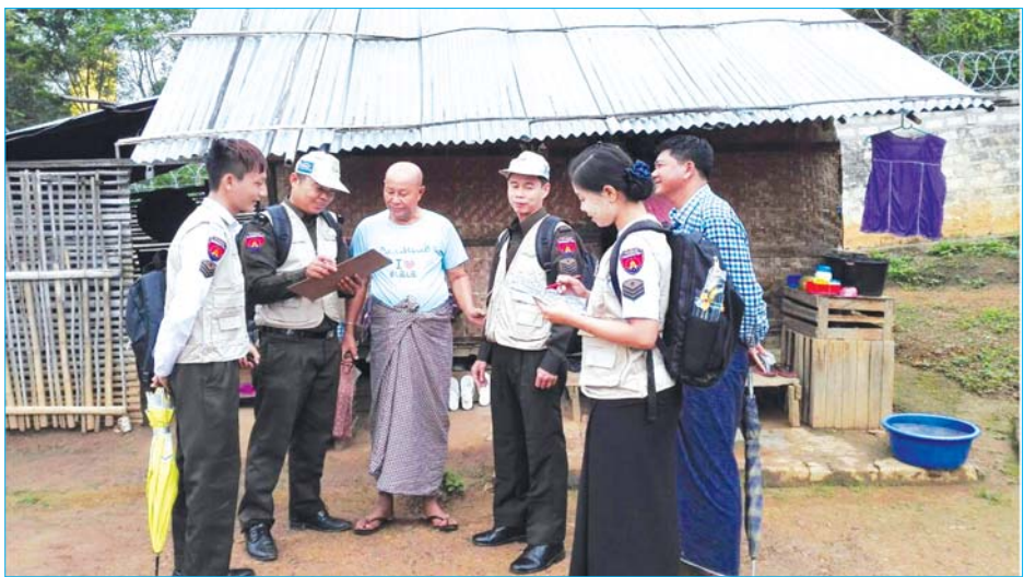
၂၀၁၉ ခုနှစ် ကြားဖြတ်လူဦးရေသန်းခေါင်စာရင်း ကောက်ယူစဉ်။

အသုံးပြုဆောင်ရွက်နေကြပြီ မြန်မာနိုင်ငံတွင် ၁၉၈၃ ခုနှစ်နောက်ပိုင်း အကြောင်းအမျိုးမျိုးကြောင့် သန်းခေါင်စာရင်း ကောက်ယူနိုင်ခဲ့ခြင်း မရှိဘဲ နှစ်ပေါင်း ၃၀ ကျော်ကြာပြီး ၂၀၁၄ ခုနှစ်တွင်မှ ပြန်လည်ကောက်ယူနိုင်ခဲ့သည်။ ၂၀၁၄ ခုနှစ် လူဦးရေနှင့် အိမ်အကြောင်းအရာသန်းခေါင်စာရင်းသည် ပြည်သူအားလုံး၏ ပူးပေါင်းပါဝင်မှု တိုင်းရင်းသားညီအစ်ကို