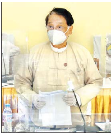
ပြည်ထောင်စုဝန်ကြီး ဒေါက်တာ သန်းမြင့်