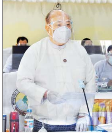
ပြည်ထောင်စုဝန်ကြီး ဦးသောင်းထွန်း