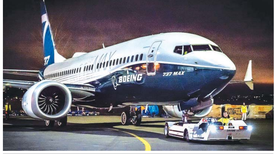
ဘိုးရင်းကုမ္ပဏီထုတ် 737-MAX လေယာဉ်တစ်စင်းကို တွေ့ရစဉ်။

သော်လည်း အာဏာပိုင်များထံ တင်ပြ ရန် ပျက်ကွက်ခဲ့သည်ဟု အမေရိကန် လွှတ်တော်က အစီရင်ခံခဲ့သည်။ ထို့အတွက် ဒဏ်ကြေးငွေ ၂ ဒသမ ၅ ဘီလီယံ ပေးဆောင်ရန် ဘိုးရင်း ကုမ္ပဏီက သဘောတူပြီးဖြစ်ကြောင်း၊ ယင်းငွေကြေးများထဲမှ သေဆုံးသူများ ၏ မိသားစုဝင်များကို နှစ်နာကြေး ပေးသွားမည်ဖြစ်ကြောင်း အမေရိကန် တရားရေးဌာနက ပြောသည်။ လေယာဉ်ထုတ်လုပ်မှု ကြီးကြပ် စစ်ဆေးသူများထံ ပွင့်လင်းမြင်သာစွာ အသိပေးရမည့်ဝတ္တရားမှာ မည်မျှ အရေးကြီးသည်ကို ယခုဖြစ်ရပ်က သတိပေးလျက်ရှိသည်ဟု ဘိုးရင်း ကုမ္ပဏီစီအီးအို ဒေးဗစ်ကယ်ဟွန်းက ဝန်ထမ်းများကို ပြောကြားခဲ့သည်။ 737-MAX လေယာဉ်ပြေးဆွဲမှုကို နှစ်နှစ်နီးပါးကြာ ရပ်နားထားရပြီး နောက် လွန်ခဲ့သည့်လအတွင်းက ပြန်လည်စတင်ခွင့်ပေးခဲ့သည်။ အင်န်အိတ်ချီကေ