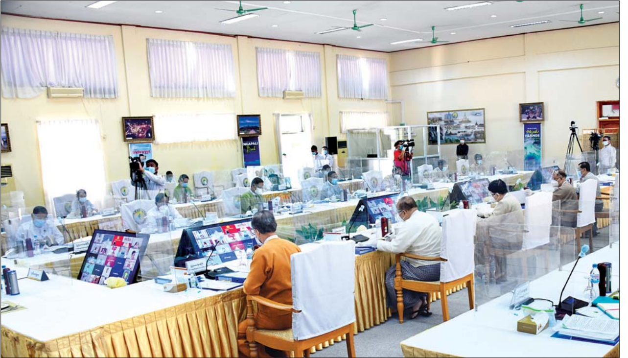
ဒုတိယသမ္မတ ဦးဟင်နရီဗန်ထီးယူ အမျိုးသားခရီးသွားလုပ်ငန်းဖွံ့ဖြိုးတိုးတက်ရေးဗဟိုကော်မတီအစည်းအဝေး (၁/၂၀၂၁) သို့ တက်ရောက် အမှာစကား ပြောကြားစဉ်။