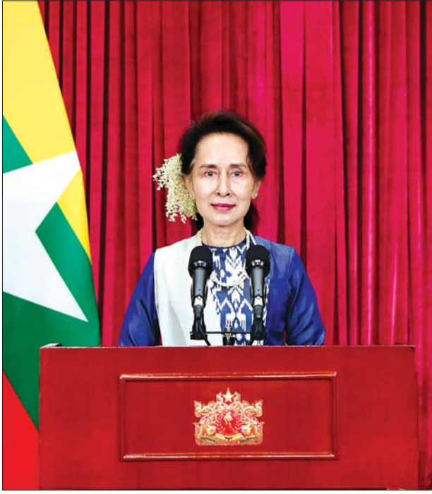
နိုင်ငံတော်၏အတိုင်ပင်ခံပုဂ္ဂိုလ် ဒေါ်အောင်ဆန်းစုကြည် အမျိုးသားခရီးသွားလုပ်ငန်း ဖွံ့ဖြိုးတိုးတက်ရေးပဟိုက်ကော်မတီ (၁/၂၀၂၁)အစည်းအဝေးတွင် အဖွင့်အမှာစကားပြောကြားစဉ်။

အခုအချိန်မှာ ဒီလုပ်ထုံးလုပ်နည်းတွေနဲ့အညီ အပျော်စီးလေယာဉ်ခရီးစဉ်တွေ၊ မြစ်တွင်းရေယာဉ်ခရီးစဉ်တွေ စတင်ပြီး ဆောင်ရွက်နေပြီ ဖြစ်ပါတယ်။ ဆက်လက်ပြီးလည်း ကမ်းခြေဒေသတွေကို စည်းမျဉ်းစည်းကမ်းနဲ့အညီ ပြန်လည်ဖွင့်လှစ်နိုင်ဖို့ စီမံချက်တွေလည်း ရေးဆွဲနေပါတယ်။ ခရီးသွားလုပ်ငန်းဟာ ကမ္ဘာ့နံ့ချိုပြီး အခက်အခဲတွေ တွေ့ကြုံနေရပါတယ်။ မြန်မာနိုင်ငံခရီးသွားလုပ်ငန်း ပြန်လည်ဦးမော့လာစေဖို့ဆိုရင် ကျွန်ုပ်တို့ရဲ့ ရှေးအစဉ်အလာတွေ၊ တိုင်းရင်းသားယဉ်ကျေးမှုတွေအပြင် ပြည်သူတွေရဲ့နေ့စဉ် လူမှုဘဝတွေကိုပါ ဖော်ကျူးပြသနိုင်တဲ့ လူထုအခြေခံခရီးသွားလုပ်ငန်းတွေကို ဆက်ပြီးအားပေး