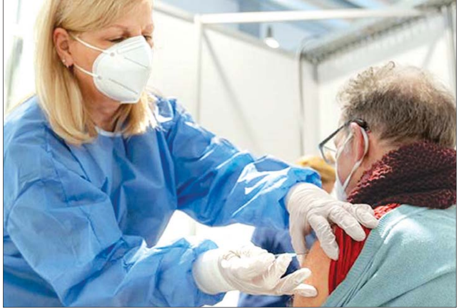
ဂျာမနီတွင် ကိုဗစ်-၁၉ ရောဂါကာကွယ်ဆေးထိုးနှံပေးနေသည့်ကို တွေ့ရစဉ်။