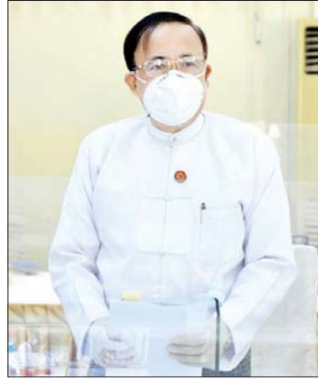
ပြည်ထောင်စုဝန်ကြီး ဦးကျော်တင်