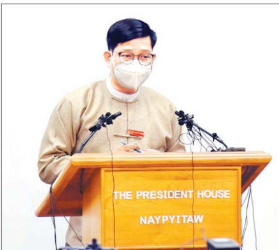
နိုင်ငံတော်အတိုင်ပင်ခံရုံးဝန်ကြီးဌာန ညွှန်ကြားရေးမှူးချုပ် ဦးဇော်ဌေး သတင်းမီဒီယာများနှင့် တွေ့ဆုံပြီး နိုင်ငံတော်၏ လတ်တလော အခြေအနေများနှင့် စပ်လျဉ်း၍ ရှင်းလင်းပြောကြားစဉ်။

သို့သော်လည်း ဆက်လက်ပြီး ညှိနှိုင်းဆွေးနွေးမည့် ပုဂ္ဂိုလ်များ၊ အဖွဲ့အစည်းများ များစွာကျန်သေးပါကြောင်း၊ ထို့ကြောင့် လာမည့်အပတ်တွင် ညှိနှိုင်းဆွေးနွေးမှုများ ဆောင်ရွက်သွားမည်ဖြစ်ပါကြောင်း၊ ဆဋ္ဌမအချက်အခြေဖြင့် ပင်လုံစာချုပ်လက်မှတ်ရေးထိုးမှု နှစ်ပေါင်း ၇၅ နှစ်ပြည့်မည့် စိန်ရတနာဖြစ်သည့် ၂၀၂၂ ခုနှစ်တွင် ပြည်ထောင်စု၏ ပန်းတိုင်ကို မိမိတို့အတူတကွ ဆက်ပြီးလျှောက်လှမ်း သွားမည့် လမ်းကြောင်းများ ခိုင်ခိုင်မာမာထပ်ထပ်ရှားရှား လှမ်းမြင်နေရသည့် အားတက်ဖွယ်အခြေအနေတစ်ရပ် ရောက်ရှိလာရန် ရည်မှန်းချက်ထားပြီး ဆောင်ရွက်သွားမည်ဖြစ်ပါကြောင်း၊ ထို့ကြောင့် ၂၀၂၀ ပြည့်နှစ် အလွန် ၂၀၂၁ ခုနှစ်မှစတင်ပြီး လာမည့်တစ်နှစ်တာအတွင်း နောက်ထပ် အဆင့်တစ်ဆင့် မည်သည့် အခြေအနေသို့ ရောက်ရှိမည်ကို ညှိနှိုင်းရန်ရှိပါကြောင်း၊ အစိုးရပိုင်း၌ မည်သည့်အဆင့်ဟု သတ်မှတ်ထားသော်လည်း ကျန်သည့် State Holder များ