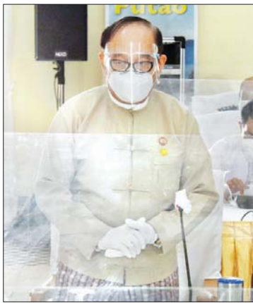
ပြည်ထောင်စုဝန်ကြီး ဒေါက်တာ မြင့်ထွေး