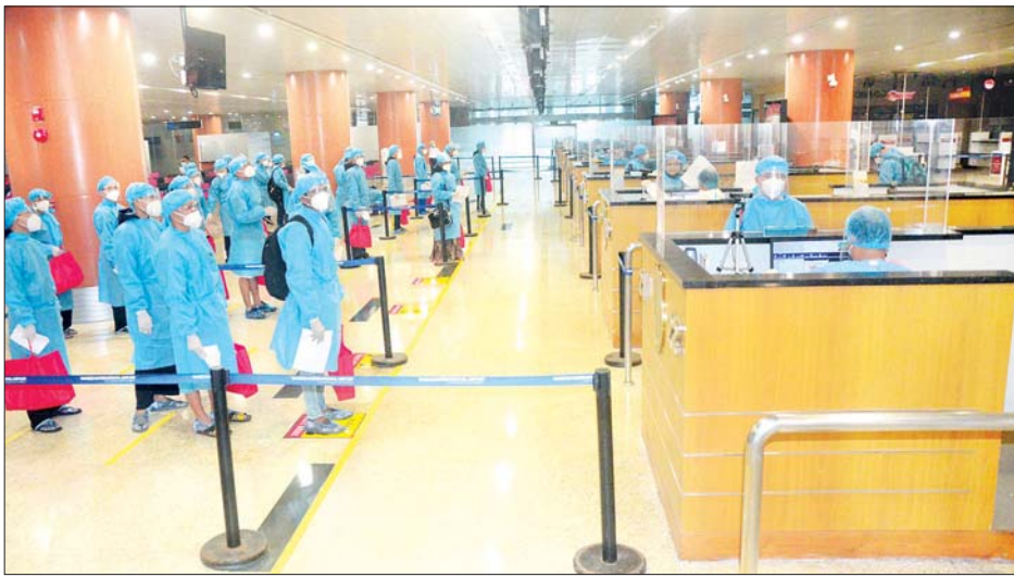
မြို့ရှိ မြန်မာသံရုံးနှင့် မြန်မာသင်္ဘောသားများ ဝန်ထမ်းများ အလှည့်ကျ ပြောင်းလဲခြင်းကော်မတီ (CCSC) တို့မှ ပူးပေါင်း စီစဉ်သည့် မြန်မာအပြည်ပြည်ဆိုင်ရာ လေကြောင်းလိုင်း (MAI)ကယ်ဆယ်ရေးလေယာဉ်ဖြင့် မြန်မာနိုင်ငံသို့ ပြန်လည် ခေါ်ဆောင်ခဲ့ရာ ယနေ့ ညပိုင်းတွင် ရန်ကုန်အပြည်ပြည် ဆိုင်ရာလေဆိပ်သို့ အဆင်ပြေချောမွေ့စွာ ပြန်လည်ရောက်

နေပြည်တော် ဇန်နဝါရီ ၈ နိုင်ငံတကာခရီးသည်တင် လေယာဉ်များပျံသန်းမှု ယာယီ ရပ်ဆိုင်းထားခြင်းကြောင့် မလေးရှားနိုင်ငံတွင် ပြစ်ဒဏ် ကျခံပြီးဖြစ်သည့် အကြောင်းအမျိုးမျိုးကြောင့် ထိန်းသိမ်းခံ ထားရသည့် မြန်မာနိုင်ငံသား ၁၄၂ ဦးအား ကွာလာလမ်ပူ မြို့ရှိ မြန်မာသံရုံးမှ စီစဉ်သည့် မြန်မာအပြည်ပြည်ဆိုင်ရာ လေကြောင်းလိုင်း (MAI) ကယ်ဆယ်ရေးလေယာဉ်ဖြင့် မြန်မာနိုင်ငံသို့ ပြန်လည်ခေါ်ဆောင်ခဲ့ရာ ယနေ့ ညနေပိုင်း တွင် ရန်ကုန်အပြည်ပြည်ဆိုင်ရာလေဆိပ်သို့ အဆင်ပြေ ချောမွေ့စွာ ပြန်လည်ရောက်ရှိခဲ့ကြသည်။ (ယာပုံ) ထို့ပြင် စင်ကာပူနိုင်ငံတွင် အခက်အခဲကြုံတွေ့နေရ သည့် မြန်မာနိုင်ငံသား ၁၄၆ ဦးအား စင်ကာပူမြို့ရှိ မြန်မာ သံရုံးမှစီစဉ်သည့် မြန်မာအမျိုးသားလေကြောင်းလိုင်း (MNA)ကယ်ဆယ်ရေးလေယာဉ်ဖြင့် မြန်မာနိုင်ငံသို့ ပြန်လည် ခေါ်ဆောင်ခဲ့ရာ ယနေ့ညနေပိုင်းတွင် ရန်ကုန်အပြည်ပြည် ဆိုင်ရာလေဆိပ်သို့ အဆင်ပြေချောမွေ့စွာ ပြန်လည်ရောက်ရှိ ခဲ့ကြသည်။ အလားတူ ကိုရီးယားသမ္မတနိုင်ငံတွင် အခက်အခဲ ကြုံတွေ့နေရသည့် မြန်မာသင်္ဘောသား ၁၂၅ ဦးအား ဆိုးလ်