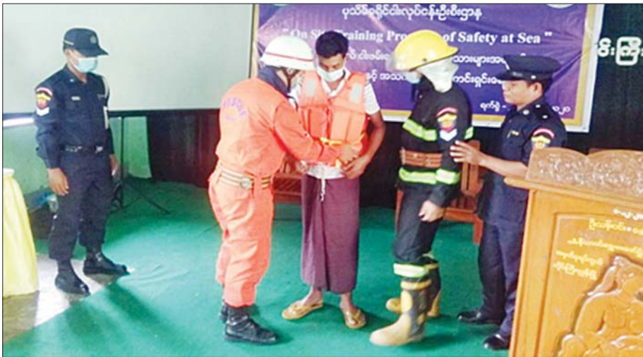
ငါးဖမ်းဆီးခြင်းလုပ်ငန်းအား အထောက်အပံ့ဖြစ်စေရေးအတွက် “ပင်လယ်ငါးဖမ်း ရေယာဉ်ရေလုပ်သားများအား လုပ်ငန်းခွင်ကျန်းမာရေးနှင့်အသက်အန္တရာယ်ကင်းရှင်းရေး (Safety at Sea) သင်တန်းဖွင့်လှစ် သင်ကြားပေးစဉ်။

မြန်မာနိုင်ငံ၏ ငါးလုပ်ငန်းဦးစီးဌာနအနေဖြင့် ကိုဗစ်-၁၉ ကပ်ရောဂါ၏ ငါးလုပ်ငန်းနှင့် ရေသတ္တဝါမွေးမြူရေးကဏ္ဍ အပေါ်စီးပွားရေးထိခိုက်မှုများ ပြန်လည်ထူထောင်ရေး အစီအစဉ်များအနေဖြင့် COVID -19 Economic Relief Plan (CERP) ဝါ Action Plan အရ COVID-19 ကာလ အတွင်း ငါးမွေးမြူရေးကဏ္ဍအပေါ် ထိခိုက်ဆုံးရှုံးမှုများကို ပြန်လည်ထူထောင်ရန်နှင့် အလုပ်အကိုင်၊ အခွင့်အလမ်း များ တိုးတက်ရရှိစေရန်အတွက် တိုင်းဒေသကြီး/ပြည်နယ် များရှိ ငါးမွေးတောင်သူဦးရေ ၁၁၀၃၁ ဦး၊ ငါးမွေးကန်ဧက ၁၅၀၀၀၀ ၊ ငါးသားပေါက်ကောင်ရေ ၂၇၉၀ ဒသမ ၇၁ သိန်းကို ပံ့ပိုးပေးနိုင်ခဲ့ပါသည်။ ငါးဖမ်းဆီးခြင်းလုပ်ငန်း အား အထောက်အပံ့ဖြစ်စေရေးအတွက် “ပင်လယ်ငါးဖမ်း ရေယာဉ်ရေလုပ်သားများအတွက် လုပ်ငန်းခွင်ကျန်းမာရေး နှင့် အသက်အန္တရာယ်ကင်းရှင်းရေး (Safety at Sea) သင်တန်း”အား ငါးဖမ်းရကလဖြစ်သည့် ဇွန်၊ ဇူလိုင်နှင့် ဩဂုတ်လများတွင် ကမ်းရိုးတန်းဒေသများဖြစ်သည့် ရန်ကင်းတိုင်းဒေသကြီး၊ တနင်္သာရီတိုင်းဒေသကြီး၊ ဧရာဝတီတိုင်းဒေသကြီး၊ မွန်ပြည်နယ်နှင့် ရခိုင်ပြည်နယ် တို့တွင် သင်တန်းစုပေါင်းအကြိမ် ၃၀ နှင့် သင်တန်းသား စုပေါင်း ၁၂၆၈ ဦးတို့အား သင်တန်းဖွင့်လှစ်ပို့ချပေးနိုင် ခဲ့ပါသည်။ ငါးလုပ်ငန်းဦးစီးဌာနမှ သက်ဆိုင်ရာဝန်ကြီး ဌာနများ ချေးငွေသတ်မှတ်ချက်များနှင့်အညီ SME ချေးငွေရရှိရေးအတွက် ချိတ်ဆက်ပေါင်းစပ် ဆောင်ရွက် ပေးခဲ့ပါသည်။