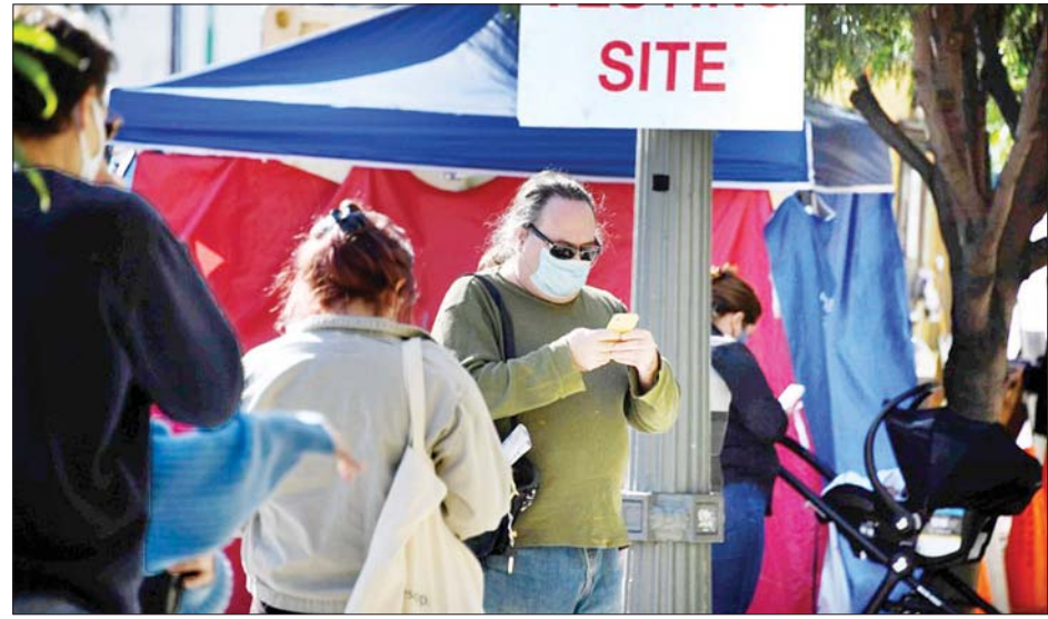
ကယ်လီဖိုးနီးယားပြည်နယ် လော့စ်အိန်ဂျလစ်တွင် ကိုဗစ်-၁၉ စစ်ဆေးရန် လူများတန်းစီစောင့်ဆိုင်းနေသည့်ကို တွေ့ရစဉ်။