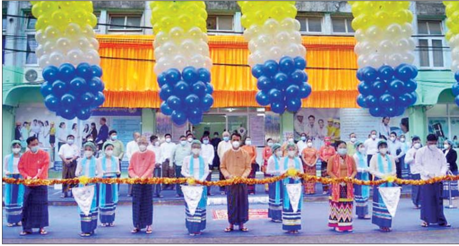
ထိုနေ့က ရန်ကုန်တိုင်းဒေသကြီးဝန်ကြီးချုပ် ဦးမြိုးမင်းသိန်းနှင့် တိုင်းဒေသကြီးလွှတ်တော်ဥက္ကဋ္ဌ ဦးတင်မောင်ထွန်းတို့က အမှာစကား ပြောကြားသည်။ ယင်းနေ့က လူမှုဖူလုံရေးအဖွဲ့ ညွှန်ကြားရေးမှူးချုပ်

ရန်ကုန် ဇန်နဝါရီ ၆ အလုပ်သမား၊ လူဝင်မှုကြီးကြပ်ရေးနှင့် ပြည်သူ့အင်အား ဝန်ကြီးဌာန၊ လူမှုဖူလုံရေးအဖွဲ့၏ လူမှုဖူလုံရေး-ကဲဝဲလ် အထွေထွေရောဂါကုဆေးခန်း ဖွင့်ပွဲအခမ်းအနားကို ရန်ကုန်မြို့၊ ကျောက်တံတားမြို့နယ် မဟာဗန္ဓုလပန်းခြံ လမ်း (အထက်ဘလောက်)ရှိ တိုင်းဒေသကြီး လူမှုဖူလုံရေး ရုံး၌ ယနေ့ နံနက် ၈ နာရီခွဲက ပြုလုပ်သည်။ ရှေးဦးစွာ လူမှုဖူလုံရေး-ကဲဝဲလ် အထွေထွေရောဂါကု ဆေးခန်းကို ရန်ကုန်တိုင်းဒေသကြီးဝန်ကြီးချုပ် ဦးမြိုးမင်း သိန်း၊ တိုင်းဒေသကြီးလွှတ်တော်ဥက္ကဋ္ဌ ဦးတင်မောင်ထွန်း၊ လူဝင်မှုကြီးကြပ်ရေးနှင့် လူ့စွမ်းအားအရင်းအမြစ်ဝန်ကြီး ဒေါ်မိုးမိုးစုကြည်၊ လွှတ်တော်ကိုယ်စားလှယ်နှင့် လူမှုဖူလုံ ရေးအဖွဲ့ ညွှန်ကြားရေးမှူးချုပ်တို့က ဖဲကြိုးဖြတ်ဖွင့်လှစ် ပေးပြီး(ယာဝုံ) တိုင်းဒေသကြီးဝန်ကြီးချုပ် ဦးမြိုးမင်းသိန်း က ဆေးခန်းဆိုင်ဘုတ်ကို စက်ခလုတ်နှိပ်ဖွင့်လှစ်ပေးကာ ဆေးခန်းအတွင်း လှည့်လည်ကြည့်ရှုကြသည်။