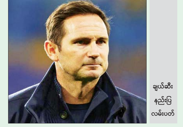
ချယ်ဆီး နည်းပြ လမ်းပတ်

လည်း သိရသည်။ အခြားသတင်းရင်းမြစ်တစ်ခုတွင် လက်ရှိ ယူကရိန်းအသင်းတွင် တာဝန်ယူကိုင်တွယ် နေသည့် ချယ်ဆီးတိုက်စစ်မှူးဟောင်း ရက်စ်ချင်ကို ကိုလည်း နည်းပြလမ်းပတ်၏နေရာကို အစားထိုး ရန် ချိန်ရွယ်ထားကြောင်း ဖော်ပြထားသည်။ နည်းပြလမ်းပတ်သည် ဟာဗက်စ်၊ ဘင်ချိုဝလ်၊ ဇီယက်၊ ဝါနာ စသည့်ကစားသမားများကို ပေါင်သန်း ၂၂၀ ကျော် အသုံးပြုကာ စတန်းဖို့ဒ်ဘရစ်သို့ ခေါ်ယူဆောင်ကြဉ်းနိုင်ခဲ့သော်လည်း အသင်းရလဒ် ပိုင်း၊ အသင်းစွမ်းဆောင်ရည်ပိုင်း၊ တိုက်စစ်ပိုင်း တို့တွင် အားရကျေနပ်စရာမရှိဘဲ ရလဒ်ဆိုးများ စာမျက်နှာ ၁၈ ကော်လံ ၄ ○