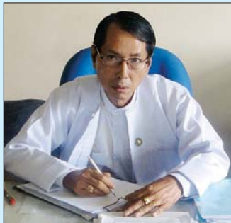
စာရေးသူ၏ ကိုယ်ရေးအကျဉ်း