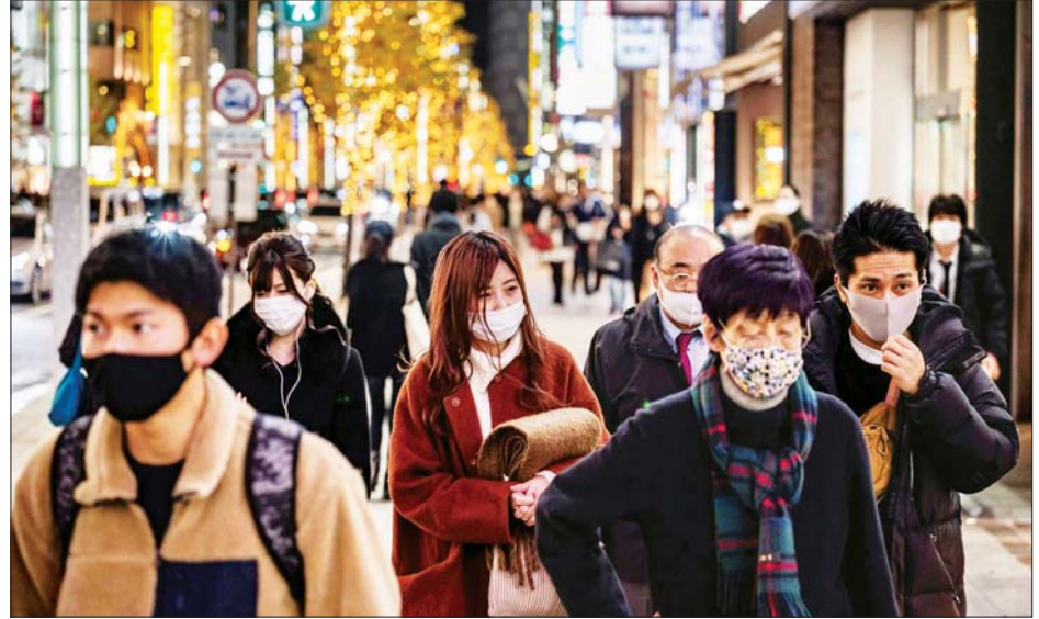
တိုကျိုမြို့ ဂင်ဇောဒေသတွင် ခရစ္စမတ်အားလပ်ရက်၌ ပြည်သူများကို တွေ့ရစဉ်။

တိုကျို ဇန်နဝါရီ ၆ ကိုဗစ်-၁၉ ကူးစက်မှု တတိယလှိုင်းမြင့်လာသောကြောင့် တိုကျိုနှင့် အနီးဝန်းကျင်ခရိုင်သုံးခု၌ အရေးပေါ်ကြေညာချက် မထုတ်ပြန်ရသေးမီ တိုကျိုတွင် ဇန်နဝါရီ ၆ ရက်က နေ့စဉ် ကိုဗစ်-၁၉ ကူးစက်သူ ၁၅၉၁ ဦးရှိကြောင်း အတည်ပြု ဖော်ပြခဲ့ကြောင်း သိရသည်။