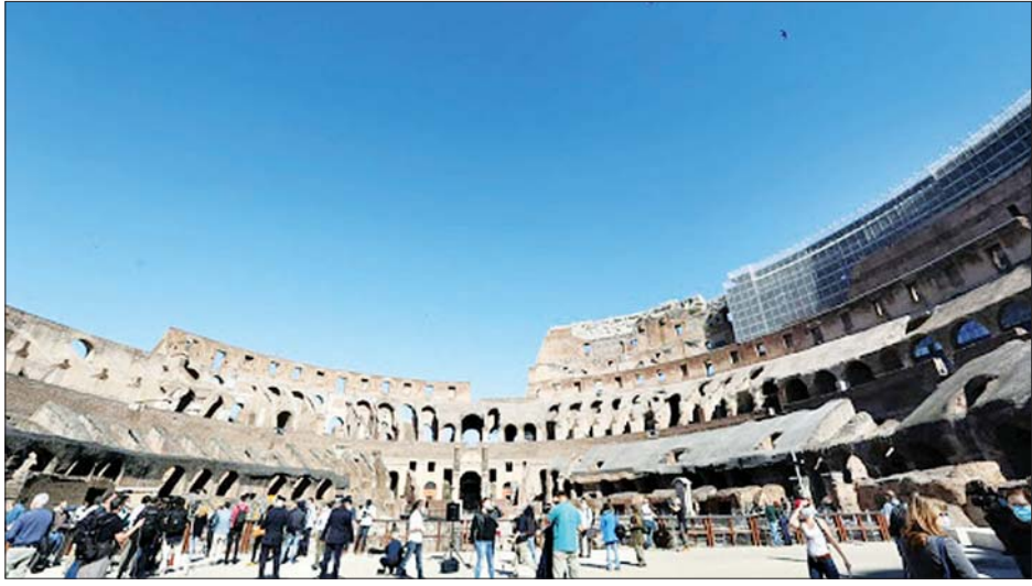
အီတလီနိုင်ငံ ရောမမြို့ရှိ ကလို့စီယမ် ပြန်လည်ဖွင့်လှစ်မှုတွင် သတင်းရယူနေသော သတင်းသမားများကိုတွေ့ရစဉ်။

ကြောင်း ပီအီးစီအဖွဲ့ အထွေထွေအတွင်းရေးမှူး ဘလေ့စ် လစ်ပန်က ပြောကြားလိုက်သည်။ သတင်းသမားများထဲတွင် ကိုဗစ်-၁၉ ရောဂါဖြင့် သေဆုံးခဲ့ရသူအရေအတွက် ထက်ဝက်ကျော် ၃၀၃ ဦးသည် လက်တင်အမေရိကနိုင်ငံများမှဖြစ်ကြောင်း၊ ထိုသို့သေဆုံး တွင် ပီရူးနိုင်ငံက သေဆုံးသူ ၉၃ ဦးရှိခဲ့ပြီး ထို့နောက် ဘရာဇီး နိုင်ငံက ၅၅ ဦးနှင့် အီဂျစ်နိုင်ငံက ၄၂ ဦးစီ အသီးသီး ဖြစ်ကြောင်း ပီအီးစီ ထုတ်ပြန်ချက်အရ သိရသည်။ ကိုဗစ်-၁၉ နှင့် ဆက်စပ်၍ သတင်းသမားများသေဆုံးခဲ့ ရသည့် အခြားသောနိုင်ငံများမှာ အိန္ဒိယနိုင်ငံမှ ၅၃ ဦး၊ မက္ကဆီကိုမှ ၄၅ ဦး၊ ဘင်္ဂလားဒေ့ရှ်နိုင်ငံမှ ၄၁ ဦး၊ အီတလီ နိုင်ငံမှ ၃၇ ဦးနှင့် အမေရိကန်နိုင်ငံမှ ၃၁ ဦး တို့ဖြစ်ကြောင်း သိရသည်။ အဆိုပါကိန်းဂဏန်းအချက်အလက်များကို မတူညီ သော အရင်းအမြစ်များပေါ်တွင် အခြေခံထားခြင်းဖြစ် ကြောင်း သိရသည်။ ယခုဖော်ပြခဲ့သည်မှာ ကိုဗစ်-၁၉ ရောဂါဖြင့် သတင်းသမားများ အမှန်တကယ်သေဆုံးခဲ့ရ သည့်အရေအတွက်ထက် လျော့နည်းဖွယ်ရှိကြောင်း ပီအီးစီ က ထုတ်ပြန်ဖော်ပြထားသည်။ ပီအီးစီအဖွဲ့ကို ၂၀၁၄ ခုနှစ်တွင် စတင်ဖွဲ့စည်းခဲ့သည်။ ကမ္ဘာတစ်ဝန်းရှိ သတင်းသမားများ ဘေးကင်းလိုမြို့မှုနှင့်