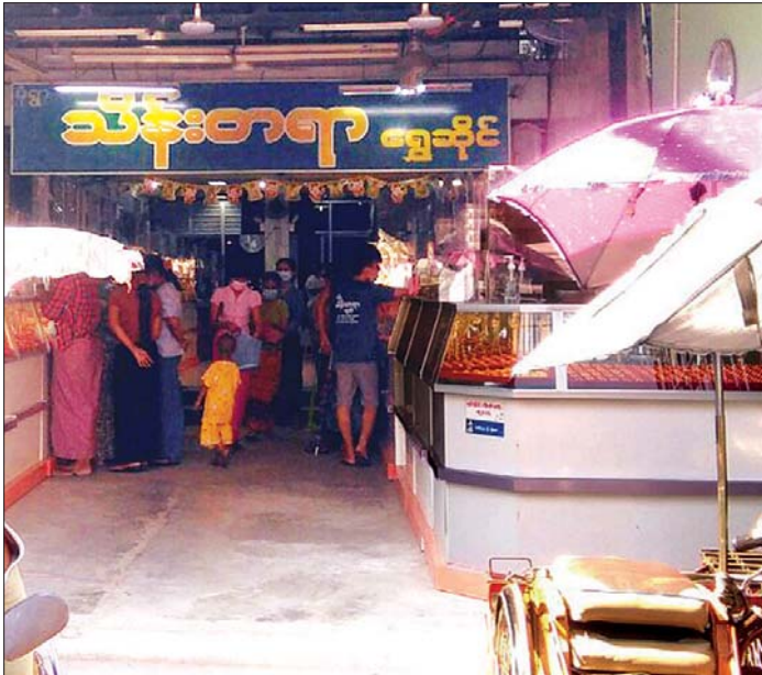
လှိုင်သာယာမြို့နယ် ဗိုလ်အောင်ကျော်လမ်းရှိ ရွှေဆိုင်တစ်ဆိုင် ရောင်းချနေမှုကို တွေ့ရစဉ်။

ရန်ကုန် ဇန်နဝါရီ ၆ ကိုဗစ်-၁၉ ရောဂါ ဒုတိယအကျဉ်းတွင် ကမ္ဘာ့ရွှေဈေးနှုန်း မြင့်နေသော်လည်း ပြည်တွင်းရွှေဈေးနှုန်းမှာ နိုင်ငံခြားဈေးအောက် တစ်ကျပ်သားလျှင် ငွေကျပ် ၃၀၀၀ ခန့် လျော့နည်းလျက်ရှိရာ နိုင်ငံတကာ ရွှေဈေးကွက်ဖြင့် နှိုင်းယှဉ်ပါက အနိမ့်ပိုင်းဈေးဖြင့် လည်ပတ်နေကြောင်း ရန်ကုန်တိုင်းဒေသကြီး ရွှေလုပ်ငန်းရှင်များအသင်းမှ သိရသည်။