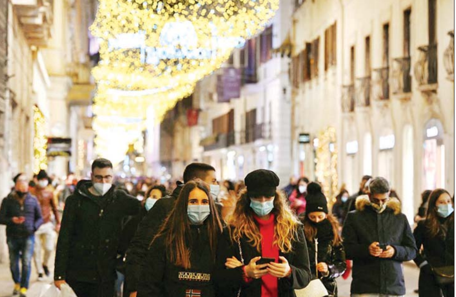
ရောမမြို့လယ်တွင် သွားလာလှုပ်ရှားနေကြသူများကို တွေ့ရစဉ်။