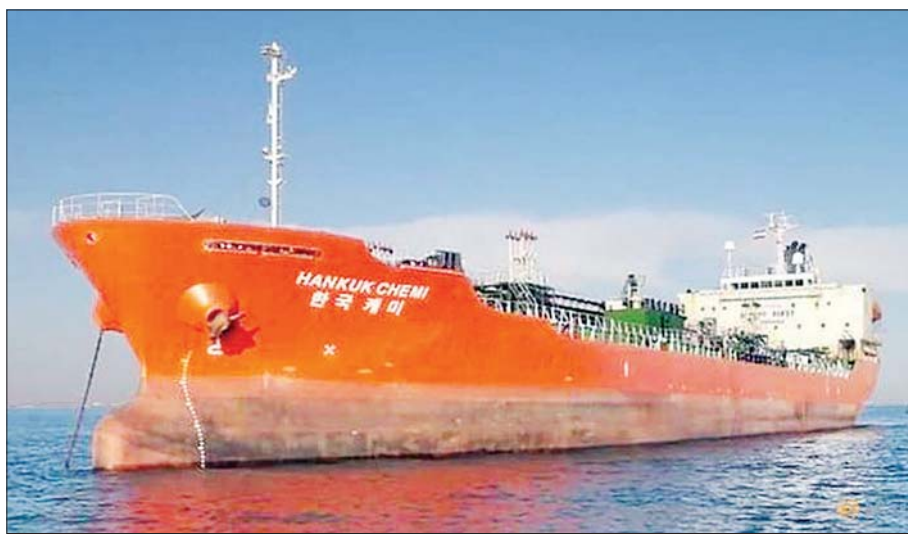
သိမ်းဆည်းခံထားရသည့် တောင်ကိုရီးယားအလံလွှင့်ထားသည့် သင်္ဘောကို တွေ့ရစဉ်။

ကလည်း လာမည့်သီတင်းပတ်အတွင်း အီရန်နိုင်ငံ တီဟီရန်မြို့သို့ သုံးရက်ကြာ သီးခြားသွားရောက်ရန် အစီအစဉ် ရှိသည်ဟု ပြောရေးဆိုခွင့်ရှိသူက ပြောသည်။ တောင်ကိုရီးယားရှိ အီရန်ပိုင် ပစ္စည်းများ ပိတ်ဆို့ထားမှုကို ဖြေလျှော့ပေးရန် အစီအစဉ် ရှိ မရှိ ခန့်မှန်းချက်များနှင့် ပတ်သက်ပြီး တောင်ကိုရီးယားနိုင်ငံခြားရေးဝန်ကြီးကန်ကျောင်းရာ က မည်သည့် မှတ်ချက်မှ ပြောဆိုခြင်းမရှိပေ။ အချက်အလက်များကို သေချာစွာ အတည်ပြုရန်နှင့် သင်္ဘောအမှုထမ်းများ၏ လုံခြုံစိတ်ချရရေးမှာ အရေးကြီးသည်ဟု ၎င်းက သတင်းထောက်များကို ပြောသည်။