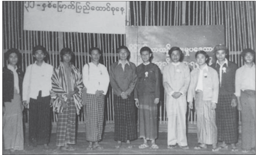
(၃၁) နှစ်မြောက် ပြည်ထောင်စုနေ့ ပဒေသာကပွဲကို ဆေးတက္ကသိုလ် (၁) လိပ်ခုံး (ရန်ကုန်)၌ ကျင်းပပြီးနောက် ဥက္ကဋ္ဌ-ဦးထွန်းအောင်ချိန်၊ ဒုတိယဥက္ကဋ္ဌ-ဦးဆွမ်းလွတ်နော် (ကွယ်လွန်)၊ ကော်မတီအတွင်းရေးမှူး၊ တွဲဖက် အတွင်းရေးမှူးများ ဆက်ကော်မတီအတွင်းရေးမှူးများ စင်မြင့်ပေါ်၌ တွေ့ရပုံ။