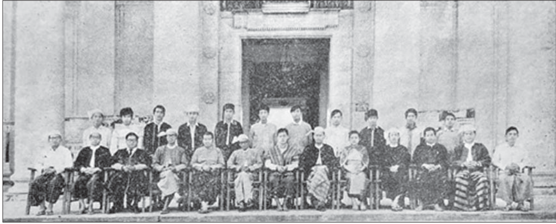
၁၉၇၃ ခုနှစ်က ထုတ်ဝေခဲ့သော တိုင်းရင်းသား စာစောင်၌ ပါဝင်သော တိုင်းရင်းသားများ စာပေနှင့် ယဉ်ကျေးမှုကော်မတီ (တက္ကသိုလ်များ-မန္တလေး) ၏ အမှုဆောင်များ။

တိုင်းရင်းသားလူမျိုးများ စာပေနှင့် ယဉ်ကျေးမှုကော်မတီ (တက္ကသိုလ်များ-ရန်ကုန်)က နှစ်စဉ် ဦးစီးဆောင်ရွက်သည့် တိုင်းရင်းသား လူမျိုးပေါင်းစုံ တွေ့ဆုံပွဲကို အပန်းဖြေရိပ်သာအောက်ရှိ ဘတ်စကက်၊ ဘော်လီဘော၊ ကြက်တောင်အားကစားကွင်း၌ သက်ဆိုင်ရာ တိုင်းရင်းသားလူမျိုး စာပေနှင့် ယဉ်ကျေးမှု ဆက်ကော်မတီအသီးသီးမှ ဆရာ ဆရာမများ၊ ကျောင်းသား ကျောင်းသူများ ပါဝင်စေလျက် ကျင်းပခဲ့သည်။ ထိုသို့ ကျင်းပ ရာတွင် နေ့လယ်စာဖြင့် တည်ခင်းစဉ်ခံ၍ တက်ရောက်လာသူများ အချင်းချင်း လက်ဆောင်ပစ္စည်းများ လဲလှယ်မှုပြုလုပ် သည်။ ထို့ပြင်တိုင်းရင်းသား ကျောင်းသား ကျောင်းသူများအား ရောနှောပေါင်းစည်း လျက် အဖွဲ့များဖွဲ့၍ ပျော်ရွှင်စရာကစားနည်း ပေါင်းစုံဖြင့် ကစားကြပါသည်။ ထိုသို့ ကျင်းပ ပေးခြင်းဖြင့် တိုင်းရင်းသားလူမျိုး ကျောင်းသား ကျောင်းသူ လူငယ်များအချင်းချင်း ပိုမို နားလည်၍ ရင်းနှီးချစ်ခင်သွားကြသည်။ တစ်နည်းအားဖြင့် တိုင်းရင်းသား စည်းလုံး ညီညွတ်ရေးကို အတိုင်းအတာတစ်ရပ်အထိ အထောက်အကူပြုခဲ့သည်မှာ မြေကြီးလက်ခတ် မလွဲပေ။ သို့ဖြစ်၍ ဆရာကြီး ဦးတင်ဇ (ရှမ်းပြည်)က ရန်ကုန်တက္ကသိုလ်နယ်မြေကို “ပြည်ထောင်စုကြီးထဲက ပြည်ထောင်စုကလေး” ဟု မှတ်ချက်ပြုခဲ့ခြင်းဖြစ်သည်။