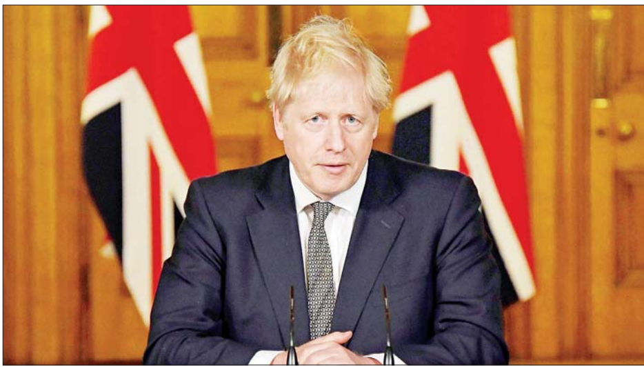
ဗြိတိန်ဝန်ကြီးချုပ် ဘောရစ်ဂျွန်ဆင်။ စကော့တလန်တွင်လည်း အလားတူ ကိုဗစ် - ၁၉ ၅ ရက်တွင် သက်ရောက်မည်ဖြစ်သည်။ တိုက်ဖျက်ရေးကို ကျင့်သုံးထားသည်ဖြစ်ရာ ဇန်နဝါရီ အင်န်အိတ်ချ်ကော့

ရမည်ဖြစ်သည်။ ဗီဇပြောင်း ကိုဗစ် - ၁၉ မျိုးစိတ်သစ်ကို ကိုင်တွယ် ထိန်းချုပ်နိုင်ရန် မိမိတို့အတူတကွ ပိုမိုရှိရန် လိုအပ်ကြောင်း ဝန်ကြီးချုပ်က ထပ်လောင်းပြောကြား လိုက်သည်။ နိုင်ငံသူနိုင်ငံသားများအနေဖြင့် မည်မျှလောက် စိတ်ရှုပ် ထွေးနေသည်ကို မိမိအနေဖြင့် သိကြောင်း၊ ဗီဇပြောင်း ကိုဗစ် - ၁၉ ကို အောင်မြင်စွာ နှိမ်နင်းအနိုင်ယူနိုင်ရန် အစိုးရ၏ လမ်းညွှန်ချက်များကို လိုလောက်စွာ လိုက်နာနေ သည်ကိုလည်း သိကြောင်း၊ သို့သော်လည်း ယခုအခါတွင် အခါတိုင်းထက် ပိုမိုလိုက်နာရမည်ဖြစ်ကြောင်း၊ မိမိတို့ အတူတကွရှိရမည်ဖြစ်ကြောင်း ဂျွန်ဆင်က ဆက်လက် ပြောကြားလိုက်သည်။ ဇန်နဝါရီ ၄ ရက်အထိ အင်္ဂလန်နိုင်ငံရှိ ဆေးရုံများတွင် ကိုဗစ် - ၁၉ ကူးစက်ခံရသူ ၂၇၀၀၀ နီးပါး ရှိကြောင်း၊ အဆိုပါပမာဏသည် အစောပိုင်း ၁၀ ရက်ထက် ၄၀ ရာခိုင်နှုန်းကျော် တိုးလာခြင်းဖြစ်ကြောင်း၊ လွန်ခဲ့သော နှစ်နေ့ဦးရေသို့ ကိုဗစ် - ၁၉ ပထမအကျောထက် ပိုမို ကူးစက်သူများလာကြောင်း သိရသည်။