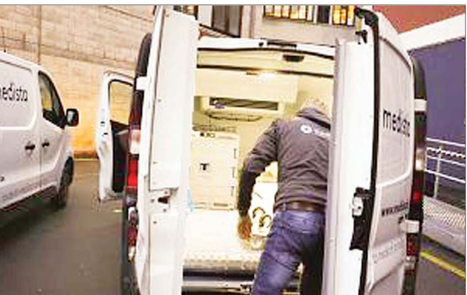
ကိုဗစ်-၁၉ ကာကွယ်ဆေးပို့ဆောင်မည့် မော်တော်ယာဉ်တစ်စီးကို တွေ့ရစဉ်။

မက်ဒရစ် ဇန်နဝါရီ ၅ ဖိုက်ဇော့နှင့် ဘိုင်ရွန်တက်ခီ ကာကွယ် ဆေး သယ်ဆောင်ရာတွင် အခက်အခဲ ရှိနေသည့်အတွက် စပိန်နိုင်ငံ အရှေ့မြောက်ပိုင်း ကိုယ်ပိုင်အုပ်ချုပ် ခွင့်ရဒေသဖြစ်သည့် ကက်တလို နီးယားဒေသရှိ ဘိုးဘွားရိပ်သာတွင် နေထိုင်ကြသည့် သက်ကြီးပုဂ္ဂိုလ်များ အား ကာကွယ်ဆေးထိုးခြင်း ဆောင်ရွက်ရန် နှောင့်နှေး ကြန့်ကြာ လျက်ရှိကြောင်း ကက်တလိုနီးယား ကျန်းမာရေးဌာနက ဇန်နဝါရီ ၄ ရက် တွင် ပြောကြားခဲ့သည်။ ပိတ်ရက်များ ဖြစ်နေခြင်းနှင့် ကာကွယ်ဆေးကို သတ်မှတ်အပူချိန်