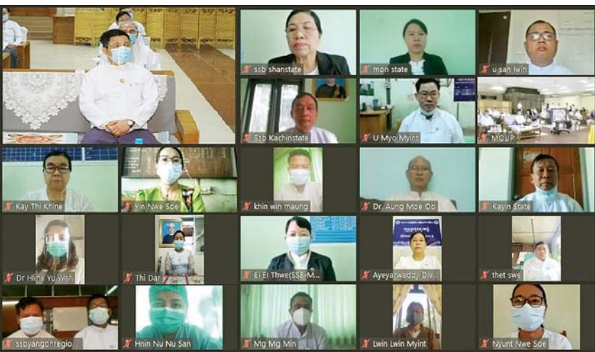
ပြည်ထောင်စု ဝန်ကြီး ဦးသိန်းဆွေ လူမှုဖူလုံရေး စီမံကိန်း လူသားအရင်း အမြစ် ဖွံ့ဖြိုး တိုးတက်ရေး ဆိုင်ရာနည်းပြ မှမ်းမံသင်တန်း ဖွင့်ပွဲ အခမ်း အနားတွင် အမှာစကား ပြောကြားစဉ်။

ဖွင့်ပွဲအခမ်းအနားသို့ အလုပ်သမား၊ လူဝင်မှုကြီးကြပ် ရေးနှင့် ပြည်သူ့အင်အားဝန်ကြီးဌာန ပြည်ထောင်စုဝန်ကြီး ဦးသိန်းဆွေ၊ ဒုတိယဝန်ကြီး ဦးမြင့်ကြိုင်၊ ညွှန်ကြားရေးမှူး ချုပ်များ၊ ဒုတိယညွှန်ကြားရေးမှူးချုပ်များ၊ ဌာနဆိုင်ရာမှ တာဝန်ရှိသူများ၊ လူမှုဖူလုံရေးအဖွဲ့ တိုင်းဒေသကြီး/ ပြည်နယ်များမှ အမှုထမ်း/အရာထမ်းများ တက်ရောက် ကြသည်။