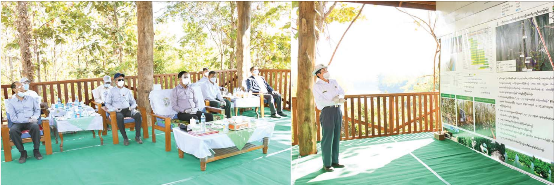
ဒုတိယသမ္မတ ဦးဟင်နရီဗန်ထီးယူနှင့်အဖွဲ့အား ငလိုက်စခန်းသာ ဆင်စခန်း၌ တည်ဆောက်ရေးလုပ်ငန်းများကို ရှင်းလင်းတင်ပြစဉ်။