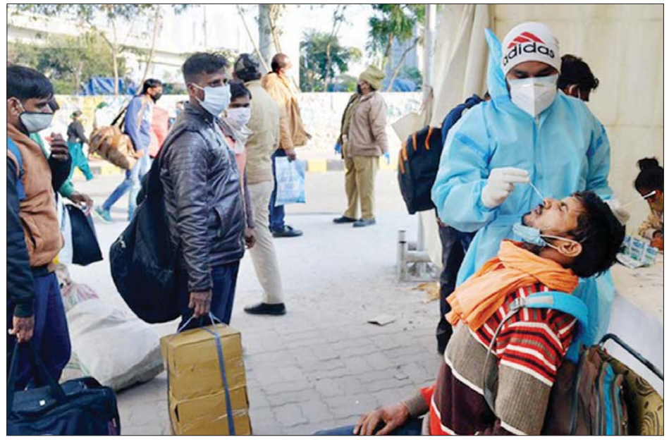
အိန္ဒိယတွင် ကျန်းမာရေးဝန်ထမ်းတစ်ဦး နှာခေါင်းတို့ဖတ် နမူနာယူနေစဉ်။

နယူးဒေလီ ဇန်နဝါရီ ၅ ဗြိတိန်တွင် ခြေရာခံတွေ့ရှိခဲ့သော ဗီဇပြောင်း ကိုဗစ်-၁၉ ရောဂါကူးစက်ခံရသူ ၃၈ ဦးကို အိန္ဒိယနိုင်ငံတွင် တွေ့ရှိခဲ့ ကြောင်း ကျန်းမာရေးဝန်ကြီးဌာနက ဇန်နဝါရီ ၄ ရက်တွင် ပြောကြားလိုက်သည်။ ဗီဇပြောင်း ကိုဗစ် - ၁၉ သစ်အတွက် နမူနာ ၃၈ခုကို စစ်ဆေးခဲ့ရာ ပိုးတွေ့ရှိခဲ့ကြောင်း ကျန်းမာရေးဝန်ကြီး ဌာနက ထုတ်ပြန်ဖော်ပြလိုက်သည်။ အဆိုပါတွေ့ရှိခဲ့သူများမှာ နယူးဒေလီမြို့မှ ၁၉ ဦး၊ ဘန်ဂလူရမြို့မှ လူနာ ၁၀ ဦး၊ ပူနီးမြို့မှ ၁၆ ဦး၊ ဟိုက်ဒရာ ဘတ်မြို့မှ သုံးဦးနှင့် ကိုလကာတာမြို့မှ တစ်ဦးတို့ဖြစ် ကြောင်း သိရသည်။ အဆိုပါ ပိုးတွေ့ နမူနာများကို အိန္ဒိယနိုင်ငံတစ်ဝန်းရှိ ဇီဝကမ္မစစ်ဆေးမှု ဓာတ်ခွဲခန်းများတွင် စစ်ဆေးခဲ့ခြင်း ဖြစ်သည်။ အဆိုပါလူနာများကို ဒေသဆိုင်ရာအစိုးရအဖွဲ့က စီစဉ်ပေးထားသော သတ်မှတ်ကျန်းမာရေး စောင့်ရှောက်မှု နေရာများတွင် တစ်ခန်းစီ သီးခြားခွဲ၍ ထားရှိပြီး ကုသပေး လျက်ရှိကြောင်း သိရသည်။ ၎င်းတို့နှင့်ထိတွေ့ခဲ့သူများကိုလည်း သီးခြားခွဲခြားနေ ထိုင်မှုလုပ်ထားကြောင်းနှင့် အတူခရီးသွားခဲ့သူများ၊ မိသား စုဝင်နှင့် ထိတွေ့ခဲ့သူများနှင့် တခြားသူများကိုလည်း