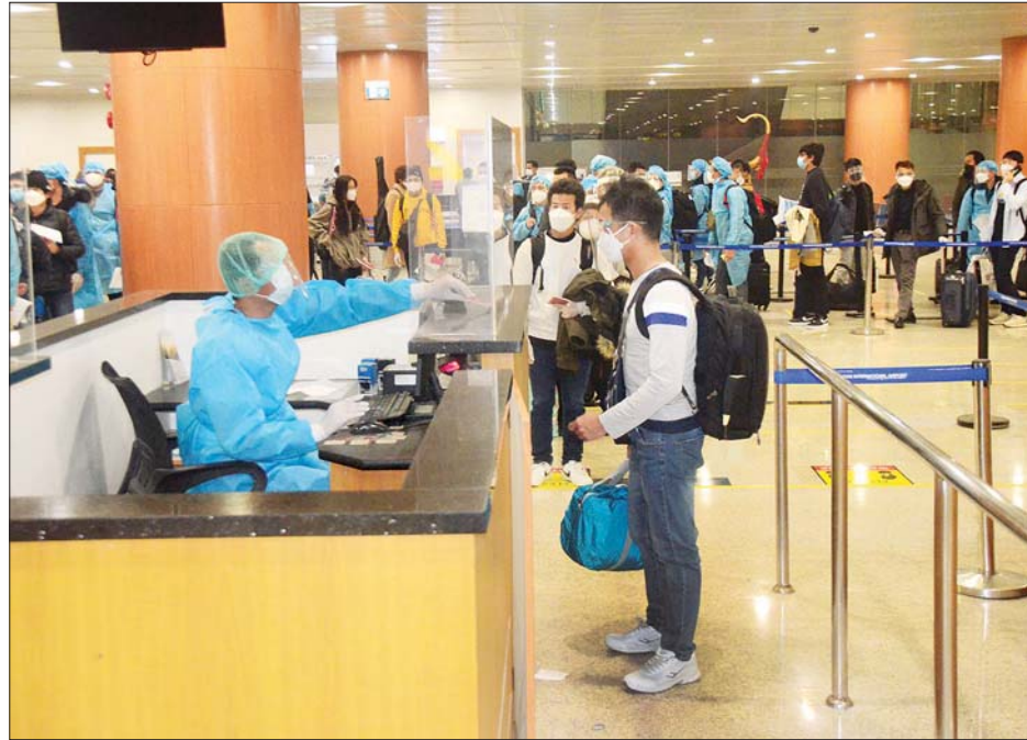
ပြည်ပနိုင်ငံများမှ ပြန်လည်ရောက်ရှိလာသည့် မြန်မာနိုင်ငံသားများအား တွေ့ရစဉ်။

နေအိမ်တွင် အသွားအလာကန့်သတ်မှု ခုခံရန် နေထိုင် စေရေးတို့ကို အလုပ်သမား၊ လူဝင်မှုကြီးကြပ်ရေးနှင့် ပြည်သူ့အင်အားဝန်ကြီးဌာန၊ ကျန်းမာရေးနှင့် အားကစား ဝန်ကြီးဌာနနှင့် ရန်ကင်းတိုင်းဒေသကြီးအစိုးရအဖွဲ့တို့မှ သက်ဆိုင်ရာအခန်းကဏ္ဍအလိုက် တာဝန်ယူဆောင်ရွက် ပေးခဲ့သည်။ ပြည်ပနိုင်ငံများတွင် အခက်အခဲကြုံတွေ့နေရသည့် မြန်မာနိုင်ငံသားများနှင့် သင်္ဘောသားများအား ပြန်လည် ခေါ်ဆောင်ရန် Coronavirus Disease 2019(COVID-19) ကာကွယ်၊ ထိန်းချုပ်၊ ကုသရေး အမျိုးသားအဆင့် ဗဟို ကော်မတီ၏လမ်းညွှန်ချက်နှင့်အညီ နိုင်ငံခြားရေးဝန်ကြီး ဌာနအနေဖြင့် သက်ဆိုင်ရာဝန်ကြီးဌာနများ၊ သက်ဆိုင်ရာ နိုင်ငံများရှိ မြန်မာသံရုံးများ၊ သင်္ဘောကုမ္ပဏီများ၊ အဖွဲ့အစည်းများနှင့် ပူးပေါင်းညှိနှိုင်း ဆောင်ရွက်ပေးလျက် ရှိရာ ယနေ့ထိ ကိုရီးယားသမ္မတနိုင်ငံမှ ကယ်ဆယ်ရေး လေယာဉ် ၃၈ ကြိမ်တိုင် ပျံသန်း ပြေးဆွဲပေးနိုင်ခဲ့ပြီး ဖြစ်ကြောင်း သိရသည်။ သတင်းစဉ်