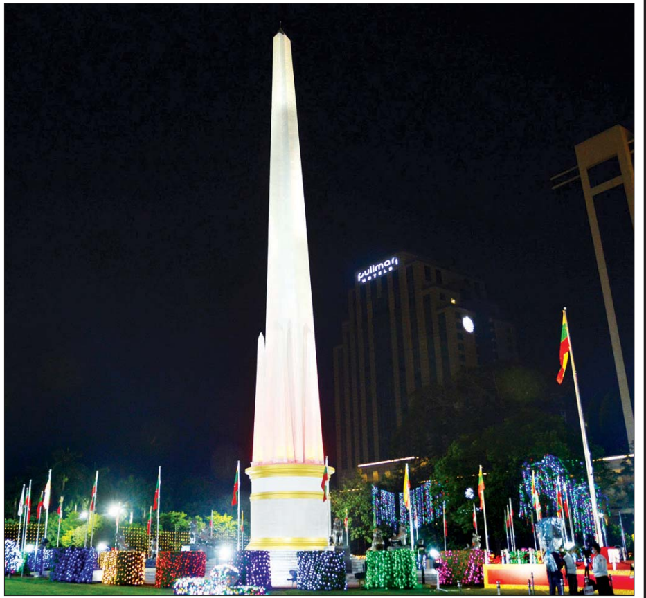
(၇၃) နှစ်မြောက် လွတ်လပ်ရေးနေ့တွင် ရန်ကုန်မြို့ မဟာဗန္ဓုလပန်းခြံရှိ လွတ်လပ်ရေးကျောက်တိုင်ရှေ့၌ ရောင်စုံမီးအလှများ ထွန်းညှိထားမှုကို တွေ့ရစဉ်။