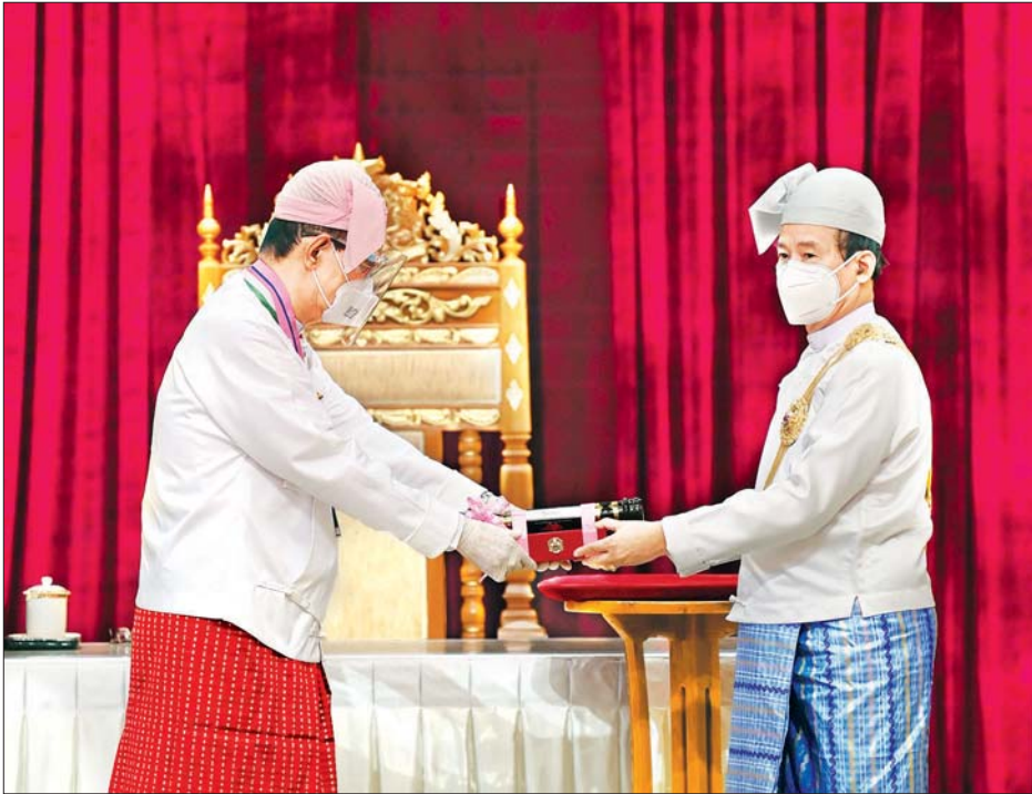
နိုင်ငံတော်သမ္မတ ဦးဝင်းမြင့် သိပ္ပံကျော်စွာဘွဲ့ရရှိသူ တာသာရပ်ဆိုင်ရာပညာရှင် ဦးကျော်ဝင်းအား ဂုဏ်ထူးဆောင်ဘွဲ့ ပေးအပ်ချီးမြှင့်စဉ်။ သတင်းစဉ်