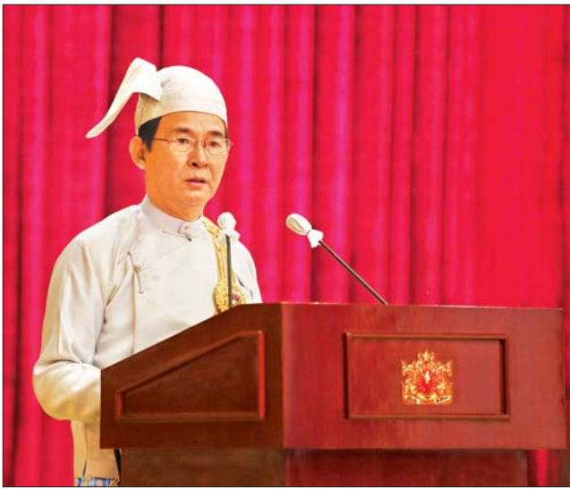
နိုင်ငံတော်သမ္မတ ဦးဝင်းမြင့် ဂုဏ်ထူးဆောင်ဘွဲ့များ ချီးမြှင့်အပ်နှင်းခြင်း အခမ်းအနားတွင် မိန့်ခွန်းပြောကြားစဉ်။ သတင်းစဉ်