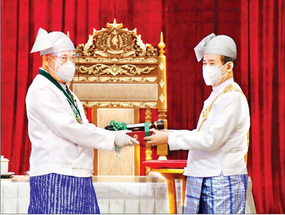
နိုင်ငံတော်သမ္မတ ဦးဝင်းမြင့် ပြည်ထောင်စုစည်သူ သင်္ကာဘွဲ့ဖြစ်သည့် သရေစည်သူဘွဲ့ရရှိသူ ကမ္ဘောဇဘက် လီမိတက်နာယက ဝဏ္ဏကျော်ထင်၊ စည်သူ ဦးအောင်ကိုဝင်းအား ဂုဏ်ထူးဆောင်ဘွဲ့ ပေးအပ်ချီးမြှင့်စဉ်။ သတင်းစဉ်

နိုင်ငံတော်သမ္မတနှင့် နိုင်ငံတော်၏ အတိုင်ပင်ခံပုဂ္ဂိုလ်တို့သည် တက် ရောက်လာကြသူများ၊ ဂုဏ်ထူး ဆောင်ဘွဲ့ရရှိကြသူများနှင့် ၎င်းတို့ ၏ မိသားစုဝင်များကို ရင်းရင်းနှီးနှီး နှုတ်ဆက်သည်။ သတင်းစဉ်