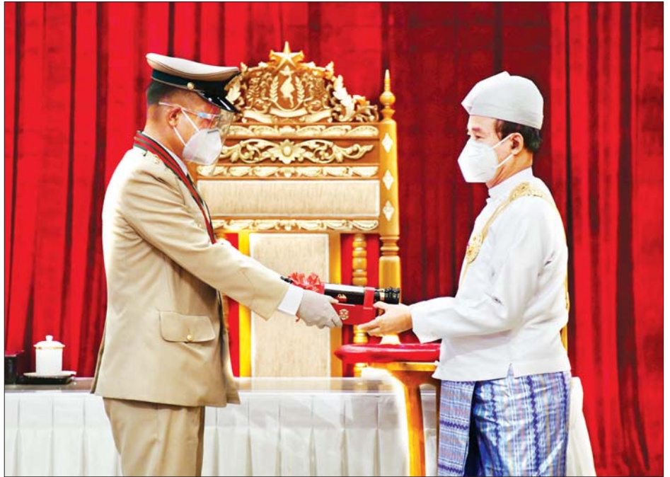
နိုင်ငံတော်သမ္မတ ဦးဝင်းမြင့် သူရဘွဲ့ရရှိသည့် စစ်တက္ကသိုလ်မှ ဗိုလ်ကြီး ဇော်ဦးလွင်အား ဂုဏ်ထူးဆောင်ဘွဲ့ ပေးအပ် ချီးမြှင့်စဉ်။ သတင်းစဉ်