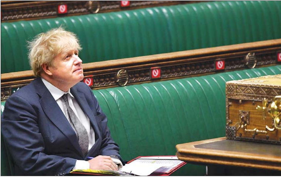
ဗြိတိန်ဝန်ကြီးချုပ် ဘောရစ်ဂျွန်ဆင်။

လန်ဒန် ဇန်နဝါရီ ၄ ဗြိတိန်နိုင်ငံ၏ အဓိကအတိုက်အခံပါတီဖြစ်သည့် လေဘာပါတီသည် လက်ရှိဗြိတိန်နိုင်ငံတွင် ကိုဗစ်-၁၉ ကူးစက်မှုများ ပြန့်လွှတ်မှုများပြားလာသည့်အတွက် အစိုးရ၏တုံ့ပြန်မှုများမှာ လုံလောက်မှုမရှိဟုဆိုကာ ပြင်းပြင်းထန်ထန် ဝေဖန်ခဲ့သည်။