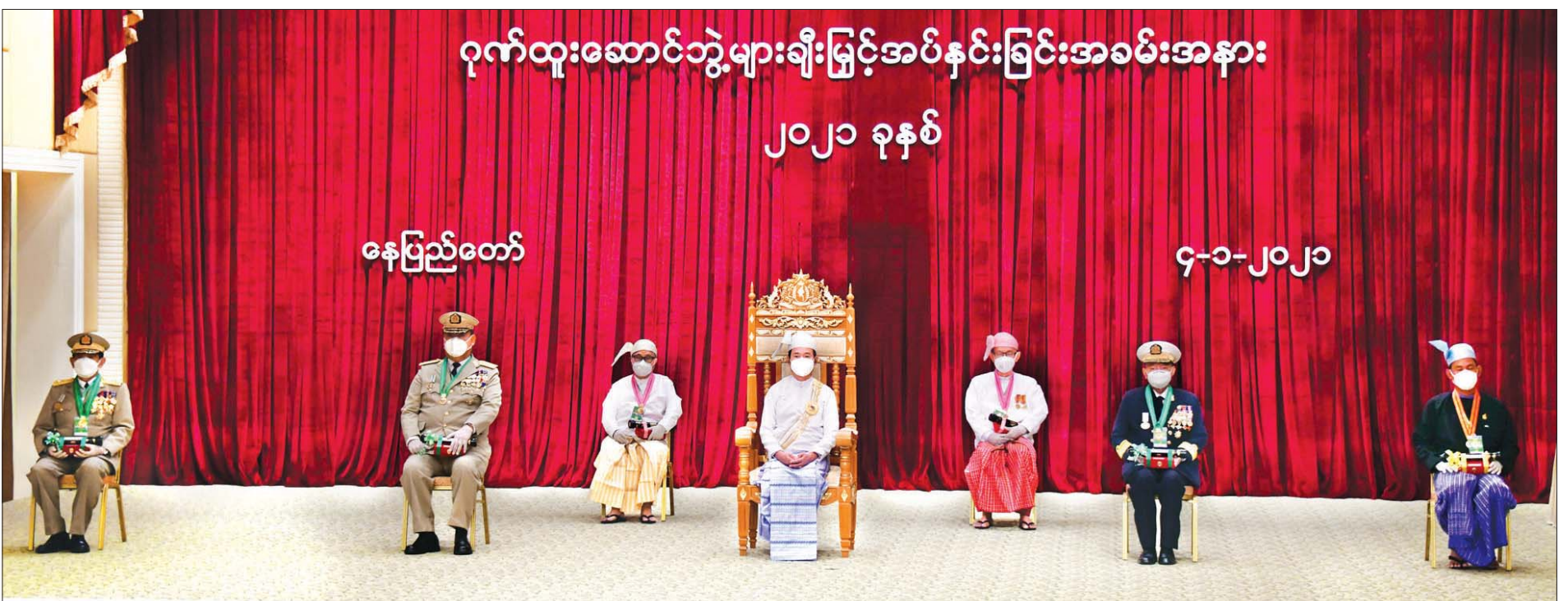
နိုင်ငံတော်သမ္မတ ဦးဝင်းမြင့် ၂၀၂၀ ပြည့်နှစ်တွင် ချီးမြှင့်ခံရသော ဂုဏ်ထူးဆောင်ဘွဲ့ရရှိသူများ၊ ၎င်းတို့၏ မိသားစုဝင်များနှင့်အတူ မှတ်တမ်းတင်ဓာတ်ပုံရိုက်စဉ်။