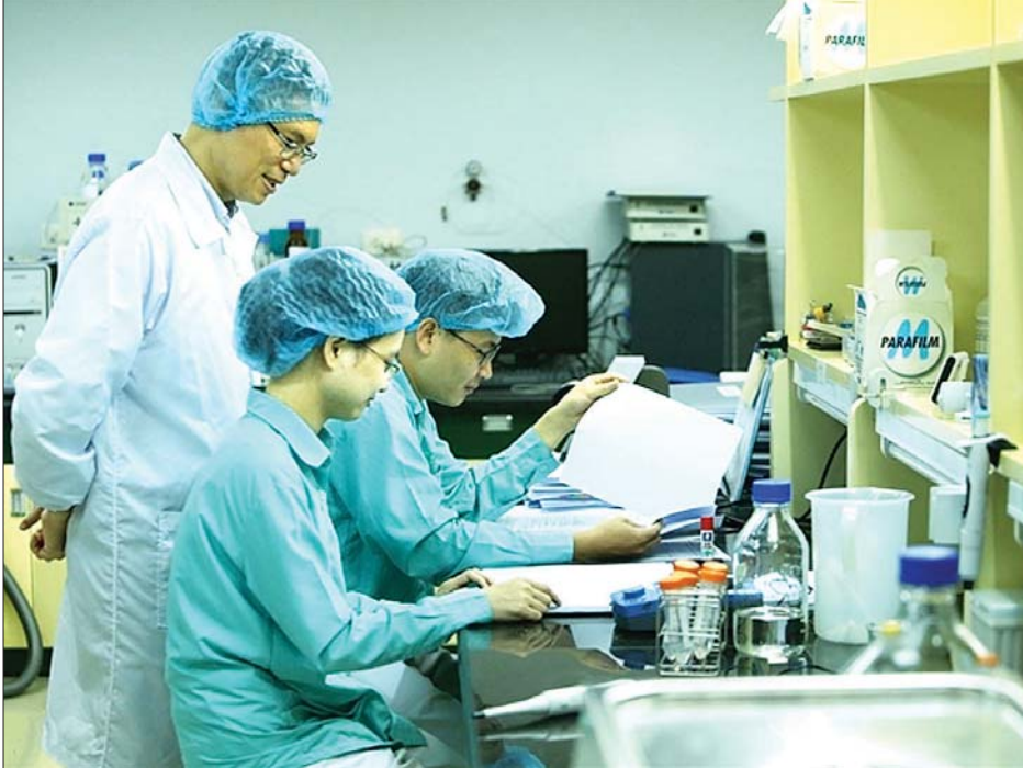
ဗီယက်နမ်နိုင်ငံ Vabiotech ကုမ္ပဏီမှ ကာကွယ်ဆေးစမ်းသပ်မှုများပြုလုပ်နေစဉ်။

ဟန့်ရှင်း ဇန်နဝါရီ ၄ ဗီယက်နမ်နိုင်ငံသည် ဗြိတိန် ဆေးဝါး ကုမ္ပဏီဖြစ်သည့် အက်စ်ထရာဇီကာ မှ ကိုဗစ်-၁၉ ကာကွယ်ဆေးသန်း ၃၀ ဝယ်ယူရန်အတွက် မှာယူထားကြောင်း ဗီယက်နမ်ကျန်းမာရေး အရာရှိတစ်ဦး က ဇန်နဝါရီ ၄ ရက်တွင် ပြောကြား သည်။