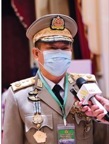
ဒုတိယဗိုလ်ချုပ်ကြီး ဇေယျကျော်ထင် သက်ပုံ

ဒုတိယဗိုလ်ချုပ်ကြီး ဇေယျကျော်ထင် သက်ပုံ ဒီနေ့ အခမ်းအနားမှာ ကျွန်တော်ချီးမြှင့်ခြင်းခံရတာက ဇေယျကျော်ထင်ဘွဲ့ဖြစ်ပါတယ်။ ကျွန်တော် တက္ကသိုလ်ဝင်တန်းကို ၁၉၈၃ ခုနှစ်မှာ အောင်မြင်ခဲ့ပါတယ်။