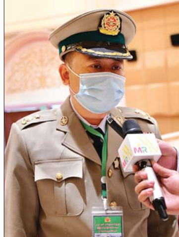
ဒုတိယဗိုလ်ချုပ်ကြီး သီဟသူရအေးမင်းအောင်

ဒုတိယဗိုလ်ချုပ်ကြီး သီဟသူရအေးမင်းအောင် ဒီနေ့ ဂုဏ်ထူးဆောင်ဘွဲ့တွေ ချီးမြှင့်အပ်နှင်းခြင်း အခမ်းအနားမှာ ကျွန်တော်ရရှိတဲ့ဘွဲ့က သီဟသူရဘွဲ့ဖြစ်ပါတယ်။ ၂၀၁၉ ခုနှစ်မှတ်လက ရခိုင်ပြည်နယ်ထဲမှာ တိုက်ပွဲဖြစ်ပွားခဲ့ပါတယ်။ အဲဒီတိုက်ပွဲမှာ ကျွန်တော်တပ်ရင်းက အရာရှိ၊ စစ်သည်တွေကို စနစ်တကျကြီးကြပ်ကွပ်ကဲ ကိုယ်တိုင်ဦးဆောင်ပြီး နောက်ဆုံးအခြေအနေအထိ တိုက်ပွဲဝင်ခဲ့ပါတယ်။ ရန်သူက ကျွန်တော်တို့ထက် သာလွန်တဲ့အင်အားနဲ့ အကြိမ်ကြိမ် အပြီးတိုင်ချေမှုန်းဖို့ ကြိုးစားခဲ့ပါတယ်။ အဲဒီအခြေအနေမှာ ကျွန်တော်တပ်ရင်းက အရာရှိ၊ စစ်သည်တွေ ထိခိုက်ကျဆုံးမှု အနည်းဆုံးဖြစ်အောင် စီမံကွပ်ကဲပြီး ရွပ်ရွပ်ချွံချွံ ဦးဆောင်တိုက်ပွဲဝင်ခဲ့ပါတယ်။ ကျွန်တော်တို့ စစ်သားတွေဟာ နိုင်ငံတော်