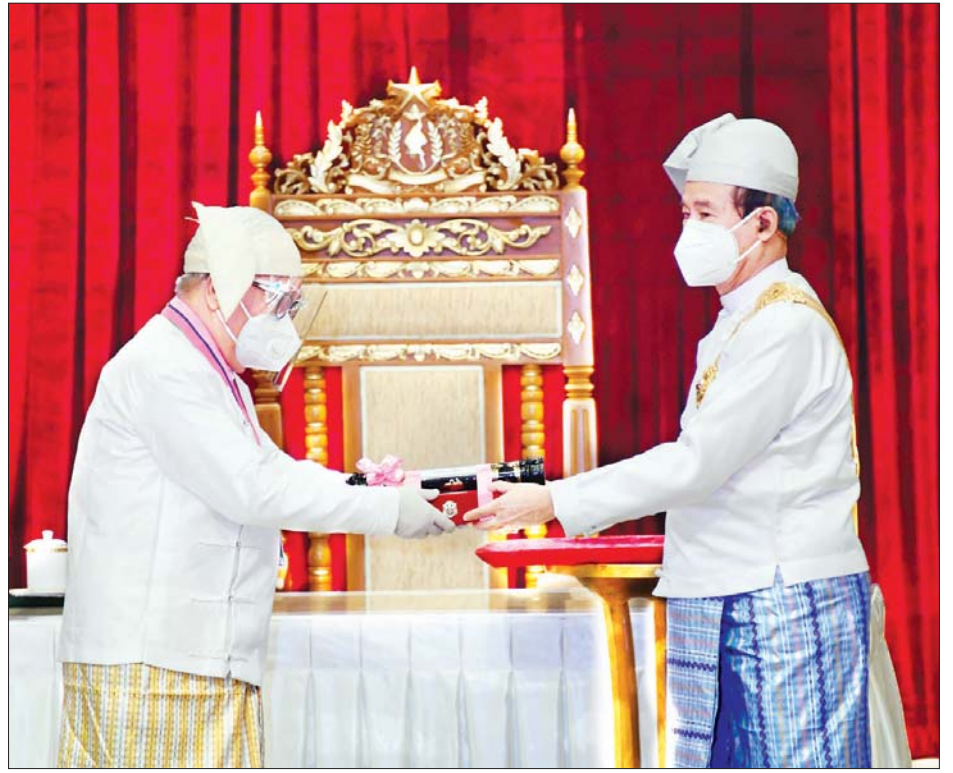
နိုင်ငံတော်သမ္မတ ဦးဝင်းမြင့် သိပ္ပံကျော်စွာဘွဲ့ရရှိသူ ဘာသာရပ်ဆိုင်ရာပညာရှင် ဒေါက်တာတိုးလှ အား ဂုဏ်ထူးဆောင်ဘွဲ့ပေးအပ်ချီးမြှင့်စဉ်။