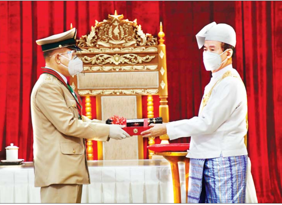
နိုင်ငံတော်သမ္မတ ဦးဝင်းမြင့် သူရဘွဲ့ရရှိသည့် အမှတ်(၅၆၄) ခြေမြန်တပ်ရင်းမှ ဗိုလ်မှူး ရန်နိုင်ဦး အား ဂုဏ်ထူးဆောင်ဘွဲ့ ပေးအပ်ချီးမြှင့်စဉ်။ သတင်းစဉ်