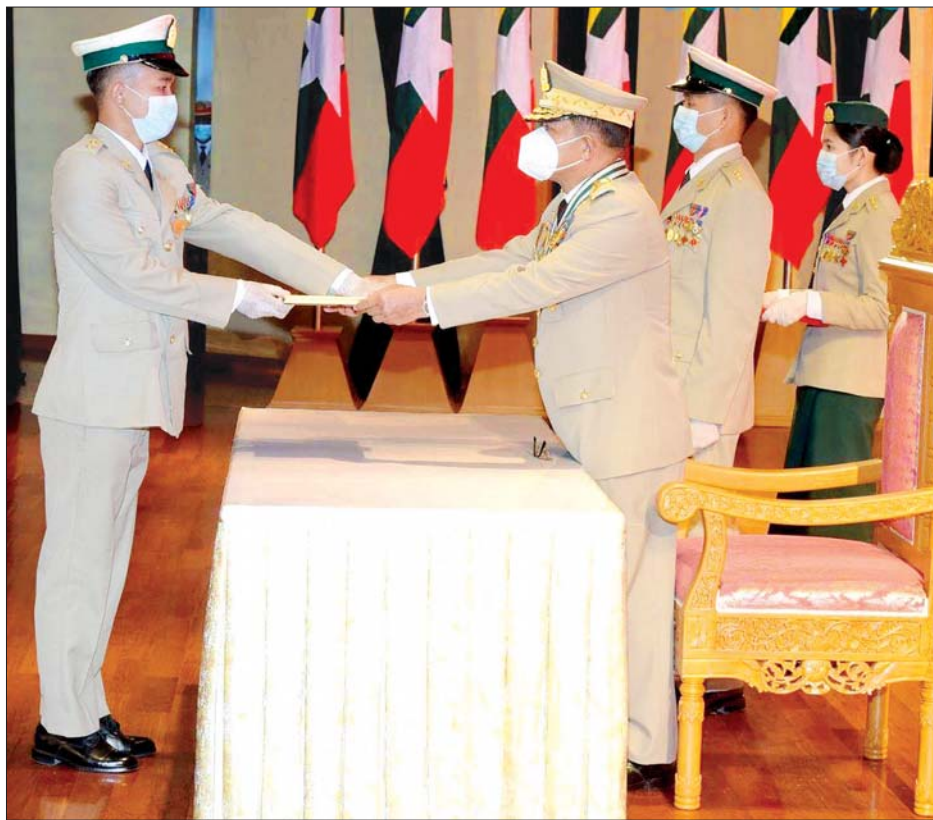
တပ်မတော်ကာကွယ်ရေးဦးစီးချုပ် ဗိုလ်ချုပ်မှူးကြီး မဟာသရေစည်သူမင်းအောင်လှိုင် သူရဲကောင်းမှတ်တမ်းဝင် တံဆိပ်ရရှိသူတစ်ဦးအား သူရဲကောင်းမှတ်တမ်းဝင် တံဆိပ်နှင့် လက်မှတ် ပေးအပ်ချီးမြှင့်စဉ်။