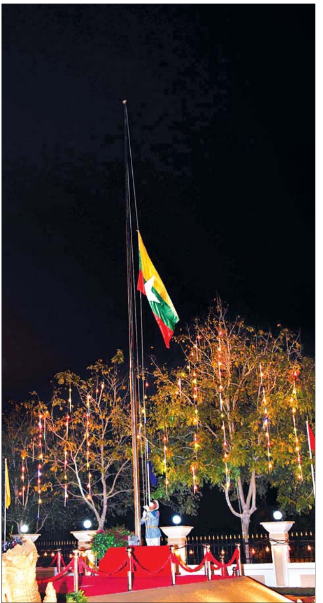
၂၀၂၁ ခုနှစ် (၇၃)နှစ်မြောက် လွတ်လပ်ရေးနေ့ နိုင်ငံတော်အလံတင်အခမ်း အနားနှင့် နိုင်ငံတော်အလံအလေးပြုပွဲအခမ်းအနားကို နေပြည်တော် မြို့တော် ခန်းမရှေ့ရင်ပြင်၌ ကျင်းပရာ အလံတင်တပ်စုက တိုင်းရင်းသား တိုင်းရင်းသူ များခြံရံ၍ နိုင်ငံတော်အလံကို လွှင့်တင်ကြစဉ်။ သတင်းစဉ်

ကျဆုံးလေပြီးသော ခေါင်းဆောင် ကြီးများနှင့် တပ်မတော်သားများအား အလေးပြု၍ သစ္စာလေးချက်ကို သံပြိုင်ရွတ်ဆိုကြသည်။ သဝဏ်လွှာဖတ်ကြား ယင်းနောက် ဒုတိယသမ္မတ ဦးမြင့်ဆွေက ပြည်ထောင်စုသမ္မတ မြန်မာနိုင်ငံတော် နိုင်ငံတော်သမ္မတ လွတ်လပ်ရေးနေ့ အခမ်းအနားသို့ ပေးပို့သည့်သဝဏ်လွှာကို ဖတ်ကြား သည်။ ထို့နောက် ဒုတိယသမ္မတ ဦးမြင့် ဆွေသည် ဂုဏ်ပြုတပ်ဖွဲ့၏ အလေးပြု ခြင်းကို ခံယူပြီး အခမ်းအနားကို ရုပ်သိမ်းလိုက်သည်။ သတင်းစဉ်