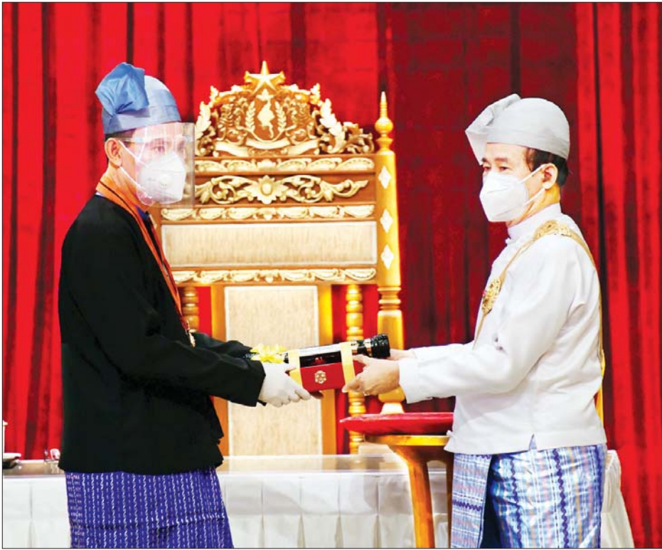
နိုင်ငံတော်သမ္မတ ဦးဝင်းမြင့် အလင်္ကာကျော်စွာဘွဲ့ရရှိသူ ဆိုင်းပညာရှင် ဦးစိန်စတင်း(ခ) ဦးတင်မောင်(ကွယ်လွန်) ကိုယ်စား သားဖြစ်သူ ဦးမင်းဟန်(ခ)ဦးစိန်မင်းနိုင်အား ဂုဏ်ထူးဆောင်ဘွဲ့ ပေးအပ်ချီးမြှင့်စဉ်။