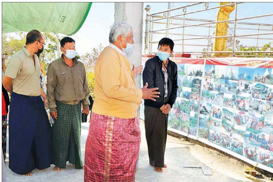
တောင်တက်လမ်းတစ်လျှောက် ကွန်ကရစ်လမ်းခင်းခြင်း ခဲ့ကြောင်း သိရသည်။ အတွက် ဘီလပ်မြေအိတ် ၅၀၀ ကို ထောက်ပံ့လှူဒါန်း ထွန်းကိုကို(ပြန်/ဆက်)

ဆက်လက်၍ တိုင်းဒေသကြီး ဝန်ကြီးချုပ်နှင့် ဇနီးသည် တောင်မတောတောင်ထိပ်ရှိ စေတီတော်အား ဖူးမြော် ကြည့်ရှု၍ အလှူတော်ငွေများကို ပေးအပ်လှူဒါန်းပြီး