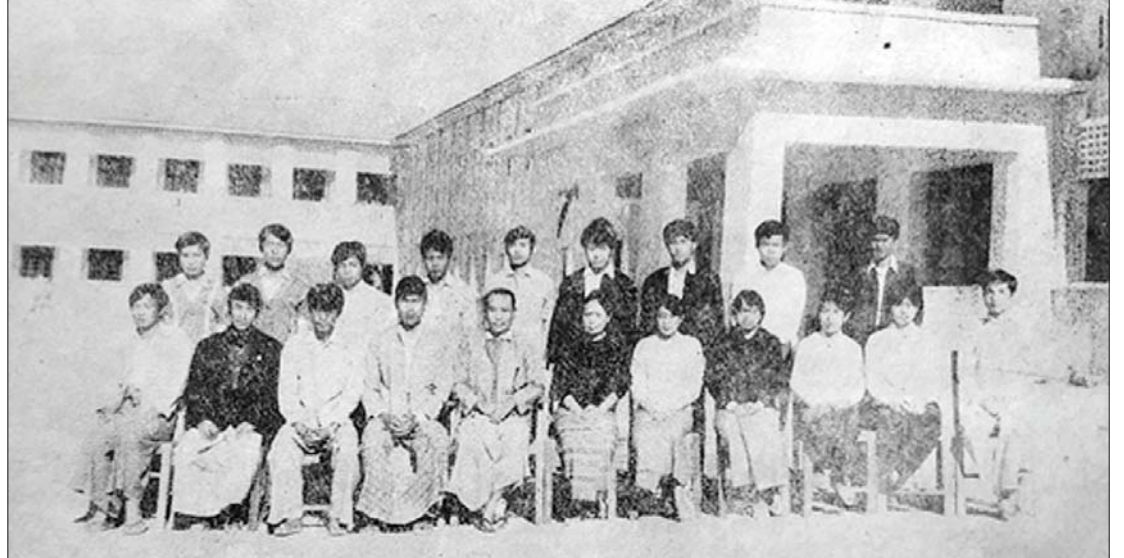
၁၉၇၃ ခုနှစ်က ထုတ်ဝေခဲ့သည့် တိုင်းရင်းသားစာစောင်၌ ပါဝင်သော တိုင်းရင်းသားများ စာပေနှင့်ယဉ်ကျေးမှုကော်မတီ၊ တောင်ကြီး ကောလိပ်၏ အမှုဆောင်များ။

ထို့ကြောင့် တိုင်းရင်းသား ကျောင်းသား ကျောင်းသူ လူငယ်များသည် ရန်ကုန် တက္ကသိုလ်၌ ပညာဆည်းပူးလေ့လာရင်းဖြင့် အချင်းချင်း တစ်ဦးအကြောင်းတစ်ဦး သိရှိ နားလည်ရေး၊ ချစ်ခင်ရင်းနှီးရေး၊ စည်းလုံး ညီညွတ်ရေးတို့သည် အလွန်လိုအပ်သော အချက်ဖြစ်သည်။ တိုင်းရင်းသားအချင်းချင်း၊ စိတ်ဝမ်းကွဲ ပြား၍ ယုံကြည်မှု ပျက်ပြားခဲ့သည့်အတွက် သူတစ်ပါးကျွန် ဖြစ်ခဲ့ကြရသော်လည်း ၁၉၄၇ ခုနှစ်က ပင်လုံတွင် တိုင်းရင်းသားအချင်းချင်း စုရုံးပေါင်းစည်း၍ ညီညွတ်မှုကို ပြသနိုင်သည့် အတွက် နိုင်ငံလွတ်လပ်ရေး ပြန်ရခဲ့ကြပေ သည်။ ထိုနည်းတူ လွတ်လပ်ရေးကို ကာကွယ် ထိန်းသိမ်းစောင့်ရှောက်ရာ၌ လည်းကောင်း၊ တိုင်းရင်းသားအားလုံးတို့၏ အကျိုးစီးပွား များ စဉ်ဆက်မပြတ် ရှင်သန်ဖွံ့ဖြိုးတိုးတက် ရေးအတွက်လည်းကောင်း တိုင်းရင်းသား စည်းလုံးညီညွတ်ရေးကိုပင် မဏ္ဍိုင်ပြုကာ ဆောင်ရွက်သွားကြရပေမည်။