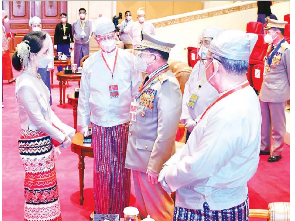
ဂုဏ်ထူးဆောင်ဘွဲ့များ ချီးမြှင့်အပ်နှင်းခြင်းအခမ်းအနားသို့ တက်ရောက်လာသော နိုင်ငံတော်၏အတိုင်ပင်ခံပုဂ္ဂိုလ် ဒေါ်အောင်ဆန်းစုကြည် တပ်မတော်ကာကွယ်ရေးဦးစီးချုပ် ဗိုလ်ချုပ်မှူးကြီး မင်းအောင်လှိုင်နှင့် တက်ရောက် လာသူများအား ရင်းရင်းနှီးနှီးတွေ့ဆုံနှုတ်ဆက်စဉ်။ သတင်းစဉ်

❖ ကျော့ဖုံးမှ ပြည်ထောင်စုရာထူးဝန်အဖွဲ့ ဥက္ကဋ္ဌ၊ နေပြည်တော်ကောင်စီဥက္ကဋ္ဌ၊ မြန်မာ နိုင်ငံတော်ဗဟိုဘဏ်ဥက္ကဋ္ဌ၊ အဂတိ လိုက်စားမှုတိုက်ဖျက်ရေးကော်မရှင် ခေတ္တဥက္ကဋ္ဌ၊ မြန်မာနိုင်ငံအမျိုးသား လူ့အခွင့်အရေး ကော်မရှင်ဥက္ကဋ္ဌ၊ တပ်မတော် အရာရှိကြီးများ၊ ပြည်ထောင်စုတရားလွှတ်တော်ချုပ် တရားသူကြီးများ၊ နိုင်ငံတော်ပွဲစည်းပုံ အခြေခံဥပဒေဆိုင်ရာခုံရုံး အဖွဲ့ဝင် များ၊ ပြည်ထောင်စုရွေးကောက်ပွဲ ကော်မရှင်အဖွဲ့ဝင်များ၊ နေပြည်တော် တိုင်းစစ်ဌာနချုပ် တိုင်းမှူး၊ ဒုတိယ ဝန်ကြီးများ၊ ဒုတိယ ရှေ့နေချုပ်၊ ပြည်ထောင်စုရာထူးဝန်အဖွဲ့ အဖွဲ့ဝင်