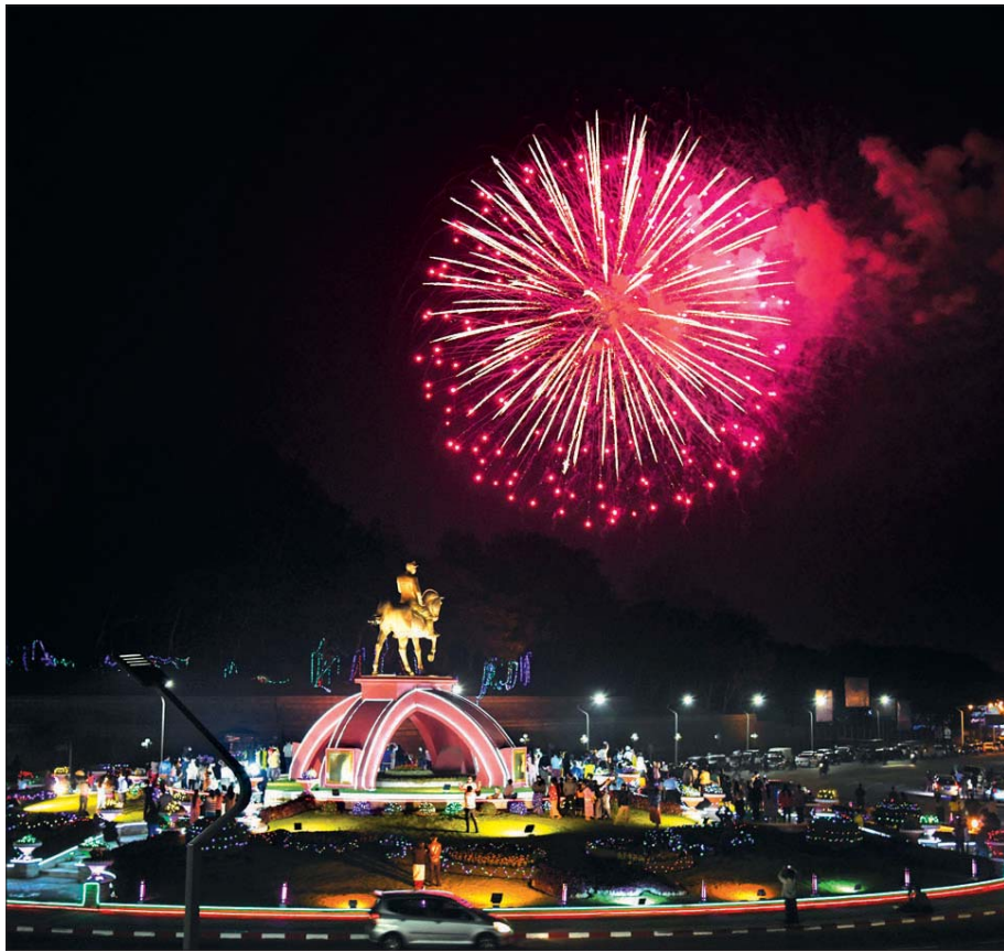
(၇၃) နှစ်မြောက် လွတ်လပ်ရေးနေ့ညတွင် နေပြည်တော်ရှိ ဗိုလ်ချုပ်ကြေးရုပ်တုအပေါ်၌ မီးရှူးမီးပန်း ပစ်ဖောက်နေမှုကို တွေ့ရစဉ်။