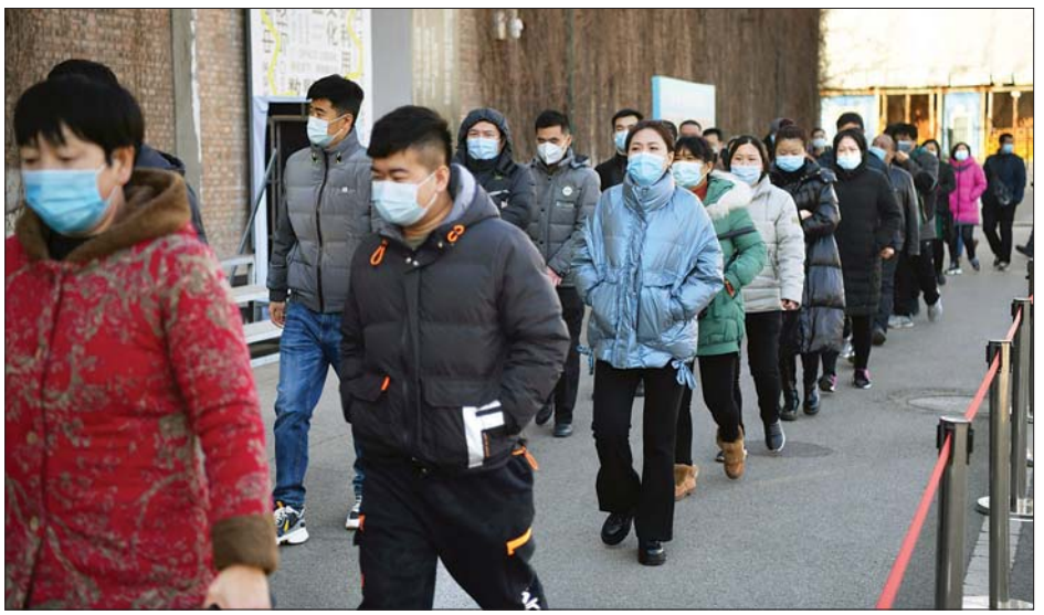
ကိုဗစ် -၁၉ ကာကွယ်ဆေး စင်တာသို့သွားနေကြသူများအား ဇန်နဝါရီ ၄ ရက်က တွေ့ရစဉ်။