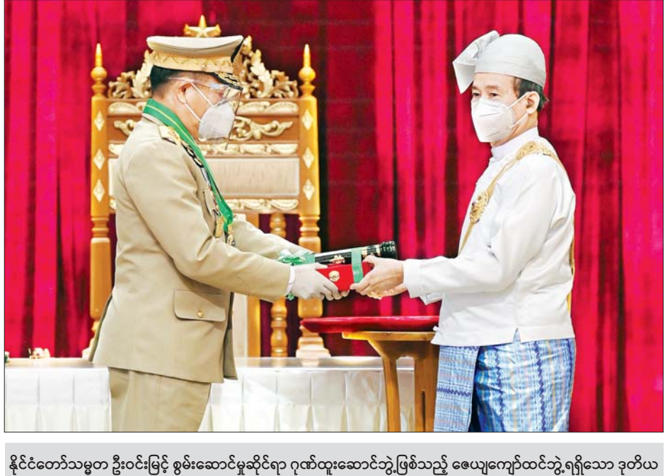
နိုင်ငံတော်သမ္မတ ဦးဝင်းမြင့် စွမ်းဆောင်မှုဆိုင်ရာ ဂုဏ်ထူးဆောင်ဘွဲ့ဖြစ်သည့် ဇေယျကျော်ထင်ဘွဲ့ရရှိသော ဒုတိယ ဗိုလ်ချုပ်ကြီး သက်ဝံအား ဂုဏ်ထူးဆောင်ဘွဲ့ ပေးအပ်ချီးမြှင့်စဉ်။ သတင်းစဉ်