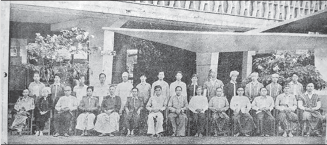
၁၉၇၃ ခုနှစ်က ထုတ်ဝေခဲ့သည့် တိုင်းရင်းသားစာစောင်၌ ပါဝင်သော တိုင်းရင်းသားများ စာပေနှင့်ယဉ်ကျေးမှုကော်မတီ၊ တက္ကသိုလ်များ-ရန်ကုန်၏ အမှုဆောင်များ။

မြန်မာနိုင်ငံတော်တွင် ၁၉၂၀ ပြည့်နှစ်မှ စတင်၍ အဆင့်မြင့်ပညာသင်ကြားပို့ချသော ရန်ကုန်တက္ကသိုလ်ကြီး စတင်ဖြစ်တည်လာခဲ့သည်။ ထိုကာလမှစတင်၍ မြန်မာနိုင်ငံ တစ်ဝန်းလုံးမှ တိုင်းရင်းသားလူမျိုးပေါင်းစုံ (ဗမာလူမျိုးအပါအဝင်) တို့၏ လူငယ်များသည် အဆင့်မြင့်ပညာရပ်များကို အဆိုပါတက္ကသိုလ်ကြီး၌ တက်ရောက်ဆည်းပူးလေ့လာခဲ့ကြပေသည်။ တစ်နည်းအားဖြင့် တိုင်းရင်းသား ပညာတတ်လူငယ်ကျောင်းသားများ စုစည်းရာ နေရာဌာနကြီးလည်းဖြစ်သည်။ တိုင်းရင်းသား ကျောင်းသား ကျောင်းသူ လူငယ်များသည် အသိပညာရပ်၊ အတတ်ပညာရပ်များ ဖြစ်လာရန် အဆင့်မြင့်ပညာကို ဆည်းပူးလေ့လာရင်း တစ်ဦးနှင့် တစ်ဦး ချစ်ခင်ရင်းနှီးရေးအတွက် တစ်ဦးအကြောင်းအား တစ်ဦးက သဘောပေါက်နားလည်ရန်အတွက် တစ်ဦး၏ ယဉ်ကျေးမှု၊ ဓလေ့ထုံးတမ်း အစဉ်အလာ၊ ဘာသာစကား၊ စာပေတို့ကို ကျွန်တစ်ဦးက လေ့လာပြီး အပြန်အလှန် လေးစားမှုဖြင့်ဖြင့် တစ်ဦးနှင့်တစ်ဦး အပြန်အလှန် ယုံကြည်မှုများ ရရှိလာကြမည်ဖြစ်သည်။ ထိုသို့ အပြန်အလှန်ယုံကြည်မှုမှတစ်ဆင့် တိုင်းရင်းသား စည်းလုံးညီညွတ်ရေးကို တည်ဆောက်နိုင်ပေမည်။