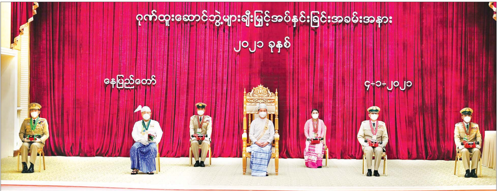
နိုင်ငံတော်သမ္မတ ဦးဝင်းမြင့် ၂၀၂၀ ပြည့်နှစ်တွင် ချီးမြှင့်ခံရသော ဂုဏ်ထူးဆောင်ဘွဲ့ရရှိသူများ၊ ၎င်းတို့၏ မိသားစုဝင်များနှင့်အတူ မှတ်တမ်းတင်ဓာတ်ပုံရိုက်စဉ်။