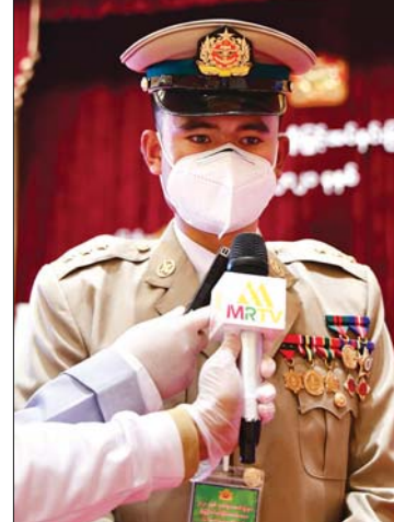
ဗိုလ်ကြီး သူရဇော်ဦးလွင်

ကျွန်တော်က မြန်မာ့သမိုင်းအဖွဲ့မှာ ဒုတိယဥက္ကဋ္ဌတာဝန် ထမ်းဆောင်ပါတယ်။ အရင်က သမိုင်းပါမောက္ခလုပ်ခဲ့ပါတယ်။ ဒီနေ့ရတဲ့ဘွဲ့တံဆိပ်က သိပ္ပကျော်စွာဘွဲ့ပါ။ ဒီဘွဲ့ ရတဲ့အတွက် ခံစားချက်ကတော့ ဝမ်းသာဂုဏ်ယူရတာပေါ့။ နောက်ပြီး ဒီဘွဲ့ရလိုက်တဲ့အတွက် နေရထိုင်ရတာ နည်းနည်းတော့ ကျဉ်းကျပ်သွားသလိုပဲ။ ဘာကြောင့်လဲဆိုတော့ လုပ်ရမယ့်တာဝန်တွေဟာ ပိုများလာမယ်လို့ ယုံကြည်ပါတယ်။ အဲဒါကြောင့် လုပ်ရမယ့်တာဝန်တွေ စဉ်းစားလိုက်တဲ့အခါ ဒီအသက်