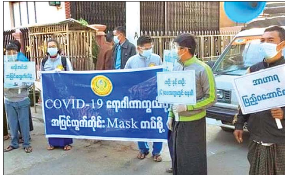
မုံရွာမြို့တွင် ကိုဗစ် - ၁၉ ရောဂါ ကာကွယ်ခြင်းဆိုင်ရာ နှာခေါင်းစည်းတပ်ဆင်ရေး အသိပညာပေး ဆောင်ရွက်နေမှုကို တွေ့ရစဉ်။

မုံရွာ ဒီဇင်ဘာ ၁၇ စစ်ကိုင်းတိုင်းဒေသကြီး အတွင်းရှိ မုံရွာမြို့တွင် ကိုဗစ် - ၁၉ ရောဂါ ကာကွယ်ခြင်းဆိုင်ရာ ကျန်းမာရေး အသိပညာမြှင့်တင်ရေးနှင့် ပြုမူ ပြောင်းလဲရေး ဆက်သွယ်ပညာပေး သည့် နှာခေါင်းစည်းတပ်ဆင်ရေး လူထုလှုပ်ရှားမှု စီမံချက်ကို ယနေ့ နံနက်ပိုင်းတွင် အရှိန်အဟုန်မြှင့် ဆောင်ရွက်လျက်ရှိကြောင်း သိရ သည်။ ရှေးဦးစွာ နှာခေါင်းစည်းတပ်ဆင် ရေး လူထုလှုပ်ရှားမှုစီမံချက်ကို လူစည်ကားရာ နေရာများဖြစ်သော မုံရွာမြို့ရှိ နန္ဒဝန်ဈေး၊ စက်မှုဇုန်ဈေး၊ ဈေးဟောင်း၊ မြသလွှာဈေး၊ ချင်းတွင်း ရတနာဈေးနှင့် မြဝတီရပ်ကွက် သစ္စာလမ်းအတွင်းရှိ ပြည်သူများ အား ပါးစပ်နှင့် နှာခေါင်းစည်းများ စာမျက်နှာ ၄ ကော်လံ ၁ □