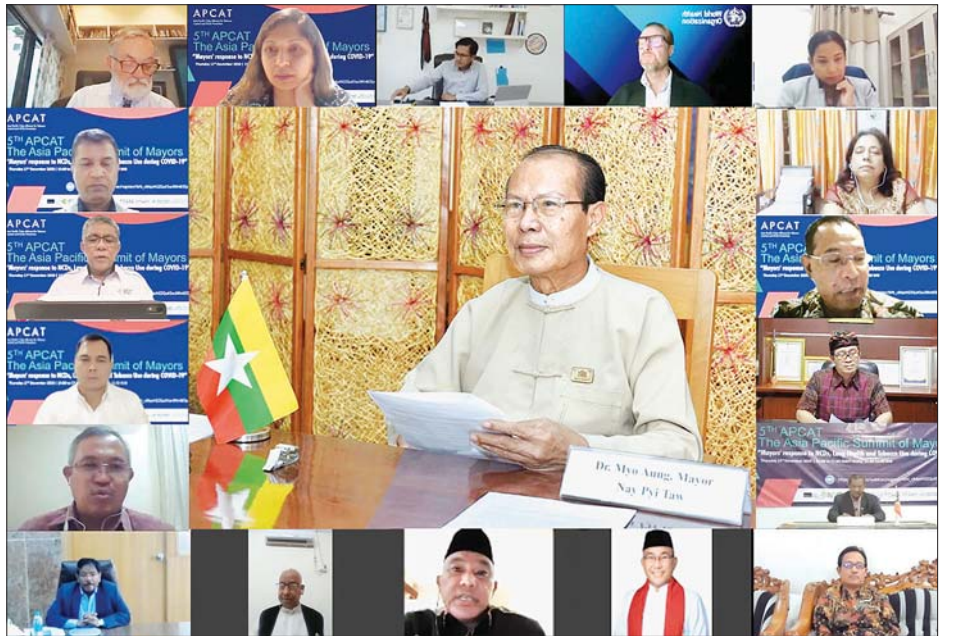
များတွင်လည်း ဆေးလိပ်နှင့် ဆေးရွက် ကာကွယ်နိုင်ရေးလုပ်ငန်းများကို ပစ်ဖိတ် ဒေသတွင်းရှိ နိုင်ငံများမှ ဝန်ကြီးများ၊ မြို့တော်ဝန်များ၊ ဖိတ်ကြားထားသော ဧည့်သည်တော် များ တက်ရောက်ကြသည်။ သတင်းစဉ်

တွေ့ဆုံရှင်းလင်းပွဲများ ဆောင်ရွက် ခဲ့ကြောင်း၊ နေပြည်တော်အတွင်းရှိ စီးပွားရေးလုပ်ငန်းများ၏ဆေးလိပ်နှင့် ဆေးရွက်ကြီး သောက်သုံးမှု ထိန်းချုပ်ရေးဆိုင်ရာ ဥပဒေနှင့် အမိန့် ကြော်ငြာစာများအပေါ် လိုက်နာ ဆောင်ရွက်မှု အခြေအနေကို စစ်တမ်း များ ကောက်ယူခဲ့ကြောင်း၊ ဆေးလိပ် နှင့် ဆေးရွက်ကြီးထွက်ပစ္စည်းများ သုံးစွဲခြင်း၏ ဆိုးကျိုးများကို အများ ပြည်သူသိရှိစေရန်နှင့် ဆေးလိပ်နှင့် ဆေးရွက်ကြီးထွက်ပစ္စည်း သောက် သုံးမှု ထိန်းချုပ်ရေးဆိုင်ရာ ဥပဒေနှင့် အမိန့်ကြော်ငြာစာများကို အများ ပြည်သူသိရှိစေရန် အသိပညာပေး အစီအစဉ်များကို ကျယ်ကျယ်ပြန့်ပြန့် ဆောင်ရွက်ခဲ့ကြောင်း၊ အသိပညာပေး ပို့စတာများကိုလည်း နေရာအနှံ့ စိုက်ထူထားရှိကြောင်း၊ လာမည့်နှစ်