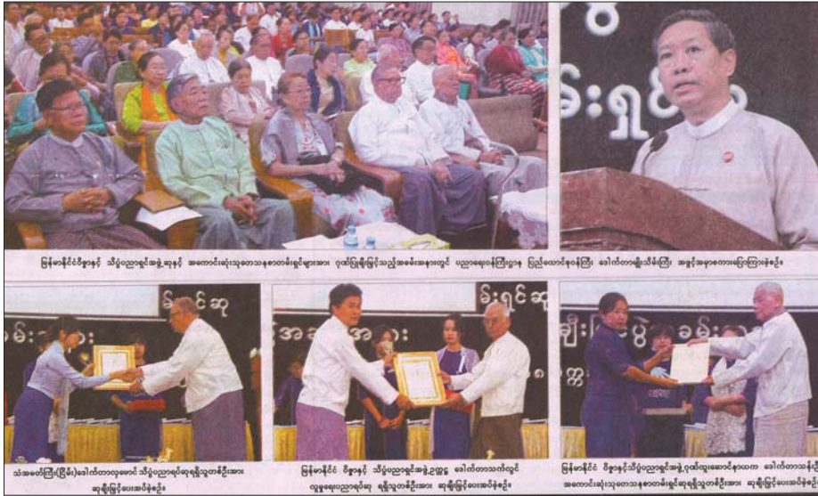
(၁၈)ကြိမ်မြောက် ၂၀၁၇ ခုနှစ် အတွက် အကောင်းဆုံးသုတေသနစာတမ်းများအား ဂုဏ်ပြုချီးမြှင့်သည့် အခမ်းအနား ကျင်းပစဉ်။

ကမ္ဘာ့တက္ကသိုလ်များ အဆင့်သတ်မှတ်ပေးရာတွင် (World University Ranking) တက္ကသိုလ်တစ်ခု၏ သုတေသန နှင့်ဖွံ့ဖြိုးမှုလုပ်ငန်းများသည် အဓိကအခန်းကဏ္ဍမှ ပါဝင်လျက်ရှိသည်ကို ဖတ်ရှုလေ့လာခဲ့ရပါသည်။ သို့ဖြစ်ပါ၍ မိမိတို့ ရန်ကုန်တက္ကသိုလ်၏ အဆင့်ပိုမိုမြင့်မားလာစေရန်အတွက် စီမံကိန်းများချမှတ်ရေးဆွဲရာတွင် တက္ကသိုလ်များ၏ သုတေသနလုပ်ငန်းရပ်များ ယခုထက်ပိုမိုတိုးမြှင့်လာစေရေးကို အလေးထားဆောင်ရွက်ပေးရန် လိုအပ်သည်ဟု ထင်မြင်မိပါသည်။ လက်ရှိတက္ကသိုလ် အသီးသီး၏ သုတေသနလုပ်ငန်းရပ်များ ဆောင်ရွက်နေမှုနှင့် ပတ်သက်၍ တင်ပြရမည်ဆိုလျှင် ပညာရေးဝန်ကြီးဌာနသည် မြန်မာနိုင်ငံ ဝိဇ္ဇာနှင့် သိပ္ပံပညာရှင်အဖွဲ့ကို ၁၉၉၁ ခုနှစ်တွင် စတင်ဖွဲ့စည်း ခဲ့ပြီးနောက် သုတေသနစာတမ်းဖတ်ပွဲများကို (၁၈)ကြိမ် ကျင်းပခဲ့ပြီး၊ ၎င်း(၁၈)နှစ်တာအချိန်ကာလအတွင်း တက္ကသိုလ် အသီးသီးတို့မှ ပညာရှင်များက သုတေသနစာတမ်းစုစုပေါင်း (၃၅၈၂)စောင် တင်သွင်းဖတ်ကြားနိုင်ခဲ့ပါသည်။ ထိုသို့ ဆောင်ရွက်နိုင်ခဲ့ခြင်းကြောင့် သုတေသနအရည်အသွေးများ တိုးမြှင့်လာသကဲ့သို့ မိမိတို့ပညာရပ် နယ်ပယ်အသီးသီးတို့တွင် လည်း သုတေသနလုပ်ငန်းရပ်များကို ယခင်ကထက်ပိုမို ထိရောက်အောင်မြင်စွာ ဆောင်ရွက်နေကြပြီဖြစ်ကြောင်း သိရှိရပါသည်။ ပညာရေးဝန်ကြီးဌာန၊ မြန်မာနိုင်ငံ ဝိဇ္ဇာနှင့် သိပ္ပံပညာရှင်အဖွဲ့က ချီးမြှင့်သည့် (၁၈)ကြိမ်မြောက် ၂၀၁၇ ခုနှစ်အတွက် အကောင်းဆုံးသုတေသနစာတမ်းရှင်များအား ဂုဏ်ပြုချီးမြှင့်သည့် အခမ်းအနားကို ၂၀၁၈ ခုနှစ်၊ နိုဝင် ဘာလ(၉)ရက်နေ့တွင် ရန်ကုန်တက္ကသိုလ်ဝိဇ္ဇာခန်းမ၌ ကျင်းပခဲ့ရာ ပညာရေးဝန်ကြီးဌာန၊ ပြည်ထောင်စုဝန်ကြီး ဒေါက်တာ မျိုးသိမ်းကြီးကိုယ်တိုင် တက်ရောက်ချီးမြှင့် အမှာစကား ပြောကြားခဲ့ပါသည်။