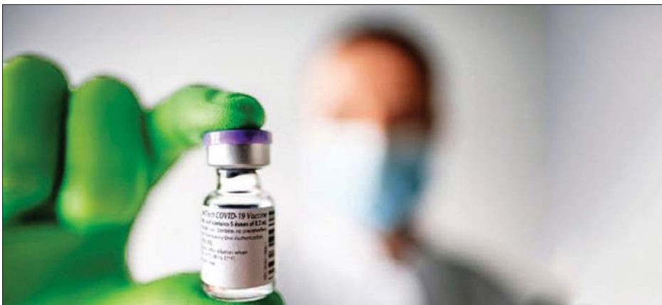
ကိုဗစ်-၁၉ ကာကွယ်ဆေးတစ်မျိုးကို တွေ့ရစဉ်။

သည်။ ကာကွယ်ဆေးထုတ်လုပ်ဖြန့် ဝေခြင်းလုပ်ငန်းများကို စတင်နေ သော်လည်း တန်းတူညီမျှဖြန့်ဝေပေး နိုင်ရန် အချိန်တစ်ခု ကြာဦးမည်ဖြစ် ကြောင်း ၎င်းက ဆက်လက်ပြောကြား လိုက်သည်။