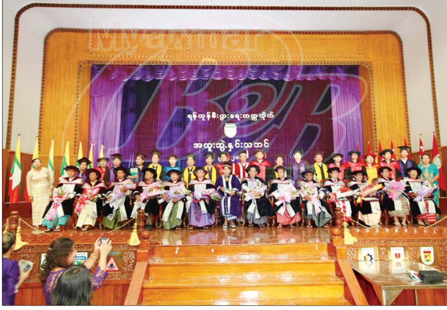
ရန်ကုန်စီးပွားရေးတက္ကသိုလ်မှ ဂုဏ်ထူးဆောင်ဒေါက်တာဘွဲ့ ချီးမြှင့်သည့် အခမ်းအနား၌ မှတ်တမ်းတင်ဓာတ်ပုံ ရိုက်စဉ်။

သို့ဖြစ်၍ အမိရန်ကုန်တက္ကသိုလ်ကြီးအနေဖြင့် ယခုနှစ်(၁၀၀)ပြည့်မှစ၍ နောင်ရာစုနှစ်များစွာတွင် အခွန်ရှည်တည် တံ့ပါစေကြောင်းနှင့် နောင်အနာဂတ်ကာလများတွင်လည်း နိုင်ငံ့ခေါင်းဆောင်ကောင်းများ၊ ပညာရှင်များ အမြောက် အမြားကို မွေးထုတ်နိုင်ပြီး အရှေ့တောင်အာရှတွင်သာမက ကမ္ဘာ့ထိပ်တန်းအဆင့်တက္ကသိုလ်များနှင့် ပါဝင် ရင်ပေါင် တန်းနိုင်စေရန် မိမိအနေဖြင့် ဆန္ဒပြုဆုတောင်း မေတ္တာပို့သအပ်ပါသည်။ ။