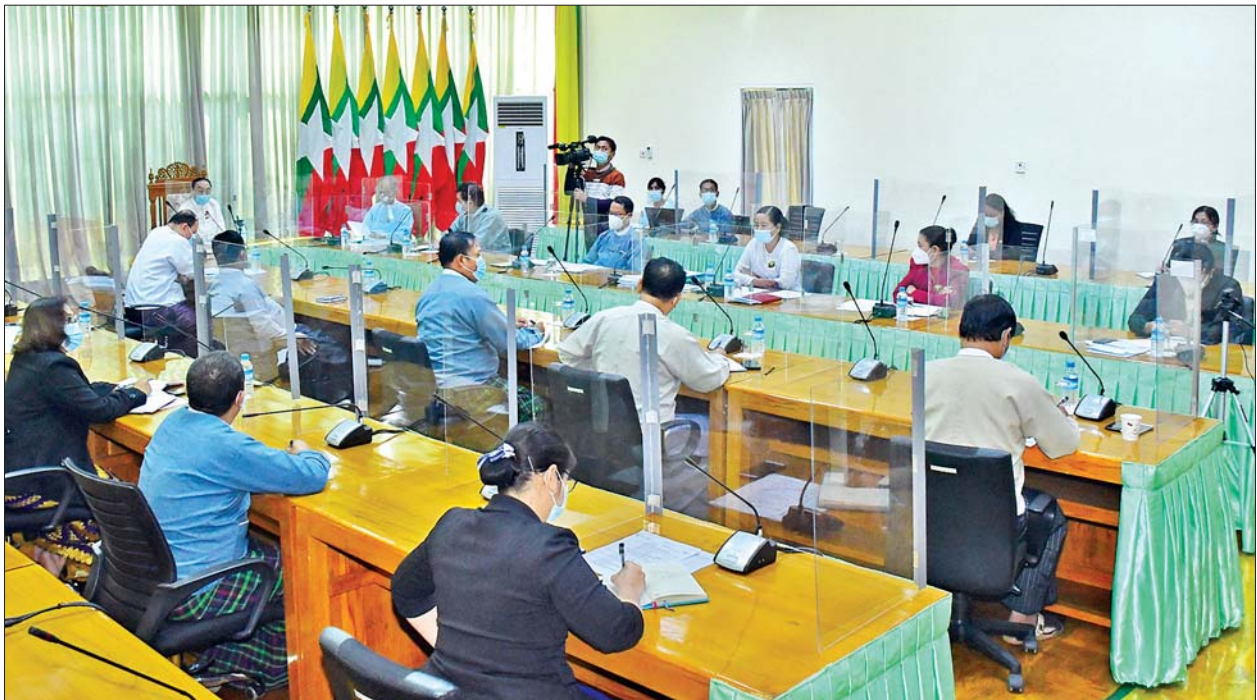
ပြည်ထောင်စုဝန်ကြီး နိုင်သက်လွင် အွန်လိုင်းစနစ်ဖြင့် ကျင်းပသည့် တိုင်းရင်းသားလူမျိုးများရေးရာဝန်ကြီးဌာန မြန်မာနိုင်ငံတိုင်းရင်းသားလူမျိုးများ၏ အခွင့်အရေးဆိုင်ရာ မဟာဗျူဟာ အတည်ပြုရေးဆွဲနိုင်ရေး ညှိနှိုင်းဆွေးနွေးပွဲ ဖွင့်ပွဲ အခမ်းအနား တက်ရောက်စဉ်။ သတင်းစဉ်

ထို့အပြင် တိုင်းရင်းသားအချင်းချင်း ရင်းနှီးချစ်ကြည်မှု တိုးပွားစေသော လေ့လာရေးခရီးများစီစဉ်ခြင်း၊ တိုင်းရင်းသားကလေးငယ်များ သင်ကြားသင်ယူမှု တိုးတက်စေရေးအတွက် တိုင်းရင်းသား ဘာသာစကားအသီးသီးဖြင့် ပုံပြင်ပြောဆိုအုပ်စုများ ပုံနှိပ်ဖြန့်ဝေခြင်း၊ ပညာရေးဝန်ကြီးဌာနနှင့် ညှိနှိုင်း၍ အခြေခံပညာကျောင်းများတွင် Teaching Assistant နှင့် Language Teacher များ ခန့်ထားနိုင်ရေး ဆောင်ရွက်ခြင်း၊ တိုင်းရင်းသားများ၏ ရိုးရာယဉ်ကျေးမှု နေထိုင်ရေးအခမ်းအနားများ ကျင်းပနိုင်ရေးအတွက် ထောက်ပံ့ကူညီဆောင်ရွက်ပေးခြင်း၊ တိမ်မြုပ်ပျောက်ကွယ်လုနီးပါးဖြစ်သည့် တိုင်းရင်းသားများ၏ ယဉ်ကျေးမှုစေလွှတ်ထုံးစံများကို ရုပ်သံမှတ်တမ်းတင်ခြင်း၊ တိုင်းရင်းသားရိုးရာဝတ်စုံနှင့် အသုံးအဆောင်များပြသသည့် ပြခန်းများပြုလုပ်ခြင်း၊ ပြည်ထောင်စုတိုင်းရင်းသားကျေးရွာ (ရန်ကုန်)ကို လွှဲပြောင်းရယူခဲ့ကာ တိုင်းရင်းသားများ၏ ပွဲတော်များ ကျင်းပခြင်းများ ဆောင်ရွက်ခဲ့ပါကြောင်း၊ တိုင်းရင်းသားများ၏ ရိုးရာယဉ်ကျေးမှုပြပွဲနှင့် ခရီးသွားလုပ်ငန်းမြှင့်တင်ရေးအပေါ်အဝင် တိုင်းရင်းသားများ၏ ချစ်ကြည်ရင်းနှီးမှု