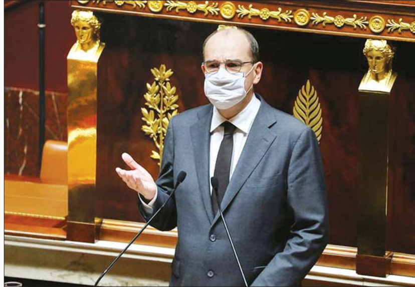
ပြင်သစ် ဝန်ကြီး ချုပ် ယောန် ကက်စ် တက်ကို တွေ့ရစဉ်။

ပါရီ ဒီဇင်ဘာ ၁၇ ပြင်သစ်နိုင်ငံတွင် ဒီဇင်ဘာလ နောက်ဆုံးပတ်မှစကာ ကိုဗစ်-၁၉ ကာကွယ်ဆေးသစ်များ စတင်ထိုးနှံပေးမည့် ပထမအဆင့်လုပ်ငန်းကို စတင် လုပ်ဆောင်မည်ဖြစ်ကြောင်း ပြင်သစ်နိုင်ငံဝန်ကြီးချုပ် ယောန် ကက်စ်တက်က ဒီဇင်ဘာ ၁၆ ရက်တွင် ပြောကြားလိုက်သည်။ ဥရောပဆေးဝါး ထိန်းချုပ်ရေး ဌာနက ဒီဇင်ဘာ ၂၁ ရက်တွင် ပထမအဆင့် ကိုဗစ်-၁၉ ကာကွယ်ဆေး သစ်ကို ဈေးကွက်သို့ တင်သွင်းခွင့် ပြုမည်ဆိုပါက ပြင်သစ်နိုင်ငံ အနေဖြင့် ကာကွယ်ဆေးထိုးနှံပေးမည့် လုပ်ငန်းကို စတင်လုပ်ကိုင်ဆောင်ရွက်မည်ဖြစ်ကြောင်း ယောန်ကက်စ်တက်က ဒီဇင်ဘာ ၁၆ ရက် လွှတ်တော် မိန့်ခွန်းတွင် ပြောကြားလိုက်သည်။ ကိုဗစ်-၁၉ ကာကွယ်ဆေး အများစုက နှစ်ကြိမ်ထိုးသွင်းရသဖြင့် ပြင်သစ်နိုင်ငံသည် ကာကွယ်ဆေး ပေါင်း သန်း ၂၀၀ ကို စုဆောင်းရန် စီစဉ်ထားရှိပြီး လူပေါင်းသန်း ၁၀၀ ကို ကာကွယ်ဆေး ထိုးပေးနိုင်မည်ဖြစ်ကြောင်း၊ အစိုးရက ထုတ်ပြန်ခဲ့သော ကာကွယ်ဆေးထိုးနှံသည့် မဟာဗျူဟာအရ ပထမအဆင့်တွင် ဘိုးဘွားရိပ်သာများတွင် လုပ်ကိုင်ဆောင်ရွက်နေသူများကို ဦးစွာထိုးနှံပေးမည် ဖြစ်ကြောင်း၊ ဒုတိယအဆင့်တွင် အိမ်တွင်းနေထိုင်သည့် သက်ကြီးရွယ်အိုများနှင့် ဆေးဘက်ဆိုင်ရာဝန်ထမ်းများကို ကာကွယ်ဆေး ထိုးပေးမည်ဖြစ်ကြောင်း၊ တတိယအဆင့်တွင် နေထိုင်ရာ ကာလကုန်ဆုံးချိန်အထိ စောင့်ဆိုင်းပြီး လူများအားလုံးကို ကာကွယ်ဆေး ထိုးနှံပေးမည်ဖြစ်ကြောင်း ၎င်းက ပြောကြားလိုက်သည်။ ကာကွယ် ထိုးနှံပေးခြင်းသည် ကပ်ရောဂါပြီးဆုံးသွားသည် မဟုတ်ကြောင်း ယောန်ကက်စ်တက်က သတိပေး ပြောကြားခဲ့ပြီး ကပ်ရောဂါ ထိန်းချုပ်ရေး လုပ်ငန်းများအနေဖြင့် အနည်းဆုံးလာမည့် နွေရာသီအချိန်အထိ ဆက်လက် ဆောင်ရွက်မည် ဖြစ်ကြောင်း ပြောကြားလိုက်သည်။ ဆင်ယွာ