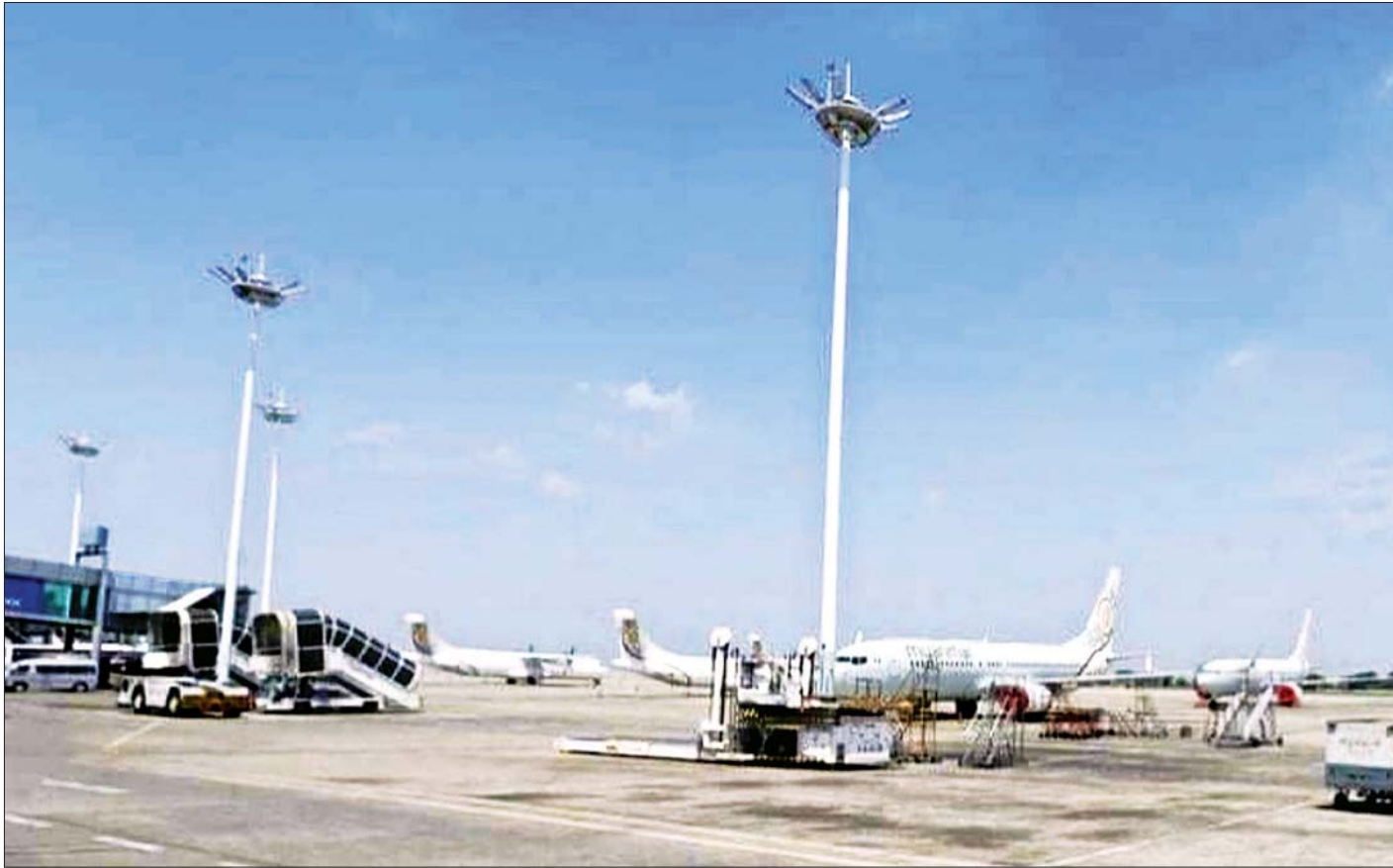
ရန်ကုန်အပြည်ပြည်ဆိုင်ရာလေဆိပ်ကို တွေ့ရစဉ်။