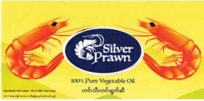
မှတ်ပုံတင်အမှတ် (၇၂၀၁/၂၀၂၀)