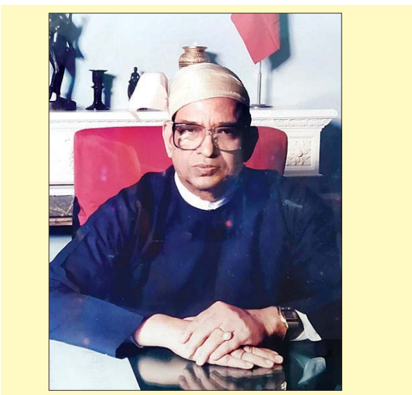
ဆောင်းပါးရှင်၏ ကိုယ်ရေးအကျဉ်း