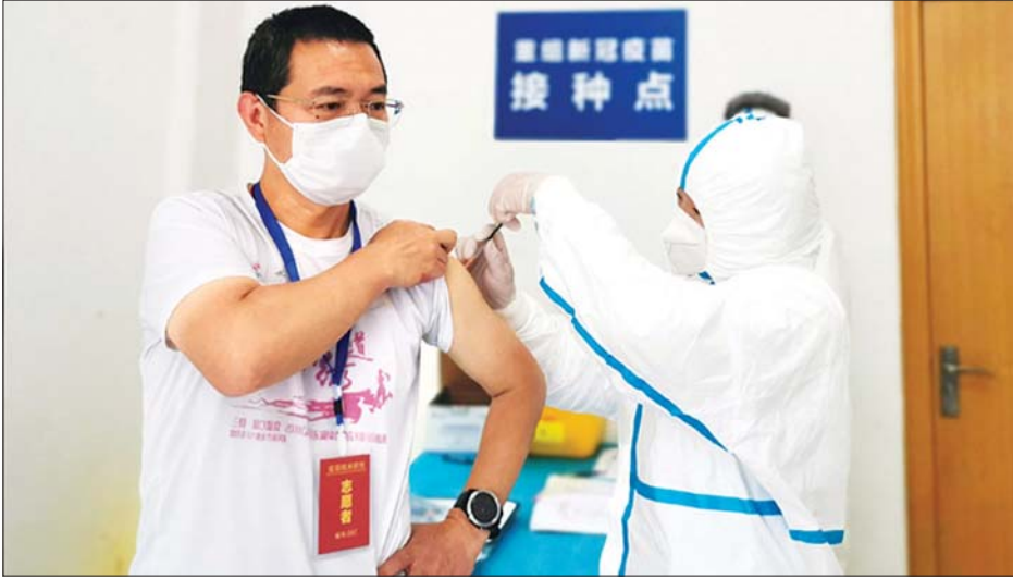
တရုတ်နိုင်ငံ အလယ်ပိုင်းဟူပေပြည်နယ် ဝူဟန်မြို့တွင် ကိုဗစ်-၁၉ ကာကွယ်ဆေး စမ်းသပ်ထိုးနှံပေးနေသည်ကို တွေ့ရစဉ်။

ပေကျင်း၊ ဒီဇင်ဘာ ၁၇ တရုတ်နိုင်ငံက ကိုဗစ်-၁၉ ကာကွယ်ဆေး အများအပြားထုတ်လုပ်ရန် ပြင်ဆင်ထားကြောင်း အမျိုးသားကျန်းမာရေး ကော်မရှင် (အင်န်အိတ်ချီစီ) ကတာဝန်ရှိသူတစ်ဦးက ပြောကြားလိုက်သည်။