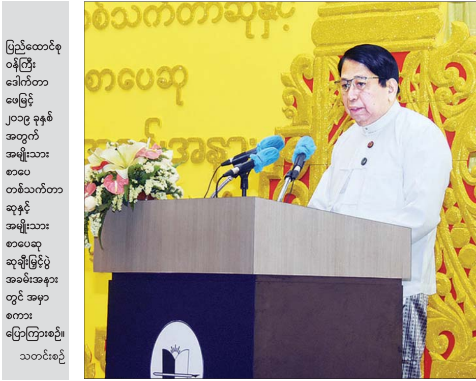
ပြည်ထောင်စုဝန်ကြီး ဒေါက်တာဖေမြင့် ၂၀၁၉ ခုနှစ် အတွက် အမျိုးသား စာပေ တစ်သက်တာ ဆုနှင့် အမျိုးသား စာပေဆု ဆုချီးမြှင့်ပွဲ အခမ်းအနား တွင် အမှာ စကား ပြောကြားစဉ်။ သတင်းစဉ်

ပြန်ကြားရေးဝန်ကြီးဌာနအနေဖြင့် နှစ်စဉ်ကျင်းပမြဲ ဖြစ်သည့် အမျိုးသားစာပေဆု ချီးမြှင့်ပွဲအခမ်းအနားကို တစ်နှစ်ထက်တစ်နှစ် ပိုပြီး ခမ်းနားပြည့်စုံစွာ ကျင်းပလိုသည့် ဆန္ဒရှိပါကြောင်း၊ ဤအခမ်းအနားသည် ဆုပုဂ္ဂိုလ်ကြီးများ