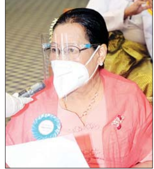
စာရေးဆရာမကြီး နတ်မောက်အနီချို