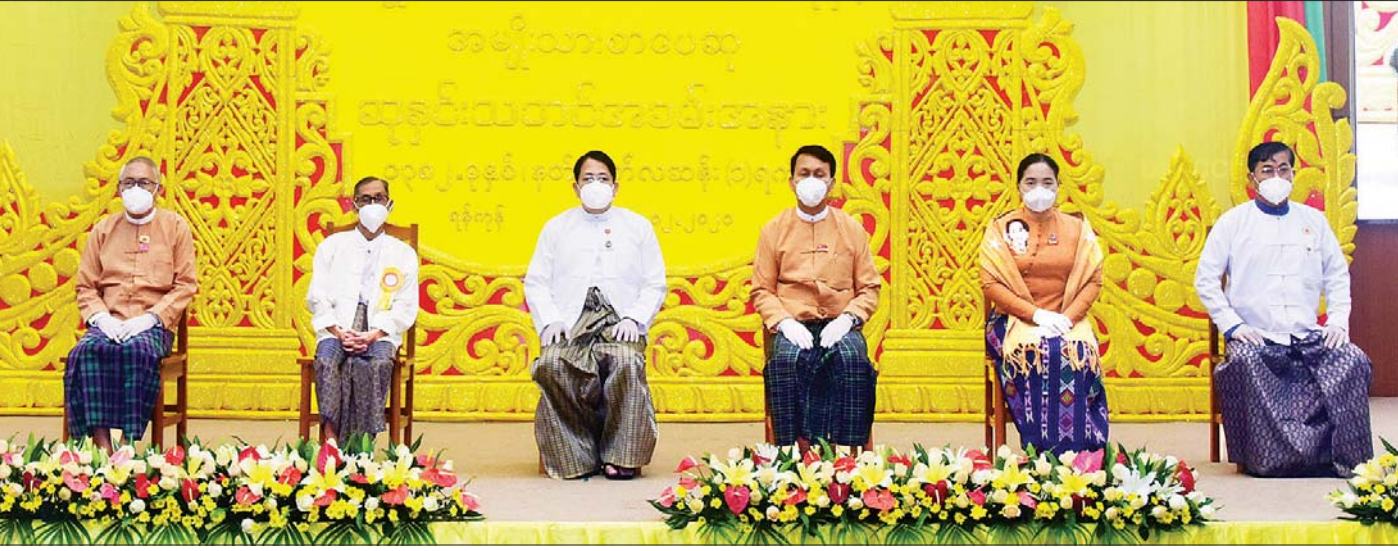
ပြည်ထောင်စုဝန်ကြီး ဒေါက်တာဖေမြင့်၊ ရန်ကုန်တိုင်းဒေသကြီး ဝန်ကြီးချုပ် ဦးဖိုးမင်းသိန်း၊ တိုင်းဒေသကြီး လွှတ်တော်ဥက္ကဋ္ဌ ဦးတင်မောင်ထွန်း၊ တိုင်းဒေသကြီးအစိုးရအဖွဲ့ဝန်ကြီးများ တစ်သက်တာစာပေဆုရ စာပေပညာရှင် ဆရာကြီး ဦးညွှန်မောင် (မောင်မောင်ညွန့်-မန်းတက္ကသိုလ်)နှင့်အတူ စုပေါင်းမှတ်တမ်းတင်ဓာတ်ပုံရိုက်စဉ်။ သတင်းစဉ်

အားလုံးကို အထူးကျေးဇူးတင်ရှိကြောင်းနဲ့ မြန်မာစာပေလောက ခိုင်မြဲစည်ပင်ဖွံ့ဖြိုးရေးအတွက် ဆက်လက်ပါဝင် ကူညီပေးကြဖို့ မေတ္တာရပ်ခံအပ်ကြောင်း ပြောကြားရင်း နိဂုံးချုပ်အပ်ပါတယ်။