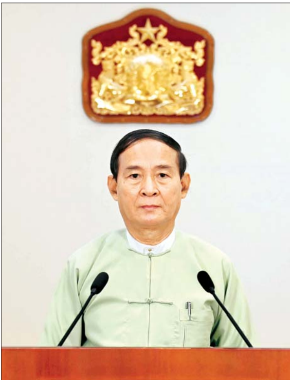
နိုင်ငံတော်သမ္မတ ဦးဝင်းမြင့် ၂၀၁၉ ခုနှစ်အတွက် အမျိုးသားစာပေ တစ်သက်တာဆုနှင့် အမျိုးသားစာပေဆုချီးမြှင့်ပွဲ အခမ်းအနားတွင် မိန့်ခွန်းပြောကြားစဉ်။

“ကျွန်တော်တို့ ပြည်သူ့အားလုံး ဒီမိုကရေစီ အလေ့အထကောင်းတွေ ရရှိအောင် အသိပညာ ကြွယ်ဝစေဖို့၊ ဒီမိုကရေစီကို မြတ်နိုးတန်ဖိုး ထားတတ်ဖို့၊ မတူကွဲပြားမှုတွေကို နားလည် လက်ခံတတ်စေဖို့၊ တိုင်းရင်းသားညီအစ်ကို မောင်နှမအချင်းချင်း ရင်းနှီးချစ်ခင်စိတ်တွေ ခိုင်မာစေဖို့ ‘စာပေ’ ဟာ အများကြီးအထောက် အကူပေးနိုင်တဲ့ ကဏ္ဍတစ်ခု ဖြစ်ပါတယ်”