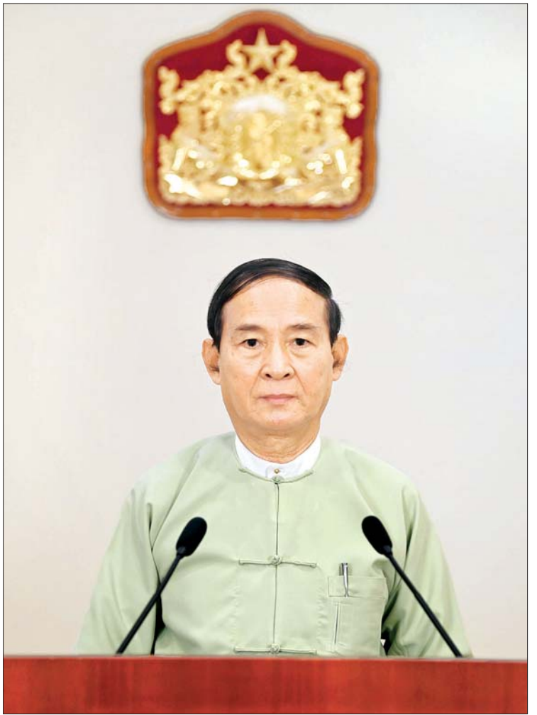
နိုင်ငံတော်သမ္မတ ဦးဝင်းမြင့် ၂၀၁၉ ခုနှစ်အတွက် အမျိုးသားစာပေ တစ်သက်တာဆုနှင့် အမျိုးသားစာပေဆုချီးမြှင့်ပွဲ အခမ်းအနားတွင် မိန့်ခွန်းပြောကြားစဉ်။ သတင်းစဉ်

အခမ်းအနားသို့ ပြန်ကြားရေးဝန်ကြီးဌာန ပြည်ထောင်စုဝန်ကြီး ဒေါက်တာ ဖေမြင့်၊ ရန်ကုန်တိုင်းဒေသကြီးဝန်ကြီးချုပ် ဦးမြိုးမင်းသိန်း၊ ရန်ကုန်တိုင်းဒေသကြီး လွှတ်တော်ဥက္ကဋ္ဌ ဦးတင်မောင်ထွန်း၊ ရန်ကုန်တိုင်းဒေသကြီးအစိုးရအဖွဲ့ဝန်ကြီးများ၊ လွှတ်တော်ကိုယ်စားလှယ်များ၊ ဌာနဆိုင်ရာအကြီးအကဲများ၊ အမျိုးသားစာပေတစ်သက်တာဆုရ ဆရာကြီးများ၊ စာပေဆုရွေးချယ်ရေးကော်မတီဝင်များ၊ စာပေဆုလက်ခံ ရယူကြမည့် စာပေညာရှင်များ၊ စာရေးဆရာ၊ ဆရာမကြီးများနှင့် ဖိတ်ကြားထားသူများ တက်ရောက်ကြသည်။ အခမ်းအနားမစတင်မီ ပြည်ထောင်စုဝန်ကြီးနှင့် အဖွဲ့သည် ၂၀၁၉ ခုနှစ်အတွက် အမျိုးသားစာပေ တစ်သက်တာစာပေဆုရရှိသူများ၏ မှတ်တမ်းဓာတ်ပုံများ၊ ၂၀၁၉ ခုနှစ်အတွက် အမျိုးသားစာပေဆု ရရှိသူများ၏ မှတ်တမ်းဓာတ်ပုံများနှင့် စာအုပ်များ၊ ၂၀၁၁ ခုနှစ်မှ ၂၀၁၉ ခုနှစ်အထိ အမျိုးသားစာပေ တစ်သက်တာ စာပေဆုရရှိသူများ၏ စာမျက်နှာ ၄ ကော်လံ ၁