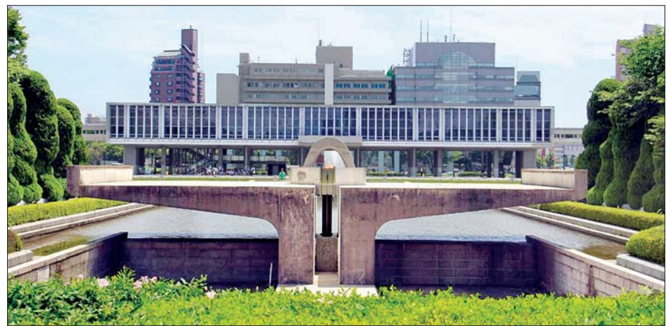
ဂျပန်နိုင်ငံရှိ ဟီရိုရှီးမား ငြိမ်းချမ်းရေးအထိမ်းအမှတ်ပြတိုက်ကို တွေ့ရစဉ်။