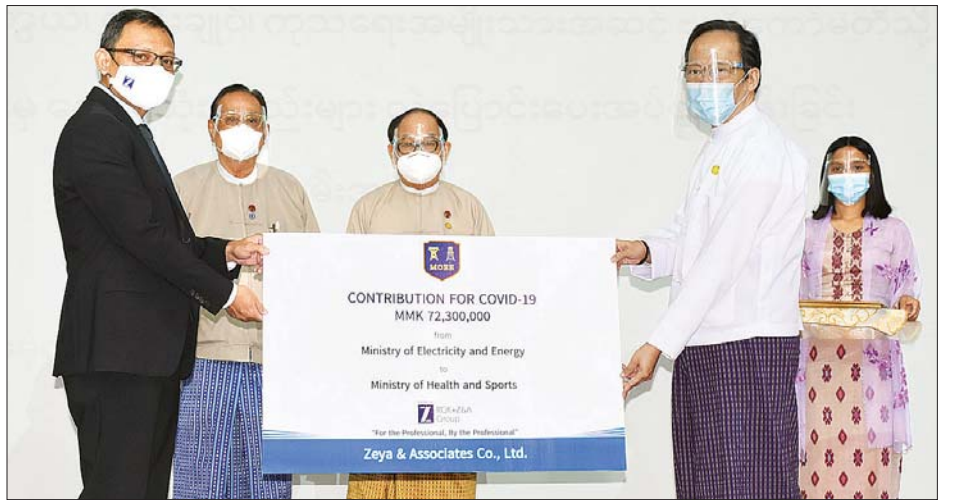
Flat Pack Container Camp ငါးခုတို့အား လှူဝစာနှင့် စွမ်းအင်ဝန်ကြီးဌာန ပြည်ထောင်စုဝန်ကြီး ဦးဝင်းခိုင်နှင့် ပြည်ထောင်စုဝန်ကြီး ဒေါက်တာမြင့်ထွေးတို့ရှေ့မှောက်တွင် Coronavirus Disease 2019 (COVID-19) ကာကွယ်၊ ထိန်းချုပ်၊ ကုသရေး အမျိုးသားအဆင့် ဗဟိုကော်မတီ

ယင်းနောက် Zeya and Associates Co., Ltd ၏ ဥက္ကဋ္ဌ ဦးစေယုသူရမွန်က ငွေကျပ် ၇၂၃ သိန်းတန်ဖိုးရှိ Injection Remdesivir (100 mg) ၁,၀၂၂ ပုလင်းနှင့်