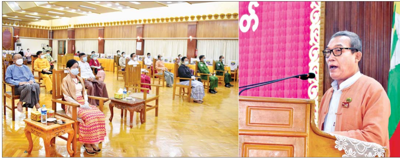
ပြည်ထောင်စုသမ္မတ မြန်မာနိုင်ငံတော်၊ နိုင်ငံတော်သမ္မတ ဦးဝင်းမြင့်ထံမှ (၄၆)ကြိမ်မြောက် ရခိုင်ပြည်နယ်နေ့အခမ်းအနားသို့ပေးပို့သော သဝဏ်လွှာအား ရခိုင်ပြည်နယ် ဝန်ကြီးချုပ် ဦးညီပု ဖတ်ကြားစဉ်။

စစ်တွေ ဒီဇင်ဘာ ၁၅ ယနေ့ ကျရောက်သည့် (၄၆) ကြိမ်မြောက် ရခိုင်ပြည်နယ်နေ့အခမ်းအနားကို နံနက် ၉ နာရီတွင် ရခိုင်ပြည်နယ်အစိုးရအဖွဲ့ရုံး အစည်းအဝေးခန်းမ၌ ကျန်းမာရေးနှင့်အားကစား ဝန်ကြီးဌာန၏ ကိုဗစ်-၁၉ ကာကွယ် ထိန်းချုပ်ရေး ညွှန်ကြားချက်များနှင့်အညီ ကျင်းပသည်။ အခမ်းအနားတွင် ပြည်ထောင်စုသမ္မတမြန်မာနိုင်ငံတော်၊ နိုင်ငံတော်သမ္မတ ဦးဝင်းမြင့် ထံမှ (၄၆)ကြိမ်မြောက် ရခိုင်ပြည်နယ်နေ့အခမ်းအနားသို့ပေးပို့သော သဝဏ်လွှာအား ရခိုင်ပြည်နယ် ဝန်ကြီးချုပ် ဦးညီပုက ဖတ်ကြားသည်။ ယင်းနောက် တပ်မတော်ကာကွယ်ရေးဦးစီးချုပ် ဗိုလ်ချုပ်မှူးကြီး မင်းအောင်လှိုင် ထံမှ ပေးပို့သည့်သဝဏ်လွှာအား ပြည်နယ်လုံခြုံရေးနှင့် နယ်စပ်ရေးရာဝန်ကြီး ဗိုလ်မှူးကြီး မင်းသန်းက ဖတ်ကြားသည်။ ထို့နောက် ပြည်နယ်ဝန်ကြီးချုပ်သည် အခမ်းအနားသို့ တက်ရောက်လာကြသူများအား ရင်းရင်းနှီးနှီးတွေ့ဆုံ နှုတ်ဆက် သည်။