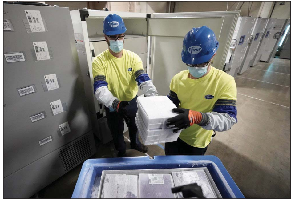
ဖိုက်စာဘိုင်အိုင်အန်တက်ချ်ကာကွယ်ဆေးများကို ပို့ဆောင်ရန် လုပ်ဆောင်နေသည်ကို တွေ့ရစဉ်။

အမေရိကန်ပြည်ထောင်စုတွင် လူတိုင်းကာကွယ်ဆေး ရရှိရေး အချိန်ယူရဦးမည်ဖြစ်ကြောင်းကျွမ်းကျင်သူများက ပြောသည်။ အင်န်အိတ်ချ်ကေ