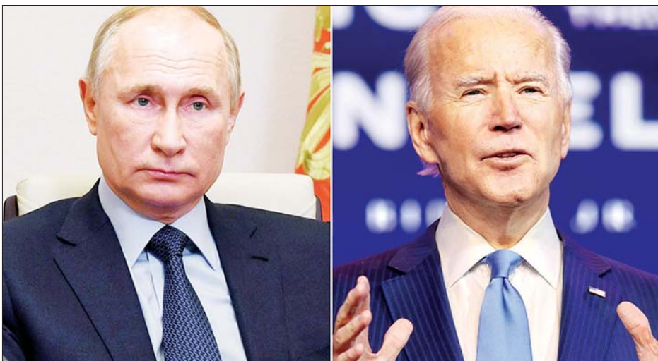
ရုရှားသမ္မတဗလာဒီမာပူတင်နှင့် အမေရိကန်သမ္မတအဖြစ် ရွေးကောက်ခံထားရသည့် ဂျိုးဘိုင်ဒင်။

သည်။ သမ္မတနှင့် ဒုတိယသမ္မတတို့ကို ရွေးချယ်ရသော ပြည်ထောင်စုကိုယ်စားလှယ်များအဖွဲ့က ၂၀၂၀ ရွေးကောက်ပွဲ ရလဒ်အပေါ်အခြေခံကာ သမ္မတသစ်အတွက် ဒီဇင်ဘာ ၁၄ ရက်တွင် မဲပေးခဲ့ပြီး ဒီမိုကရက်တစ်သမ္မတ ဂျိုးဘိုင်ဒင် အတွက် တရားဝင် အနိုင်ကိုသေချာစေခဲ့သည်။ ဂျိုးဘိုင်ဒင်သည် အိမ်ဖြူတော်တွင် ခြေချနိုင်ရန် လိုအပ်သည့် မဲအရေအတွက် ၂၇၀ ထက် ကျော်လွန်ခဲ့သည်။ နောက်ဆုံးအပြီးသတ် ရေတွက်ပြီးချိန်တွင် သမ္မတနှင့် ဒုတိယသမ္မတတို့ကို ရွေးချယ်ရသော ပြည်ထောင်စု ကိုယ်စားလှယ်များအဖွဲ့က မဲပေးရာ ဂျိုးဘိုင်ဒင်က မဲအရေ အတွက် ၃၀၆ မဲရရှိခဲ့ပြီး ဒေါ်နယ်ထရမ်ကမူ ၂၃၂ မဲသာ ရရှိ ခဲ့သည်။