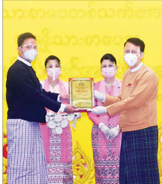
ရန်ကုန်တိုင်းဒေသကြီး ဝန်ကြီးချုပ် ဦးဖိုးမင်းသိန်း ၂၀၁၉ ခုနှစ်အတွက် အမျိုးသားစာပေ ဝတ္ထုရှည်ဆုရ မိုးကျော်စင် ကိုယ်စား ဦးမင်းဝေဟင် အား ဆုပေးအပ်ချီးမြှင့်စဉ်။ သတင်းစဉ်