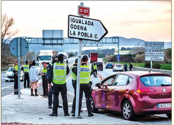
စပိန်နိုင်ငံတွင် မတ်လအတွင်းက ကိုဗစ်- ၁၉ ကြောင့် ယာဉ်အသွားအလာ များ ထိန်းချုပ်စစ်ဆေးနေသည်ကို တွေ့ရစဉ်။