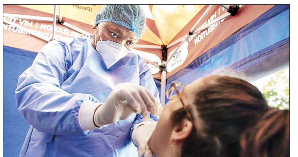
ဂျီဟန်နက်စ်ဘတ်မြို့တွင် ကိုဗစ်-၁၉ ဆေးစစ်မှုလုပ်ဆောင်နေစဉ်။

တောင်အာဖရိက နိုင်ငံသည် ကိုဗစ်-၁၉ စတင်ဖြစ်ပွားသည့်အချိန်မှ စတင်ကာ ကမ္ဘာပေါ်တွင် ပဉ္စမမြောက် ကူးစက်မှု အမြင့်ဆုံးနိုင်ငံလည်း ဖြစ်သည်။ တောင်အာဖရိကနိုင်ငံသည် နယ်စပ်များကို ခြောက်လကြာ ပိတ်ထားပြီးနောက် အောက်တိုဘာလအတွင်းမှစတင်ကာ စီးပွားရေး ပြန်လည်စတင်ရန်အတွက် နယ်စပ်များကိုဖွင့်ပေးခဲ့သည်။ အင်န်အိတ်ချ်ကေ