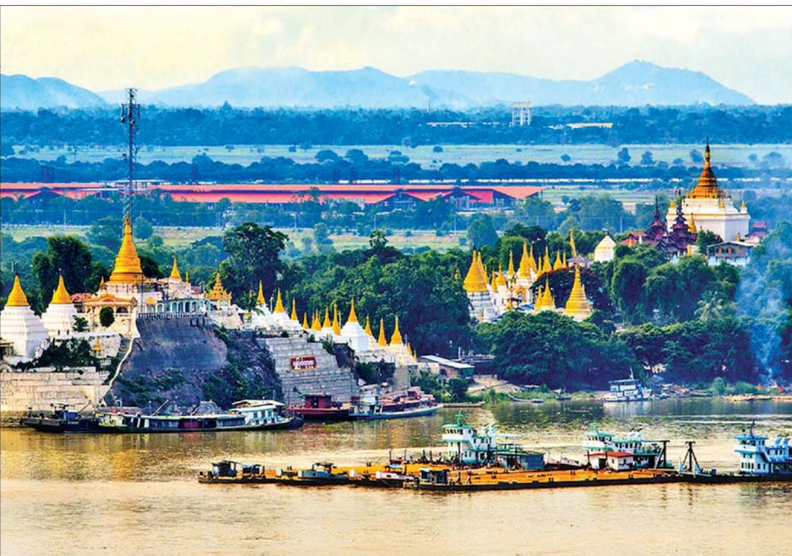
ရွှေကြက်ယက်၊ ရွှေကြက်ကျဘုရား

(ဗိုလ်ချုပ်အောင်ဆန်း၏ (၁၁-၂-၁၉၄၇) ရက်နေ့တွင် ပင်လုံမြို့ စော်ဘွားများ ထမင်းစားပွဲတွင် ပြောကြားသော မိန့်ခွန်းမှ ကောက်နုတ်ချက်)