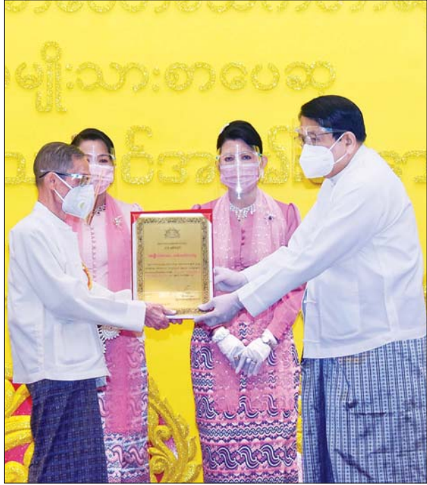
ပြည်ထောင်စုဝန်ကြီး ဒေါက်တာဖေမြင့် ၂၀၁၉ ခုနှစ်အတွက် အမျိုးသားစာပေ တစ်သက်တာဆုရ စာပေပညာရှင် ဆရာကြီး ဦးညွန့်မောင် (မောင်မောင် ညွန့် - မန်းတက္ကသိုလ်) အား ဆုပေးအပ်ချီးမြှင့်စဉ်။ သတင်းစဉ်

ဆက်လက်၍ ပြည်ထောင်စုဝန်ကြီး ဒေါက်တာဖေမြင့် က ၂၀၁၉ ခုနှစ်အတွက် အမျိုးသားစာပေတစ်သက်တာ ဆုရရှိကြသည့် စာပေပညာရှင် ဆရာကြီး ဦးညွန့်မောင် (မောင်မောင်ညွန့်-မန်းတက္ကသိုလ်) နှင့် စာရေးဆရာကြီး ဦးအုံမောင် (အုံမောင်) (ကိုယ်စား) ဦးသောင်းဌေး တို့ကို ဆုများ ပေးအပ်ချီးမြှင့်သည်။