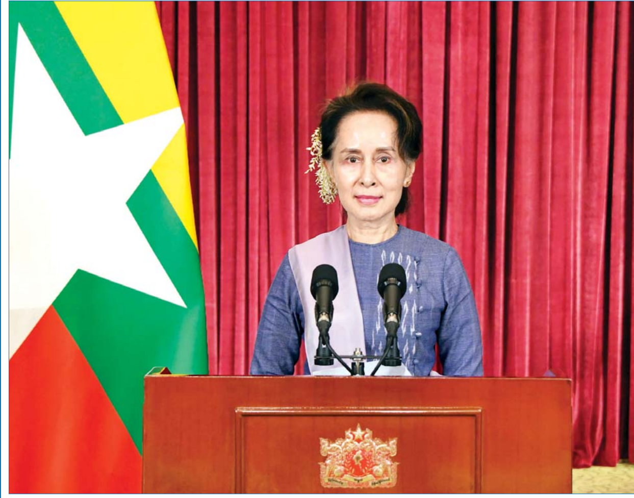
နိုင်ငံတော်၏အတိုင်ပင်ခံပုဂ္ဂိုလ် ဒေါ်အောင်ဆန်းစုကြည် ကိုဗစ် - ၁၉ ရောဂါဖြစ်ပွားမှု နောက်ဆုံးအခြေအနေနှင့်စပ်လျဉ်း၍ ပြည်သူများသို့ အစီရင်ခံ တင်ပြသည့် မိန့်ခွန်းပြောကြားစဉ်။

အခု ကိုဗစ်နောက်ဆုံးအခြေအနေ ပြောရမယ်ဆိုရင် ကိုဗစ်ကို မထိန်းချုပ် နိုင်သေးတဲ့ နေရာတွေကိုလည်း အဓိကထားပြီးတော့ ပြောဖို့လည်းလိုတယ်။ နောက်ပြီးတော့ ကျွန်မတို့ ကာကွယ်ဆေးအစီအစဉ်တွေနဲ့ ပတ်သက်လို့လည်း ပြောဖို့တော့ လိုပါတယ်။ ကိုဗစ်ထိန်းချုပ်ရာမှာ အားနည်းနေတဲ့နေရာ အများဆုံးကတော့ ရန်ကုန်ပေါ့။ အဲဒါတော့လည်း ကျွန်မတို့ ရန်ကုန်တိုင်းက ပြည်သူတွေ သိပြီးသားဖြစ်ပါတယ်။ အဲဒီတော့ အထူးသတိထားစေချင် ပါတယ်။ အခုအချိန်မှာဆိုရင် ရာသီဥတုကလည်း အေးလာပြီ။ ရာသီဥတုက အေးလာတဲ့အခါကျတော့ တခြား အေးတဲ့ရာသီနဲ့ ဆောင်းရာသီနဲ့ ပတ်သက် နေတဲ့ ဖြစ်တတ်ဖြစ်လေ့ဖြစ်ထရှိတဲ့ အအေးမိတာလေးတွေ၊ တုပ်ကွေးဖြစ်တာ လေးတွေလည်း ရှိနိုင်ပါတယ်။ အဲဒီတော့ ကျွန်မနားလည်သလောက်ကတော့ တုပ်ကွေးဖြစ်နေသူတစ်ဦးကနေပြီးတော့ ကိုဗစ်ပါကူးမယ်ဆိုရင် အခြေအနေ က နည်းနည်းပိုပြီးတော့ ပြင်းထန်နိုင်ပါတယ်။ ဒါကြောင့် အားလုံး အထူးသတိ ထားဖို့ဆိုတာကို ကျွန်မတို့ သတိပေးချင်ပါတယ်။ ရန်ကုန်ကနေပြီးတော့ မထိန်းချုပ်နိုင်တာကတော့ ကျွန်မတို့ နိုင်ငံ တစ်နိုင်ငံလုံးအတွက် စိန်ခေါ်မှုတစ်ခုပါပဲ။ ဘာဖြစ်လို့လဲဆိုတော့ ရန်ကုန်က ကျွန်မတို့ရဲ့ တစ်နည်းအားဖြင့် ပြောရမယ်ဆိုရင် စီးပွားရေးမြို့တော်ဆိုရင် လည်း မမှားပါဘူး။ ဒီတော့ စီးပွားရေးမြို့တော်ကြီးကို ပြန်ပြီးတော့ နာလန် ထူအောင်လုပ်ဖို့ဆိုတာဟာ ကျွန်မတို့ရဲ့ စီးပွားရေး ပြန်လည်ထူထောင်ရေး အတွက် အင်မတန်မှ အရေးကြီးပါတယ်ဆိုတာလည်း ကျွန်မက သတိပေးချင် ပါတယ်။ စာမျက်နှာ ၃ ကော်လံ ၁ ❖