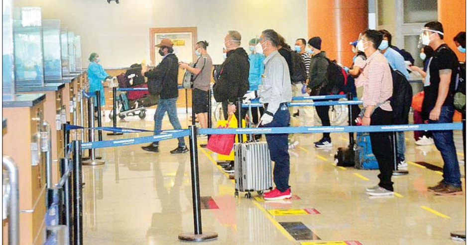
ပြည်သူ့အင်အားဝန်ကြီးဌာန၊ ကျန်းမာ ရေးနှင့် အားကစားဝန်ကြီးဌာနနှင့် ရန်ကုန်တိုင်းဒေသကြီးအစိုးရအဖွဲ့တို့ မှ သက်ဆိုင်ရာ အခန်းကဏ္ဍအလိုက် တာဝန်ယူ ဆောင်ရွက်ပေးခဲ့ ကြသည်။ ပြည်ပနိုင်ငံများတွင် အခက် အခဲကြုံတွေ့နေရသည့်မြန်မာသင်္ဘော သားများနှင့် မြန်မာနိုင်ငံသားများအား ပြန်လည်ခေါ်ဆောင်ရန် ကိုဗစ် - ၁၉ ကာကွယ်၊ ထိန်းချုပ်၊ ကုသရေး အမျိုးသားအဆင့် ဗဟိုကော်မတီ၏ လမ်းညွှန်ချက်နှင့်အညီ နိုင်ငံခြားရေး ဝန်ကြီးဌာနအနေဖြင့် သက်ဆိုင်ရာ ဝန်ကြီးဌာနများ၊ သက်ဆိုင်ရာ နိုင်ငံ များရှိ မြန်မာသံရုံးများ၊ သင်္ဘော ကုမ္ပဏီများ၊ အဖွဲ့အစည်းများနှင့် ပူးပေါင်းညှိနှိုင်း ဆောင်ရွက်ပေးလျက် ရှိကြောင်း သိရသည်။ သတင်းစဉ်

နေပြည်တော် ဒီဇင်ဘာ ၁၁ နိုင်ငံတကာခရီးသည်တင် လေယာဉ် များပျံသန်းမှု ယာယီရပ်ဆိုင်းထား ခြင်းကြောင့် ဘယ်လ်ဂျီယံ၊ နယ်သာလန်နိုင်ငံနှင့် အနီးတစ်ဝိုက် ဒေသများတွင် အခက်အခဲကြုံတွေ့ နေရသည့် မြန်မာသင်္ဘောသား ၁၆၈ ဦးအား ဘရပ်ဆဲလ်မြို့ရှိ မြန်မာသံရုံး နှင့် သင်္ဘောကုမ္ပဏီတို့က ပူးပေါင်း စီစဉ်သည့် TUI လေကြောင်းလိုင်း စင်းလုံးငှား ကယ်ဆယ်ရေးလေယာဉ် ဖြင့် ပြန်လည်ခေါ်ဆောင်ခဲ့ရာ ယနေ့ နံနက် ၈ နာရီတွင် ရန်ကုန်အပြည်ပြည် ဆိုင်ရာလေဆိပ်သို့ အဆင်ပြေ ချောမွေ့စွာ ပြန်လည်ရောက်ရှိ ကြသည်။ ထို့ပြင် စင်ကာပူနိုင်ငံတွင် အခက် အခဲကြုံတွေ့နေရသည့် မြန်မာနိုင်ငံ သား ၁၅၃ ဦးအား စင်ကာပူမြို့ရှိ မြန်မာသံရုံးမှ စီစဉ်သည့် မြန်မာ အမျိုးသား လေကြောင်းလိုင်း (MNA) ကယ်ဆယ်ရေး လေယာဉ်ဖြင့် ပြန်လည်ခေါ်ဆောင်ခဲ့ရာ ယနေ့ ညနေ ၅ နာရီခွဲတွင် ရန်ကုန်အပြည်ပြည် ဆိုင်ရာလေဆိပ်သို့ ပြန်လည်ရောက်ရှိ