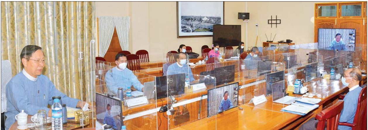
ဗိုလ်ချုပ်အောင်ဆန်းအတ္ထုပ္ပတ္တိ “အောင်ဆန်း”ရုပ်ရှင် ရိုက်ကူးထုတ်လုပ်ရေးလုပ်ငန်းညှိနှိုင်းအစည်းအဝေး ကျင်းပစဉ်။ သတင်းစဉ်

အစည်းအဝေးသို့ လုပ်ငန်း ကော်မတီဥက္ကဋ္ဌ၊ သာသနာရေးနှင့် ယဉ်ကျေးမှုဝန်ကြီးဌာန ပြည်ထောင်စု ဝန်ကြီး သူရဦးအောင်ကို၊ လုပ်ငန်း ကော်မတီဒုတိယဥက္ကဋ္ဌ သာသနာ ရေးနှင့် ယဉ်ကျေးမှုဝန်ကြီးဌာန ဒုတိယဝန်ကြီး ဦးကြည်မင်းနှင့် သက်ဆိုင်ရာ ဝန်ကြီးဌာနများမှ အမြဲတမ်းအတွင်းဝန်များ၊ ညွှန်ကြား ရေးမှူးချုပ်များ၊ ဆပ်ကော်မတီများ မှ ဌာနဆိုင်ရာ တာဝန်ရှိသူများ၊ အလင်္ကာကျော်စွာ အကယ်ဒမီပန်းချီ စိုးမိုး၊ မြန်မာနိုင်ငံ ရုပ်ရှင်အစည်းအရုံး ဥက္ကဋ္ဌ ဦးညီညီထွန်းလွင်၊ အောင်ဆန်း ရုပ်ရှင်ဇာတ်ကား ဒါရိုက်တာ ဦးလူ မင်းနှင့် ဗိုလ်ချုပ်အောင်ဆန်းရုပ်ရှင် ရိုက်ကူးထုတ်လုပ်ရေး လုပ်ငန်း ကော်မတီဝင်များ၊ ဆပ်ကော်မတီ ဥက္ကဋ္ဌများ၊ လုပ်ငန်းအဖွဲ့ငယ် ခေါင်းဆောင်များ မြန်မာ့သမိုင်း ပညာရှင်များက Video Conferencing စနစ်ဖြင့် တက်ရောက်ဆွေးနွေး ကြသည်။