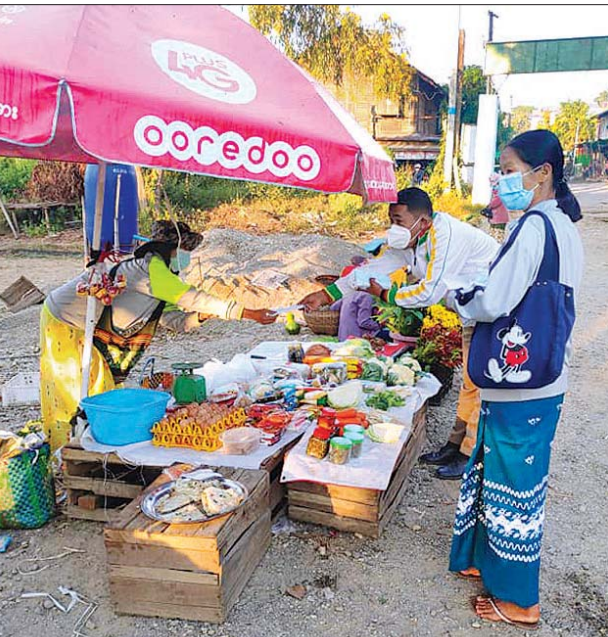
မကွေးတိုင်းဒေသကြီး သရက်ခရိုင် မင်းတုန်းမြို့နယ် အားကစားနှင့်ကာယ ပညာဦးစီးဌာနမှ ဝန်ထမ်းများက မင်းတုန်းမြို့နယ် ဈေးရောင်းဈေးဝယ်ပြည်သူ များအား ဒီဇင်ဘာ ၉ ရက်က ကိုဗစ် - ၁၉ ရောဂါကာကွယ်၊ ထိန်းချုပ်ရေး အတွက် ပါးစပ်နှာခေါင်းစည်းများ အခမဲ့ဖြန့်ဝေ၍ ကျန်းမာရေးနှင့် အားကစားဝန်ကြီးဌာနက သတ်မှတ်ထားသည့် ဆောင်ရန်/ ရောင်ရန် စည်းကမ်းများအား အသိပေးကြေညာခြင်းများ ဆောင်ရွက်စဉ်။ သတင်းစဉ်

၁။ ၂၀၁၉ - ၂၀၂၀ ခုနှစ် မိုးစပါးရိတ်သိမ်းရာတွင် အချိန်မီရိတ်သိမ်းနိုင်ရန်နှင့် အခြောက်ခံနိုင်ရန်အတွက် ရိတ်သိမ်းခြွေလှေ့စက် (Combine Harvester) များနှင့် အခြောက်ခံစက် (Dryer) များကို ရွှေ့ပြောင်းသယ်ယူ ပို့ဆောင်ရေးနှင့် တပ်ဆင်အသုံးပြုရေး၊ ဆောင်းသီးနှံ ထွက်နှုန်းစိုက်ပျိုးရေးအတွက် ထွက်ကုန်ကြီးများ ရွှေ့ပြောင်းဆောင်ရွက်ရာတွင် ပါဝင်ဆောင်ရွက်ကြမည့် မောင်းနှင်သူများနှင့် ကျွမ်းကျင်သူများအား Coronavirus Disease 2019 (COVID-19) ကာကွယ်၊ ထိန်းချုပ်၊ ကုသရေး အမျိုးသားအဆင့်ဗဟိုကော်မတီ၏ ညွှန်ကြား ချက်များနှင့်အညီ အဆင်ပြေချောမွေ့စွာ ဆောင်ရွက် နိုင်ရေးအတွက် စိုက်ပျိုးရေး၊မွေးမြူရေးနှင့်ဆည်မြောင်း ဝန်ကြီးဌာန၊ စီးပွားရေးနှင့် ကူးသန်းရောင်းဝယ်ရေး ဝန်ကြီးဌာနနှင့် မြန်မာနိုင်ငံ ဆန်စပါးအသင်းချုပ်တို့ ညှိနှိုင်းဆောင်ရွက်မှုဖြင့် “မြို့နယ်အဆင့် လယ်ယာသုံး စက်ကိရိယာများ ရွှေ့ပြောင်းအသုံးချနိုင်ရေး ပူးပေါင်း ညှိနှိုင်းရေးအဖွဲ့” အား ဖွဲ့စည်းထားရှိပြီးဖြစ်ပါသည်။ ၂။ သို့ဖြစ်ပါ၍ တောင်သူလယ်သမားများအပါအဝင် သီးနှံစိုက်ပျိုးထုတ်လုပ်ရောင်းဝယ်ရေး လုပ်ငန်းများတွင် ပါဝင်ဆောင်ရွက်နေကြသူ ပုဂ္ဂလိကနှင့် အဖွဲ့အစည်းများ အနေဖြင့် သီးနှံများရိတ်သိမ်းရာတွင် အသုံးပြုရန် စက်ကိရိယာများ၊ ရိတ်သိမ်းခြွေလှေ့စက်များ လိုအပ်ပါက သက်ဆိုင်ရာ မြို့နယ်စိုက်ပျိုးရေးဦးစီးဌာနနှင့် စက်မှု လယ်ယာဦးစီးဌာနများသို့လည်းကောင်း၊ စိုက်ပျိုးရေး၊ မွေးမြူရေးနှင့်ဆည်မြောင်းဝန်ကြီးဌာန၊ နေပြည်တော်၊ ဖုန်းနံပါတ် ၀၆၇-၄၃၁၂၈ နှင့် ၀၆၇-၄၁၅၅၆ တို့သို့ ဆက်သွယ်ဆောင်ရွက်နိုင်ပါကြောင်း အသိပေးနှိုးဆော် အပ်ပါသည်။ စိုက်ပျိုးရေး၊မွေးမြူရေးနှင့်ဆည်မြောင်းဝန်ကြီးဌာန