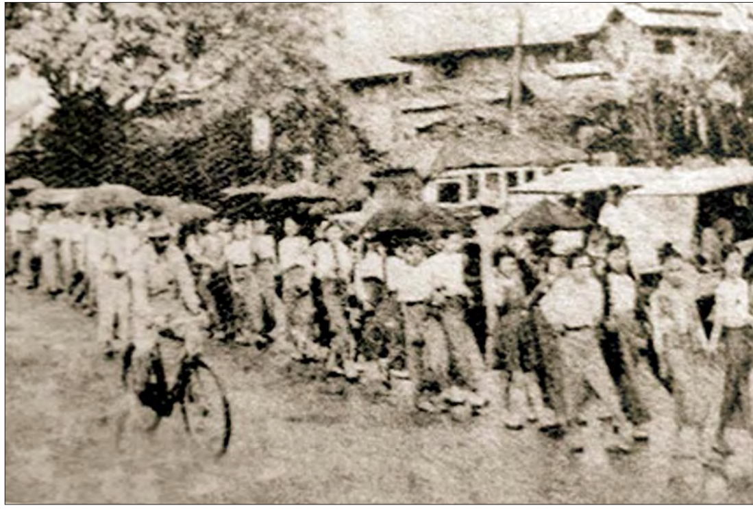
လွတ်လပ်ရေးရပြီးစခေတ် ပဲခူးမြို့အတွင်း အမျိုးသားအောင်ပွဲနေ့ လှည့်လည်သည့် မှတ်တမ်းဓာတ်ပုံ။

“ဝံသာနု ရက္ခိတ တရား (ဝံသာနုမှာ အမျိုးအနွယ် အား၊ ရက္ခိတသည် စောင့်ရှောက်ခြင်း) ဖြစ်၍ ယင်းသည် အမျိုးသား ရေး စိတ်ဓာတ်များ နိုးကြား ရှင်သန်လာစေ ရန် အမျိုးသားအောင်ပွဲ နေ့ လှုပ်ရှားမှုကြီးနှင့် အတူ အမျိုးသားကျောင်း များက ဆောင်ရွက်နိုင်ခဲ့ သည်ကို တွေ့နိုင်ပါသည်။ အမျိုးသား အောင်ပွဲနေ့ သည် တစ်မျိုးသားလုံး အတွက် ကောင်းကျိုး များစွာ ဆောင်ခဲ့သော မမေ့အပ်သည့် အခါ သမယ ဖြစ်ပါသည်”