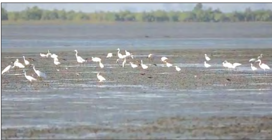
နွားထိုးကြီးမြို့နယ်၌ ဆောင်းခိုငှက်များ စတင်ရောက်ရှိစဉ်။

နှစ်စဉ်ဆောင်းခိုငှက်များ ရောက်လာနေသော်လည်း ယခုနှစ်နောက်ကျရောက်ကြောင်း သိရသည်။ နွားထိုးကြီးမြို့နယ်တွင် ဆောင်းရာသီစပြီး ရာသီဥတု အေးနေ၍ မြို့နယ်၌ ယခုနှစ် နောက်ကျ အအေးပိုကြောင်း