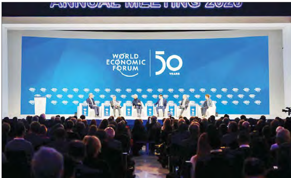
ဆွစ်ဇာလန်နိုင်ငံ၌ ၂၀၂၀ ပြည့်နှစ် ဇန်နဝါရီ ၄ ရက်က ကျင်းပခဲ့သည့် ကမ္ဘာ့စီးပွားရေးဖိုရမ်။

ပေးမည့်မြို့မှ ဒေသခံများနှင့် ပွဲတက်ရောက်လာမည့် သူများ၏ ကျန်းမာရေးကို စိုးရိမ်ရသောကြောင့် အခက်အခဲရှိလိမ့်မည်ဟု ပြောကြား သည်။ ပါရီ လေကြောင်းလုပ်ငန်းပြသ ပွဲကိုလည်း ဇွန်လသို့ ရွှေ့ပြောင်း လိုက်ကြောင်း ပြင်သစ်ပွဲစဉ်သူ များက ဒီဇင်ဘာ ၇ ရက်တွင် ကြေညာ သည်။ ကိုဗစ်-၁၉ ကာကွယ်ဆေး ဖြန့်ဝေမှုအတွက် အချိန်ယူရဦးမည် ဖြစ်သဖြင့် ရွှေ့ပြောင်းလိုက်ရခြင်း ဖြစ်သည်ဟု ပြောသည်။ အင်န်အိတ်ချ်ကေ