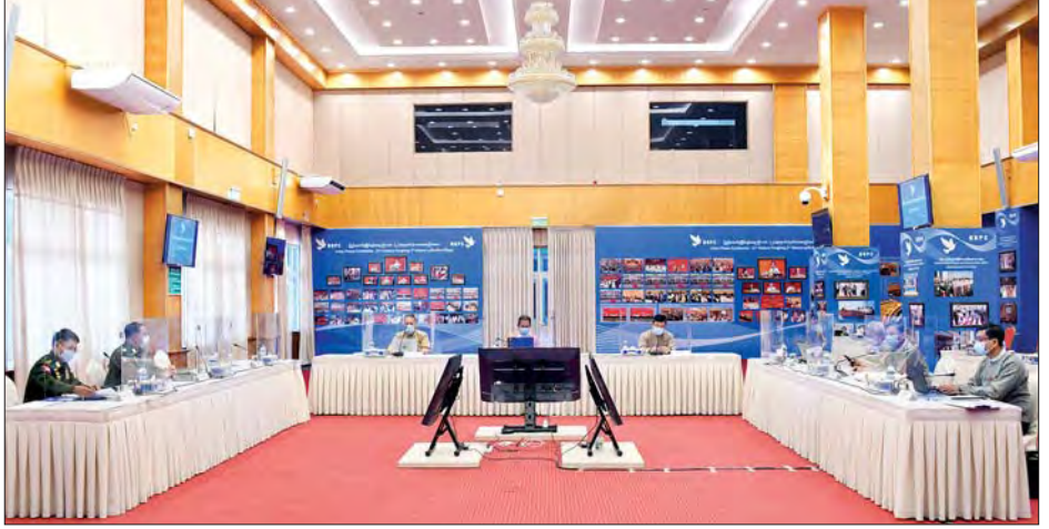
နိုင်ငံရေးဆွေးနွေးမှုဆိုင်ရာ မူဘောင်သုံးသပ်ပြင်ဆင်ရေး ညှိနှိုင်းအစည်းအဝေး ဒုတိယနေ့ ဆက်လက်ကျင်းပစဉ်။

နေပြည်တော် ဒီဇင်ဘာ ၈ နိုင်ငံရေးဆွေးနွေးမှုဆိုင်ရာ မူဘောင် သုံးသပ်ပြင်ဆင်ရေး ညှိနှိုင်းအစည်းအဝေး ဒုတိယနေ့ကို ယနေ့ နံနက် ၁၀ နာရီတွင် နေပြည်တော်ရှိ အမျိုးသား ပြန်လည်သင်မြတ်ရေးနှင့် ငြိမ်းချမ်းရေးဗဟိုဌာန (NRPC) ၌ ဆက်လက်ကျင်းပသည်။