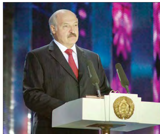
ဘီလာရုစ် သမ္မတ အလက်ဇန်းဒါးလူကာရှန်ကို

မင့်စ် ဒီဇင်ဘာ ၈ အားကစားသမားများအား နိုင်ငံရေးဆိုင်ရာ ဖိနှိပ်ဆက်ဆံမှုများ ပြုလုပ်ခဲ့သည်ဟုဆိုကာ နိုင်ငံတကာအိုလံပစ်ကော်မတီက ဘီလာရုစ် သမ္မတအလက်ဇန်းဒါးလူကာရှန်ကို အိုလံပစ်အားကစားပွဲဆိုင်ရာ လှုပ်ရှားမှုအားလုံးမှ ထုတ်ပယ်ရန် ဆုံးဖြတ်လိုက်ပြီဖြစ်ကြောင်း သိရသည်။