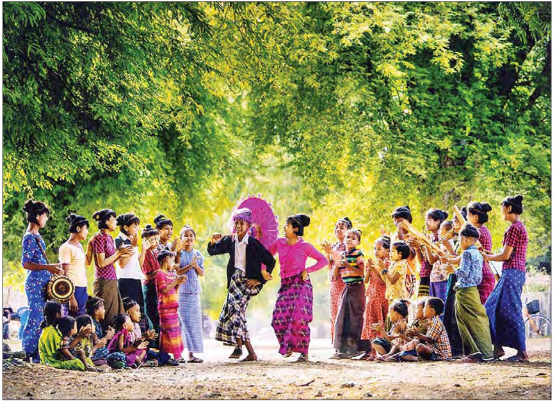
မြန်မာ့ရိုးရာ ဦးရွှေရိုး ဒေါ်မိုးအက

[ နိုင်ငံတော်၏အတိုင်ပင်ခံပုဂ္ဂိုလ် ဒေါ်အောင်ဆန်းစုကြည်၏ (၁၅-၁-၂၀၂၀) ရက်နေ့တွင် ကယားပြည်နယ်နေ့အခမ်းအနား၌ ပြောကြားသည့်နှုတ်ခွန်းဆက်စကားမှကောက်နုတ်ချက် ]