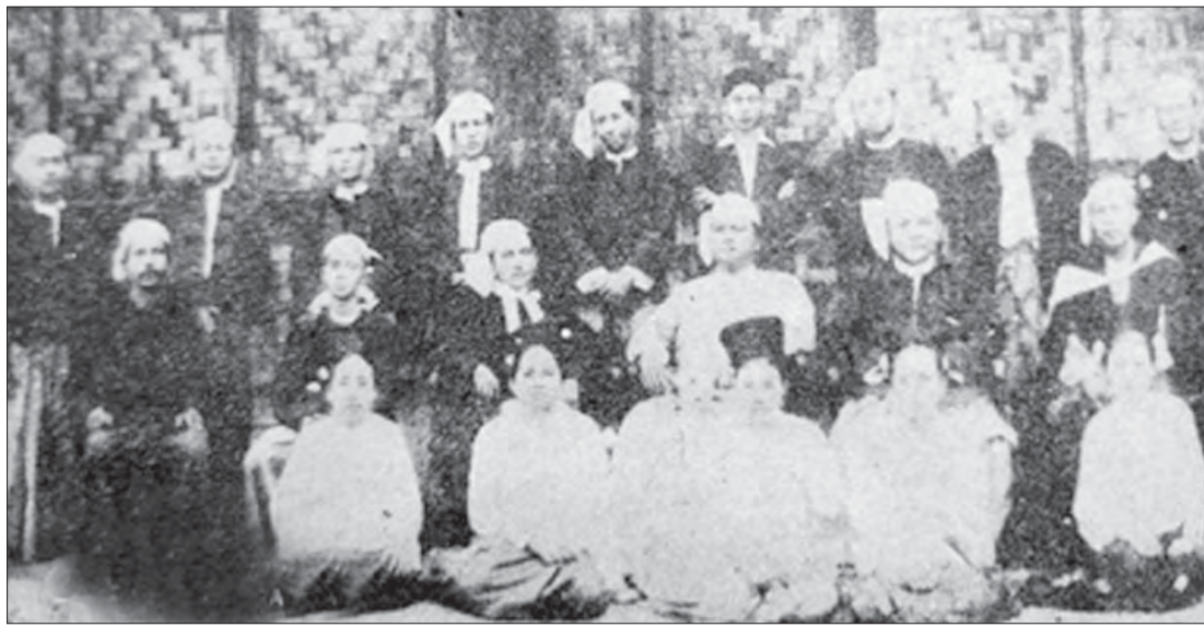
အမျိုးသားကျောင်း ကျောင်းဆရာ၊ ဆရာမများ။

- ယခုအခါ ရန်ကုန်မြို့ လမ်း၄၀၊ အမှတ် ၂၁၉ ရှိ “Health for All” မဂ္ဂဇင်းတိုက် တွင် အယ်ဒီတာချုပ်၊ မြန်မာနိုင်ငံ စာရေးဆရာအသင်း ဗဟိုအလုပ်အမှု ဆောင်အဖွဲ့ဝင်၊ မြန်မာနိုင်ငံ ဆရာဝန် အသင်း ဗဟိုအလုပ်အမှုဆောင်အဖွဲ့ ဝင်၊ မဲခေါင်စာပေဆုရွေးချယ်ရေးအဖွဲ့၊ စာပေဗိမာန်စာမူဆုနှင့် ပခုက္ကူ ဦးအုန်းဖေ စာမူဆုရွေးချယ်ရေး အဖွဲ့ဝင် စသည့်တာဝန်များ ထမ်းဆောင်လျက်ရှိပါသည်။