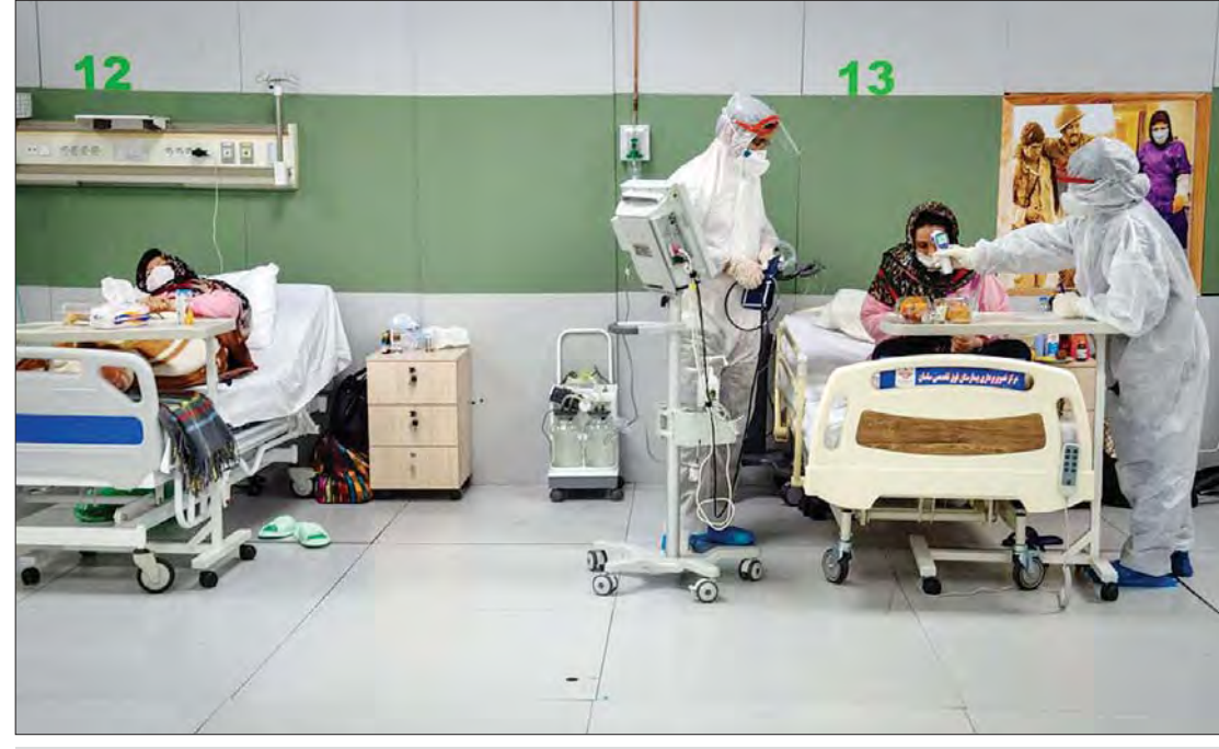
တီဟီရန်မြို့ရှိ ဆေးရုံတစ်ရုံတွင် ဆေးကုသမှုခံယူနေကြသည့် ကိုဗစ်-၁၉ လူနာများကို တွေ့ရစဉ်။

ခြင်းချက်ပေးသွားမယ် စီးပွားရေးနဲ့ ဘဏ္ဍာရေးဆိုင်ရာ ကျွမ်းကျင်သူတွေကတော့ အမေရိကန်ရဲ့ ပိတ်ဆို့မှုတွေကြောင့် အီရန်နိုင်ငံ ကာကွယ်ဆေးရရှိမှုမှာ အဟန့်အတားတွေဖြစ်လာနိုင်တယ်ဆိုပြီး သုံးသပ်ကြပါတယ်။ အီရန်နိုင်ငံဟာ အရှေ့အလယ်ပိုင်းဒေသမှာ ကိုဗစ်-၁၉ ကူးစက်မှုအမြင့်ဆုံးထဲက တစ်နိုင်ငံပါပဲ။ တကယ်လို့ အီရန်နိုင်ငံအတွက် ကာကွယ်ဆေးရရှိမှုမှာ အနှောင့်အယှက် အဟန့်အတားတွေရှိနေမယ်ဆိုရင် ဒေသတွင်း မိုင်းရပ်စ်ကူးစက် ပျံ့နှံ့မှုနှုန်းကို ထိန်းချုပ်ရာမှာလည်း အန္တရာယ်တွေ ရှိလာနိုင်ပါတယ်။ ကာကွယ်ဆေးဝယ်ယူရာမှာတော့ အီရန်နိုင်ငံအပေါ် အမေရိကန် အစိုးရက ခြင်းချက်ပေးသွားမယ်လို့ ကိုဗက် (Covax) လို့ခေါ်တဲ့ တစ်ကမ္ဘာလုံးဆိုင်ရာ ကာကွယ်ဆေးအစီအစဉ်က ပြောပါတယ်။