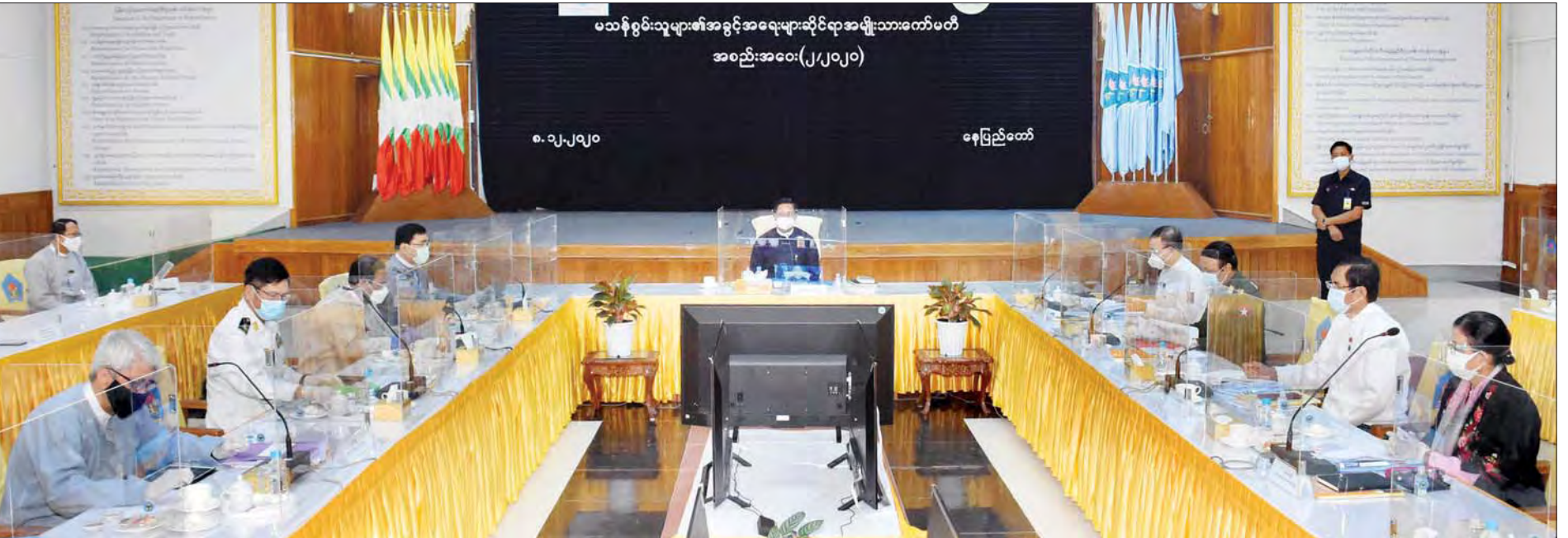
ဒုတိယသမ္မတ ဦးဟင်နရီဗန်ထီးယူ မသန်စွမ်းသူများ၏ အခွင့်အရေးများဆိုင်ရာ အမျိုးသားကော်မတီအစည်းအဝေး (၂/၂၀၂၀) တွင် အမှာစကားပြောကြားစဉ်။ သတင်းစဉ်

နေပြည်တော် ဒီဇင်ဘာ ၈ မသန်စွမ်းသူများ၏ အခွင့်အရေးများဆိုင်ရာ အမျိုးသားကော်မတီ အစည်းအဝေး (၂/၂၀၂၀) ကို ယနေ့ နံနက် ၉ နာရီတွင် နေပြည်တော်ရှိ လူမှုဝန်ထမ်း၊ ကယ်ဆယ်ရေးနှင့် ပြန်လည်နေရာချထားရေးဝန်ကြီးဌာန အစည်းအဝေးခန်းမ၌ Video Conferencing စနစ်ဖြင့် ကျင်းပရာ မသန်စွမ်းသူများ၏ အခွင့်အရေးများဆိုင်ရာ အမျိုးသားကော်မတီဥက္ကဋ္ဌ ဒုတိယသမ္မတ ဦးဟင်နရီဗန်ထီးယူ တက်ရောက်အမှာစကား ပြောကြားသည်။ အစည်းအဝေးသို့ ပြည်ထောင်စုဝန်ကြီးများ၊ ဒုတိယဝန်ကြီးများ၊ နေပြည်တော်ကောင်စီဝင်၊ ဌာနဆိုင်ရာအကြီးအကဲများ တက်ရောက်ကြပြီး ကချင်ပြည်နယ် ဝန်ကြီးချုပ်၊ ပညာရေးဝန်ကြီးဌာန ဒုတိယဝန်ကြီး၊ မြန်မာနိုင်ငံ အမျိုးသားလူ့အခွင့်အရေးကော်မရှင် ဒုတိယဥက္ကဋ္ဌ၊ တိုင်းဒေသကြီးနှင့် ပြည်နယ် များမှ လူမှုရေးဝန်ကြီးများနှင့် တာဝန်ရှိသူများ၊ စာမျက်နှာ ၄ ကော်လံ ၁ ✽