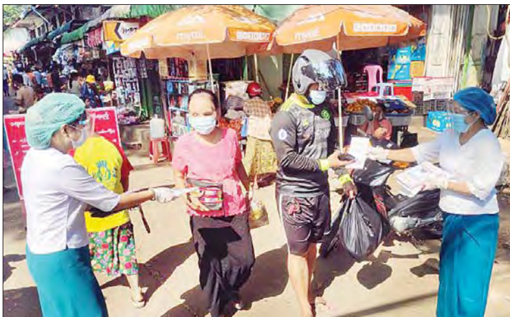
အမျိုးသားအောင်ပွဲနေ့အထိမ်းအမှတ် လက်ကမ်းစာစောင်များ သန့်လျှင်၌ဖြန့်ဝေ

သန့်လျှင် ဒီဇင်ဘာ ၈ ၂၀၂၀ ပြည့်နှစ် နှစ်တစ်ရာပြည့်အမျိုးသားအောင်ပွဲနေ့အထိမ်းအမှတ် ပြန်ကြားရေးနှင့်ပြည်သူ့ဆက်ဆံရေးဦးစီးဌာနက ထုတ်ဝေသော သတင်းစကားလက်ကမ်းစာစောင်များကို ယနေ့နံနက်ပိုင်းက သန့်လျှင်မြို့နယ် ပြန်ကြားရေးနှင့် ပြည်သူ့ဆက်ဆံရေးဦးစီးဌာန ဝန်ထမ်းများက ဈေးများ၊ ကယ်ရီဂိတ်၊ ကားဂိတ်များ လမ်းသွားလမ်းလာများကို ဖြန့်ဝေပေးသည်။ (အပေါ်ပုံ) အဆိုပါ နှစ်တစ်ရာပြည့် အမျိုးသားအောင်ပွဲနေ့အထိမ်းအမှတ် လက်ကမ်းစာစောင်တွင် နိုင်ငံတော်သမ္မတ ဦးဝင်းမြင့်၏ (၉၉)နှစ်မြောက် အမျိုးသားနေ့သဝဏ်လွှာကောက်နုတ်ချက်၊ နိုင်ငံတော်၏အတိုင်ပင်ခံပုဂ္ဂိုလ် ဒေါ်အောင်ဆန်းစုကြည်၏ တက္ကသိုလ်များ ဖွံ့ဖြိုးတိုးတက်မှု နှိုးဆော်ပေးလှပွဲ မိန့်ခွန်းကောက်နုတ်ချက်၊ အမျိုးသားအောင်ပွဲနေ့ဦးတည်ချက်၊ ရန်ကုန်ယူနီဗာစတီ အက်ဥပဒေကို သပိတ်မှောက်ရန် သစ္စာဆိုအမိဋ္ဌာန်ပြုကြသော ကျောင်းသားကြီး ၁၁ ဦး၏ အမည်များ၊ ဗြိတိသျှတို့ ပြဋ္ဌာန်းသော ကျွန်ပညာရေးဥပဒေပါအချက်များ၊ အမျိုးသားအောင်ပွဲနေ့သမိုင်းကြောင်းနှင့် ဆရာမြင်းမူမောင်နိုင်မိုးရေးသားသည့် အမျိုးသားအောင်ပွဲနေ့ သန့်လျှင်ကဏ္ဍ၊ ဇာတ်ပုံများဖြင့် ဝေဝေဆာဆာဖော်ပြထားကြောင်း တွေ့ရသည်။ သန်းဝင်း(သန့်လျှင်)