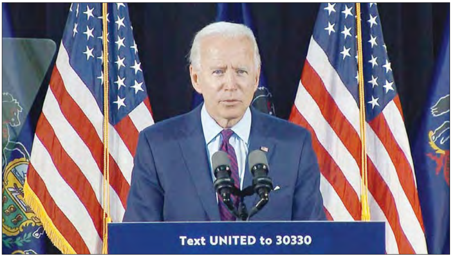
အမေရိကန်ရွေးကောက်ခံသမ္မတ ဂျိုးဘိုင်ဒင်ကို တွေ့ရစဉ်။

လန်စကီကို ရောဂါထိန်းချုပ်ရေးနှင့် ကာကွယ်ရေးဌာန၏ ညွှန်ကြားရေးမှူးအဖြစ် ရွေးချယ်ထားကြောင်း သိရ သည်။ အမေရိကန်သမ္မတဟောင်း ဘားရက်အိုဘားမား အစိုးရလက်အောက်တွင် ပြည်သူ့ကျန်းမာရေး ဆေးမှူး ချုပ်အဖြစ် တာဝန်ထမ်းဆောင်ခဲ့သော ဒေါက်တာ ဗီဗက်မာသီကို ယင်းရာထူးဖြင့်ပင် တာဝန်ထမ်းဆောင်ရန် ရွေးချယ်ထားသည်။ ကမ္ဘာ့ထိပ်တန်းအဆင့်မီ ဆေးဘက်ဆိုင်ရာ ကျွမ်းကျင်သူများပါဝင်သော ကိုဗစ်-၁၉ ရောဂါတုံ့ပြန် ရေးအဖွဲ့သည် တာဝန်များကို ထမ်းဆောင်ရန် အဆင်သင့် ဖြစ်နေပြီဖြစ်ကြောင်း ဒီဇင်ဘာ ၇ ရက်က ထုတ်ပြန်လိုက် သည့်ကြေညာချက်တွင် ဘိုင်ဒင်က ပြောကြားလိုက်သည်။ အန်နီအိတ်ချ်က