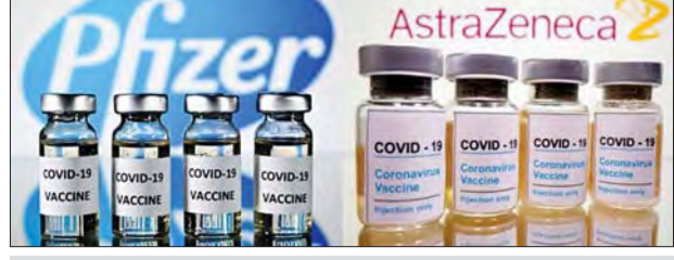
ဖိုက်ဇာနှင့် အက်စ်ထရာဇန်ကာတို့မှ ကိုဗစ်-၁၉ ကာကွယ်ဆေးများကို တွေ့ရစဉ်။

နှင့် အကယ်၍ လိုအပ်ပါက နိုင်ငံအနေ ဖြင့် အခြားသော ကာကွယ်ဆေး ထုတ်လုပ်သည့် ကုမ္ပဏီများနှင့် ချိတ်ဆက်၍ ကာကွယ်ဆေးများ ထပ်မံဖြည့်စွက်ဆောင်ရွက်ရန် စီစဉ် ထားကြောင်း ဝန်ကြီးဌာန၏ ထုတ်ပြန် ချက်တွင် ဖော်ပြထားသည်။ ကာကွယ်ဆေးများ၏ ဘေးကင်း လုံခြုံမှုနှင့် အစွမ်းအားရှိသည့် ဝန်ထမ်းအဖွဲ့များ ရှိနေချိန်တွင် ကာကွယ်ဆေး ထုတ်လုပ်မှုသည် လည်းမပြီးသေးသည့်အတွက် ကာကွယ် ဆေးထိုးနှံမှုအချိန်နှင့် ပတ်သက်ပြီး မဆုံးဖြတ်ရသေးကြောင်း တောင်ကိုရီး ယား ကျန်းမာရေးဝန်ကြီးဌာနက ဆက်လက်ပြောကြားသည်။ တောင်ကိုရီးယားအစိုးရသည် ပထမဆုံး ကာကွယ်ဆေးထိုးနှံမှု ကို သက်ကြီးရွယ်အိုများ၊ သက်ကြီး စောင့်ရှောက်ရေး ဂေဟာများရှိ ဘိုးဘွားများ၊ နာတာရှည်ရောဂါ ဝေဒနာသည်များနှင့် ကျန်းမာရေး ဝန်ထမ်းများကဲ့သို့သော ဝိုင်းရစ်ကူး စက်နိုင်ခြေရှိသည့် လူများကို ဦးစားပေးထိုးနှံပေးရန် ဆုံးဖြတ်ထား ကြောင်း သိရသည်။ ဆင်ပွာ