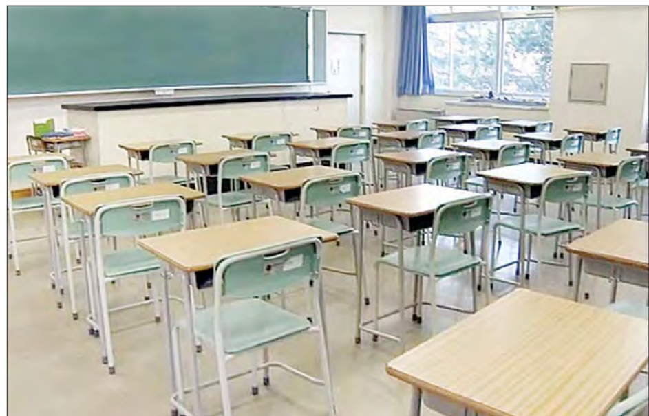
ကိုဗစ်-၁၉ ကြောင့် ပိတ်ထားရသည့် ကျောင်းတစ်ကျောင်းတွင် လူသူကင်းမဲ့နေသည့် စာသင်ခန်းကိုတွေ့ရစဉ်။

နိုင်ခြင်းမရှိသည့် ကလေးငယ် အရေအတွက်သည် တစ်လအတွင်း သန်း ၉၀ အထိ တိုးလာကြောင်း ယူနီဆက်ဗ်အဖွဲ့က ပြောသည်။ မကြာသေးမီက တစ်ကမ္ဘာလုံး ဆိုင်ရာ လေ့လာမှုအရ လူထုအတွင်း ကိုဗစ်-၁၉ အစုလိုက် ကူးစက်ဖြစ်ပွား မှုနှုန်းသည် စာသင်ကျောင်းများနှင့် ဆက်သွယ်မှုမရှိကြောင်း နိုင်ငံပေါင်း ၁၉၁ နိုင်ငံမှ ရရှိသည့်အချက်အလက် များက ဖော်ပြနေကြောင်း၊ စာသင် ကျောင်းများကြောင့် ရောဂါကူးစက် မှုနှုန်း တိုးလာသည်ဆိုသော အထောက်အထားများမှာ လွန်စွာ နည်းပါးကြောင်း ယူနီဆက်ဗ်အဖွဲ့က ထောက်ပြသည်။