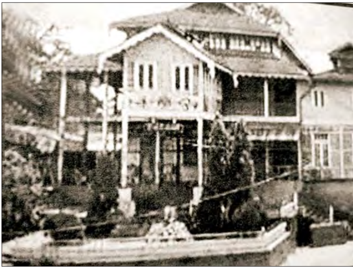
ပဲခူးမြို့ အမျိုးသားတန်းမြင့်ကျောင်း(Y.M.B.A) မူလကျောင်းဆောင်ကြီး မှတ်တမ်းဓာတ်ပုံ။

ဝိတိုရိယဘုရင်မကြီး၏ နှစ်ငါးဆယ် ပြည့် အထိမ်းအမှတ် အခမ်းအနားကို အင်္ဂလန်နိုင်ငံ လန်ဒန်မြို့တွင် ၁၈၉၇ ခုနှစ် ဇွန်လ ၂၂ ရက်နေ့က ကျင်းပခဲ့ပါသည်။ ယင်းသည် ကမ္ဘာတစ်ဝန်း ကြီးကျယ်လှသော အခမ်းအနားများစွာထဲက ဧည့်ခံပွဲတစ်ခု ဖြစ်ခဲ့ပါသည်။ ထိုစဉ်က နိုင်ငံပေါင်း ၁၁ နိုင်ငံ မှ ဝန်ကြီးချုပ် ၁၁ ဦး တက်ရောက်ခဲ့ပြီး စစ်သည်တော်ပေါင်း ၄၆၀၀၀ တို့ ချီတက် အလေးပြုခြင်း ခံခဲ့ရသည်။ ယင်းသည် ဝိတိုရိယမင်းဆက် နှစ် ၆၀ ပြည့်ခြင်းလည်း ဖြစ်သလို ဂရိတ်ဗြိတိန် နိုင်ငံတော်ကြီး၏ အလွန်ကြီးမားသော အင်အားပိုင်ဆိုင်နေချိန် လည်း ဖြစ်သည်။ ထို ၁၈၉၇ ခုနှစ်များဆီက ဝိတိုရိယဘုရင်မကြီးသည် ကမ္ဘာလူဦးရေ၏ လေးပုံတစ်ပုံ၊ ကမ္ဘာ့နယ်မြေ၏ ငါးပုံတစ်ပုံ (နေမဝင်အင်ပါယာကြီး)ကို ပိုင်ဆိုင်ချုပ်ချုပ် နေချိန်လည်း ဖြစ်သည်။ စစ်အင်အား ကြီးမားစွာ ပိုင်ဆိုင်လျက်ရှိသည့်အပြင် တော်ဝင်ရေတပ်မတော် အပါအဝင် တပ်ဖွဲ့ များသည် နည်းပညာရပ်များစွာကိုလည်း လက်တွေ့ အသုံးချနိုင်နေပြီဖြစ်သည်။