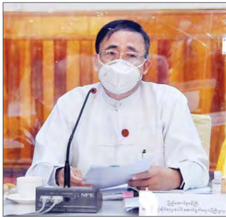
ပြည်ထောင်စုဝန်ကြီး ဦးကျော်တင် ဆွေးနွေးတင်ပြစဉ်။

ကျန်းမာရေးနှင့် အထူးစောင့်ရှောက်ရေး ဝန်ကြီးဌာနမှ ပြည်ထောင်စုဝန်ကြီး ဒေါက်တာဝင်းမြတ်အေးက ပြောကြားခဲ့သည်။