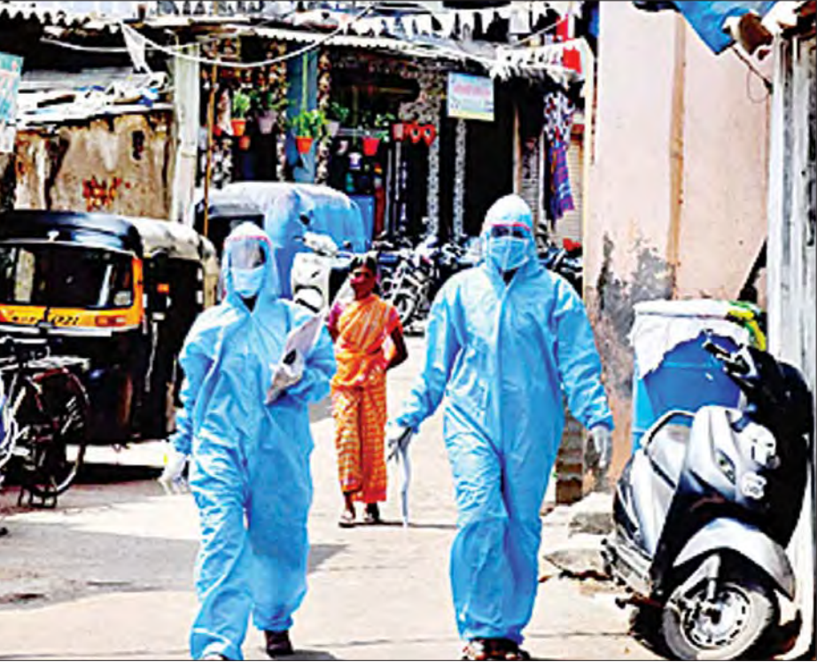
အိန္ဒိယနိုင်ငံ မွမ်ဘိုင်တွင် ပီပီအီးဝတ်စုံ ဝတ်ဆင်ထားသော ကျန်းမာရေးဝန်ထမ်းများကို တွေ့ရစဉ်။