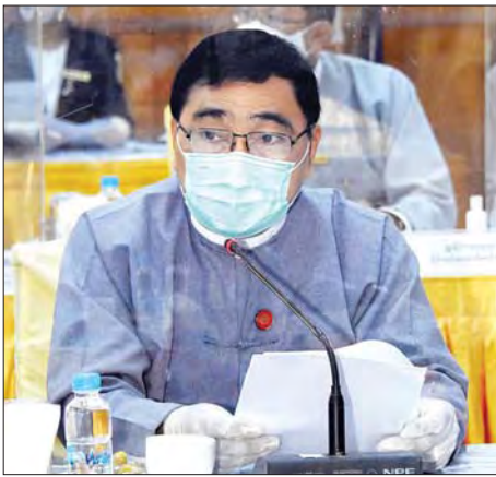
ပြည်ထောင်စုဝန်ကြီး ဒေါက်တာဝင်းမြတ်အေး ရှင်းလင်းပြောကြားစဉ်။