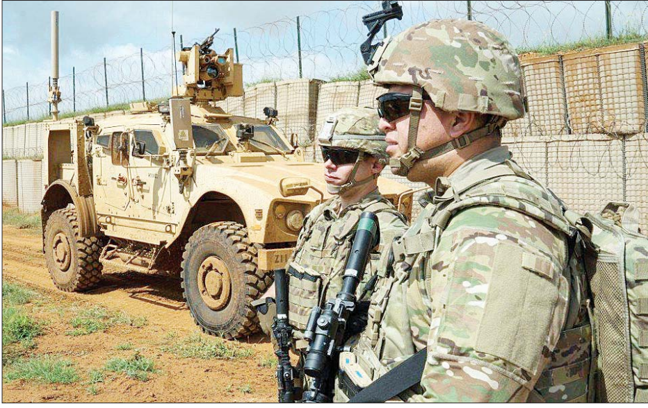
ပြည်ပ၌ချထားသည့် အမေရိကန်တပ်ဖွဲ့ဝင်အချို့ကို တွေ့ရစဉ်။

မကြာသေးမီ လများအတွင်း အမေရိကန်သမ္မတ ဒေါ်နယ်ထရမ် သည် အာဖဂန်နစ္စတန်နှင့် အီရတ် နိုင်ငံတို့တွင်ချထားသည့် အမေရိကန် တပ်ဖွဲ့ဝင်များကို လျှော့ချရန်