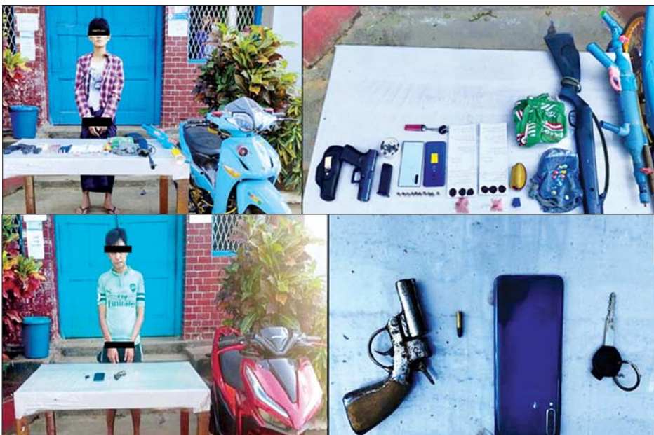
ပြစ်မှုကျူးလွန်သူများနှင့် သိမ်းဆည်းရမိသည့် စိတ်ကြွေးသွပ်ဆေးပြားများ၊ လက်နက်ခဲယမ်းများ။