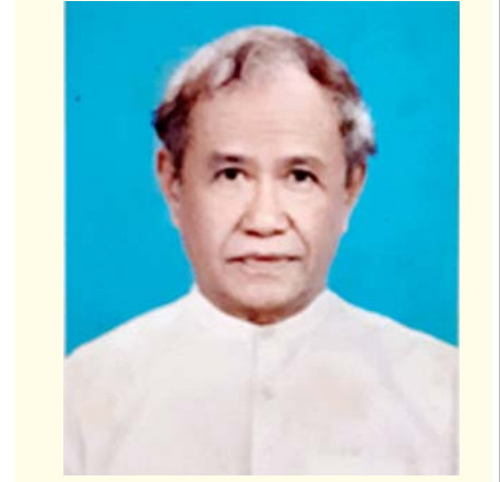
ဆောင်းပါးရှင်၏ ကိုယ်ရေးအကျဉ်း

“ယခုအခါ ဖက်ဒရယ်တက္ကသိုလ် တည်ထောင်ပေးဖို့