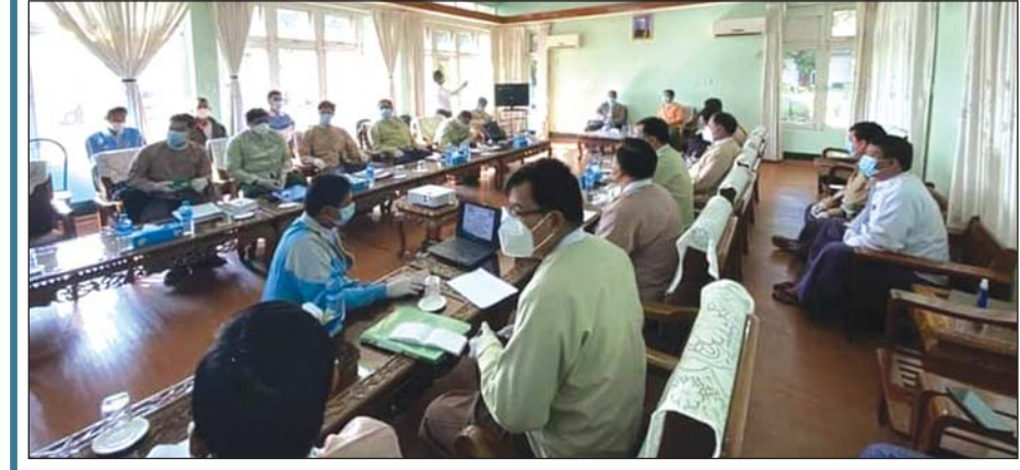
မြေနက္ကျန်းအငြင်းပွားမှုနှင့်ပတ်သက်၍ တိုင်းဒေသကြီးနှစ်ခုမှ ဝန်ကြီးများနှင့် တာဝန်ရှိသူများ တွေ့ဆုံဆွေးနွေးကြစဉ်။

ဆွေးနွေးပွဲတွင် ပဲခူးတိုင်း ဒေသကြီး ရွှေတောင်မြို့နယ် လယ် ယာမြေစီမံခန့်ခွဲရေးနှင့် စာရင်းအင်း ဦးစီးဌာနမှူးနှင့် ဧရာဝတီတိုင်းဒေသ ကြီးကြိုခင်းမြို့နယ် အုပ်ချုပ်ရေးမှူး တို့က ပြည်ခရိုင် ရွှေတောင်မြို့နယ်နှင့် ဟင်္သာတခရိုင် ကြိုခင်းမြို့နယ်အကြား ဧရာဝတီမြစ်အတွင်း မြေနက္ကျန်းများ ပေါ်ထွန်းလာမှု အခြေအနေ၊ အငြင်း ပွားမှု ဖြစ်ပွားနေသည့် အခြေအနေ များကို ရှင်းလင်းတင်ပြ၍ တိုင်း ဒေသကြီး ဝန်ကြီးများနှင့် တက် ရောက်လာကြသူများက ဆွေးနွေး ညှိနှိုင်းကြပြီး ဝန်ကြီးများက ဆောင် ရွက်သွားသည့်သည့်များကို ဆွေးနွေး မှာကြားခဲ့သည်။