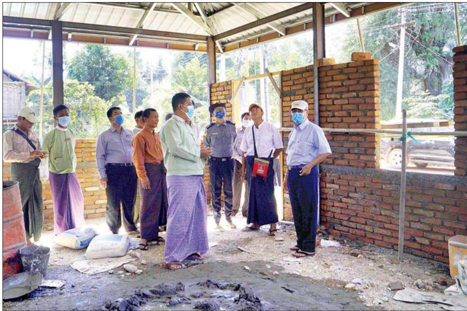
နေပြည်သူများ အဆင်ပြေစွာ ဖြတ်သန်းသွားလာနိုင်ရေး အတွက် လုပ်ငန်းအရည်အသွေးပြည့်မီအောင် ကြိုးပမ်း ဆောင်ရွက်ကြရန် ဆွေးနွေးမှာကြားသည်။

ပွင့်ဖြူ ဒီဇင်ဘာ ၆ မကွေးတိုင်းဒေသကြီး ဝန်ကြီးချုပ် ဒေါက်တာအောင်မိုးညို သည် တိုင်းဒေသကြီး၊ ခရိုင်နှင့် မြို့နယ်အဆင့် ဌာန ဆိုင်ရာ တာဝန်ရှိသူများနှင့်အတူ ယနေ့ မွန်းတည့် ၁၂ နာရီက ပွင့်ဖြူမြို့နယ် ကျေးလက်နေ ဒေသခံပြည်သူများ ရာသီမရွေး အဆင်ပြေစွာ သွားလာနိုင်ရေးအတွက် ပွင့်ဖြူမြို့ - မုန်းဇလဲကျေးရွာ ရေကျော်ချောင်းကူးတံတား တည်ဆောက်နေမှုနှင့် မုန်းဇလဲကျေးရွာတွင် ကျေးရွာ အုပ်ချုပ်ရေးမှူးရုံး ဆောက်လုပ်နေမှုတို့ကို ကွင်းဆင်း စစ်ဆေးသည်။