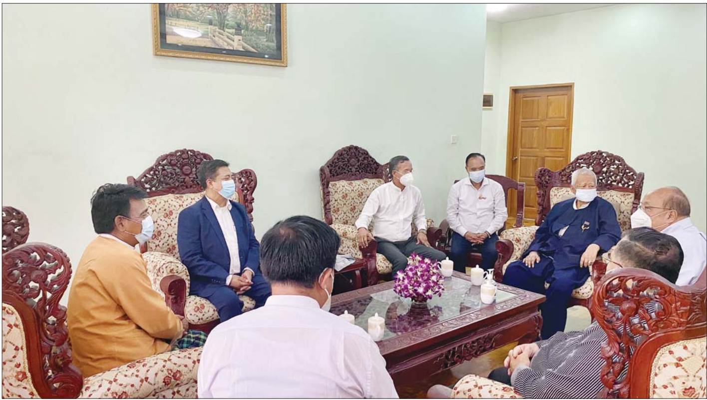
ပြည်ထောင်စုဝန်ကြီး ဦးသောင်းထွန်းနှင့် ဦးအုန်းမောင် တို့ ပအိုဝ်းတိုင်းရင်းသားခေါင်းဆောင် ဦးအောင်ခမ်းထီ နှင့်အဖွဲ့အား တွေ့ဆုံစဉ်။ သတင်းစဉ်

နေပြည်တော် ဒီဇင်ဘာ ၆ ရင်းနှီးမြှုပ်နှံမှုနှင့် နိုင်ငံခြားစီးပွားဆက်သွယ်ရေး ဝန်ကြီးဌာန ပြည်ထောင်စုဝန်ကြီး ဦးသောင်းထွန်း၊ ဟိုတယ်နှင့် ခရီးသွားလာရေးဝန်ကြီးဌာန ပြည်ထောင်စုဝန်ကြီး ဦးအုန်းမောင်တို့သည် ပအိုဝ်းတိုင်းရင်းသားခေါင်းဆောင် ဦးအောင်ခမ်းထီနှင့် အဖွဲ့အား ယနေ့ မွန်းလွဲပိုင်းတွင် နေပြည်တော်၌ တွေ့ဆုံသည်။ တွေ့ဆုံစဉ် ပြည်ထောင်စုနယ်မြေ နေပြည်တော် ပတ်ဝန်းကျင်ရှိ တိုင်းရင်းသားကျေးရွာ ၁၄ ရွာတွင် ပါဝင်သော ပအိုဝ်းတိုင်းရင်းသားများနေထိုင်သည့် ကျေးရွာများတွင် လူထုအခြေပြုခရီးသွားလုပ်ငန်း (Community Based Tourism) အပါအဝင် ကျေးရွာအလိုက် သင့်လျော်သည့် ကျေးလက်ဒေသခရီးသွားလုပ်ငန်းများ ဖော်ဆောင်ရေး၊ ပအိုဝ်းကိုယ်ပိုင်အုပ်ချုပ်ခွင့်ရနယ်မြေ စိုက်ပျိုးရေးကဏ္ဍတွင် နိုင်ငံတကာအဆင့်မီထုတ်ကုန်များ အရည်အသွေးမီ စိုက်ပျိုးထုတ်လုပ်တင်ပို့နိုင်ရေး၊ ပအိုဝ်းတိုင်းရင်းသား ဒေသခံများ၏ စာမျက်နှာ ၃ ကော်လံ ၁ ❖