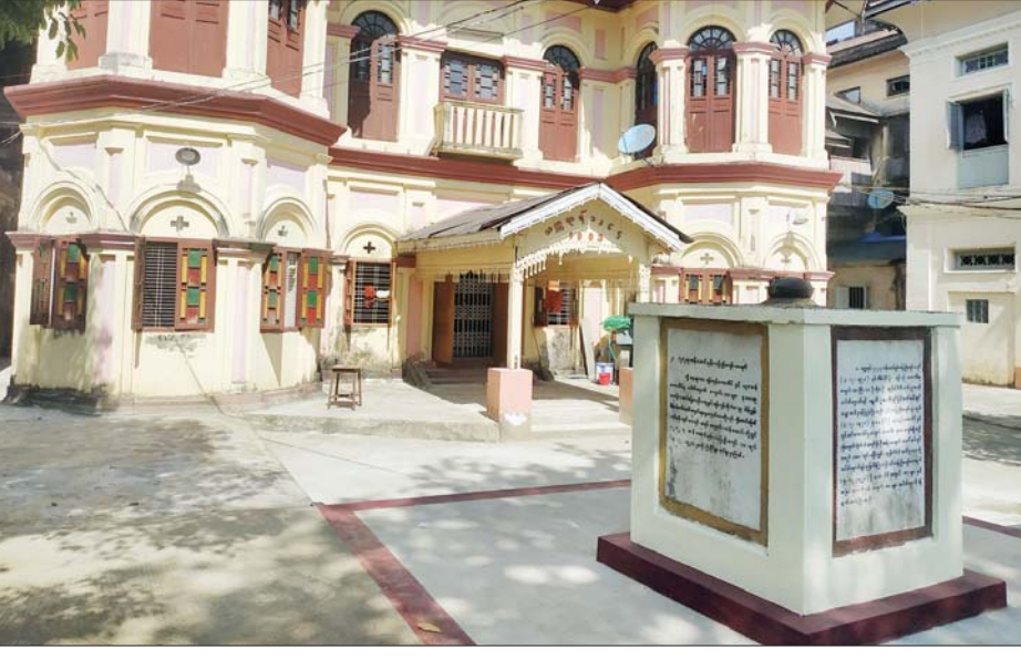
အမွေအနှစ် ထိန်းသိမ်းစောင့်ရှောက်ရေးအဖွဲ့ကလည်း လာကြည့်တယ်။ ကျောက်တိုင်၊ ရင်ပြင်နဲ့ ရေကန်ကိုတော့ မြို့မကျောင်းသားကျောင်းသူဟောင်းအသင်းရဲ့ရန်ပုံငွေစိုက်ထုတ်မှုနဲ့ မူလလက်ရာမပျက် ပြုပြင်ပေး

ကျောက်တိုင် မွမ်းမံပြင်ဆင်မှုနှင့်ပတ်သက်၍ ဗဟန်းမြို့နယ်စည်ပင်သာယာရေးကော်မတီဥက္ကဋ္ဌ ဦးဝင်းဗိုလ်က “တစ်နေ့မှာ မက်ဆင်ဂျာက တစ်ဆင့် ကျွန်တော့်မိတ်ဆွေတစ်ဦးက ဦးအရိယ ကျောင်းတိုက်ထဲမှာ ဒီကျောက်တိုင်ရှိတယ်။ နှစ်တွေကြာပြီ။ ချုံနွယ်ပိတ်ပေါင်းတွေ ပိတ်ပြီး ပျက်စီးနေလို့ ပြုပြင်သင့်တဲ့အကြောင်း ပြောလာတယ်။ ဒါနဲ့ သွားကြည့်ပြီး မြို့မကျောင်းသား ကျောင်းသူဟောင်းအသင်းက ညီနောင်တွေကို တင်ပြတယ်။ လူမှုရေးဝန်ကြီး ဦးနိုင်လင်းလည်း လည်းကောင်း၊ ရန်ကုန်မြို့ပြ