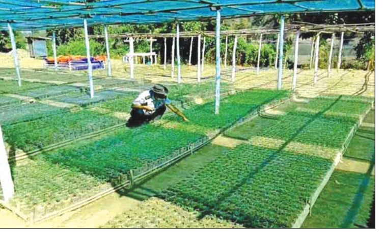
ရေဝေရေလဲစိုက်ခင်းစိုက်ပျိုးရန် ကြိုတင်ပျိုးထောင်ထားသော ပျိုးပင်များ။

ရေဝေရေလဲစိုက်ခင်းကို အောင်မြင်စွာ စိုက်ပျိုးနိုင်ရေးအတွက် မြို့နယ်သစ်တောဦးစီးဌာနမှ ရှိရှိဦးဆောင်မော်ဦးဆောင်သည့် သစ်တောဝန်ထမ်းများအဖွဲ့က မြေကျင်းတူးခြင်းလုပ်ငန်းများကို ကြိုတင်ပြင်ဆင် ဆောင်ရွက်လျက်ရှိကြောင်း သိရသည်။ ရံဝင်းနိုင်(ပြန်/ဆက်)