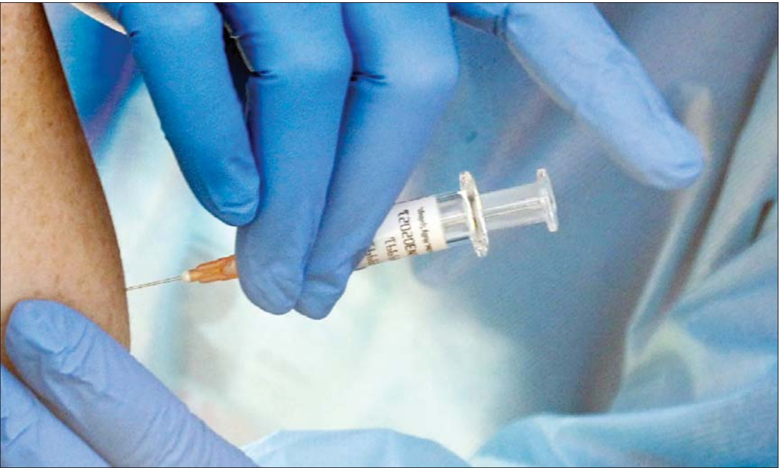
ကိုဗစ်-၁၉ ကာကွယ်ဆေးတစ်မျိုးကို စမ်းသပ်ထိုးနှံနေသည်ကို တွေ့ရစဉ်။

ကာကွယ်ဆေးသစ်တစ်မျိုးကို သုတေသနလုပ်ဆောင်တာတွေ၊ စမ်းသပ်မှုတွေ၊ သဘောတူခွင့်ပြုမှုတွေ၊ ထုတ်လုပ်မှုတွေနဲ့ ဖြန့်ဖြူးရောင်းချမှု လုပ်ဆောင်တာတွေဟာ ပုံမှန်အားဖြင့်တော့ ဆယ်စုနှစ်တစ်စု နီးပါး သို့မဟုတ် အဲဒီထက် ပိုကြာတတ်ပါတယ်။ ကြောက်စရာကောင်းလောက်တဲ့ အမြန်နှုန်း