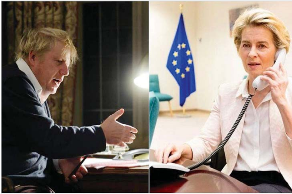
ဗြိတိန်ဝန်ကြီးချုပ် ဘောရစ်ဂျန်ဆင်နှင့် ဥရောပကော်မရှင်ဥက္ကဋ္ဌ အာဆူလာဗွန်ဒါလီယန်။