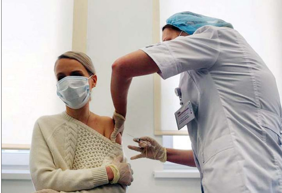
ရှားတွင် ကာကွယ်ဆေး ထိုးနှံပေးနေသည်ကို တွေ့ရစဉ်။

ကာကွယ်ဆေး စတင် ထိုးနှံပေးခဲ့ ကြောင်း သိရသည်။ အဆိုပါကာကွယ်ဆေးကို ရှား အစိုးရက ဩဂုတ်လတွင် အတည်ပြု ပေးခဲ့သည်။ ကာကွယ်ဆေးထိုးရန် အင်တာနက်တွင် လျှောက်ထားသူများ အား မြို့တော်ဆေးရုံသို့ လာရောက် သည်ကို တွေ့မြင်ရမည်ဖြစ်သည်။ အမျိုးသမီး ဆရာဝန်တစ်ဦးက ကိုယ့်ကိုယ်ကိုယ်လည်း ကာကွယ် ရမည်ဖြစ်ကြောင်းနှင့် ကာကွယ်ဆေး ထိုးနှံရသည့်အတွက် ပျော်ရွှင်ကြောင်း ပြောကြားလိုက်သည်။ သမ္မတ ဗလာဒီမာပူတင် အစိုးရ အဖွဲ့သည် ရှားကိုဗစ်-၁၉ ကာကွယ် ဆေး၏ ထိရောက်မှုကို ဗြိတိန်ထက် အရင် စမ်းသပ်ခဲ့သည်။ တချို့ ရှားဝန်ကြီးများကို ကာကွယ်ဆေးထိုးနှံပေးခဲ့သော်လည်း ပူတင်က ကာကွယ်ဆေးထိုး မခံရ သေးကြောင်း သိရသည်။ အင်န်အိတ်ချီကေ