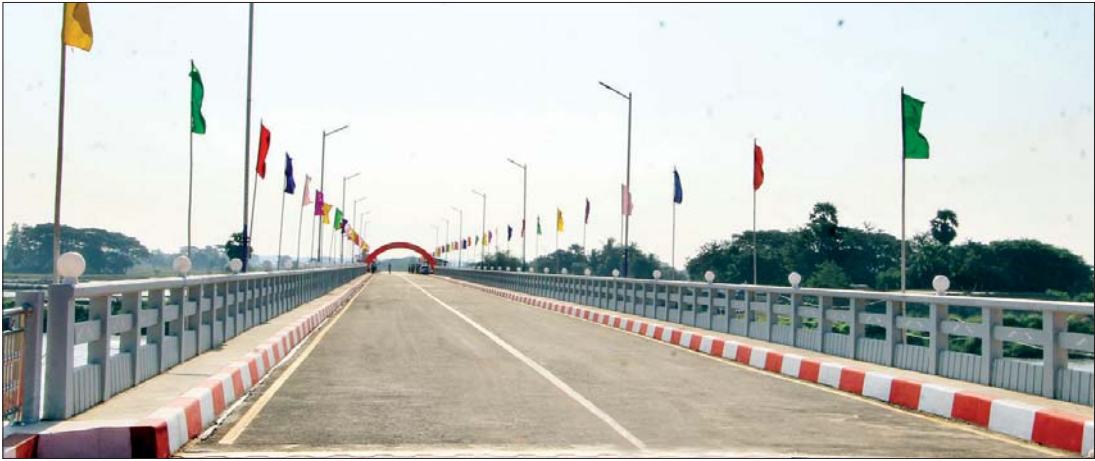
ပဲခူးမြစ်ကူးတံတား(ကဝ)။

ပဲခူး ဒီဇင်ဘာ ၆ ပဲခူးတိုင်းဒေသကြီး ကဝမြို့နယ် ကဝမြို့ရှောင်လမ်းပေါ်ရှိ ပဲခူးမြစ်ကူးတံတား(ကဝ)ဖွင့်ပွဲအခမ်းအနားကို ဒီဇင်ဘာ ၆ ရက် နံနက် ၉ နာရီက ကျန်းမာရေးနှင့် အားကစားဝန်ကြီးဌာနက ထုတ်ပြန်ထားသည့် ညွှန်ကြားချက်များနှင့်အညီ ကျင်းပသည်။ လက်ရှိအသုံးပြုနေသည့် ပဲခူးမြစ်ကူးတံတား(ကဝ) ဘေလီတံတားသည် တစ်လမ်းသွား ဘေလီတံတားဖြစ်ပြီး ကဝမြို့တွင်းကို ဖြတ်သန်းသွားလာရသည့်အတွက် ယာဉ်ကြောကျပ်တည်းမှုများ ဖြစ်ပေါ်ကာ ယာဉ်အန္တရာယ်များပြားလာသောကြောင့် ကဝမြို့ရှောင်လမ်းကို တည်ဆောက် စာမျက်နှာ ၄ ကော်လံ ၁ ●