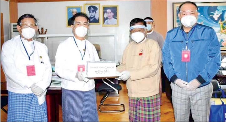
မန္တလေးတိုင်းဒေသကြီးအတွင်း ကိုဗစ် - ၁၉ ရောဂါကြိုတင်ကာကွယ် ထိန်းချုပ်၊ ကုသရေးလုပ်ငန်းများတွင် အသုံးပြုနိုင်ရန်အတွက် မန္တလေးတိုင်းဒေသကြီး ကုန်သည်များနှင့်စက်မှုလက်မှုလုပ်ငန်းရှင်များအသင်း အသင်းသူ အသင်းသားများက အလှူငွေကျပ်သိန်း ၅၀ နှင့် နှာခေါင်းစည်းခုရေ ၂၀၀၀၀ ကို ဒီဇင်ဘာ ၃ ရက်က မန္တလေးတိုင်းဒေသကြီး အစိုးရအဖွဲ့သို့ ပေးအပ်လှူဒါန်းစဉ်။ အောင်သူရ