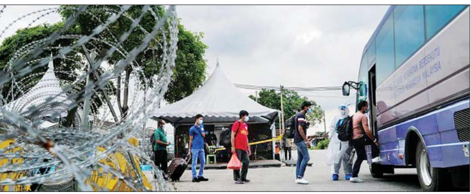
မလေးရှားနိုင်ငံ ဆီလန်ဂေါပြည်နယ်၌ ကိုဗစ်-၁၉ ကူးစက်မှုမှ ပြန်လည်ကောင်းမွန်လာသူများကို ပို့ဆောင်ရန် စီစဉ်နေစဉ်။

ကွာလာလမ်ပူ ဒီဇင်ဘာ ၆ မလေးရှားနိုင်ငံ၌ ကိုဗစ်-၁၉ ရောဂါ ကူးစက်ပျံ့နှံ့မှုကို တားဆီးကာကွယ် ရန် သွားလာလှုပ်ရှားမှုအားထိန်းချုပ် ဟန့်တားသည့် အမိန့်ကို ဒီဇင်ဘာ ၂၀ ရက်အထိ ထပ်မံ တိုးမြှင့်မည်ဖြစ် ကြောင်း အစိုးရက ဒီဇင်ဘာ ၅ ရက် တွင် ပြောကြားလိုက်သည်။ ကိုဗစ်-၁၉ ကန့်သတ်ချက်များ ကို ညှိနှိုင်းအကောင်အထည်ဖော် ဆောင်ရွက်နေသော ကာကွယ်ရေး ဝန်ကြီး အစ္စမေးလ်က သတင်းစာ ရှင်းလင်းပွဲတစ်ခုတွင် ကွာလာလမ်ပူ၊ ယင်းနှင့်ကပ်လျက်ရှိသော ဆီလန်ဂေါ