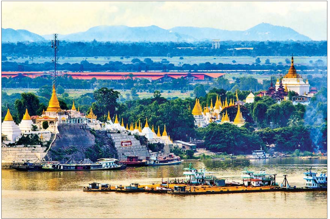
ရွှေကြက်ယက်၊ ရွှေကြက်ကျဘုရား

(ဗိုလ်ချုပ်အောင်ဆန်း၏ (၁၁-၂-၁၉၄၇) ရက်နေ့တွင် ပင်လုံမြို့ စော်ဘွားများ ထမင်းစားပွဲတွင် ပြောကြားသော မိန့်ခွန်းမှ ကောက်နုတ်ချက်)