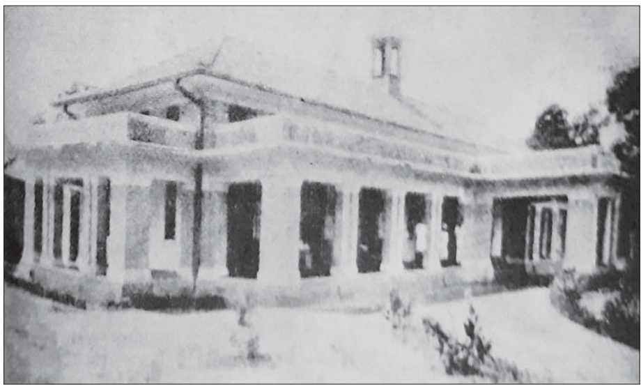
ရန်ကုန်တက္ကသိုလ် ဆေးရုံ မှတ်တမ်းဓာတ်ပုံ။