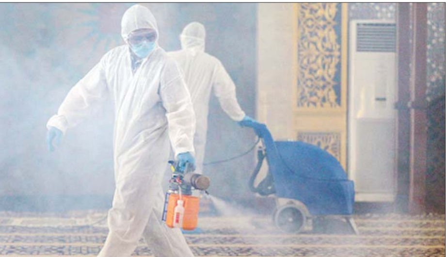
ဘရူနိုင်းနိုင်ငံ မြို့တော် ဘန်ဒါဆီရီဘီဂါဝမ်ရှိ ဘာသာရေးအဆောက်အအုံတစ်ခုအတွင်း ပိုးသတ်ဆေးဖျန်းနေသူများကို တွေ့ရစဉ်။