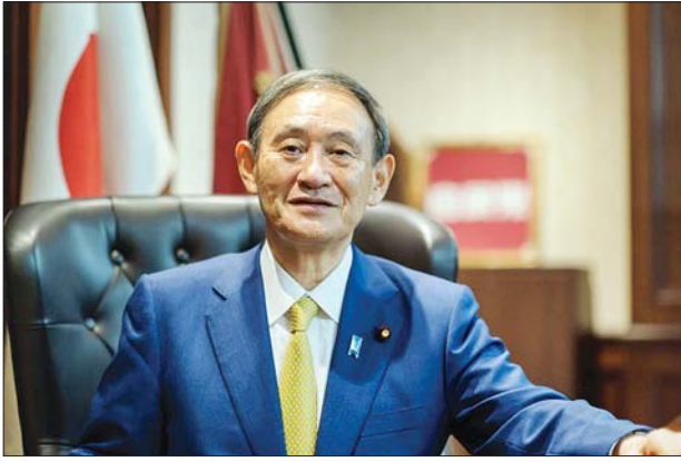
ဂျပန်ဝန်ကြီးချုပ် မစ္စတာ ဆူဂါယိုရှိဟိဒဲ

ထို့ပြင် ဂျပန်အစိုးရအနေဖြင့် မော်တော်ယာဉ်များမှ ကာဗွန်ဒိုင်အောက်ဆိုက် ဓာတ်ငွေထုတ်လွှတ်မှုကို သုညအထိ လျှော့ချနိုင်ရန်နှင့် ဓာတ်ဆီ၊ ဒီဇယ်သုံးကား များအသုံးပြုမှုမှ လျှပ်စစ်စွမ်းအင်သုံး မော်တော်ယာဉ်များ ပြောင်းလဲအသုံးပြုမှု