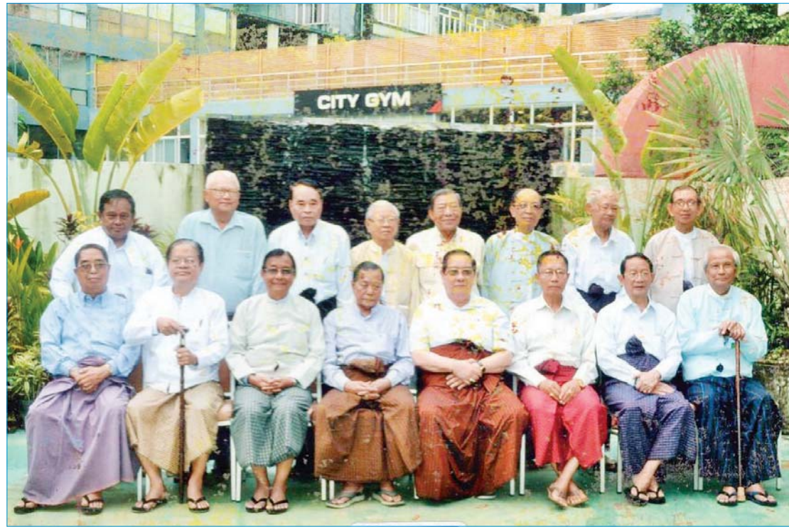
ရန်ကုန်တက္ကသိုလ် ထီးတန်းကောလိပ် ကျောင်းသားဟောင်းများ တွေ့ဆုံပွဲအမှတ်တရ (၂၀၁၇)။