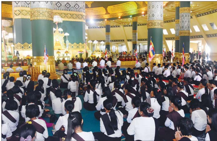
ယမန်နှစ် တန်ဆောင်မုန်းလပြည့်နေ့က နေပြည်တော် ဥပုတသန္တိစေတီတော်၌ ဝတ်ရွတ်ဖတ်ပူဇော်နေစဉ်။

ကျီးမန်းပွဲ ဖြစ်ခဲ့ပုံကတော့ ရှေးအခါက ယောက်ျားသားများ ရှင်လိင်ပြန်ကြတဲ့အခါ ဆေးမင်ကြောင်ထိုးတဲ့ ဓလေ့ဟာ အထင်အရှားရှိခဲ့ပါတယ်။ ရှင်ဘုရင်မှ အစချီကာ မင်းညီမင်းသား၊ များမတ်သူကြွယ်များ၊ ကုန်သည်၊ လယ်လုပ်၊ သူရင်းငှားများ စတဲ့ ယောက်ျားသားတိုင်းဟာ ဆေးမင်ထိုးကြလေ့ရှိတယ်လို့ ဆိုပါတယ်။ ဒီလိုထိုးတဲ့အခါ