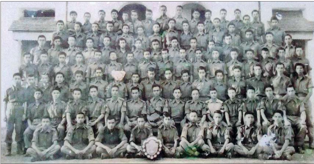
ဒိုင်းဆုရရှိသည့် ရန်ကုန်တက္ကသိုလ် ထီးတန်း - တပ်ရင်း ပထမနှစ်ကျောင်းသားများ (၁၉၅၈)။

ထီးတန်းကောလိပ်မှာ သွပ်မိုး၊ ဝါးထရိုကာ၊ သစ်သားကြမ်းခင်း တန်းလျား ခြောက်ခုနှင့် အလယ်မှာ နှစ်ထပ်တိုက် တစ်လုံးရှိပါသည်။ အဆောင်မူ၊ အဆောင်နည်းပြနှင့် ကျောင်းသားအချို့ နေကြပါသည်။ တန်းလျား တစ်ခုကို A နှင့် B နှစ်ပိုင်းခွဲထားပြီး တစ်ပိုင်းမှာ ကျောင်းသား ၁၀ ယောက်စီနေပါသည်။ ကျွန်တော်အဆောင်က (၇) ဘီမှာနေပြီး ပျဉ်းမနားက သုံးဦး၊ ပြည်၊ ကြို့ပင်ကောက်၊