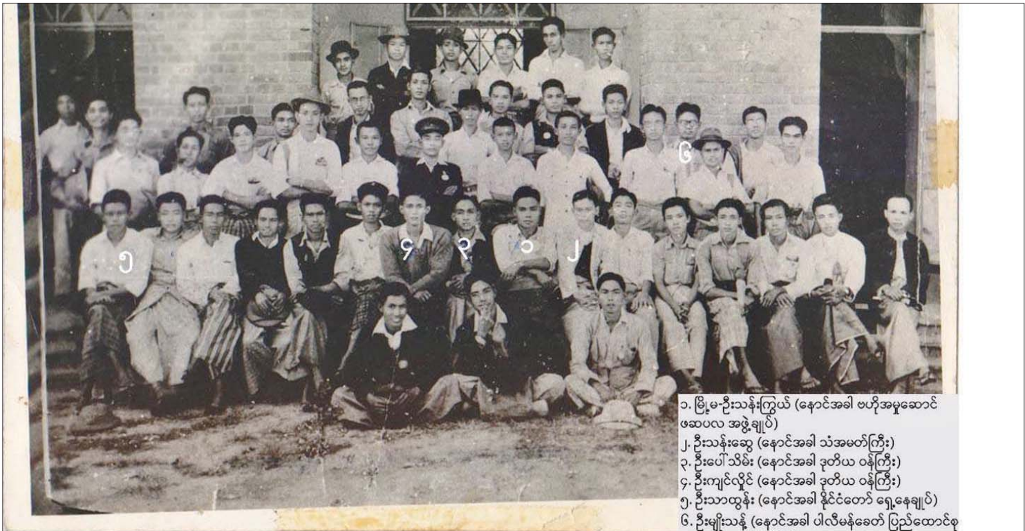
၁. မြို့မဦးသန်းကြွယ် (နောင်အခါ ဗဟိုအမှုဆောင် ဖဆပလ အဖွဲ့ချုပ်) ၂. ဦးသန်းဆွေ (နောင်အခါ သံအမတ်ကြီး) ၃. ဦးပေါ်သိမ်း (နောင်အခါ ဒုတိယ ဝန်ကြီး) ၄. ဦးကျင်လှိုင် (နောင်အခါ ဒုတိယ ဝန်ကြီး) ၅. ဦးသာထွန်း (နောင်အခါ နိုင်ငံတော် ရှေ့နေချုပ်) ၆. ဦးမျိုးသန့် (နောင်အခါ ပါလီမန်ဗေတ ပြည်ထောင်စု အစိုးရ သတင်း ပြန်ကြားရေးမှူး)