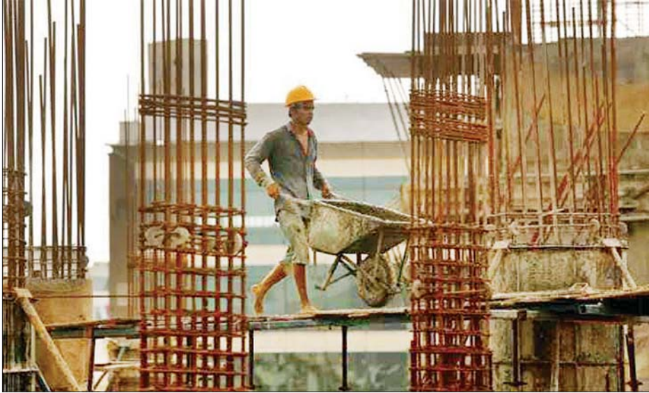
ဆောက်လုပ်ရေးလုပ်ငန်းခွင်မှ လုပ်သားတစ်ဦးကို တွေ့ရစဉ်။