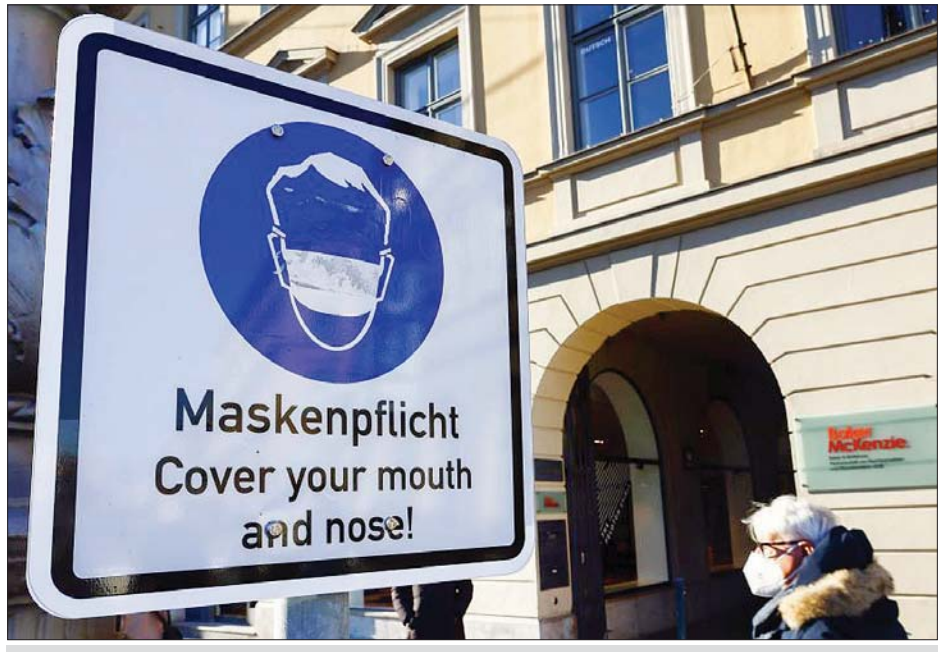
ဂျာမနီနိုင်ငံ မြူးနစ်မြို့ရှိ ကိုဗစ်-၁၉ အန္တရာယ်ကင်းဝေးရေးသတိပေးဆိုင်းဘုတ် စိုက်ထူထားမှုကို တွေ့ရစဉ်။