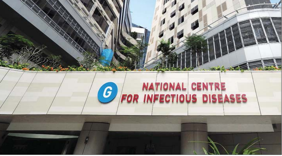
စင်ကာပူနိုင်ငံ၏ ကူးစက်ရောဂါဆိုင်ရာ အမျိုးသားဗဟိုဌာနကို တွေ့ရစဉ်။