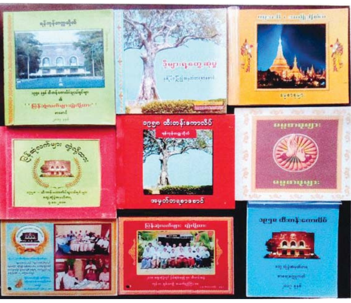
ရန်ကုန်တက္ကသိုလ် ထီးတန်းကောလိပ် ကျောင်းသားဟောင်းများ အစုအဖွဲ့မှ ထုတ်ဝေသော အထိမ်းအမှတ် စာအုပ်၊ စာစောင်များ။