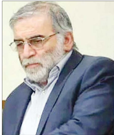
ကွယ်လွန်သူ အီရန်နျူကလီးယားသိပ္ပံပညာရှင် မိုဆန် ဖက်ကရီဇာဒက်။

ဝန်းကျင်မှကြားရကြောင်း သိရသည်။ မိုဆန် ဖက်ကရီဇာဒက်သည် နျူကလီး ယား နည်းပညာဆိုင်ရာ သုတေသနပညာရှင် တစ်ဦးအဖြစ် လူသိများပြီး နျူကလီးယားနှင့် တိုက်ချင်းပစ်ခံခဲ့ကျည် အကောင်အထည်ဖော် ရေး လုပ်ဆောင်မှုများတွင် အဓိကကျသည့် နေရာမှ ပါဝင်ဆောင်ရွက်ခဲ့သူအဖြစ် ကုလ သမဂ္ဂလုံခြုံရေးကောင်စီက ဖော်ပြခဲ့သည်။ သို့ရာတွင် အီရန်အစိုးရက နျူကလီးယား လက်နက်များထုတ်လုပ်ရန် လုပ်ဆောင်နေ သည်ဆိုခြင်းမှာ မဟုတ်ကြောင်း ငြင်းဆန် ထားသည်။ ယင်းတိုက်ခိုက်မှု ဖြစ်ပွားခဲ့ပြီးနောက်တွင် အီရန်နိုင်ငံခြားရေးဝန်ကြီး မိုဟာမက် ဂျာဗက် ဇာရစ်ဖ်က ယင်းကိစ္စတွင် အစွဲရော့တို့ ပါဝင် ပတ်သက်နေသည့် အရိပ်အယောင်ရှိကြောင်း တွစ်တာပေါ်၌ ရေးသားဖော်ပြခဲ့သည်။