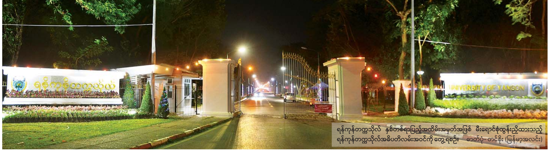
ရန်ကုန်တက္ကသိုလ် နှစ်တစ်ရာပြည့်အထိမ်းအမှတ်အဖြစ် မီးရောင်စုံထွန်းညှိထားသည့် ရန်ကုန်တက္ကသိုလ်အဓိပတိလမ်းအဝင်ကို တွေ့ရစဉ်။

ကျွန်တော်တို့ ဘဝများစွာအတွက် အရေးပါလှသော အဓိရန်ကုန်တက္ကသိုလ်ကြီး ကို အမှတ်ရ တမ်းတလျက် မိမိတို့ ကျောင်းသားဘဝမှတ်မိသမျှ ရေးသားဖော်ပြ ရင်း ရန်ကုန်တက္ကသိုလ် ရာပြည့်ပွဲကို ဂုဏ်ပြုလိုက်ပါသည်။ ။