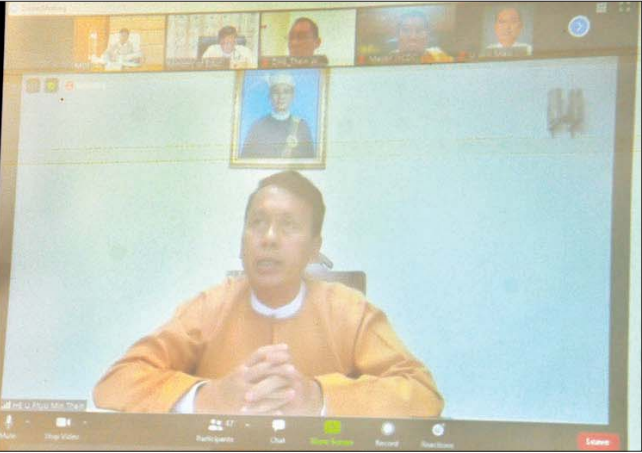
ရန်ကုန်တက္ကသိုလ်နှစ်(၁၀၀)ပြည့် ရာပြည့်သဘင်အခမ်းအနား Virtual Event ဖြင့် အောင်မြင်စွာကျင်းပနိုင်ရေး အကြံပြုညှိနှိုင်းအစည်းအဝေးတွင် ပြည်ထောင်စု ဝန်ကြီး ခေါက်တာမျိုးသိမ်းကြီးနှင့် ရန်ကုန်တိုင်းဒေသကြီးဝန်ကြီးချုပ် ဦးဖိုးမင်းသိန်းတို့ ဗီဒီယိုကွန်ဖရင့်စနစ်ဖြင့် ဆွေးနွေးစဉ်။

ကြောင်း ပြောကြားသည်။ ဆက်လက်၍ မြန်မာ့အသံနှင့် ရုပ်မြင်သံကြား ညွှန်ကြားရေးမှူးချုပ် ဦးရဲနိုင်က ပြန်ကြားရေးနှင့် သတင်း ထုတ်ပြန်ရေး လုပ်ငန်းကော်မတီ၏ လုပ်ငန်း ဆောင်ရွက်ချက်များကို လည်းကောင်း၊ ပညာရေးဝန်ကြီးဌာန