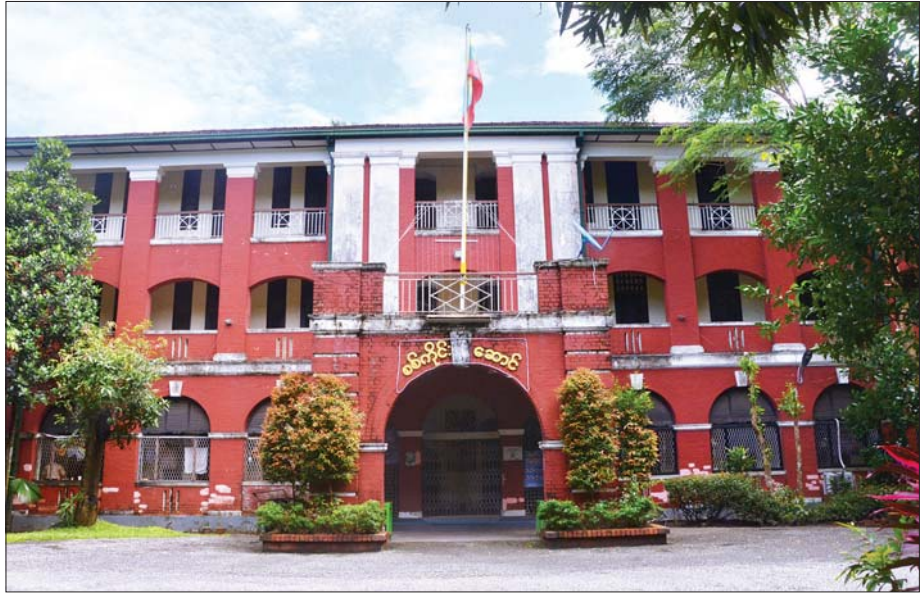
ရန်ကုန်တက္ကသိုလ်ရှိ စစ်ကိုင်းဆောင်။

သည် လူအများစု နှုတ်ဖျားတွင် စွဲနေပါသည်။ လူတိုင်းလိုလို အနည်းဆုံးတော့ ရေချိုးခန်းမင်းသားအဖြစ် သိချင်းဟစ်ကြပါသည်။ မည်သူ့ကိုမျှ အားနာစရာမလိုပါ။ ပထမနှစ်သင်တန်းများကို မန္တလေးဆောင်တွင် သင်ကြားကြရပြီး မြန်မာစာ၊ အင်္ဂလိပ်စာ၊ သင်္ချာ၊ ဓာတုဗေဒ၊ ရူပဗေဒနှင့် ဘူမိဗေဒတို့ကို သင်ကြားရပါသည်။ ဆယ်တန်းအောင်စဉ်က ဇီဝဗေဒယူခဲ့သော်လည်း တက္ကသိုလ်တွင် ဇီဝဗေဒယူပါက သတ္တဗေဒ ဌာနနှင့် ရုက္ခဗေဒဌာနနှစ်ခုခွဲ၍ သင်ယူရမည်ဖြစ်သဖြင့် အများစုမှာ တစ်ဘာသာတည်း ဖြစ်သော ဘူမိဗေဒကို ယူကြပါသည်။ ဒုတိယနှစ်မှစ၍ ပင်မဆောင်ရှိ သင်္ချာဌာန စာသင်ခန်းများတွင် ပညာသင်ကြားရပါသည်။ ဒုတိယနှစ်တွင် အင်္ဂလိပ်စာ၊ သင်္ချာဘာသာနှင့် ခုနစ်သင်္ချာယုတ္တိဗေဒ(သို့မဟုတ်) ဓာတုဗေဒတို့ကို မိုင်နာအဖြစ် သင်ယူကြရရာ ကျွန်တော်က စာမျက်နှာ ၇ သို့