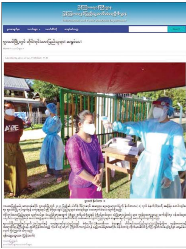
ပြန်ကြားရေးနှင့်ပြည်သူ့ဆက်ဆံရေးဦးစီးဌာန ဝက်ဘ်ဆိုက်တွင် ဖော်ပြခဲ့သည့် ၂၀၂၀ ပြည့်နှစ် အထွေထွေရွေးကောက်ပွဲနှင့်ပတ်သက်သည့်သတင်းများ။