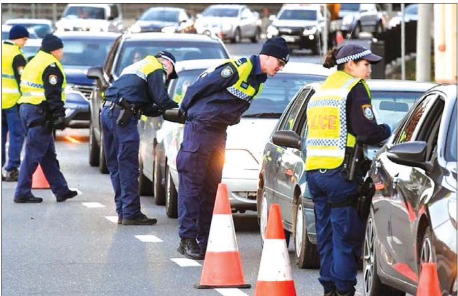
ဗစ်တိုးရီးယားနှင့် နယူးဆောက်ဝေးပြည်နယ်ကို ဆက်သွယ်ထားသည့် နယ်စပ်ဂိတ်၌ ရဲတပ်ဖွဲ့ဝင်များက အဝင်အထွက် စစ်ဆေးနေစဉ်။

နှာခေါင်းစည်းမတပ်မနေရအမိန့်ကိုလည်း ပြန်လည်ဖြေလျှော့ပေးလျက်ရှိသည်။ ဩစတြေးလျနိုင်ငံတွင် ကိုဗစ်- ၁၉ ကူးစက်ဖြစ်ပွားမှုကြောင့် သေဆုံးသူ ၉၀၀ ခန့်ရှိပြီး ရောဂါကူးစက်ခံရသူ အရေအတွက် စုစုပေါင်း ၂၈၀၀၀ ရှိသည်။