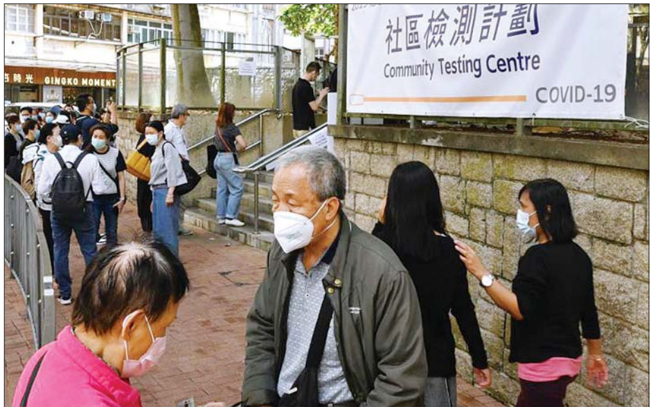
ဟောင်ကောင်မြို့ရှိ ကိုဗစ်- ၁၉ စစ်ဆေးဌာနအပြင်ဘက်တွင် ပြည်သူများ စောင့်ဆိုင်းနေစဉ်။

အတွက် ဟောင်ကောင်နှင့် စင်ကာပူအကြား ခရီးသွားလှုပ်ဆော်မှုအစဉ်အား ရက်သတ္တနှစ်ပတ်ကြာသည်အထိ ရွှေ့ဆိုင်းထားမည့် အစီအစဉ်ကို နိုဝင်ဘာ ၂၂ ရက်တွင် ကြေညာခဲ့သည်။ ထို့အတူ ရောဂါကူးစက်မှုကို ထိန်းချုပ်နိုင်ရန် လူမှုဝေးကွာကန့်သတ်ချက်အသစ်များကိုလည်း ထုတ်ပြန်မည်ဖြစ်ကြောင်း သိရသည်။ ဘန်ကောက်ပို့စ်