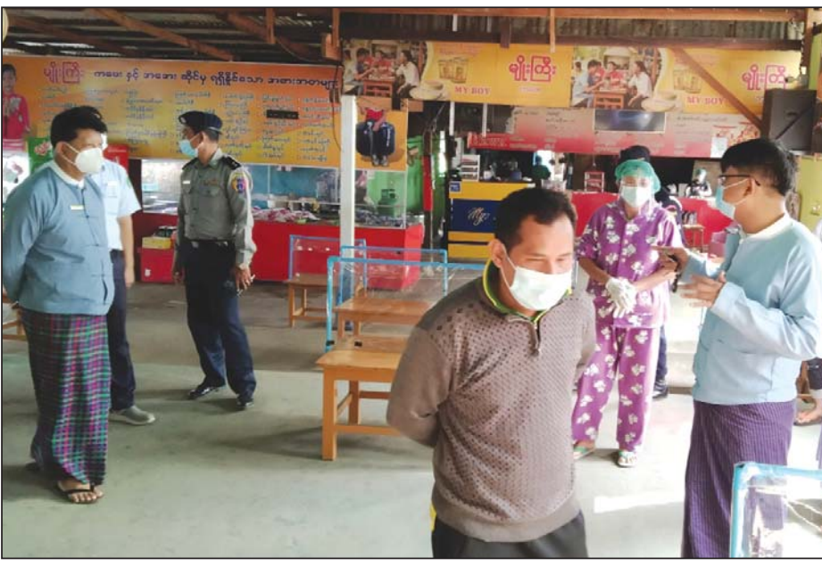
လက်ဖက်ရည်ဆိုင်တစ်ဆိုင်အတွင်း၌ တာဝန်ရှိသူများ လိုက်လံကြည့်ရှု စစ်ဆေးနေစဉ်။

မိုးကောင်း နိုဝင်ဘာ ၂၃ ကချင်ပြည်နယ် မိုးကောင်းမြို့နယ်ရှိ စားသောက်ဆိုင်များ၊ လက်ဖက်ရည်ဆိုင်များတွင် ပါဆယ်စနစ်ဖြင့် ရောင်းချလျက်ရှိရာမှ သတ်မှတ်ချက်များနှင့် ကိုက်ညီသော ဆိုင်များကို နိုဝင်ဘာလကုန်တွင် ဆိုင်ထိုင်စနစ်ဖြင့် ပြန်လည်ရောင်းချခွင့်ပြုသွားမည်ဖြစ်ကာ ခွင့်ပြုနိုင်ရေးအတွက် တာဝန်ရှိသူများက နိုဝင်ဘာ ၂၂ ရက်တွင် လိုက်လံ စစ်ဆေးခဲ့သည်။