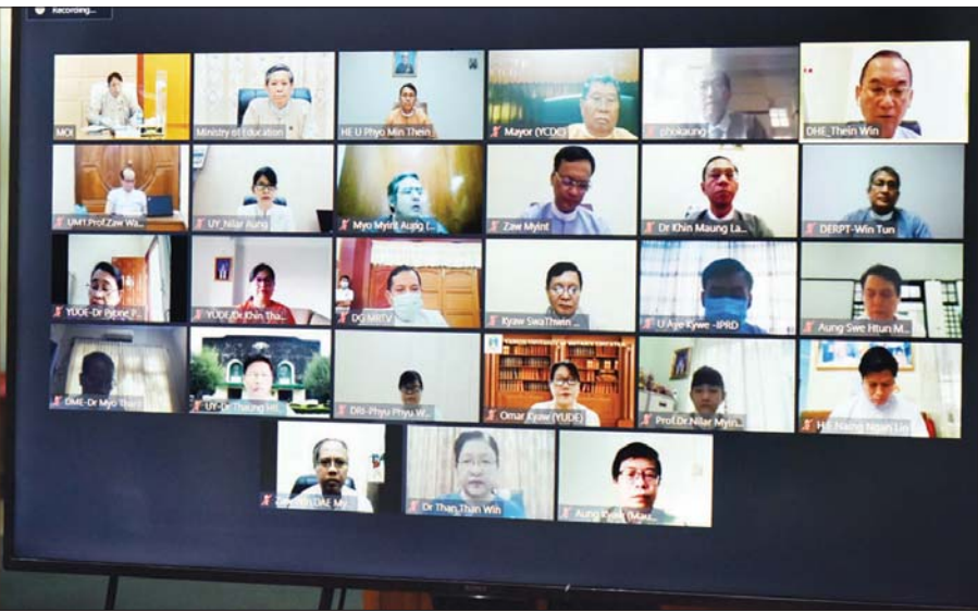
ပြည်ထောင်စုဝန်ကြီး ဒေါက်တာဖေမြင့် ဗီဒီယိုကွန်ဖရင့်စနစ်ဖြင့် ကျင်းပသည့် ရန်ကုန်တက္ကသိုလ် နှစ်(၁၀၀)ပြည့် ရာပြည့် သဘင်အခမ်းအနား Virtual Event ဖြင့် အောင်မြင်စွာကျင်းပနိုင်ရေး အကြံပြုညှိနှိုင်းအစည်းအဝေးသို့ တက်ရောက်ဆွေးနွေးစဉ်။

ရွက်နေသည့် အခြားအစီအစဉ်များ ရှိပါကြောင်း၊ ရန်ကုန်တက္ကသိုလ်နှစ်(၁၀၀) ပြည့် အထိမ်းအမှတ်အဖြစ် မြန်မာ့အသံနှင့် ရုပ်မြင်သံကြားက ထုတ်လွှင့်လျက်ရှိသည့် ရုပ်သံအစီအစဉ်များလည်းရှိပါကြောင်း၊ သတင်းနှင့်စာနယ်ဇင်းလုပ်ငန်းက ထုတ်ဝေလျက်ရှိသည့် သတင်းစာများတွင် ရန်ကုန်တက္ကသိုလ် နှစ်(၁၀၀)ပြည့် အထိမ်းအမှတ် ဆောင်းပါးများ၊ အင်တာဗျူးများကိုလည်း ဖော်ပြပေးလျက် ရှိပါကြောင်း၊ ပြန်ကြားရေးနှင့် ပြည်သူ့ဆက်ဆံရေးဦးစီးဌာနက ပြုပြင်ပုံနှိပ်အစီအစဉ်များတွင် ပါဝင်ဆောင်ရွက်ပေးလျက်ရှိပါကြောင်း။