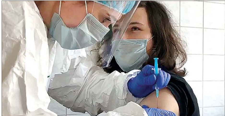
ကိုဗစ်- ၁၉ ကာကွယ်ဆေးကို စေတနာရှင်တစ်ဦးအား စမ်းသပ်ထိုးနှံပေးစဉ်။

ကြားခဲ့သည်။ ကာကွယ်ဆေးထိုးနှံပေးခြင်းကို လာမည့် ဒီဇင်ဘာ ၁၁ ရက်နှင့် ၁၂ ရက်တို့တွင် စတင်နိုင်ရန် ခန့်မှန်းထားကြောင်း ၎င်းက ပြောသည်။ အေအက်ဖ်ပီ