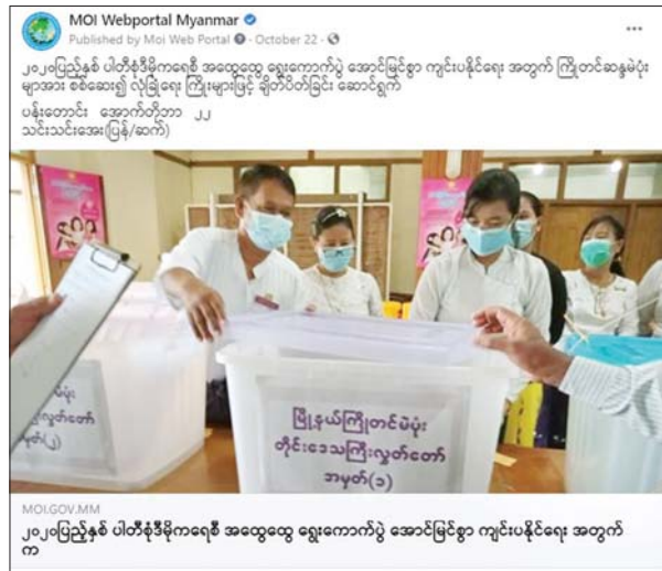
MOI Webportal ဖေ့ဘုတ်စာမျက်နှာတွင် ဖော်ပြခဲ့သည့် ၂၀၂၀ ပြည့်နှစ် ပါတီစုံဒီမိုကရေစီအထွေထွေ ရွေးကောက်ပွဲဆိုင်ရာ သတင်းနှင့် ဓာတ်ပုံများကို တွေ့ရစဉ်။

ပြည်သူ့ဆက်ဆံရေး ဦးစီးဌာနရုံးများက Facebook Pages ၄၃၅ ခုတွင် မိမိတို့ ဒေသအလိုက် ဆောင်ရွက်သည့် ရွေးကောက်ပွဲဆိုင်ရာ လှုပ်ရှားမှုများကို သတင်းရိုက်ကူးထုတ်လွှင့်မှု ၆၂၉၀ နှင့် MOI Website၊ MRTV နှင့် သတင်းစာတို့မှ ရွေးကောက်ပွဲဆိုင်ရာ ကြေညာချက်များကို ထပ်ဆင့်မျှဝေမှု ၂၆၇၆ ပုဒ်၊ စုစုပေါင်း ၃၃၀၅ ပုဒ်ကို ပြည်သူများသိရှိအောင် ဖော်ပြပေးခဲ့ပါသည်။ ထို့ပြင် ဒီမိုကရေစီကဏ္ဍမှလည်း ရွေးကောက်ပွဲဆိုင်ရာ အသိအမြင်ဆောင်းပါး ၂၂ ပုဒ်ကို ရေးသားဖော်ပြပေးခဲ့သည်။