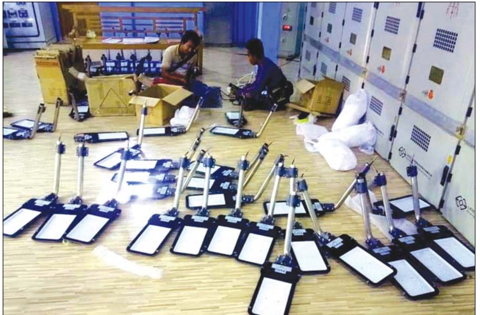
လမ်းမီးတိုင်များ၌ ပြောင်းလဲတပ်ဆင်ပေးသွားမည့် LED မီးသီးများ။