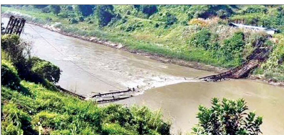
မန်စီမြို့များ၊ ရှမ်းပြည်နယ်နှင့် ကချင်ပြည်နယ်စပ် မန်စီရိုးကြီး အပါအဝင် ကျေးရွာများကို နေ့စဉ်ဖြတ်သန်းသွားလာကြရသည်။ လမ်းတံတားအထူးအဖွဲ့ (၄) ကကြိုးတံတားအသစ် တည်ဆောက်ပြီးစီးသည့် အချိန်၌ အဆိုပါကြိုးတံတားဟောင်းကို အသုံးမပြုတော့ဘဲ ၂၀၀၇-၂၀၀၈ ခုနှစ်ဘဏ္ဍာ

နမ့်ခမ်း နိုဝင်ဘာ ၂၃ ရှမ်းပြည်နယ်မြောက်ပိုင်း နမ့်ခမ်းမြို့၌ ဒုတိယကမ္ဘာစစ်ကာလ အင်္ဂလိပ်တို့က ၁၉၄၄ ခုနှစ်မှ စတင်တည်ဆောက်ခဲ့ပြီး ၁၉၄၇ ခုနှစ်တွင် ပြီးစီးခဲ့သော နမ့်ခမ်းမှ ဗန်းမော်သို့ ဆက်သွယ်သွားလာသည့် အလျား ၂၄၄ ပေ အနံ ၁၄ ပေရှိ ရွှေလီမြစ်ကူး ဘေးလီကြိုးတံတားသည် နိုဝင်ဘာ ၂၃ ရက် နံနက် ၁၁ နာရီ ၄၅ မိနစ်ခန့် ကျိုးကျသွားသည်။ (ယာပုံ) အဆိုပါကြိုးတံတားမှာ သံမဏိကြိုး တစ်ဖက်စီတွင် ခုနှစ်ချောင်း၊ နှစ်ဖက် ၁၄ ချောင်းဖြင့် ခံနိုင်ရည် သတ်မှတ်ထားပြီး ၁၉၈၉ ခုနှစ်က ပြန်လည်ပြုပြင်ခဲ့သည်။ ယခင်က ထိုတံတားကို အသုံးပြု၍ ဗန်းမော်၊