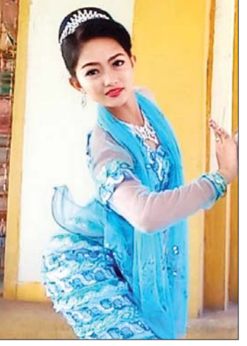
မဖြူဇင်ဦး ဒုတိယနှစ် မြန်မာစာ