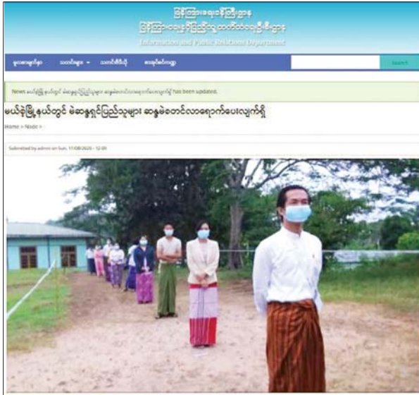
ပြန်ကြားရေးနှင့်ပြည်သူ့ဆက်ဆံရေးဦးစီးဌာန ဝက်ဘ်ဆိုက်တွင် ဖော်ပြခဲ့သည့် ၂၀၂၀ ပြည့်နှစ် အထွေထွေရွေးကောက်ပွဲနှင့်ပတ်သက်သည့်သတင်းများ။

ရွေးကောက်ပွဲများနှင့်ပတ်သက်၍ ဆရာကြီး မောင်စူးစမ်းက “ရွေးကောက်ပွဲကို နိုင်ငံရေးသို့ပညာရှင်တို့က နည်းသုံးနည်းဖြင့်ကြည့်သည်။ ပထမနည်းသည် Narrative Approval သဒ္ဒါကျမ်း “စံ”ဖြစ်သည်။ သဒ္ဒါ၌ ကတ္တားနှင့်ကံရှိရသကဲ့သို့ နိုင်ငံရေး၌လည်း ရွေးကောက်ပွဲရှိရမည်။ ရွေးကောက်ပွဲမရှိသော နိုင်ငံရေးသည် သဒ္ဒါမပီသပေ”ဟု ရေးခဲ့ဖူးသည်။