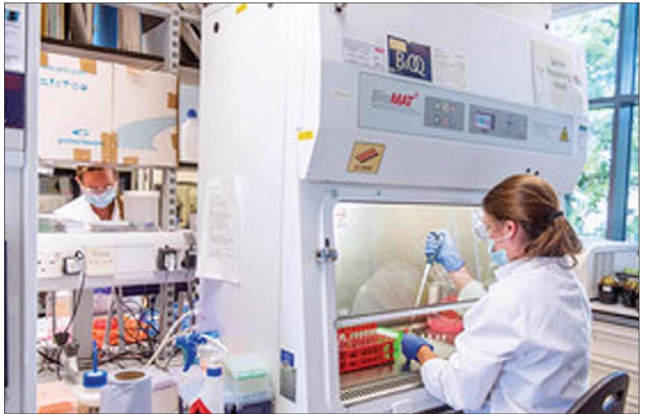
ကာကွယ်ဆေးအတွက် စမ်းသပ်မှုများ ပြုလုပ်နေကြစဉ်။

နောက်ထပ်ရရှိလာသည့် အချက်အလက်များကိုလည်း လုပ်ငန်းထိန်းသိမ်းသူအဖွဲ့အစည်းထံ တင်ပြသွားမည်ဟု ၎င်းက ဆက်လက်ပြောကြားသည်။ ဖိုက်စာနှင့် မော်ဒန်နာ ကာကွယ်ဆေးများက ၉၅ ရာခိုင်နှုန်း အကာအကွယ်ပေးသည်ဟု ကြေညာထားသည့်အတွက် ယခုတွေ့ရှိချက်မှာ အောင်မြင်မှုကဲ့သို့ အနည်းငယ်စိတ်မကျေနပ်စရာလည်း ဖြစ်သည်။ သို့သော်လည်း အောက်စဖို့ဒ်မှ ထုတ်လုပ်သည့်ဆေးသည် ဈေးချိုပြီး သိမ်းဆည်းရလွယ်ကူကာ ကမ္ဘာပေါ်ရှိ နေရာတိုင်းသို့ အလွယ်တကူ သယ်ဆောင်နိုင်ကြောင်း သိရသည်။ ဗြိတိန်အစိုးရသည် အဆိုပါကာကွယ်ဆေးကို သန်း ၁၀၀ မှာယူထားပြီး ပြည်သူ့ သန်းငါးဆယ်ကို ထိုးနှံပေးရန် လိုလောက်သည့် ပမာဏဖြစ်သည်။