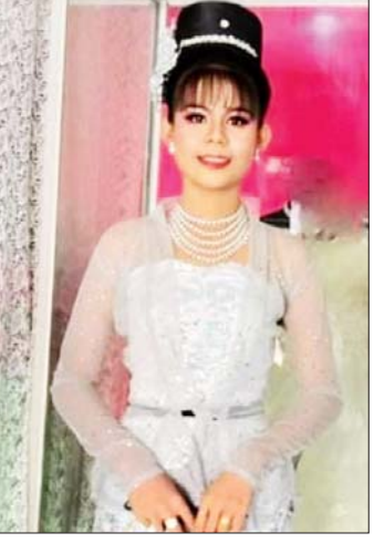
မပြည့်ပြည့်မွန် ဒုတိယနှစ် ပထဝီဝင်

မကြာမီ မြတ်တက္ကသိုလ်မှ “လှပတင့်ဆန်း မြတ်တက္ကသိုလ်ပန်း” အငြိမ့်အဖွဲ့၏ ဖျော်ဖြေတင်ဆက်မှုကို မြန်မာ့အသံနှင့် ရုပ်မြင်သံကြားတွင် ရိုက်ကူးထုတ်လွှင့်ရန် အတွက် ရန်ကုန်တက္ကသိုလ်စစ်ကိုင်းဆောင်၌ ဇာတ်တိုက်လေ့ကျင့်နေမှုကို မြန်မာ့သတင်းစဉ်မှ သွားရောက်တွေ့ဆုံမေးမြန်းထားပါသည်။