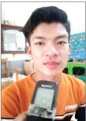
မောင်မင်းမောင်မောင် ပထမနှစ် ဂုဏ်ထူးတန်းမြန်မာစာ

စာမျက်နှာ ၂၂ မှ မြန်မာစာတတ်ထုပ်အနေနဲ့ ပါမယ်။ အငြိမ့်သမားစဉ်ရဲ့ သံချပ်လေးတွေ ရော စုံလင်စွာနဲ့ အကောင်းဆုံး ကြိုးစားထားပါတယ်။ ကျွန်တော်ရဲ့ တက္ကသိုလ်ကျောင်းသားဘဝမှာ မှတ်တိုင်တစ်ခုအနေနဲ့ ရာပြည့် တက္ကသိုလ်ပွဲတော်ကြီးမှာ ပါဝင် ဖျော်ဖြေခွင့်ရတဲ့အတွက် ဝမ်းသာ ဂုဏ်ယူမိပါတယ်။