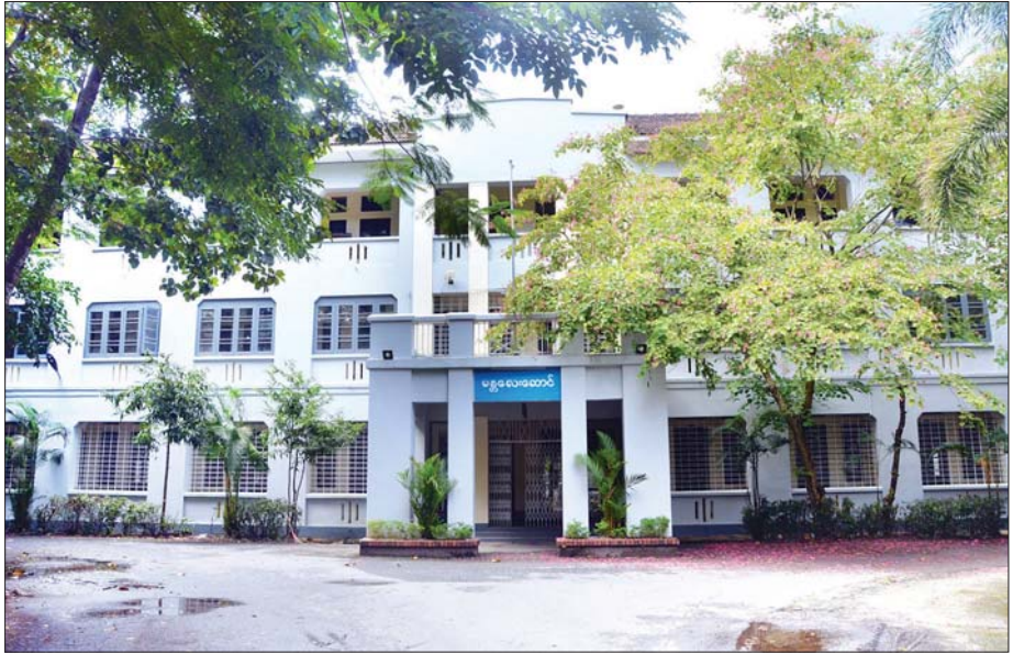
ရန်ကုန်တက္ကသိုလ်ရှိ မန္တလေးဆောင်။