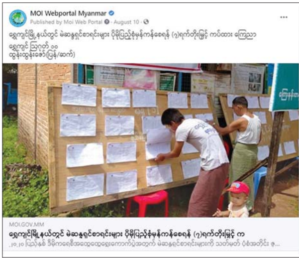
MOI Webportal ဖေ့ဘုတ်စာမျက်နှာတွင် ဖော်ပြခဲ့သည့် ၂၀၂၀ ပြည့်နှစ် ပါတီစုံဒီမိုကရေစီအထွေထွေ ရွေးကောက်ပွဲဆိုင်ရာ သတင်းနှင့် ဓာတ်ပုံများကို တွေ့ရစဉ်။

ရွေးကောက်ပွဲအကြံကုလဖြစ်သည့် ၂၀၂၀ မေလမှ နိုဝင်ဘာ ၇ ရက်နေ့အထိ MOI Website နှင့် MOI Facebook Page တို့တွင် တိုင်းဒေသကြီး၊ ပြည်နယ်၊ ခရိုင်၊ မြို့နယ်များက ဆောင်ရွက်နေသည့် ရွေးကောက်ပွဲဆိုင်ရာ လှုပ်ရှားဆောင်ရွက်မှု သတင်း ၃၃၀၇ ပုဒ်၊ သတင်းစီဒီယို ၁၁၇၀၊ MRTV နှင့် သတင်းစာများက ဖော်ပြသည့် သတင်းများကို ထပ်ဆင့်ဖော်ပြသည့်သတင်း ၁၁၈ ပုဒ်၊ ပြည်ထောင်စုရွေးကော်မရှင်က ထုတ်ပြန်ကြေညာချက် ၃၇ပုဒ်၊ စုစုပေါင်း ၄၆၃၂ ပုဒ်ကို ပြည်သူများ သိရှိစေရန် ဖော်ပြပေးခဲ့ပါသည်။ ထိုနည်းတူ တိုင်းဒေသကြီး၊ ပြည်နယ်၊ ခရိုင်၊ မြို့နယ် ပြန်ကြားရေးနှင့်