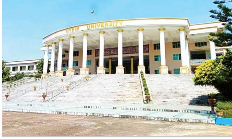
မြတ်တက္ကသိုလ်ကို တွေ့ရစဉ်။

အမည်နဲ့ ဖျော်ဖြေမှာပါ။ တက္ကသိုလ်ကျောင်းသားဖြစ်တဲ့အတွက် ဘယ်သူ့ကိုမှ မထိခိုက်ဘဲ ပုံမှန်ဟာသာ ပြက်လုံး ပြက်ကွက်လေးတွေကို လူရွှင်တော် ဆရာကြီး ဦးပေါက်ပွင့်က အနီးကပ်သင်ကြားပေးပြီး အကောင်းဆုံး ကြိုးစားထားပါတယ်။ ပြက်လုံးတွေအနေနဲ့ဆိုရင် အခုခေတ် ယဉ်ကျေးမှုနဲ့ ယခင်ယဉ်ကျေးမှု နှိုင်းယှဉ်ထားတာပါပဲ။