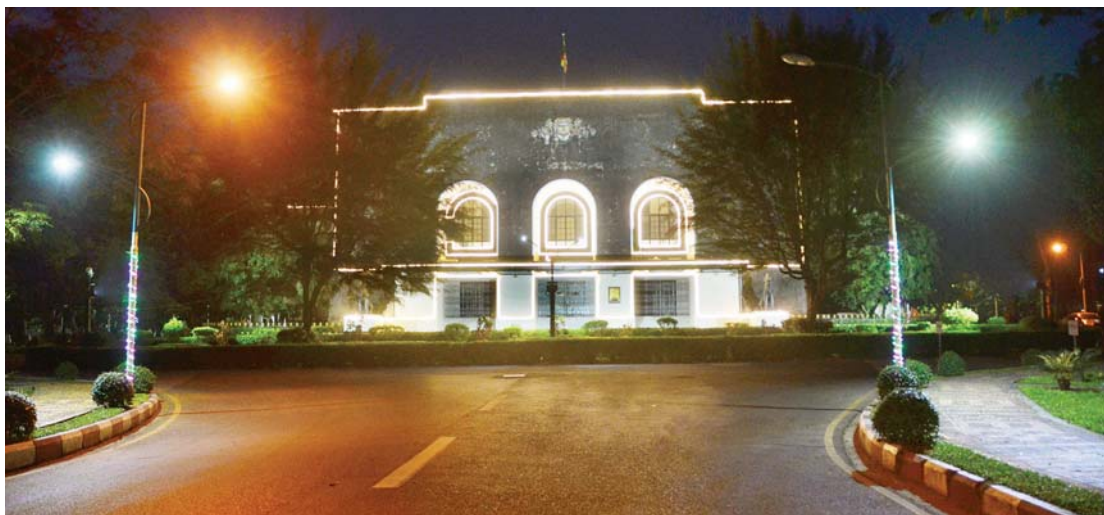
ရန်ကုန်တက္ကသိုလ် နှစ်တစ်ရာပြည့်အထိမ်းအမှတ်အဖြစ် မီးရောင်စုံထွန်းညှိထားသည့် ရန်ကုန်တက္ကသိုလ်ဘွဲ့နှင့်သဘင်ခန်းမကို တွေ့ရစဉ်။

ဒုတိယအကြိမ် တက္ကသိုလ်ကျောင်းသား ပြန်ဖြစ်ခြင်းမှာ တွက်ချက်ရေး ဒီပလိုမာ သင်တန်းတက်ရောက်ခြင်း ဖြစ်ပါသည်။ ကျွန်တော် ဗိုလ်သင်တန်းဆင်းပြီး ခြေလျင်