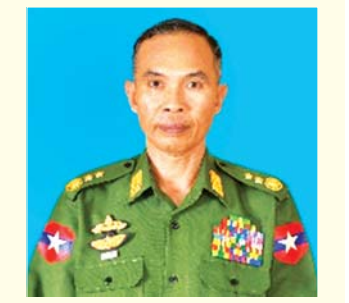
စာရေးသူ၏ အတ္ထုပ္ပတ္တိ အကျဉ်း