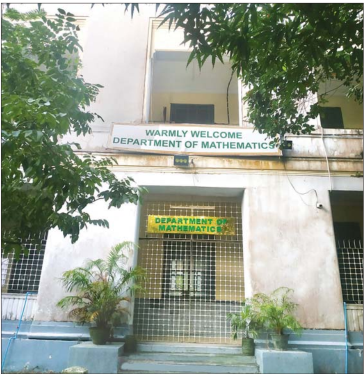
ရန်ကုန်တက္ကသိုလ်ရှိ သင်္ချာဌာန။

ကျွန်တော်တို့ ပထမနှစ် တက်ရသည့် ၁၉၅၂-၅၃ ကာလမှာ အေးချမ်းပျော်ရွှင်စွာ ပညာသင်ကြားရပြီး ဒုတိယနှစ်အရောက်တွင် အရေးအခင်းများ စတင်ကြုံတွေ့ရပါတော့သည်။ ကျွန်တော်တို့ ဒုတိယနှစ် ၁၉၅၄ ခုနှစ်တွင် အလုပ်သမားအရေးအခင်း စတင်ဖြစ်ပွားခဲ့ရာ ဆင်မလိုက်သင်္ဘောကျင်း၊ သမိုင်းချည်မျှင်နှင့် အထည်စက်တို့တွင် အလုပ်သမားများ ဆန္ဒပြမှုဖြစ်ပွားခဲ့ပါသည်။ တက္ကသိုလ်များ ပိတ်ခဲ့ရပြီး မိမိနေရပ်သို့ ပြန်ခဲ့ကြရပါသည်။ ကျွန်တော်တို့ တတိယနှစ်၊ ၁၉၅၅ ခုနှစ်တွင် ဦးသန့်အရေးအခင်း ဖြစ်ပါသည်။ ကုလသမဂ္ဂ အထွေထွေအတွင်းရေးမှူးချုပ် အဖြစ်မှ အနားယူခဲ့သော မြန်မာနိုင်ငံသား ဦးသန့်သည် အမေရိကန်ပြည်ထောင်စုတွင် ကွယ်လွန်ပြီး ကြွင်းကျန်သော ရုပ်ကလာပ်ကို ရန်ကုန်မြို့သို့ ပြန်လည်သယ်ယူလာရာ ဈာပနအခမ်းအနားကို ကျိုက္ကဆံကွင်းတွင် ကျင်းပရန် စီစဉ်ခဲ့ကြပါသည်။ ဈာပနကျင်းပမည့်နေ့တွင် ကျွန်တော်တို့ အပါအဝင် တက္ကသိုလ် ကျောင်းသား/ ကျောင်းသူများ၊ အခြား ကျောင်းသား/ ကျောင်းသူများ၊ အရပ်သူ/ အရပ်သားများ ကျိုက္ကဆံကွင်းသို့ လမ်းလျှောက် ချီတက်၍ သွားရောက်စုဝေးကြပါသည်။ အခမ်းအနားပြုလုပ်ပြီး အစီအစဉ်အရ ရုပ်ကလာပ်ကို ကြံတောသုသာန်သို့ ပို့ဆောင်သင်္ဂြိုဟ်ရန် ဖြစ်သော်လည်း ကျောင်းသားအချို့က ဦးသန့်သည် ကမ္ဘာသိ၊ မြန်မာ့ဂုဏ်ဆောင်တစ်ဦးဖြစ်သဖြင့် ကြံတောသုသာန်တွင် သာမန်လူကဲ့သို့ သင်္ဂြိုဟ်ရန်