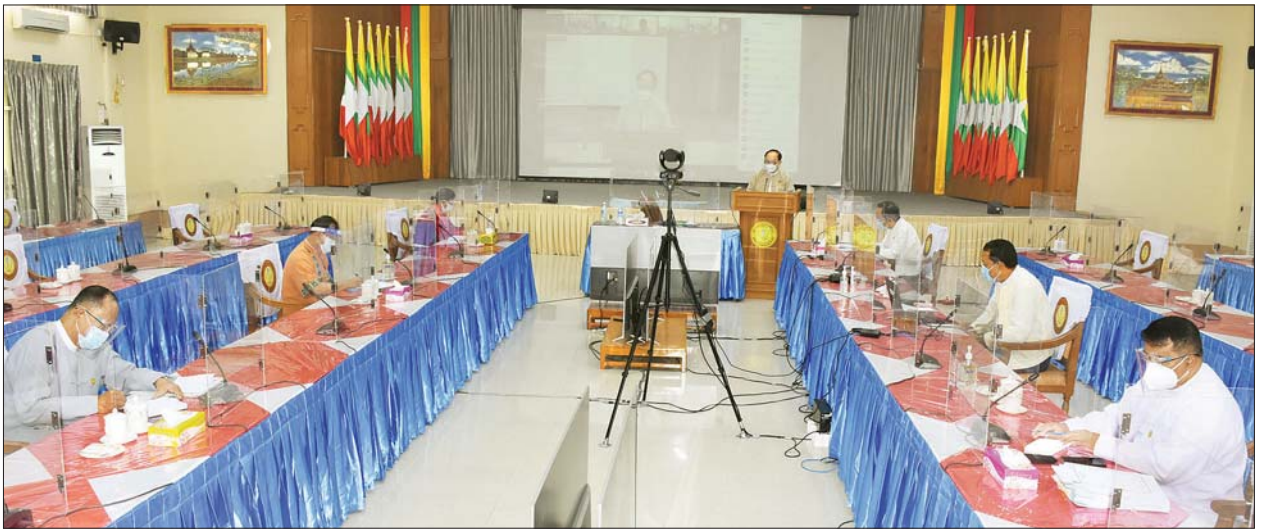
တိုင်းဒေသကြီး/ ပြည်နယ်အလိုက် ပါးစပ်နှင့်နှာခေါင်းစည်း မဖြစ်မနေတပ်ဆင်ရေး လူထုလှုပ်ရှားမှုစီမံချက် ဆောင်ရွက်မှုအခြေအနေများ သုံးသပ်ဆွေးနွေးပွဲသို့ ပြည်ထောင်စုဝန်ကြီး ဒေါက်တာမြင့်ထွေး တက်ရောက်ဆွေးနွေးစဉ်။