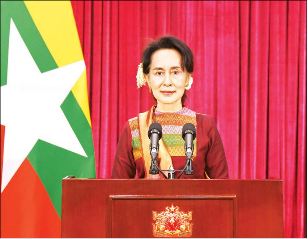
နိုင်ငံတော်၏အတိုင်ပင်ခံပုဂ္ဂိုလ် ဒေါ်အောင်ဆန်းစုကြည် ကိုဗစ် - ၁၉ ရောဂါဖြစ်ပွားမှု နောက်ဆုံးအခြေအနေနှင့်စပ်လျဉ်း၍ ပြည်သူ များသို့ အစီရင်ခံတင်ပြသည့်မိန့်ခွန်း ပြောကြားစဉ်။

“သတင်းစာဖတ်တယ်ဆိုရင် သတင်းစာထဲ မှာ ကြေညာချက်တွေအားလုံး ပါပါတယ်။ တရားဝင်ထုတ်ပြန်ထားတာ၊ ဌာနအသီးသီး က ထုတ်ပြန်ထားတာ၊ နောက်ပြီးတော့ ကျန်းမာရေးအထူးပြုပေါ့။ ကျန်းမာရေးနဲ့ အားကစားဝန်ကြီးဌာနက ထုတ်ပြန်ထားတဲ့ ဟာတွေ အဲဒါကြောင့် ကြည့်စေချင်ပါတယ်”