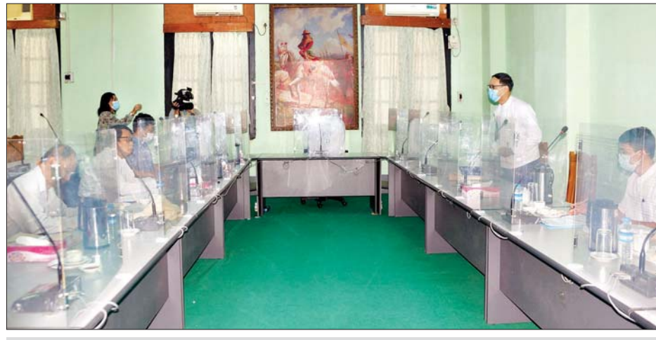
ရန်ကုန်တက္ကသိုလ် နှစ် (၁၀၀) ပြည့် အထိမ်းအမှတ်ဆောင်းပါး ဆုစိစစ်ရွေးချယ်ရေး အစည်းအဝေး ကျင်းပစဉ်။

ဖော်ဆောင်ပေးနေမှုများ၊ နိုင်ငံတကာ နှင့် ယှဉ်ပြိုင်နိုင်စွမ်းရှိသော တက္ကသိုလ် ကြီးတစ်ခု ပေါ်ပေါက်လာစေရန်နှင့် လူ့အဖွဲ့အစည်းနှင့် ကမ္ဘာကြီးကို အကျိုး ပြုနိုင်သော စွမ်းဆောင်ရည်ပြည့်ဝ သည့် နိုင်ငံတကာအဆင့်မီ တက္ကသိုလ် ကြီးတစ်ခု ဖြစ်ထွန်းပေါ်ပေါက်လာရန် ကြိုးပမ်း ဆောင်ရွက်နေမှုများကို ရေးသားယှဉ်ပြိုင်ရန် ၂၀၂၀ ပြည့်နှစ် အောက်တိုဘာ ၁၉ ရက်မှ နိုဝင်ဘာ ၁၆ ရက်အထိ ဖိတ်ခေါ်ခဲ့ရာ ဆောင်းပါး ပြိုင်ပွဲတွင် ပြိုင်ပွဲဝင်သူ ၆၄ ဦးတို့က ပြိုင်ပွဲဝင်ဆောင်းပါး ၆၄ ပုဒ်ကိုလည်း ကောင်း၊ ဝတ္ထုတို ပြိုင်ပွဲတွင် ပြိုင်ပွဲဝင် ၄၁ ဦးက ပြိုင်ပွဲဝင်ဝတ္ထုတို ၄၁ ပုဒ်ကို လည်းကောင်း အသီးသီးပဝင်ယှဉ်ပြိုင် ခဲ့ကြသည်။