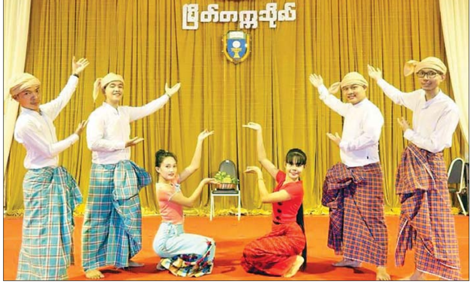
မြတ်တက္ကသိုလ်မှ “လှပတင့်ဆန်း မြတ်တက္ကသိုလ်ပန်း” အငြိမ့်အဖွဲ့၏ ဖျော်ဖြေတင်ဆက်မှုကို တွေ့ရစဉ်။