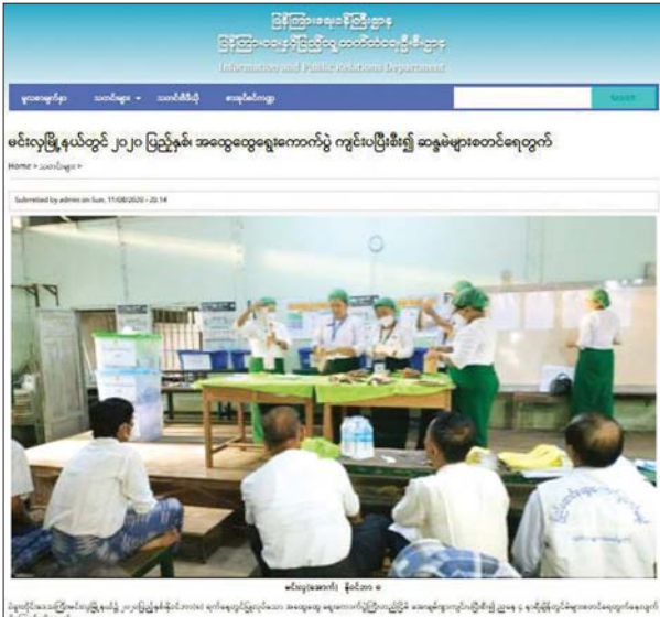
ပြန်ကြားရေးနှင့်ပြည်သူ့ဆက်ဆံရေးဦးစီးဌာန ဝက်ဘ်ဆိုက်တွင် ဖော်ပြခဲ့သည့် ၂၀၂၀ ပြည့်နှစ် အထွေထွေရွေးကောက်ပွဲနှင့်ပတ်သက်သည့်သတင်းများ။

“ယခုကျင်းပပြီးစီးခဲ့သည့် ရွေးကောက်ပွဲကြီးတွင် မြန်မာနိုင်ငံတစ်ဝန်းရှိ ပြန်ကြားရေးနှင့် ပြည်သူ့ဆက်ဆံရေးဦးစီးဌာနမှ ဝန်ထမ်း ၆၄၇ ဦးက သတင်း / မှတ်တမ်းဓာတ်ပုံများ ရိုက်ကူးဆောင်ရွက် ပေးခဲ့ကြပြီး အရာထမ်း / အမှုထမ်း ၈၇၀ က ရွေးကောက်ပွဲကော်မရှင်အဆင့်ဆင့်တွင် ပါဝင်ကူညီ ဆောင်ရွက်ပေးခဲ့သည့်အတွက် စုစုပေါင်း အရာထမ်း / အမှုထမ်း ၁၅၁၇ ဦးခန့်က ရွေးကောက်ပွဲ ကြီးအောင်မြင်စွာကျင်းပပြီးစီးနိုင်ရန် ပေးအပ်သည့်တာဝန်ကို ကျရာကဏ္ဍမှ ပါဝင်ဆောင်ရွက်ခဲ့”