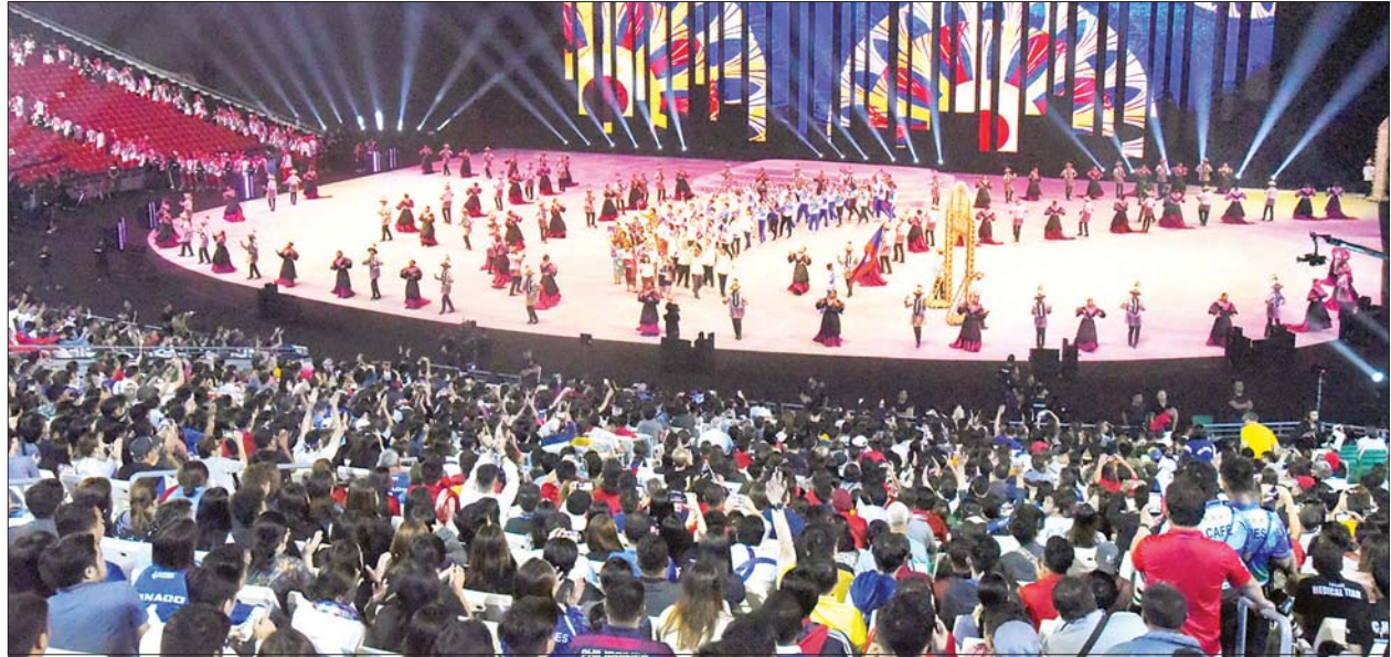
၂၀၁၉ ဆီးဂိမ်းပြိုင်ပွဲ ဖွင့်ပွဲအခမ်းအနား ကျင်းပနေစဉ်။