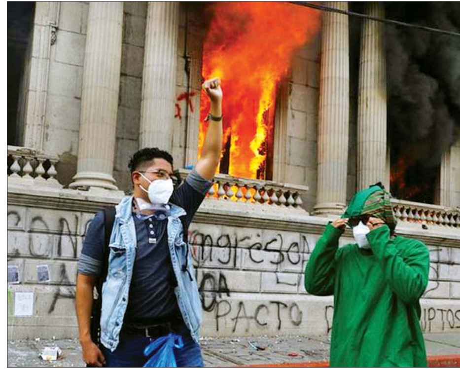
ဂြိုဟ်မာလာ၌ လွှတ်တော်အဆောက်အအုံကို မီးရှို့ရန်ကြိုးပမ်းခဲ့သည့် ဆန္ဒပြသူအချို့ကို တွေ့ရစဉ်။

များက ကြားဖြတ်ဟန့်တားခဲ့ရသည်။ မီးသတ်တပ်ဖွဲ့က ဖော်ပြခဲ့သည့် မှတ်တမ်းပုံများတွင် လွှတ်တော် အဆောက်အအုံအချို့၏ ပရိဘောဂ ပစ္စည်းများ မီးလောင်နေသည်ကို တွေ့ရသည်။ ဂြိုဟ်မာလာ သမ္မတ အလီဂျန်ဒရီ ဝီယာမက်တီက ၎င်း၏တွစ်တာ အကောင့်မှတစ်ဆင့် ဆန္ဒပြသူများ၏ အကြမ်းဖက်လုပ်ရပ်အပေါ် ပြင်းပြင်း ထန်ထန်ဝေဖန်ရှုတ်ချခဲ့သည်။ ဥပဒေနှင့်အညီ ဆန္ဒဖော်ထုတ်ခွင့် ရှိသည်ကို မပြောလိုသော်လည်း ယင်းကဲ့သို့ အများပြည်သူဆိုင်ရာ အဆောက်အအုံများကို ဖျက်လိုဖျက် ဆီးလုပ်ဆောင်သည့် စည်းကမ်းမဲ့ လုပ်ရပ်မျိုးကို လက်မခံနိုင်ကြောင်း၊ လွှတ်တော်အဆောက်အအုံကို မီးရှို့ ရန်ကြိုးပမ်းရာတွင် ပါဝင်ခဲ့သူမှန်သမျှ ကို ဥပဒေအတိုင်း ပြစ်ဒဏ်ပေးအရေး ယူသွားမည်ဖြစ်ကြောင်း ၎င်းက ပြော ကြားခဲ့သည်။ ဂြိုဟ်မာလာ၌ ကျန်းမာရေး စောင့်ရှောက်မှုနှင့် ပညာရေးဆိုင်ရာ အသုံးစရိတ်ကို လျှော့ချလိုက်သည့် ၂၀၂၁ ခုနှစ် အသုံးစရိတ်ဥပဒေကို အတည်ပြုလိုက်သည့်အတွက် နိုင်ငံ ရေးဆိုင်ရာ တင်းမာမှုများ မြင့်တက် လျက်ရှိသည်။ အေအက်ဖ်ပီ