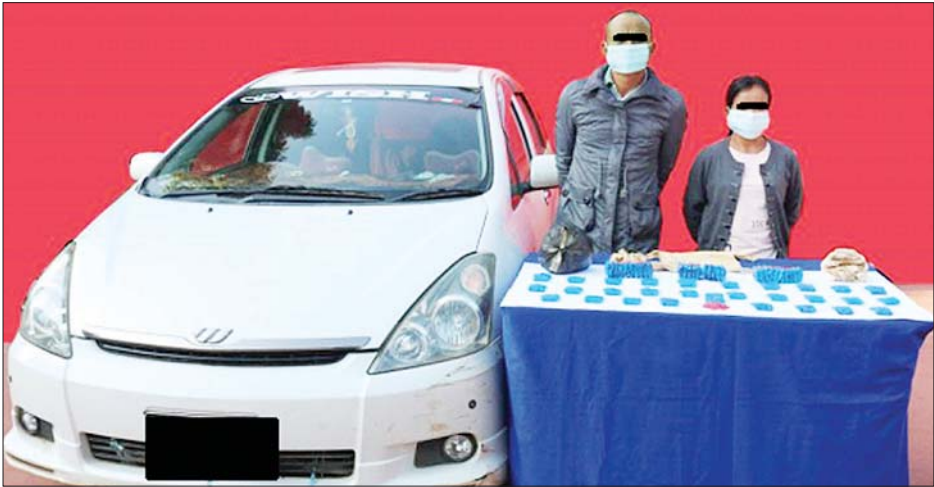
အိုက်ရီနှင့် မအေးညွန့်တို့အား သိမ်းဆည်းရမိသည့် မူးယစ်ဆေးဝါးများနှင့်အတူ တွေ့ရစဉ်။

နေပြည်တော် နိုဝင်ဘာ ၂၂ မူးယစ်ဆေးဝါး တားဆီးနှိမ်နင်းရေး ရဲတပ်ဖွဲ့မှ တပ်ဖွဲ့ဝင်များသည် နိုဝင်ဘာ ၂၁ ရက် ညနေ ၅ နာရီက ဖယ်ခွံမြို့နယ် လွယ်ပေါ - နားဟီး ကျေးရွာသွားကားလမ်း နားဟီး ကျေးရွာ လွယ်မိန်းခူတောင် (ဒေသ အခေါ်)အနီးတွင် ကော်ပိုးထမ်းလာ သည့် အမျိုးသားတစ်ဦးအား မသင်္ကာ ဖွယ်တွေ့ရှိသဖြင့် စစ်ဆေးရန် ရပ်တန့် ခိုင်းစဉ် ကော်ပိုးအားပစ်ချ၍ ပြောင်းခင်း အတွင်း ထွက်ပြေးလွတ်မြောက် သွားသဖြင့် ကော်ပိုးအား စစ်ဆေးရာ ဘိန်းစိမ်း ၁၄ ကီလိုလိုလည်းကောင်း၊ အလားတူ ယင်းနေ့နံနက် ၇ နာရီခွဲ တွင် မူးယစ်ဆေးဝါး တားဆီးနှိမ်နင်း ရေး ရဲတပ်ဖွဲ့မှ တပ်ဖွဲ့ဝင်များသည် လားရှိုးမြို့နယ် လားရှိုး - မိုင်းယော် သွားလမ်း အေတီတံတားအနီးတွင်