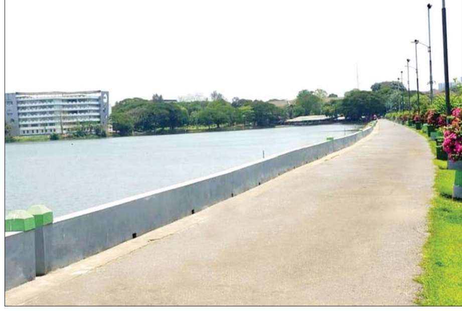
တက္ကသိုလ် ကျောင်းတော်သူ ကျောင်းတော်သားများ ခြေရာချင်းထပ်ခဲ့ရာ အင်းလျားကန်သာ။