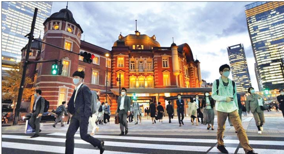
တိုကျိုမြို့တွင် ပါးစပ်နာခေါင်းစည်းဝတ်ဆင်ကာ သွားလာနေကြသူများကို တွေ့ရစဉ်။

နိုဝင်ဘာ ၂၁ ရက်တွင် တစ်နိုင်ငံလုံးအနှံ့ ကူးစက်ခံရသူ ပေါင်း ၂၅၉၂ ဦး ရှိပြီး စုစုပေါင်းသေဆုံးသူဦးရေမှာလည်း ၁၉၉၄ ဦး အထိရှိလာကြောင်း သိရသည်။ ကျိုးခဲ့