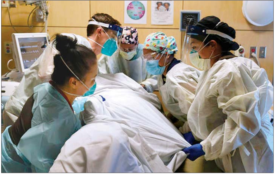
ကယ်လီဖိုးနီးယားပြည်နယ်ရှိ ဆေးရုံတစ်ရုံတွင် ကျန်းမာရေးဝန်ထမ်းများက ကိုဗစ်-၁၉ လူနာကို ကုသမှုဆောင်ရွက် နေစဉ်။

သေဆုံးသူ ၂၀၀၀ ကျော်ခဲ့ကြောင်း သိရသည်။ တစ်နိုင်ငံလုံး ရောဂါကူးစက်ဖြစ်ပွားသူ ၁၂ သန်းကျော်အထိ ရှိလာ ခဲ့သည့်အပြင် သေဆုံးသူအရေအတွက် စုစုပေါင်း ၂၅၅၀၀၀ ကျော်အထိရှိကြောင်း ဂျွန်ဟော့ကင်းတက္ကသိုလ်က ဖော်ပြ သည်။ ကယ်လီဖိုးနီးယားပြည်နယ်တွင် ပြီးခဲ့သည့် ရက်သတ္တပတ်က ရောဂါကူးစက်ဖြစ်ပွားသူအရေအတွက် စုစုပေါင်း တစ်သန်းရှိခဲ့သည်။ အသစ်ထုတ်ပြန်လိုက်သည့် အမိန့်အရပြည်နယ်အတွင်း နိုဝင်ဘာ ၂၁ ရက်မှ စတင်ကာ ဒီဇင်ဘာ ၂၁ ရက်အထိ ညအချိန်အပြင်ထွက်ခွင့် ပိတ်ပင် ထားပြီး လိုအပ်လာလျှင် အချိန်ထပ်တိုးမည်ဖြစ်ကြောင်း ပြည်နယ်အာဏာပိုင်များက ပြောကြားခဲ့သည်။ အေအက်ဖ်ပီ