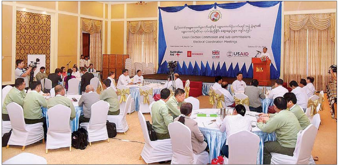
ရွေးကောက်ပွဲဆိုင်ရာလုပ်ငန်းညှိနှိုင်းဆွေးနွေးပွဲများ ကျင်းပခြင်းကို ထုတ်လွှင့်ခဲ့မှု။