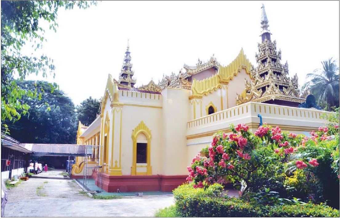
ရန်ကုန်တက္ကသိုလ်မွေ့ရုံကို ပြုပြင်မွမ်းမံမှုများအပြီး တွေ့ရစဉ်။

ရန်ကုန်တက္ကသိုလ်သို့ ရောက်ရှိလာခြင်း ထိုစဉ်က အခြေခံသိပ္ပံပညာချွန်ဆုအဖြစ် သင်္ချာ၊ ရူပဗေဒနှင့် ဓာတုဗေဒဘာသာရပ် သုံးခုကို ချီးမြှင့်ပြီး သတ်မှတ်ချက်မှာ ယင်းသုံးဘာသာ ဂုဏ်ထူးရရှိရမည့်အပြင် အဓိကယူမည့် ဘာသာရပ်၌ အမှတ် ၉၀ ကျော်လွန်ရမည်ဖြစ်သည်။ ကျွန်တော်က လေးဘာသာဂုဏ်ထူးဖြင့် အောင်မြင်ခဲ့ပြီး သင်္ချာနှင့် ရူပဗေဒဘာသာရပ်တို့၌ အမှတ် ၉၀ ကျော်သောကြောင့် အခြေခံသိပ္ပံပညာချွန်ဆု(သင်္ချာ)နှင့် (ရူပဗေဒ) တို့ကို ပထမနှင့် ဒုတိယဦးစားပေးအဖြစ် တက္ကသိုလ်ဝင်ခွင့် လျှောက်ထားခဲ့ပါသည်။ တက္ကသိုလ်ဝင်ခွင့် အကြောင်းပြန်ကြားရာတွင် သင်္ချာဘာသာ