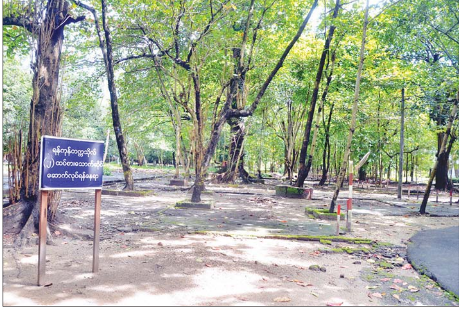
ယခင်က ဦးချစ် လက်ဖက်ရည်ဆိုင် ရှိခဲ့ရာနေရာ။