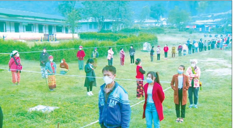
နိုဝင်ဘာ ၈ ရက်က ၂၀၂၀ ပြည့်နှစ် အထွေထွေရွေးကောက်ပွဲတွင် မဲဆန္ဒရှင်များ ဆန္ဒမဲပေးမှုကို အချိန်နှင့် တစ်ပြေးညီ ထုတ်လွှင့်ပြသခဲ့စဉ်။

ပွဲကြီးကို ရွေးကောက်ပွဲအကြိုကာလမှသည် ရွေးကောက်ပွဲကြီးပျော်နဲ့ ရွေးကောက်ပွဲကြီးစီးချိန်အထိ မြန်မာ့အသံနှင့် ရုပ်မြင်သံကြားမှ သတင်းအချက်အလက်များနဲ့အတူ အသိပညာပေးအစီအစဉ်တွေနဲ့ ဖျော်ဖြေရေးအစီအစဉ်တွေကို ပြည်သူ့အတွက် ဂုဏ်ယူစွာ တင်ဆက်ခဲ့ခြင်းဖြစ်ပါတယ်။