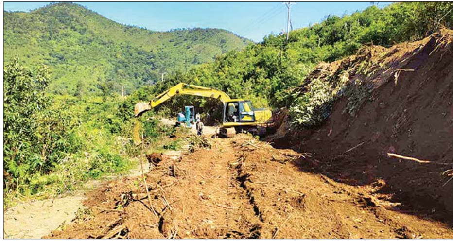
လမ်းကို ၂၀၂၀-၂၀၂၁ ဘဏ္ဍာရေးနှစ် ဖြင့် ၅ မိုင် ၄ ဖာလုံ မြေလမ်းချဲ့ခြင်း၊ နယ်စပ်ဒေသဖွံ့ဖြိုးရေး (ပြည်ထောင်စု) ရေနယ်မြေခြင်း ပြန်လည်တူးဖော်ခြင်း၊ ရန်ပုံငွေကျပ် ၂၀၃ ဒသမ ၂၆၇ သန်း လုပ်ငန်းနှင့် အဆိုပါလမ်းပေါ်တွင် လိုအပ်သော (၄x၄x၂၆) ပေ ရေပြန် တံတား ၁၁ စင်း တည်ဆောက်ခြင်း၊ လုပ်ငန်းများ ဆောင်ရွက်နိုင်ရေး

ဖရူဆို နိုဝင်ဘာ ၂၂ နယ်စပ်ရေးရာဝန်ကြီးဌာန နယ်စပ် ဒေသနှင့် တိုင်းရင်းသားလူမျိုးများ ဖွံ့ဖြိုးတိုးတက်ရေးဦးစီးဌာနသည် နယ်စပ်ဒေသ ဖွံ့ဖြိုးတိုးတက်ရေး အတွက် အခြေခံအကျဆုံးဖြစ်သည့် လမ်းပန်းဆက်သွယ်ရေး ကဏ္ဍကို အဓိကထား ဦးစားပေးဆောင်ရွက် ပေးလျက်ရှိရာ ကယားပြည်နယ် ဖရူဆိုမြို့နယ် အနောက်ဘက်ခြမ်း ဟိုယာကျေးရွာအုပ်စု ဒိုမိုဆိုကျေးရွာ နှင့် ရှမ်းပြည်နယ်တောင်ပိုင်း ဖယ်ခုံ မြို့နယ် ဘီသူး(အထက်) ကျေးရွာတို့ ဆက်သွယ်သည့် ပြည်နယ်ချင်းဆက် လမ်း ဖောက်လုပ်လျက်ရှိသည်။ ကွင်းဆင်းစစ်ဆေးပြီးဖြစ် အဆိုပါ ပြည်နယ်ချင်းဆက်