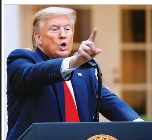
အမေရိကန်သမ္မတ ဒေါက်တာထရမ်။