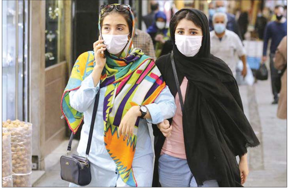
တီဟီရန်မြို့ တက်ဂျီ ရစ်ဈေးအတွင်း သွားလာနေကြသူများကို တွေ့ရစဉ်။