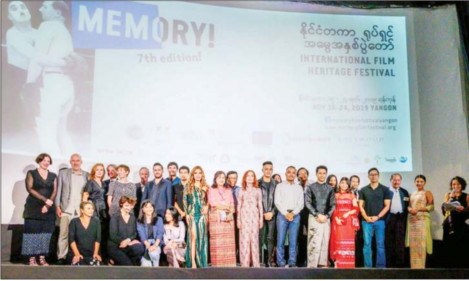
အရှိဆုံးသော နိုင်ငံတကာရုပ်ရှင် ပွဲတော်များမှ ပညာရှင်များကိုဖိတ်ခေါ်ပြီး နှစ်စဉ်နှစ်တိုင်း ပိုမိုအင်အား ကောင်းလာသော Myanmar Script Fund (MSF) ကို အစဉ်အလာမပြတ် ဆက်လက်ပံ့ပိုး ကျင်းပသွားမည် ဖြစ်သည်။ “MSF ကို (၄)ကြိမ်မြောက် ကျင်းပပြီးတဲ့အခါမှာတော့ MSF ဟာ

ယခုနှစ်တွင် MEMORY ပွဲတော် အနေဖြင့် ကျန်းမာရေး အကျပ် အတည်းများကြောင့် MEMORY နိုင်ငံတကာ ရုပ်ရှင်ပွဲတော်ကဏ္ဍ၏ တစ်စိတ်တစ်ပိုင်း ဖြစ်သော လူအများ စုဝေး၍ ရုပ်ရှင်များပြသခြင်းကို ကျင်းပပြုလုပ်နိုင်တော့မည် မဟုတ်ဘဲ အခြေအနေပေါ် မူတည်၍ ၂၀၂၁ ခုနှစ်တွင်သာ ပြန်လည်ပြုလုပ်နိုင်ရန် စီစဉ်ထားသည်။ သို့သော် MEMORY ပွဲတော်အနေဖြင့် ၂၀၂၀ ပြည့်နှစ်တွင် ကျင်းပခဲ့သော နိုင်ငံတကာရုပ်ရှင်ပွဲတော်များကို နမူနာယူ၍ ဂုဏ်သရေ