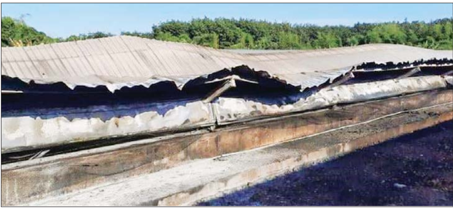
မီးလောင်မှုဖြစ်ပွားသည့် ကြက်ခြံကို တွေ့ရစဉ်။

မှော်ဘီမြို့မရဲစခန်းက အမှုဖွင့်အရေး ယူထားကြောင်း သိရသည်။ သတင်းနှင့် ဓာတ်ပုံ- မျိုးကြီး