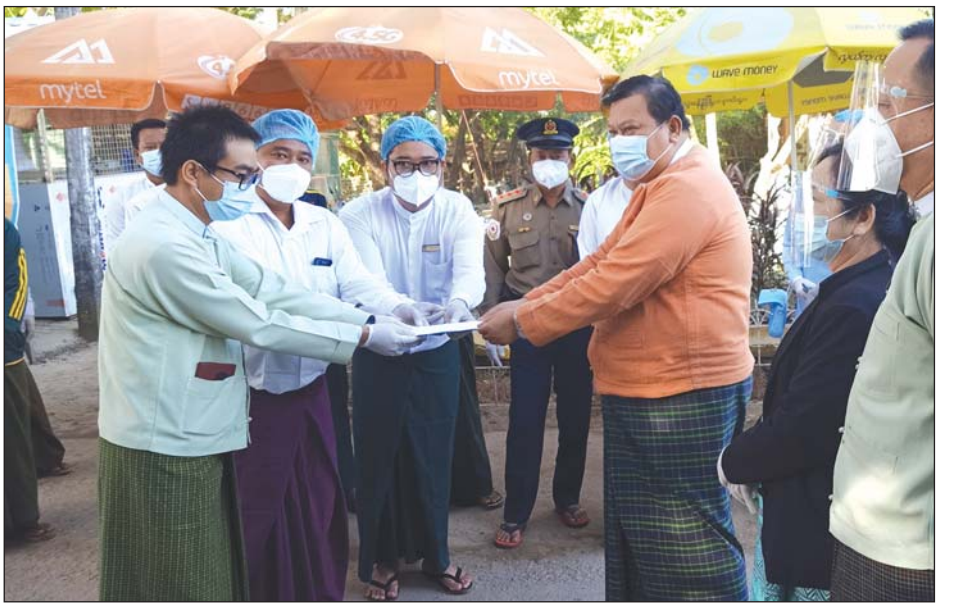
တိုင်းဒေသကြီးဝန်ကြီးချုပ် ဦးလှဝင်းအောင်က စစ်ဆေးရေးဂိတ်အတွက် ထောက်ပံ့ငွေကျပ်ငါးသိန်း ပေးအပ်နေစဉ်

ပန်းတနော် နိုဝင်ဘာ ၂၂ ဧရာဝတီတိုင်းဒေသကြီး မအူပင်ခရိုင် ပန်းတနော်မြို့နယ်၌ ကိုဗစ်-၁၉ ရောဂါ ကာကွယ်တားဆီးရေးအတွက် မြို့ အဝင်အထွက်ကိတ်၌ စစ်ဆေးရေး လုပ်ငန်းများ ဆောင်ရွက်လျက်ရှိရာ နိုဝင်ဘာ ၂၂ ရက်တွင် အဆိုပါ စစ်ဆေး ရေးဂိတ်ကို တိုင်းဒေသကြီးဝန်ကြီးချုပ် ဦးလှဝင်းအောင်နှင့် တာဝန်ရှိသူများက ကြည့်ရှုအားပေး၍ ထောက်ပံ့ငွေများ ပေးအပ်သည်။