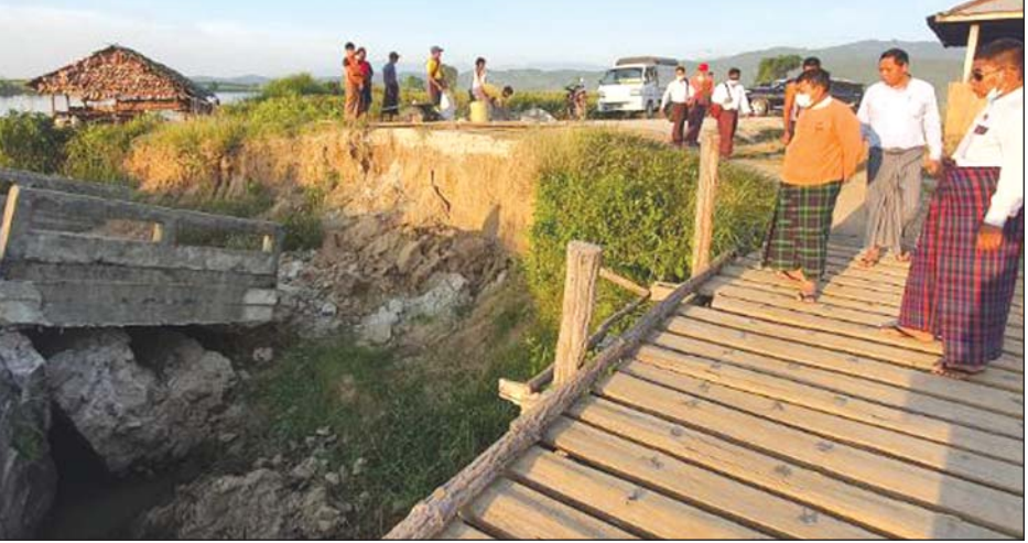
သဘာဝဘေးကြောင့် ပျက်စီးခဲ့သည့်တံတားကို တိုင်းဒေသကြီးဝန်ကြီးချုပ် ဦးဝင်းသိန်း ကြည့်ရှုစစ်ဆေးစဉ်။

တွင် ကျောက်ရောမြေခင်းခြင်းလုပ်ငန်း များ ဆောင်ရွက်ပြီးစီးမှု အခြေအနေ များကို ကြည့်ရှုစစ်ဆေးခဲ့ခြင်းဖြစ်ပြီး သက်ဆိုင်ရာ တာဝန်ရှိသူများက လုပ်ငန်းဆောင်ရွက်မှု အခြေအနေကို ရှင်းလင်းတင်ပြ၍ ဝန်ကြီးချုပ်က လိုအပ်သည်များကို မှာကြားခဲ့ သည်။