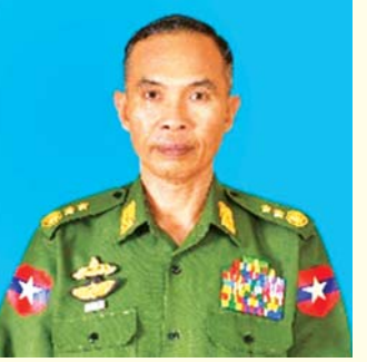
စာရေးသူ၏ အတ္ထုပ္ပတ္တိ အကျဉ်း