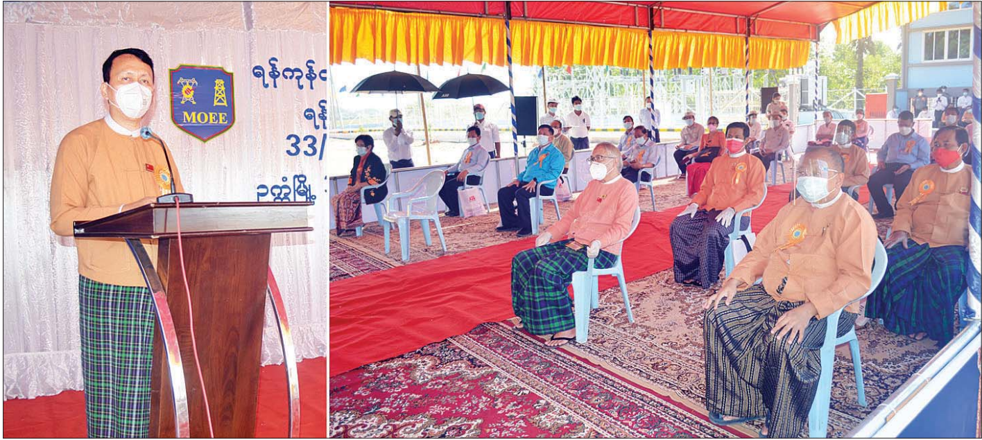
ရန်ကုန်တိုင်းဒေသကြီး ဝန်ကြီးချုပ် ဦးမြိုးမင်းသိန်း ရန်ကုန်တိုင်းဒေသကြီး တိုက်ကြီးမြို့နယ် ၃၃/၁၁ KV, ၅ MVA သိမ်ကုန်းဓာတ်အားခွဲရုံပွဲတွင် အမှာစကားပြောကြားစဉ်။

ယခုကဲ့သို့ ဓာတ်အားခွဲရုံများ တိုးချဲ့တည်ဆောက်ပေးနိုင်ခဲ့ခြင်းဖြင့် ကျေးရွာပေါင်း ၁၂ ရွာ၊ အိမ်ထောင်စုပေါင်း ၈၀၀ ကျော်မှာ တည်ငြိမ်ပြည့်ဝသည့် လျှပ်စစ် ဓာတ်အားကို တိုးမြှင့်သုံးစွဲလာနိုင်မည်ဖြစ်ကြောင်း၊ ယနေ့အထိ မြောက်ပိုင်း ခရိုင်အတွင်း 33/11 KV, 5 MVA ဓာတ်အားခွဲရုံသစ် စုစုပေါင်း ခြောက်ရုံကို အောင်မြင်စွာ ဖွင့်လှစ်ပေးနိုင်ခဲ့ပြီဖြစ်ကြောင်း၊ ရန်ကုန်တိုင်းဒေသကြီးအစိုးရအဖွဲ့နှင့် လျှပ်စစ်နှင့် စွမ်းအင် ဝန်ကြီးဌာန၊ ရန်ကုန်လျှပ်စစ်ဓာတ်အားပေးရေး ကော်ပိုရေးရှင်းတို့ ပူးပေါင်းပြီး မိမိတို့၏ ရည်မှန်းချက်ဖြစ်သည့် ပြည်သူများနှင့် စက်မှုလက်မှုလုပ်ငန်းများတွင် လျှပ်စစ် ဓာတ်အား ပြည့်ဝစွာသုံးစွဲနိုင်ရေးအတွက် ဓာတ်အားပေးခွဲရုံများ၊ ဓာတ်အားလိုင်းများ၊ ဓာတ်အားခွဲရုံများ တည်ဆောက်၍ ဓာတ်အားဖြန့်ဖြူးပေးနိုင်ရေးအတွက် ဆောင်ရွက်လျက် ရှိပါကြောင်း၊ ရန်ကုန်တိုင်းဒေသကြီးအတွင်းရှိ ကျေးလက် ဒေသများသို့ လျှပ်စစ်ဓာတ်အားရရှိရေး ဆောင်ရွက် လျက်ရှိရာ ၂၀၂၀ ပြည့်နှစ် ဒီဇင်ဘာလကုန်တွင် ရန်ကုန်