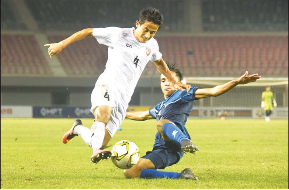
မြန်မာ့လက်ရွေးစင်အသင်းနှင့် နီပေါလက်ရွေးစင်အသင်းတို့ ၂၀၁၉ ခုနှစ်က ခြေစမ်းပွဲကစားနေစဉ်။

ရန်ကုန် နိုဝင်ဘာ ၂၂ လာမည့်နှစ်တွင် နိုင်ငံတကာပြိုင်ပွဲများ ယှဉ်ပြိုင်ကစားရမည့် မြန်မာ့လက်ရွေးစင်အသင်းသည် နိုင်ငံတကာခြေစမ်းပွဲများ ကစားခွင့်ရရန် ကြိုးပမ်းလျက်ရှိသည်။ မြန်မာ့လက်ရွေးစင်အသင်းသည် ၂၀၂၁ ခုနှစ် မတ်လမှ ဇွန်လအထိ နိုင်ငံတကာပြိုင်ပွဲများ ဆက်တိုက်ယှဉ်ပြိုင်ရမည် ဖြစ်သည်။