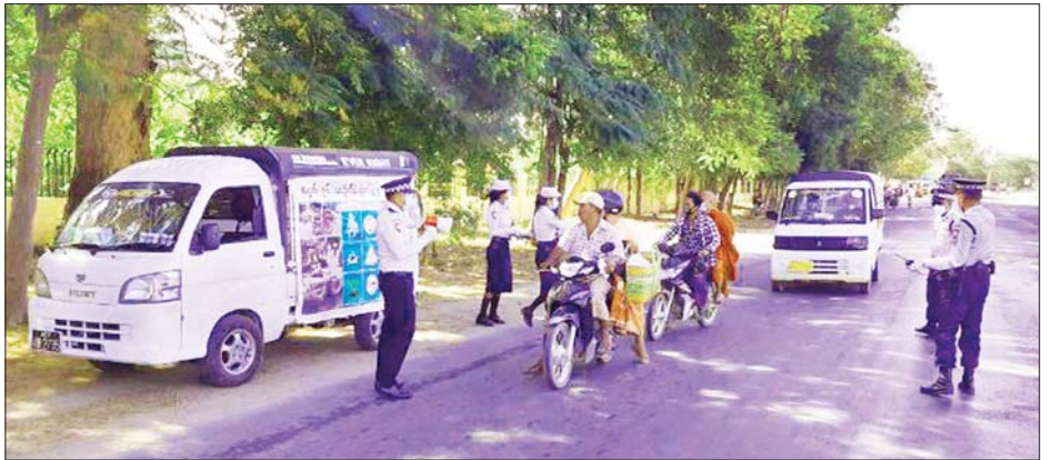
(မိတ္ထီလာ)ခုရဲမှူး ရန်နိုင်ထံမှ သိရသည်။ မိတ္ထီလာမြို့နယ်တွင် အမှတ်(၉၆) ယာဉ်ထိန်းရဲတပ်ဖွဲ့စုမှ ယာဉ် စည်းကမ်း၊ လမ်းစည်းကမ်း အသိ ပညာပေးခြင်းနှင့် စည်းကမ်းပျက် ယာဉ်များအား ဖမ်းဆီးအရေးယူမှု

ပြည်သူများ၊ ကျောင်းသား ကျောင်းသူ များအား ယာဉ်စည်းကမ်း၊ လမ်း စည်းကမ်း အသိပညာပေးခြင်းနှင့် စည်းကမ်းပျက်ယာဉ်များအား ဖမ်းဆီး အရေးယူခြင်း လုပ်ငန်းများကို ဆောင်ရွက်လျက်ရှိရာ ကိုဗစ်-၁၉ ရောဂါဖြစ်ပွားခဲ့သည့်အတွက် ၎င်း လုပ်ငန်းများကို ယာယီရပ်နားထား လျက်ရှိသည်။ ထိုသို့ ယာယီရပ်နား ထားချိန်တွင် ယာဉ်တိုက်မှုများ များပြားလာသည့်အတွက် ယာဉ် အန္တရာယ်ဖြစ်ပွားမှု လျော့နည်းလာ စေရန် ယာဉ်စည်းကမ်း၊ လမ်း စည်းကမ်း အသိပညာပေးခြင်းနှင့် စည်းကမ်းပျက်ယာဉ်များကို နိုဝင်ဘာ ၉ ရက်မှစတင်၍ အပတ်စဉ် တနင်္ဂနွေ နေ့တိုင်း လူစည်ကားရာ နေရာ များ