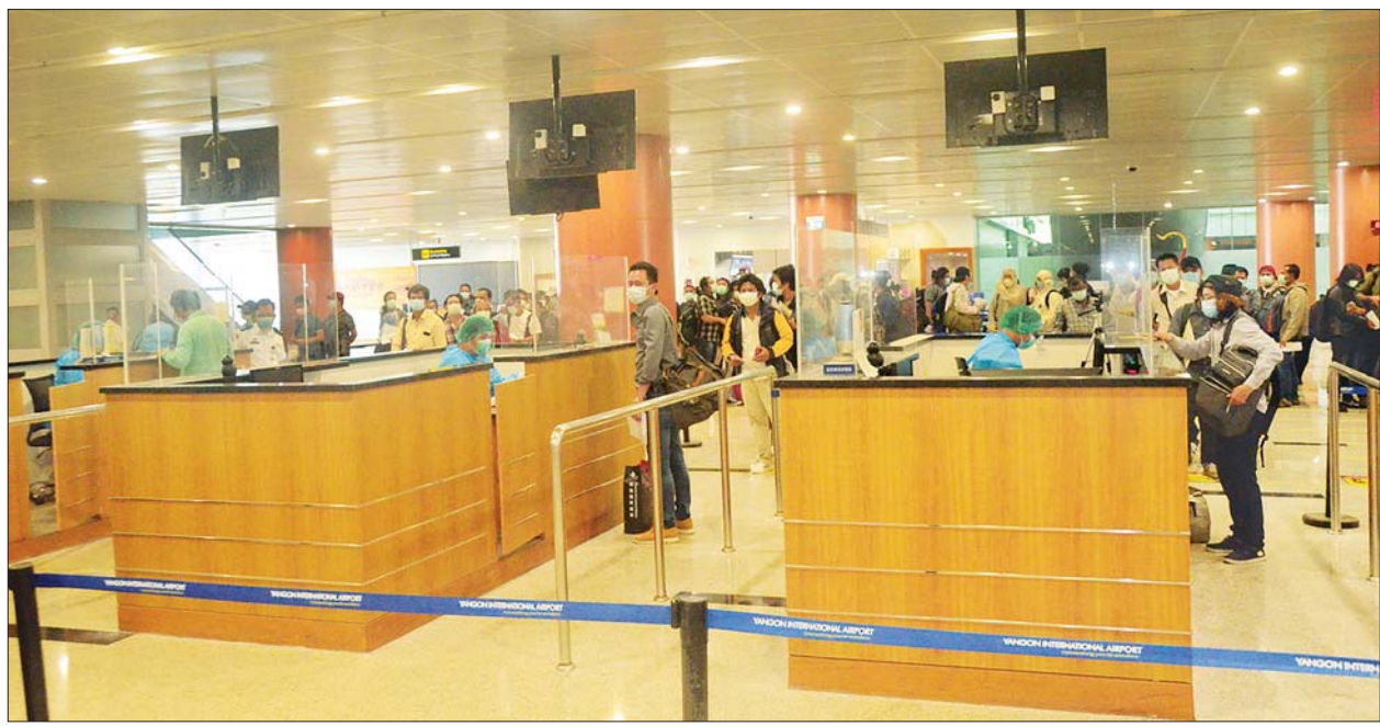
China Airlines လေကြောင်းလိုင်း ကယ်ဆယ်ရေးလေယာဉ်ဖြင့် ပြန်လည်ရောက်ရှိလာသော မြန်မာနိုင်ငံသားများအား ရန်ကုန်အပြည်ပြည်ဆိုင်ရာ လေဆိပ်၌ တွေ့ရစဉ်။