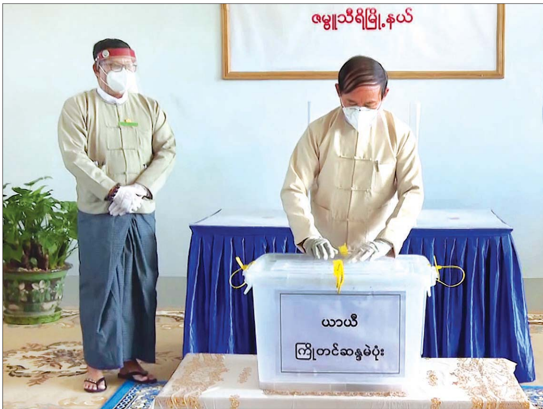
နိုင်ငံတော်သမ္မတ ဦးဝင်းမြင့် ကြိုတင်ဆန္ဒမဲပေးမှု သတင်းကို MRTV မှ သတင်းထုတ်လွှင့်ခဲ့စဉ်။

“မြန်မာ့အသံနှင့် ရုပ်မြင်သံကြားဟာ မြန်ကြားရေးဝန်ကြီးဌာန၊ ပညာပေးရန်နဲ့ ဖျော်ဖြေပေးရန်ဆိုတဲ့ ရည်မှန်းချက် ၃ ရပ်နဲ့ ပြည်သူ့အတွက် ဝန်ဆောင်မှုပေးနေတဲ့ ရုပ်သံလုပ်ငန်းဖြစ်ပါတယ်။ ၅ နှစ်တစ်ကြိမ်ကျင်းပတဲ့ ရွေးကောက်ပွဲကြီး အောင်မြင်ဖို့အတွက် ဦးစားပေး တာဝန်တစ်ရပ်အဖြစ် သတ်မှတ်ပြီး ရွေးကောက်ပွဲမကျင်းပမီ အကြံကလေး၊ ရွေးကောက်ပွဲကြီးကျင်းပပြီးနောက် ကာလတွေ ခွဲခြားပြီး တိကျစွာ တာဝန်တွေ သတ်မှတ်ကာ ကြိုးပမ်းဆောင်ရွက်ခဲ့တာ ဖြစ်ပါတယ်”