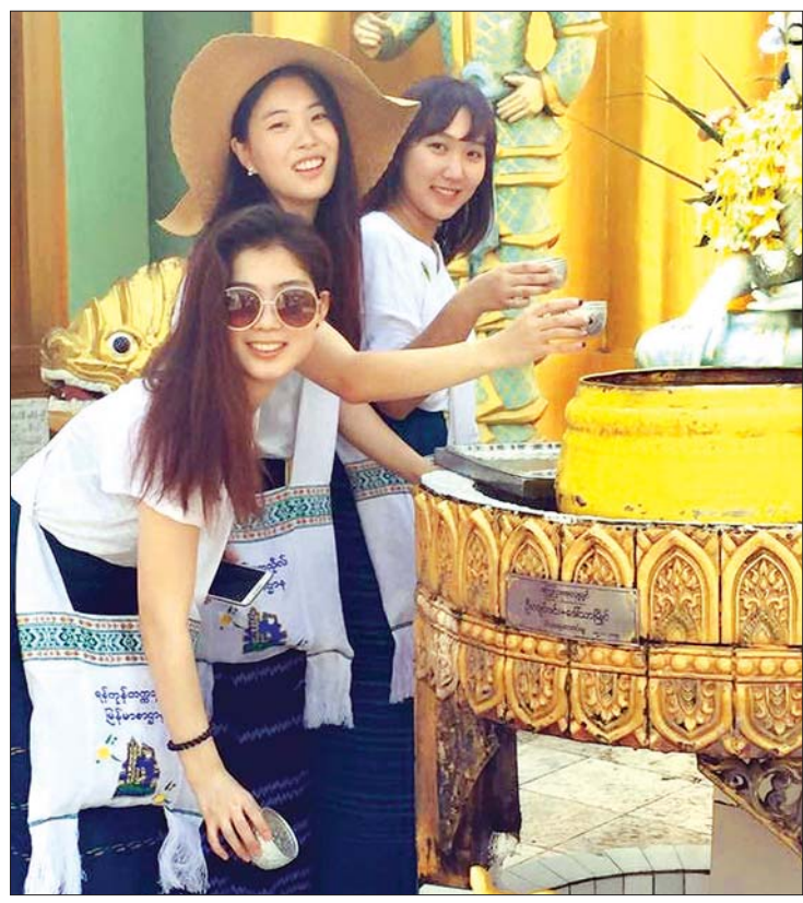
ရန်ကုန်တက္ကသိုလ်တွင် မြန်မာစာလာရောက် သင်ယူကြသည့် ကိုရီးယားကျောင်းသူများ။