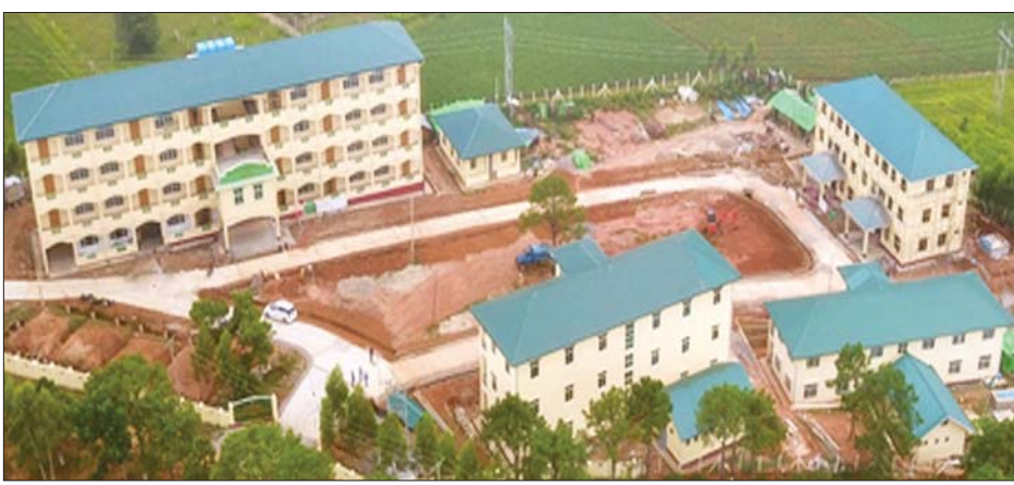
စက်မှုလက်မှုပညာသင်တန်းကျောင်း (အောင်ပန်း) ကို တွေ့ရစဉ်။

နေပြည်တော် ဇူလိုင် ၁၉ နယ်စပ်ရေးရာဝန်ကြီးဌာန၊ ပညာရေးနှင့် လေ့ကျင့်ရေးဦးစီးဌာန ဒုတိယ ညွှန်ကြားရေးမှူးချုပ် ဦးတင်မောင်မြင့်သည် ယနေ့ မွန်းလွဲ ၁၂ နာရီခွဲတွင် ရှမ်းပြည်နယ်တောင်ပိုင်း မြို့နယ်များရှိ တိုင်းရင်းသား လူငယ်များအတွက် အသက်မွေးဝမ်းကျောင်း ပြုနိုင်မည့် သင်တန်းများ စဉ်ဆက်မပြတ် ဖွင့်လှစ်ပေးနိုင်ရေး ရည်ရွယ်၍ ဆောက်လုပ်ရေးသင်တန်း၊ လျှပ်စစ်သင်တန်း၊ ဂဟေသင်တန်း၊ မော်တော်ယာဉ်နှင့် စက်ပြင်သင်တန်းနှင့် လက်ကိုင်ဖုန်းပြင် သင်တန်းများ ဖွင့်လှစ်သင်ကြားပေးရန် ဆောင်ရွက်ထားသည့် နယ်စပ်ဒေသ တိုင်းရင်းသားလူငယ်များ စက်မှုလက်မှုပညာ သင်တန်းကျောင်း (အောင်ပန်း) သို့ ရောက်ရှိပြီး လေးထပ် အလုပ်ရုံ စာသင်ခန်းမ၊ သုံးထပ် သင်တန်းသား အိမ်ဆောင်၊ လေးခန်းတွဲ သုံးထပ် ဝန်ထမ်းအိမ်ရာ၊ စတုရန်းပုံ နှင့် ထမင်းချက်ဆောင်တို့ အသင့်ပြင်ဆင်ထားမှု အခြေအနေများနှင့် သင်တန်းအလိုက် သင်ထောက်ကူပစ္စည်းများ၊ လက်တွေ့ခန်းသုံးပစ္စည်းများဖြင့် သင်ကြားပေးရန် ဆောင်ရွက်ထားမှုများအား ကြည့်ရှုစစ်ဆေးပြီး ကိုဗစ်-၁၉ ကာလအလွန် သင်တန်းကျောင်း ဖွင့်ပွဲပြုလုပ်၍ သင်တန်းများ ဖွင့်လှစ်နိုင်ရေး လိုအပ်သည်များ