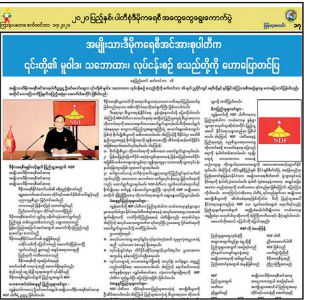
နိုင်ငံရေးပါတီများ၏ မူဝါဒ၊ သဘောထား၊ လုပ်ငန်းစဉ် စသည်တို့ ဟောပြောတင်ပြမှုကို သတင်းစာ၌ ဖော်ပြပေးမှု။

အကြိမ်အဖြစ် သွားရောက်တွေ့ဆုံပြီး ရှင်းလင်းတင်ပြခဲ့ပါသည်။ ထို့နောက် ပါတီစုံဒီမိုကရေစီအထွေထွေရွေးကောက်ပွဲဆိုင်ရာ ပညာပေးအစီအစဉ်များကို နိုင်ငံပိုင်ရုပ်မြင်သံကြားနှင့် သတင်းစာများတွင် ဖော်ပြနိုင်ရန်အတွက် ပြည်ထောင်စုဝန်ကြီးနှင့် ဌာနဆိုင်ရာတာဝန်ရှိသူများသည် ၂၀၂၀ ပြည့်နှစ် နှစ်ဆန်းပိုင်းမှ စတင်၍ အကြိမ်ကြိမ်ညှိနှိုင်းဆွေးနွေးကာ လုပ်ငန်းစဉ်များကို ချမှတ်ဆောင်ရွက်ခဲ့ကြပါသည်။ ထို့ပြင် ၂၀၂၀ ပြည့်နှစ် မတ်လ ၁၃ ရက်နေ့တွင် ပြည်ထောင်စုရွေးကောက်ပွဲကော်မရှင်ဥက္ကဋ္ဌနှင့် အဖွဲ့ဝင်များအား ဒုတိယ အကြိမ်သွားရောက်တွေ့ဆုံကာ ဝန်ကြီးဌာနက ဆောင်ရွက်မည့် လုပ်ငန်းစဉ် များနှင့် ပတ်သက်၍ ရှင်းလင်းတင်ပြ ညှိနှိုင်းဆွေးနွေးခဲ့ကြပါသည်။