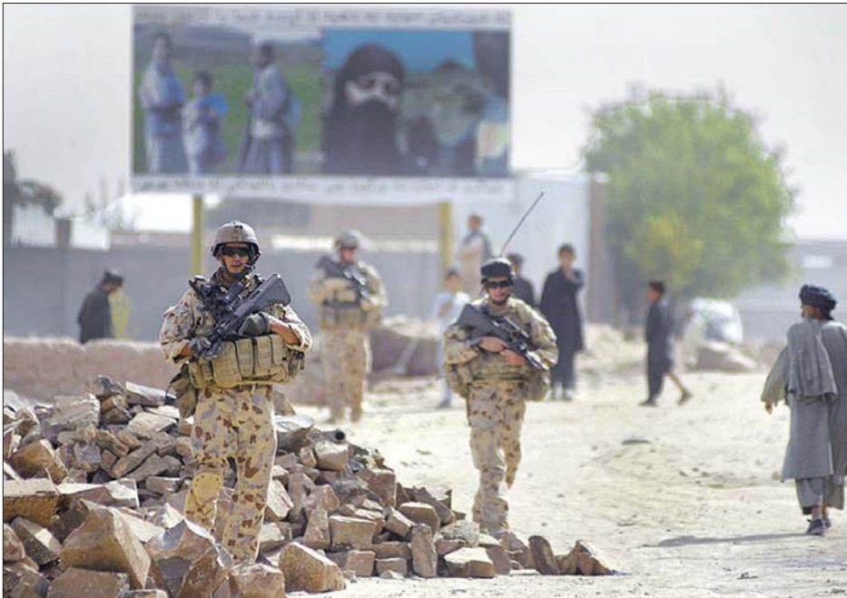
၂၀၀၈ ခုနှစ်က အာဖဂန်ရှိ စစ်စခန်းတစ်ခုတွင် ဩစတြေးလျတပ်ဖွဲ့ဝင်အချို့ကို တွေ့ရစဉ်။

အကျဉ်းသား ၃၉ ဦးထက်မနည်းကို ဥပဒေမဲ့သတ်ဖြတ်ခဲ့သည့် သက်သေအထောက်အထားများ တွေ့ခဲ့ကြောင်း နိုဝင်ဘာ ၁၉ ရက်တွင် ထုတ်ဖော်ပြောကြားလိုက်ပြီး