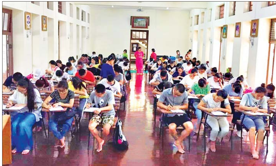
မြန်မာဘာသာစကား သင်ယူကြသူ နိုင်ငံခြား ကျောင်းသူ ကျောင်းသားများ အရည်အချင်းစစ် စာမေးပွဲဖြေဆိုနေမှု။