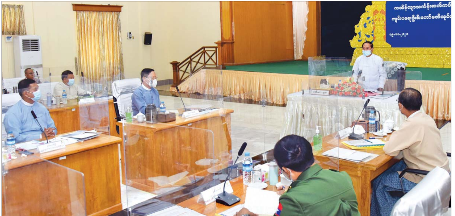
ဒုတိယသမ္မတ ဦးမြင့်ဆွေ ၂၀၂၀ ပြည့်နှစ် ကထိန်လျာသင်္ကန်း ဆက်ကပ်လျှို့ဝှက်ပွဲအခမ်းအနားကျင်းပရေးဦးစီးကော်မတီ လုပ်ငန်းညှိနှိုင်းအစည်းအဝေးတွင် အမှာစကားပြောကြားစဉ်။ သတင်းစဉ်

အစည်းအဝေးသို့ ပြည်ထောင်စု သမ္မတမြန်မာနိုင်ငံတော်အစိုးရ ၂၀၂၀ ပြည့်နှစ် ကထိန်လျာသင်္ကန်း ဆက်ကပ်လျှို့ဝှက်ပွဲ အခမ်းအနား ကျင်းပရေးဦးစီးကော်မတီ ဥက္ကဋ္ဌ၊ သာသနာရေးနှင့် ယဉ်ကျေးမှုဝန်ကြီး ဌာန၊ ပြည်ထောင်စုဝန်ကြီး သူရ ဦးအောင်ကို၊ နေပြည်တော်ကောင်စီ ဥက္ကဋ္ဌ ဒေါက်တာမျိုးအောင်၊ ဒုတိယဝန်ကြီးများ ဖြစ်ကြသည့် စာမျက်နှာ ၄ ကော်လံ ၁