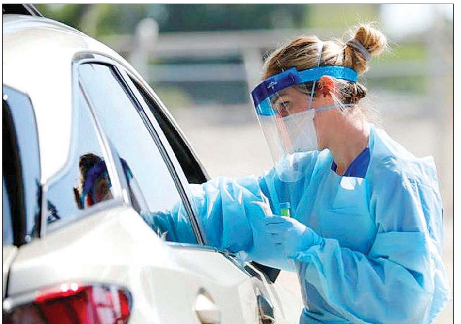
အမေရိကန်ပြည်ထောင်စု၌ ယာဉ်မောင်းသူတစ်ဦးကို ကိုဗစ်- ၁၉ စစ်ဆေးခြင်းဆောင်ရွက်နေစဉ်။

အမေရိကန် ပြည်ထောင်စု၌ ကိုဗစ်- ၁၉ ကြောင့်