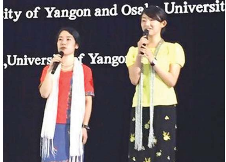
ရန်ကုန်တက္ကသိုလ်နှင့် ယူနန်နော်မယ်တက္ကသိုလ်တို့၏ ယဉ်ကျေးမှု ဖလှယ်ပွဲအဖြစ် နှစ်နိုင်ငံမှ ကျောင်းသူများ သီချင်းသီဆိုမှုကို တွေ့ရစဉ်။