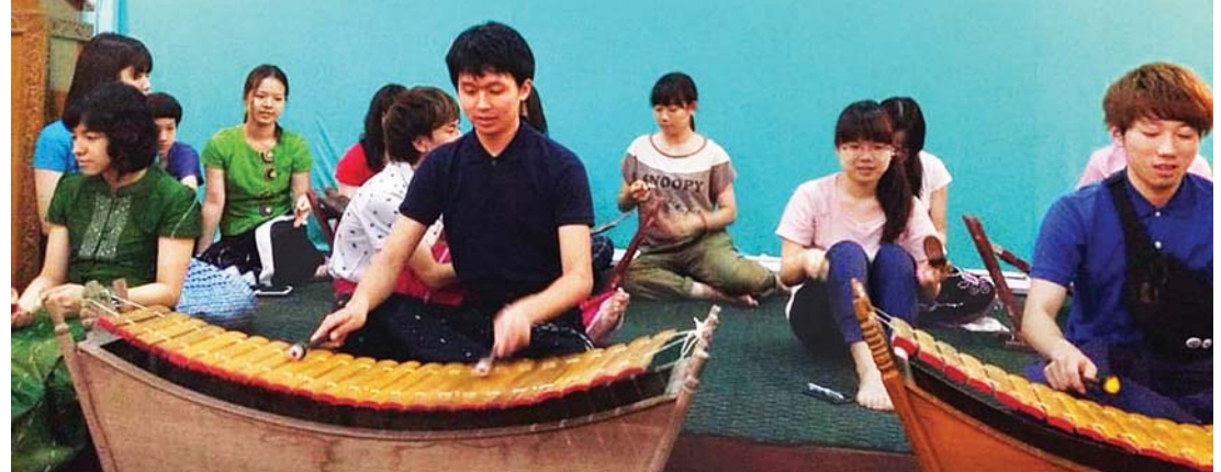
မြန်မာဘာသာစကားသင်ယူကြသူ နိုင်ငံခြားသား ပညာသင်ကျောင်းသား ကျောင်းသူများ မြန်မာယဉ်ကျေးမှု တူရိယာများ သင်ယူလေ့လာမှုကို တွေ့ရစဉ်။