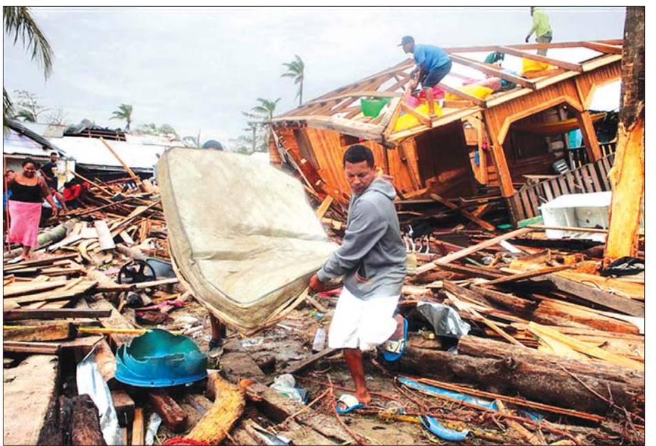
ဟာရီကိန်းမုန်တိုင်း အိုင်အိုတာကြောင့် နေအိမ်များ ထိခိုက်ပျက်စီးမှုကို တွေ့ရစဉ်။

မုန်တိုင်းကြောင့် အန္တရာယ်ရှိသည့် မြေပြိုမှုများ ဆက်လက်ဖြစ်ပွားနိုင်သေးသည့်အတွက် မုန်တိုင်းအန္တရာယ် သတိပေးနိုးဆော်ချက်ကို အနီးရောင်အဆင့်တွင် ဆက်လက် ထားရှိမည်ဖြစ်ကြောင်း အရေးပေါ်အခြေအနေဆိုင်ရာ ကော်မရှင်က ပြောသည်။ ဆင်ဟွာ