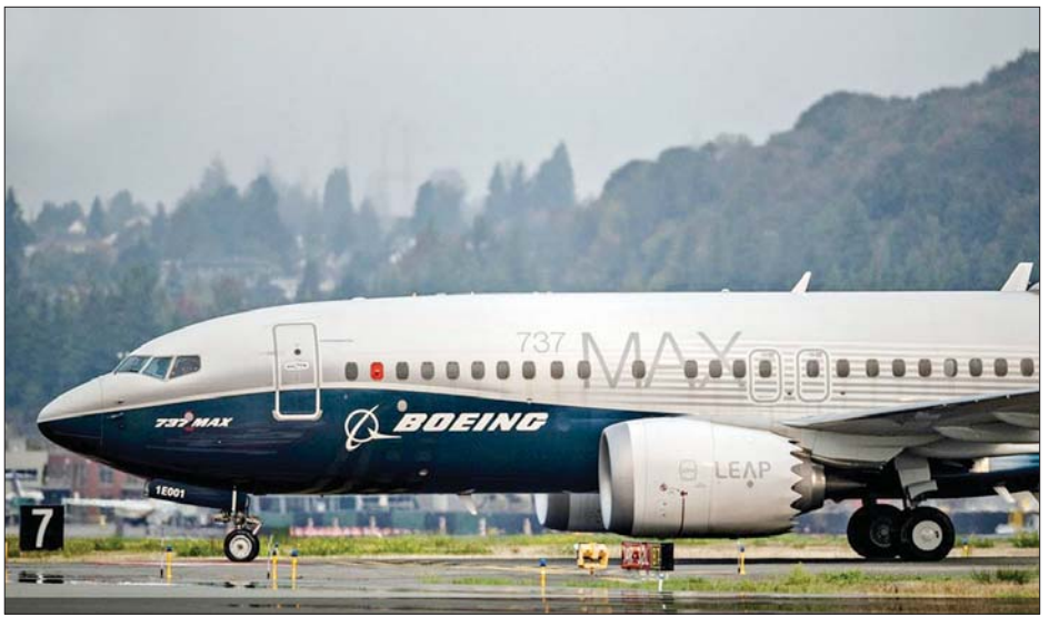
မြေပြင်၌ ရပ်နားထားသည့် ဘိုးရင်း ၇၃၇-မက်စ် ခရီးသည်တင်လေယာဉ်။