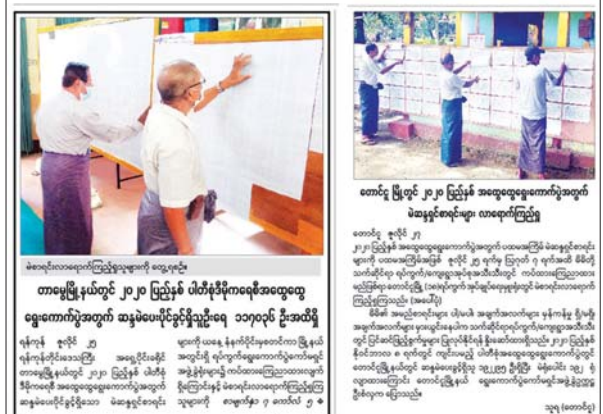
ရွေးကောက်ပွဲအတွက် အသိပညာပေးအစီအစဉ် အဖွဲ့ဝင်များနှင့် တွေ့ဆုံမေးမြန်းမှု

ရွေးကောက်ပွဲအကြိုကာလအတွင်း နိုင်ငံရေးပါတီ ၇ ခု၏ စည်းရုံး ဟောပြောချက်များကို ဖော်ပြခဲ့ရာတွင်လည်း ပါတီများအားလုံးအတွက် တူညီသည့်စာမျက်နှာ၊ တူညီသည့် ခေါင်းစည်းစာလုံးအရွယ်အစား၊ တူညီ သည့်ပါတီတံဆိပ်အရွယ်အစား၊ တူညီသည့်ဓာတ်ပုံ ဖော်ပြမှုအရွယ်အစား သတ်မှတ်ချက်များဖြင့် မျှမျှတတ ဖော်ပြပေးခဲ့သည့်အပြင် မည်သည့်နေ့တွင် မည်သည့်ပါတီက ပြည်သူ့ထံ တင်ပြမည်ဟူသည့် သတင်းအချက်အလက်များ ကိုလည်း ကြိုတင်ဖော်ပြပေးနိုင်ခဲ့ပါသည်။ (ဆက်လက်ဖော်ပြပါမည်)