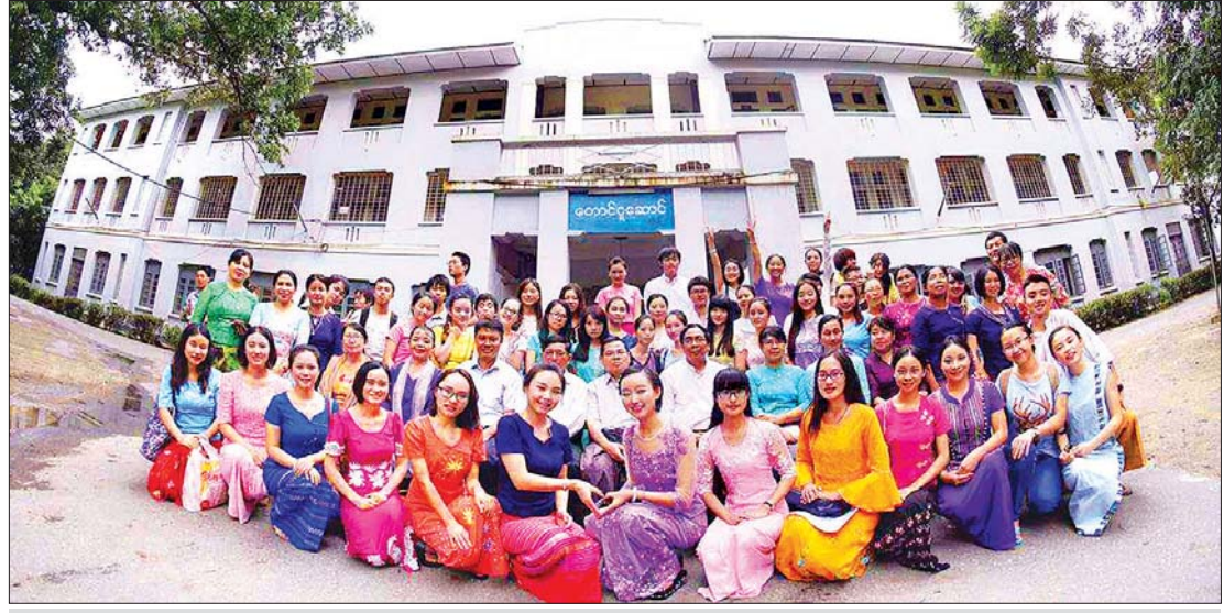
နိုင်ငံခြားပညာသင် ကျောင်းသား ကျောင်းသူများ၊ ဆရာ ဆရာမများနှင့်အတူ တောင်ငူဆောင်ရွေ့၍ စုပေါင်းမှတ်တမ်းတင် ဓာတ်ပုံရိုက်စဉ်။