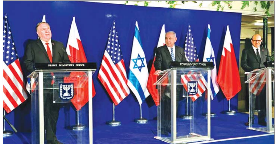
အမေရိကန်နိုင်ငံခြားရေးဝန်ကြီးမိုက်ပွန်ပီအို အစ္စရေးဝန်ကြီးချုပ် ဘင်ဂျမင်နေတန်ယာဟု၊ ဘာရိန်းနိုင်ငံခြားရေးဝန်ကြီး အစ္စဗလက်အစ်စ် ဘင် ရက်ဟစ် အယ် ဇာယာနီ တို့နှင့် ဂျေရုဆလင်တွင် တွေ့ဆုံစဉ်။

အခြားသော ကိစ္စရပ်များတွင် ပူးပေါင်းဆောင်ရွက်မှု အရှိန်မြှင့်တင်လျက် ရှိသည်။ ဒေသတွင်း အိရန်နိုင်ငံ၏ လွှမ်းမိုးနိုင်မှုမှာ ဆုတ်ယုတ်လာပြီး အထီးကျန်နိုင်ငံဖြစ်နေသည်ဟု မိုက်ပွန်ပီအိုက သတင်းထောက်များကို ပြောသည်။