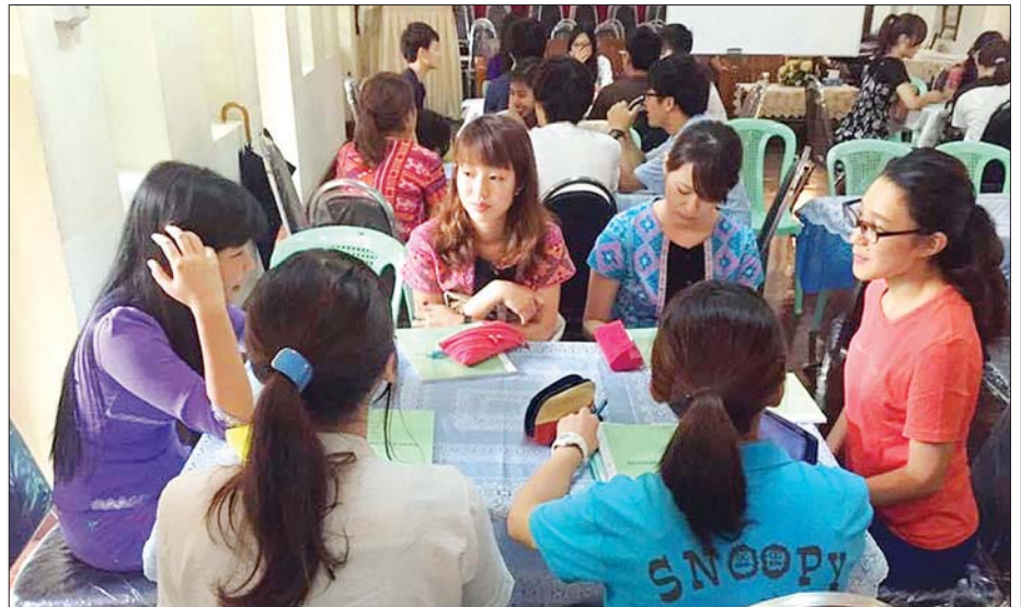
မြန်မာကျောင်းသူ ကျောင်းသားများနှင့် နိုင်ငံခြား ကျောင်းသူ ကျောင်းသားများ၏ ဘာသာရပ်ဆွေးနွေးပွဲ။