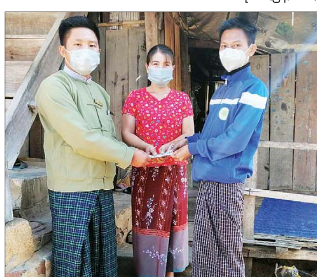
မိုးဒေ (ပြန်/ဆက်)

မိုင်းခတ် ဇူလိုင် ၁၉ ရှမ်းပြည်နယ် အရှေ့ပိုင်း ကျိုင်းတုံခရိုင် မိုင်းခတ်မြို့နယ်တွင် ကိုဗစ်-၁၉ ရောဂါ ကာကွယ်ထိန်းချုပ်ရေးကာလအတွင်း ပုံမှန်ဝင်ငွေမရှိသော အခြေခံလူတန်းစားများအား နိုင်ငံတော်က တစ်အိမ်ထောင်လျှင် ငွေကျပ် ၂၀၀၀ နှုန်းဖြင့် ဇူလိုင် ၁၈ နေ့မှစတင်၍ မြို့ပေါ်ရပ်ကွက် နှစ်ရပ်ကွက်နှင့် ကျေးရွာအတွင်းရှိ ပုံမှန်ဝင်ငွေမရှိသည့် အိမ်ထောင်စုများအား စတုတ္ထအကြိမ် ထောက်ပံ့ငွေများ ပေးအပ်သည်။ ထောက်ပံ့ငွေများ ပေးအပ်ရာတွင် မြို့နယ်အထွေထွေအုပ်ချုပ်ရေးဦးစီးဌာနမှ တာဝန်ရှိသူများ၊ ရပ်ကွက်၊ ကျေးရွာအုပ်ချုပ်ရေးမှူးများ၊ ရပ်/ကျေး စာရေးများက မြို့ပေါ်ရပ်ကွက် နှစ်ရပ်ကွက်၊ မိုင်းနှုန်း၊ ဝမ်းခတ်၊ ဝမ်းပင်း၊ ဝမ်းအွန်၊ တုံဖက်၊ ဖာလန်ကော်၊ နောင်လုံး၊ မိုင်းကာနှင့် ပါပွန်းကျေးရွာအုပ်စုများရှိ ပုံမှန်ဝင်ငွေမရှိသည့် အခြေခံလူတန်းစား အိမ်ထောင်စုများအား အိမ်တိုင်ရာရောက် ထောက်ပံ့ပေးအပ်သည်။ မိုင်းခတ်မြို့နယ်တွင် အခြေခံလူတန်းစား အိမ်ထောင်စုပေါင်း ၁၄၄ စု၊ လူဦးရေ စုစုပေါင်း ၄၉၇ ဦး ရှိပြီး တာဝန်ရှိသူများက အိမ်ထောင်စုများရှိရာသို့ အိမ်တိုင်ရာရောက် ထောက်ပံ့ပေးအပ်ခဲ့ကြသည်။