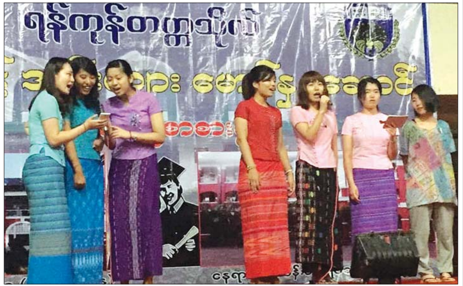
ဂျပန်ကျောင်းသူများ၏ အဆောင်ပွင့် ဖွဲ့စည်းပေးပို့ပေးမှုကို တွေ့ရစဉ်။