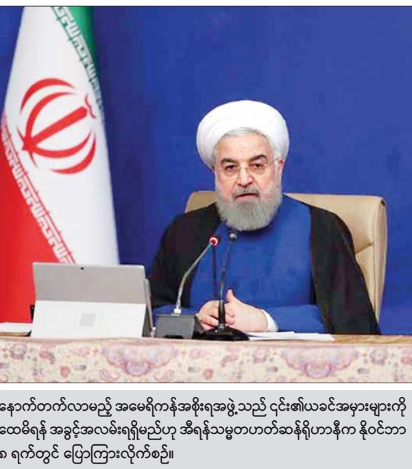
နောက်တက်လာမည့် အမေရိကန်အစိုးရအဖွဲ့သည် ၎င်း၏ယခင်အမှားများကို ထပ်မံရန် အခွင့်အလမ်းရရှိမည်ဟု အိရန်သမ္မတဟတ်ဆန်ရိုဟာနီက နိုဝင်ဘာ ၈ ရက်တွင် ပြောကြားလိုက်စဉ်။

ဝါရှင်တန် နိုဝင်ဘာ ၉ ဂျိုးဘိုင်ဒင်က အိရန်အပေါ်အမေရိကန် မူဝါဒ ပြောင်းလဲကျင့်သုံးမည် ဖြစ်ကြောင်း ကတိပေး ပြောကြားလိုက်သော်လည်း ရွေးကောက်ခံသမ္မတတစ်ဦး၏ အစွလာမ္မတ သမ္မတ နိုင်ငံနှင့် လှုပ်ရှားဆောင်ရွက်မည့် အခန်းကဏ္ဍသည် ကျဉ်းမြောင်းလျက်ရှိသည်။ ထွက်ခွာသွားရတော့မည့် အမေရိကန်သမ္မတ ဒေါ်နယ်ထရမ်သည် အိရန်နိုင်ငံကို ၎င်း၏ မဟာရန်ဘက်ကြီးအဖြစ် ကြေညာလိုက်ပြီး ကမ္ဘာကြီးမှ သီးခြားခွဲထုတ်ရန် လုပ်ဆောင်ခဲ့သည်။ ဘိုင်ဒင်က သံတမန်လမ်းကြောင်းပေါ် ပြန်သွားမည်ဖြစ်ကြောင်း အကြံပြုပြောကြားလိုက်သည်။ နျူကလီးယားပူးပေါင်းပြုလုပ်ရန် စိုးရိမ်မှုကို ဗဟိုပြုသည့် အိရန်အရေးကိစ္စသည် လွန်ခဲ့သည့် လေးနှစ်နှင့်