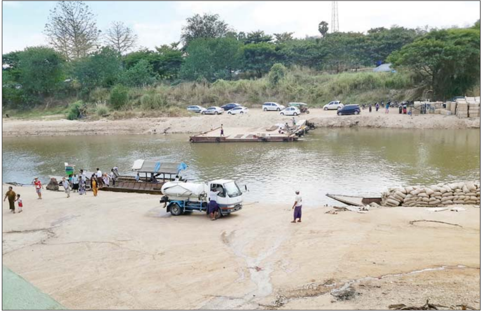
မြဝတီမြို့နယ်နှင့် မဲဆောက်မြို့ နယ်စပ်ချောင်း။

ထို့အတူ ဒေသနေပြည်သူများကို ကျန်းမာရေးစောင့်ရှောက်မှုပေးနိုင်ရန် ခုတင် ၁၀၀ ဆံ့ မြို့နယ်ပြည်သူ့