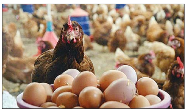
ခန့် ကြာမြင့်နိုင်မည်ဟု ခန့်မှန်းရ သည်။ ခရိုင်အစိုးရအဖွဲ့၏ တောင်းဆို ချက်အရ မြေပြင်ကာကွယ်ရေးတပ်ဖွဲ့ ကလည်း ကြက်ငှက်တုပ်ကွေးရောဂါ တိုက်ဖျက်ရေး ဆောင်ရွက်မှုတွင်

ရွှေ့ပြောင်းခြင်းမပြုရန် ကာကွယ်ရန် အုပ်ချုပ်ရေးအဖွဲ့က ညွှန်ကြားထားပြီး အခြားနေရာများတွင် ရောဂါကူးစက် မှုဖြစ်ပွားခြင်း ရှိ မရှိ စစ်ဆေးလျက်ရှိ ကြောင်း သိရသည်။ ရောဂါ ကူးစက်ဖြစ်ပွားသည့် နေရာမှ ၁၀ ကီလိုမီတာအတွင်းရှိ မွေးမြူရေးခြံများမှ ကြက်၊ ငှက်များ နှင့် ဥများကိုလည်း ပြင်ပသို့ ရွှေ့ပြောင်းသယ်ဆောင်ခြင်း မပြုရန် အမိန့်ထုတ်ထားသည်။ ရောဂါကူးစက် ဖြစ်ပွားရာ မွေးမြူရေးခြံမှ ကြက်များ သေဆုံးမှုမှာ လေးရက်အတွင်း ကြက် ကောင်ရေ ၃၈၀၀ အထိ သေဆုံးခဲ့ ကြောင်း သိရသည်။ ရောဂါကူးစက် ဖြစ်ပွားမှု သံသယရှိသည့် ကြက်များ အားလုံးကို သုတ်သင်ရန် ၁၀ ရက်