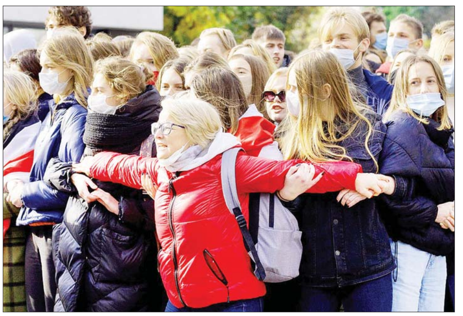
မင့်စ်မြို့တွင် ပြုလုပ်သည့် ဆန္ဒပြပွဲအတွင်း ဆရာများနှင့် ကျောင်းသားများ ပါဝင်ခဲ့ကြစဉ်။

ရှိသည်ဟု လူ့အခွင့်အရေးစောင့်ကြည့်ရေးအုပ်စုက ပြောသည်။ မျှော်လင့်လျက်ရှိ ဂျိုးဘိုင်ဒင်သည် ဘီလာရပ်စ်နိုင်ငံမှ ပြည်သူများအား ထောက်ပံ့ပေးလိုသည်ဟု မကြာခဏ ထုတ်ဖော်ပြောကြား လေ့ရှိကြောင်း လူမှုကွန်ရက်မီဒီယာတွင် ဆဗက်လာနာ ကပြောသည်။ အမေရိကန်အစိုးရသစ်၏ အုပ်ချုပ်မှု အောက်တွင် အမေရိကန်ပြည်ထောင်စုနှင့် ဥရောပနိုင်ငံ များသည် ၎င်းတို့၏ ချစ်ကြည်ခိုင်မြဲမှုကို ပိုမိုအားကောင်း လာစေမည်ဟု စောင့်ကြည့်လေ့လာသူများက ပြော သည်။ ဆဗက်လာနာသည်လည်း သမ္မတ လူကာရှန်ကိုအား ဖြုတ်ချနိုင်ရေးအတွက် အနောက်နိုင်ငံများနှင့် ဆက်ဆံရေး ချည်နှောင်နိုင်ရန် မျှော်လင့်လျက်ရှိသည်။ အင်န်အိတ်ချ်ကေ