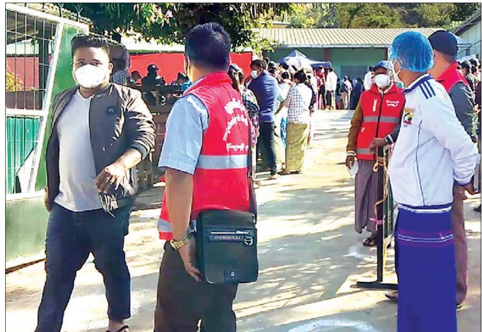
မူဆယ် (၁၀၅) မိုင် မဲရုံတစ်ရပ်၌ ဆန္ဒမဲပေးရန် ပြည်သူများ တန်းစီစောင့်ဆိုင်းနေစဉ်။