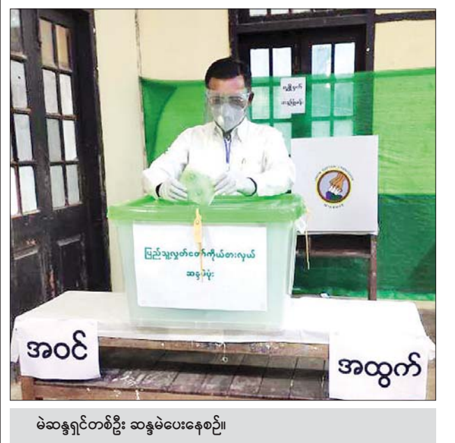
မဲဆန္ဒရှင်တစ်ဦး ဆန္ဒမဲပေးနေစဉ်။