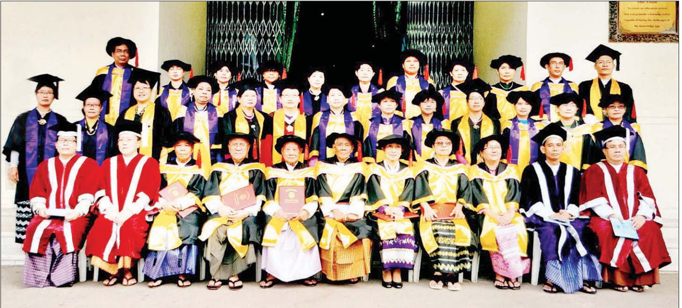
ရန်ကုန်တက္ကသိုလ် အထူးဘွဲ့နှင်းသဘင်အခမ်းအနား (၂၀၁၅) တွင် ဂုဏ်ထူးဆောင်စာပေပါရဂူဘွဲ့ ချီးမြှင့်ခံရသူ ခုနစ်ဦးနှင့် အခမ်းအနားတက်ရောက်သူများ စုပေါင်း မှတ်တမ်းတင်ဓာတ်ပုံရိုက်စဉ်။

၁၉၉၉-၂၀၁၃ ဥက္ကဋ္ဌ၊ မြန်မာနိုင်ငံဝိဇ္ဇာနှင့် သိပ္ပံပညာရှင်အဖွဲ့ ၁၉၉၉- ဥက္ကဋ္ဌ၊ ပညာတန် ယနေ့အထိ ဆောင်အုပ်ချုပ်ရေးအဖွဲ့ ၁၉၉၉- ဥက္ကဋ္ဌ၊ မြန်မာနိုင်ငံ စာတတ်မြောက်ရေး အထောက်အကူပြုပင်မဌာန ၂၀၁၅-ဇန်နဝါရီ ရန်ကုန်တက္ကသိုလ် Doctor of Letters (Honoris Causa) ဘွဲ့ ၂၀၁၅-မေ အမေရိကန်နိုင်ငံ ဟာဝိုင်ရီ တက္ကသိုလ် Doctor of Humane Letters, (Honoris Causa) ဘွဲ့ ၂၀၁၅-ဇွန် နိုင်ငံတော်သမ္မတ၏ ပညာရေး အကြံပေးအဖွဲ့ အဖွဲ့ဝင် ၂၀၁၈ ပခုက္ကူဦးအုန်းဖေ တစ်သက် တာ စာပေဆုရ