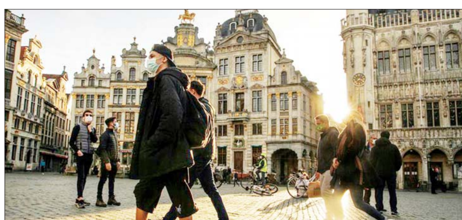
ဘယ်လ်ဂျီယံနိုင်ငံ ဘရပ်ဆဲလ်ပြည်သူ့ရင်ပြင်ရှေ့တွင် နှာခေါင်းစည်းတပ်ဆင်သွားလာနေသူကြည့်သူများကို နိုဝင်ဘာ ၈ ရက်က တွေ့ရစဉ်။

ဝါရှင်တန် နိုဝင်ဘာ ၉ နိုဝင်ဘာ ၈ ရက်က ကမ္ဘာတစ်ဝန်း ကိုဗစ်-၁၉ ကူးစက်ဖြစ်ပွားသူပေါင်း သန်း ၅၀ ကျော်လာကြောင်း ဂျွန်ဟော့ကင်းတက္ကသိုလ် သိပ္ပံနှင့် အင်ဂျင်နီယာဌာန၏ စစ်တမ်းများအရ သိရသည်။ နိုဝင်ဘာ ၈ ရက် အမေရိကန် စံတော်ချိန် နံနက် ၁၁ နာရီ ၂၄ မိနစ်က ကမ္ဘာတစ်ဝန်း ကိုဗစ်-၁၉ ဖြစ်ပွားသူပေါင်း ၅၀၀၅၂၀၄ ဦး ရှိလာခဲ့ပြီး သေဆုံးသူ ၁၂၅၄၁၀ ရှိလာကြောင်း ဂျွန်ဟော့ကင်းတက္ကသိုလ်၏ အချက်အလက်များတွင် ဖော်ပြထားသည်။ အမေရိကန် ပြည်ထောင်စုသည် ကမ္ဘာတစ်ဝန်း ကိုဗစ်-၁၉ ကူးစက်မှု အများဆုံးနှင့် သေဆုံးမှုအများဆုံး ဖြစ်ပွားလျက်ရှိသည့် နိုင်ငံတစ်နိုင်ငံ ဖြစ်သည်။ အမေရိကန်နိုင်ငံတွင် ကိုဗစ်-၁၉ ဖြစ်ပွားသူပေါင်း ၉၈၇၉၂၃ ဦးနှင့် သေဆုံးသူပေါင်း ၂၃၇၁၅ ဦး ရှိသည်။ အိန္ဒိယနိုင်ငံသည် ကိုဗစ်-၁၉ ဖြစ်ပွားသူပေါင်း ၈၅၀၇၅၄ ဦးဖြင့် ကမ္ဘာ့ဒုတိယအများဆုံး ကိုဗစ်-၁၉ ကပ်ရောဂါကူးစက် ဖြစ်ပွားသည့် နိုင်ငံတစ်နိုင်ငံဖြစ်လာသည်။ ဘရာဇီးနိုင်ငံသည် ကိုဗစ်-၁၉ ကူးစက်မှုအရေ အတွက် ၅၆၅၄၅၆၁ ဦးဖြင့် အိန္ဒိယနိုင်ငံနောက်မှ လိုက်လျက်ရှိပြီး သေဆုံးသူ ၁၆၂၅၆၉ ဦးဖြင့် ကမ္ဘာ့ဒုတိယ သေဆုံးမှု အများဆုံးနိုင်ငံ တစ်နိုင်ငံ ဖြစ်လာသည်။ ကိုဗစ်-၁၉ ကူးစက်ဖြစ်ပွားသူအရေအတွက် ၁ ဒသမ ၁ သန်း ကျော်လာသော နိုင်ငံများမှာ ရုရှား၊ ပြင်သစ်၊ စပိန်၊ အာဂျင်တီးနား၊ မြိတ်နီနှင့် ကိုလံဘီယာနိုင်ငံတို့ ဖြစ်ကြပြီး သေဆုံးသူ ၄၀၀၀၀ ကျော်လာသော