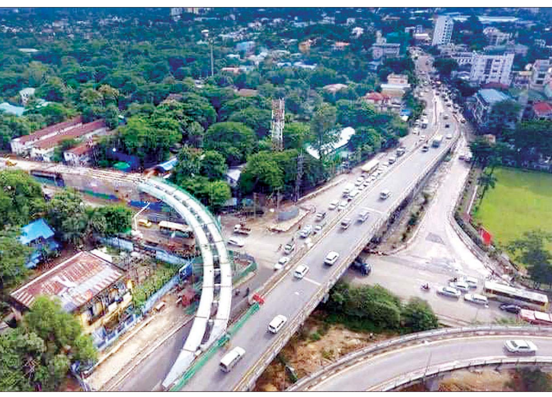
လက်ရှိ ဆောက်လက်စအနေအထား အင်းစိန်ရထားခုံးကျော်တံတားကို ဝေဟင်မှ တွေ့ရစဉ်။

ရန်ကုန် နိုဝင်ဘာ ၉ ရန်ကုန်တိုင်းဒေသကြီး အင်းစိန်မြို့နယ်တွင် လက်ရှိအသုံးပြုလျက်ရှိသော ရထားလမ်းခုံးကျော်တံတား အမှတ် (၂) အင်းစိန်နှင့် ဆက်သွယ်ကာ မြန်မာ့မီးရထား (မြို့ပြ) အင်ဂျင်နီယာဌာန တံတားပေါင်အလုပ်ရုံ (မလွှဲကုန်း)မှ တာဝန်ယူဆောင်ရွက်နေသော ရထားလမ်းခုံးကျော် တံတားသစ် (မင်းကြီးလမ်းဘက်ခြမ်း) တည်ဆောက်ရေးစီမံကိန်းသည် လက်ရှိတွင်တံတားသံပေါင် တပ်ဆင်ခြင်းလုပ်ငန်းများနှင့် အချောသပ်လုပ်ငန်း ပြီးစီးမှု ၉၅ ရာခိုင်နှုန်းခန့် ပြီးစီးလာပြီး ယခု လကုန်ပိုင်းအတွင်း အပြီးဆောင်ရွက်ကာ ဒီဇင်ဘာလပိုင်းတွင် အများပြည်သူများ အသုံးပြုနိုင်တော့မည်ဖြစ်ကြောင်း တံတားတည်ဆောက်ရေးစီမံကိန်းတာဝန်ခံရုံးမှ သိရသည်။