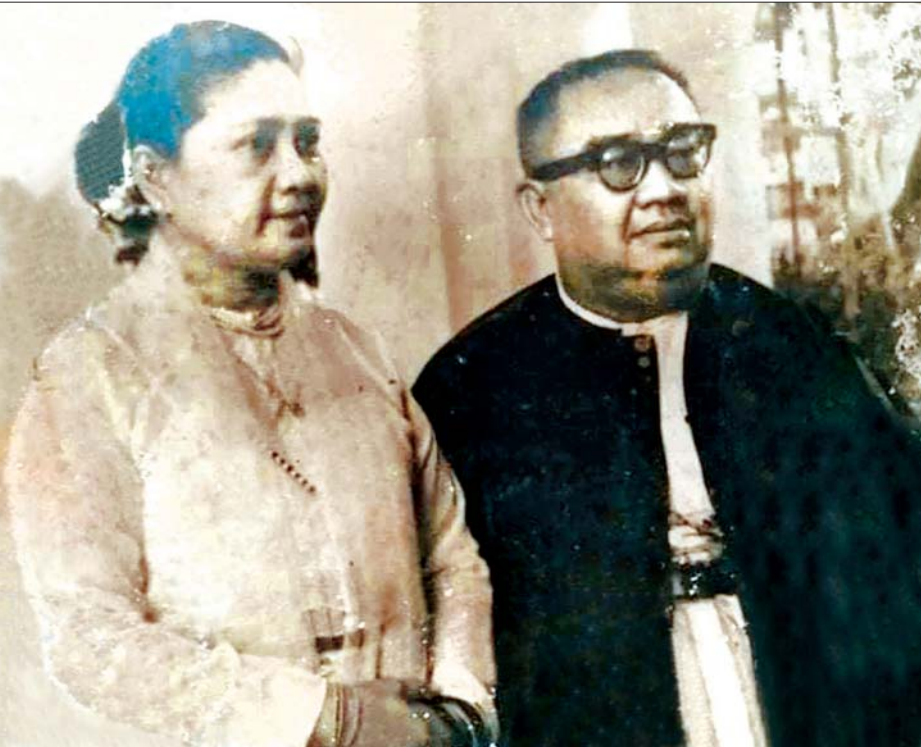
ပါမောက္ခချုပ် ဒေါက်တာထင်အောင်နှင့် ဇနီး။

ရန်ကုန်တက္ကသိုလ်ကို အင်္ဂလန်နိုင်ငံရှိ အောက်စဖို့ နှင့် ကိန်းဘရစ်ချ်တက္ကသိုလ်တို့၏ စနစ်အတိုင်း ဖွဲ့စည်း တည်ဆောက်ခဲ့ခြင်းဖြစ်ကြောင်း သိရသည်။ ၁၉၄၀ နှင့် ၅၀ ပြည့်နှစ်များအတွင်းတွင် အရှေ့တောင်အာရှ၏ အကောင်းဆုံးတက္ကသိုလ်ထဲတွင် ပါဝင်ခဲ့ပြီး အာရှအဆင့် တွင်လည်း ထိပ်တန်းရပ်တည်နိုင်ခဲ့ခြင်းကြောင့် အခြား အာရှနိုင်ငံများမှ ကျောင်းသားများ လာရောက်ပညာ ဆည်းပူးရာတက္ကသိုလ် ဖြစ်ခဲ့သည်။ အဆိုပါ တက္ကသိုလ် ကြီးသည် ၂၀၂၀ ပြည့်နှစ် ဒီဇင်ဘာလ ၁ ရက်နေ့တွင် သက်တမ်း နှစ် ၁၀၀ ပြည့်မြောက်တော်မူမည်ဖြစ်သည်။