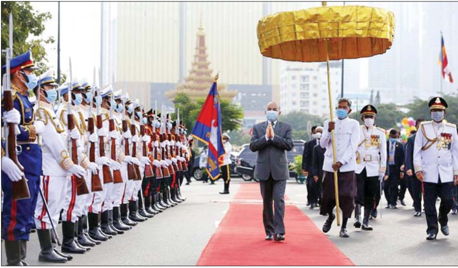
ကမ္ဘောဒီးယားဘုရင် နိရိဒ္ဒန် ဆီဟာမိုနီသည် လွတ်လပ်ရေးနေ့အခမ်းအနားတွင် ဂုဏ်ပြုတပ်ဖွဲ့ကို စစ်ဆေးနေစဉ်။

ဖနောင်ပင် နိုဝင်ဘာ ၉ ကမ္ဘောဒီးယားနိုင်ငံသည် ပြင်သစ် လက်မှ လွတ်လပ်ရေးရရှိခဲ့သည့် (၆၇) ကြိမ်မြောက် လွတ်လပ်ရေးနေ့ ကို နိုဝင်ဘာ ၉ ရက်က ကျင်းပခဲ့သည်။ ကမ္ဘောဒီးယားဘုရင် နိရိဒ္ဒန် ဆီဟာမိုနီသည် လွတ်တော်ဥက္ကဋ္ဌ ဆမ်ဒက်ဆေချာဟမ်နှင့် အမျိုးသား လွတ်တော်ဥက္ကဋ္ဌ ဆမ်ဒက် ဟန်ဆမ်ရင်နှင့်အတူ မြို့တော် ဖနောင်ပင်ရှိ လွတ်လပ်ရေးနေ့ အထိမ်းအမှတ် အဆောက်အအုံ