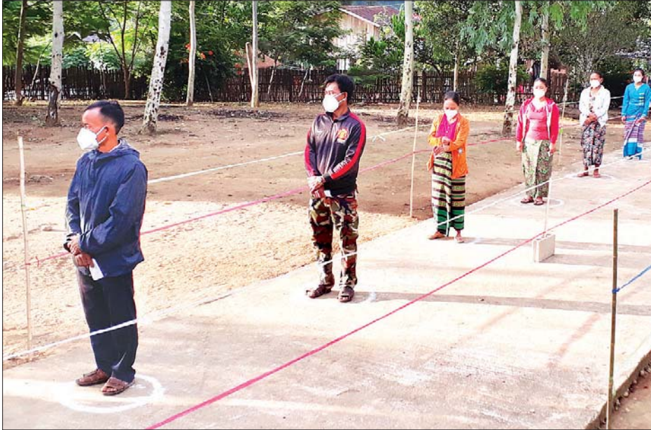
ကျိုင်းလပ်မြို့တွင် အထွေထွေ ရွေးကောက်ပွဲကို မဲရုံပေါင်း ငါးရုံဖြင့် ကျင်းပပြီး အမှတ် (၂၂) ရပ်ကွက်တွင် မဲဆန္ဒရှင်ပေါင်း ၂၄၅၈ ဦးရှိကြောင်း ဖြူဖြူဝင်း (ပြန်/ဆက်)

ကျိုင်းလပ် နိုဝင်ဘာ ၉ ရှမ်းပြည်နယ်အရှေ့ပိုင်း တာချီလိတ် ခရိုင် ကျိုင်းလပ်မြို့တွင် ၂၀၂၀ ပြည့်နှစ် ပါတီစုံဒီမိုကရေစီအထွေထွေ ရွေးကောက်ပွဲကို ယမန်နေ့က ရပ်ကွက်နှင့် ကျေးရွာအုပ်စုမှ မဲရုံများ ဖွင့်လှစ်ပြီး ပြည်သူများ ဆန္ဒမဲပေးကြကြောင်း သိရသည်။