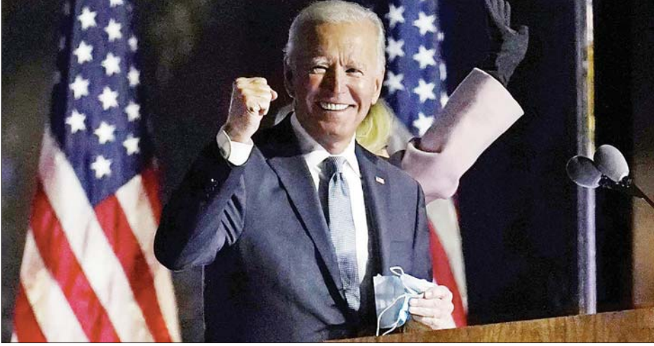
ထောက်ခံမဲ အများစုနဲ့ ၂၀၂၀ ရွေးကောက်ပွဲ အောင်မြင်ခဲ့တဲ့ ဒီမိုကရက်တစ် သမ္မတလောင်း ဘိုင်ဒင်

သို့သော်လည်း အမေရိကန်သမ္မတ ဟောင်း ဂျော့ဂျီဒဗလျူဟာတော့ အဖြေက ရှင်းနေတာပဲလို့ ပြောလိုက်ပြီး သမ္မတရွေးကောက်ပွဲ ဘိုင်ဒင်နဲ့ ဒုတိယ သမ္မတရွေးကောက်ပွဲ ဟားရစ်တို့ကိုလည်း ဝမ်းမြောက်ကြောင်း ပြောကြားလိုက်ပါ တယ်။ အမေရိကန်ပြည်သူတွေအနေနဲ့ အခုရွေးကောက်ပွဲဟာ အခြေခံအားဖြင့် မျှတမှုရှိတယ်လို့ လက်ခံယုံကြည်နိုင်