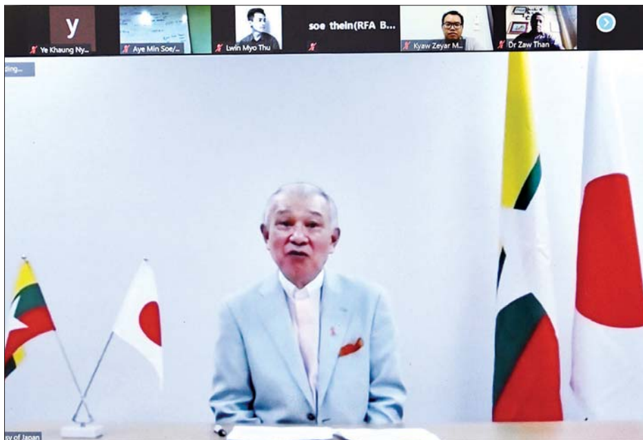
မြန်မာနိုင်ငံအမျိုးသားပြန်လည်သင့်မြတ်ရေးဆိုင်ရာ ဂျပန်အစိုးရ၏ အထူးကိုယ်စားလှယ်နှင့် ပါတီစုံဒီမိုကရေစီ အထွေထွေရွေးကောက်ပွဲ လေ့လာရေးအဖွဲ့ခေါင်းဆောင် မစ္စတာ ရိုဟေး ဆာဆာကာဝါ သတင်းမီဒီယာများ၏ မေးမြန်းချက်များကို ရှင်းလင်းဖြေကြားစဉ်။

ထို့ပြင် သတင်းစာရှင်းလင်းပွဲအပြီး မြန်မာနိုင်ငံဆိုင်ရာ ဂျပန်သံအမတ်ကြီး မစ္စတာ မာရုယာမကလည်း မြန်မာနိုင်ငံ က ရွေးကောက်တင်မြှောက်မည့် အစိုးရသစ်လက်ထက်တွင်