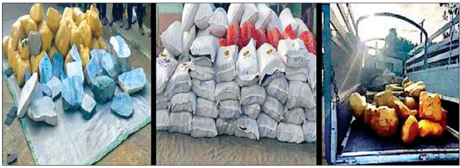
ကျောက်စိမ်းဟုယူဆရသော ကျောက်တုံးအရွယ်အမျိုးအစားစုံ၊ အခြေခံစားသောက်ကုန်နှင့် ပစ္စည်းတင်ဆောင်လာသောယာဉ်ကို တွေ့ရစဉ်။

တရားမဝင်ကုန်စည်များ တားဆီး ထိန်းချုပ်ရေးအတွက် ရေပူနှင့် မရမ်းချောင့်အမြဲတမ်းစစ်ဆေးရေးစခန်းတို့ အား ဌာနဆိုင်ရာ ပူးပေါင်းအဖွဲ့များဖြင့် ၂၀၁၇ ခုနှစ် မတ်လ ၁ ရက်တွင် စတင်ဖွင့်လှစ် ဆောင်ရွက်ခဲ့ပြီး ၂၀၂၀ ပြည့်နှစ် နိုဝင်ဘာ ၈ ရက်တွင် မန္တလေး - မုဆယ် ပြည်ထောင်စု လမ်းမကြီး တစ်လျှောက် ကုန်သွယ်မှု ယာဉ် ပို့ကုန် ၄၃၁ စီး၊ သွင်းကုန် ၂၆၁ စီး၊ ရန်ကုန် - မြဝတီ လမ်းမကြီးတစ်လျှောက် ကုန်သွယ်မှု ယာဉ်သွင်းကုန် ၁၁၁ စီး ကုန်စည်များ သယ်ယူပို့ဆောင်လျက်ရှိသည်။