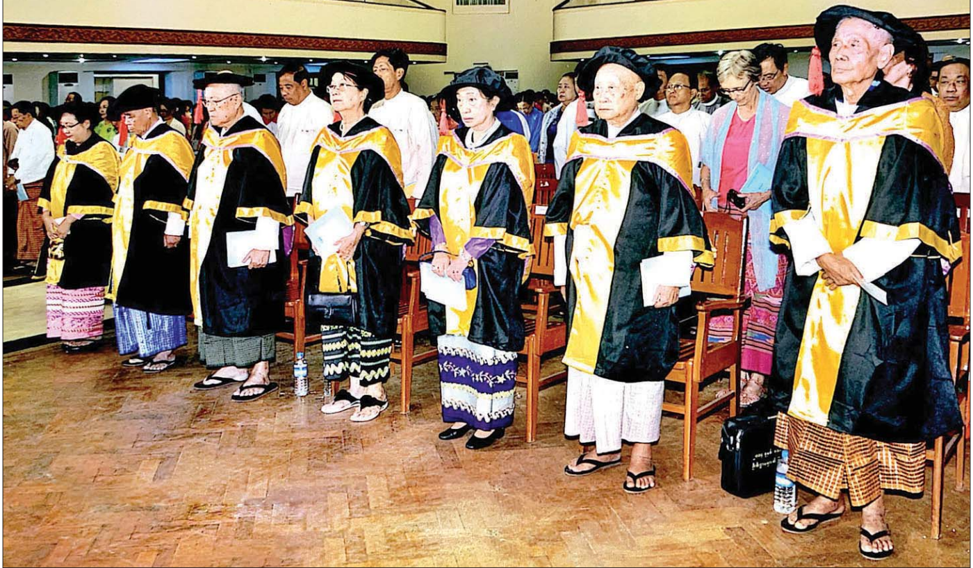
ရန်ကုန်တက္ကသိုလ်အထူးဘွဲ့နှင်းသဘင်အခမ်းအနား (၂၀၁၅) တွင် ဂုဏ်ထူးဆောင်စာပေပါရဂူဘွဲ့ ချီးမြှင့်ခံရသူ ခုနစ်ဦး။

၁၉၂၅ ခုနှစ်တွင် တရားသူကြီးချုပ်အဖြစ် တာဝန် ထမ်းဆောင်သူ ဦးမြင့်သိန်း၏ ကိုယ်ရေး မှတ်တမ်းအရ ရန်ကုန် တက္ကသိုလ်က ဂုဏ်ထူးဆောင်ဥပဒေဝိဇ္ဇာဘွဲ့ (Bachelor of Laws) ကို ချီးမြှင့်ခံရသည်ဟု ဖော်ပြ ထားကြောင်း တွေ့ရှိရပါသည်။ ဤမှတ်တမ်းအရ ဂုဏ်ထူး ဆောင် ဥပဒေဝိဇ္ဇာဘွဲ့ကိုလည်း ရန်ကုန်တက္ကသိုလ်က