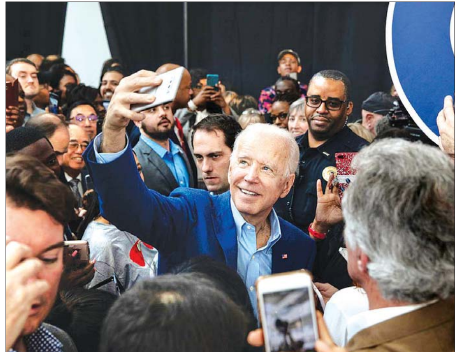
ရွေးကောက်ခံသမ္မတ ဘိုင်ဒင်ကို ထောက်ခံသူများနှင့်အတူ တွေ့ရစဉ်။

လွန်ခဲ့သည့် သီတင်းပတ်ရွေးကောက်ပွဲတွင် ဒီမိုကရက်များက အထက်လွှတ်တော်နေရာ သုံးနေရာသာရရှိထားသေးသည်။ အကယ်၍သာ ဇန်နဝါရီလတွင် ဒီမိုကရက်တစ်ပါတီသည် စိတ်လှုပ်ရှားစရာကောင်းသော နေရာလွှဲပြောင်းပွဲကိုသာ အနိုင်ရရှိခဲ့မည်ဆိုပါက သရေပွဲဖြစ်နိုင်သည်။ ဆိုလိုသည်မှာ ဒုတိယသမ္မတသည် ရှေ့မတိုးသာ နောက်မဆုတ်သာ အခြေအနေကို ကျော်လွှားနိုင်မည်ဖြစ်သည်။ ရီပတ်ဘလစ်ကန်သမ္မတဟောင်း ကျော့ဂျီဒဗလျူဘူရှီနှင့် အမျိုးသားစီးပွားရေးကောင်စီ ညွှန်ကြားရေးမှူးဟောင်း ဂယ်ရီကွန်တို့သည် ဘိုင်ဒင်ကို ဝမ်းမြောက်ကြောင်း ပြောကြားခဲ့သလို တခြားနာမည်ကြီး ရီပတ်ဘလစ်ကန်အတော်များများလည်း ဘိုင်ဒင်ကို ဂုဏ်ယူဝမ်းမြောက်ကြောင်း ပြောကြားခဲ့သည်။ သို့သော်လည်း အင်အားအကြီးဆုံးဖြစ်သည့် ရီပတ်ဘလစ်ကန်သမားတစ်ဦးဖြစ်သည့် ထရမ်သည် ပုံမှန်ထုံးစံ များကို လိုက်နာခြင်းမရှိသလို ဘိုင်ဒင်ကို ဂုဏ်ယူကြောင်းလည်း ပြောကြားခြင်း မရှိသေးချေ။ ၎င်း၏အဖွဲ့သည် ၂၀၂၀ အမေရိကန်သမ္မတရွေးကောက်ပွဲရလဒ်ကို စိန်ခေါ်မည့် တရားစွဲဆိုမှုများ ပြုလုပ်ခဲ့ပြီး ပြည်နယ်အများစုတွင် မဲရေတွက်မှုများ ပြန်လည်ပြုလုပ်ရန် တောင်းဆိုလိုက်သည်။ သို့သော်လည်း ထင်ရှားသည့် သက်သေအထောက်အထားများ မရှိကြောင်း သိရသည်။ အင်န်အိတ်ချ်ကေ