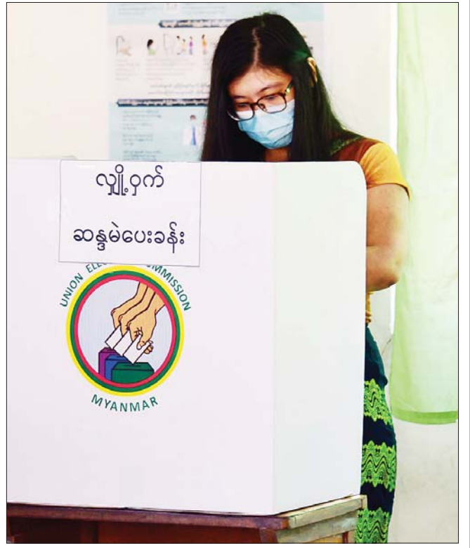
နေပြည်တော် ဧရာသီရိမြို့နယ်တွင် မဲဆန္ဒရှင်တစ်ဦး လျှို့ဝှက် ဆန္ဒမဲပေးနေစဉ်။