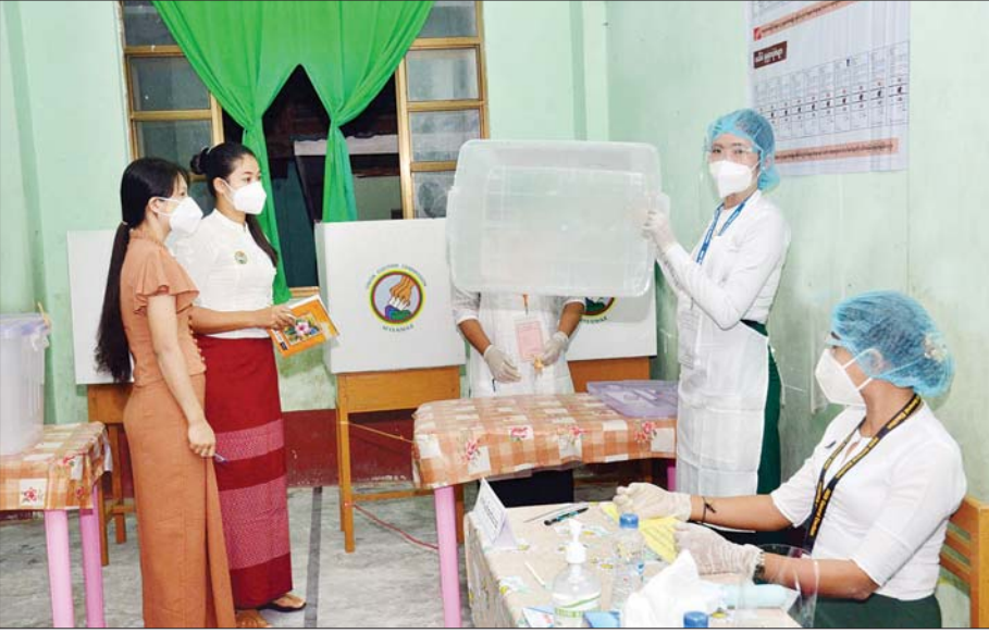
တနင်္သာရီတိုင်းဒေသကြီး မြိတ်မြို့နယ် မဲရုံတစ်ရုံ၌ မဲရုံမဖွင့်မီ မဲရုံတာဝန်ရှိသူများက မဲပုံးအလွတ်အား အများ ဖြင့်သာအောင် ပြသစဉ်။

၂၀၂၀ ပြည့်နှစ် ပါတီစုံဒီမိုကရေစီ အထွေထွေရွေးကောက်ပွဲကို နိုဝင်ဘာ ၈ ရက်တွင် တစ်နိုင်ငံလုံး၌ တစ်ချိန်တည်း၊ တစ်ပြိုင်တည်း ကျင်းပရာ မဲဆန္ဒရှင်ပြည်သူများက မိမိတို့ ကြိုက်နှစ်သက်ရာ ကိုယ်စားလှယ်လောင်းများကို လွတ်လပ်စွာ ဆန္ဒမဲပေး ရွေးချယ်ကြသည်။ ထိုသို့ ဆန္ဒမဲပေးရွေးချယ်ကြသည့် တိုင်းဒေသကြီးများမှ မြို့နယ်အလိုက် ပြည်သူများ၏ ဆန္ဒမဲပေးမှု ပုံရိပ်များကို စုစည်းဖော်ပြလိုက်ပါသည်-