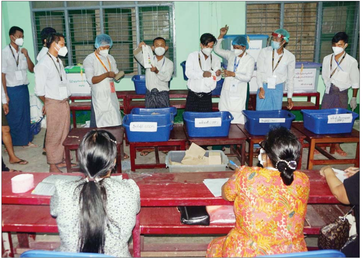
ရန်ကုန်တိုင်းဒေသကြီး ဗဟန်းမြို့နယ် ကိုယ့်မင်းကိုယ်ချင်းလမ်းရှိ မဲရုံ၌ မဲရုံမှူးနှင့်တာဝန်ရှိသူများ ဆန္ဒမဲများ ရေတွက်နေစဉ်။ သတင်းစဉ်