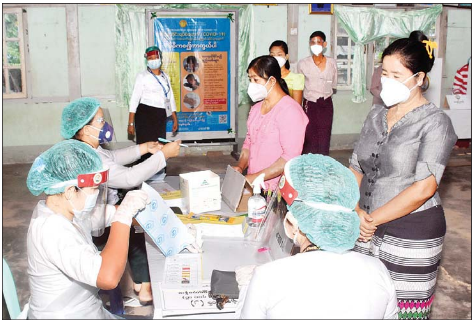
နေပြည်တော် လယ်ဝေးမြို့နယ်တွင် မဲဆန္ဒရှင်များ ဆန္ဒမဲပေးရန် မဲလက်မှတ်များ ထုတ်ယူနေကြစဉ်။

နေပြည်တော် ပြည်ထောင်စု နယ်မြေအတွင်းရှိ မဲဆန္ဒရှင်ပြည်သူ များက ဧမ္မာသီရိမြို့နယ်၊ ဒက္ခိဏသီရိ