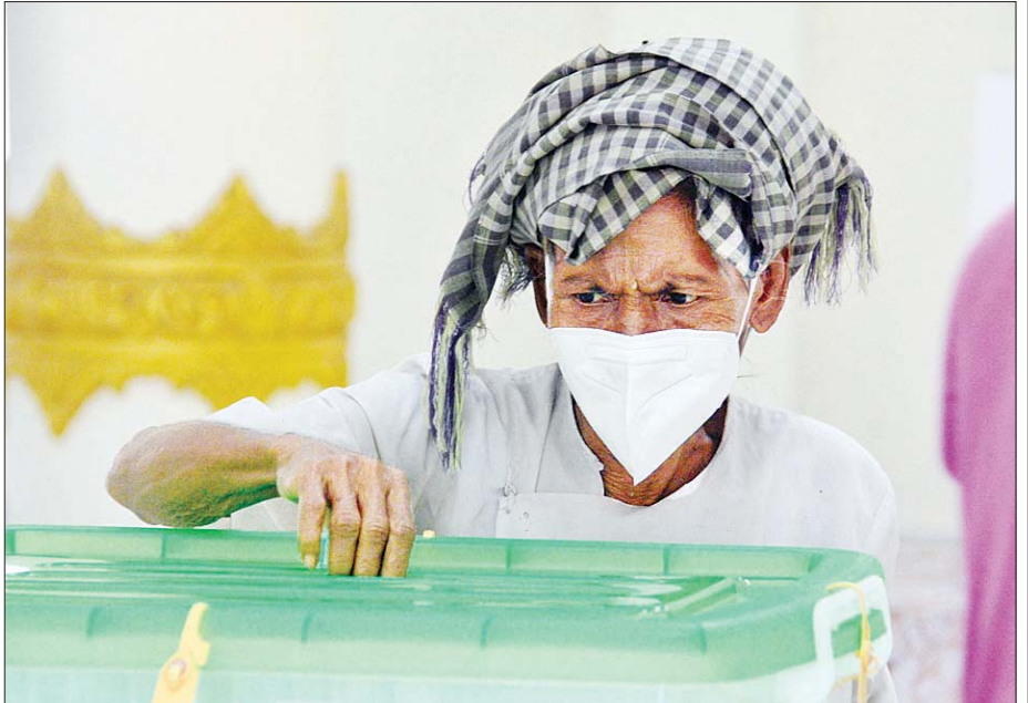
ပျဉ်းမနားမြို့နယ် ရွာကောက်ရပ်ကွက်ရှိ မဲရုံ၌ သက်ကြီးမဲဆန္ဒရှင်တစ်ဦး ဆန္ဒမဲပေးစဉ်။