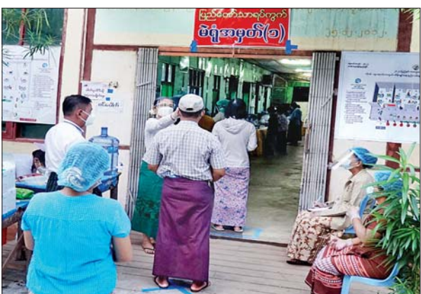
မကွေးတိုင်းဒေသကြီး မကွေးမြို့ ပြည်တော်သာ ရပ်ကွက်ရှိ မဲရုံအမှတ် (၁)တွင် မဲဆန္ဒရှင်များအား မဲရုံတာဝန်ရှိသူများက ကျန်းမာရေးဆိုင်ရာ လမ်းညွှန်ချက်များနှင့်အညီ ကျန်းမာရေးစစ်ဆေးပေးနေစဉ်။ သန်းနိုင်ဦး(ငယ်)