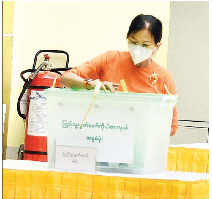
တပ်မတော်ကာကွယ်ရေးဦးစီးချုပ် ဗိုလ်ချုပ်မှူးကြီး မင်းအောင်လှိုင်နှင့်ဇနီး ဒေါ်ကြူကြူလှတို့ ဆန္ဒမဲပေးကြစဉ်။