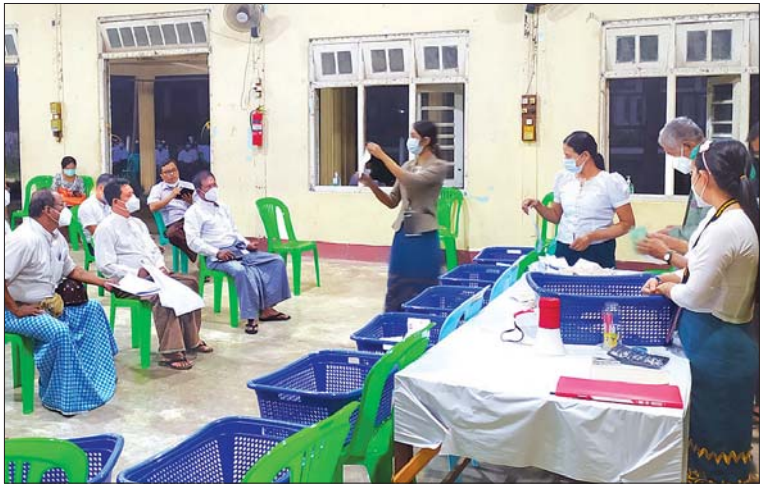
ဧရာဝတီတိုင်းဒေသကြီး ရေကြည်မြို့နယ်ရှိ မဲရုံတစ်ရုံတွင် မဲရုံတာဝန်ရှိသူများ မဲစာရင်းများ ရေတွက်နေစဉ်။

၂၀၂၀ ပြည့်နှစ် ပါတီစုံဒီမိုကရေစီ အထွေထွေရွေးကောက်ပွဲကို နိုဝင်ဘာ ၈ ရက်တွင် တစ်နိုင်ငံလုံး၌ တစ်ချိန်တည်း၊ တစ်ပြိုင်တည်း ကျင်းပရာ မဲဆန္ဒရှင်ပြည်သူများက မိမိတို့ ကြိုက်နှစ်သက်ရာ ကိုယ်စားလှယ်လောင်းများကို လွတ်လပ်စွာ ဆန္ဒမဲပေး ရွေးချယ်ကြသည်။ ထိုသို့ ဆန္ဒမဲပေးရွေးချယ်ကြသည့် တိုင်းဒေသကြီးများမှ မြို့နယ်အလိုက် ပြည်သူများ၏ ဆန္ဒမဲပေးမှု ပုံရိပ်များကို စုစည်းဖော်ပြလိုက်ပါသည်-