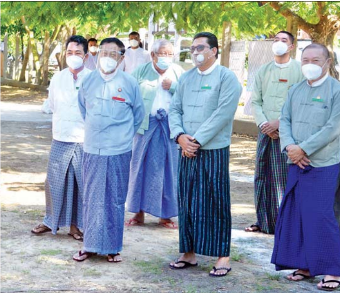
ပြည်ထောင်စုရွေးကောက်ပွဲကော်မရှင်ဥက္ကဋ္ဌ ဦးလှသိန်း ဥတ္တရသီရိမြို့နယ် ဥတ္တရသီရိကုန်တိုက် မဲရုံအမှတ် (၁) အ.မ.က (ချင်းရွာ) ၌ မဲဆန္ဒရှင်ပြည်သူများ လာရောက်ဆန္ဒမဲပေးမှုကို ကြည့်ရှုစဉ်။ သတင်းစဉ်

၂၀၂၀ ပြည့်နှစ် ပါတီစုံ ဒီမိုကရေစီ အထွေထွေ ရွေးကောက်ပွဲဆိုင်ရာ အချက်အလက်များ