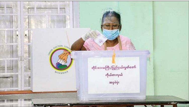
မန္တလေးတိုင်းဒေသကြီး မိတ္ထီလာမြို့နယ်၌ မဲဆန္ဒရှင်တစ်ဦး ဆန္ဒမဲပေးစဉ်။ ချမ်းသာ(မိတ္ထီလာ)