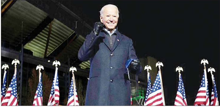
၂၀၂၀ ရွေးကောက်ပွဲတွင် လက်ရှိသမ္မတဒေါ်နယ်ထရမ်ကို ဖြတ်ကျော်ပြီး အမေရိကန်သမ္မတဖြစ်လာသူ ဒီမိုကရက်တစ်ပါတီမှ ဂျိုးဘိုင်ဒင်ကို တွေ့ရစဉ်။

အိန္ဒိယဝန်ကြီးချုပ် နာရင်ဒရာမိုဒီကလည်း ဘိုင်ဒင်၏ အောင်မြင်မှုအတွက် ဝမ်းသာဂုဏ်ယူကြောင်း တွစ်တာပေါ်တွင် ရေးသားဖော်ပြလိုက်သည်။ ဒုတိယသမ္မတ တာဝန်ယူစဉ်အချိန်တုန်းက အင်ဒို-အမေရိကန်ဆက်ဆံရေးကို ပိုမိုအခွန်ရှည်အောင် ဆောင်ရွက်ခြင်းသည် အဓိကကျပြီး တန်ဖိုးဖြတ်မရပါကြောင်းနှင့် ယခုတစ်ခါထပ်မံပြီး အိန္ဒိယ-အမေရိကန်ဆက်ဆံရေးကို ပိုမိုမြှင့်တင်အောင် စွမ်းဆောင်