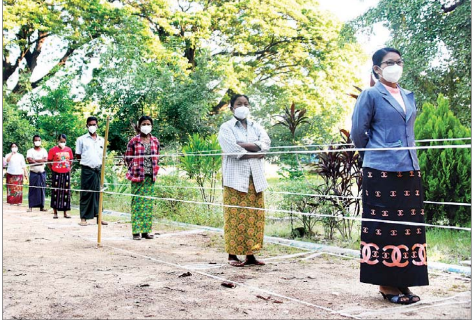
နေပြည်တော် ပျဉ်းမနားမြို့နယ်တွင် မဲဆန္ဒရှင်များ ဆန္ဒမဲပေးရန် စောင့်ဆိုင်းနေစဉ်။

စစ်ဆေးပြသကြပြီး ပြည်ထောင်စု ရွေးကောက်ပွဲကော်မရှင်က သတ်မှတ် ထားသည့် လုံခြုံရေးကြီးများနှင့် မဲပုံး များကို စနစ်တကျပိတ်သည်။