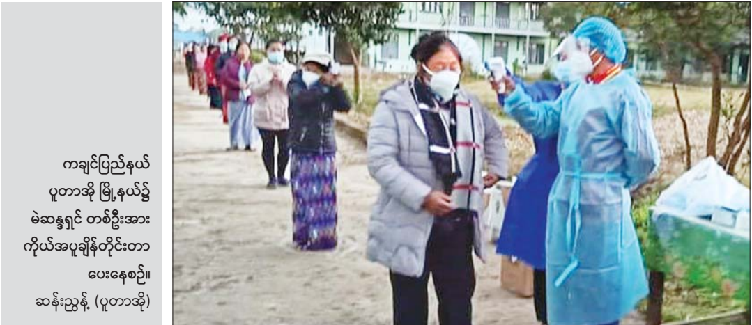
ကချင်ပြည်နယ် ပူတာအို မြို့နယ်၌ မဲဆန္ဒရှင် တစ်ဦးအား ကိုယ်အပူချိန်တိုင်းတာ ပေးနေစဉ်။