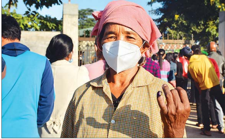
ကယားပြည်နယ် လွိုင်ကော်မြို့မှ ဆန္ဒမဲပေးပြီးသည့် မဲဆန္ဒရှင်အဘွားအား တွေ့ရစဉ်။ ကိုစိုင်း (လွိုင်ကော်)