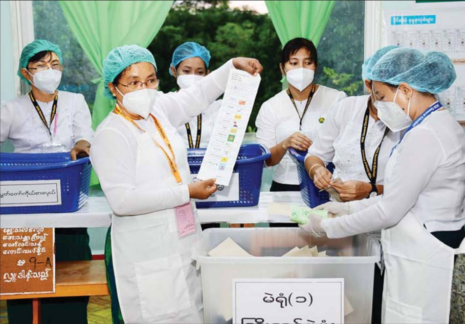
နေပြည်တော် အ.ထ.က (၇) တွင် ဆန္ဒမဲများ ရေတွက်နေစဉ်။