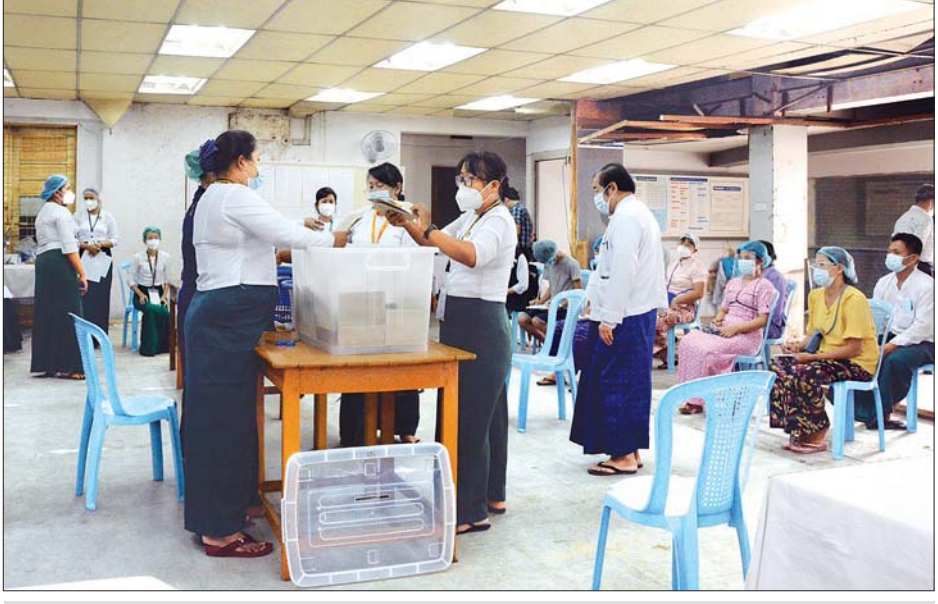
ဗိုလ်တထောင်မြို့နယ် အမှတ် (၉) ရပ်ကွက် မဲရုံအမှတ် (၁) ၌ မဲရုံမှူးနှင့် တာဝန်ရှိသူများ ဆန္ဒမဲများ ရေတွက် နေစဉ်။