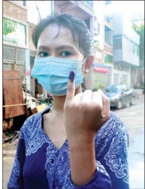
မသီရိခေတ်