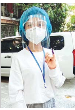
မဆုလွဲမွန်

ပထမဆုံးအကြိမ် မဲပေးခွင့်ရတာပါ။ ပြည်သူတစ်ယောက်အနေနဲ့ နိုင်ငံတာဝန်တစ်ခုကို ထမ်းဆောင်လိုက်ရသလို၊ ပြည်သူ့တာဝန်ကျေသလို ခံစားမိတယ်။ မဲပေးတဲ့အခါမှာလည်း သက်ဆိုင်ရာက အစစအရာရာအဆင်ပြေအောင် စီစဉ်ပေးထားတဲ့