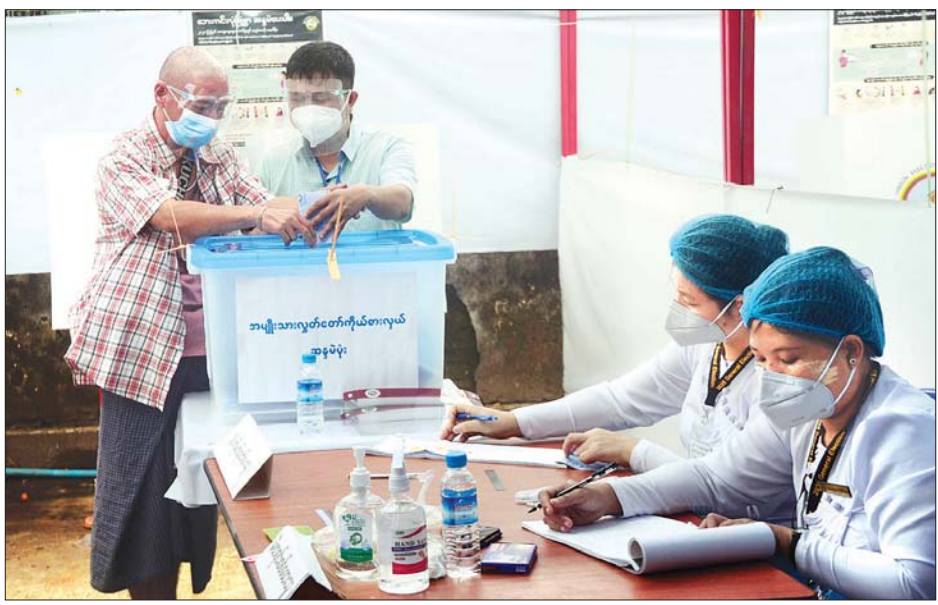
ကြည့်မြင်တိုင်မြို့နယ် မကျည်းတန်းတောင် အရှေ့ရပ်ကွက် မဲရုံအမှတ် (၂) ၌ အမြင်အာရုံမသန်စွမ်းသည့် မဲဆန္ဒရှင် တစ်ဦး ပါဝင်ဆန္ဒမဲပေးနေစဉ်။