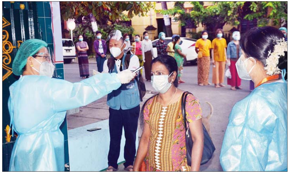
မန္တလေးမြို့ မဲဆန္ဒရှင်များအား မဲရုံတာဝန်ရှိသူများက ကျန်းမာရေးစစ်ဆေးပေးစဉ်။ သတင်းစဉ်