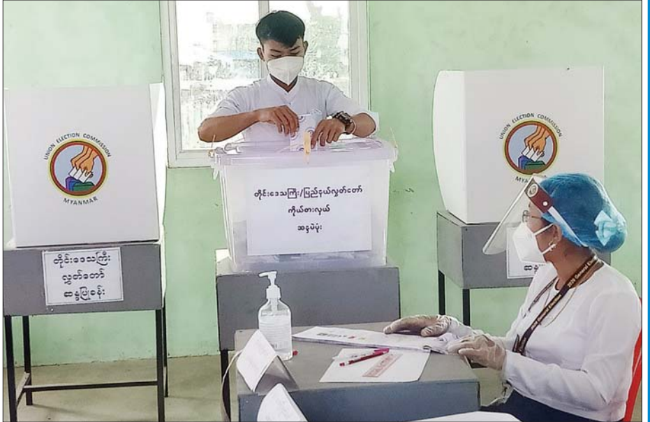
ဧရာဝတီတိုင်းဒေသကြီး ပန်းတနော်မြို့နယ်၌ မဲဆန္ဒရှင်တစ်ဦး ဆန္ဒမဲပေးစဉ်။ ပြည့်ဖြိုးကျော် (ပြန်/ဆက်)