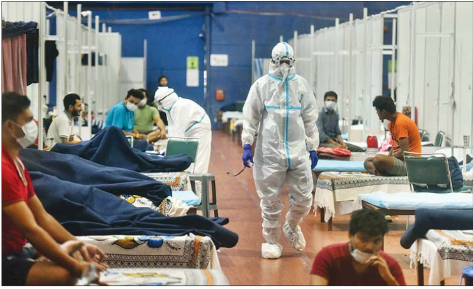
အိန္ဒိယနိုင်ငံ ဆေးရုံတစ်ရုံတွင် ကိုဗစ်-၁၉ လူနာများကို သက်ဆိုင်ရာ တာဝန်ကျဆေးဝန်ထမ်းများက စစ်ဆေးနေစဉ်။

လေထုညစ်ညမ်းမှု အဆင့်နှင့် ကိုဗစ်-၁၉ ကူးစက်မှုကို တားဆီး ထိန်းချုပ်သည့်အနေဖြင့် ကြာသပတေးနေ့က ဒေလီဝန်ကြီးချုပ်က နိုဝင်ဘာ ၁၄ ရက်တွင် ကျရောက်မည့် ဒီပဲလီပွဲတော်တွင် မီးရှူးမီးပန်း ဖစ်ဖောက်ခွင့် တားမြစ်ထားလိုက် သည်။ ဆင်ဟွာ