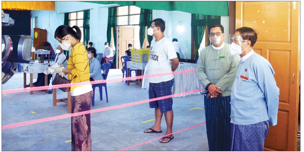
ပြည်ထောင်စုရွေးကောက်ပွဲကော်မရှင်ဥက္ကဋ္ဌ ဦးလှသိန်း၊ ဧပြီသီရိမြို့နယ် ဇေယျသိဒ္ဓိရပ်ကွက် မဲရုံအမှတ် (၁) ၌ မဲဆန္ဒရှင်ပြည်သူများ ဆန္ဒမဲပေးနေမှုကို ကြည့်ရှုစစ်ဆေးစဉ်။ သတင်းစဉ်

နိုင်ငံသာယာပြောဖို့ သဘာဝတောတွေ ထိန်းသိမ်းဖို့