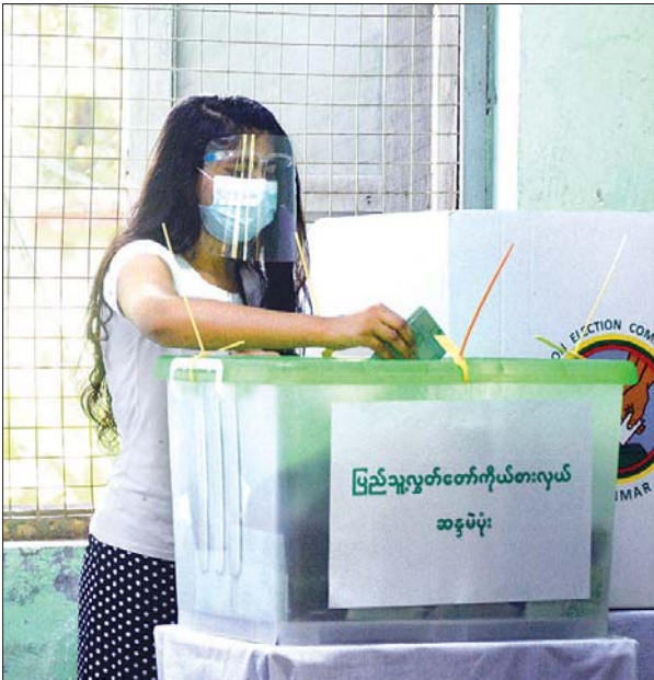
ရန်ကုန်တိုင်းဒေသကြီး အင်းစိန်မြို့နယ် ပေါက်တော ရပ်ကွက်ရှိ မဲရုံ (၂) တွင် မဲဆန္ဒရှင်တစ်ဦး ဆန္ဒမဲ ပေးနေစဉ်။ သတင်းစဉ်

၂၀၂၀ ပြည့်နှစ် ပါတီစုံဒီမိုကရေစီ အထွေထွေရွေးကောက်ပွဲကို နိုဝင်ဘာ ၈ ရက်တွင် တစ်နိုင်ငံလုံး၌ တစ်ချိန်တည်း၊ တစ်ပြိုင်တည်း ကျင်းပရာ မဲဆန္ဒရှင်ပြည်သူများက မိမိတို့ ကြိုက်နှစ်သက်ရာ ကိုယ်စားလှယ်လောင်းများကို လွတ်လပ်စွာ ဆန္ဒမဲပေး ရွေးချယ်ကြသည်။ ထိုသို့ ဆန္ဒမဲပေးရွေးချယ်ကြသည့် ရန်ကုန်တိုင်းဒေသကြီးနှင့် မန္တလေးတိုင်းဒေသကြီးတို့မှ မြို့နယ်အလိုက် ပြည်သူများ၏ ဆန္ဒမဲပေးမှု ပုံရိပ်များကို စုစည်းဖော်ပြလိုက်ပါသည် -