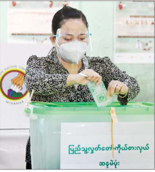
နေပြည်တော် ဇေယျာသီရိမြို့နယ်တွင် မဲဆန္ဒရှင်တစ်ဦး ဆန္ဒမဲပေးစဉ်။