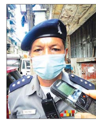
ဒုတိယရဲမှူး ညီညီ