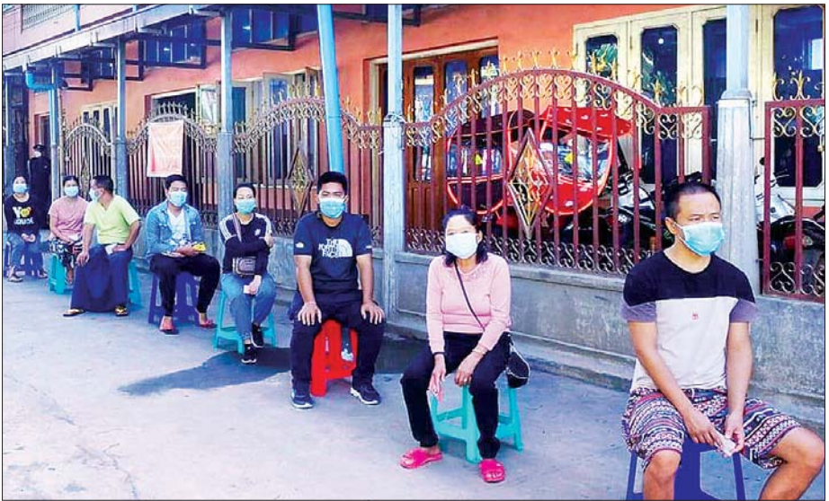
ရှမ်းပြည်နယ် မြောက်ပိုင်း မူဆယ် မြို့နယ်ရှိ မဲရုံတစ်ရုံ၌ မဲဆန္ဒရှင်များ ဆန္ဒမဲပေးရန် စောင့်ဆိုင်း နေစဉ်။ ဆလိုင်း ဗန်ရိုးထန် (ပြန်/ဆက်)