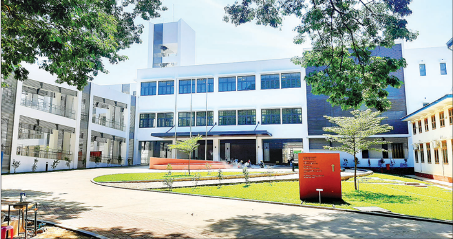
ဇေယျတု(မကွေး)

ယင်းဆေးရုံကြီး ဝင်းအတွင်း၌ ပြည်ထောင်စုဘတ်ဂျက်နှင့် တိုင်းဒေသကြီးအစိုးရရန်ပုံငွေ ပံ့ပိုးမှုများဖြင့် တည်ဆောက်ခဲ့သည့် ငါးထပ်တိုးချဲ့ဆောင်ကြီးနှင့် ဂျပန်နိုင်ငံ(JICA) မှ လှူဒါန်းသည့် အမေရိကန်ဒေါ်လာ ၁၂ ဒသမ ၈ သန်းတန်သားဖွားမီးယပ်နှင့် မွေးကင်းစကလေး ကုသဆောင်(သုံးထပ်အဆောက်အအုံ)မှာ တည်ဆောက်ပြီးစီးနေပြီဖြစ်ကြောင်း သိရသည်။ (ဝဲပုံ)