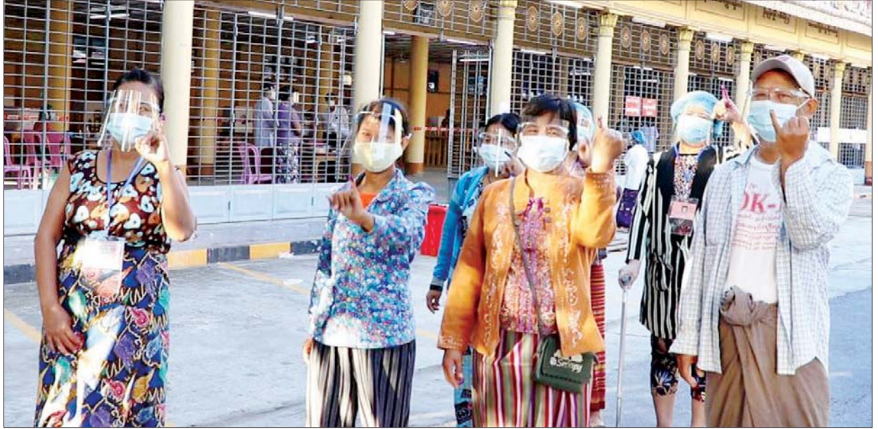
မန္တလေးမြို့မှ ဆန္ဒမဲပေးပြီးသည့် မဲဆန္ဒရှင်များ။ သတင်းစဉ်