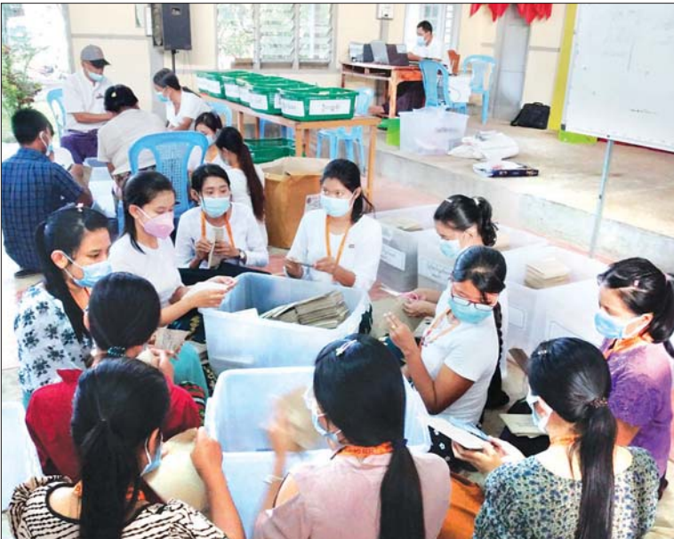
မွန်ပြည်နယ် ကျိုက်မရော မြို့နယ် မဲရုံ တစ်ရုံ၌ မဲဆန္ဒရှင် ပြည်သူများ၏ မဲများကို ရေတွက် နေစဉ်။ ချိုချို (ပြန်/ဆက်)

၂၀၂၀ ပြည့်နှစ် ပါတီစုံဒီမိုကရေစီ အထွေထွေရွေးကောက်ပွဲကို နိုဝင်ဘာ ၈ ရက်တွင် တစ်နိုင်ငံလုံး၌ တစ်ချိန်တည်း၊ တစ်ပြိုင်တည်း ကျင်းပရာ မဲဆန္ဒရှင်ပြည်သူများက မိမိတို့ ကြိုက်နှစ်သက်ရာ ကိုယ်စားလှယ်လောင်းများကို လွတ်လပ်စွာ ဆန္ဒမဲပေး ရွေးချယ်ကြသည်။ ထိုသို့ ဆန္ဒမဲပေးရွေးချယ်ကြသည့် ပြည်နယ်များမှ မြို့နယ်အလိုက် ပြည်သူများ၏ ဆန္ဒမဲပေးမှု ပုံရိပ်များကို စုစည်းဖော်ပြလိုက်ပါသည်-