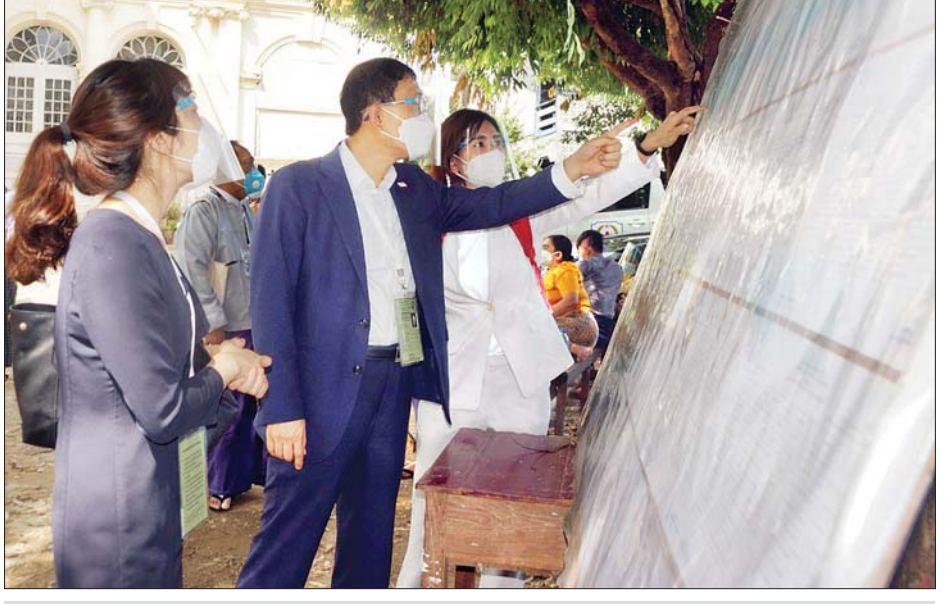
မြန်မာနိုင်ငံဆိုင်ရာ ကိုရီးယားနိုင်ငံသံရုံးမှ တာဝန်ရှိသူများ ဗဟန်းမြို့နယ်ရှိ အိမ်တွင်းအသက်မွေးဝမ်းကျောင်း ပညာဆိုင်ရာ သင်တန်းကျောင်း မဲရုံ၌ ကြည့်ရှုလေ့လာကြစဉ်။