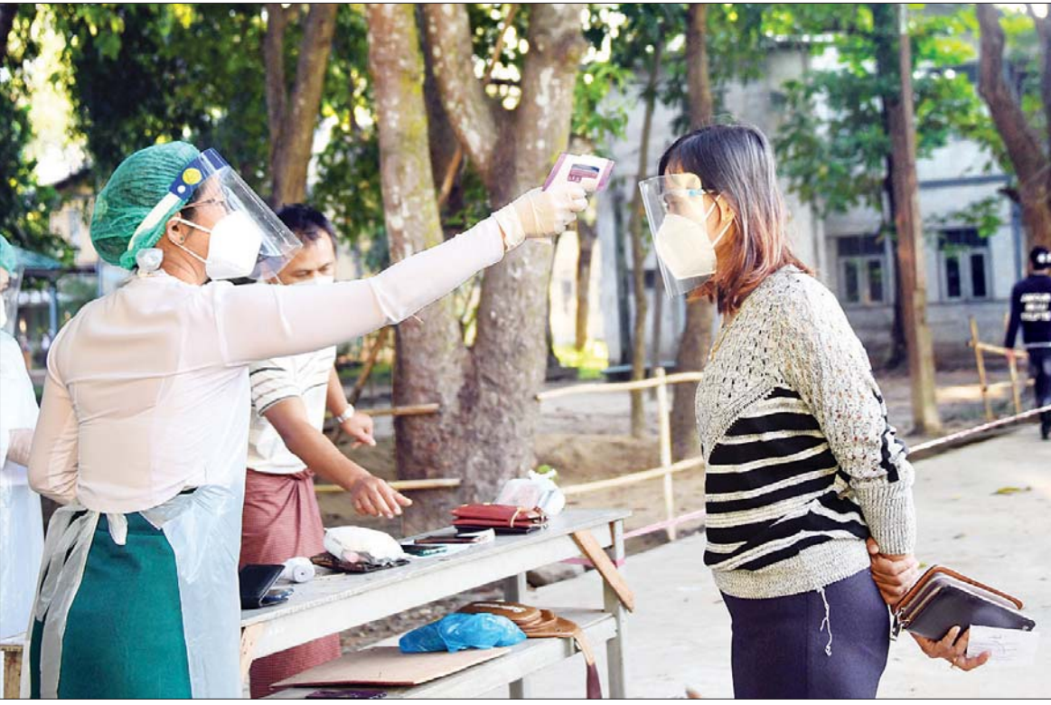
နေပြည်တော် လယ်ဝေးတွင် မဲဆန္ဒရှင်တစ်ဦးအား အပူချိန်တိုင်းပေးနေစဉ်။