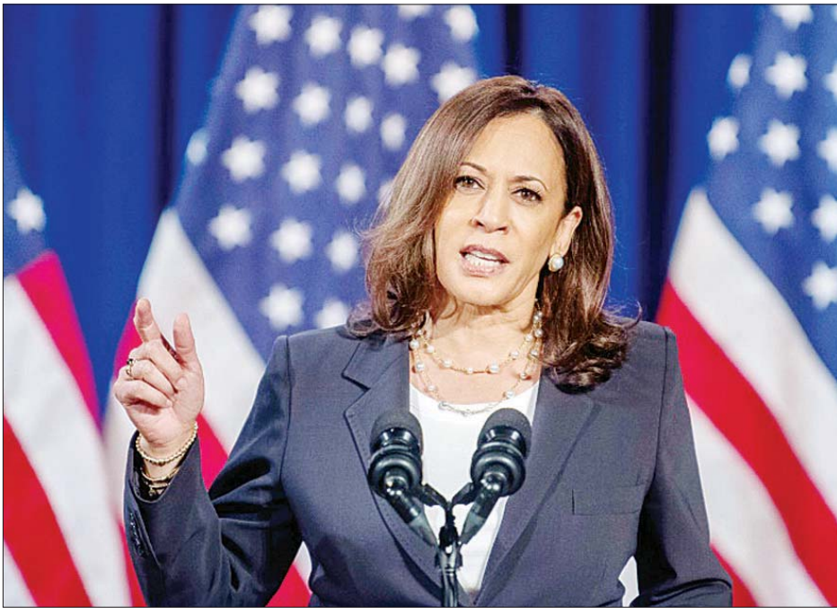
ကာမလာဟားရစ်

ဝါရှင်တန် နိုဝင်ဘာ ၈ အမေရိကန်သမ္မတ ရွေးကောက်ပွဲတွင် ဒီမိုကရက်တစ်ကိုယ်စားလှယ် ဂျိုးဘိုင်ဒင် အနိုင်ရရှိသွားပြီးဖြစ်သည့် အတွက် ၎င်း၏ တွဲဖက်ဖြစ်သူ ကာမလာဟားရစ်သည် အမေရိကန်၏ ပထမဆုံးသော အမျိုးသမီးဒုတိယသမ္မတ ဖြစ်လာတော့မည်ဖြစ်သည်။ ကာမလာဟားရစ်သည် အမေရိကန်၏ ဒုတိယသမ္မတနေရာ ရောက်ရှိလာတော့မည့် ပထမဆုံးသော အာရှ- အမေရိကန်နိုင်ငံသား လူမည်း အမျိုးသမီး တစ်ဦးလည်း ဖြစ်သည်။ အသက် ၅၆ နှစ် ရှိပြီဖြစ်သည့် ဟားရစ်သည် ၂၀၁၆ ခုနှစ်တွင် အမေရိကန် ဆီးနိတ်လွှတ်တော် ကိုယ်စားလှယ်အဖြစ် ရွေးချယ်ခံခဲ့ရပြီး ၎င်းသည် ကယ်လီဖိုးနီးယားပြည်နယ် ၏ ရှေ့နေချုပ်အဖြစ်လည်း တာဝန်ထမ်းဆောင်ခဲ့သူဖြစ်သည်။ ရွေးကောက်ပွဲတွင် အနိုင်ရရှိသွားသူ ဂျိုးဘိုင်ဒင် သမ္မတတာဝန် ထမ်းဆောင်ချိန်တွင် အသက် ၇၈ နှစ် ရှိတော့မည်ဖြစ်ရာ ကာမလာဟားရစ်ကို နောက်လအတွက် သမ္မတ ရွေးကောက်ပွဲအတွက် ဒီမိုကရက်တစ်