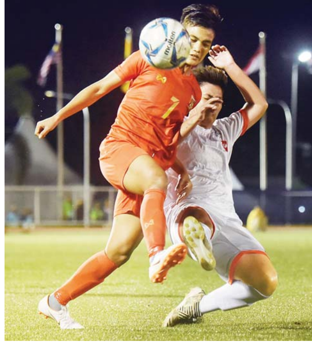
၂၀၁၉ ဆီးဂိမ်းပြိုင်ပွဲတွင် မြန်မာအသင်း ယှဉ်ပြိုင်နေစဉ်။