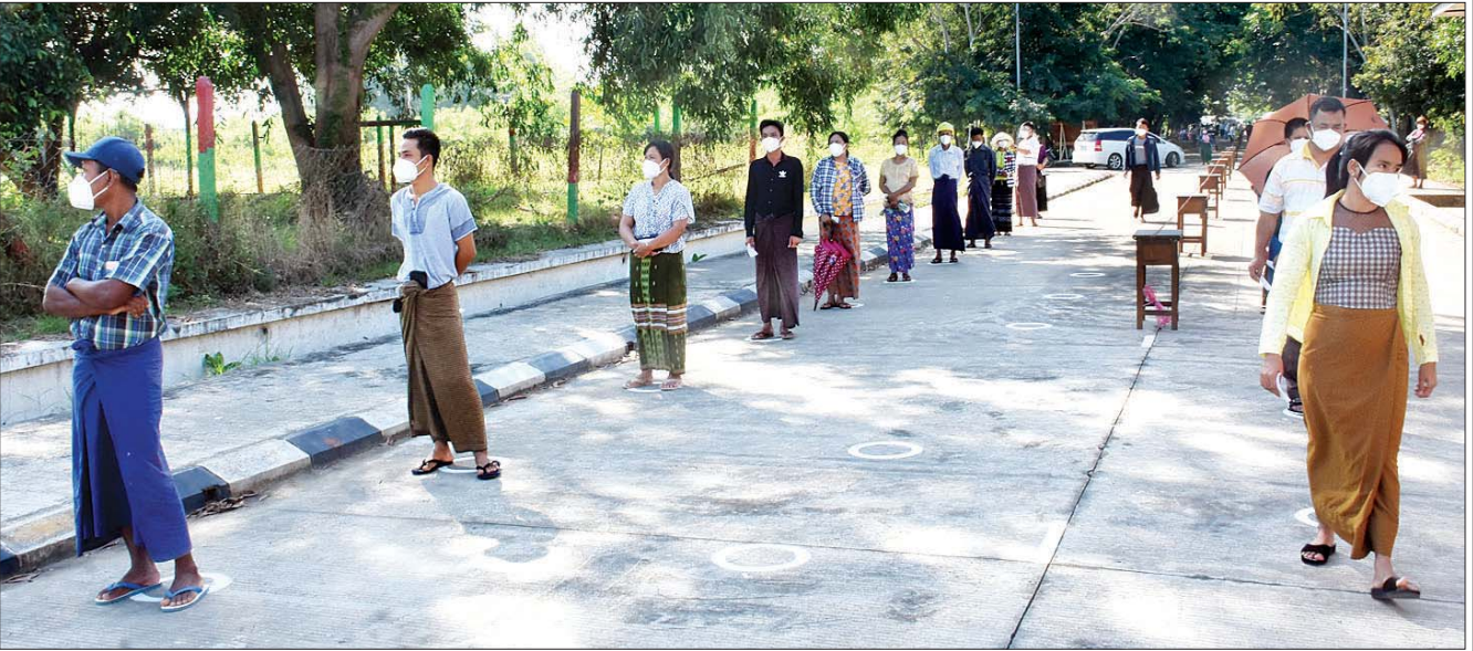
နေပြည်တော် ပုဗ္ဗသီရိမြို့နယ်တွင် မဲဆန္ဒရှင်များ ဆန္ဒမဲပေးရန် စောင့်ဆိုင်းနေစဉ်။