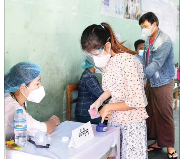
နေပြည်တော် ဧယျာသီရိမြို့နယ်တွင် မဲဆန္ဒရှင်တစ်ဦး ဆန္ဒမဲပေးပြီး လက်သန်းတွင် မင်တို့စဉ်။

ယခုရွေးကောက်ပွဲတွင် နိုင်ငံရေး ပါတီစုံပါတီ ဝင်ရောက်ယှဉ်ပြိုင်ကြပြီး ဆန္ဒမဲပေးပိုင်ခွင့်ရှိသူ ၃၇၂၆၈၈၇ ဦး ရှိကာ မဲရုံပေါင်း ၃၉၉၆၅ ရုံ ဖွင့်လှစ် ထားရှိကြောင်း သိရသည်။