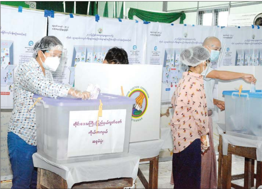
ရန်ကုန်တိုင်းဒေသကြီး လှိုင်သာယာမြို့နယ်ရှိ မဲရုံအမှတ် (၄) တွင် မဲဆန္ဒရှင်ပြည်သူများ ဆန္ဒမဲပေးကြစဉ်။ သတင်းစဉ်