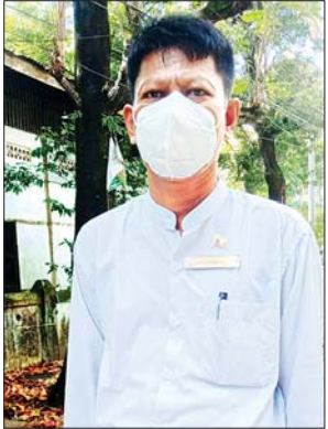
ဦးဇော်မြင့်နိုင်