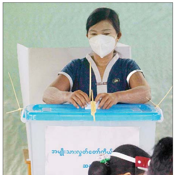
တနင်္သာရီတိုင်းဒေသကြီး မြိတ်ခရိုင် ကျွန်းစုမြို့နယ်ရှိ မဲရုံတစ်ရုံတွင် မဲဆန္ဒရှင်တစ်ဦး ဆန္ဒမဲပေးနေစဉ်။