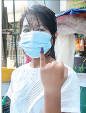
မဇင်မာလွင်