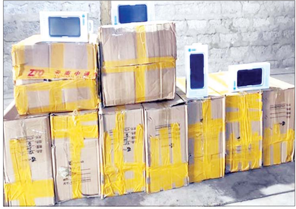
ဖမ်းဆီးရမိသည့် တရားဝင် စာရွက်စာတမ်းတစ်စုံတစ်ရာ တင်ပြနိုင်ခြင်းမရှိသည့် Power Bank For Mobile Phone များကို တွေ့ရစဉ်။

ထူးခြားဖမ်းဆီးမှု အနေဖြင့် နိုဝင်ဘာ ၇ ရက်တွင် ရေပူအမြဲတမ်းစစ်ဆေးရေးစခန်းမှ တာဝန်ကျ အကောက်ခွန် စစ်ဆေးရေးအဖွဲ့သည် မူဆယ်မှ လာရှိုးသို့ထွက်ခွာလာသော ခရီးသည်တင် ယာဉ်ငယ်များကို စစ်ဆေးရာ တရားဝင်စာရွက်စာတမ်း တစ်စုံတစ်ရာ တင်ပြနိုင်ခြင်းမရှိသည့် Power Bank For Mobile Phone (10000 Mah) (C/O China) (250 U)၊ ခန့်မှန်းတန်ဖိုး ငွေကျပ် ၁ ဒသမ ၆၂၅ သန်းကို ဖမ်းဆီးရမိခဲ့ကြောင်း သိရသည်။ သတင်းစဉ်