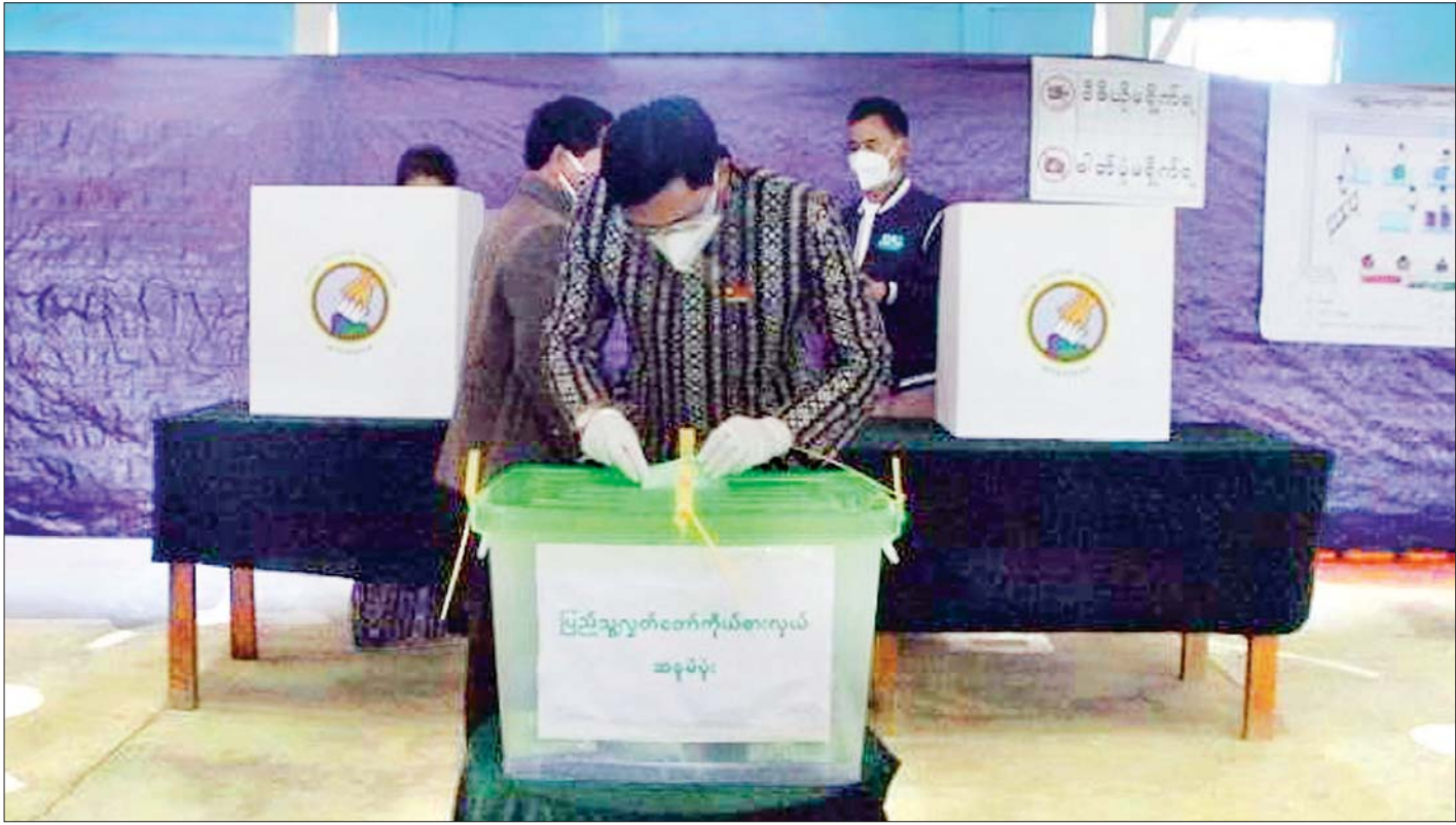
ဒုတိယသမ္မတ ဦးဟင်နရီဗန်ထီးယူ ထန်တလန်မြို့ အမှတ်(၂)ရပ်ကွက် မဲရုံအမှတ်(၁) ၌ ဆန္ဒမဲပေးစဉ်။

ထန်တလန် နိုဝင်ဘာ ၈ ချင်းပြည်နယ် ဟားခါးခရိုင် ထန်တလန်မြို့၌ ၂၀၂၀ ပြည့်နှစ် ပါတီစုံဒီမိုကရေစီ အထွေထွေရွေးကောက်ပွဲ ဆန္ဒမဲပေးခြင်းကို ယနေ့ နံနက် ၆ နာရီတွင် စတင်ခဲ့ရာ မဲဆန္ဒရှင်ပြည်သူများအနေဖြင့် သက်ဆိုင်ရာ မဲရုံအသီးသီး၌ လာရောက်ဆန္ဒမဲပေးခဲ့ကြပြီး ဒုတိယသမ္မတ ဦးဟင်နရီ ဗန်ထီးယူနှင့် ဇနီး ဒေါက်တာရွှေလွမ်း တို့သည် နံနက်ပိုင်း တွင် ထန်တလန်မြို့ အမှတ်(၂)ရပ်ကွက် မြို့နယ်ခန်းမ၌ ဖွင့်လှစ်ထားသော မဲရုံအမှတ်(၁)သို့ လာရောက်၍ ဆန္ဒမဲ ပေးခဲ့ကြသည်။ ထန်တလန်မြို့နယ်၌ မဲရုံပေါင်း ၁၀၅ ရုံ ဖွင့်လှစ်ထားရှိ ပြီး ဆန္ဒမဲပေးခွင့်ရှိသူ ၃၃၈၀၆ ဦးရှိရာ မဲဆန္ဒရှင်ပြည်သူ များသည် မဲရုံစတင်ဖွင့်လှစ်ချိန်မှစ၍ သက်ဆိုင်ရာ မဲရုံ အသီးသီးသို့ လာရောက်ကြပြီး ဆန္ဒမဲပေးခဲ့ကြသည်။ မဲရုံများတွင် ဆန္ဒမဲလာရောက်ပေးသူများ စိတ်ချလုံခြုံစွာ မဲပေးနိုင်ရန်နှင့် ကိုဗစ်-၁၉ရောဂါ ကူးစက်ပြန့်ပွားမှု မရှိစေရေးအတွက် ကျန်းမာရေးနှင့် အားကစားဝန်ကြီးဌာန ၏ ကျန်းမာရေးဆိုင်ရာ လမ်းညွှန်ချက်များနှင့်အညီ ဆန္ဒမဲ ပေးနိုင်ရေး မြို့နယ်ရွေးကောက်ပွဲကော်မရှင်အဖွဲ့ခွဲမှ တာဝန်ရှိသူများ၊ မဲရုံမှူးများနှင့် မဲရုံအဖွဲ့ဝင်များ၊ မဲရုံလုံခြုံရေးများနှင့် စေတနာ့ဝန်ထမ်းများက လိုအပ်သည်များကို ကူညီဆောင်ရွက်ပေးလျက်ရှိကြောင်း သိရသည်။ မြို့နယ်(ပြန်/ဆက်)