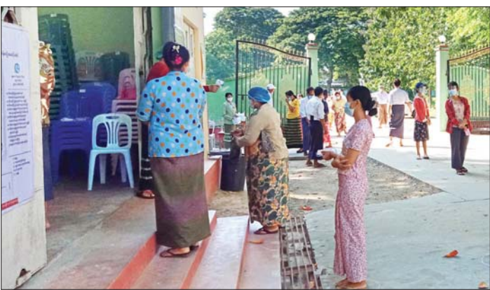
စစ်ကိုင်းတိုင်းဒေသကြီး စစ်ကိုင်းမြို့ရှိ မဲရုံတစ်ရုံတွင် မဲဆန္ဒရှင်များအား မဲရုံတာဝန်ရှိသူများက ကျန်းမာရေးဆိုင်ရာ လမ်းညွှန်ချက်များနှင့်အညီ ကျန်းမာရေး စစ်ဆေးပေးစဉ်။ နိုင်ဇေယျ