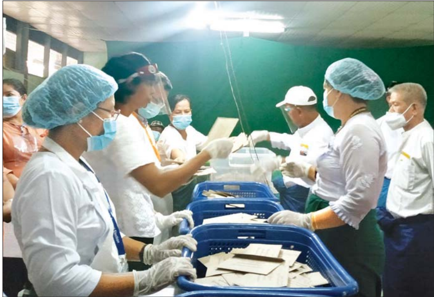
ပဲခူးတိုင်းဒေသကြီး ကဝမြို့နယ်ရှိ မဲရုံတစ်ရုံတွင် မဲရုံတာဝန်ရှိသူများ ဆန္ဒမဲ လက်မှတ်များ ရေတွက်နေစဉ်။