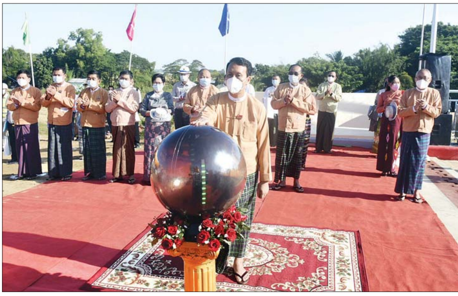
တိုင်းဒေသကြီးဝန်ကြီးချုပ် ဦးဖိုးမင်းသိန်း၊ ပဲခူးမြစ်ကူးတံတား(ဒါးပိန်-သပြေ) ကျောက်စာကို စက်ခလုတ်နှိပ်ဖွင့်လှစ်ပေးစဉ်။