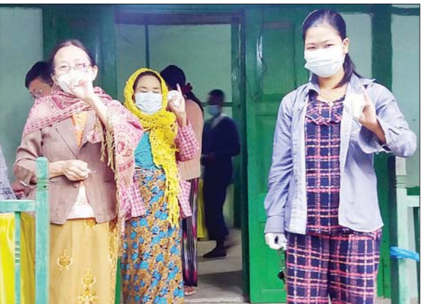
မကွေးတိုင်းဒေသကြီး နတ်မောက်မြို့နယ်မှ ဆန္ဒမဲပေးပြီးသည့် မဲဆန္ဒရှင်များ။

မကွေးတိုင်း ဒေသကြီး ပွင့်ဖြူမြို့နယ်၌ မဲဆန္ဒရှင်များ ဆန္ဒမဲပေးစဉ်။