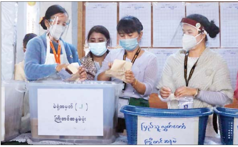
ချင်းပြည်နယ် ဟားခါးမြို့နယ်အတွင်းရှိ မဲရုံတစ်ရုံ၌ မဲဆန္ဒရှင်များ၏ ဆန္ဒမဲများကို ရေတွက် နေစဉ်။ ခရိုင် (ပြန်/ဆက်)