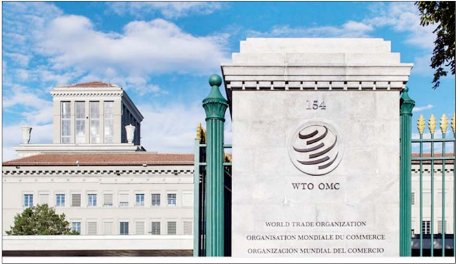
ကမ္ဘာ့ကုန်သွယ်ရေးအဖွဲ့ကြီး၏ ဌာနချုပ် အဆောက်အအုံကို တွေ့ရစဉ် ။

ရာထူးနေရာလစ်လပ်နေဆဲဖြစ်သည့် သို့သော်လည်း အစည်းအဝေးကို နိုဝင်ဘာ ၁၃ ရက် သို့အကြောင်းပြချက် မပေးဘဲ ရွှေ့ဆိုင်းခဲ့သည်။ အမေရိကန်၏ ရုပ်တည်မှုကြောင့် အများသဘောဆန္ဒအတိုင်းဖြစ်လာနိုင်ဖွယ်မရှိဟု သတင်းအရင်းအမြစ်များက ပြောသည်။ ယခင် ကမ္ဘာ့ကုန်သွယ်ရေးအဖွဲ့ ညွှန်ကြားရေးမှူးချုပ်မှာ ၎င်း၏ရာထူးသက်တမ်း မပြီးဆုံးမီ ဩဂုတ်လအတွင်းက ရာထူးမှ နုတ်ထွက်သွားပြီးနောက် အဆိုပါနေရာမှာ ဆက်လက်လစ်လပ်နေဆဲဖြစ်သည်။ အင်နီအိတ်ချ်ကေ