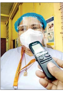
ဒေါ်နုမြတ်စ