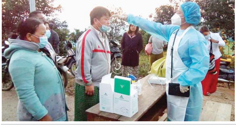
ချင်းပြည်နယ် ကန်ပက်လက်မြို့နယ်၌ မဲဆန္ဒရှင်တစ်ဦးအား ကိုယ်အပူချိန်တိုင်းတာပေး သန်းမောင် (ပြန်/ဆက်)