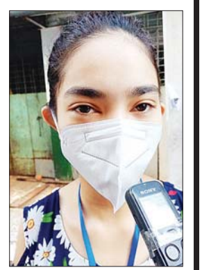
မဝင်းပပလှိုင်

အတွက် ကျေနပ်မိပါတယ်။ ကိုယ်ကြိုက်နှစ်သက်တဲ့ ကိုယ်စားလှယ်လောင်းကို မဲပေးခဲ့ပြီးဆိုတော့ စိတ်ထဲမှာလည်း ကျေနပ်ပြီး ဝိတိဖြစ်မိတယ်။ ရွေးကောက်ပွဲရလဒ်တွေ မသိရသေးပေမယ့် ကိုယ့်မဲပေးခဲ့တဲ့ ကိုယ်စားလှယ်လောင်းတွေအပေါ်မှာ အများကြီးမျှော်လင့်ထားတယ်။ ကိုယ့်ရဲ့ ကိုယ်စားလှယ်လောင်းသာ အနိုင်ရခဲ့မယ်ဆိုရင် အဓိကအနေနဲ့ ပညာရေးပိုင်းကို ပိုမိုအားကောင်းလာအောင် ဆောင်ရွက်ပေးစေချင်ပါတယ်။ ကျန်းမာရေးနဲ့ စီးပွားရေးကလည်း အရေးကြီးပေမယ့် လူငယ်တွေရဲ့ ပညာရေးပိုင်းကို ပိုမိုပြီး အလေးပေး ဆောင်ရွက်ပေးစေချင်ပါတယ်။