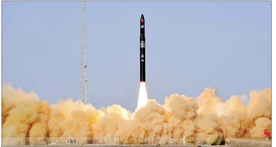
တရုတ်နိုင်ငံ အနောက်မြောက်ပိုင်း ဂျူကျွမ်းဒုံးပျံလွှတ်တင်နေရာမှ နိုဝင်ဘာ ၇ ရက်တွင် အောင်မြင်စွာလွှတ်တင်လိုက် သည့်ကို တွေ့ရစဉ်။

ယခု လွှတ်တင်လိုက်သော CERES-1 ဒုံးပျံသည် တီယန်ချီကျွန်းစတယ်လေးရှင်းမှ ပိုင်ဆိုင်သော ဂြိုဟ်တု ငယ်တစ်စင်းကို သတ်မှတ်ကမ္ဘာပတ်လမ်းအတွင်းထဲသို့ သယ်ဆောင်ပေးခဲ့သည်။ အဆိုပါ တီယန်ချီ-၁၁ ဂြိုဟ်တုကို အချက်အလက်များ စုဆောင်းခြင်းနှင့် ထပ်ဆင့်ထုတ်လွှင့် ခြင်းများ ပြုလုပ်ရန် အသုံးပြုသွားမည်ဖြစ်သည်။ ဆင်ဟွာ