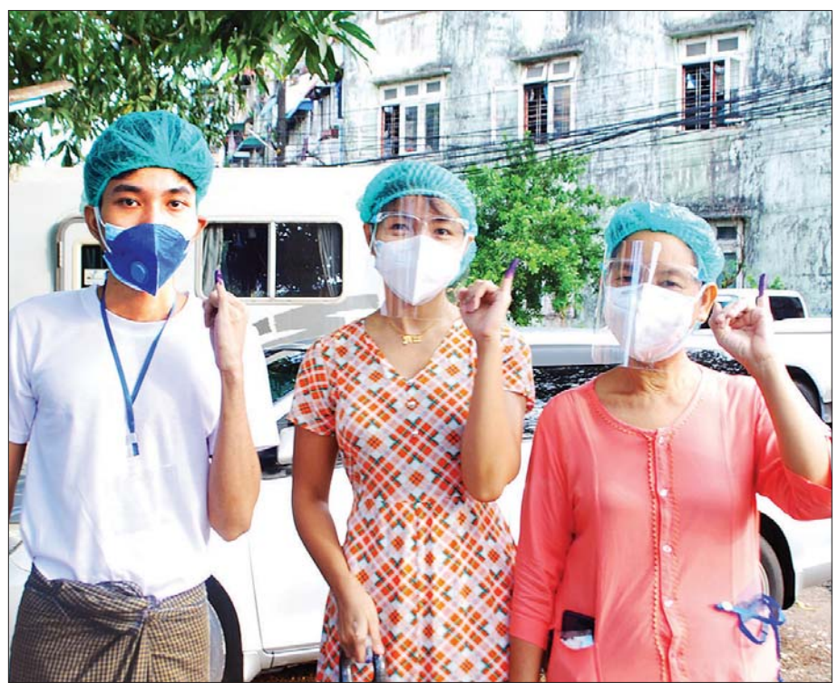
ရန်ကုန်တိုင်းဒေသကြီး ကမာရွတ်မြို့နယ်အတွင်းရှိ မဲရုံ၌ ဆန္ဒမဲပေးပြီးသည့် မဲဆန္ဒရှင်များ။