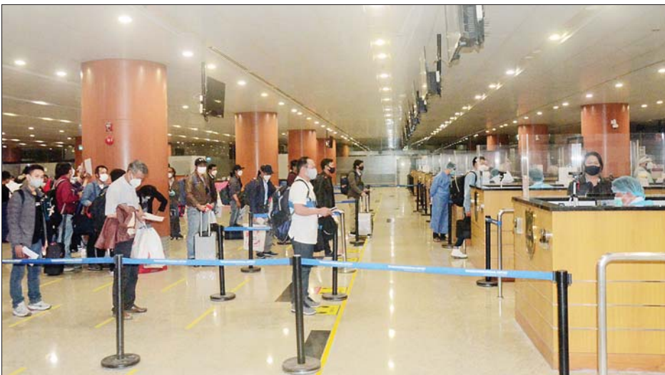
ဆိုင်ရာလေဆိပ်သို့ ရောက်ရှိချိန်တွင် ဆိပ်ကမ်း၊ သီးသန့်စီစဉ်ပေးသည့် အသွားအလာကန့်သတ်မှု ခုနစ်လူဝင်မှုကြီးကြပ်ရေး၊ ကျန်းမာရေး နေရာ / သတ်မှတ်ဟိုတယ်များ၌ ရက်နှင့် နေအိမ်တွင် အသွားအလာ သတင်းစဉ်

နေပြည်တော် နိုဝင်ဘာ ၈ နိုင်ငံတကာခရီးသည်တင် လေယာဉ်များ ပျံသန်းမှု ယာယီရပ်ဆိုင်းထားခြင်းကြောင့် ကိုရီးယားသမ္မတနိုင်ငံ၌ အခက်အခဲကြုံတွေ့နေရသည့် မြန်မာသင်္ဘောသား ၅၅ ဦးနှင့် မြန်မာအလုပ်သမား ၅၅ ဦး မြန်မာနိုင်ငံသား စုစုပေါင်း ၁၀၀ ဦးကို ဆိုးလ်မြို့ရှိ မြန်မာသံရုံးနှင့် JSM International ကုမ္ပဏီတို့မှ ပူးပေါင်းစီစဉ်သည့် မြန်မာအမျိုးသားလေကြောင်းလိုင်း (MNA) ကယ်ဆယ်ရေး လေယာဉ်ဖြင့် ပြန်လည်ခေါ်ဆောင်ခဲ့ရာ ယနေ့ည ၈ နာရီတွင် ရန်ကင်းအပြည်ပြည်ဆိုင်ရာ လေဆိပ်သို့ အဆင်ပြေချောမွေ့စွာ ပြန်လည်ရောက်ရှိကြသည်။