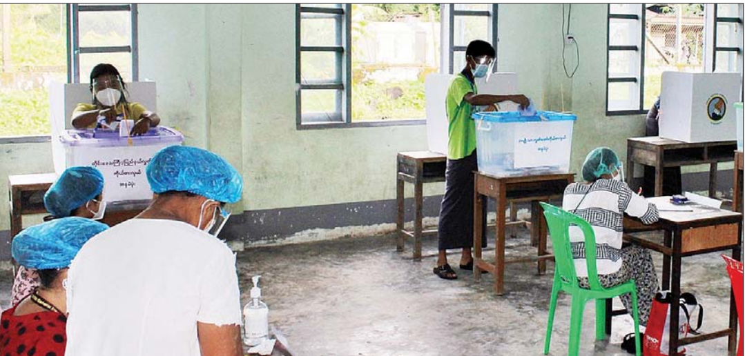
ရန်ကုန်တိုင်း ဒေသကြီး ဒလမြို့နယ်၌ မဲဆန္ဒရှင်များ ဆန္ဒမဲပေးစဉ်။