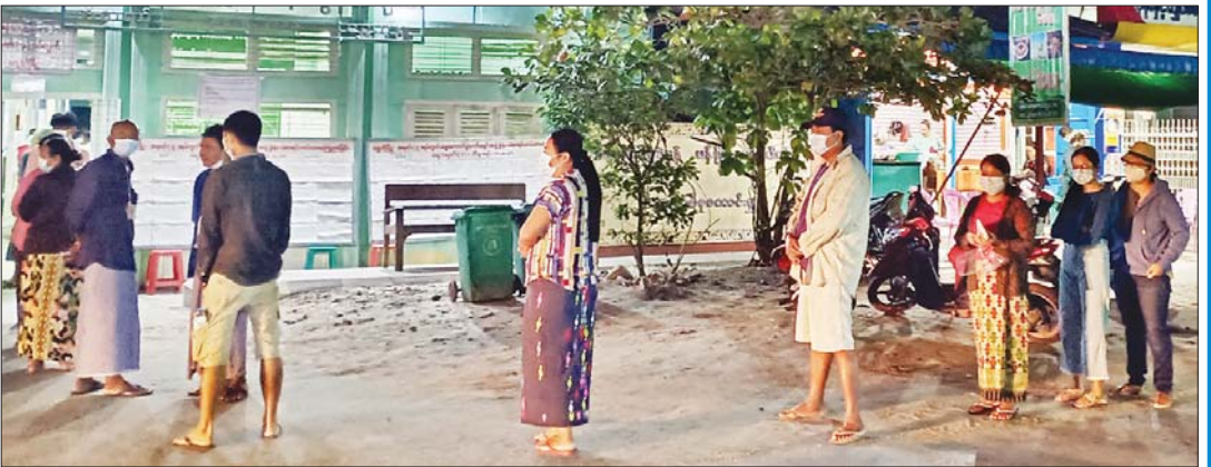
စစ်ကိုင်းတိုင်းဒေသကြီး ရွှေဘိုမြို့နယ်၌ ဆန္ဒမဲပေးရန် စောင့်ဆိုင်းနေသည့် မဲဆန္ဒရှင်များ။