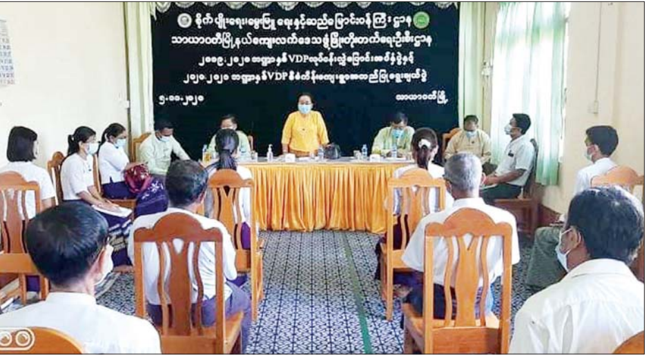
သာယာဝတီမြို့နယ်ကျေးလက်ဒေသဖွံ့ဖြိုးတိုးတက်ရေးဦးစီးဌာန၊ ၂၀၂၀-၂၀၂၁ ဘဏ္ဍာနှစ် VDF လုပ်ငန်းညှိနှိုင်းအစီအစဉ် ဖွံ့ဖြိုးရေးအစီအစဉ် အစည်းအဝေးအတွင်း ဖွဲ့စည်းပေးခဲ့သည့် ကျေးရွာ ၂၀ ရွေးချယ်ခြင်းအား ဆောင်ရွက်နေကြောင်း မြို့နယ်ကျေးလက်ဒေသ ဖွံ့ဖြိုးတိုးတက်ရေးဦးစီးဌာနမှ သိရသည်။