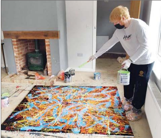
အဆိုတော် အက်ဒ်ရီရန် ပရဟိတရန်ပုံငွေလေလံပွဲတွင် လှူဒါန်းမည့် ပန်းချီကား ဆွဲနေစဉ်။