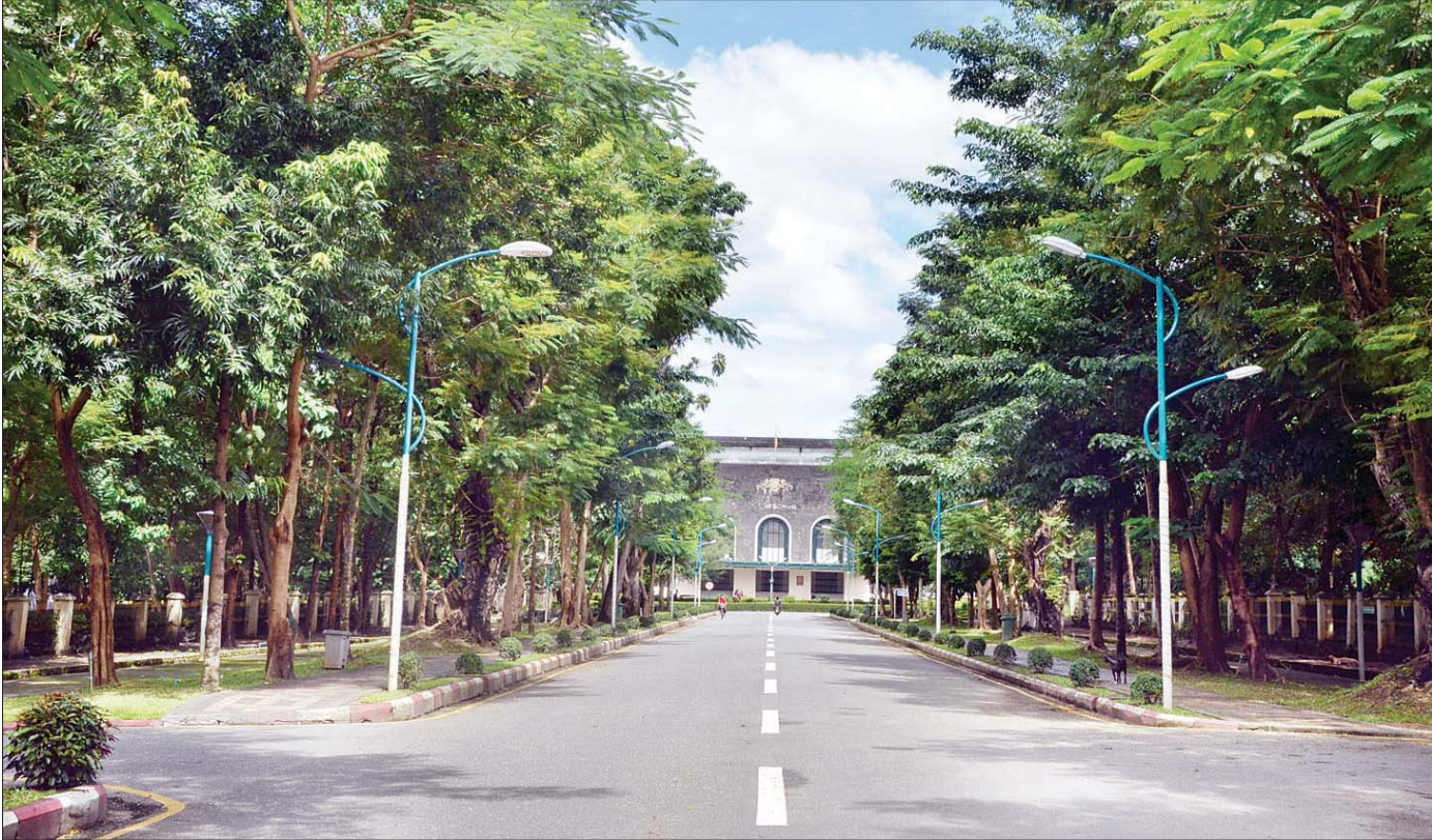
အဓိပတိလမ်းမထက်က ခွံညားထည်ဝါစွာတည်ရှိနေသည့် ဘွဲ့နှင်းသဘင်ခန်းမ။

မြကျွန်းညိုညို ကွန်းခိုရာ ဤတက္ကသိုလ်မြေမှာ ကံ့ကော်တို့ဝေမြ၊ စိန်ပန်းတို့ဝေဆဲ ၊ ငှုဝိပိတောက်တို့ ပွင့်မြပွင့်ဆဲပင် ဖြစ်သည်။ နှစ်လကြာညောင်း အချိန်တွေအလီလီပြောင်းသော်လည်း အတိတ်နယ်က အရိပ်တို့သည် နုပျိုဆဲ၊ လတ်ဆတ်ဆဲဖြစ်သည်။ တွေးမိတိုင်း လွမ်းတ၊ မျှော်မိတိုင်း မှန်းဆနေရပေသည်။