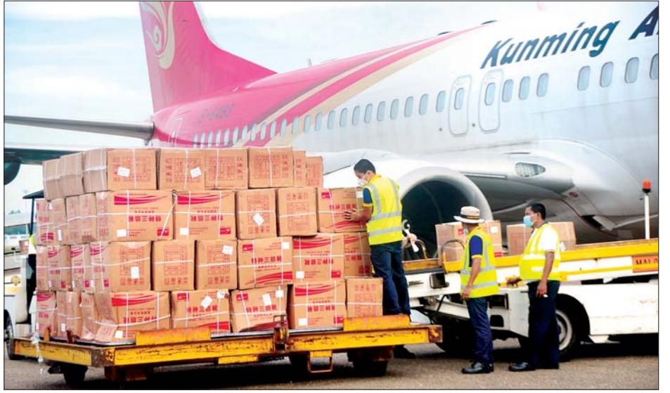
ပါတီစုံဒီမိုကရေစီ အထွေထွေရွေးကောက်ပွဲအတွက် တရုတ်ပြည်သူ့သမ္မတနိုင်ငံမှဝယ်ယူထားသည့် ကိုဗစ် - ၁၉ ကာကွယ်၊ ထိန်းချုပ်၊ ကုသရေးအထောက်အကူပစ္စည်းများ မန္တလေးအပြည်ပြည်ဆိုင်ရာလေဆိပ်သို့ ဆက်လက်ရောက်ရှိစဉ်၊ သတင်းစဉ်