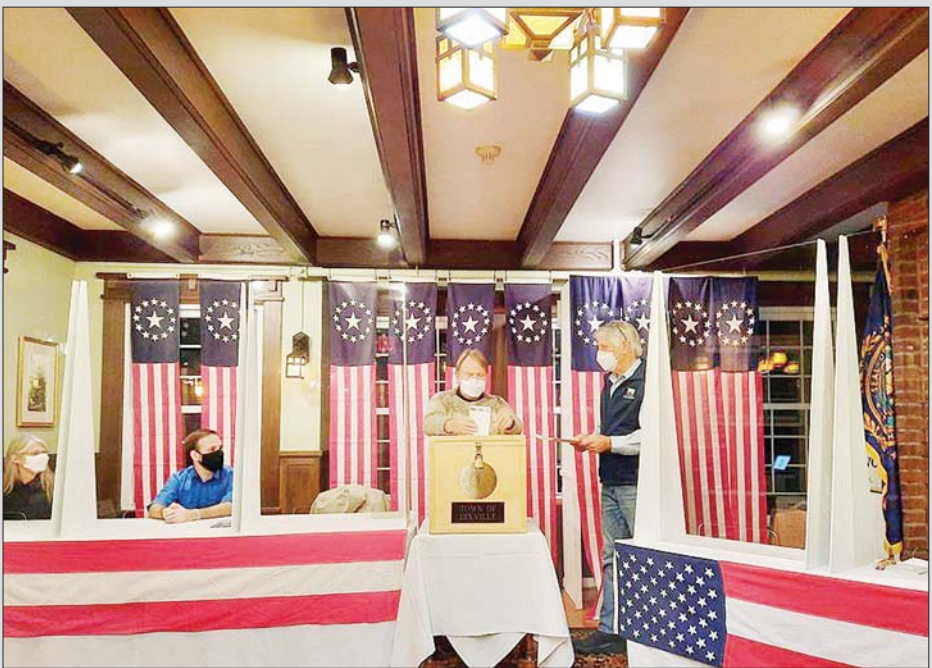
အမေရိကန်ပြည်ထောင်စု နယူးဟမ်းရှိုင်းယားပြည်နယ် ဒစ်ဗီလီနော့ချ်တွင်ဆန္ဒမဲပေးနေသူတစ်ဦးကိုတွေ့ရစဉ်။

ဝါရှင်တန် နိုဝင်ဘာ ၃ ကမ္ဘာတစ်ဝန်းလုံးတွင် နိုဝင်ဘာ ၂ ရက်အထိ ကိုဗစ်-၁၉ ကြောင့် စုစုပေါင်း သေဆုံးသူ ၁ ဒသမ ၂ သန်းကျော်ရှိလာကြောင်း ဂျွန်ဟော့ကင်းတက္ကသိုလ် ၏ စာရင်းအချက်အလက်များအရ သိရသည်။