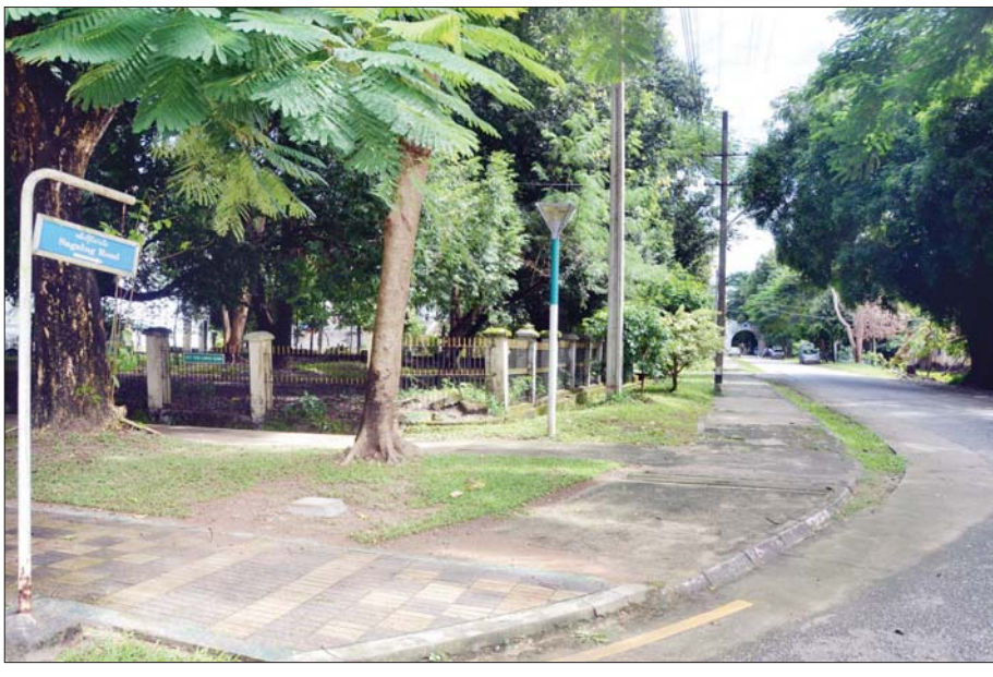
ကျောင်းသား ကျောင်းသူများ ပျော်ခဲ့ကြသည့် စစ်ကိုင်းလမ်း။