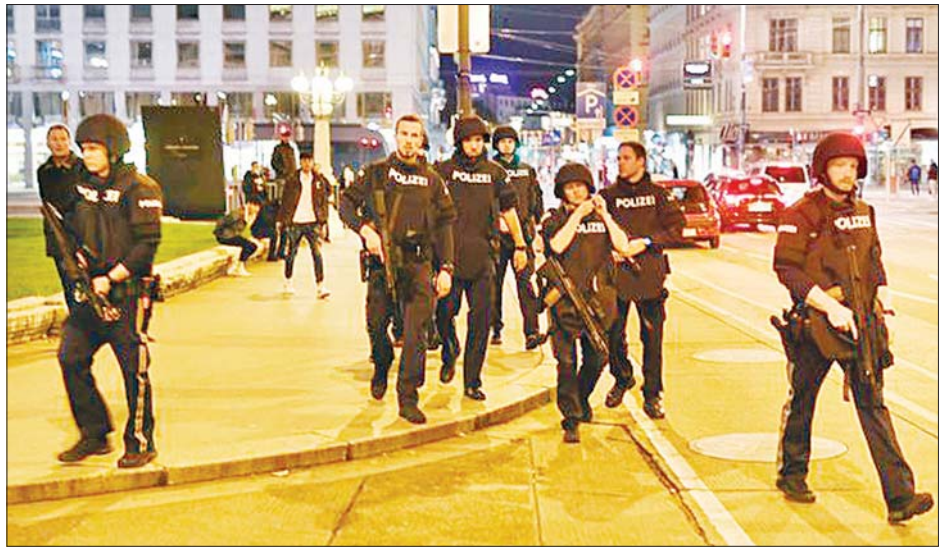
လုံခြုံရေးတာဝန်ယူနေကြသည့် တပ်ဖွဲ့ဝင်များကို တွေ့ရစဉ်။