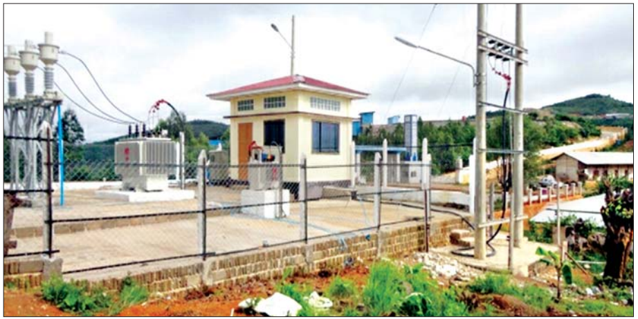
GPS Joint Venture Co., Ltd. မှ ရှမ်းပြည်နယ်၊ ဘော်ဆိုင်းဒေသရှိ ကျေးရွာလေးရွာ မီးလင်းရေး ဆောင်ရွက် ထားမှု။