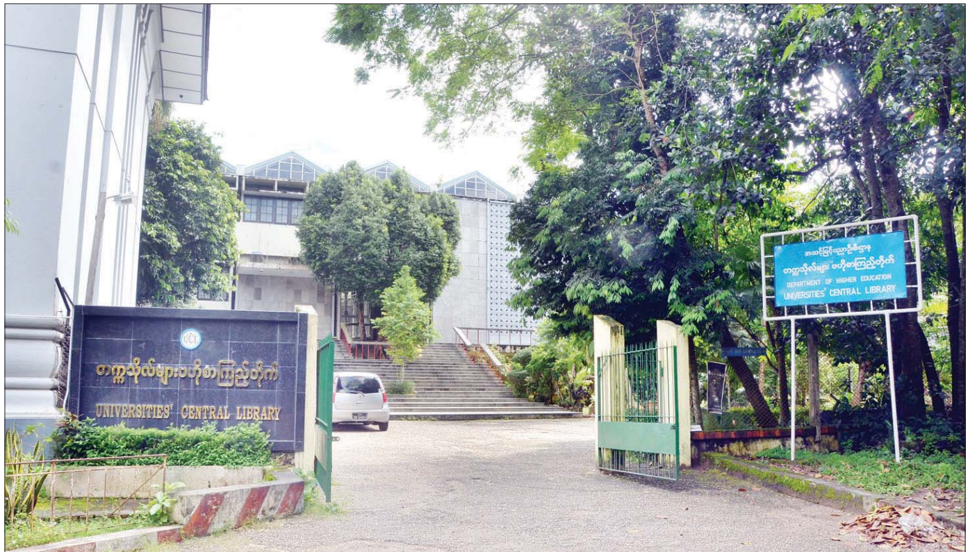
ကျောင်းသား ကျောင်းသူများ ပညာဗဟုသုတများရှာဖွေရာ တက္ကသိုလ်များ ဗဟိုစာကြည့်တိုက်။