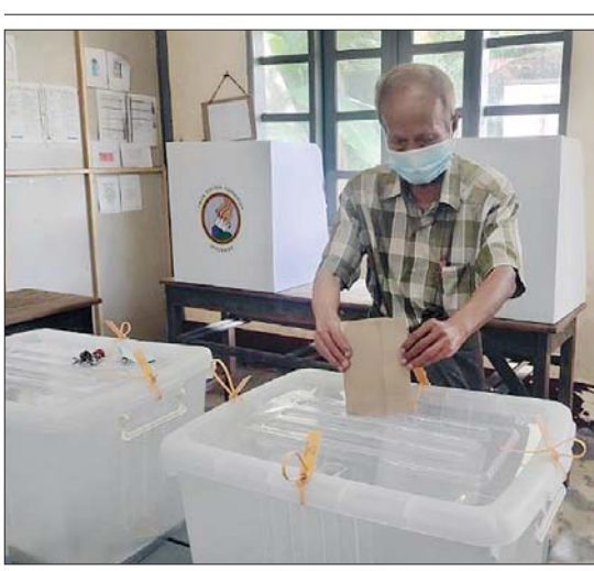
သန်လျင်မြို့နယ်တွင် ၂၀၂၀ ပြည့်နှစ် အထွေထွေ ရွေးကောက်ပွဲအတွက် အသက် ၆၀ နှင့်အထက် မဲဆန္ဒရှင် တစ်ဦး နိုဝင်ဘာ ၂ ရက်က ကြိုတင်ဆန္ဒမဲပေးနေစဉ်။ သန်းဝင်း(သန်လျင်)

အရှည် ၁/၀ မိုင် ကတ္တရာထပ်ပိုးလွှာခင်းခြင်း လုပ်ငန်းနှင့် ဖြည့်စွက်ခွင့်ပြုရန်ပုံငွေကျပ် ၁၅ ဒသမ ၆ သန်းဖြင့် ၅ x ၅ x ၂၆ ပေ ရေထုတ်ပြန်သုံးစင်း တည်ဆောက်ခြင်းလုပ်ငန်းကို ပန်ခွန်သတ္တုတူးဖော်ရေးနှင့် ဆောက်လုပ်ရေးကုမ္ပဏီက တာဝန်ယူဆောင်ရွက်ခဲ့ရာ လုပ်ငန်းအားလုံး၏ ၁၀၀ ရာခိုင်နှုန်း ဆောင်ရွက်ပြီးစီးပြီဖြစ်ကြောင်း ခရိုင်ဖွံ့ဖြိုးမှုကြီးကြပ်ရေးရုံးမှ လက်ထောက်ညွှန်ကြားရေးမှူးဦးဝင်းနိုင်က ပြောသည်။