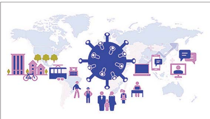
ကိုဗစ်-၁၉ အလွန် ပြောင်းလဲမှုများကို ပုံဖော်ထားသည့် ပုံတစ်ပုံကို တွေ့ရစဉ်။

၅ - ဂျီအင်တာနက် ကုန်စည်လည်ပတ်စီးဆင်းမှုပြောင်းလဲ ဖြစ်ပေါ်လာသလို ၅-ဂျီ အင်တာနက်ကို လည်း ပိုပြီး တွင်တွင်ကျယ်ကျယ်အသုံးပြု လာနေကြပါပြီ။ ၅-ဂျီအင်တာနက်စနစ်ဟာ အွန်လိုင်းအင်တာနက်အသုံးပြုမှုကို ပိုမို တိုးမြှင့်ပေးလိုက်ပြီး ဗဟိုချုပ်ကိုင်မှုတွေ ကြောင့် ဖြစ်ပေါ်လာနိုင်တဲ့ အန္တရာယ် တွေကိုလည်း လျော့ချပေးနိုင်မှာ ဖြစ်ပါ တယ်။ သမားရိုးကျ စီးပွားရေးမဟာဗျူဟာ ဟာ ဈေးကွက်နယ်ပယ်နဲ့ ယှဉ်ပြိုင်သူတွေ ပေါ်မှာ မှီခိုနေပါတယ်။ ကိုဗစ်-၁၉ ကာလ အလွန်မှာ ကုမ္ပဏီတွေဟာ သူတို့ရဲ့ဝယ်ယူ အားပေးသုံးစွဲသူ ဖောက်သည်တွေအတွက် အခက်အခဲ ပြဿနာတွေကို ထိုးဖောက် ကျော်လွှားနိုင်မယ့် စံနှုန်းတန်ဖိုးတွေကို အဆက်မပြတ်ဖန်တီးပေးဖို့ လိုအပ်လာမှာ ဖြစ်ပါတယ်။ တကယ်လို့ ကုမ္ပဏီတွေအနေ နဲ့ ကမ္ဘာလုံးဆိုင်ရာစဉ်းစားမှုအပိုင်း မဟာ ဗျူဟာမိတ်ဖက်တည်ဆောက်မှုနဲ့ ကမ္ဘာ့ စီးပွားရေးစနစ်မှာ တခြားသူတွေနဲ့ စီးပွား ဖက်မိတ်ဖွဲ့မှုတွေကို အဓိမလိုက်နိုင်ဘူး