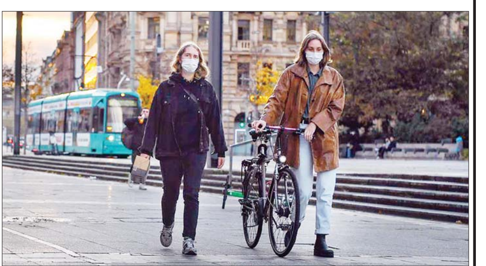
ဂျပန်နိုင်ငံ ဖရန်ဖတ်ရှိလမ်းမတစ်ခုပေါ်တွင် နှာခေါင်းစည်းဝတ်ဆင်သွားလာနေသူတစ်ဦးကို တွေ့ရစဉ်။

အစိုးရ၏ တင်းကျပ်သည့် ဆောင်ရွက်ချက်များ မပါဝင်ဘဲ ကိုဗစ်-၁၉ ကူးစက် ဖြစ်ပွားခြင်းကို ထိန်းချုပ်နိုင်မည် မဟုတ်ကြောင်း ၎င်းက ဆက်လက်ပြောကြားသည်။ လွန်ခဲ့သော သီတင်းပတ်နှစ်ပတ် ခန့်က အထူးကြပ်မတ်ကုသဆောင်