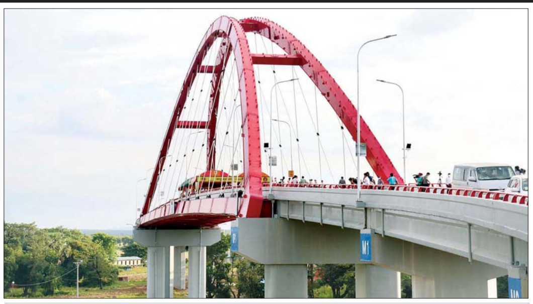
နိုဝင်ဘာ ၃ ရက်က ဖွင့်လှစ်လိုက်သည့် မွန်ညီညွတ်ရေးပါတီနှင့် ဒီမိုကရေစီပါတီသစ် (ကချင်) တို့၏ အတ္ထရိမြစ်ကူး(စံပယ်ဂူ)တံတားကို တွေ့ရစဉ်။ (သတင်း - စာ - ၄)