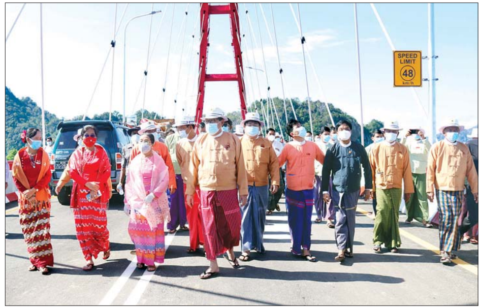
မွန်ပြည်နယ်ဝန်ကြီးချုပ် ဒေါက်တာအေးဇံနှင့် တာဝန်ရှိသူများ အတ္ထရိမြစ်ကူး(စံပယ်ဂူ)တံတားပေါ်မှ ဖြတ်သန်း ကြည့်ရှုစဉ်။

မော်လမြိုင် နိုဝင်ဘာ ၃ မွန်ပြည်နယ် ကျိုက်မရောမြို့နယ် ကျိုက်မရော-စံပယ်ဂူ- ကော့ပနောလမ်းပေါ်တွင်တည်ရှိသည့် အတ္ထရိမြစ်ကူး (စံပယ်ဂူ) တံတားဖွင့်ပွဲကို ယနေ့နံနက်ပိုင်းက ကျင်းပသည်။ ရှေးဦးစွာ အတ္ထရိမြစ်ကူး(စံပယ်ဂူ)တံတားကြီးပေါ်ရှိ မင်္ဂလာမဏ္ဍပ်တွင် ကျိုက်မရောမြို့နယ် ဇေတဝန်ကျောင်း တိုက်ဆရာတော်နှင့် သံဃာတော်များထံမှ မွန်ပြည်နယ် ဝန်ကြီးချုပ်ဒေါက်တာအေးဇံနှင့် ဧည့်ပရိသတ်အပေါင်းတို့က ငါးပါးသီလခံယူပြီး ဆရာတော် သံဃာတော်များမှ အန္တရာယ်ကင်း ပရိတ်တရားတော်များကို ရွတ်ဖတ်ပူဇော် ကြသည်။ ဆက်လက်၍ ဆရာတော် သံဃာတော်များအား မွန်ပြည်နယ်ဝန်ကြီးချုပ်နှင့် တာဝန်ရှိသူများက လှူဖွယ် ဝတ္ထုပစ္စည်းများ ဆက်ကပ်လှူဒါန်းပြီး ရေစက်သွန်းချအမျှ ပေးဝေသည်။ ထို့နောက် ပြည်နယ်ဝန်ကြီးချုပ်နှင့် တာဝန်ရှိသူများ သည် နံနက် ၉ နာရီ ၁၅ မိနစ်တွင် အတ္ထရိမြစ်ကူး(စံပယ်ဂူ) တံတား ကမ္ဘည်းမော်ကွန်းကျောက်စာတိုင်အား အမွှေး နံသာရည်များ ပက်ဖျန်းပြီး တံတားကြီးပေါ်ဖြတ်သန်း ကြည့်ရှု၍ တံတားအား ဖွင့်လှစ်ပေးသည်။