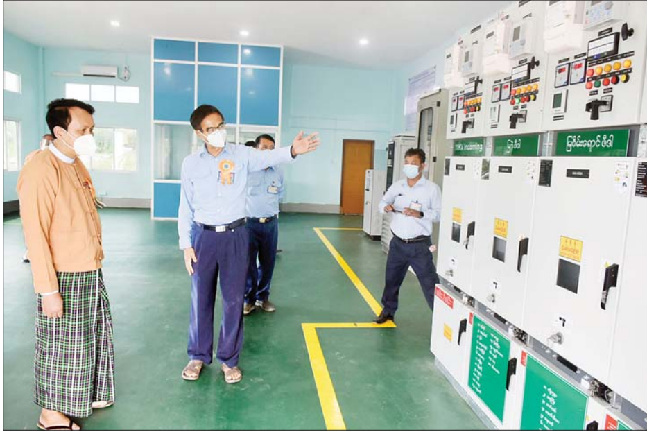
ရန်ကုန်တိုင်းဒေသကြီးဝန်ကြီးချုပ် ဦးဖိုးမင်းသိန်း ထန်းတပင်မြို့နယ် တက်သစ်ကျွန်း ဓာတ်အားခွဲရုံအတွင်း ကြည့်ရှုစဉ်။

ရန်ကုန် နိုဝင်ဘာ ၃ ရန်ကုန်တိုင်းဒေသကြီးအစိုးရ၏ ၂၀၁၉-၂၀၂၀ ဘတ်ဂျက်ဖြင့် ရန်ကုန်လျှပ်စစ်ဓာတ်အားပေးရေး ကော်ပိုရေးရှင်းမှ အကောင်အထည်ဖော်ဆောင်ရွက်ပြီးစီးခဲ့သည့် ရန်ကုန်တိုင်းဒေသကြီး မှော်ဘီမြို့နယ် ရေကျော်ဓာတ်အားခွဲရုံ၊ ဝါးနက်ချောင်းဓာတ်အားခွဲရုံနှင့် ထန်းတပင်မြို့နယ် ကျူတောဓာတ်အားခွဲရုံ၊ တက်သစ်ကျွန်းဓာတ်အားခွဲရုံတို့၏ ဖွင့်ပွဲအခမ်းအနားများကို ယနေ့တွင် အဆိုပါဓာတ်အားခွဲရုံများ၌ ကျင်းပသည်။