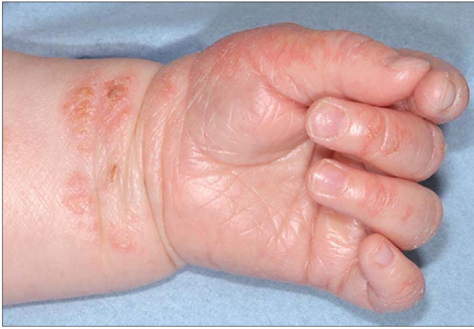
ကလေးငယ်တစ်ဦး၏လက်တွင် ဖြစ်ပွားသော အေတိုးပစ် ယားနာရောဂါ

ရောဂါကို ဆန်းစစ်ခြင်း အေတိုးပစ် အရေပြားယားနာရောဂါဟု သတ်မှတ်ရန် ရောဂါရာဇဝင်မေးရာတွင် အရေပြားယားယံခြင်း၊ အကွက်ထခြင်းအပြင် မိသားစုမျိုးရိုးရာဇဝင်၊ ပန်းနာရင်ကျပ်နှင့် ဓာတ်မတည့်ခြင်း ရာဇဝင်၊ အရေပြားခြောက်ခြင်း၊ ခန္ဓာကိုယ်ရှိ မြင်သာသော နေရာများဖြစ်သည့် နဖူး၊ ပါး၊ ခြေ၊ လက်များတွင် ယားနာများပေါ်ခြင်း၊ နှစ်နှစ်သားအရွယ်မှ စတင်၍ ယားနာဖြစ်ပေါ်ခြင်း စသည်တို့ကို သေချာဆန်းစစ်ရန် လိုအပ်သည်။