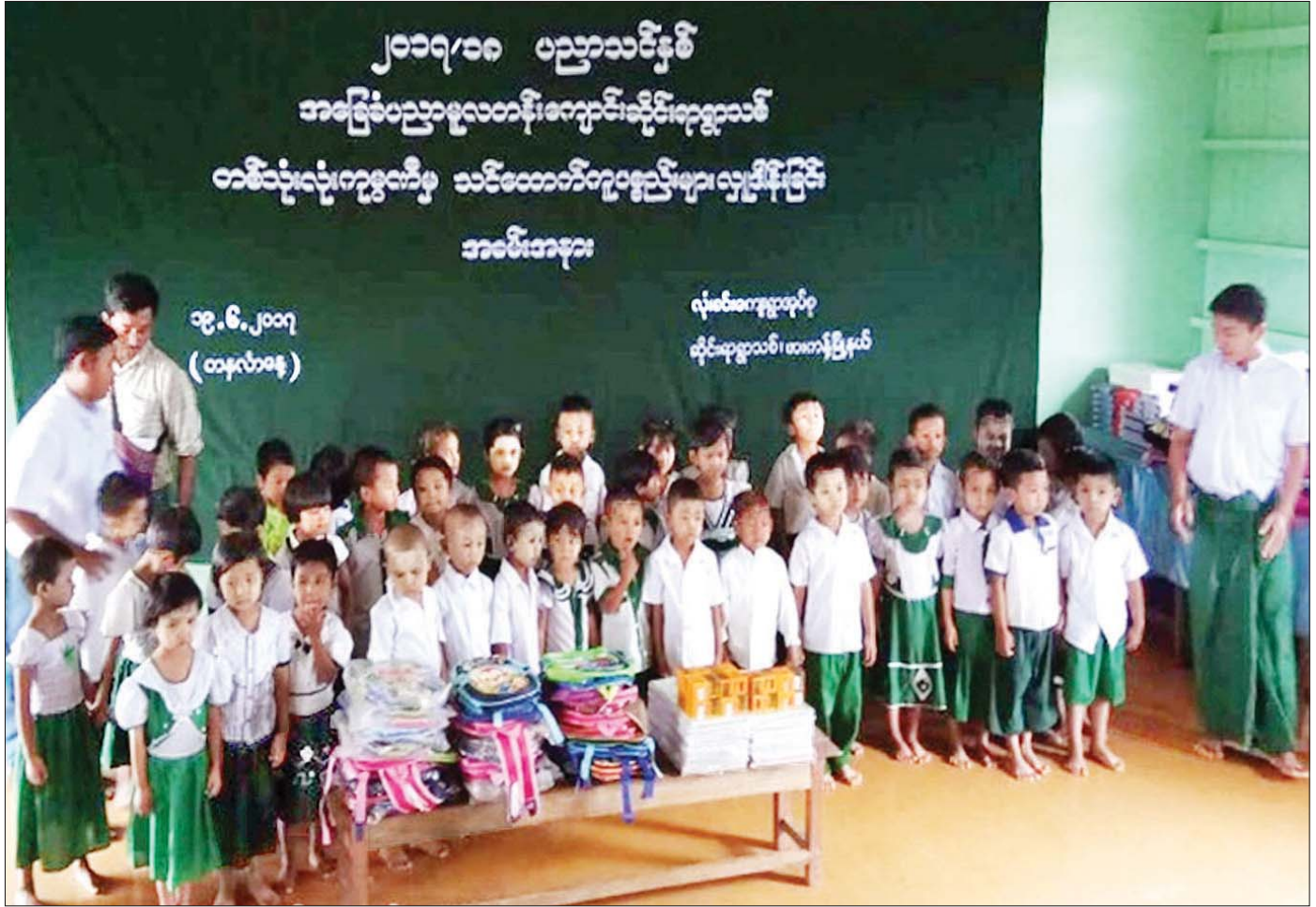
ဖားကန်မြို့နယ် လုံးခင်းနယ်မြေ၊ ဆိုင်းရာရွာသစ် အခြေခံပညာမူလတန်းကျောင်းအတွက် တစ်သုံးလုံးကျွန်းမှ သင်ထောက်ကူပစ္စည်း(၁၄)မျိုး ပေးအပ် လှူဒါန်းမှု။

(င) ကွင်းဆင်းဒေသ၏ မြေသားသဘာဝ၊ မြေလွှာအက်ကွဲကြောင်းများ မြေတွင်း အစပျိုး ဖြစ်ပေါ်မှုနှင့် မြေပြင်ပေါ်သို့ အက်ကွဲထွက်ရှိမှု ဖြစ်စဉ်သဘောကို သုတေသန ပြုလုပ်နိုင်ခဲ့ပြီး မုန်းချောင်းရေတိုက်စားမှု ဘေးအန္တရာယ်ကို လျော့ပါးသက်သာစေရန် ကမ်းပါးများ၏ မြေသားထုထိန်းသိမ်းရေး နည်းလမ်းများ ဖော်ဆောင်နိုင်ရန်အတွက် မြေသားစမ်းသပ်မှု များပြုလုပ်၍ မြေသားစစ်ဆေးမှုကို ပြုလုပ်ခဲ့ ပါသည်။ မြေလွှာအက်ကွဲကြောင်းများ ဖြစ်ပေါ် ခဲ့ရာ နေရာတိုင်းတွင် မြေသားပြန်လည်ဖြည့်တင်း မှုကို အလျင်အမြန် လုပ်ဆောင်မှသာ အက်ကွဲ ကြောင်းများ ဆက်လက်ကွဲအက်မှုနှင့် ထပ်မံ ဖြစ်ပွားမှုကို လျော့ချနိုင်မည် ဖြစ်ပါသည်။ (စ) သို့ဖြစ်၍ မှန်ကန်သည့် ရေတွင်းတူးဖော် မှုနှင့် ထုတ်ယူသုံးစွဲမှုကို နည်းစနစ်တကျ တူးဖော် ထုတ်ယူသုံးစွဲမှုများ ပြုလုပ်လာစေရန်နှင့် သင့်လျော်သည့် ချောင်းရေတိုက်စားမှုဒဏ် ကာကွယ်ရေး နည်းစနစ်များဖြစ်သော ကန်လန်၊ ဖြတ် အနေအထားပုံစံများ ဆောက်လုပ်၍ ကာကွယ်ခြင်း၊ ဒေါင်လိုက်အနေအထားပုံစံများ ဆောက်လုပ်၍ ကာကွယ်ခြင်းများဖြင့် ရေတိုက်စားမှုဒဏ်ကို ကာကွယ်သင့်ကြောင်း ဒေသခံပြည်သူများအား အသိပညာပေးလုပ်ငန်း များ ဆောင်ရွက်ပေးနိုင်ခဲ့ပါသည်။