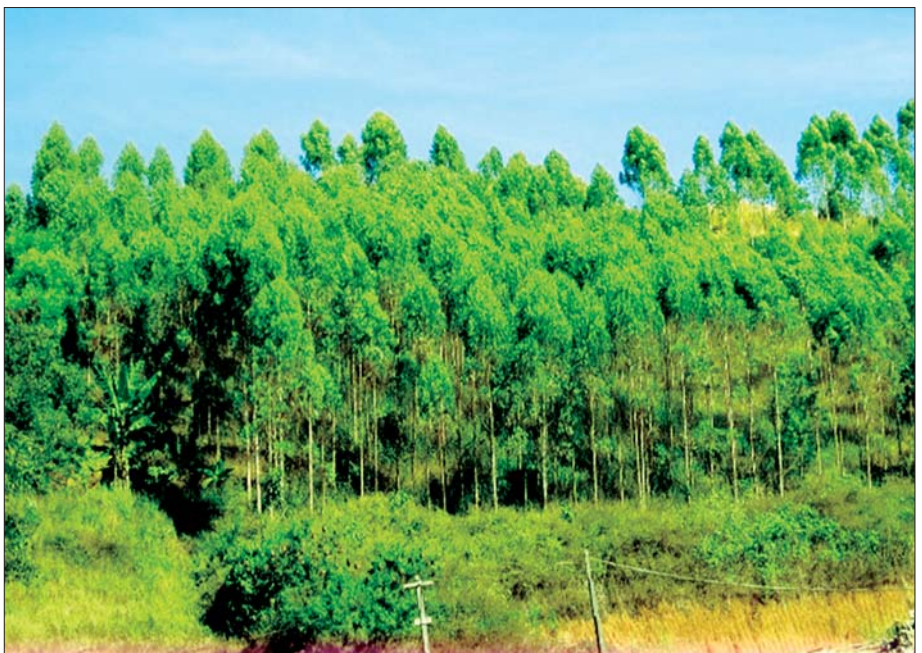
သဘာဝပတ်ဝန်းကျင်ထိန်းသိမ်းရေးလုပ်ငန်းအတွက် သတ္တုတူးဖော်သည့် ကုမ္ပဏီများက သစ်ပင်များ စိုက်ပျိုးထားမှု။