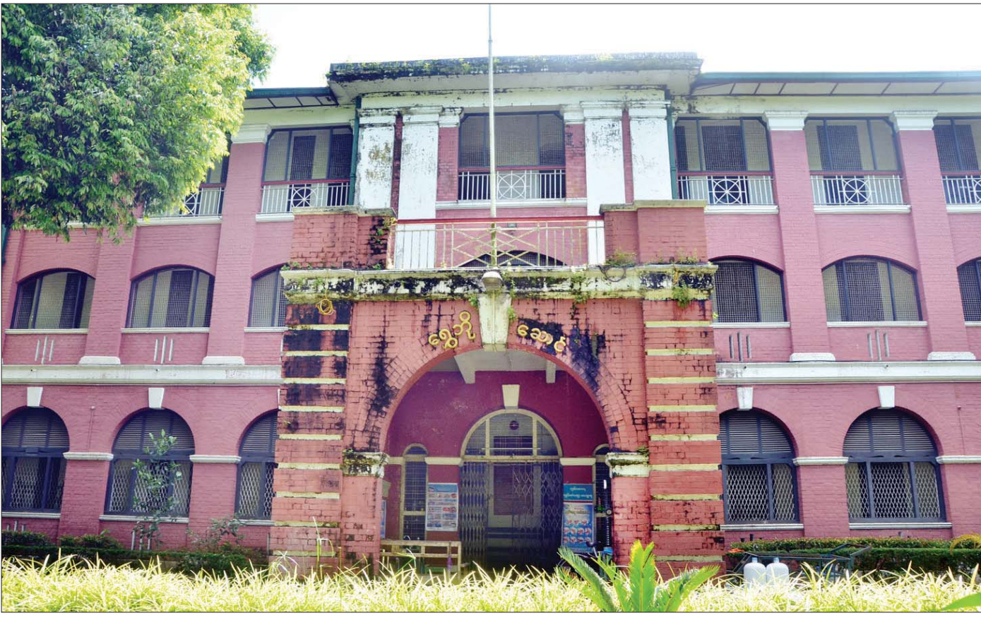
ရန်ကုန်တက္ကသိုလ်အတွင်းရှိ ရွှေဘိုဆောင်။

“၁၉၄၈ ခုနှစ် ဇန်နဝါရီလ ၄ ရက်နေ့တွင် မြန်မာတစ်မျိုးသားလုံး လွတ်လပ်ရေးဟူသော အသီး အပွင့်ကို စားသုံးကြရခြင်းသည် ဤမြေ၏ကျေးဇူးဖြစ်လေသည်။ နိုင်ငံခေါင်းဆောင်အသီးသီး၊ ပညာရှင်အသီးသီး၊ သံတမန်အသီးသီး၊ မျိုးချစ်ပုဂ္ဂိုလ်အသီးသီးတို့ကို ဤမြေက မွေးထုတ်ပေး ခဲ့သည်။ သခင်ကိုယ်တော်မှိုင်း၏ ယူနိုဟစတီ ဘွဲ့လေးချိုးကြီးကို သတိရမိသည်၊ ဗိုလ်ချုပ် အောင်ဆန်းကို တမ်းတမိသည်၊ ဦးသန့်ကို မြင်ယောင်မိသည်၊ ဗိုလ်အောင်ကျော်၏ပုံရိပ်က အတွေးသို့ ဝင်ရောက်လာသည်။ ဤသို့ အတိတ်သမိုင်းအလှနှင့် ပြည့်စုံသော ဤမြေသည် မြန်မာတစ်မျိုးသားလုံး၏ ရင်ထဲ၌ကိန်းဝင်နေသော အမြဲတေ ရတနာတစ်ပါးပင်ဖြစ်ခဲ့”