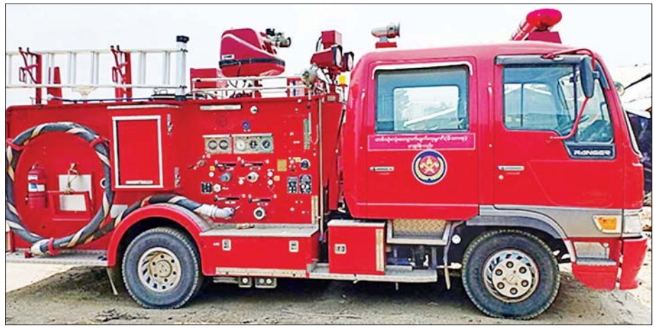
တစ်သုံးလုံးကျောက်မျက်ကုမ္ပဏီမှ ဖားကန့်မြို့နယ်၊ လုံးခင်းအုပ်စု၊ ဆိုင်းရာရွာသစ် ကျေးရွာအတွက် လှူဒါန်းသော မီးသတ်ယာဉ်။

“လေးနှစ်ကျော်ကာလအတွင်း ဒေသခံပြည်သူလူထု၏ ပညာရေး၊ ကျန်းမာရေး၊ လူမှုရေး နှင့် လူမှုစီးပွားဘဝဖွံ့ဖြိုးတိုးတက်ရေးအတွက် အကျိုးတူဖက်စပ်လုပ်ကိုင်နေသော ကုမ္ပဏီများအား စည်းရုံးဆောင်ရွက်နိုင်မှုကြောင့် သတ္တု၊ ကျောက်မျက်/ ကျောက်စိမ်း နှင့် ပုလဲထုတ်လုပ်ရာ ဒေသအသီးသီးရှိ ပြည်သူလူထု၏ လူမှုစီးပွားဘဝဖွံ့ဖြိုး တိုးတက်ရေးအတွက် ကူညီထောက်ပံ့လှူဒါန်းမှုများ ပြုလုပ်”