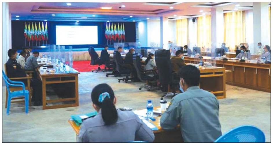
ရှမ်းပြည်နယ်အဆင့် ရွေးကောက်ပွဲ လုံခြုံရေးဆိုင်ရာ အစည်းအဝေးကျင်းပစဉ်။

တောင်ကြီး နိုဝင်ဘာ ၃ ၂၀၂၀ ပြည့်နှစ် နိုဝင်ဘာ ၈ ရက်တွင် ကျင်းပမည့် ပါတီစုံ ဒီမိုကရေစီအထွေထွေ ရွေးကောက်ပွဲ အောင်မြင်စွာ ကျင်းပနိုင်ရေးအတွက် ပြည်နယ်အဆင့်ရွေးကောက်ပွဲလုံခြုံရေးဆိုင်ရာ အစည်းအဝေးကို နိုဝင်ဘာ ၂ ရက် မွန်းလွဲ ၁ နာရီ က ရှမ်းပြည်နယ်အစိုးရအဖွဲ့ရုံး အစည်းအဝေး ခန်းမ(၁)၌ ကျင်းပသည်။