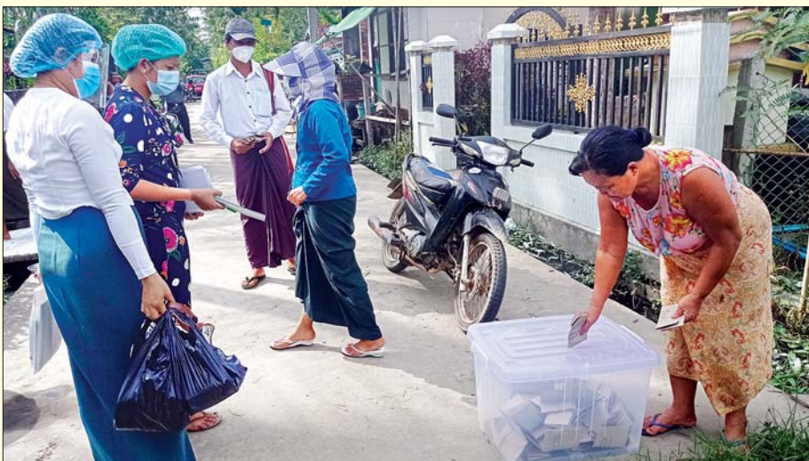
ခရမ်းမြို့နယ် တွင် အသက် ၆၀ နှင့် အထက် မဲဆန္ဒရှင် တစ်ဦး ကြိုတင်ဆန္ဒမဲ ပေးနေစဉ်။