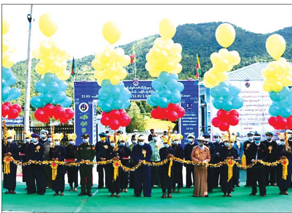
စင်စတင်အားခွဲရုံနှင့် ဓာတ်အားလှိုင်းဖွင့်ပွဲ ကျင်းပစဉ်။

ထို့နောက် ဓာတ်အားခွဲရုံအား ပြည်နယ်ဝန်ကြီးချုပ် ဒေါက်တာလင်းထွဋ်၊ ပြည်နယ်လုံခြုံရေးနှင့် နယ်စပ်ရေးရာ ဝန်ကြီး ဦးလှိုင်၊ ဦးစီးဌာနမှူးများနှင့် နယ်စပ်ရေးရာ ဝန်ကြီး ဦးစိုးဝင်း၊ ဦးစီးဌာနမှူး၊ ပအိုဝ်းကိုယ်ပိုင်အုပ်ချုပ် ခွင့်ရဒေသဦးစီးအဖွဲ့ ဥက္ကဋ္ဌ ဦးခွန်လွင်၊ ပြည်သူ့လွှတ်တော် ကိုယ်စားလှယ် ဦးခွန်သိန်းဖေတို့မှ ဖဲကြိုးဖြတ်ဖွင့်လှစ်ပေး ကြပြီး ဓာတ်အားခွဲရုံအတွင်း လှည့်လည်ကြည့်ရှုကြသည်။ ၎င်းနောက် ပအိုဝ်း ကိုယ်ပိုင်အုပ်ချုပ်ခွင့်ရဒေသ ကျောက်ဆုံမြို့နယ်၊ ကျေးရွာရှိ ၁၁ ကေစီဓာတ်အားလှိုင်းကို ရှမ်း ပြည်နယ်လွှတ်တော် ဒုတိယ ဥက္ကဋ္ဌ ဦးစင်အောင်မြတ်နှင့်