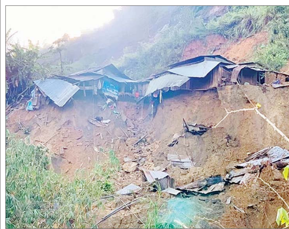
ဗီယက်နမ်နိုင်ငံရှိ မြေပြိုမှုဖြစ်ပွားခဲ့သည့်နေရာတွင် နေအိမ်များထိခိုက်ပျက်စီးမှုကိုတွေ့ရစဉ်။

ဟန့်ရှင်း အောက်တိုဘာ ၂၉ ဗီယက်နမ်နိုင်ငံအလယ်ပိုင်း ကွမ်နမ်ပြည်နယ်၌ အောက်တိုဘာ ၂၈ ရက်က မြေပြိုမှုဖြစ်ပွားခဲ့ရာ ၁၆ ဦး သေဆုံးခဲ့ကြောင်း ဗီယက်နမ်သတင်းအေဂျင်စီက ဖော်ပြသည်။ အဆိုပါနေ့အစောပိုင်းက သေဆုံးသူအရေအတွက် ရှစ်ဦးရှိရာမှ ၁၆ ဦးအထိ မြင့်တက်လာခြင်းဖြစ်ကြောင်း သိရသည်။ အောက်တိုဘာ ၂၈ ရက်ကလည်း ကွမ်နမ်ပြည်နယ် နမ်တရာမိုင်ဒေသရှိ တရာဗန်နှင့် တရာလန်တို့တွင် မြေပြိုမှုဖြစ်ပွားခဲ့သည်။ နောက်ထပ် တွေ့ရ သည့် အလောင်းရစ်လောင်းမှာ တရာလန်မှဖြစ်ကြောင်း သိရသည်။ မြေပြိုမှု အတွင်းပျောက်ဆုံးနေသူများကို တပ်မတော်သားများနှင့် ကယ်ဆယ်ရေးအဖွဲ့ဝင် များက စက်ယန္တရားများအသုံးပြုကာ ပိုင်းဝန်းရှာဖွေလျက်ရှိသည်။ သဘာဝဘေးအန္တရာယ်ကျရောက်မှုများကို ရင်ဆိုင်နေရသည့် ဗီယက်နမ် နိုင်ငံတွင် မြေပြိုမှုများအတွင်း ကျရောက်ခဲ့သူများနှင့်ပျောက်ဆုံးနေသူများကို အမြန်ဆုံး ကယ်ဆယ်နိုင်ရေးအတွက် ရန်ဒီသမျှနည်းလမ်းမျိုးစုံကို အသုံး ပြုကြရန်နှင့် ရှာဖွေကယ်ဆယ်ရေးလုပ်ငန်းများတွင် သဘာဝဘေးအန္တရာယ် တုံ့ပြန်ဆောင်ရွက်ရေးအဖွဲ့၊ ကယ်ဆယ်ရေးနှင့်ရှာဖွေရေးအဖွဲ့များ၊ တပ်ဖွဲ့ ဝင်များနှင့် ဒေသအာဏာပိုင်များ အတူတကွ ပိုင်းဝန်းကြီးပမ်းကြရန် ဗီယက်နမ် ဝန်ကြီးချုပ် ငုယင်စွမ်ဖေက တိုက်တွန်းတောင်းဆိုခဲ့ကြောင်း သိရသည်။ တိုင်ဖွန်းမုန်တိုင်း မိုလေ့သည် အောက်တိုဘာ ၂၈ ရက်တွင် ဗီယက်နမ် အလယ်ပိုင်းသို့ ဝင်ရောက်ခဲ့ရာ မိုးသည်းထန်စွာရွာသွန်းပြီး လေပြင်းများ တိုက်ခတ်ခဲ့သည်။ ဆင်ဟွာ