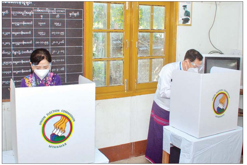
ပြည်ထောင်စုရွေးကောက်ပွဲကော်မရှင်ဥက္ကဋ္ဌ ဦးလှသိန်းနှင့်ဇနီး ဒေါ်အေးသီတာတို့ ဆန္ဒမဲလက်မှတ်များ၌ လျှို့ဝှက်ဆန္ဒမဲပေးကြစဉ်။