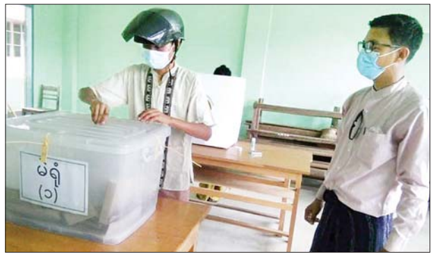
ယနေ့အောက်တိုဘာ ၂၉ တွင် အသက် ၆၀ နှင့်အထက် သက်ကြီးများ ကြိုတင်ဆန္ဒမဲပေးကြရာ ပျဉ်းမနားမြို့ ရွာကော်မရှင်ကွက် မင်္ဂလာဇေယျူ အလက (၄၇) တွင် ဖွင့်လှစ်ထားသော မဲရုံအမှတ် (၁) သို့ လာရောက်ဆန္ဒမဲ ပေးကြသည်ကို တွေ့ရစဉ်။ (အဆိုပါမဲရုံတွင် ကျန်းမာရေးနှင့် အားကစား ဝန်ကြီးဌာနမှ ထုတ်ပြန်ထားသော ကိုဗစ်-၁၉ ကာကွယ်ရေးဆိုင်ရာ အစီအမံ များနှင့်အညီ ခင်းကျင်းထားရှိပြီး အဆိုပါမဲရုံ၏ ဆန္ဒမဲနယ်မြေအတွင်းရှိ သက်ကြီး ၂၅၀ ခန့်နှင့် နိုင်ငံ့ဝန်ထမ်းအချို့ ဆန္ဒမဲပေးကြကြောင်း၊ နိုဝင်ဘာ ၆ ရက်နှင့် ၇ ရက်တို့တွင် မသန်စွမ်းသူများ ကိုယ်ဝန်ဆောင်နှင့် မီးနေသည်များ၊ ရောဂါ ဝေဒနာရှင်များကို အိမ်တိုင်ရာရောက် ဆန္ဒမဲများ ကောက်ခံမည်ဖြစ်ကြောင်း သိရသည်။) ကိုကိုနေ