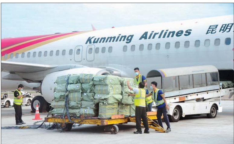
ပါတီစုံဒီမိုကရေစီ အထွေထွေရွေးကောက်ပွဲအတွက် တရုတ်ပြည်သူ့သမ္မတနိုင်ငံမှ ဝယ်ယူထားသည့် ကိုဗစ် - ၁၉ ကာကွယ်၊ ထိန်းချုပ်၊ ကုသရေး အထောက်အကူပစ္စည်းများ ရန်ကုန် အပြည်ပြည်ဆိုင်ရာလေဆိပ်သို့ ရောက်ရှိစဉ်။

ရန်ကုန် အောက်တိုဘာ ၂၉ နိုင်ငံတော်ရက်၌ ကျင်းပမည့် ပါတီစုံ ဒီမိုကရေစီ အထွေထွေရွေးကောက်ပွဲတွင် မဲဆန္ဒရှင်များ၊ မဲရုံတာဝန်ကျ ဝန်ထမ်းများနှင့် စေတနာ့ဝန်ထမ်းများအား ကိုဗစ်-၁၉ ရောဂါ ကာကွယ်၊ ထိန်းချုပ်၊ ကုသရေးအတွက် ဖြန့်ဝေပေးမည့် တရုတ်ပြည်သူ့သမ္မတနိုင်ငံမှ ဝယ်ယူထားသော ပစ္စည်းများ ရန်ကုန် အပြည်ပြည်ဆိုင်ရာ လေဆိပ်နှင့် မန္တလေး အပြည်ပြည်ဆိုင်ရာ လေဆိပ်တို့သို့ ယနေ့တွင် အထူးလေယာဉ်များဖြင့် ဆက်လက်ရောက်ရှိကြသည်။