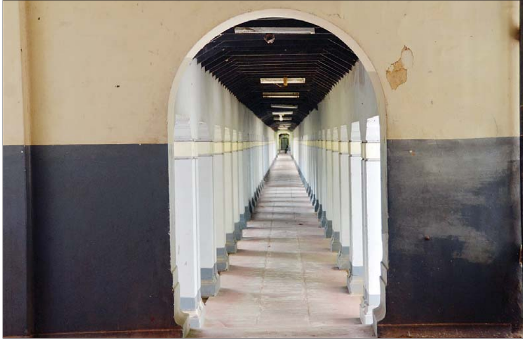
ရန်ကုန်တက္ကသိုလ်အတွင်းပိုင်း လျှောက်လမ်းတစ်နေရာကို တွေ့ရစဉ်။