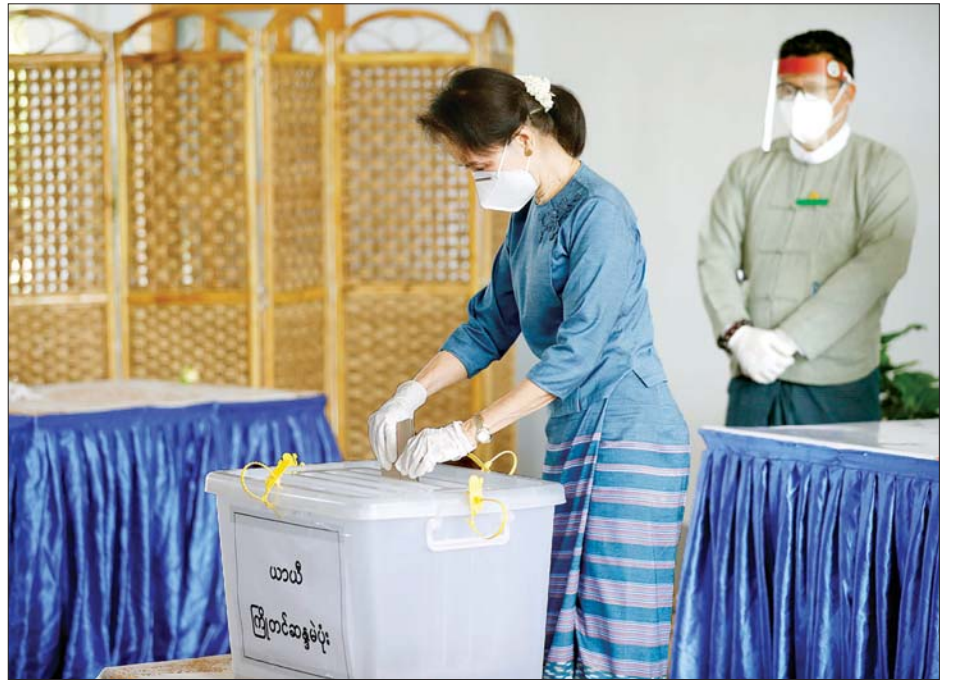
နိုင်ငံတော်၏အတိုင်ပင်ခံပုဂ္ဂိုလ် ဒေါ်အောင်ဆန်းစုကြည် ယာယီ ကြိုတင်ဆန္ဒမဲပုံးထဲသို့ ဆန္ဒမဲလက်မှတ်များ ထည့်သွင်းစဉ်။ (သတင်းရှေ့ဖုံး) သတင်းစဉ်