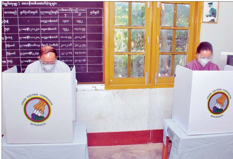
နိုင်ငံတော်ဖွဲ့စည်းပုံအခြေခံဥပဒေဆိုင်ရာခုံရုံးဥက္ကဋ္ဌ ဦးမျိုးညွန့်နှင့်ဇနီး ဒေါ်ဌေးရီတို့ ဆန္ဒမဲလက်မှတ်များ၌ လျှို့ဝှက်ဆန္ဒမဲပေးကြစဉ်။