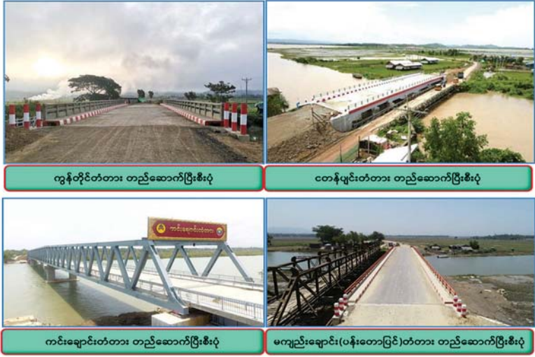
ရခိုင်ပြည်နယ်ဆိုင်ရာအကြံပြုချက်များအပေါ် အကောင်အထည်ဖော်ဆောင်ရွက်ရေးကော်မတီ