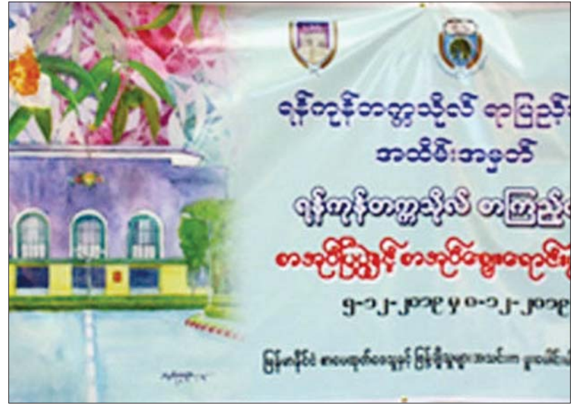
ရန်ကုန်တက္ကသိုလ်ရာပြည့် စာအုပ်ပြပွဲနှင့် စာအုပ်ဈေးပွဲတော် သရုပ်ဖော် ဒီဇိုင်းလက်ရာအလှ