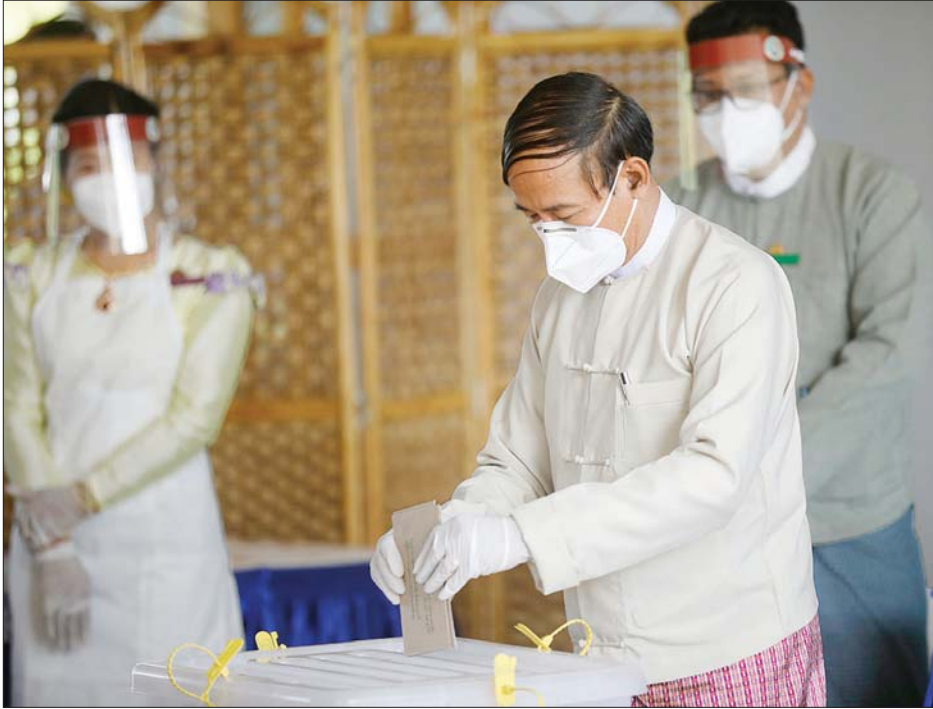
နိုင်ငံတော်သမ္မတ ဦးဝင်းမြင့် ယာယီကြိုတင် ဆန္ဒမဲပေးထဲသို့ ဆန္ဒမဲလက်မှတ်များ ထည့်သွင်းစဉ်။ သတင်းစဉ်

နေပြည်တော် အောက်တိုဘာ ၂၉ နိုင်ငံတော်သမ္မတ ဦးဝင်းမြင့်သည် ယနေ့နံနက်ပိုင်းတွင် နိုဝင်ဘာ ၈ ရက်၌ ကျင်းပမည့် ၂၀၂၀ ပြည့်နှစ် အထွေထွေ ရွေးကောက်ပွဲတွင် ရန်ကုန်မြို့၊ တာမွေမြို့နယ် မဲဆန္ဒနယ်မှ ဝင်ရောက်ယှဉ်ပြိုင်ကြမည့် လွှတ်တော်ကိုယ်စားလှယ် နေရာများအတွက် မဲဆန္ဒနယ်ပြင်ပရောက် ကြိုတင်ဆန္ဒမဲပေးသည်။ ဆန္ဒမဲလက်မှတ်များထည့်သွင်း နိုင်ငံတော်သမ္မတ ဦးဝင်းမြင့်သည် ယနေ့နံနက် ၉ နာရီတွင် နေပြည်တော် ဧမ္မာသီရိမြို့နယ် ရွေးကောက်ပွဲကော်မရှင် အဖွဲ့ခွဲရုံးသို့ လာရောက်၍ ကိုဗစ်-၁၉ ရောဂါ ကာကွယ်၊ ထိန်းချုပ်ရေး လမ်းညွှန်ချက်များနှင့်အညီ လျှို့ဝှက်ဆန္ဒမဲပေးပြီး ယာယီ ကြိုတင်ဆန္ဒမဲပေးထဲသို့ ဆန္ဒမဲလက်မှတ်များကို ထည့်သွင်းသည်။ ယင်းနောက် နိုင်ငံတော်သမ္မတသည် မဲဆန္ဒနယ်ပြင်ပသို့ ပုံစံ - ၁၅ ထုတ်ပေးမှုနှင့် ဆန္ဒမဲပေးပြီးကြောင်း မှတ်တမ်း စာအုပ်တွင် လက်မှတ်ရေးထိုးသည်။ သတင်းစဉ်