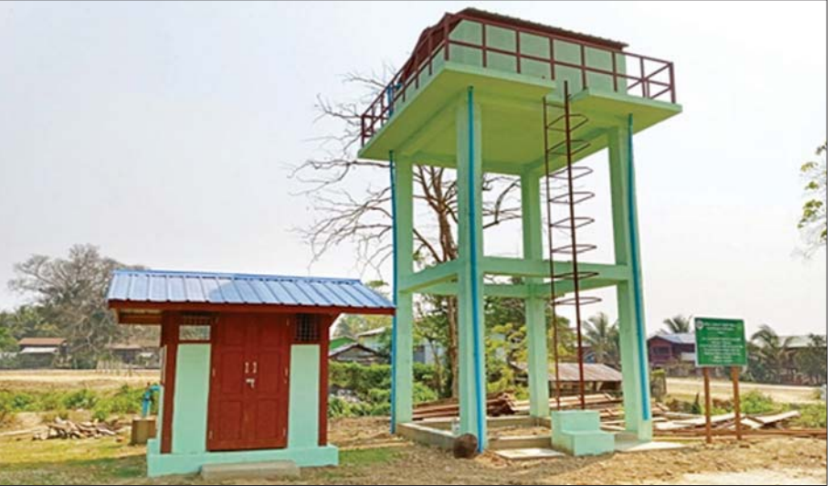
မံစီမြို့နယ် စီကေးကျေးရွာ၌ တွင်းနက်တူးဖော်ခြင်းလုပ်ငန်းဆောင်ရွက်ထားမှုကို တွေ့ရစဉ်။

ကျယ်ပြန့်သော စုပေါင်းဆောင်ရွက်မှု အလေ့အကျင့်များ ကျေးလက်ဒေသ ဖွံ့ဖြိုးတိုးတက်ရေးဥပဒေကို တာဝန်ခံ၊ တာဝန်ယူ၍ ဖော်ဆောင်ပေးရမည့်သူမှာ စိုက်ပျိုးရေး၊ မွေးမြူရေးနှင့် ဆည်မြောင်းဝန်ကြီးဌာနနှင့် ၎င်း၏ လက်အောက်ရှိ ကျေးလက်ဒေသဖွံ့ဖြိုးတိုးတက်ရေးဦးစီးဌာနတို့ ဖြစ်ပါသည်။ သို့သော်လည်းကျေးလက်ဒေသ ဖွံ့ဖြိုးတိုးတက်ရေးလုပ်ငန်းများကို ဘက်ပေါင်းစုံမှ ကြည့်မြင်ပြီး ကျယ်ပြန့်စွာနှင့် ထိရောက်အောင်မြင်စွာ အကောင်အထည်ဖော်နိုင်ရန် သက်ဆိုင်ရာဝန်ကြီးဌာနများနှင့် အစိုးရအဖွဲ့အစည်းများမှ တာဝန်ရှိသူများ ပါဝင်သည့် အဖွဲ့အစည်းများဖြင့် စာမျက်နှာ ၂၁ သို့