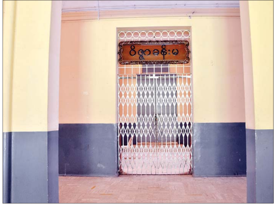
ရန်ကုန်တက္ကသိုလ်ရှိ ဝိဇ္ဇာခန်းမ

၁၉၂၀ပြည့်နှစ်တွင် ကိုလိုနီခေတ်ပညာရေးစနစ်ကို အသက်သွင်းထားသော အင်္ဂလိပ်နယ်ချဲ့အစိုးရ၏ “ရန်ကုန်တက္ကသိုလ် အက်ဥပဒေ”(Rangoon University Act) ကို ဆန့်ကျင်သပိတ်မှောက်ခဲ့ကြသည့် ရန်ကုန် တက္ကသိုလ် မျိုးချစ်ကျောင်းသားခေါင်းဆောင်များ၏ ပထမအကြိမ်သပိတ်ကြီးသည် “အမျိုးသားပညာရေး စနစ်”(National Education)ကို ရုပ်လုံးပေါ်ပေါက်လာပြီး မြန်မာပြည်အနှံ့ ကိုယ့်အားကိုယ်ကိုး “အမျိုးသား ကျောင်းများ”(National School)ပေါ်ပေါက် လာခဲ့သည့် အပြင် မြန်မာနိုင်ငံ တစ်နိုင်ငံလုံး သူ့ကျွန်ဘဝမှ လွတ်မြောက်ရေးအတွက် မြန်မာ့လွတ်လပ်ရေးကြိုးပမ်းမှု မှန်တံခါးကို စတင်ဖွင့်လှစ်ပေးခဲ့သည်မှာ သမိုင်းသက်သေ တည်ပြီး ဖြစ်ပါသည်။ ။