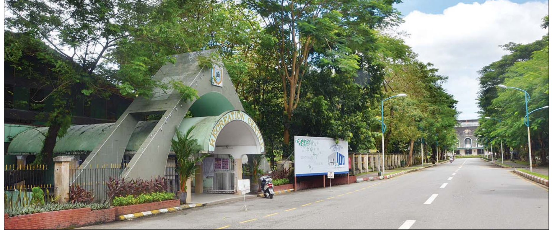
ရန်ကုန်တက္ကသိုလ် အဓိပတိလမ်းမနှင့် အပန်းဖြေရိပ်သာ