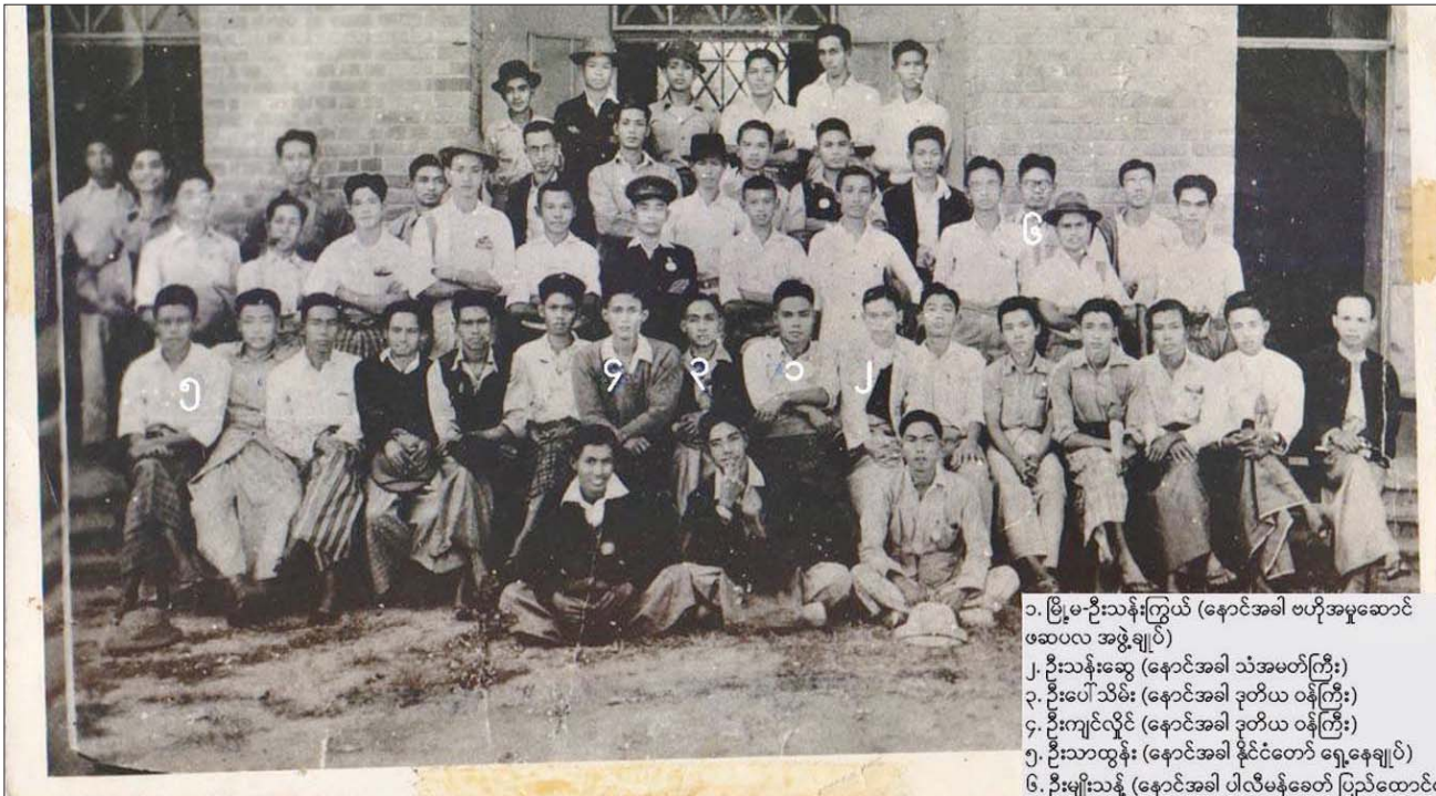
၁. ဗြိမ္မ-ဦးသန်းကြွယ် (နောင်အခါ ဗဟိုအမှုဆောင် ဗဆပလ အဖွဲ့ချုပ်) ၂. ဦးသန်းဆွေ (နောင်အခါ သံအမတ်ကြီး) ၃. ဦးပေါ်သိမ်း (နောင်အခါ ဒုတိယ ဝန်ကြီး) ၄. ဦးကျင်လှိုင် (နောင်အခါ ဒုတိယ ဝန်ကြီး) ၅. ဦးသာထွန်း (နောင်အခါ နိုင်ငံတော် ရှေ့နေချုပ်) ၆. ဦးမျိုးသန့် (နောင်အခါ ပါလီမန်ခေတ် ပြည်ထောင်စု အစိုးရ သတင်း ပြန်ကြားရေးမှူး)

သို့ရာတွင် ၁၉၂၀ ပြည့်နှစ် ရန်ကုန်တက္ကသိုလ် ဥပဒေသည် ကြေးရတတ်သားသမီးများကိုသာ အကျိုး ပြုပြီး တိုင်းရင်းသား ပြည်သူတို့၏ သားသမီးများအား အဆင့်မြင့်ပညာရပ်များ သင်ကြားနိုင်မှုကို ကန့်သတ် ထားခြင်း၊ တက္ကသိုလ်အုပ်ချုပ်ရေးစည်းကမ်းများမှာ လည်း ကျောင်းသားကျောင်းသူများအပေါ် ဖိနှိပ် ချုပ်ချယ် လွန်းရာရောက်ရှိနေခြင်း၊ ဘွဲ့ရပညာတတ်ဦးရေ