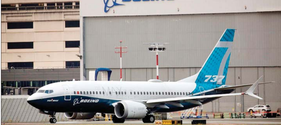
ဘိုးရင်းလေယာဉ် ကုမ္ပဏီမှ ထုတ်လုပ်သည့် လေယာဉ်တစ်စင်းကို တွေ့ရစဉ်။

ကုမ္ပဏီသည် ခက်ခဲမှုပေါင်း မြောက်မြားစွာနှင့် ရင်ဆိုင်နေရ သည်။ အမေရိကန်လေကြောင်းလိုင်း နှင့် ယူနိုက်တက်လေကြောင်းလိုင်း တို့သည် အလုပ်အကိုင် ၃၂၀၀၀ လျော့ချခဲ့သည်။ အင်န်အိတ်ချ်ကေ