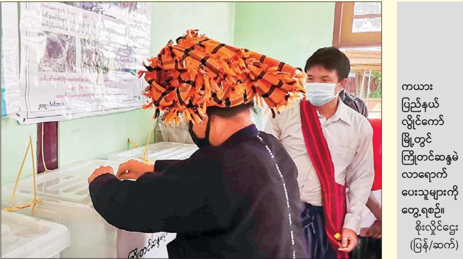
ကယား ပြည်နယ် လှိုင်ကော် မြို့တွင် ကြိုတင်ဆန္ဒမဲ လာရောက် ပေးသူများကို တွေ့ရစဉ်။