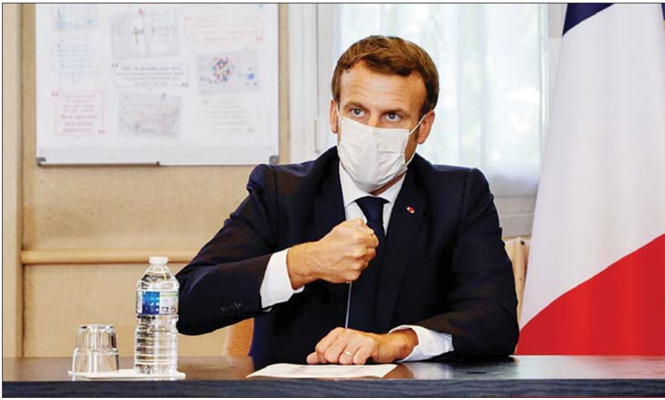
ပြင်သစ်သမ္မတ အီမန်နျယ်မက်ခရွန်