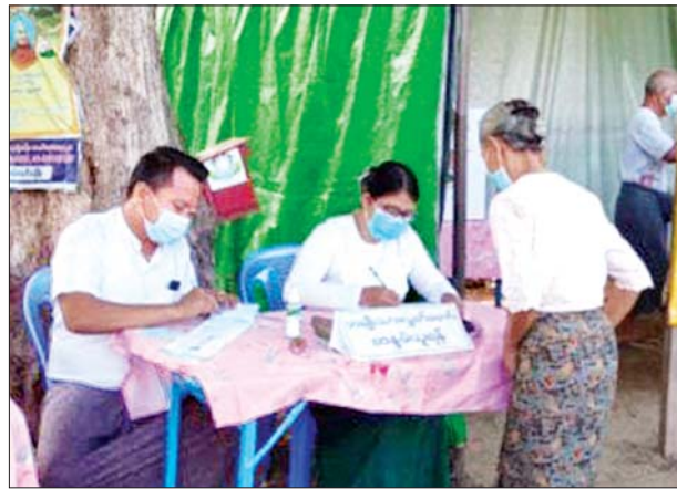
ပျဉ်းမနားမြို့နယ်တွင် ကြိုတင်ဆန္ဒမဲပေးစဉ်။

ခြင်း၊ မဲပေးခြင်းလုပ်ငန်းစဉ် အချိန်ကြန့်ကြာမှုမရှိစေရေး၊ ကိုဗစ်-၁၉ ရောဂါ ကာကွယ်ထိန်းချုပ်ရေးလုပ်ငန်းလမ်းညွှန်ချက်များနှင့်အညီ မဲပေးနိုင်ရေးတို့အတွက် ကူညီဆောင်ရွက်ပေးကြသည်။