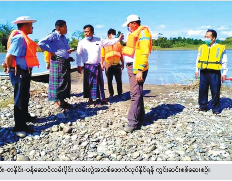
နမ္မတီး-တနိုင်း-ပန်ဆောင်လမ်းပိုင်း လမ်းလွဲအသစ်ဖောက်လုပ်နိုင်ရန် ကွင်းဆင်းစစ်ဆေးစဉ်။

တောင်ကြီး အောက်တိုဘာ ၂၉ ရှမ်းပြည်နယ်ပြည်သူ့လူထု စားနပ်ရိက္ခာထောက်ပံ့ရေးကော်မတီက ရှမ်းပြည် နယ်ရှိ ရန်ကုန်မြို့သို့ သွားရောက် တာဝန်ထမ်းဆောင်မည့် ကျန်းမာရေးသူနာပြု ဝန်ထမ်း ၄၀ အတွက် ထောက်ပံ့ငွေကျပ်သိန်း ၈၀ ထောက်ပံ့လှူဒါန်းပွဲကို အောက်တိုဘာ ၂၈ ရက်က မိုးကုတ်ပိသနာဓမ္မရိပ်သာ၊ ဘောဇနဆောင် ရှမ်းပြည်နယ် ပြည်သူ့လူထုစားနပ်ရိက္ခာထောက်ပံ့ရေးကော်မတီရုံး အစည်း အဝေးခန်းမ၌ လှူဒါန်းပွဲကျင်းပသည်။