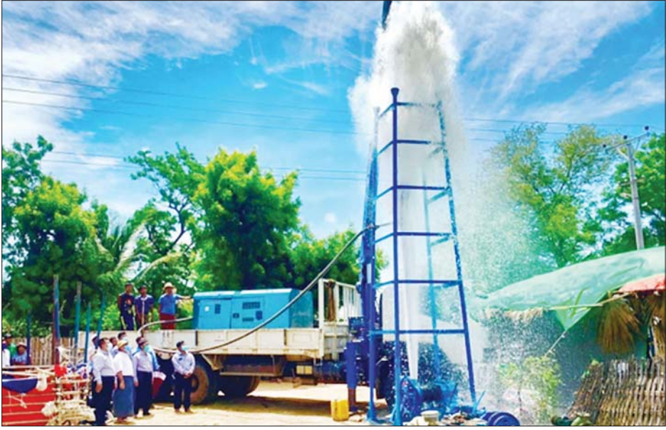
မြိုင်မြို့နယ် ဖိုလ်ကုန်းကျေးရွာ စက်ရေတွင်းတူးဖော်နေမှုကို တွေ့ရစဉ်။

ပြည်ထောင်စုလွှတ်တော်သည် အထက်တွင် ဖော်ပြခဲ့သော ပြည်ထောင်စုလူဦးရေ၏ ၇၀ ဒသမ ၄ % နေထိုင်လျက်ရှိသည့် ပြည်ထောင်စုတစ်ဝန်းရှိ ကျေးလက်ဒေသအားလုံး၏ ဖွံ့ဖြိုးတိုးတက်ရေးလုပ်ငန်းတာဝန်များကို ခေတ်စနစ်နှင့်အညီ စနစ်တကျအောင်မြင်စွာ ဆောင်ရွက်နိုင်ရန်အတွက် စိုက်ပျိုးရေး၊ မွေးမြူရေးနှင့် ဆည်မြောင်းဝန်ကြီးဌာနနှင့်ညှိနှိုင်းပြီး ကျေးလက်ဒေသဖွံ့ဖြိုး