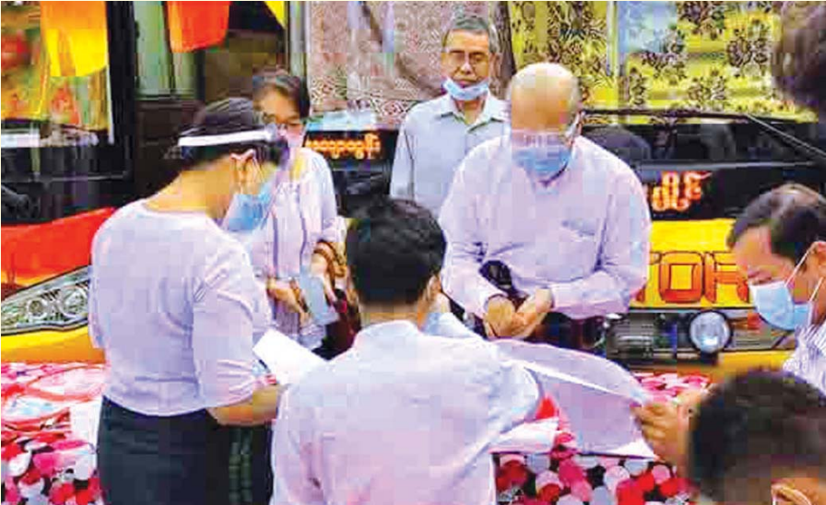
မကွေးတိုင်းဒေသကြီး ဝန်ကြီးချုပ် ဒေါက်တာအောင်စိုးညို အောက်တိုဘာ ၂၉ ရက်က ပွင့်ဖြူမြို့ သက်တော်ရှည် ရပ်ကွက် တွင် ကြိုတင်ဆန္ဒမဲပေးစဉ်။