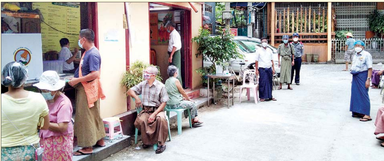
ရန်ကုန်တိုင်းဒေသကြီး ကမာရွတ်မြို့နယ်တွင် အသက် ၆၀ နှင့်အထက် မဲဆန္ဒရှင်များ ကြိုတင်ဆန္ဒမဲပေးရန် ရောက်ရှိနေမှုကို တွေ့ရစဉ်။