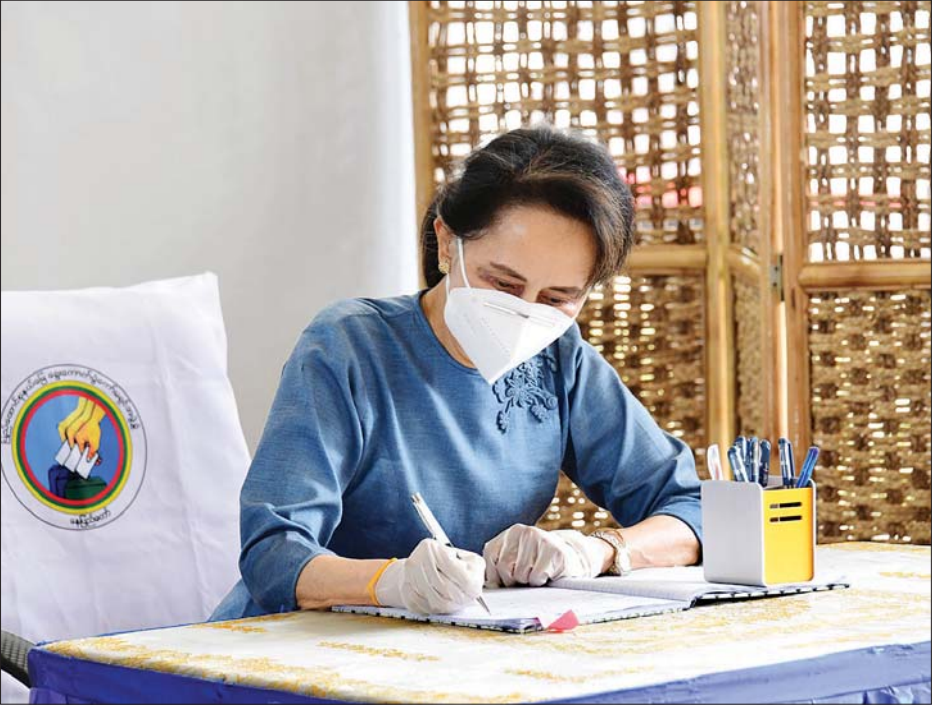
နိုင်ငံတော်၏အတိုင်ပင်ခံပုဂ္ဂိုလ် ဒေါ်အောင်ဆန်းစုကြည် မဲဆန္ဒနယ်ပြင်ပသို့ ပုံစံ - ၁၅ ထုတ်ပေးမှုနှင့် ဆန္ဒမဲပေးပြီး ကြောင်း မှတ်တမ်းစာအုပ်တွင် လက်မှတ်ရေးထိုးစဉ်။ သတင်းစဉ်

နေပြည်တော် အောက်တိုဘာ ၂၉ နိုင်ငံတော်၏အတိုင်ပင်ခံပုဂ္ဂိုလ် ဒေါ်အောင်ဆန်းစုကြည်သည် ယနေ့နံနက်ပိုင်းတွင် နိုဝင်ဘာ ၈ ရက်၌ ကျင်းပမည့် ၂၀၂၀ ပြည့်နှစ် အထွေထွေရွေးကောက်ပွဲတွင် ရန်ကုန်မြို့၊ ဗဟန်းမြို့နယ် မဲဆန္ဒနယ်မှ ဝင်ရောက်ယှဉ်ပြိုင်ကြမည့် လွှတ်တော်ကိုယ်စားလှယ်နေရာများအတွက် မဲဆန္ဒနယ်ပြင်ပရောက် ကြိုတင်ဆန္ဒမဲပေးသည်။ နိုင်ငံတော်၏အတိုင်ပင်ခံပုဂ္ဂိုလ် ဒေါ်အောင်ဆန်းစုကြည်သည် ယနေ့ နံနက် ၉ နာရီခွဲတွင် ဧမ္မာသီရိမြို့နယ် ရွေးကောက်ပွဲကော်မရှင်အဖွဲ့ခွဲရုံးသို့ လာရောက်၍ ကိုဗစ်-၁၉ ရောဂါ ကာကွယ်၊ ထိန်းချုပ်ရေးလမ်းညွှန်ချက်များနှင့်အညီ လျှို့ဝှက်ဆန္ဒမဲပေးပြီး ယာယီ ကြိုတင်ဆန္ဒမဲပေးထဲသို့ ဆန္ဒမဲလက်မှတ်များကို ထည့်သွင်းသည်။ ယင်းနောက် နိုင်ငံတော်၏အတိုင်ပင်ခံပုဂ္ဂိုလ်သည် မဲဆန္ဒနယ်ပြင်ပသို့ ပုံစံ - ၁၅ ထုတ်ပေးမှုနှင့် ဆန္ဒမဲပေးပြီးကြောင်း မှတ်တမ်းစာအုပ်တွင် လက်မှတ်ရေးထိုးသည်။ နေပြည်တော်ကောင်စီနယ်မြေ ဧမ္မာသီရိမြို့နယ်၌ မဲဆန္ဒနယ်ပြင်ပရောက် ကြိုတင်ဆန္ဒမဲပေးရန် ပုံစံ - ၁၅ ဖြင့် လျှောက်ထားသူ ၄၈၂ ဦးရှိပြီး ၁၁၇ ဦးမှာ ကြိုတင်ဆန္ဒမဲပေးပြီးဖြစ်ကာ ယနေ့တွင် ၂၂ ဦး ကြိုတင်ဆန္ဒမဲပေးကြမည် ဖြစ်ကြောင်း သိရသည်။ သတင်းစဉ်