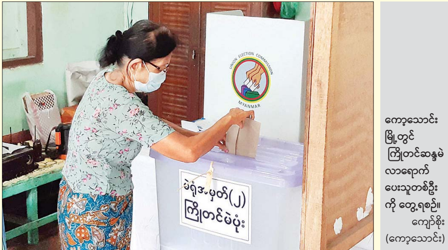
ကော့သောင်း မြို့တွင် ကြိုတင်ဆန္ဒမဲ လာရောက် ပေးသူတစ်ဦး ကို တွေ့ရစဉ်။