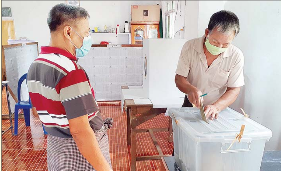
ကရင်ပြည်နယ် လှိုင်းဘွဲ့မြို့နယ်တွင် ကြိုတင်ဆန္ဒမဲ လာရောက်ပေးသူတစ်ဦးကို တွေ့ရစဉ်။