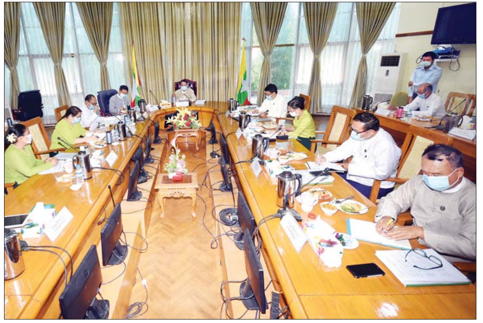
ပြည်ထောင်စုဝန်ကြီး ဒေါက်တာသန်းမြင့် လုပ်ငန်းညှိနှိုင်းအစည်းအဝေးတွင် အမှာစကားပြောကြားစဉ်။ သတင်းစဉ်

ကုန်စည်ပြပွဲများကိုလည်း တိုးမြှင့်ဆောင်ရွက်နိုင်ခဲ့ပါကြောင်း၊ ပို့ကုန်ပိုမိုတိုးမြှင့်နိုင်ရေးအတွက် နိုင်ငံတော်၏ စီးပွားရေးမူဝါဒများနှင့် အညီ နိုင်ငံတကာလုပ်ထုံးလုပ်နည်းများကို ဆောင်ရွက်နိုင်စွမ်းရှိစေရန် လိုအပ်သကဲ့သို့ ဈေးကွက်တစ်ခုတည်းကို မှီခိုအားထားနေခြင်းမပြုဘဲ ကျယ်ပြန့်သော ဈေးကွက်ရရှိစေရေးနှင့် ဈေးနှုန်းနှင့် အရည်အသွေးယှဉ်ပြိုင်နိုင်စွမ်းရှိသည့် တန်ဖိုးဖြင့် ထုတ်ကုန်များ ထုတ်လုပ်တင်ပို့နိုင်စေရေးအတွက်လည်း ကြိုးပမ်းဆောင်ရွက်သွားကြရမည် ဖြစ်ပါကြောင်း ပြောကြားသည်။ ယင်းနောက် ဒုတိယဝန်ကြီးက မိမိတို့ဝန်ကြီးဌာနအနေဖြင့် ကုန်သွယ်မှုတိုးမြှင့် ဆောင်ရွက်နိုင်ရေးအတွက် အင်တာနက်နှင့် အွန်လိုင်းစနစ်များကို ပိုမိုအသုံးပြု ဆောင်ရွက်လာခြင်း၊ နိုင်ငံတကာနှင့် ရင်ပေါင်တန်းနိုင်စေရန် စွမ်းဆောင်ရည်မြှင့်တင်ရေး သင်တန်းများ ဖွင့်လှစ်ခြင်း၊ နှစ်နိုင်ငံကုန်သွယ်မှု တိုးမြှင့်လာနိုင်ခြင်း၊ စားသုံးသူကာကွယ်ရေးကော်မတီများ ဖွဲ့စည်း၍ စားသုံးသူများ၏ အကျိုးစီးပွားကို ဆောင်ရွက်ခြင်းကိုလည်း ပိုမို ဆောင်ရွက်ပေးနိုင်ခဲ့သည်ကို မြင်တွေ့ရပါကြောင်း။ ထို့ပြင် နိုင်ငံတော်၏ အရေးပေါ်ရိက္ခာဝယ်ယူရေး၊ တောင်သူလယ်သမား အကျိုးစီးပွားမြှင့်တင်ရေး အဖြစ် အခြေခံဈေးနှုန်းဖြင့် ဆန်စပါး