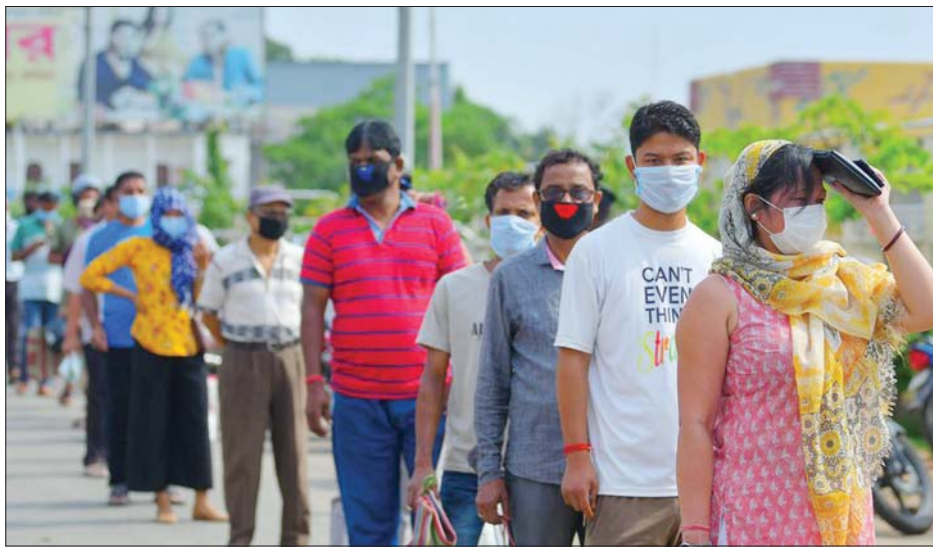
အသွားအလာကန့်သတ်ပိတ်ဆို့မှုကာလအတွင်း ပြည်သူများ အိန္ဒိယနိုင်ငံ အရှေ့မြောက်ပိုင်းပြည်နယ်မြို့တော် အာဂါတာလာရှိ ဈေးအတွင်းသို့ ဝင်ရောက်ဈေးဝယ်ခြင်းမပြုမီ အပူချိန်စစ်ဆေးခံရန် တန်းစီစောင့်ဆိုင်းနေသည်ကို တွေ့ရစဉ်။

ပြောကြားလိုက်သည်။ အိန္ဒိယနိုင်ငံ၏ ကိုဗစ်-၁၉ အတည်ပြုလူနာထက်ဝက် ခန့်သည် အိန္ဒိယနိုင်ငံအနောက်ပိုင်းပြည်နယ် မဟာရက်စ် ထရာ၊ အရှေ့တောင်ပိုင်းပြည်နယ် ဥတာပရာဒေရှ်နှင့် တောင်ပိုင်းပြည်နယ်နှစ်ခုတို့မှဖြစ်သည်။ အိန္ဒိယပတ်ဝန်းကျင်သည် တစ်နိုင်ငံလုံးအသွားအလာ ကန့်သတ်ပိတ်ဆို့မှုများကို မတ်လနှောင်းပိုင်းမှ မေလ ကုန်အထိ ချမှတ်ခဲ့ပြီး ဇွန်လမှစကာ ဖြေလျော့မှုများ တဖြည်းဖြည်း ပြုလုပ်ခဲ့သည်။ သို့သော်လည်း ပြည်ထဲရေးဝန်ကြီးဌာနက အောက်တို ဘာ ၃၀ ရက်တွင် နိုင်ငံ၏စီးပွားရေးကို ပြန်ဖွင့်ရန် စီစဉ် ထားမှုကို နိုင်ငံဘာ ၃၀ ရက်အထိတိုးမြှင့်လိုက်ကြောင်း ပြောကြားလိုက်သည်။ ဟိန္ဒူပွဲတော်ကာလအတွင်း ကိုဗစ်-၁၉ ကူးစက်မှုတိုးလာမည်ကို စိုးရိမ်သောကြောင့် အဆိုပါ ဆုံးဖြတ်ချက်ကို ချမှတ်ခဲ့ခြင်းဖြစ်သည်။ ကျိုတို