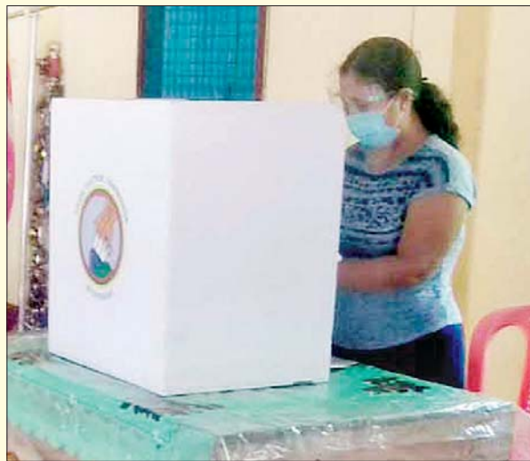
ရခိုင်ပြည်နယ် စစ်တွေမြို့တွင် ကြိုတင်ဆန္ဒမဲ လာရောက်ပေးနေသည်ကို တင်ထွန်း(ပြန်/ဆက်) တွေ့ရစဉ်။