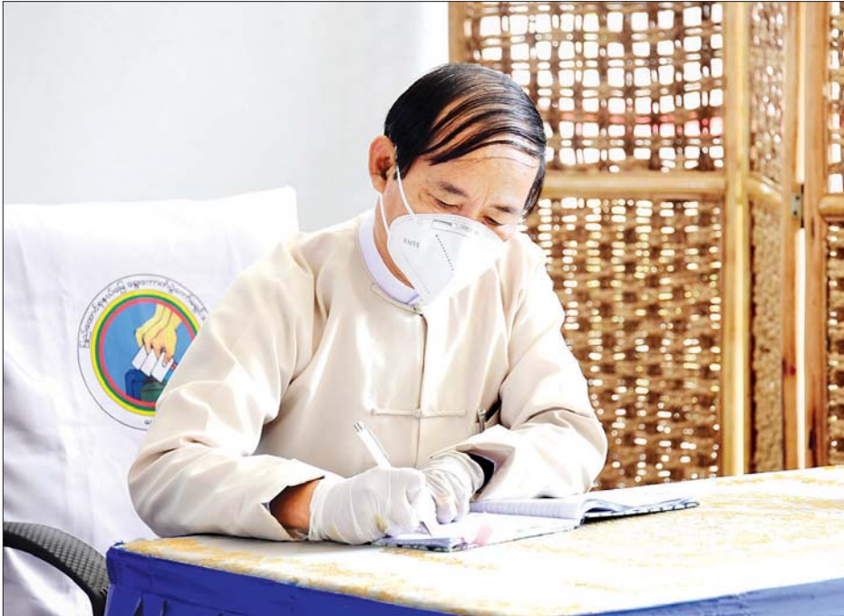
နိုင်ငံတော်သမ္မတ ဦးဝင်းမြင့် မဲဆန္ဒနယ်ပြင်ပသို့ ပုံစံ - ၁၅ ထုတ်ပေးမှုနှင့် ဆန္ဒမဲပေးပြီးကြောင်း မှတ်တမ်းစာအုပ်တွင် လက်မှတ်ရေးထိုးစဉ်။ (သတင်းရှေ့ဖုံး) သတင်းစဉ်