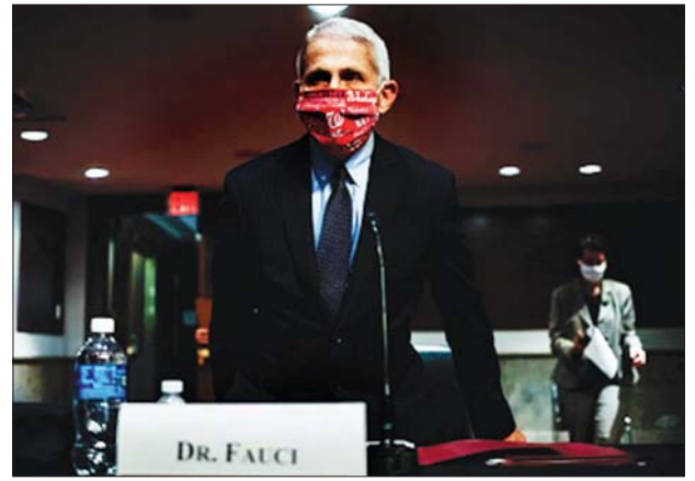
အမေရိကန်နိုင်ငံ၏ ထိပ်တန်းကျန်းမာရေးအင်အားစု အကြံပေး အဖွဲ့တို့က ဖော်စက

အမေရိကန် ပြည်သူများက နှာခေါင်းစည်းတပ်ဆင်ခြင်းကို လျှော့ ခြားသောရေမှတစ်ဆင့် ထင်နေ ကြောင်း၊ ၎င်းက မိမိမည်သည့် နိုင်ငံ ရေးအမြင်ပေါ်တွင် ရပ်တည်နေသလဲ ဆိုသည့်အပေါ်မူတည်ကြောင်း၊ သမား တော်တစ်ဦး၊ သိပ္ပံပညာရှင်တစ်ဦး၊ ပြည်သူ့ကျန်းမာရေးပုဂ္ဂိုလ်တစ်ဦး အနေဖြင့်အလွန်ကိုနာကျင်ရကြောင်း ဖော်စက ဆက်လက်ပြောကြားသည်။ ထို့အပြင် ဖော်စက ၎င်းအနေဖြင့် နိုင်ငံ၏ ကူးစက်ရောဂါပျံ့နှံ့မှုအခြေ အနေနှင့်ပတ်သက်ပြီး သတိထားနေ ရကြောင်း၊ ဆောင်းရာသီနှင့် အားလပ် ရက်ရာသီသို့ ရောက်ရှိတော့မည့် နောက်ထပ် လအနည်းငယ်အတွက် အလွန်ကို စိုးရိမ်ကြောင်း ပြောသည်။ လာမည့်လအနည်းငယ်အတွင်း ကိုဗစ်- ၁၉ ကာကွယ်ဆေးရရှိတော့ မည်ဖြစ်သော်လည်း ၂၀၂၁ ဒုတိယ သုံးလပတ် သို့မဟုတ် တတိယသုံးလ ပတ်မတိုင်မီ လုံလောက်သည့်ထိုးနှံမှု လုပ်ဆောင်နိုင်ဦးမည်မဟုတ်ကြောင်း ၎င်းက ဆက်လက်ပြောကြားလိုက် သည်။ ဆင်ပွား