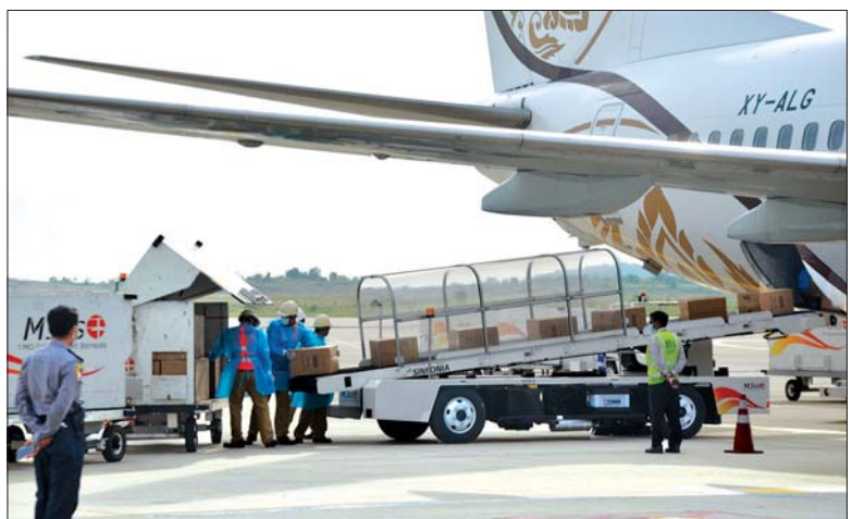
ပါတီစုံဒီမိုကရေစီ အထွေထွေရွေးကောက်ပွဲအတွက် တရုတ်ပြည်သူ့သမ္မတနိုင်ငံမှ ဝယ်ယူထားသည့် ကိုဗစ် - ၁၉ ကာကွယ်၊ ထိန်းချုပ်၊ ကုသရေး အထောက်အကူပစ္စည်းများ မန္တလေးအပြည်ပြည်ဆိုင်ရာလေဆိပ်သို့ ရောက်ရှိစဉ်။

ယနေ့တွင် ရန်ကုန်အပြည်ပြည်ဆိုင်ရာလေဆိပ်သို့ အထူးလေယာဉ် ငါးခေါက်နှင့် မန္တလေးအပြည်ပြည်ဆိုင်ရာလေဆိပ်သို့ အထူးလေယာဉ် သုံးခေါက် ရောက်ရှိကြပြီး ယနေ့