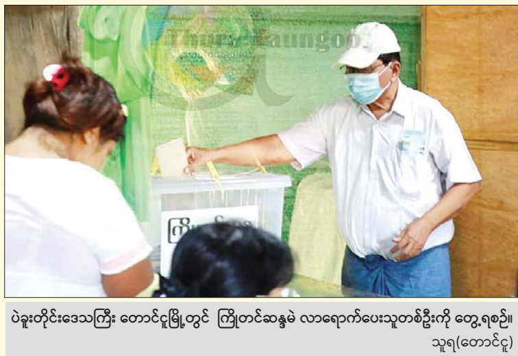
ပဲခူးတိုင်းဒေသကြီး တောင်ငူမြို့တွင် ကြိုတင်ဆန္ဒမဲ လာရောက်ပေးသူတစ်ဦးကို တွေ့ရစဉ်။