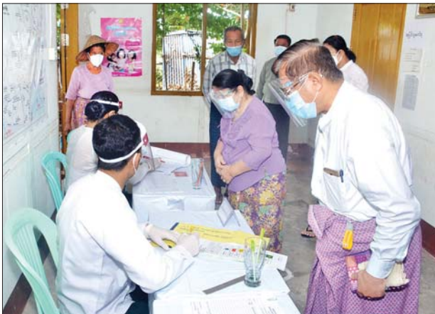
ဥတ္တရသီရိမြို့နယ်တွင် ကြိုတင်ဆန္ဒမဲပေးစဉ်။

ကြိုတင်ဆန္ဒမဲလာရောက်ပေးသူများကို မဲရုံပြင်ပ ကြီးကြပ်ရေးတာဝန် ထမ်းဆောင်သူများက ကိုယ်အပူချိန်တိုင်းတာခြင်း၊ လက်သန့်ဆေးရည်ဖြင့် လက်များသန့်စင်ပေးခြင်း၊ နှာခေါင်းစည်းထုတ်ပေးခြင်း၊ မဲရုံမှူးများက မဲစာရင်းစစ်ဆေးခြင်း၊ မဲလက်မှတ်ထုတ်ပေးခြင်း၊ ဆန္ဒမဲပေးပြီးကြောင်း လက်မှတ်ထိုး