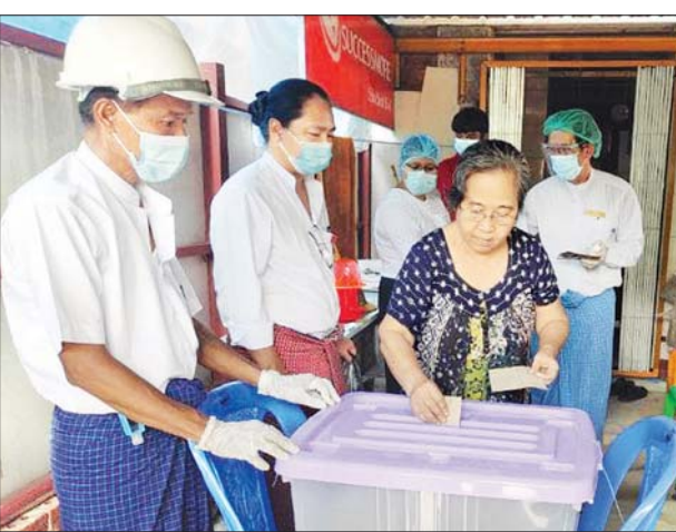
သန်လျင်မြို့နယ်တွင် ကြိုတင်ဆန္ဒမဲ ပေးစဉ်။

၂၀၂၀ ပြည့်နှစ် အထွေထွေရွေးကောက်ပွဲကို နိုဝင်ဘာလ ၈ ရက်တွင် ကျင်းပ