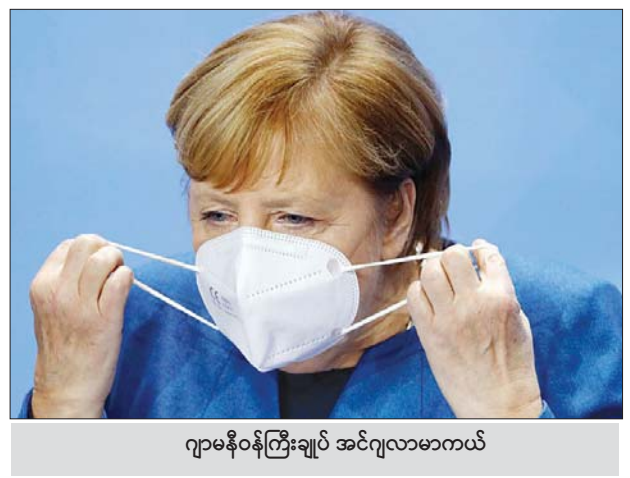
ဂျာမနီဝန်ကြီးချုပ် အင်ဂျလာမာကာယ်

ကာယ်က ကြေညာခဲ့သည်။ လုပ်သားအင်အား ၅၀ ထက်ပို သည့် ကုမ္ပဏီများနှင့်လုပ်ငန်းများ တွင် လွန်ခဲ့သည့်နှစ် နိုဝင်ဘာလ ဝင်ငွေ၏ ၇၅ ရာခိုင်နှုန်းကို အစိုးရ က ပြန်လည်ထောက်ပံ့ပေးမည်ဖြစ် သည်။ ဈေးဆိုင်ကြီးများ၊ ကျောင်းများ၊ မူလတန်းကျောင်းများကိုမူ ဆက်လက် ဖွင့်ခွင့်ပေးထားမည်ဖြစ်ပြီး ရောဂါ ကူးစက်မှု ကာကွယ်ရေးအတွက် နည်းလမ်းများ ဆက်လက်ကျင့်သုံး သွားရမည် ဖြစ်သည်။ အင်န်အိတ်ချ်ကေ