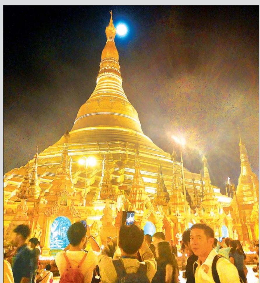
ရွှေတိဂုံစေတီတော်၌ ယမန်နှစ် သီတင်းကျွတ်လပြည့်ညက ဘုရားဖူးလာပြည်သူများဖြင့် စည်ကားစွာ တွေ့ရစဉ်

အင်းဝခေတ်စာပေများတွင်မူ 'သီတင်းကျွတ်' ဟု စတင်သုံးစွဲခဲ့ကြပြီး 'သီတင်း' ဆိုသည်မှာ 'နေထိုင်ခြင်း' ဟု အဓိပ္ပာယ်ရကာ ဝါတွင်းသုံးလကာလပတ်လုံး သီတင်းသုံးနေထိုင်ခြင်းမှ ကျွတ်လွတ်သော အချိန်အခါဖြစ်ကြောင်း ဖွင့်ဆိုထားသည်ကို တွေ့ရသည်။ ရာသီပန်းမှာ ကြာဖြူပန်း (Nymphaea Lotus) ဖြစ်သည်။ သီတင်းကျွတ်လပြည့် (အဘိဓမ္မာ အခါတော်နေ့) ရောက်သည့်အခါ လသည် နေနှင့် ဆန့်ကျင်ဘက်ဖြစ်ရာ ကမ္ဘာတစ်ဖက်ခြမ်းသို့ ရောက်ရှိနေသဖြင့် နေအလင်းရောင်ကြောင့် ထိုနေ့ညတွင် လသည် အပြည့်အဝ လင်းလက်တောက်ပလျက် ရှိသည်။ အမေရိကန် ရိုးရာအနေဖြင့်မူ ထိုညတွင် ထိန်ထိန်သာနေသော လမင်း