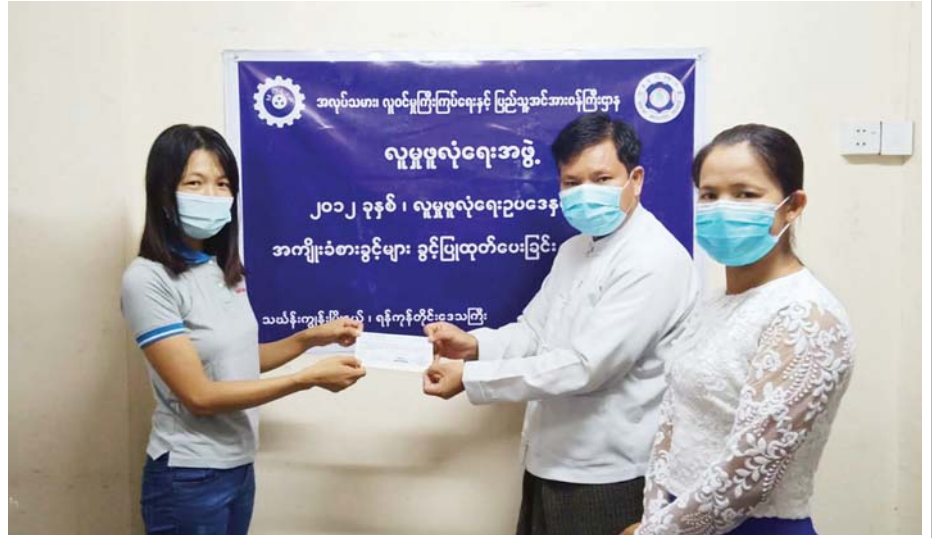
COVID-19 ကပ်ရောဂါဖြစ်ပွားမှုကြောင့် ယာယီပိတ်ထားသည့် စက်ရုံ၊ အလုပ်ရုံ၊ လုပ်ငန်းဌာနများမှ လူမှုဖူလုံရေးအာမခံ အကျိုးခံစားခွင့်များအား လူမှုဖူလုံရေးထောက်ပံ့ကူညီမှု အကျိုးခံစားခွင့်များ စိစစ်ခွင့်ပြုထုတ်ပေးစဉ်။