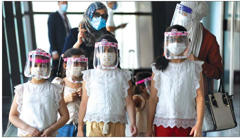
အီရတ်နိုင်ငံတွင် နာခေါင်းစည်းနှင့် မျက်နှာဖုံးအကာတပ်ဆင်ထားသည့် ကလေးငယ်များကို တွေ့ရစဉ်။

အီရတ်နိုင်ငံတွင် ကိုဗစ်-၁၉ ထပ်မံကူးစက်ခဲ့ရာ ၂၅၀၄ ဦး ထပ်မံ စစ်ဆေးတွေ့ရှိခဲ့ကြောင်း ကျန်းမာရေး ဝန်ကြီးဌာနက ဖော်ပြသည်။ အီရတ် နိုင်ငံတွင် ကိုဗစ်-၁၉ ကပ်ရောဂါကို ရင်ဆိုင်တိုက်ဖျက်နေရချိန် နိုင်ငံ ကျန်းမာရေးကဏ္ဍကို အထောက်အကူ ပြုရန် ယခုနှစ်၏ နောက်ဆုံးလ အတွင်း ဆေးဝါးကုသမှုဆိုင်ရာ အကူအညီများ ပေးအပ်မည်ဖြစ် ကြောင်း အီရတ်ရှိ ကမ္ဘာ့ကျန်းမာရေး အဖွဲ့ဆိုင်ရာ အရေးပေါ်အဖွဲ့အကြီး အကဲ ဝါအယ်လ် ဟာတာဟစ်က သတင်းစာရှင်းလင်းပွဲတွင် ပြောကြား ခဲ့သည်။ လာမည့်နှစ်လအတွင်း ကမ္ဘာ့