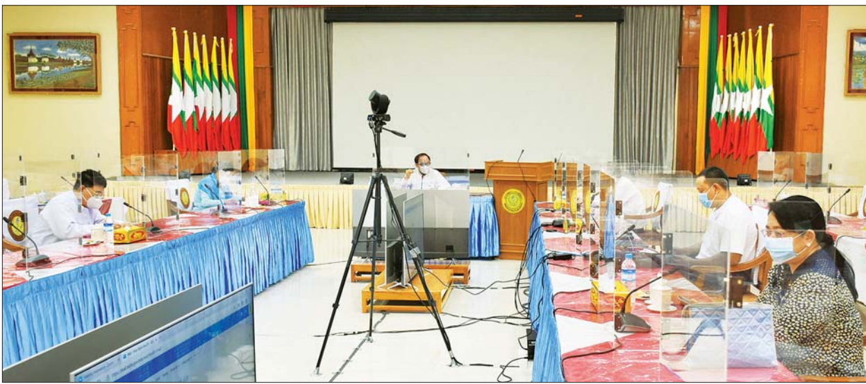
ပြည်ထောင်စုဝန်ကြီး ဒေါက်တာမြင့်ထွေး ကိုဗစ်-၁၉ ဖြစ်ပွားမှုနှင့် ရောဂါ ကာကွယ်၊ ထိန်းချုပ်၊ ကုသရေးလုပ်ငန်းများ ဆောင်ရွက်နေမှု အခြေအနေများ အပတ်စဉ် တင်ပြဆွေးနွေးပွဲ တက်ရောက်စဉ်။

ထိုသို့ နာတာရှည်ရောဂါရှိ သူများနှင့် သက်ကြီးရွယ်အိုများအနေ ဖြင့် တစ်အိမ်တည်း နေထိုင်သူများ နှင့် ခပ်ခွာခွာနေထိုင်ခြင်း၊ သီးခြား စားသောက်ခြင်း၊ အချိန်ခြား၍ စားသောက်ခြင်းနှင့်ဖြစ်နိုင်ပါက သီးခြား အိပ်ခန်းခြားတို့ကို အထူးသတိပြု လိုက်နာဆောင်ရွက်ကြရန် မြို့နယ်၊ ရပ်ကွက်များတွင် လက်ကိုင်အသံ ချဲ့စက်များ အသုံးပြုကာ ကျယ်ကျယ် ပြန့်ပြန့် အသံပေးနှိုးဆော်ကြစေလိုပါ ကြောင်း၊ အသံပေးနှိုးဆော်မှုများ အပြင် အသွားအလာ ကန့်သတ်ရာ နေရာ (Quarantine Site) များ၊ လတ်တလော အနံ့ပျောက်လက္ခဏာ ရှိသူများထားရှိရာ စင်တာများ၊ ဆေးရုံ များနှင့် ကိုဗစ်-၁၉ ကုသမှုဌာနများ တွင် ရောက်ရှိနေသည့် မကူးစက်တတ် သော ရောဂါအခဲရှိသူများတွင် သောက် လက်စဆေးဝါးများ မပြတ်လပ်စေရေး အတွက် မိမိတို့ဆောင်ရွက်လျက်ရှိပါ ကြောင်း၊ ၎င်းတို့အားလည်း အခြား ရောဂါအခဲမရှိသူများနှင့် ကွဲပြားရန် နှင့် မြင်သာစေရန် တစ်နည်းနည်းဖြင့် အမှတ်အသား ပြုလုပ်ကာ ၎င်းတို့ကို ရောဂါအခြေအနေကို အထူးစောင့် ကြပ်ကြည့်ရှုရမည် ဖြစ်ပါကြောင်း။