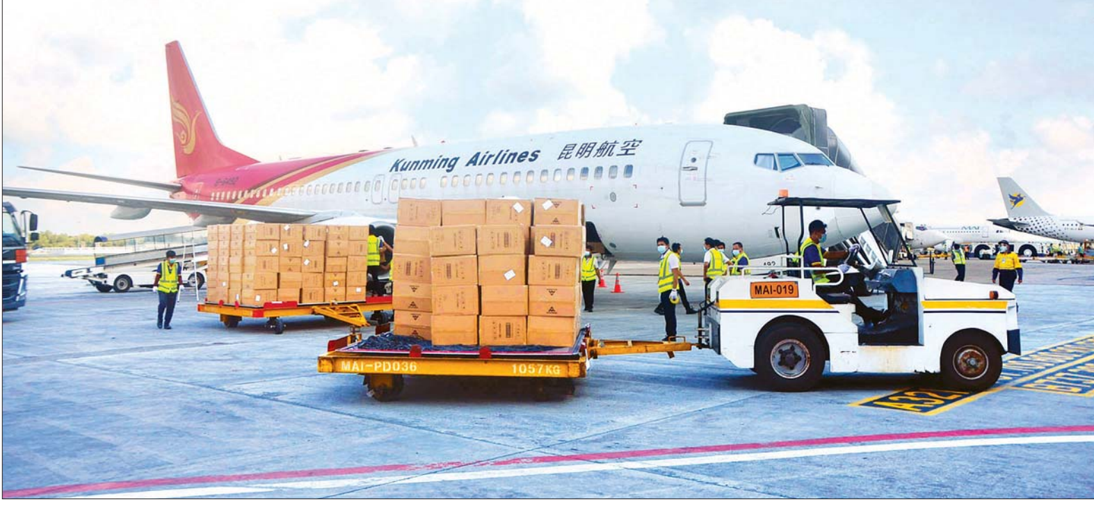
ပါတီစုံဒီမိုကရေစီအထွေထွေရွေးကောက်ပွဲအတွက် တရုတ်ပြည်သူ့သမ္မတနိုင်ငံမှ ဝယ်ယူထားသည့် ကိုဗစ် - ၁၉ ကာကွယ်၊ ထိန်းချုပ်၊ ကုသရေး အထောက်အကူပစ္စည်းများ ရန်ကုန်အပြည်ပြည်ဆိုင်ရာ လေဆိပ်သို့ အောက်တိုဘာ ၂၅ ရက်က ထပ်မံရောက်ရှိလာစဉ်။

ရန်ကုန် အောက်တိုဘာ ၂၅ နိုဝင်ဘာ ၈ ရက်တွင် ကျင်းပမည့် ပါတီစုံဒီမိုကရေစီ အထွေထွေ ရွေးကောက်ပွဲတွင် မဲဆန္ဒရှင်များ၊ မဲရုံ တာဝန်ကျ ဝန်ထမ်းများနှင့် စေတနာ့ ဝန်ထမ်းများအား ကိုဗစ်-၁၉ ရောဂါ ကာကွယ်၊ ထိန်းချုပ်၊ ကုသရေးအတွက် ဖြန့်ဝေပေးမည့် တရုတ်ပြည်သူ့သမ္မတ နိုင်ငံမှ ဝယ်ယူထားသော ပစ္စည်းများ ရန်ကုန်အပြည်ပြည်ဆိုင်ရာလေဆိပ် သို့ ယနေ့တွင် အထူးလေယာဉ်များဖြင့် ဆက်လက်ရောက်ရှိကြသည်။ ရန်ကုန် အပြည်ပြည်ဆိုင်ရာ လေဆိပ်သို့ အထူးလေယာဉ်များသည် နံနက် ၃ နာရီ ၂၅ မိနစ်တွင်လည်း ကောင်း၊ နံနက် ၅ နာရီ မိနစ် ၄၀ တွင် လည်းကောင်း၊ နံနက် ၈ နာရီ ၅ မိနစ် တွင် လည်းကောင်း၊ နံနက် ၉ နာရီ မိနစ် ၄၀ တွင်လည်းကောင်း၊ ညနေ ၅ နာရီ ၄၅ မိနစ်တွင် လည်းကောင်း၊ ည ၁၀ နာရီ ၅ မိနစ်တွင်လည်းကောင်း ရောက်ရှိကြသည်။ စာမျက်နှာ ၄ ကော်လံ ၃ ◆