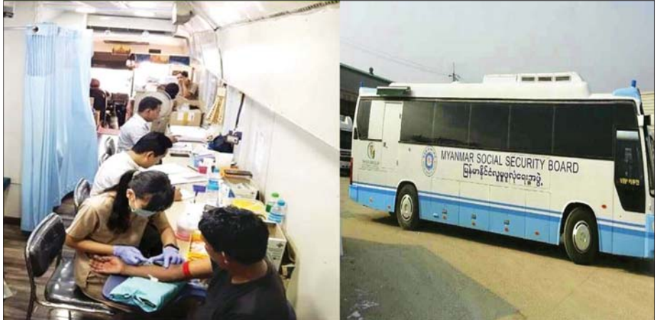
လူမှုဖူလုံရေးအဖွဲ့က နေပြည်တော်ရှိ မြန်မာ့အသံနှင့် ရုပ်မြင်သံကြား (တပ်ကုန်း)သို့ Mobile Medical Unit (MMU) ဖြင့် ဆေးကုသမှု ဆောင်ရွက်ပေးစဉ်။

(ဂ) ဦးစားပေး ၃ - ၂၀၂၀ ခုနှစ်တွင် အားလုံးအတွက် အထူးသဖြင့် ထိခိုက်လွယ်သော အလုပ်သမားများနှင့် ပြည်သူများအတွက် လူမှုအကာအကွယ်စောင့်ရှောက်ရေးလှမ်းခြုံမှု တိုးချဲ့နိုင်စေရန်၊