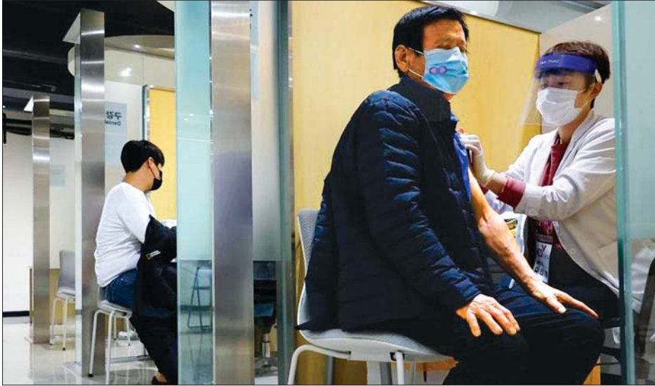
တောင်ကိုရီးယားနိုင်ငံတွင် တုပ်ကွေးကာကွယ်ဆေး ထိုးနှံပေးနေစဉ်။

ဆိုးလ် အောက်တိုဘာ ၂၅ တောင်ကိုရီးယားနိုင်ငံတစ်ဝန်းတွင် တုပ်ကွေးရောဂါ ကာကွယ်ဆေး အခမဲ့ထိုးနှံပေးခဲ့ပြီးနောက်ပိုင်း သေဆုံးသူ အရေအတွက် ထပ်တိုးလာခဲ့ကြောင်းသိရသည်။