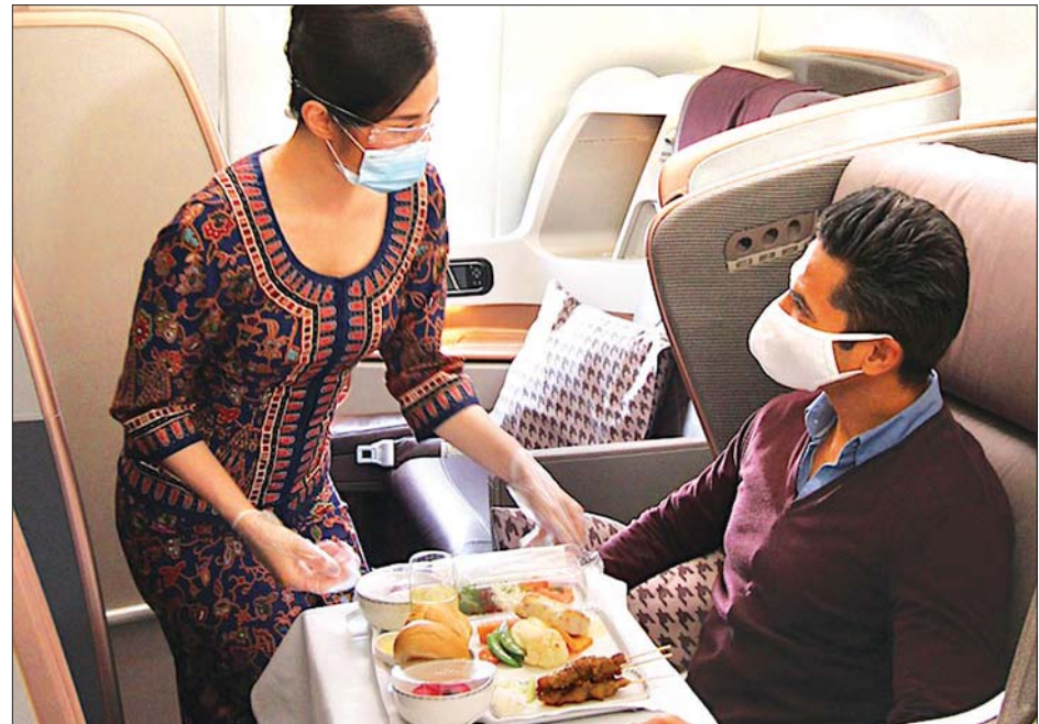
လေယာဉ်ပေါ်တွင် လာရောက်စားသုံးသူတစ်ဦးကို တွေ့ရစဉ်။