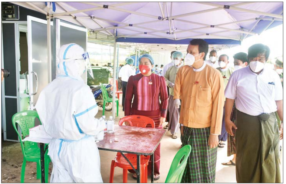
တိုင်းဒေသကြီး အဝင် / အထွက် လုံခြုံရေးနှင့် ကိုဗစ် - ၁၉ ရောဂါ စစ်ဆေးရေးစခန်း (လှည်းကူး) တည်ဆောက်နေမှု များကို ကြည့်ရှုစစ်ဆေးပြီး လိုအပ်သည်များကို မှာကြား ခဲ့သည်။ မြို့နယ် (ပြန်/ဆက်)

ထို့နောက် ဝန်ကြီးချုပ်နှင့်အဖွဲ့သည် Max Highway Co., Ltd နှင့် ဧရာဝတီမောင်ဒေးရှင်းတို့မှ ဆောက်လုပ် လှူဒါန်းသည့် လှည်းကူးမြို့နယ် မင်းလွင်ကျန်းကျေးရွာရှိ