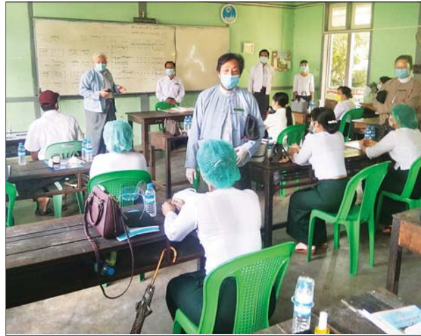
ခြင်းကြောင့် ကိုဗစ်-၁၉ ရောဂါ စည်းကမ်း လမ်းညွှန်ချက်များနှင့် ကာကွယ် ထိန်းချုပ်ရေးဆိုင်ရာ အညီ မဲရုံများ၌ ကြိုတင်ပြင်ဆင်မှု

ရွေးကောက်ပွဲ ကာလသည် ရက်ပိုင်းမျှသာ ကျန်တော့သည်ဖြစ်