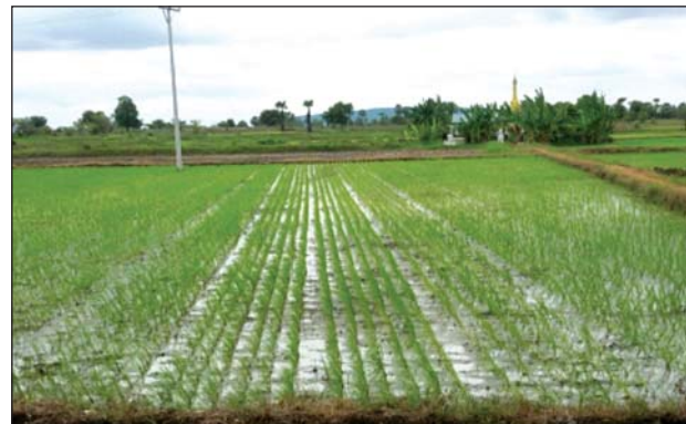
စစ်ကိုင်းခရိုင်အတွင်းမှ နွေစပါးစိုက်ပျိုးထားသော လယ်မြေများ

ကျပ်သိန်းပေါင်း ၃၀၀၀ ကျော်နှင့် ဝယ်ယူကာ ခေတ် ကာလနှင့် လျော်ညီသည့် အရည်အသွေးမြင့် ပိုးချည် များထုတ်လုပ်၍ နိုင်ငံတကာဈေးကွက်သို့ တင်ပို့နိုင် ရေးအတွက် ရည်ရွယ်ကြောင်း၊ ရစ်တိုင် ၄၀ ပါသော ခေတ်မီ ပိုးချည်စက်ဖြစ်ပြီး ထွက်ရှိလာသော ပိုးချည် များကို နိုင်ငံတကာဈေးကွက်သို့ တင်ပို့နိုင်မည်ဖြစ်၍ ဒေသခံ ပိုးစာပင်စိုက်ပျိုးသူများနှင့် ပိုးမွေးမြူသည့် တောင်သူများ၏ လူနေမှုဘဝကို မြှင့်တင်ပေးမည်ဖြစ် သလို ချင်းပြည်နယ် ဖွံ့ဖြိုးတိုးတက်ရေးကိုလည်း များစွာ အထောက်အကူပြုမည်ဖြစ်ကြောင်း သိရ သည်။ ပေါင်ကျင့်မုန့်(ပြန်/ဆက်)