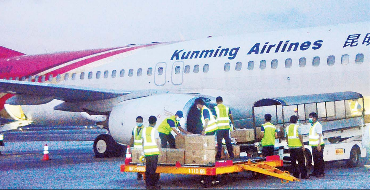
ပါတီနီမိုကရေစီအထွေထွေရွေးကောက်ပွဲအတွက် တရုတ်ပြည်သူ့သမ္မတနိုင်ငံမှ ဝယ်ယူထားသည့် ကိုဗစ် - ၁၉ ကာကွယ် ထိန်းချုပ်၊ ကုသရေး အထောက် အကူပစ္စည်းများ ရန်ကုန်အပြည်ပြည်ဆိုင်ရာ လေဆိပ်သို့ အောက်တိုဘာ ၂၅ ရက်က ထပ်မံရောက်ရှိလာစဉ်။

◆ ရှေ့ပိုးမှ အထောက်အကူပစ္စည်းများမှာ ရန်ကုန်အပြည်ပြည်ဆိုင်ရာလေဆိပ်နှင့် မန္တလေးအပြည်ပြည်ဆိုင်ရာ လေဆိပ်တို့မှ တစ်ဆင့် အောက်တိုဘာ ၂၆ ရက်မှ