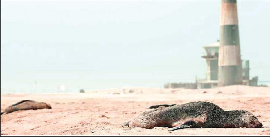
နမီးဘီးယားနိုင်ငံရှိ ကမ်းခြေတစ်ခုတွင် သေဆုံးနေသည့် ပင်လယ်ဖျံတစ်ကောင်ကို တွေ့ရစဉ်။