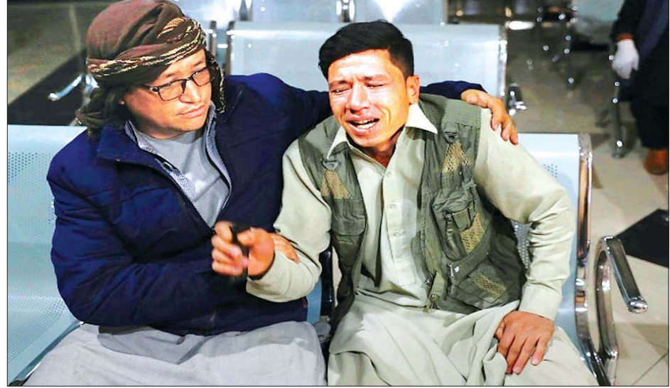
အစ်ကိုသေဆုံးသွားသည့်အတွက် ဝမ်းနည်းပူဆွေးနေသည့် အာဖဂန်အမျိုးသားတစ်ဦးကို တွေ့ရစဉ်။

သို့သော်လည်း တိုင်းပြည်အတွင်း အကြမ်းဖက်တိုက်ခိုက်မှုများ ပိုမို များပြားလာသည့်အတွက် လုံခြုံရေး ကို ပြန်လည်ထိန်းသိမ်းရန် အခက်အခဲ၊ စိန်ခေါ်မှုများနှင့် ကြုံတွေ့နေရ သည်။ အင်န်အိတ်ချ်ကေ