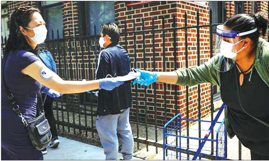
ပါးစပ်နှာခေါင်းစည်းဝတ်ဆင်ရန် မျှဝေပေးနေသည့်ကို တွေ့ရစဉ်။

ဒေါက်တာမာရေးနဲ့ သူ့ရဲ့လုပ်ဖော်ကိုင်ဖက်တွေဟာ ကိုဗစ်-၁၉ ကူးစက်မှုနှုန်း၊ ဆေးစစ်ပေးနိုင်မှုနှုန်း၊ ပါးစပ်နှာခေါင်းစည်းအသုံးပြုနှုန်းတွေကို ခွဲခြားစိတ်ဖြာခဲ့ကြပါ