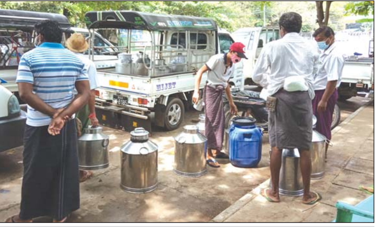
အင်းစိန်မြို့နယ်မှ နွားနို့ခိုင်တစ်ခုတွင် နွားနို့များရောင်းဝယ်နေစဉ်။ ညနေပိုင်းပါ ရောင်းချပြီး တာမွေခိုင်မှာ နံနက် လျက်ရှိသလို လက်ရှိအခြေအနေအရ ဆောင်း ပိုင်းသာရောင်းချသည်။ လက်ရှိတွင် ရန်ကုန် ရာသီတွင်လည်း ဈေးနှုန်းကျဖွယ်မရှိကြောင်း အင်းစိန်နွားနို့ဈေးကွက်မှ သိရသည်။ နည်းပြီး စားသုံးမှုများ၍ ဈေးနှုန်းမြင့်တက် သန်းထိုက်၊ ဓာတ်ပုံ - သန်းစိုး

တွင် တစ်ပိဿာလျှင် ကျပ် ၇၀၀၀ နှုန်းအထိ ဈေးမြင့်လျက်ရှိကြောင်း သိရသည်။ ရန်ကုန်မြို့တွင် နို့စားနွားငါးမျိုးကို မွေးမြူ လျက်ရှိပြီး ဗရေရန်နို့စားနွားမှာ မြန်မာနိုင်ငံ၏ ရာသီဥတုနှင့် ကိုက်ညီသောကြောင့် မွေးမြူသူ အများဆုံးဖြစ်သည်။ နို့ထွက်နှုန်းကောင်းသော ပြင်သစ်နို့စားနွားမှာ တစ်ရက်လျှင် ၁၄ ပိဿာ ခန့်အထိ ထွက်ရှိသော်လည်း အသားအရေ နူးညံ့၍ ရာသီဥတုဒဏ် မခံနိုင်သဖြင့် ရန်ကုန် မြို့တွင် မွေးမြူသူနည်းပါးသည်။ ရန်ကုန်တိုင်း ဒေသကြီးတွင် ကနေဒါ၊ ဒိန်းမတ်နှင့် နော်ဝေ နိုင်ငံတို့မှ နို့စားနွားမျိုးများကို အများဆုံး မွေးမြူထား၍ ရန်ကုန်တိုင်းဒေသကြီးအတွက် နွားနို့များ နေ့စဉ် ထုတ်လုပ်ကာ အင်းစိန်နှင့် တာမွေခိုင်များမှတစ်ဆင့် မြန်မြူးပေးလျက်ရှိ သည်။ အင်းစိန် နွားနို့ခိုင်မှာ နံနက်ပိုင်းရော