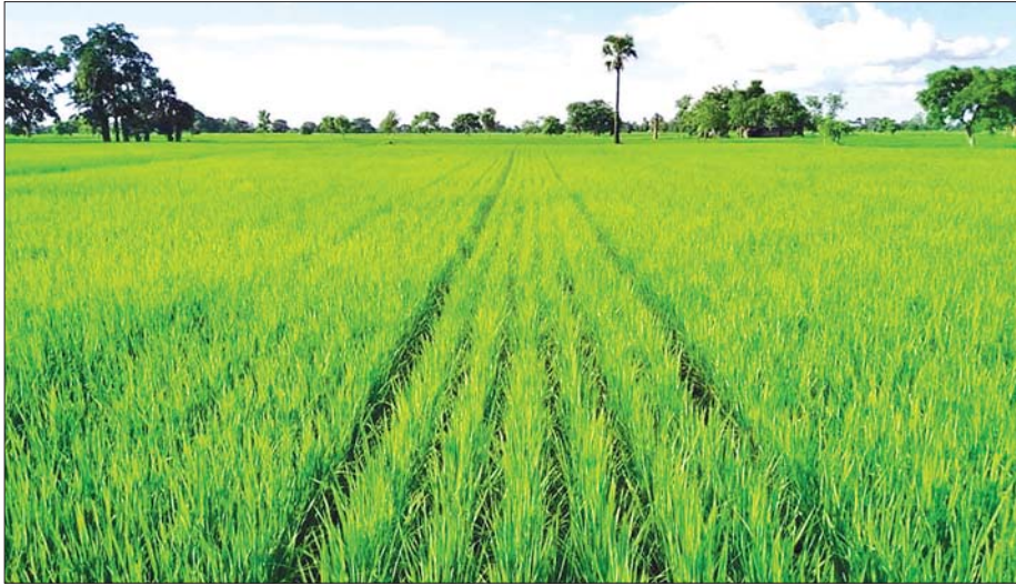
ကိုဗစ်-၁၉ စီးပွားရေးကုစားမှုအစီအစဉ် (CERP) ဖြင့် ဆောင်ရွက်ထားသော စိုပေးမျိုးစေ့ထုတ် SRI စိုက်ခင်းအောင်မြင်ဖြစ်ထွန်းနေမှုကို တွေ့ရစဉ်။

ကပ်ရောဂါဆိုးကြီး၏ ရိုက်ခတ်မှုကြောင့် တောင်သူ လယ်သမားများ၏ လူမှုစီးပွားရေးဆိုင်ရာ ထိခိုက်နစ်နာမှုများကို ကုစားနိုင်ရန်အတွက် ကိုဗစ်-၁၉ စီးပွားရေးကုစားမှုအစီအစဉ် (COVID-19 Economic Relief Plan-CERP)ကို ဆောင်ရွက်ခဲ့ပြီး ထိုအစီအစဉ်အရ စိုက်ပျိုးရေး၊ မွေးမြူရေးနှင့် ဆည်မြောင်းဝန်ကြီးဌာန စိုက်ပျိုးရေးဦးစီးဌာနအနေဖြင့် ဗီဒီယို၊ ပညာပေးစာစောင်များ၊ ပညာပေးစာအုပ်များ ဖြန့်ဝေခြင်း၊ ICT Based ပညာပေးလုပ်ငန်းများ ပြုလုပ်ခြင်း၊ မျိုးစေ့ထုတ်တောင်သူများအား ငွေကြေးထောက်ပံ့ခြင်း၊ ဓာတ်ခွဲခန်းများ အဆင့်မြှင့်တင်ခြင်း၊ ဓာတ်ခွဲခန်းအသစ်များ တည်ဆောက်ခြင်းနှင့် Home Gardening များ ဆောင်ရွက်နိုင်ရန် မျိုးစေ့၊ ပျိုးပင်၊ မြေဩဇာများထောက်ပံ့ခြင်း စသည့် လုပ်ငန်းစဉ်များကို လုပ်ဆောင်ပေးလျက်ရှိပါသည်။