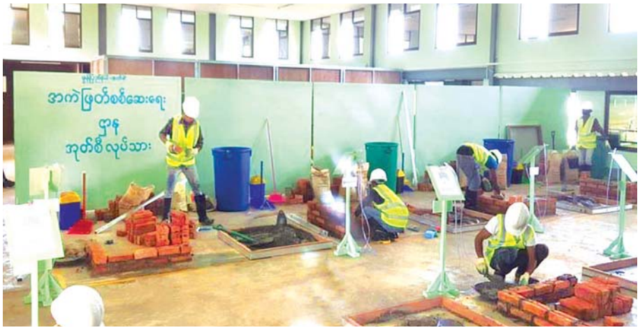
ကျွမ်းကျင်မှုလေ့ကျင့်ရေးသင်တန်းကျောင်း (စက်စဲ) တွင် အုတ်စီ/အုတ်ညှပ်သင်တန်း ဖွင့်လှစ်သင်ကြားနေမှုကို တွေ့ရစဉ်။