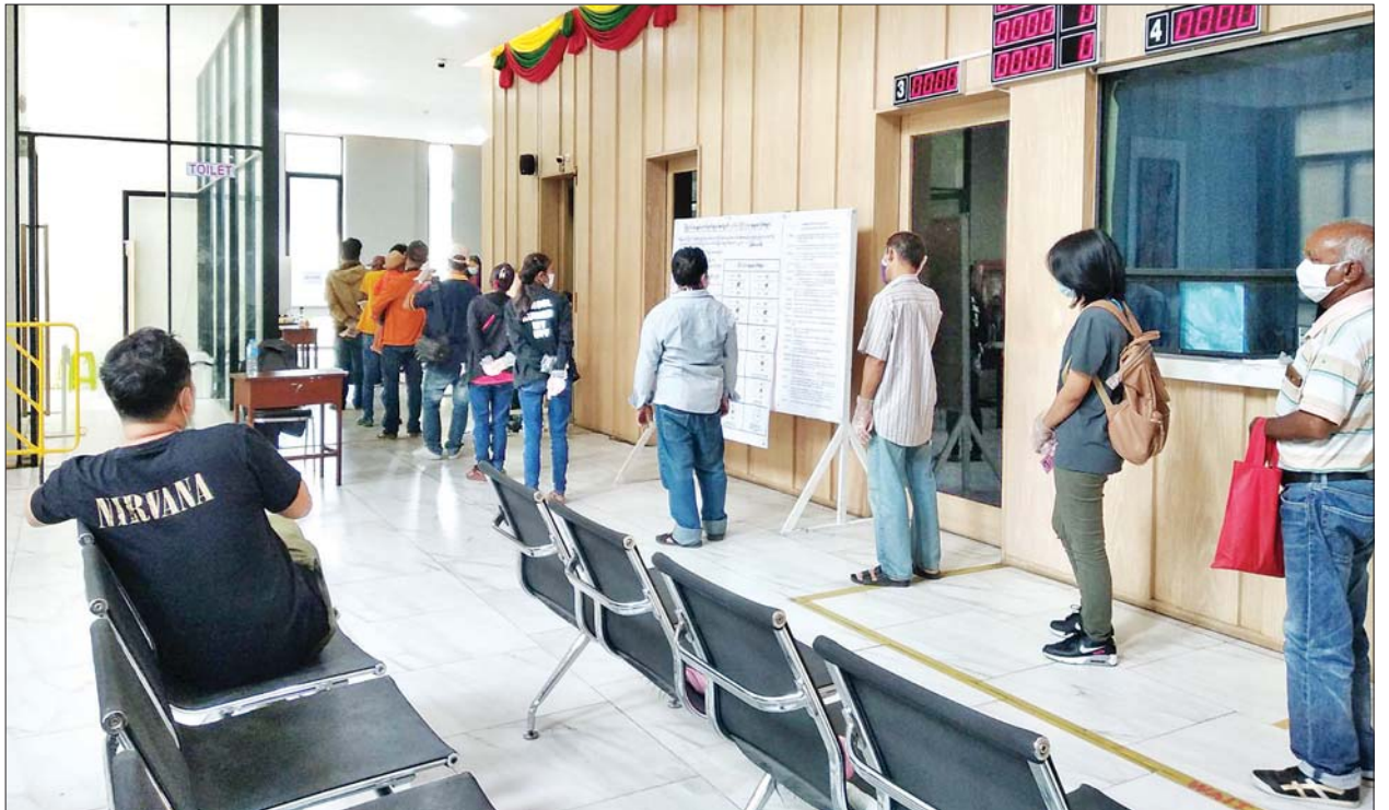
ဗန်ကောက်မြို့ရှိ မြန်မာသံရုံးတွင် ကြိုတင်ဆန္ဒမဲပေးရန် လာရောက်သည့် မြန်မာနိုင်ငံသားများကို တွေ့ရစဉ်။