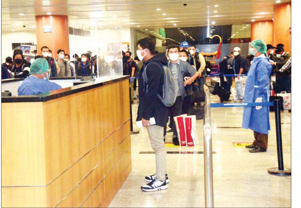
ရေးဝန်ကြီးဌာနအနေဖြင့် သက်ဆိုင်ရာဝန်ကြီးဌာနများ၊ ဆောင်ရွက်ပေးလျက်ရှိကြောင်း သိရသည်။ သက်ဆိုင်ရာနိုင်ငံများရှိ မြန်မာသံရုံးများနှင့် ပူးပေါင်းညှိနှိုင်း သတင်းစဉ်

၈၄ ဦး၊ ဗြိတိန်မှ နှစ်ဦး၊ သီရိလင်္ကာမှ ခြောက်ဦး၊ နော်ဝေမှ နှစ်ဦး၊ အီတလီမှ သုံးဦး၊ တောင်အာဖရိကမှ ခြောက်ဦး၊ ဩစတြီးယားမှ တစ်ဦး၊ ဘင်္ဂလားဒေ့ရှ်မှ တစ်ဦး၊ ရုရှားမှ လေးဦး၊ ပြင်သစ်မှ သုံးဦး၊ ယူအေအီးနှင့် ကာတာမှ မြန်မာသင်္ဘောသား ၃၅ ဦးအပါအဝင် မြန်မာနိုင်ငံသား စုစုပေါင်း ၁၆၅ ဦး လိုက်ပါခဲ့ကြသည်။ ၎င်းတို့ ရန်ကုန်အပြည်ပြည်ဆိုင်ရာလေဆိပ်သို့ ရောက်ရှိချိန်တွင် လူဝင်မှုကြီးကြပ်ရေး၊ ကျန်းမာရေးစစ်စစ်ရေး၊ သီးသန့်စီစဉ်ပေးသည့်နေရာ / သတ်မှတ် ဟိုတယ်များ၌ အသွားအလာကန့်သတ်မှု ခုနစ်ရက်နှင့် နေအိမ်တွင် အသွားအလာကန့်သတ်မှု ခုနစ်ရက် နေထိုင်စေရေးတို့ကို အလုပ်သမား၊ လူဝင်မှုကြီးကြပ်ရေးနှင့် ပြည်သူ့အင်အား ဝန်ကြီးဌာန၊ ကျန်းမာရေးနှင့် အားကစားဝန်ကြီးဌာနနှင့် ရန်ကုန်တိုင်းဒေသကြီးအစိုးရအဖွဲ့တို့မှ သက်ဆိုင်ရာ အခန်းကဏ္ဍအလိုက် တာဝန်ယူ ဆောင်ရွက်ပေးခဲ့ကြသည်။ ပြည်ပနိုင်ငံများတွင် အခက်အခဲကြုံတွေ့နေရသည့် မြန်မာနိုင်ငံသားများနှင့် မြန်မာသင်္ဘောသားများအား ပြန်လည်ခေါ်ဆောင်ရန် Coronavirus Disease 2019 (COVID-19) ကာကွယ်၊ ထိန်းချုပ်၊ ကုသရေး အမျိုးသားအဆင့် ဗဟိုကော်မတီ၏လမ်းညွှန်ချက်နှင့်အညီ နိုင်ငံခြား