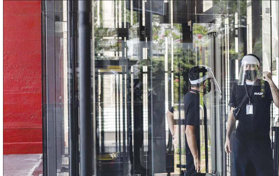
ပြန်လည်ဖွင့်လှစ်လိုက်သည့် ဆော်ပိုလိုအနုပညာပြတိုက်တွင် ဧည့်သည်များအားလက်ခံနိုင်ရန် ပြင်ဆင်နေသည့် ဝန်ထမ်းအချို့ကို တွေ့ရစဉ်။

ဘရာဇီးနိုင်ငံ၏ ကိုဗစ်-၁၉ ကူးစက်ဖြစ်ပွားမှု အခြေအနေသည် ကမ္ဘာပေါ်တွင် တတိယအဆိုးဆုံး ဖြစ် ကာ ရောဂါကြောင့်သေဆုံးသူ အရေ အတွက် ဒုတိယအများဆုံးနေရာတွင် ရှိသည်။ အမေရိကန်ပြည်ထောင်စုမှာ ကိုဗစ်-၁၉ ကူးစက်ဖြစ်ပွားမှု အများ ဆုံးနိုင်ငံအဖြစ် ရပ်တည်လျက်ရှိပြီး အိန္ဒိယနိုင်ငံသည် ကူးစက်မှုဒုတိယ အများဆုံးနိုင်ငံ ဖြစ်သည်။ ဆင်ပွာ