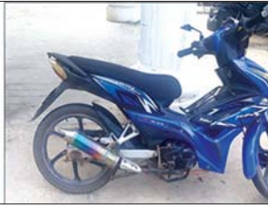
ကြည်ရှိန် အသုံးပြုသည့် ဆိုင်ကယ်