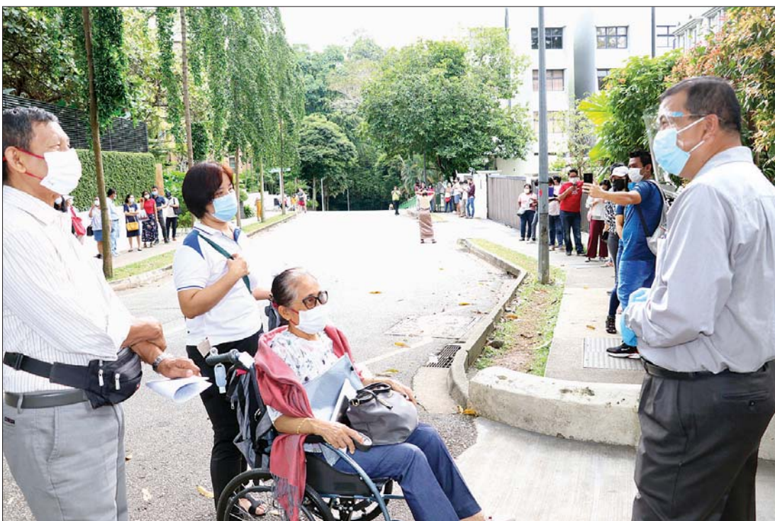
စင်ကာပူမြို့ရှိ မြန်မာသံရုံးတွင် လာရောက် ကြိုတင်ဆန္ဒမဲပေးသည့် မြန်မာနိုင်ငံသားများကို တွေ့ရစဉ်။