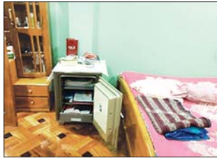
ရွှေထည်ပစ္စည်းခိုးယူသွားသည့် မီးခဲ သေတ္တာ၏ မှတ်တမ်းဓာတ်ပုံ