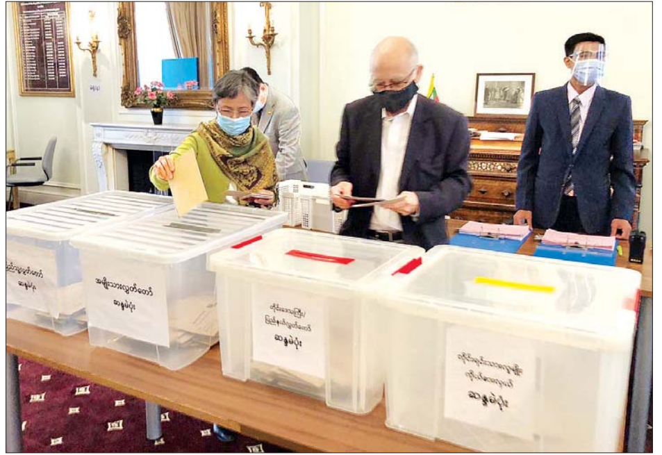
လန်ဒန်မြို့ရှိ မြန်မာသံရုံးတွင် မြန်မာနိုင်ငံသားများ ကြိုတင်ဆန္ဒမဲပေးစဉ်။