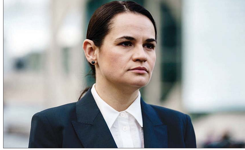
ဘီလာရစ်အတိုက်အခံခေါင်းဆောင် ဆယ်လန်နာ တစ်ဟန်နော့ဖ်စကားရာ။

ဆယ်လန်နာတစ်ဟန်နော့ဖ်စကားရာ က လူမှု ကွန်ရက်မီဒီယာပေါ်မှတစ်ဆင့် ကြေညာချက်ထုတ် ပြန်ခဲ့ခြင်းဖြစ်သည်။ အကြမ်းဖက်နှိမ်နင်းမှုများကို ရပ်နားထားပြီး လူကာရှန်ကို ရာထူးမှနှုတ်ထွက်ပေး ရေး ၎င်းက တိုက်တွန်းထားပြီး ယင်းသို့မလုပ်ဆောင် ပါက အောက်တိုဘာ ၂၆ ရက်မှစတင်ကာ တစ်နိုင်ငံ လုံးအနှံ့သပိတ်မှောက်ခြင်းများ ဖြစ်ပေါ်လာနိုင် သည်ဟု ပြောကြားထားသည်။ ဆယ်လန်နာသည် ပြီးခဲ့သည့် ဩဂုတ်လအတွင်းက လက်ရှိသမ္မတ လူကာရှန်ကိုအားဆန့်ကျင်ကာ သမ္မတ ရွေးကောက် ပွဲဝင်ခဲ့သူလည်း ဖြစ်သည်။ သမ္မတလူကာရှန်ကို ရွေးကောက်ပွဲတွင် အနိုင် ရရှိပြီးနောက် မဲလိမ်လည်မှုပြုလုပ်သည်ဟုဆိုကာ ဆန္ဒပြပွဲများ ပေါ်ပေါက်လာခဲ့သည်။ အတိုက်အခံ ခေါင်းဆောင်သည် ပြင်သစ်၊ ဂျာမနီတို့မှ ထောက်ခံ မှုများကို ရာဇဝေလျက်ရှိပြီး အပြည်ပြည်ဆိုင်ရာမှ