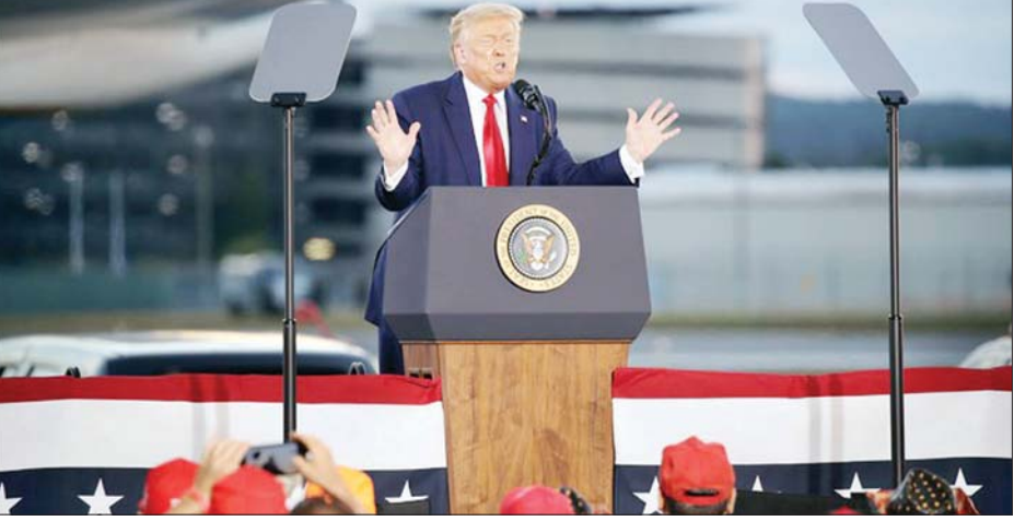
အမေရိကန်သမ္မတဒေါ်နယ်ထရမ် ထောက်ခံသူများကိုမိန့်ခွန်းပြောနေစဉ်။