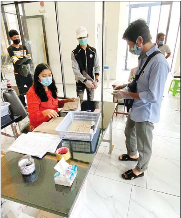
ဗန်ကောက်မြို့ရှိ မြန်မာသံရုံးတွင် မြန်မာနိုင်ငံသားများ ကြိုတင်ဆန္ဒမဲ ပေးစဉ်။