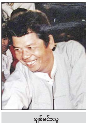
ချစ်မင်းလူ