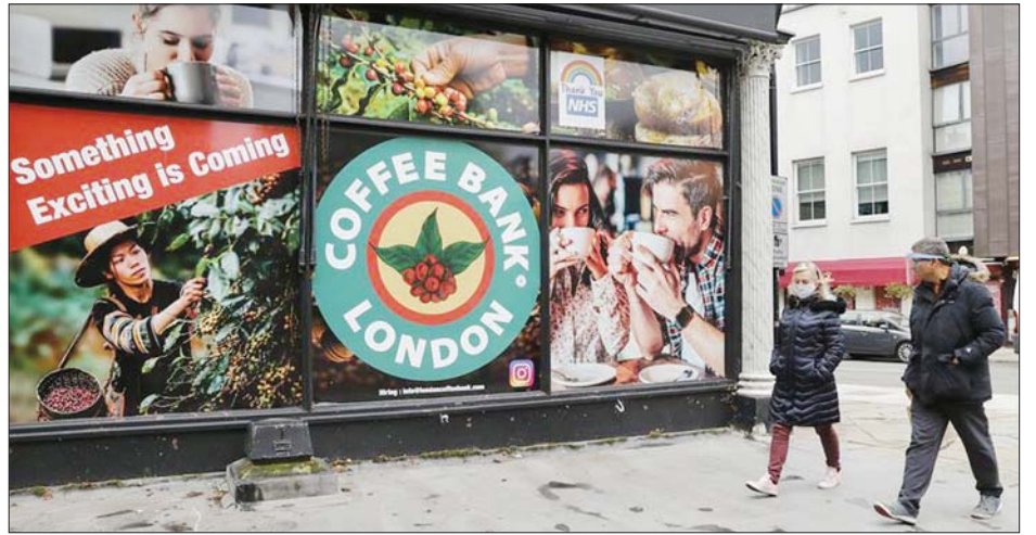
လန်ဒန်ရှိ ကော်ဖီဆိုင်တစ်ဆိုင်ရှေ့တွင် လူများလမ်းဖြတ်လျှောက်နေသည့်ကို အောက်တိုဘာ ၁၃ ရက်ကတွေ့ရစဉ်။