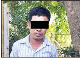
ကြည်ရှိန်

မြန်မာနိုင်ငံရဲတပ်ဖွဲ့၊ မူခင်းရဲတပ်ဖွဲ့နှင့် နေပြည်တော်ရဲတပ်ဖွဲ့ဝင်များက တရားခံဖော် ထုတ်နိုင်ရေး စုံစမ်းထောက်လှမ်းနေချိန် အောက်တိုဘာ ၁၃ ရက် တွင် တရားခံဟုယူဆရသည့် သပြေကုန်းကျေးရွာအတွင်းရှိ ရွှေဆိုင်တစ်ဆိုင်သို့ ရွှေဆွဲကြိုးလာရောက်ပေါင်နံ့ရာ ရွှေဝယ်ဘောက်ချာမပါရှိသဖြင့် ဆိုင်မှ လက်မခံ သောကြောင့် ဆိုင်ကယ်ဖြင့် ပြန်လည်ထွက်ခွာသွားကြောင်း သတင်းရရှိခဲ့ပြီး ရဲတပ်ဖွဲ့ဝင်များက CCTV မှတ်တမ်းများအရ စီးနင်းလာသည့် ဆိုင်ကယ်နံပါတ်နှင့် လူပုံသဏ္ဍာန်အား စိစစ်ရရှိခဲ့ကြောင်း၊ ယနေ့တွင် ယင်းနံပါတ်ပါ ဆိုင်ကယ်၏