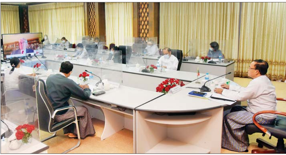
ရေးအဖွဲ့တို့အကြား စေ့စပ်ညှိနှိုင်းနေမှု အပေါ် တိုးတက်မှုများကို ဆွေးနွေးခဲ့ ကြပြီး ကိုဗစ်-၁၉ ရောဂါ ကာကွယ်၊ ထိန်းချုပ်၊ ကုသရေးဆိုင်ရာ ဆောင် ရွက်မှုများနှင့် စပ်လျဉ်း၍ အတွေ့ သိရသည်။ များကိုလည်း ဆွေးနွေးခဲ့ကြကြောင်း သတင်းစဉ်

အမျိုးသမီး၊ ကလေးသူငယ်နှင့် မသန်စွမ်းသူများ၏ အခွင့်အရေး၊ စီးပွားရေးနှင့် လူမှုရေးအခွင့်အရေး များ၊ လွတ်လပ်စွာ ထုတ်ဖော်ပြောကြား ခွင့်၊ အမုန်းတရား လှုံ့ဆော်မှုများ ကာကွယ်တားဆီးရေးတို့ အပါအဝင် အခြေခံအခွင့်အရေးနှင့် လွတ်လပ်ခွင့် ရရှိရေး၊ နိုင်ငံတကာမျက်နှာစာတွင် လူ့အခွင့်အရေးဆိုင်ရာ ပူးပေါင်း ဆောင်ရွက်ရေး စသည့် လူ့အခွင့် အရေးဆိုင်ရာ ကိစ္စရပ်များနှင့် ရွှေ့ပြောင်းသွားလာမှုနှင့် နိုင်ငံရေးခိုလှုံ ခွင့် အပါအဝင် လူ့အခွင့်အရေး ကာကွယ်စောင့်ရှောက်ရာတွင် အီးယူ ၏ အတွေ့အကြုံများကို အမြင်ချင်း ပလှယ် ဆွေးနွေးခဲ့ကြသည်။ ထို့ပြင် မြန်မာနှင့် ဥရောပသမဂ္ဂ ကုန်သွယ်မှု အခွင့်အရေးစစ်စစ်လေ့လာ