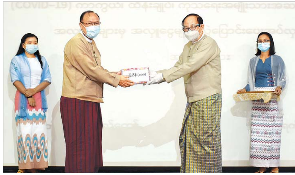
ပြည်ထောင်စုဝန်ကြီး ဦးသန့်စင်မောင် Coronavirus Disease 2019 (COVID-19) ကာကွယ်၊ ထိန်းချုပ်၊ ကုသရေး အမျိုးသားအဆင့် ဗဟိုကော်မတီသို့ အလှူငွေပေးအပ်လှူဒါန်းရာ ပြည်ထောင်စုဝန်ကြီး ဒေါက်တာမြင့်ထွေး လက်ခံ ရယူစဉ်။

ကို အမြဲဆန်းစစ်သုံးသပ်ကာလုပ်ငန်း နည်းဗျူဟာများကို မွမ်းမံပြောင်းလဲ ဆောင်ရွက်လျက်ရှိကြောင်း၊ မိမိတို့နိုင်ငံ၌ ကိုဗစ်-၁၉ ကူးစက်မှု ဒုတိယလှိုင်းနောက်တွင်လည်း ထိရောက်သော ကာကွယ်ဆေး ထွက်ပေါ်လာသည့် အချိန်မတိုင်မီ ကာလအထိ ကူးစက်မှုလှိုင်းငယ်များ ရှိနိုင်သဖြင့် ရောဂါကာကွယ်ရေး စည်းကမ်းများကို အထူးအလေးထား လိုက်နာကြရန် အရေးကြီးပါကြောင်း၊ မြန်မာနိုင်ငံတွင် ကိုဗစ်-၁၉ သေဆုံး လူနာများ၏ ၉၅ ရာခိုင်နှုန်းသည် သွေးတိုးရောဂါ၊ ဆီးချိုရောဂါ၊ နှလုံးနှင့် သွေးကြောရောဂါ၊ ကျောက်ကပ် ရောဂါ၊ ကင်ဆာရောဂါ စသည့် နာတာရှည်ရောဂါရှိသူများ ဖြစ်ပါကြောင်း၊ ပြည်သူများအနေဖြင့် နေအိမ်တွင် နေထိုင်ချိန်တွင်လည်း အကြောင်းအမျိုးမျိုးကြောင့် အပြင်ထွက်ရသည့် တစ်အိမ်တည်းနေသူများထံမှ ရောဂါ ကူးစက်နိုင်ပါကြောင်း။ သို့ဖြစ်၍ နာတာရှည်ရောဂါရှိသူ များနှင့် သက်ကြီးရွယ်အိုများအနေ ဖြင့် တစ်အိမ်တည်း နေထိုင်သူများ နှင့် ခပ်ခာခာနေထိုင်ခြင်း၊ သီးခြား