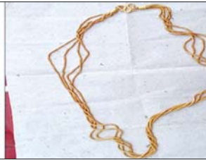
ဖမ်းဆီးစဉ် သိမ်းဆည်းရမိသည့် သက်သေခံရွှေဆွဲကြိုး