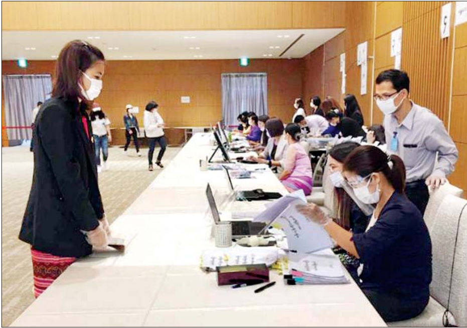
တိုကျိုမြို့ရှိ မြန်မာသံရုံးတွင် မြန်မာနိုင်ငံသားများ ကြိုတင်ဆန္ဒမဲပေးစဉ်။

သို့ပါ၍ ယနေ့ မြန်မာသံရုံး (၃) ရုံး၌ ကြိုတင်ဆန္ဒမဲများ လာရောက်ပေးခဲ့ ကြသူ မဲဆန္ဒရှင် စုစုပေါင်း ၁၈၂၄ ဦးနှင့် ယမန်နေ့တွင် ဒေသဆိုင်ရာ စံတော်ချိန် နှင့်အညီ ကြိုတင်ဆန္ဒမဲ လာရောက်ပေးခဲ့ကြသူ မဲဆန္ဒရှင် ၈၅ ဦးရှိသဖြင့် မဲဆန္ဒရှင် စုစုပေါင်း ၁၉၀၉ ဦး ဆန္ဒမဲပေးခဲ့ကြကြောင်း သိရသည်။ သတင်းစဉ်