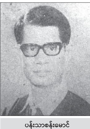
ပန်းသာစန်းမောင်