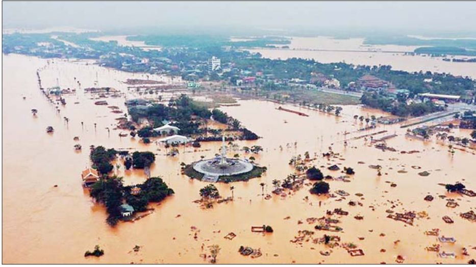
ဗီယက်နမ်အလယ်ပိုင်း သန့်ချီဒေသ၌ ရေကြီးနစ်မြုပ်နေသည့်ကို အောက်တိုဘာ ၁၃ ရက်က ဝေဟင်မှ တွေ့ရစဉ်။

ဟန့်ရှင်း အောက်တိုဘာ ၁၄ ဗီယက်နမ်နိုင်ငံ အလယ်ပိုင်းဒေသနှင့် အလယ်ပိုင်း ကုန်းမြင့်ဒေသ (Central Highlands) တွင် လွန်ခဲ့သော ရက်အနည်းငယ်ကတည်းကတော့အစွာရယ်များနှင့် အတူ မိုးသည်းထန်စွာရွာသွန်းခြင်း၊ ရေအဆက်မပြတ်ကြီးခြင်းတို့ကြောင့် လူ ၂၈ ဦးသေဆုံးခဲ့ပြီး ၁၂ ဦး ပျောက်ဆုံးခဲ့ကြောင်း သဘာဝဘေးအန္တရာယ်ကာကွယ်ထိန်းချုပ်ရေးဆိုင်ရာ ဗဟိုကော်မတီက အောက်တိုဘာ ၁၃ ရက်တွင် ပြောကြားလိုက်သည်။