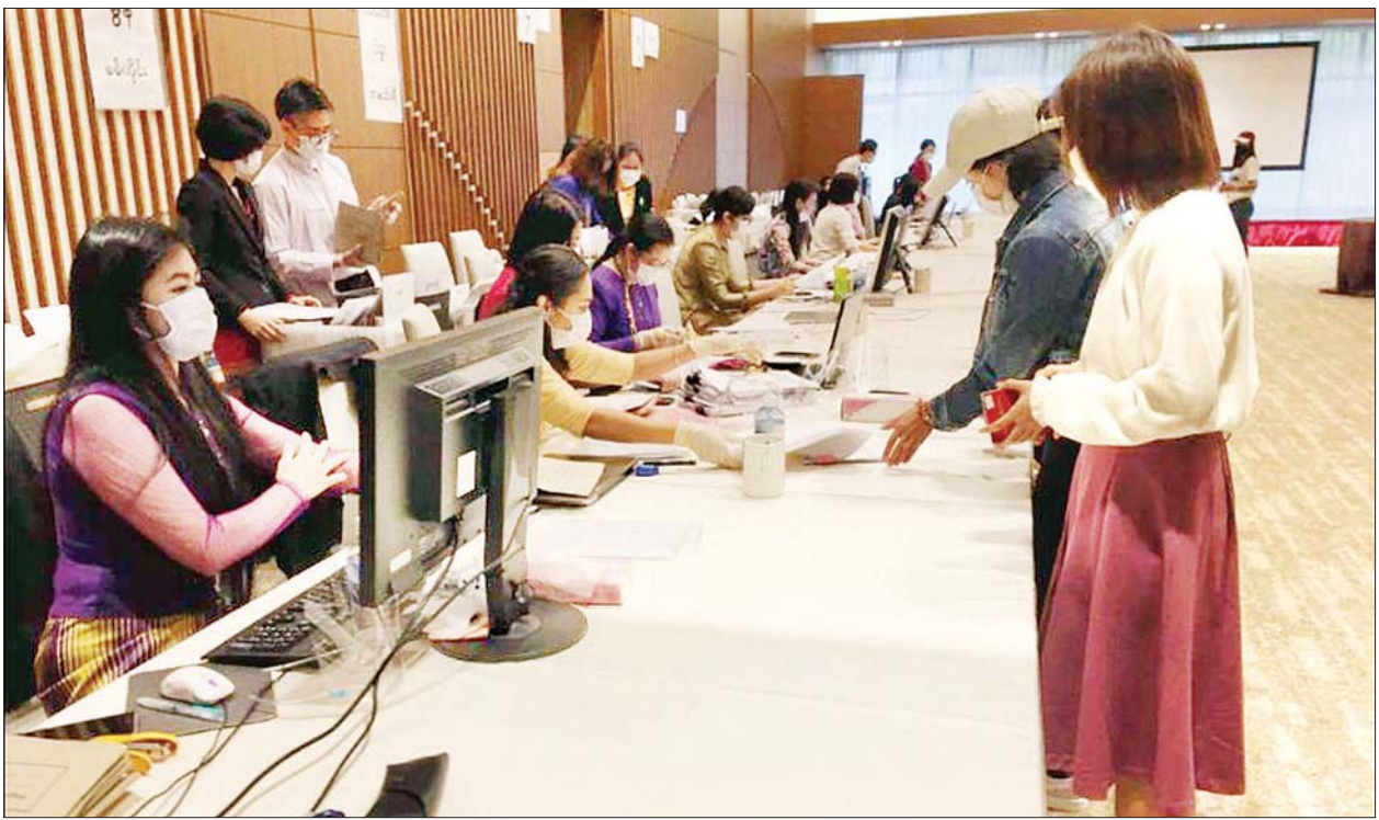
တိုကျိုမြို့ရှိ မြန်မာသံရုံးတွင် မြန်မာနိုင်ငံသားများ ကြိုတင်ဆန္ဒမဲ ပေးစဉ်။

နေပြည်တော် အောက်တိုဘာ ၁၄ ၂၀၂၀ ပြည့်နှစ် အထွေထွေ ရွေးကောက်ပွဲအတွက် ယနေ့တွင် ကြိုတင်ဆန္ဒမဲများ ဆက်လက်ပေးကြ ရာ မြန်မာသံရုံး၊ ပန်ကောက်မြို့၊ မဲဆန္ဒရှင် ၅၂၄ ဦး၊ မြန်မာသံရုံး တိုကျိုမြို့၊ မဲဆန္ဒရှင် ၅၇ ဦးနှင့် မြန်မာသံရုံး၊ စင်ကာပူမြို့၊ မဲဆန္ဒရှင် ၁၂၄၃ ဦးတို့ ကြိုတင်ဆန္ဒမဲများ ဆက်လက်ပေးခဲ့ကြောင်း သိရသည်။ ယမန်နေ့တွင် ဒေသဆိုင်ရာ စံတော်ချိန်နှင့်အညီ ကြိုတင်ဆန္ဒမဲ ပေးခဲ့ကြသည့် မြန်မာသံရုံး၊ လန်ဒန်မြို့ မှ သတင်းပေးပို့ချက်အရ မဲဆန္ဒရှင် ၈၅ ဦး ဆန္ဒမဲများပေးခဲ့ကြောင်း သိရသည်။