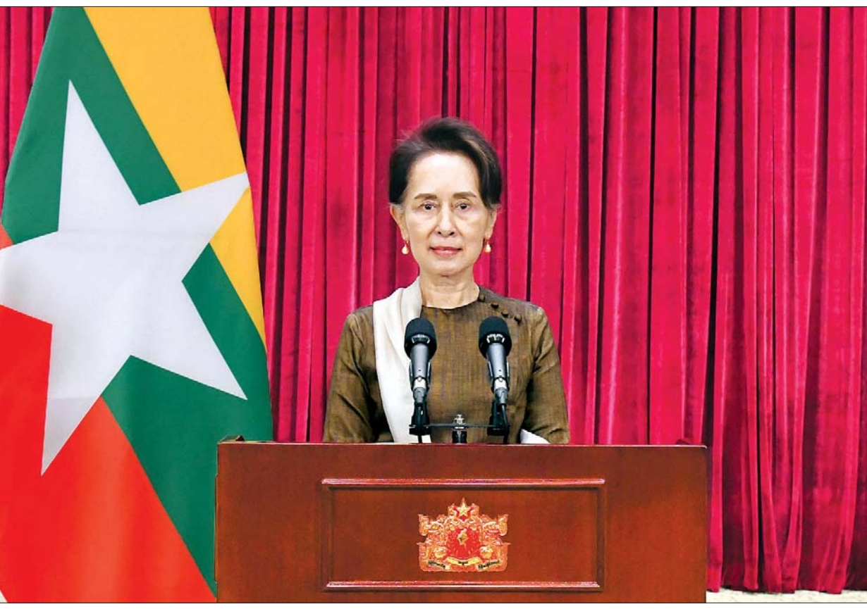
Coronavirus Disease 2019 (COVID-19) ကာကွယ်၊ ထိန်းချုပ်၊ ကုသရေး အမျိုးသားအဆင့် ဗဟိုကော်မတီဥက္ကဋ္ဌ၊ နိုင်ငံတော်၏အတိုင်ပင်ခံပုဂ္ဂိုလ် ဒေါ်အောင်ဆန်းစုကြည် ကိုဗစ် - ၁၉ ရောဂါဖြစ်ပွားမှု နောက်ဆုံးအခြေအနေနှင့်စပ်လျဉ်း၍ ပြည်သူများသို့ အစီရင်ခံတင်ပြသည့်မိန့်ခွန်း ပြောကြားစဉ်။ သတင်းစဉ်

“ဒီအချိန်မှာဆိုရင် ကျွန်မတို့ နိုင်ငံက အားလုံးစုပေါင်းပြီး၊ အင်အားတွေကို စုပြီး၊ ကိုဗစ်ကိုလည်း ကျော်လွှားရမယ်။ ရွေးကောက်ပွဲကိုလည်း အောင်အောင် မြင်မြင်ဖြစ်အောင် ကျင်းပနိုင်ရမယ်။ ဒီနှစ်ခုကို အမြဲတွဲပြီးစဉ်းစားပါတယ်။ ဘယ်လိုစဉ်းစားလဲဆိုတော့ အထွေထွေရွေးကောက်ပွဲကျင်းပတဲ့အချိန်မှာ ပြည်သူ ပြည်သားများဟာ ကျန်းမာရေးအရ လုံလုံခြုံခြုံနဲ့ ရွေးကောက်ပွဲမှာ သွားပြီး မဲပေးနိုင်ဖို့ကို ကျွန်မတို့စဉ်းစားပါတယ်”