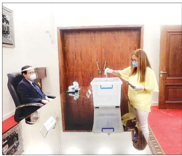
မြန်မာနိုင်ငံသားတစ်ဦး ကိုင်းရိုမြို့ရှိ မြန်မာသံရုံးတွင် ကြိုတင်ဆန္ဒမဲပေး စဉ်။