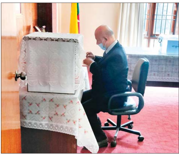
နီပေါနိုင်ငံတွင် ရောက်ရှိနေသော မြန်မာနိုင်ငံသားတစ်ဦး ခတ္တမန္နာမြို့ရှိ မြန်မာသံရုံးတွင် ကြိုတင်ဆန္ဒမဲပေးစဉ်။