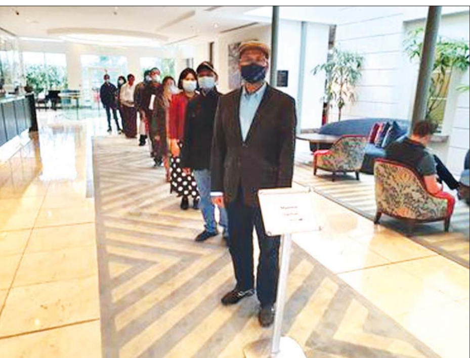
အိုင်ယာလန်နိုင်ငံတွင် ရောက်ရှိနေသော မြန်မာနိုင်ငံသားများ လန်ဒန်မြို့ရှိ မြန်မာသံရုံးတွင် ကြိုတင်ဆန္ဒမဲပေးရန် စောင့်ဆိုင်းနေကြစဉ်။

သို့ပါ၍ ယနေ့တွင် မြန်မာသံရုံး ခုနစ်ရုံး၌ ကြိုတင်ဆန္ဒမဲပေးခဲ့ကြ ကြောင်းနှင့် ဘင်္ဂလားဒေ့ရှ်နိုင်ငံ၊ ဘရူနိုနိုင်ငံ၊ အိုင်ယာလန်နိုင်ငံ၊ ဒိန်းမတ်နိုင်ငံ၊ ဆွီဒင်နိုင်ငံနှင့် အက်စတိုး ဝီနီနိုင်ငံတို့တွင် ရောက်ရှိနေသော မြန်မာနိုင်ငံသားများ ကြိုတင်ဆန္ဒမဲ ပေးမှုများ ပြီးဆုံးခဲ့ကြောင်း သိရသည်။