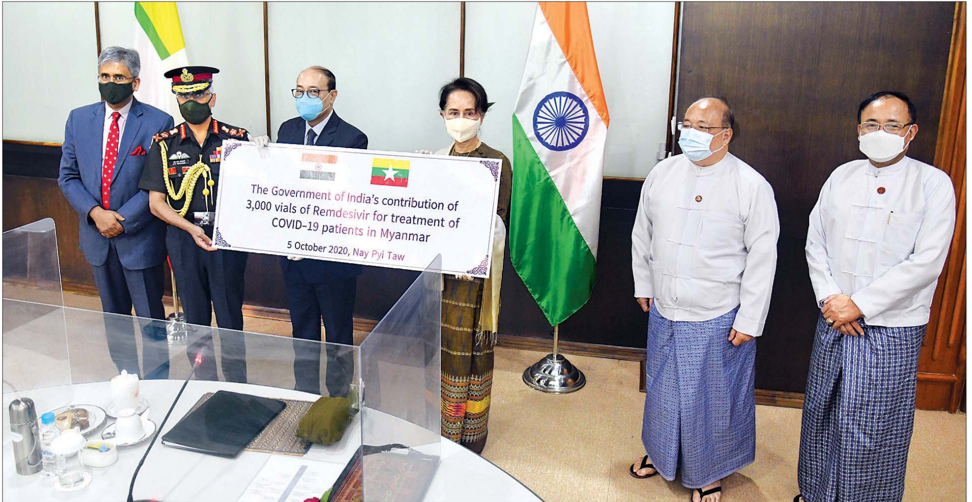
နိုင်ငံတော်၏အတိုင်ပင်ခံပုဂ္ဂိုလ် ဒေါ်အောင်ဆန်းစုကြည် အိန္ဒိယအစိုးရက မြန်မာအစိုးရထံသို့ လှူဒါန်းသည့် COVID-19 ကူးစက်ရောဂါ ကုသရေးတွင် အသုံးပြုမည့် Remdesivir ထိုးဆေး (၃,၀၀၀)ကို အိန္ဒိယ နိုင်ငံခြားရေးအတွင်းဝန်ထံမှ လွှဲပြောင်းလက်ခံစဉ်။

* ရှေ့ပိုင်းမှ ထို့ပြင် အိန္ဒိယနိုင်ငံမှ စမ်းသပ်ထုတ်လုပ်နေသည့် ကိုဗစ်-၁၉ ကာကွယ်ဆေး အောင်မြင်ပါက မြန်မာနိုင်ငံအပါအဝင် မိတ်ဖက်နိုင်ငံများနှင့် ပူးပေါင်းထုတ်လုပ်သွားနိုင်ရေး၊ စစ်တွေဆိပ်ကမ်းအား ၂၀၂၁ ခုနှစ် အစောပိုင်းကာလတွင် လည်ပတ်သွားနိုင်ရေး၊ ရခိုင်ပြည်နယ်တွင် လူငယ်များ အတွက် အသက်မွေးဝမ်းကျောင်း သင်တန်းများဖွင့်လှစ်