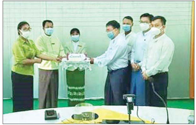
ဦးမိုးထက်က လက်ခံယူပြီး အလှူရှင် ပေးအပ်လိုက်ကြောင်း သိရသည်။ များသို့ ဂုဏ်ပြုမှတ်တမ်းလွှာ ပြန်လည်

တောင်ငူ အောက်တိုဘာ ၅ ကမ္ဘာ့ဆရာများနေ့ အထိမ်းအမှတ် အဖြစ် အောက်တိုဘာ ၅ ရက်က နည်းပညာတက္ကသိုလ် (တောင်ငူ)မှ ပါမောက္ခချုပ် ဒေါက်တာမောင်မောင် လတ်၊ ဆရာ ဆရာမများနှင့် ဝန်ထမ်းများက တောင်ငူတက္ကသိုလ် ယာယီဆေးရုံပြင်ဆင်ရန်နှင့် အထွေထွေ အသုံးပြုရန်အတွက် အလှူငွေကျပ် ၁၆ သိန်းကို တောင်ငူခရိုင် အုပ်ချုပ်ရေးမှူးရုံး ၁၇ ရပ်ကွက်ခရိုင် အုပ်ချုပ်ရေးနှင့် အရေးပေါ်တုံ့ပြန်ရေးကော်မတီဥက္ကဋ္ဌ တောင်ငူခရိုင် အုပ်ချုပ်ရေးမှူး