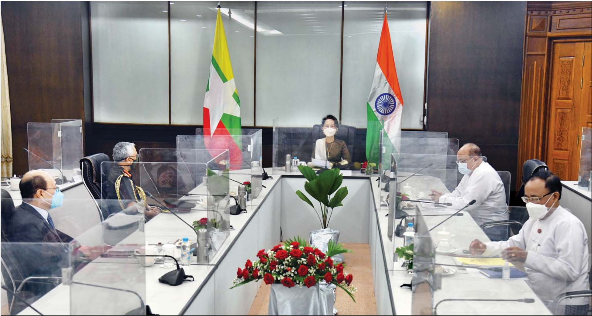
နိုင်ငံတော်၏အတိုင်ပင်ခံပုဂ္ဂိုလ် ဒေါ်အောင်ဆန်းစုကြည် အိန္ဒိယနိုင်ငံ၊ ပြည်ပရေးရာဝန်ကြီးဌာန၊ နိုင်ငံခြားရေးအတွင်းဝန် Mr. Harsh Vardhan Shringla ဦးဆောင်သော အိန္ဒိယကိုယ်စားလှယ်အဖွဲ့အား လက်ခံတွေ့ဆုံစဉ်။ သတင်းစဉ်

နေပြည်တော် အောက်တိုဘာ ၅ နိုင်ငံတော်၏အတိုင်ပင်ခံပုဂ္ဂိုလ်၊ နိုင်ငံခြားရေးဝန်ကြီးဌာန ပြည်ထောင်စုဝန်ကြီး ဒေါ်အောင်ဆန်းစုကြည်သည် အိန္ဒိယနိုင်ငံ၊ ပြည်ပရေးရာဝန်ကြီးဌာန၊ နိုင်ငံခြားရေးအတွင်းဝန် Mr. Harsh Vardhan Shringla ဦးဆောင်သော အိန္ဒိယ ကိုယ်စားလှယ်အဖွဲ့အား ယနေ့နံနက် ၉ နာရီခွဲတွင် နိုင်ငံခြားရေးဝန်ကြီးဌာနတွင် လက်ခံတွေ့ဆုံသည်။ အဆိုပါ ဂါရဝပြုတွေ့ဆုံပွဲသို့ ရင်းနှီးမြှုပ်နှံမှုနှင့် နိုင်ငံခြားစီးပွားဆက်သွယ် ရေးဝန်ကြီးဌာန ပြည်ထောင်စုဝန်ကြီး ဦးသောင်းထွန်း၊ အပြည်ပြည်ဆိုင်ရာ ပူးပေါင်းဆောင်ရွက်ရေးဝန်ကြီးဌာန ပြည်ထောင်စုဝန်ကြီး ဦးကျော်တင်နှင့် နိုင်ငံခြားရေးဝန်ကြီးဌာနမှ တာဝန်ရှိပုဂ္ဂိုလ်များ တက်ရောက်ခဲ့ကြပြီး အိန္ဒိယ နိုင်ငံခြားရေးအတွင်းဝန်နှင့်အတူ အိန္ဒိယနိုင်ငံ ကြည်းတပ်ဦးစီးချုပ် (Chief of Army Staff) General Manoj Mukund Naravane၊ မြန်မာနိုင်ငံဆိုင်ရာအိန္ဒိယ နိုင်ငံ သံအမတ်ကြီး Mr. Saurabh Kumar နှင့် အိန္ဒိယနိုင်ငံမှ တာဝန်ရှိပုဂ္ဂိုလ် များ တက်ရောက်ကြသည်။ ထိုသို့တွေ့ဆုံစဉ် နှစ်နိုင်ငံချစ်ကြည်ရေးနှင့် ဆက်ဆံရေးပိုမိုတိုးမြှင့်ရေး ကိစ္စရပ်များ၊ ကုန်သွယ်ရေးနှင့် ရင်းနှီးမြှုပ်နှံမှု၊ ပေါင်းစည်းဆက်သွယ်ရေး၊ ပို့ဆောင်ရေး၊ စွမ်းအင်၊ ဖွံ့ဖြိုးတိုးတက်ရေးဆိုင်ရာ စီမံကိန်းများ၊ စွမ်းဆောင်ရည် မြှင့်တင်ရေးနှင့် ပြည်သူ့အချင်းချင်း ထိတွေ့ဆက်ဆံမှု နယ်ပယ်များ အပါအဝင် မြန်မာနိုင်ငံနှင့် အိန္ဒိယနိုင်ငံတို့အကြား ပိုမိုနီးကပ်စွာ ပူးပေါင်းဆောင်ရွက်ရေး ကိစ္စရပ်များနှင့် အခြားအကျိုးတူကိစ္စရပ်များနှင့်စပ်လျဉ်း၍ ရင်းနှီးပွင့်လင်းစွာ အမြင်ချင်းဖလှယ်ဆွေးနွေးခဲ့ကြသည်။ စာမျက်နှာ ၃ ကော်လံ ၁ *