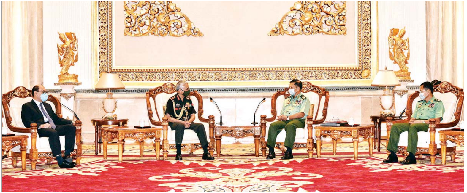
တပ်မတော်ကာကွယ်ရေးဦးစီးချုပ် ဗိုလ်ချုပ်မှူးကြီး မင်းအောင်လှိုင် အိန္ဒိယကြည်းတပ်ဦးစီးချုပ် General MM Naravane အား လက်ခံတွေ့ဆုံစဉ်။

အဆိုပါတွေ့ဆုံပွဲသို့ တပ်မတော် ကာကွယ်ရေးဦးစီးချုပ် ဗိုလ်ချုပ်မှူးကြီး မင်းအောင်လှိုင်နှင့်အတူ ဒုတိယတပ်မတော် ကာကွယ်ရေးဦးစီးချုပ် ကာကွယ်ရေးဦးစီးချုပ်ကြည်း(ကြည်း) ဒုတိယဗိုလ်ချုပ်မှူးကြီး စိုးဝင်း၊ ကာကွယ်ရေးဦးစီးချုပ်ရုံး (ကြည်း) မှ တပ်မတော် အရာရှိကြီးများနှင့် နယ်စပ်ရေးရာ ဝန်ကြီးဌာန ဒုတိယဝန်ကြီး ဗိုလ်ချုပ် ဖုန်းမြတ်တို့ တက်ရောက်ကြပြီး အိန္ဒိယကြည်းတပ်ဦးစီးချုပ် General MM Naravane နှင့်အတူ မြန်မာနိုင်ငံ ဆိုင်ရာ အိန္ဒိယနိုင်ငံ သံအမတ်ကြီး စာမျက်နှာ ၆ ကော်လံ ၁