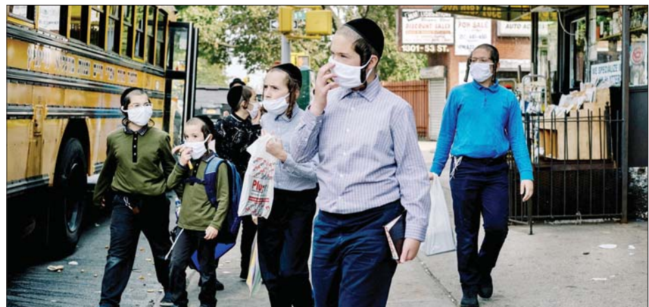
အမေရိကန်ပြည်ထောင်စု နယူးယောက်စီးတီး၌ နှာခေါင်းစည်းတပ်ဆင်ထားသူအချို့ကို တွေ့ရစဉ်။