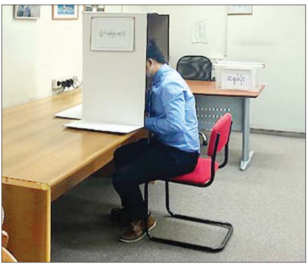
အစွဲရေးနိုင်ငံတွင် ရောက်ရှိနေသော မြန်မာနိုင်ငံသားတစ်ဦး တဲလ်အမီးမြို့ရှိ မြန်မာသံရုံးတွင် ကြိုတင်ဆန္ဒမဲပေးစဉ်။