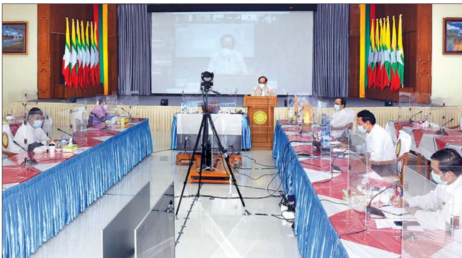
ပြည်ထောင်စုဝန်ကြီး ဒေါက်တာမြင့်ထွေး တိုင်းဒေသကြီး/ ပြည်နယ် (၆) ခုရှိ ကိုဗစ်-၁၉ ကာကွယ်ထိန်းချုပ်ရေး လုပ်ငန်းများအား လက်တွေ့မြေပြင်တွင်ဆောင်ရွက်နေသည့် မြို့နယ်ဆရာဝန်ကြီးများနှင့် တွေ့ဆုံဆွေးနွေးစဉ်။

ကိုဗစ်-၁၉ ကာကွယ်ထိန်းချုပ်မှု လုပ်ငန်းဗျူဟာနှင့်