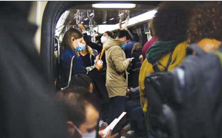
ပါရီမြို့မြေအောက်ရထား စီးနင်းသူများကို စက်တင်ဘာ ၂၈ ရက်က တွေ့ရစဉ်။

ပါရီမြို့ကစီးပွားရေးလုပ်ငန်းရှင်အများစုကတော့ ကာလရှည်ကြာလုပ်ငန်းတွေ ပိတ်လိုက်ရမှုကြောင့် ထိခိုက်မှုတွေရှိလာမှာကို စိုးရိမ်နေကြပြီး အဲဒီအတွက် ကြောင့်လည်း ပိတ်ဆို့ကန့်သတ်မှုတွေကို ဆန့်ကျင်ခဲ့ကြ တာပါ။ ပါရီမြို့မှာ အရင်ကတည်းက ကန့်သတ်မှုတွေကို တိုးမြှင့် လုပ်ဆောင်ပြီးသားပါ။ လူ ၁၀ ဦးထက်ပိုပြီး စုဝေးခွင့် မရှိသလို ၂၂၀ နာရီနောက်ပိုင်း ဘားတွေပိတ်ဖို့ အမိန့်ထုတ်ထားပါတယ်။ တကယ်လို့ လုပ်ငန်းရှင်တွေဘက်