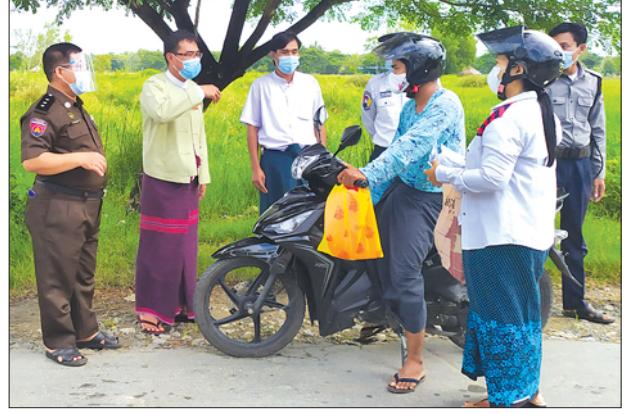
မြို့တွင်းသွားလာသည့် ပြည်သူများအား စစ်ဆေးမှုများ ပြုလုပ်နေစဉ်။

ဖျာပုံ အောက်တိုဘာ ၃ ဖျာပုံမြို့နယ်အတွင်းရှိ ပြည်သူများအား Stay at Home အစီအစဉ်ဖြင့် နေအိမ် ဌာန နေထိုင်ရန် ညွှန်ကြားထားပြီးဖြစ်ရာ ညွှန်ကြားချက်များကို လိုက်နာနေထိုင် စေရေးအတွက် ဖျာပုံမြို့နယ် ကိုဗစ်-၁၉ ရောဂါ ကာကွယ်ထိန်းချုပ်ရေးကော်မတီ ဥက္ကဋ္ဌနှင့် အဖွဲ့ဝင်များက မြို့တွင်း ရွေ့လျားစစ်ဆေးရေးအဖွဲ့များဖွဲ့၍ အောက်တို ဘာ ၂ ရက်တွင် လိုက်လံစစ်ဆေး အရေးယူမှုများ ဆောင်ရွက်နေပြီဖြစ်ကြောင်း သိရသည်။ မြို့နေပြည်သူများအတွက် ဈေးဝယ်ခွင့်၊ လုပ်ငန်းတာဝန်ဖြင့် အပြင်ထွက် သွားလာခွင့် ကတ်ပြားများကို သက်ဆိုင်ရာ ရပ်ကွက်အုပ်ချုပ်ရေးအဖွဲ့များက ထုတ်ပေးထားပြီးဖြစ်ရာ ပြည်သူများအနေဖြင့် အပြင်သို့ထွက်တိုင်း တစ်ဦးလျှင် ခွင့်ပြုကတ်တစ်ကတ် ပါရှိရမည်ဖြစ်ပြီး ကတ်ပါရှိသူများကိုသာ သွားလာခွင့်ပြု၍ ကတ်မပါရှိသူများအား သွားလာခွင့်မပြုကြောင်း၊ ထို့အပြင် ဖျာပုံမြို့နယ်အတွင်းရှိ ကျေးလက်ဒေသများမှ ပြည်သူများအနေဖြင့် ဖျာပုံမြို့ပေါ်သို့ လာရောက်မည် ဆိုလျှင်လည်း ခရီးသွားရန်အတွက် ခွင့်ပြုကတ်ပြားအပြင် ကျေးရွာအုပ်ချုပ်ရေးမှူး ထောက်ခံစာကိုပါ မူးတွဲတင်ပြမှသာ ခရီးသွားလာခွင့်ပေးမည်ဖြစ်ကြောင်း သိရ သည်။ ကိုဗစ်-၁၉ ရောဂါ ကာကွယ်ရေးအတွက် ဖျာပုံမြို့နယ်အတွင်းရှိ ပြည်သူများ အနေဖြင့် မလိုအပ်ဘဲ နေအိမ်ပြင်ပသို့ ထွက်ခွာမှုများမရှိစေရန်အတွက် ယခုလို ကန့်သတ်စစ်ဆေးမှုများကို သက်ဆိုင်ရာ တာဝန်ရှိသူများက အမှတ်(၁)နှင့် (၂) စစ်ဆေးရေးဂိတ်များအပြင် မြောက်ပိုင်းဈေးရေနှင့် (၁၈)ရပ်ကွက် အောက်ပိုင်း ကားဂိတ်များတွင် ဆောင်ရွက်နေခြင်းဖြစ်သည်။ ချမ်းသာ