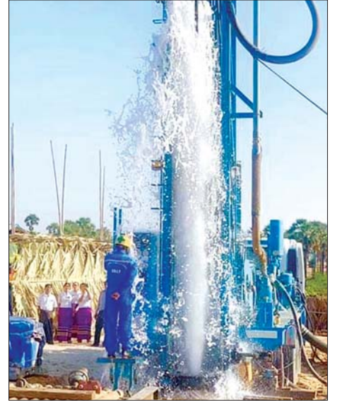
ရည်မှန်းချက်အား ပြည့်မီနိုင်ရေးအတွက် သက်ဆိုင်သူများ ဌာနဆိုင်ရာများနှင့် အတူလက်တွဲ၍ ကြိုးပမ်းဆောင်ရွက်လျက်ရှိကြောင်း၊ လုပ်ငန်းအကောင်အထည်ဖော်ဆောင်ရွက်မှုများကို နှစ်စဉ်ဆောင်ရွက်သကဲ့သို့ တစ်ဖက်မှလည်း ဆောင်ရွက်ပြီးဖြစ်သော ရေအရင်းအမြစ်များ ခန်းခြောက်မှု မရှိစေရေးအတွက် သဘာဝပတ်ဝန်းကျင် ထိန်းသိမ်းရေးနှင့် ရာသီဥတုပြောင်းလဲမှုနှင့် လိုက်လျောညီထွေရှိသည့် ရေပေးရေးစနစ်များကို ဆောင်ရွက်နိုင်ရန် ကြိုးပမ်း ဆောင်ရွက်လျက်ရှိကြောင်း ကျေးလက်ဒေသဖွံ့ဖြိုးတိုးတက်ရေးဦးစီးဌာနမှ သိရသည်။

ရည်မှန်းချက်အား ပြည့်မီနိုင်ရေးအတွက် သက်ဆိုင်သူများ ဌာနဆိုင်ရာများနှင့် အတူလက်တွဲ၍ ကြိုးပမ်းဆောင်ရွက်လျက်ရှိကြောင်း၊ လုပ်ငန်းအကောင်အထည်ဖော်ဆောင်ရွက်မှုများကို နှစ်စဉ်ဆောင်ရွက်သကဲ့သို့ တစ်ဖက်မှလည်း ဆောင်ရွက်ပြီးဖြစ်သော ရေအရင်းအမြစ်များ ခန်းခြောက်မှု မရှိစေရေးအတွက် သဘာဝပတ်ဝန်းကျင် ထိန်းသိမ်းရေးနှင့် ရာသီဥတုပြောင်းလဲမှုနှင့် လိုက်လျောညီထွေရှိသည့် ရေပေးရေးစနစ်များကို ဆောင်ရွက်နိုင်ရန် ကြိုးပမ်း ဆောင်ရွက်လျက်ရှိကြောင်း ကျေးလက်ဒေသဖွံ့ဖြိုးတိုးတက်ရေးဦးစီးဌာနမှ သိရသည်။ ညီညီသန်း(နေပြည်တော်)