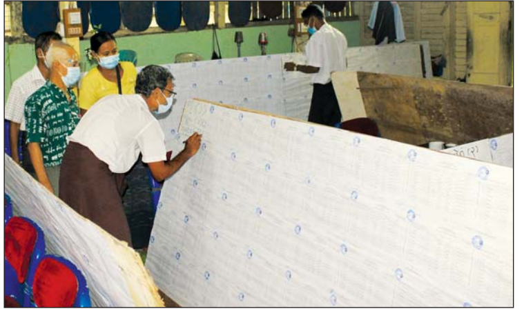
မဲဆန္ဒရှင်စာရင်းတွင် မိမိအမည်ပါ/မပါ လာရောက်စစ်ဆေးနေသည့် ဒလမြို့ခံပြည်သူများ

ဒလမြို့နယ်၌ အထွေထွေရွေးကောက်ပွဲအောင်မြင်စွာကျင်းပနိုင်ရေးအတွက် မဲရုံလုံခြုံရေးတာဝန်ထမ်းဆောင်ရန် အထူးရဲတပ်ဖွဲ့ ၁၈၂ ဦးကိုလည်း ခန့်အပ်ထားပြီး အဆိုပါ အထူးရဲများအား သင်တန်းကို အောက်တိုဘာ ၁ ရက်မှစ၍ တစ်လတိတိ ဖွင့်လှစ်ပို့ချလျက်ရှိကြောင်းနှင့် သင်တန်းတွင် ရွေးကောက်ပွဲဥပဒေ၊ ရဲတပ်ဖွဲ့ကမ်းထိန်းသိမ်းရေး ဥပဒေ