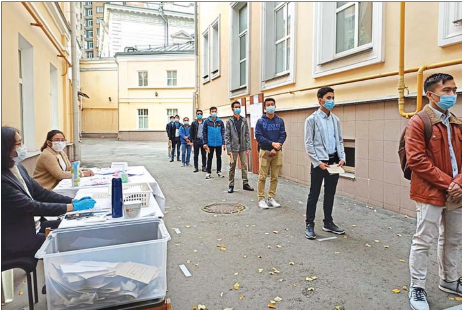
ရုရှားနိုင်ငံ မော်စကိုမြို့ မြန်မာသံရုံးတွင် မြန်မာနိုင်ငံသားများ ကြိုတင်ဆန္ဒမဲပေးရန် စောင့်ဆိုင်းနေကြစဉ်။