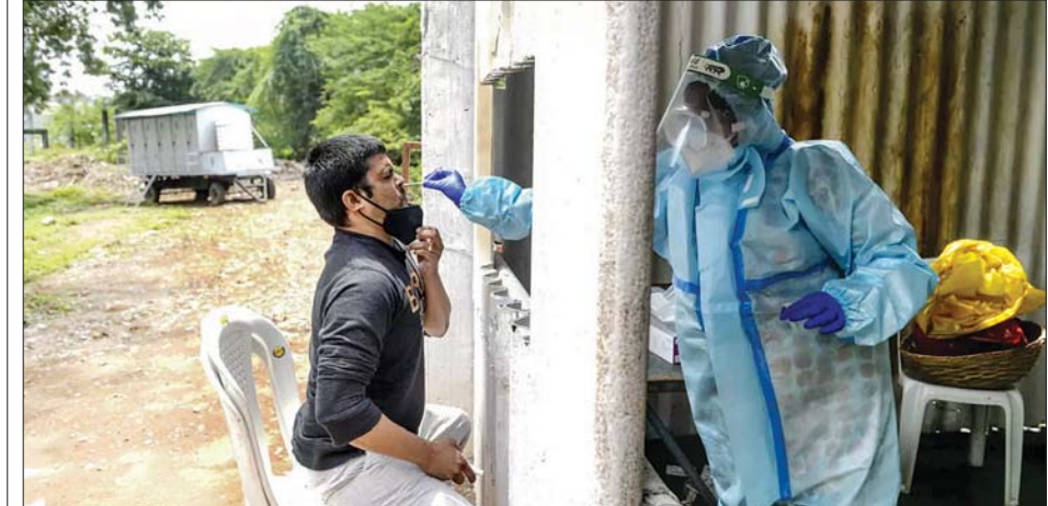
အိန္ဒိယနိုင်ငံတွင် ကိုဗစ်-၁၉ စစ်ဆေးရန် နှာခေါင်းတို့ဖတ်နမူနာ ရယူနေစဉ်။

နှစ်ဆများလာနိုင်သည်။ ထို့အပြင် အိန္ဒိယနိုင်ငံ၏ ကိုဗစ်-၁၉ ကူးစက် ခံရ သည့် တရားဝင်စာရင်းဇယားထုတ်ပြန် မှုများအပေါ်လည်း သံသယဖြစ်လျက် ရှိသည်။ အိန္ဒိယနိုင်ငံ၏ ကိုဗစ်- ၁၉ ကြောင့် သေဆုံးသည့်နှုန်းကို ယုံကြည် စိတ်ချရမလားဆိုသည်ကို မသိရကြောင်း အိန္ဒိယနိုင်ငံတွင် ပြည်သူ့ကျန်းမာရေး စောင့်ကြည့်စနစ် မရှိကြောင်းရောဂါ ပိုးမွှားဗေဒပညာရှင် တီဂျက်ကော့ဘ် ဂျွန်က ပြောကြားလိုက်သည်။