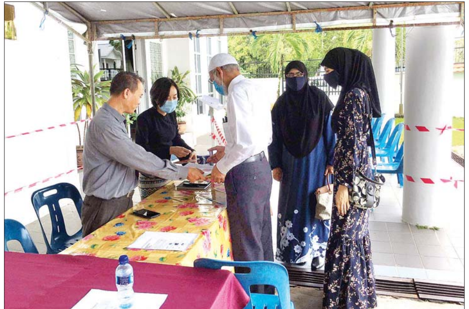
ဘရူနိုင်းနိုင်ငံ ဘန်ဒါဆရီဘီဂါဝန်မြို့ မြန်မာသံရုံးတွင် မြန်မာနိုင်ငံသားများ ကြိုတင်ဆန္ဒမဲပေးနေကြစဉ်။