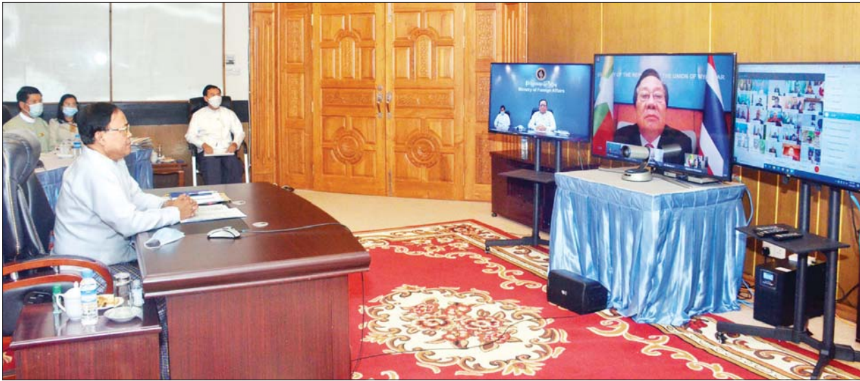
ပြည်ထောင်စုဝန်ကြီး ဦးကျော်တင် မြန်မာသံရုံးအကြီးအကဲများအကြား နိုင်ငံပြင်ပရောက်ရှိနေသည့် မြန်မာနိုင်ငံသားများ ကြိုတင်ဆန္ဒမဲပေးရေးကိစ္စနှင့် ပတ်သက်၍ Video Conferencing စနစ်ဖြင့် ဒုတိယအကြိမ် တွေ့ဆုံညှိနှိုင်းစဉ်။

နေပြည်တော် အောက်တိုဘာ ၃ အပြည်ပြည်ဆိုင်ရာ ပူးပေါင်းဆောင်ရွက်ရေး ဝန်ကြီးဌာန ပြည်ထောင်စုဝန်ကြီး ဦးကျော်တင် သည် ယမန်နေ့ ညနေ ၆ နာရီက ၂၀၂၀ ပြည့်နှစ် အထွေထွေရွေးကောက်ပွဲတွင် နိုင်ငံပြင်ပရောက်ရှိနေသည့် မြန်မာနိုင်ငံသားများ ကြိုတင်ဆန္ဒမဲပေးနိုင်ရေးကိစ္စနှင့် စပ်လျဉ်း၍ ပြည်ပရှိ မြန်မာသံရုံး၊ မြန်မာအမြဲတမ်း ကိုယ်စားလှယ်အဖွဲ့ရုံးနှင့် မြန်မာကောင်စစ်ဝန်ချုပ်ရုံးများမှ မြန်မာသံအမတ်ကြီးများ၊ သံရုံးအကြီးအကဲများနှင့် ဗီဒီယိုကွန်ဖရင့်စနစ်ဖြင့် တွေ့ဆုံ၍ ဒုတိယအကြိမ် ညှိနှိုင်းအစည်းအဝေး ကျင်းပသည်။