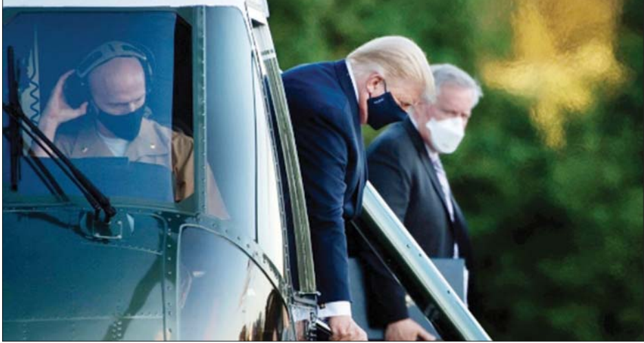
ရဟတ်ယာဉ်ပေါ်မှဆင်းလာသည့် အမေရိကန်သမ္မတထရမ်ကို တွေ့ရစဉ်။

ဝါရှင်တန်ဒီစီ အောက်တိုဘာ ၃ အမေရိကန်သမ္မတ ဒေါ်နယ်ထရမ်သည် အောက်တိုဘာ ၂ ရက်က ဆေးရုံတက်ရောက်ခဲ့ပြီး ကိုဗစ်-၁၉ ကုသမှုခံယူနေကြောင်း၊ သူ့အနေဖြင့် ကျန်းမာရေးကောင်းမွန်လျက်ရှိကြောင်း ပြောကြားလိုက်သည်။