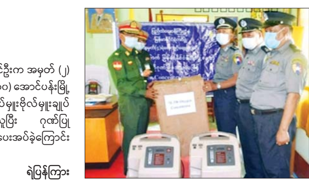
ရဲပြန်ကြား

နေပြည်တော် အောက်တိုဘာ ၃ (၅၆) နှစ်မြောက် မြန်မာနိုင်ငံရဲတပ်ဖွဲ့နေ့ကို ရုတ်ပြုသောအားဖြင့် စက်တင်ဘာ ၃၀ ရက် မွန်းတည့် ၁၂ နာရီက အမှတ် (၄) ရဲလှေကွေ့ရေ ကျောင်းတပ်ဖွဲ့ဝင်၊ မိသားစုများမှ လှူဒါန်းသည့် အောက်ဆီဂျင်ပေးစက် နှစ်လုံး (တန်ဖိုး ငွေကျပ် ၁၂၃၀၀၀) ကို ကျောင်းကိုယ်စား