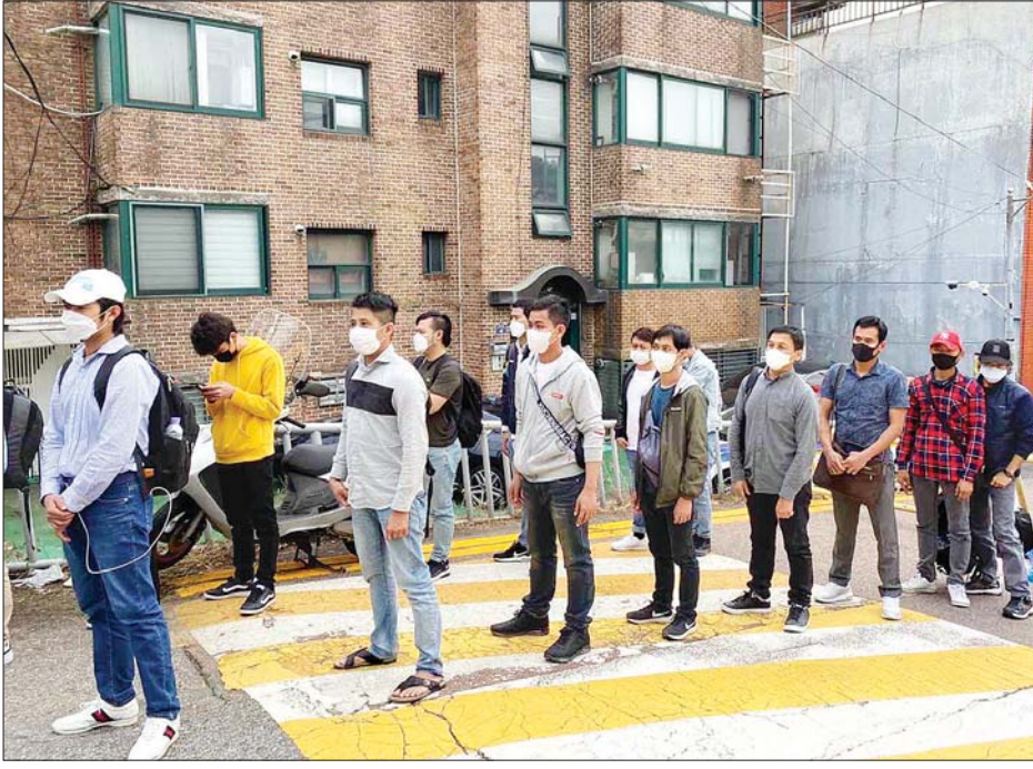
ကိုရီးယားနိုင်ငံ ဆိုးလ်မြို့ မြန်မာသံရုံးတွင် မြန်မာနိုင်ငံသားများ ကြိုတင်ဆန္ဒမဲပေးရန် စောင့်ဆိုင်းနေကြစဉ်။

ထိုပြင် ဂျပန်နိုင်ငံ၌ ရောက်ရှိနေကြသော မဲဆန္ဒပေးပိုင်ခွင့်ရှိသူ မြန်မာနိုင်ငံသားများသည် ယနေ့တွင် မြန်မာသံရုံး တိုကျိုမြို့၌ ကြိုတင်ဆန္ဒမဲပေးမှုများ စတင်ပြုလုပ်ခဲ့ပြီး မဲဆန္ဒရှင် ၁၁၅၉ ဦး စည်းကမ်းတကျ လာရောက် ဆန္ဒမဲပေးခဲ့ကြသည်။