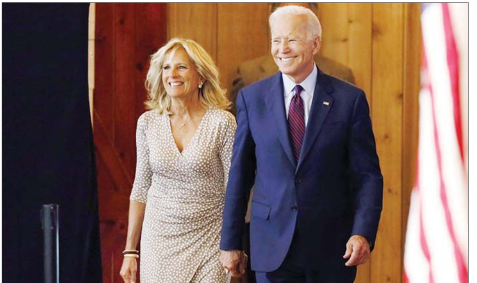
ဂျိုးဘိုင်ဒင်နှင့်ဇနီးဖြစ်သူ ဂျိုးဘိုင်ဒင်တို့ကို ၂၀၁၉ ခုနှစ် ဩဂုတ် ၇ ရက်က အတူတွေ့ရစဉ်။

ပြောကြားသည်။ တရုတ်နိုင်ငံခြားရေး ဝန်ကြီးဌာန ပြောရေးဆိုခွင့်ရှိသူ ဟွာချောင်းရင်ကလည်း အမေရိကန်သမ္မတနှင့် သမ္မတ ကတော်တို့လျင်မြန်စွာ ပြန်လည်ကျန်းမာလာရေး အတွက် တွစ်တာမှတစ်ဆင့် ဆုမွန်ကောင်းတောင်းပေးကြောင်း သိရသည်။ ထို့ပြင် ဂျပန်ဝန်ကြီးချုပ် ဆူဂါယိုရှိဟိဒဲးကလည်း သမ္မတထရမ် ကိုဗစ် -၁၉ မှပြန်လည်ကျန်းမာလာရေး ဆုတောင်းစကား ပြောကြားခဲ့သည်။ ပုံမှန်နေထိုင်မှု ဘဝသို့ မကြာမီအချိန်အတွင်း သမ္မတထရမ်ပြန်လည် ရောက်ရှိလာရေးကိုလည်း မျှော်လင့်ကြောင်း ပြောကြား ခဲ့သည်။ အင်န်အိတ်ချ်ကော