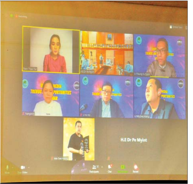
ဒစ်ဂျစ်တယ်မီဒီယာရေစီးနှင့် အခွင့်အလမ်းများဆိုင်ရာ အွန်လိုင်းဆွေးနွေးပွဲကျင်းပစဉ်။