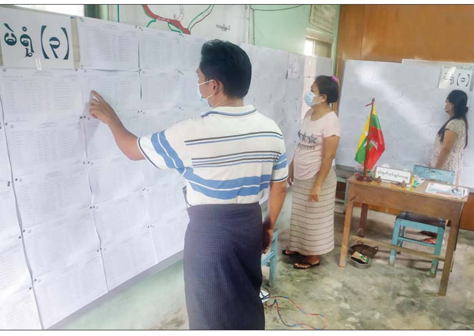
ဗဟန်းမြို့နယ် ဗိုလ်ချုပ်(၂)ရပ်ကွက် ရွေးကောက်ပွဲကော်မရှင်အဖွဲ့ခွဲရုံးတွင် မဲဆန္ဒရှင်များ မဲစာရင်းလာရောက်ကြည့်ရှုစဉ်။

ရန်ကုန် အောက်တိုဘာ ၃ ရန်ကုန်တိုင်းဒေသကြီး ဗဟန်း မြို့နယ်၌ နိုဝင်ဘာ ၈ ရက်တွင် ကျင်းပမည့် ပါတီစုံဒီမိုကရေစီ အထွေထွေရွေးကောက်ပွဲ အောင်မြင် စွာ ကျင်းပနိုင်ရေးအတွက် မဲဆန္ဒ ရှင်စာရင်းများကို အောက်တိုဘာ ၁ ရက်မှစ၍ ဒုတိယအကြိမ်အဖြစ် ကြေညာခြင်းကို ရပ်ကွက် ရွေးကောက်ပွဲကော်မရှင် အဖွဲ့ခွဲရုံး များတွင် ကပ်ထား ကြေညာပေး ထားလျက်ရှိသည်။ မဲဆန္ဒရှင်စာရင်းများကို ဒုတိယ အကြိမ် ကပ်ထား ကြေညာခြင်းသည် နောက်ဆုံးအကြိမ်အဖြစ် အောက်တို ဘာ ၁ ရက်မှ ၁၄ ရက်အထိ သက်ဆိုင်ရာ ရပ်ကွက်/ ကျေးရွာ ရွေးကောက်ပွဲကော်မရှင် အဖွဲ့ခွဲရုံး များတွင် ကပ်ထား ကြေညာထား မည်ဖြစ်ပြီး ပြည်သူများအနေဖြင့် စာမျက်နှာ ၄ ကော်လံ ၁ □