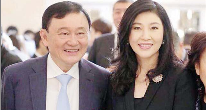
သက်ဆင်နှင့် ၎င်းညီမဖြစ်သူ ရင်လတ်တို့ကို တွေ့ရစဉ်။