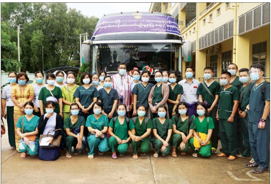
ကရင်ပြည်နယ်မှ ကျန်းမာရေးဝန်ထမ်း ၂၀ ရန်ကုန်တိုင်းဒေသကြီး ကိုဗစ်-၁၉ ကုသရေးဌာနတွင် တာဝန်ထမ်းဆောင်ရန် မထွက်ခွာမီ တွေ့ရစဉ်။

* အမရပူရမြို့နယ်မှ (၂) ဦး၊ မြို့သစ်မြို့နယ်မှ (၁) ဦးနှင့် ဟင်္သာတမြို့နယ်မှ (၂) ဦးတို့သည် ရန်ကုန်တိုင်းဒေသကြီးတွင် ဆေးကုသမှုခံယူလျက်ရှိသူများ ဖြစ်ပါသည်။ ** သာကေတမြို့နယ်မှ (၁) ဦးနှင့် တောင်ဥက္ကလာပမြို့နယ်မှ (၂) ဦးသည် ပဲခူးတိုင်းဒေသကြီးတွင် အသွားအလာကန့်သတ်ထားရှိသူများဖြစ်ပါသည်။ *** မြောက်ဥက္ကလာပမြို့နယ်မှ (၁) ဦးသည် မကွေးတိုင်းဒေသကြီးတွင် အသွားအလာကန့်သတ်ထားရှိသူဖြစ်ပါသည်။ **** ရန်ကုန်တိုင်းဒေသကြီးတွင် အသွားအလာကန့်သတ်ထားရှိသူ ဖြစ်ပါသည်။ မှတ်ချက်။ (၂၉-၉-၂၀၂၀) ရက်နေ့၊ ည (၈:၀၀) နာရီအချိန် ဓာတ်ခွဲအဖြေများ သတင်းထုတ်ပြန်ချိန်တွင် ဓာတ်ခွဲခန်း (၁) ခုမှ ပိုးတွေ့လူနာ (၂) ဦး၏ စာရင်းမှာ ကျန်ရှိခဲ့သဖြင့် (၂၈-၉-၂၀၂၀) ရက်နေ့၊ ည (၈:၀၀) နာရီမှ (၂၉-၉-၂၀၂၀) ရက်နေ့၊ ည (၈:၀၀) နာရီအတွင်း ဓာတ်ခွဲခန်းမှ စုစုပေါင်း (၆,၁၃၇) ခုအား စစ်ဆေးခဲ့ခြင်းဖြစ်ပြီး COVID-19 ရောဂါ ဓာတ်ခွဲအတည်ပြုလူနာသစ် (၇၉၇) ဦး တွေ့ရှိခဲ့ခြင်း ဖြစ်ပါသည်။ ကျန်းမာရေးနှင့် အားကစားဝန်ကြီးဌာန