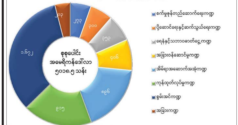
စာစစ်ခြစ်- ရင်းနှီးမြှုပ်နှံမှုနှင့် နိုင်ငံခြားစီးပွားဆက်သွယ်ရေးဝန်ကြီးဌာန