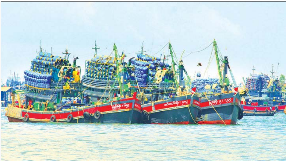
တနင်္သာရီကမ်းရိုးတန်းတွင် ငါးဖမ်းလုပ်ငန်းလုပ်ကိုင်နေကြသော ငါးဖမ်းရေယာဉ်များကို တွေ့ရစဉ်။