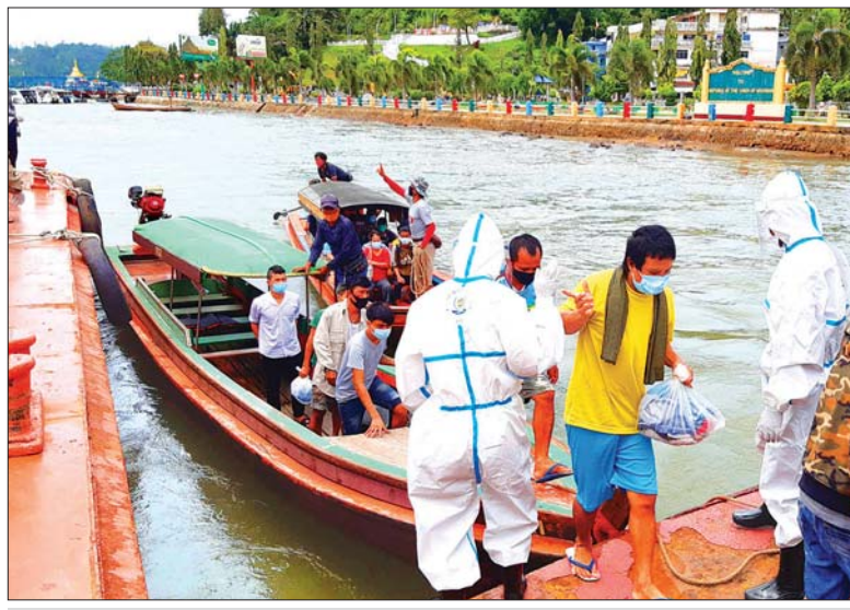
ကျေးသောင်းနယ်စပ်ဂိတ်မှ ပြန်လည်ဝင်ရောက်လာသည့် မြန်မာရွှေ့ပြောင်းအလုပ်သမားများကို တွေ့ရစဉ်။

ပြန်လည် ဝင်ရောက်လာသည့် အလုပ်သမားများအား ကျေးသောင်း ခရိုင်နှင့် မြို့နယ် ကိုဗစ်-၁၉ ရောဂါ ကာကွယ်ထိန်းချုပ်ရေးနှင့် အရေးပေါ် တုံ့ပြန်ရေးကော်မတီဝင်များ၊ ဌာန ဆိုင်ရာနှင့် NGO အဖွဲ့အစည်းများက စာမျက်နှာ ၁၄ ကော်လံ ၄ ◆