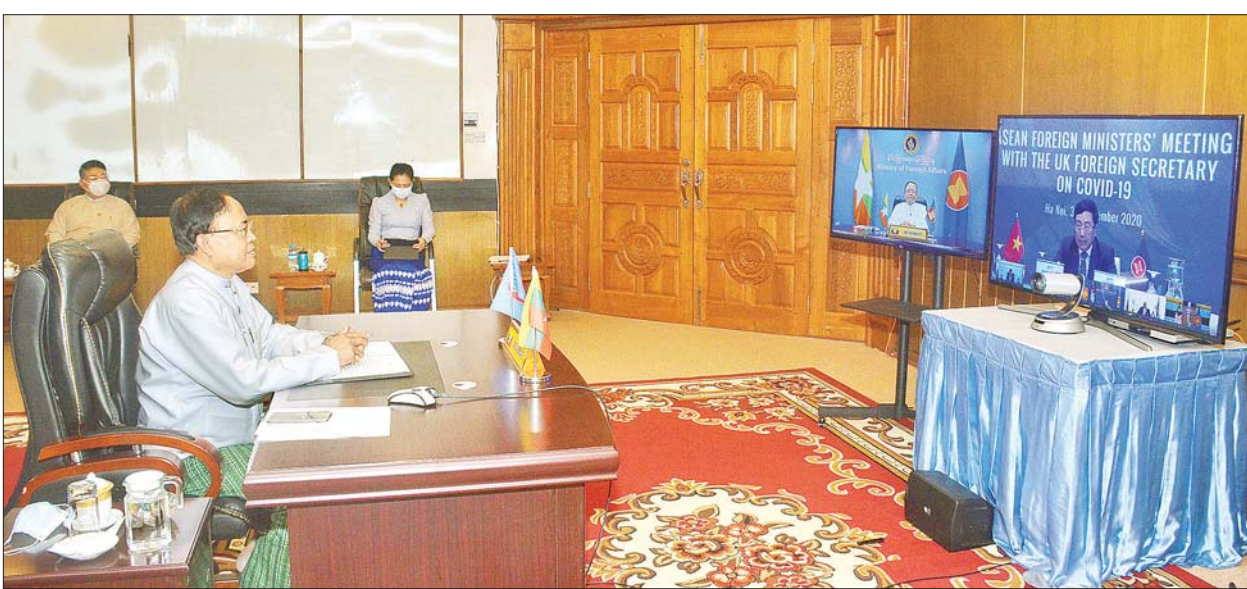
ပြည်ထောင်စုဝန်ကြီး ဦးကျော်တင် အာဆီယံနိုင်ငံခြားရေးဝန်ကြီးများနှင့် ဗြိတိန်နိုင်ငံခြားရေးဝန်ကြီးတို့အကြား Video Conferencing စနစ်ဖြင့် ကျင်းပသည့် ကိုဗစ်-၁၉ ကူးစက်ရောဂါဆိုင်ရာ အစည်းအဝေးသို့ ပါဝင်တက်ရောက်စဉ်။

အစည်းအဝေးတွင် ဝန်ကြီး များက ကမ္ဘာတစ်ဝန်း၌ ကိုဗစ်-၁၉ ကူးစက်ရောဂါကို ခိုင်မာထိရောက်စွာ ရင်ဆိုင် တုံ့ပြန်နိုင်ရေးအတွက် ပူးပေါင်းဆောင်ရွက်မှု တိုးမြှင့်ရန်နှင့် အတူတကွ ပေါင်းစပ်ညှိနှိုင်းဆောင်ရွက်ရန်လိုအပ်ကြောင်း အလေးထား ဆွေးနွေးခဲ့ကြပြီး ကာကွယ်ဆေးနှင့် ပတ်သက်၍ ထိရောက်လုံခြုံစိတ်ချမှု ရှိစေရေးနှင့် လက်လှမ်းမီသည့်