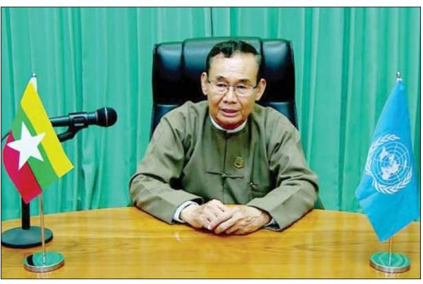
ပြည်ထောင်စုဝန်ကြီး ဦးအုန်းဝင်း Summit on Biodiversity တွင် Video-recorded Statement ဖြင့် မိန့်ခွန်းပြောကြားစဉ်။

နေပြည်တော် စက်တင်ဘာ ၃၀ အမေရိကန်နိုင်ငံ နယူးယောက်မြို့၌ ကျင်းပသည့် (၇၅)ကြိမ်မြောက် ကုလသမဂ္ဂ အထွေထွေညီလာခံ၏ High-level Week အတွင်း ဇီဝမျိုးစုံ မျိုးကွဲဆိုင်ရာ ထိပ်သီးအစည်းအဝေး (Summit on Biodiversity) ကို ယနေ့နံနက်ပိုင်းတွင် ကျင်းပသည်။