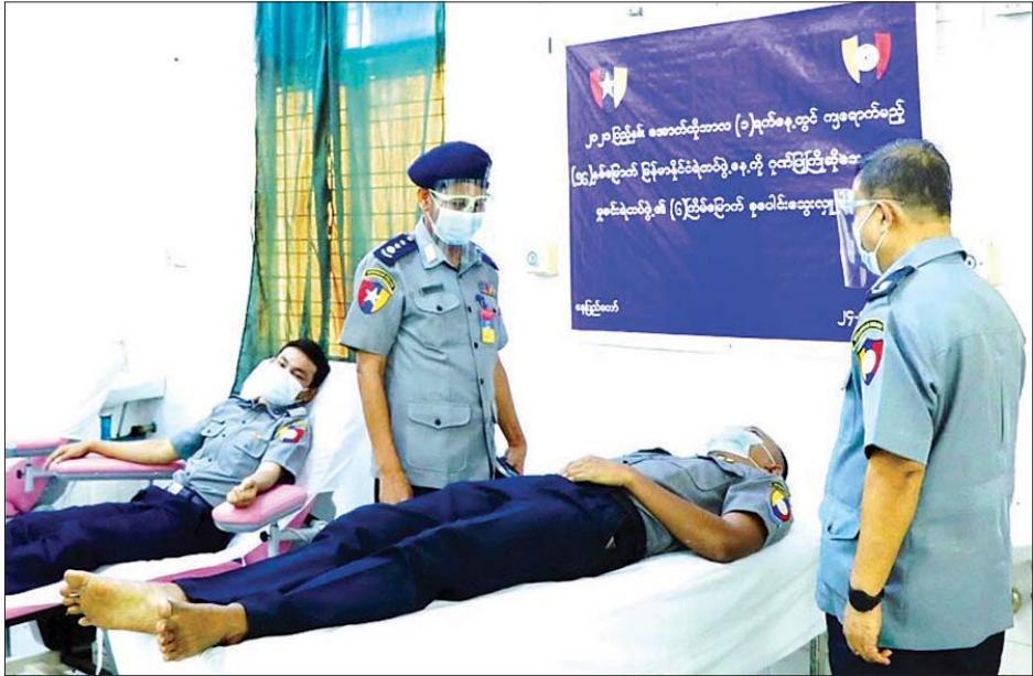
(၅၆)နှစ်မြောက် မြန်မာနိုင်ငံရဲတပ်ဖွဲ့နေ့ကို ဂုဏ်ပြုကြိုဆိုသောအားဖြင့် နေပြည်တော်မှခင်းရဲတပ်ဖွဲ့ဝင်များ ပြည်သူ့ အကျိုးပြု သွေးလျှာဒါနကြံစဉ်။

မြန်မာနိုင်ငံရဲတပ်ဖွဲ့၏ ရည်မှန်းချက်တာဝန် (၄) ရပ်နှင့် လုပ်ငန်းတာဝန် (၆) ရပ်တို့သည် အထက်တွင် ဖော်ပြခဲ့သော ဆောင်ပုဒ်နှင့်သက်ဆိုင်သည့် မေးခွန်းများ ၏ အဖြေများပင် ဖြစ်ပါသည်။ ကူညီပါရစေဟူသည့် ဆောင်ပုဒ်သည် မြန်မာနိုင်ငံရဲတပ်ဖွဲ့၏ ရည်မှန်းချက် တာဝန်နှင့် လုပ်ငန်းတာဝန်တို့နှင့် ပတ်သက်၍ ဆောင်ရွက်သမျှသော ကိစ္စအဝဝနှင့် သက်ဆိုင်နေသည်ကို