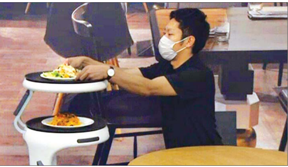
SoftBank Robotics ကုမ္ပဏီ က တီထွင်လိုက်သည့် အစားအစာသယ်ဆောင်ပေးမည့် စက်ရုပ်ကို တွေ့ရစဉ်။

တိုကျို စက်တင်ဘာ ၃၀ ကိုဗစ်- ၁၉ ကူးစက်မှု တိုးနေသည့် ကာလအတွင်း လူနေမှုဘဝပုံစံသစ်နှင့် လိုက်လျောညီထွေရှိစေ ရန်အတွက် ဂျပန်နိုင်ငံရှိ စားသောက်ဆိုင်များတွင် အကူအညီပေးမည့် စက်ရုပ်များကို ပညာရှင်များက တီထွင်လိုက်ပြီဖြစ်ကြောင်း သိရသည်။