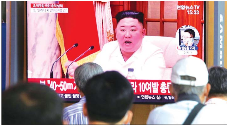
မြောက်ကိုရီးယားခေါင်းဆောင် ကင်ဂျုံအန်းရုပ်ပုံ ပါဝင်သည့် သတင်းထုတ်လွှင့်မှုအစီအစဉ်တစ်ခုကို တောင်ကိုရီးယား ပြည်သူများ ကြည့်ရှုနေစဉ်။