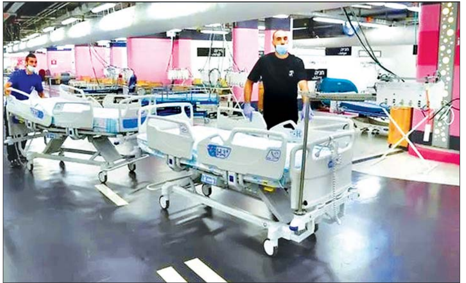
အစ္စရေးနိုင်ငံရှိ ဆေးရုံတစ်ခုတွင် လူနာဆောင်အဖြစ် ပြောင်းလဲလိုက်သည့် ကားပါကင်နေရာကို တွေ့ရစဉ်။