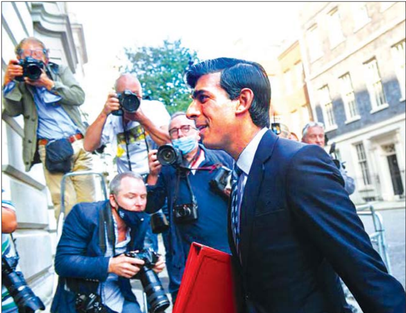
ဗြိတိန် ဘဏ္ဍာရေးဝန်ကြီး ရစ်ရှီဆူနက်။