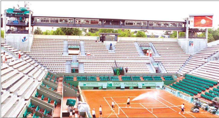
တင်းနစ်ကွင်းအတွင်း ပြင်ဆင်မှုများပြုလုပ်နေသည်ကို တွေ့ရစဉ်။