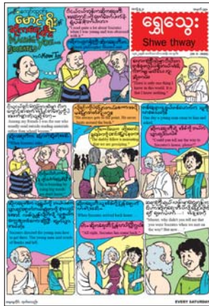
ကလေးကာတွန်းလက်ရာ ဖိတ်ခေါ် ခြင်းကြောင့်ပြောကဏ္ဍ၊ ရွှေသွေးအင်္ဂလိပ် စကားစဉ်၊ ကဗျာစုံလင်စွာဖြင့် ဖတ်စရာ မှတ်စရာများ ပါရှိကြောင်း သိရသည်။

အားလပ်နေ့သောအချိန်တွင် အချိန်ကို အကျိုးရှိရှိ အသုံးပြုတတ်စေရန် နည်းလမ်းကောင်းအချို့ကို ရေးဖွဲ့ထား သည့် “အချိန်တွေကို အကျိုးရှိရှိ အသုံး ချမယ်” သုတဆောင်းပါး၊ အာဖရိက တောကြီးထဲသို့ အမှန်တကယ် ရောက်ရှိသွားသကဲ့သို့ ခံစားမိသော ဖိုးလုံးအကြောင်းကို ရေးဖွဲ့ထားသည့် “ဖိုးလုံး-မုဆိုးအိပ်မက်” နှစ်မျက်နှာ ကာတွန်း၊ မိခင်၏ စကားကို နားမ ထောင်ဘဲ အစားမက်မိရာမှ ဘေး အန္တရာယ်နှင့် ကြုံတွေ့ရသော ဒရယ် ပျိုမလေးအကြောင်းကို ပညာပေး ရေးဖွဲ့ထားသည့် “အစားမက်သော ဒရယ်ပျို” ပုံပြင် ကဏ္ဍအပါအဝင်