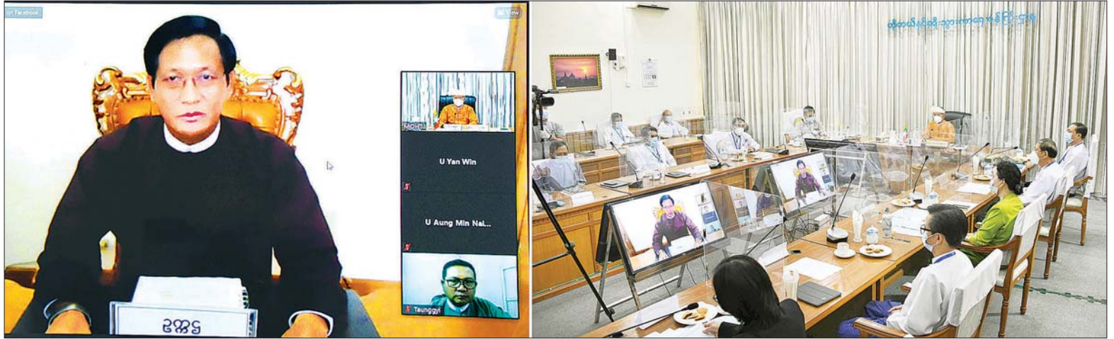
ဒုတိယသမ္မတ ဦးဟင်နရီဗန်ထီးယူ ကမ္ဘာ့ခရီးသွားလုပ်ငန်းနေ့ (၂၀၂၀) အထိမ်းအမှတ် Tourism and Rural Development ဆိုင်ရာ ဆွေးနွေးပွဲသို့ Video Conferencing စနစ်ဖြင့် အမှာစကားပြောကြားစဉ်။

နေပြည်တော် စက်တင်ဘာ ၂၅ ကမ္ဘာ့ခရီးသွားလုပ်ငန်းနေ့ (၂၀၂၀) အထိမ်းအမှတ် Tourism and Rural Development ဆိုင်ရာ ဆွေးနွေးပွဲကို ယနေ့နံနက် ၁၀ နာရီတွင် နေပြည်တော်ရှိ ဟိုတယ်နှင့် ခရီးသွားလာရေး ဝန်ကြီးဌာန အစည်းအဝေးခန်းမ၌ ကျင်းပရာ အမျိုးသားခရီးသွားလုပ်ငန်း ဖွံ့ဖြိုးတိုးတက်ရေးဗဟိုကော်မတီဥက္ကဋ္ဌ ဒုတိယသမ္မတ ဦးဟင်နရီဗန်ထီးယူက Video Conferencing စနစ်ဖြင့် အမှာစကားပြောကြားသည်။ ဆွေးနွေးပွဲသို့ ဗဟိုကော်မတီ ဒုတိယဥက္ကဋ္ဌ ပြည်ထောင်စုဝန်ကြီး ဦးအုန်းမောင်၊ ဒုတိယဝန်ကြီး ဦးတင်လတ်၊ စာမျက်နှာ ၇ ကော်လံ ၁