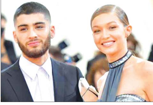
စူပါမော်ဒယ် ဂျီဂျီဟာဒ်နှင့် အဆိုတော် ဇိန်းမာလစ်။