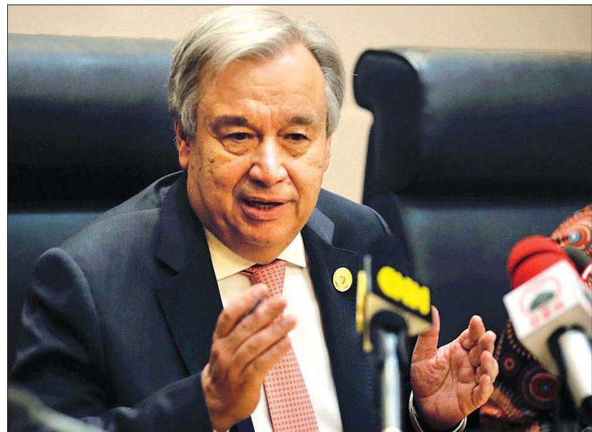
ကုလသမဂ္ဂအထွေထွေအတွင်းရေးမှူး အန်တိုနီယိုဂူတာရက်စ်။