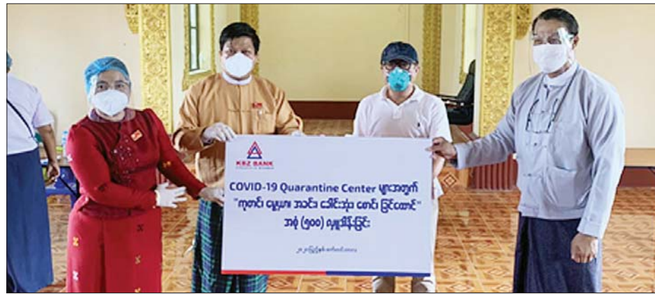
ကမ္ဘောဇဘဏ်က ရန်ကုန်တိုင်းဒေသကြီးအတွင်းရှိ ဆေးရုံများ၊