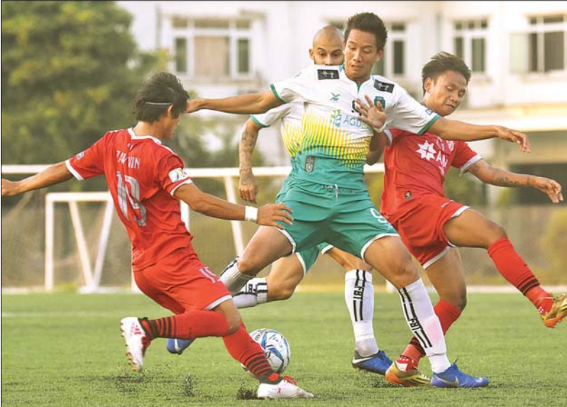
ရန်ကုန်နှင့် ဧရာဝတီအသင်း ၂၀၁၉ ရာသီက တွေ့ဆုံခဲ့စဉ်။

ရန်ကုန် စက်တင်ဘာ ၂၅ ၂၀၂၀ ရာသီ MNL အမှတ်ပေးပြိုင်ပွဲ ပွဲစဉ် (၁၉) ကို စနေ၊ တနင်္ဂနွေနေ့တွင် ဆက်လက်ကျင်းပမည် ဖြစ်ပြီး ချန်ပီယံဆုအတွက် အရေးပါသည့်ပွဲများ ပါဝင်နေသည်။ ပြိုင်ပွဲပြီးဆုံးရန် နှစ်ပွဲသာလိုတော့ပြီ ချန်ပီယံဆုအတွက် မျှော်လင့်ချက်ရှိနေသည့် အသင်း သုံးသင်း၏ ရုန်းကန်မှုများကို ဆက်လက်တွေ့မြင် ရမည်ဖြစ်သည်။ ပွဲစဉ် (၁၉)အဖြစ် စက်တင်ဘာ ၂၆ ရက် (ယနေ့) တွင် သုဝဏ္ဏကွင်း၌ ဟံသာဝတီ အသင်းနှင့် မကွေးအသင်း၊ YUSC ကွင်း၌ စစ်ကိုင်း အသင်းနှင့် ရတနာပုံအသင်း၊ စက်တင်ဘာ ၂၇ ရက်တွင် YUSC ကွင်း၌ Southern အသင်း နှင့် ရှမ်းယူနိုက်တက်အသင်း၊ သုဝဏ္ဏကွင်း၌ အား/ကာသိပွဲအသင်းနှင့် ရခိုင်အသင်း၊ ပဒုမ္မာကွင်း၌ ရန်ကုန်အသင်းနှင့် ဧရာဝတီအသင်းတို့ ယှဉ်ပြိုင် ကစားမည်ဖြစ်သည်။ ပွဲစဉ် (၁၈) အပြီးတွင် ဟံသာဝတီအသင်းက ရမှတ် ၄၀ ဖြင့် ထိပ်ဆုံးနေရာကို ပြန်လည်ရယူနိုင်ခဲ့ပြီး ဧရာဝတီအသင်းက ၃၉ မှတ်၊ ရှမ်းယူနိုက်တက်အသင်းက ၃၈ မှတ်၊ ရန်ကုန်အသင်းက ၃၁ မှတ်၊ ရတနာပုံအသင်းက ၁၉ မှတ်၊ ရခိုင်အသင်းက ၁၈ မှတ်၊ စစ်ကိုင်းအသင်းက ၁၆ မှတ်၊ မကွေးအသင်းက ၁၀ မှတ်၊ အား/ကာသိပွဲအသင်းက ရှစ်မှတ်၊ Southern အသင်းက ခုနစ်မှတ် ရရှိထားသည်။ လက်ရှိအနေအထားအရ ချန်ပီယံဆုအတွက် ရမှတ် ၄၀ ရထားသည့် ဟံသာဝတီအသင်း၊ ၃၉ မှတ် ရထားသည့် ဧရာဝတီအသင်းနှင့် ၃၈ မှတ် ရထားသည့် ရှမ်းယူနိုက်တက်အသင်းတို့ မျှော်လင့်ချက်ရှိနေသည်။ ပွဲစဉ် (၁၈) တွင် ပထမဆုံးရှုံးပွဲ ကြုံတွေ့ခဲ့သည့် ဧရာဝတီအသင်းသည် ယခု တစ်ပတ်တွင် ရှုံးရှုံးရသည့်အနေအထားဖြစ်သွား