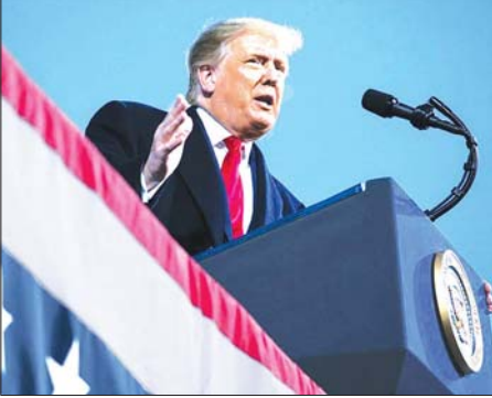
အမေရိကန်သမ္မတ ဒေါ်နယ်ထရမ်

အမေရိကန်က စက်တင်ဘာ ၁၉ ရက်တွင် တစ်ဖက်သတ် ကြေညာ လိုက်ပြီးနောက်မှာပင် ယခုအမိန့် ထုတ်ပြန်ချက်ကို သမ္မတထရမ်က လက်မှတ်ရေးထိုးလိုက်ခြင်း ဖြစ် သည်။