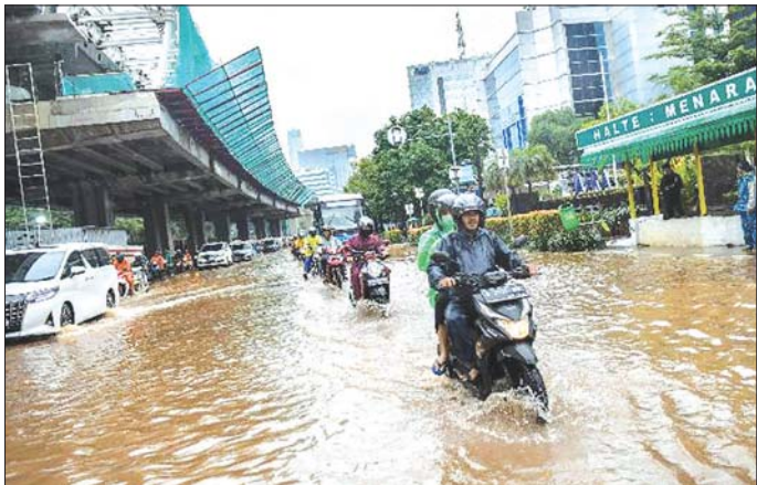
အင်ဒိုနီးရှားနိုင်ငံ မြို့တော် ဂျကာတာ၌ မိုးသည်းထန်စွာ ရွာသွန်းမှုကြောင့် ရေကြီးမှုကို တွေ့ရစဉ်။

ထုတ်ပြန်ရေးအရာရှိ ရာဇ်လီ ပရာဆက်တီယိုက ပြောကြား ခဲ့သည်။ ရေကြီးမှုဖြစ်ပွားသည့်နေရာတွင် တပ်မတော်သား များ၊ ရဲတပ်ဖွဲ့ဝင်များနှင့် ဂျကာတာမြို့ ကယ်ဆယ်ရေးနှင့် ရှာဖွေရေးရုံးမှ အဖွဲ့သားများအပါအဝင် ရာနှင့်ချီ ပူးပေါင်း ပါဝင်ဆောင်ရွက်လျက်ရှိကြောင်း ရာဇ်က ပြောသည်။ ၎င်း၏ပြောချက်အရ ကယ်ဆယ်ရေးဆောင်ရွက်ရန် ရာသီဥတုအခြေအနေကောင်းမွန်ကြောင်း သိရသည်။ ဒေသခံပြည်သူအများအပြားမှာ ရေကြီးမှုကြောင့် နေအိမ်မှ ဘေးလွတ်ရာ အဆောက်အအုံများဆောက်လုပ် ရှောင်တိမ်းနေထိုင်ခဲ့ရသည်။ မြို့တော် ဂျကာတာ၌ ရေဘေးကြောင့် သေဆုံးမှုမရှိကြောင်း သိရသည်။ ဆင်ဟွာ