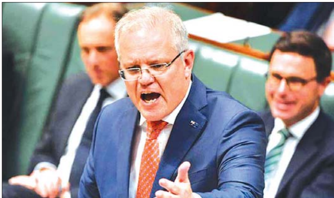
ဩစတြေးလျဝန်ကြီးချုပ် စကောက်မော်ရစ်ဆင်။