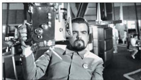
မိုက်ကယ်လွန်စိဒဲလ်

သူဟာ ဗြိတိန်နဲ့ ဖြစ်သရုပ်ရှင် ဇာတ်ကားပေါင်း ၂၀၀ ကျော်မှာ ပါဝင် သရုပ်ဆောင်ခဲ့သူလည်း ဖြစ်ပါတယ်။ သူ့ရဲ့ အနုပညာသက်တမ်းကတော့ ဆယ်စု နှစ် ခြောက်စုစာ ရှိပါပြီ။ ဂျိမ်းစ်ဘွန်း ထုတ်လုပ်သူတွေဖြစ်ကြတဲ့ မိုက်ကယ် ဂျီဝေလ်ဆင်နဲ့ ဘာသာရာ ဘရိုက်လီကတော့ လွန်စိဒဲလ်ဟာ အနုပညာ အရည် အချင်းပြည့်ဝတဲ့ သရုပ်ဆောင်တစ်ယောက်လို့ မှတ်ချက်ပြောဆိုခဲ့ကြပါတယ်။ လွန်စိဒဲလ် သေဆုံးသွားတဲ့အတွက် ဝမ်းနည်းကြေကွဲကြောင်း ပြောကြားခဲ့ကြ ပါတယ်။ ဂျိမ်းစ်ဘွန်းဇာတ်ကားမှာ ဗီလိန်အဖြစ် သရုပ်ဆောင်ရတဲ့အတွက် နောက်ပိုင်း သူ့ရဲ့ အနုပညာအလုပ်မှာ အနှောင့်အယှက်ဖြစ်မှာ၊ ပရိသတ်တွေက သူ့ကို မုန်းသွားမှာကို စိုးရိမ်ခဲ့ရဖူးတယ်လို့ လွန်စိဒဲလ်က အင်တာဗျူးတစ်ခုမှာ ပြောကြားခဲ့ပါတယ်။ ဒါပေမယ့်လည်း သူ့စိုးရိမ်သလိုဖြစ်မလာဘဲ ရုပ်ရှင်ဇာတ်ကား အများကြီးမှာ ပါဝင်ခွင့်ရခဲ့တယ်လို့ သူက ဆက်ပြောပါတယ်။ အောင်မြင်မှု အကြီးအကျယ်မရခဲ့ပေမယ့် ရုပ်ရှင်တွေ အများကြီး ရိုက်ကူးနိုင်ခဲ့တယ်လို့ သူက ပြောပြခဲ့ပါတယ်။