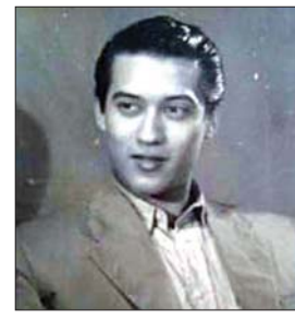
ခင်မောင်စင်