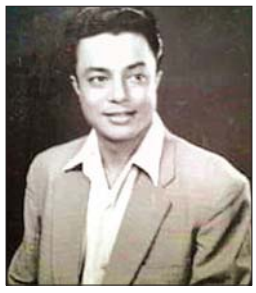
မောင်မောင်တာ

မင်းသားကြီးမြင့်စိုး။ ။ ဒီလိုပဲ၊ အကြာကြီးရိုက်ရတာပဲ ။ ကြည်စိုးထွန်း ။ ။ မှန်တာပေါ့။ မင်းသားကြီးမြင့်စိုး။ ။ တစ်ရက်တည်းဧကန်ထုပ်လည်း ပေတစ်သောင်း ငါးထောင်ပြည့်အောင် ရိုက်ရမှာပဲ ။ ကြည်စိုးထွန်း ။ ။ ဟုတ်ကဲ့။