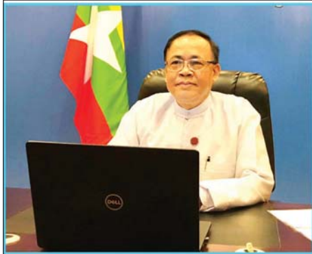
ပြည်နယ်၌ ဆောင်ရွက်လျက်ရှိသော စီမံကိန်းများနှင့်စပ်လျဉ်းသည့် တိုးတက်မှု အခြေအနေများကို အမြင်ချင်းဖလှယ် ဆွေးနွေးခဲ့ကြသည်။ ထို့အပြင် COVID-19 ကူးစက်ရောဂါကြောင့် ပြည်သူများ၏ လူမှု-စီးပွား

ယင်းသို့ တွေ့ဆုံစဉ် ပြည်ထောင်စုဝန်ကြီးက Mr. Titon Mitra အား UNDP ၏ မြန်မာနိုင်ငံဆိုင်ရာ ဌာနကိုယ်စားလှယ်အဖြစ် ခန့်အပ်ခြင်းခံရသည့် အတွက် ဂုဏ်ယူဝမ်းမြောက်ကြောင်း၊ ကြိုဆိုနှုတ်ခွန်းဆက်စကားများ ပြောကြားခဲ့ပြီး မြန်မာနိုင်ငံနှင့် ကုလသမဂ္ဂဖွံ့ဖြိုးမှု အစီအစဉ်တို့အကြား ပူးပေါင်းဆောင်ရွက်မှု နောက်ခံဖြစ်စဉ်များ၊ ကုလသမဂ္ဂဖွံ့ဖြိုးမှု အစီအစဉ်၏ မြန်မာနိုင်ငံဆိုင်ရာ အစီအစဉ် (၂၀၁၈-၂၀၂၂) အရ ငြိမ်းချမ်းရေးနှင့် အုပ်ချုပ်မှု စွမ်းဆောင်ရည် မြှင့်တင်ရေး၊ ပတ်ဝန်းကျင်ဆိုင်ရာ စီမံခန့်ခွဲမှု၊ တရားဥပဒေစိုးမိုးရေး၊ အကတ် လိုက်စားမှုတိုက်ဖျက်ရေး၊ ဆင်းရဲနွမ်းပါးမှုလျှော့ချရေးအပါအဝင် ကုလသမဂ္ဂ ဖွံ့ဖြိုးမှုအစီအစဉ်နှင့် မြန်မာနိုင်ငံတို့အကြား ပူးပေါင်းဆောင်ရွက်နေမှုနှင့် ရရှိနိုင်