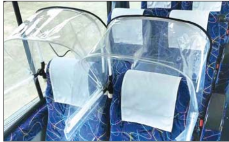
ဘတ်စ်ကားထိုင်ခုံများတွင် လုံခြုံရေးအစီအမံများ ပြုလုပ်ထားစဉ်။

တစ်ကမ္ဘာလုံးကို ရိုက်ခတ်နေတဲ့ ကိုဗစ်-၁၉ ကြောင့် စီးပွားရေးလုပ်ငန်းတွေ ထိခိုက်ရပေမယ့် အစောဆုံးနဲ့ အဆိုးဆုံးထိခိုက်ခံရတဲ့ လုပ်ငန်းတွေကတော့ သယ်ယူပို့ဆောင်ရေးနဲ့ ခရီးသွားလုပ်ငန်းတွေပါ။ သယ်ယူပို့ဆောင်ရေး ကုမ္ပဏီကြီးတွေဟာ လုပ်ငန်းမှာကြီးမားတဲ့ဆုံးရှုံးမှုတွေကို ကာမိစေဖို့အတွက် စီးပွားရေးလုပ်ငန်းတွေကို အဆင်ပြေအောင် အသွင်ပြောင်းလာရပါတယ်။ ဂျပန်နိုင်ငံမှာ အရေးပေါ်ကြေညာချက် ထုတ်ပြန်ထားတဲ့ မေလအတွင်းမှာဆိုရင် တိုဟိုဂျူရုပ်ကန်ဆန်ကျည်ဆန်ရထားပေါ် စီးနင်းလိုက်ပါနေကျ ခရီးသွား ရာခိုင်နှုန်းဟာ လွန်ခဲ့တဲ့နှစ်ကနဲ့ယှဉ်ရင် ၁၀ ရာခိုင်နှုန်းကျဆင်းခဲ့ပါတယ်။ အဲဒီနောက်မှာတော့ တဖြည်းဖြည်း ဆိုးရွားလာပြီး ဩဂုတ်လနောင်ပိုင်းမှာတော့ အခြေအနေတွေ ပိုမိုဆိုးရွားလာခဲ့ပါတယ်။