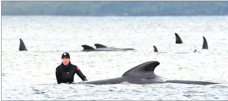
ကယ်ဆယ်ရေးသမားတစ်ဦးက ဝေလငါး ရေနက်ပိုင်းသို့ ပြန်သွားနိုင်ရေး ကူညီပေးနေစဉ်။