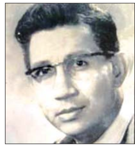
ကောလိပ်ဂျင်နေဝင်း