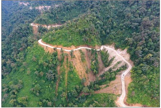
ကျောက်ခင်းလမ်း ဆောင်ရွက်ပြီးစီးမှုကို တွေ့ရစဉ်။

ရိုန်းခေါင်ကျေးရွာသည် ခေါင်လန်ဖူးမြို့နယ်ထဲက ရွာတစ်ရွာဖြစ်ပြီး တရုတ်နိုင်ငံနယ်စပ်နှင့် နယ်နိမိတ်ချင်း ထိစပ်နေပါသည်။ ဆီးနင်းများ ဖုံးလွှမ်းပြီး သွားလာရ ခက်ခဲချိန်မှလွဲ၍ ကျန်အချိန်များတွင် တရုတ်နိုင်ငံဘက် မှ စားကုန်သောက်ကုန်နှင့် လူသုံးကုန်ပစ္စည်းများ ဝင်ရောက်ရာဒေသလည်းဖြစ်၏။ နယ်စပ်ရေးရာဝန်ကြီး ဌာနက မဂ္ဂေ-ခေါင်လန်ဖူးကားလမ်း ဖောက်လုပ် မပေးမီအချိန်ကာလများ၌ ခေါင်လန်ဖူးမြို့လေးသည်ပင် လျှင် ရိုန်းခေါင်ဘက်မှလာသော ဆန်နှင့်စားကုန်သောက် ကုန်၊ လူသုံးကုန်များကို အားထားနေရသည့်မှာ အမှန်ပင်။ ရိုန်းခေါင်တွင် အခြေခံပညာအထက်တန်းကျောင်း(ခွဲ) ဖွင့်လှစ်ပေးထားသည်။ ရိုန်းခေါင်နှင့် လန်ဆယ်ဒေသများသို့ ဆန်များထောက်ပံ့ ဆို့ခဲ့သည့်အတိုင်း ရိုန်းခေါင်ဒေသနှင့် တရုတ်နယ်စပ် အကြားမှ ဆီးနင်းများဖုံးပြီး ဆက်သွယ်ရေးလမ်းကြောင်း ပြတ်တောက်သွားချိန်မှာ ဆန်ရှားပါးမှုပြဿနာ အမြဲ ကြုံနေရသည်။ တရုတ်နိုင်ငံမှ ကိုဗစ်-၁၉ ကပ်ရောဂါ ကို ကပ်ခက်ခဲထိ ထိန်းချုပ်နေရချိန်၊ နယ်စပ်ဝင်ပေါက် ထွက်ပေါက်များကို ပိတ်ပစ်လိုက်သောအခါ ရိုန်းခေါင်