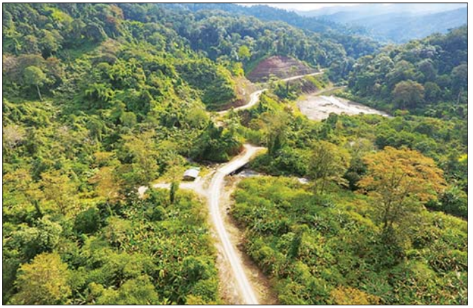
ကျောက်ခင်းလမ်းဆောင်ရွက်ပြီးစီးမှုကို တွေ့ရစဉ်။

ရေးများ ဦးကျော်မင်းက ကချင်ပြည်နယ် ကိုဗစ်-၁၉ ထိန်းချုပ်ရေးနှင့် အရေးပေါ်တုံ့ပြန်ရေးကော်မတီဥက္ကဋ္ဌ ပြည်နယ်ဝန်ကြီးချုပ် ဒေါက်တာဝေအောင်ထံ လွှဲပြောင်း ပေးခဲ့ပါသည်။ ထို့အတူ လူမှုဝန်ထမ်း၊ ကယ်ဆယ်ရေး နှင့် ပြန်လည်နေရာချထားရေးဝန်ကြီးဌာနကလည်း ဆန်အိတ် ၂၀၁၈ အိတ်ကို ၎င်းဒေသအတွင်း ထောက်ပံ့ ဖြန့်ဝေပေးခဲ့သည်။ ရိုန်းခေါင်နှင့် ဖီးထန်ဒေသများအတွင်းရှိ ညီဝစ်ထန် ကျေးရွာအုပ်စု၊ ရနင်ထိကျေးရွာအုပ်စု၊ ဇန်နီယာကျေးရွာ အုပ်စု၊ ချီလူပန်ကျေးရွာအုပ်စု၊ ရမန်ချီကျေးရွာအုပ်စု၊ ဖီးထန်ကျေးရွာအုပ်စု၊ ဒါလန်ကျေးရွာအုပ်စု၊ လာတား ကော်ကျေးရွာအုပ်စု စသည်ဖြင့် ကျေးရွာအုပ်စု ရှစ်အုပ်စု အတွင်းမှ လူဦးရေ ၉၈၀၀ အတွက် ဆန်အိတ် ၈၀၀ ဟူ၍ လည်းကောင်း၊ လန်ဆယ်အရှေ့ခြမ်းဒေသများ ဖြစ်သည့် ထမ်းကျေးရွာအုပ်စု၊ ရပ်မားကျေးရွာအုပ်စု၊ နမ့်ချိန်ကျေးရွာအုပ်စု၊ ရှိလန်ဒန်းကျေးရွာအုပ်စုအတွင်း မှ လူဦးရေ ၁၈၀၈ ဦးအတွက် ဆန်အိတ် ၂၀၀ ဟူ၍ လည်းကောင်း၊ သတ်မှတ်ခဲ့ပေးပြီးနောက် တစ်မတော်၊ နယ်စပ်ရေးရာဝန်ကြီးဌာနနှင့် ကချင်ပြည်နယ်အစိုးရတို့