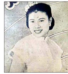
မြင့်မြင့်ဌေး