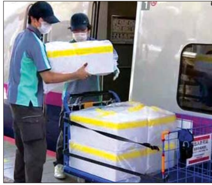
ကျည်ဆန်ရထားပေါ်သို့ ကုန်တင်နေသည့်ကို တွေ့ရစဉ်။