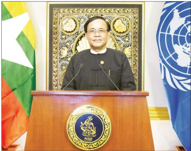
ပြည်ထောင်စုဝန်ကြီး ဦးကျော်တင် ကုလသမဂ္ဂတည်ထောင်သည့် (၇၅) နှစ်ပြည့် နှစ်ပတ်လည် အထိမ်းအမှတ် နယူးယောက်မြို့ ကုလသမဂ္ဂဌာနချုပ်၌ ကျင်းပခဲ့သည့် အဆင့်မြင့်အစည်းအဝေး၌ ဗီဒီယိုဖြင့် မိန့်ခွန်းပြောကြားစဉ်။

ယနေ့ကမ္ဘာကြီးမှာ အင်အားပြိုင်ဆိုင်မှုတွေ ပိုမို ကွဲပြားလာနေပြီး၊ ပထဝီဇိုင်ရေးနဲ့ စီးပွားရေး တင်းမာမှု တွေလည်း မြင့်တက်လျက်ရှိပါတယ်။ ဒါတွေထက်ပိုပြီး ဆိုးရွားတာကတော့ စီးပွားရေးနဲ့ လူ့အဖွဲ့အစည်းတွေ အပေါ်ကြီးမားတဲ့ ဖိစီးမှုတွေကျရောက်စေတဲ့ ကိုဗစ်-၁၉ ကပ်ရောဂါဘေး အကျပ်အတည်းနဲ့ ကျွန်တော်တို့ ရင်ဆိုင် နေကြရတာပဲ ဖြစ်ပါတယ်။ ကိုဗစ်-၁၉ ရောဂါဟာ အလုပ် အကိုင်နဲ့ အသက်မွေးဝမ်းကျောင်းလုပ်ငန်း ဆုံးရှုံးမှုတွေ၊ ဆင်းရဲနွမ်းပါးမှုကို ပိုမိုဆိုးရွားစေမှုတွေ ပညာရေးကဏ္ဍမှာ အဟန့်အတားတွေ ဖြစ်ပေါ်စေပြီး အထိအနာဆုံးကတော့ ထိခိုက်အလွယ်ဆုံးသောသူတွေပဲ ဖြစ်ပါတယ်။ ဒီလို အရေးကြီးတဲ့အချိန်မှာ ကမ္ဘာ့သမိုင်းတစ်လျှောက် ဆိုးကျိုး ဂယက်ရိုက်မှုအများဆုံး ဖြစ်နိုင်တဲ့ ဒီကပ်ရောဂါ မိန့်ခွန်း မူကြီးကို စုပေါင်းတုံ့ပြန်နိုင်ဖို့အတွက် ပိုမိုခိုင်မာ