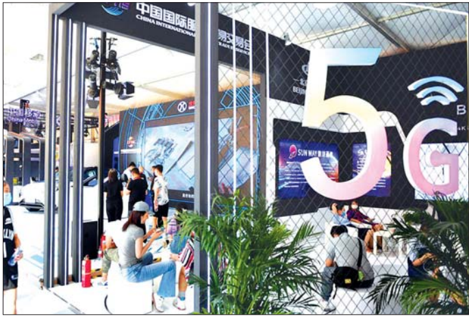
တရုတ်နိုင်ငံ ပေကျင်းမြို့ရှိ ဖိုက်ဂျီဝန်ဆောင်မှုပေးသည့် နေရာတစ်ခုကို တွေ့ရစဉ်။

ပေကျင်း စက်တင်ဘာ ၂၂ တရုတ်နိုင်ငံ ပေကျင်းမြို့တွင် ၂၀၁၉ ခုနှစ်က ဖိုက်ဂျီကွန်ရက် တရားဝင် ထူထောင်လိုက်ပြီးနောက် လက်ရှိ ဖိုက်ဂျီအသုံးပြုသူ အရေအတွက် ၅ ဒဿမ ၀၆ သန်းအထိ ရှိကြောင်း ဒေသအာဇာပိုင်များက စက်တင်ဘာ ၂၂ ရက်တွင် ပြောကြားသည်။ ပေကျင်း၌ ဩဂုတ်လက ဖိုက်ဂျီ အခြေစိုက်ရုံးပေါင်း ၄၄၀၀၀ အထိ လုပ်ငန်းလည်ပတ်ဆောင်ရွက်ခဲ့ပြီး ၂၀၂၀ ပြည့်နှစ် နှစ်ကုန်ပိုင်းတွင် ဖိုက်ဂျီအခြေစိုက်ရုံး ၅၀၀၀၀ ကျော် အထိလည်ပတ်နိုင်မည်ဟု ခန့်မှန်း ထားကြောင်း ပေကျင်းမြို့ စည်ပင် ဆက်သွယ်ရေးနှင့် အုပ်ချုပ်ရေးအဖွဲ့၏ ပြောကြားချက်အရ သိရသည်။ ဖိုက်ဂျီလုပ်ငန်းလိုင်စင် ရရှိထား သည့် ကုမ္ပဏီသုံးခုဖြစ်သည့် China Mobile, China Unicom နှင့် China Telecom ကုမ္ပဏီများ၏ ပေကျင်း ရုံးခွဲများက ဖိုက်ဂျီကွန်ရက်ကို လုပ်ငန်းစီမံကိန်း ၁၀၀၀ ကျော်တို့တွင်