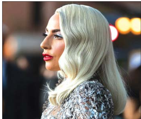
အဆိုတော် လေဒီဂါဂါ

အခုအခါမှာတော့ သူ့ရဲ့စိတ်ပိုင်းဆိုင်ရာအခြေအနေဟာ အရင်ကထက် အများကြီး ပိုကောင်းလာပြီး ကိုယ့်ကိုယ်ကိုယ်လည်း မမုန်းတော့ဘူး၊ မိမိကိုယ် မိမိချစ်ခင်နှစ်သက်ရမယ့် နည်းလမ်းကိုလည်း တွေးသွားပြီလို့ လေဒီဂါဂါက တွေ့ ဆုံ မေးမြန်းခန်းအစီအစဉ်မှာ ပြောကြားခဲ့ပါတယ်။