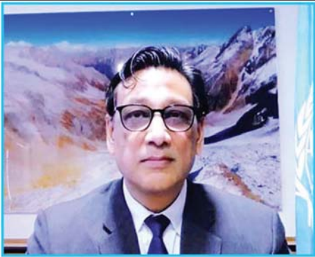
ဘဝအပေါ် သက်ရောက်မှုများ လျော့ချနိုင်ရေးအတွက် ပူးပေါင်းဆောင်ရွက်မှု မြှင့်တင်ရေး ကိစ္စရပ်များကိုလည်း ဆွေးနွေးခဲ့ကြကြောင်း သတင်းရရှိသည်။ သတင်းစဉ်