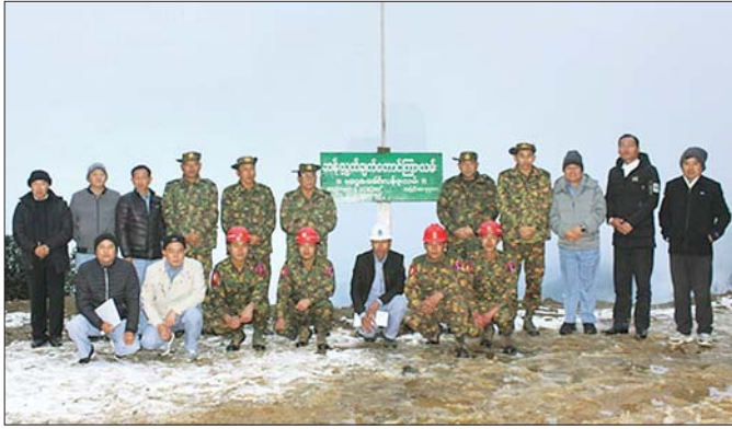
မဂ္ဂေ-ခေါင်လန်ဖူးလမ်း စီမံကိန်း ကြည့်ရှုစစ်ဆေးသည့် ပြည်ထောင်စုဝန်ကြီး ဒုတိယဗိုလ်ချုပ်ကြီး ရဲအောင်နှင့် အဖွဲ့ စုပေါင်းဓာတ်ပုံရိုက်စဉ်။

ကျွန်တော်တို့မြို့နယ်အတွင်းမှာ ရိုန်းခေါင်ဆိုတာက သွားရလရာ ခက်ခဲသော ဒေသထဲမှာပါသည်။ စရိတ်စက တတ်နိုင်သော ပြည်မက လာသူတချို့ကတော့ ကန်ပိုက် တီးမှတစ်ဆင့် တရုတ်နိုင်ငံအတွင်းသို့ဝင်ပြီး ကားစီး၍ လာကြသည်။ ဈေးတော့ကြီးသည်ပေါ့။ ထို့ကြောင့် ခေါင်လန်ဖူးမြို့လေးမှတစ်ဆင့် သွားမည်ဆိုလျှင် လမ်း နှစ်သွယ်ရှိပါသည်။ ခေါင်လန်ဖူးမှ ဆရစ်ဖာအထိ ၁၅ မိုင်ခန့်ကို တစ်ရက်လမ်းလျှောက်ရမည်။ ဆက်လက်၍ ဆရစ်ဖာမှ ညီဝါးအထိ ၁၂ မိုင်ခန့်ကို တစ်ရက်၊ ညီဝါးမှ လာဂါလော်ကိုလည်း တစ်ရက်ခန့်၊ လမ်းလျှောက်ကြရ ပြီး လာဂါလော်-ရိုန်းခေါင်ခရီးကိုတော့ ကားဖြင့်သွား နိုင်ပါသည်။ ကားခ လွှဲ ၁၀၀၊ မြန်မာငွေကျပ် ၂၀၀၀၀ ဖြစ်သည်။ နောက်လမ်းတစ်သွယ်ကမူ ခေါင်လန်ဖူးမှ ဇန်နီယာအထိ ဆိုင်ကယ်လမ်းရှိသည်။ ဈေးကြီး၍ ဆိုင်ကယ်မစီးနိုင်သူများက ဇန်နီယာအထိ နှစ်ညအိပ် သုံးရက်ခန့် လမ်းလျှောက်ကြရပါမည်။ ဇန်နီယာမှ ချီလာ ဝါဒီသို့ တစ်ရက်၊ ချီလာဝါဒီမှ ရိုန်းခေါင်သို့ အောက်ထပ် တစ်ရက်ခန့်၊ ခြေကျင်လျှောက်လျှင်ရောက်ပါပြီ။ အကုန် အကျနည်းမည် ဖြစ်သော်ငြားလည်း လူပင်ပန်းသော လမ်းခရီးများဖြစ်၏။ ပူတာအိုမှလာသူ အချို့ကတော့ ခေါင်လန်ဖူးအထိ သွားမနေတော့ပါ။ ထလားလော် ရွာလေးမှ ဆရစ်ဖာသို့ ဖြတ်ချက်လျှင် ၂၇ မိုင်ခန့် ခရီးတာဝန်သွားမည် ဖြစ်သည်။ တောင်အောက်အဆင်း မတ်သောနေရာများ ရှိနေပါသည်။