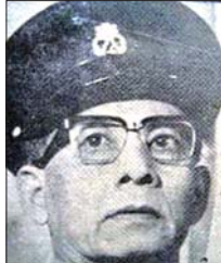
‘ဖားတစ်လုံး ခေါင်းကား’ ခင်မောင်