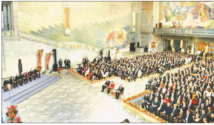
၂၀၁၉ ခုနှစ် နိုဘယ်ဆုချီးမြှင့်ပွဲ အခမ်းအနားကျင်းပနေသည်ကို တွေ့ရစဉ်။