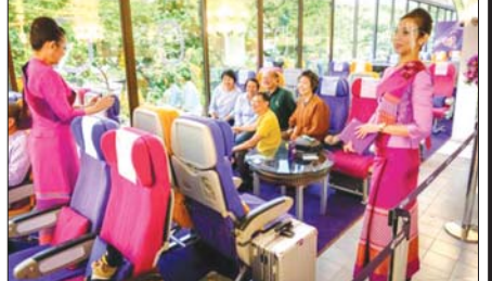
လေယာဉ်ခရီးစဉ်ပွင့်လှစ်ထားသည့် ကော်ဖီဆိုင်ကို တွေ့ရစဉ်။