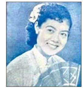
ပြုံးပြုံးကြည်

မင်းသားကြီးမြင့်စိုး။ ။ ကိုလှသူ။ ကြည်စိုးထွန်း ။ ။ သိတယ်။ မင်းသားကြီးမြင့်စိုး။ ။ နောက်ပြီးတော့ စာရေးဆရာ မြတ်ထွဋ်။ ကြည်စိုးထွန်း ။ ။ ဪ မြတ်ထွဋ် ဆုံးသွားပြီ။ မင်းသားကြီးမြင့်စိုး။ ။ သူတို့နှစ်ယောက်ရောတဲ့ ဧကန်တင်လမ်း။