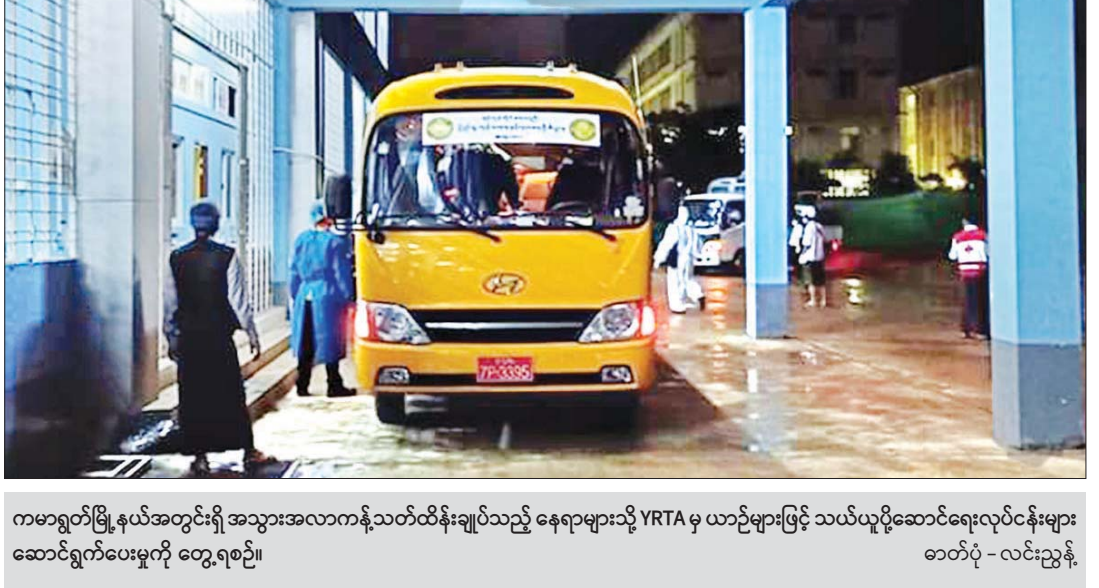
ကမာရွတ်မြို့နယ်အတွင်းရှိ အသွားအလာကန့်သတ်ထိန်းချုပ်သည့် နေရာများသို့ YRTA မှ ယာဉ်များဖြင့် သယ်ယူပို့ဆောင်ရေးလုပ်ငန်းများ ဆောင်ရွက်ပေးမှုကို တွေ့ရစဉ်။