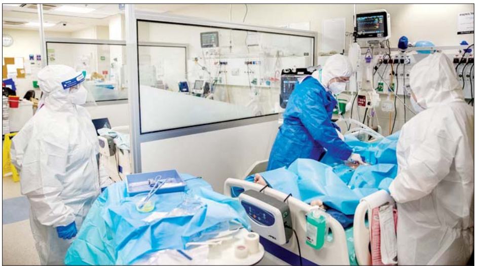
အစ္စရေးနိုင်ငံရှိ ကိုဗစ်- ၁၉ လူနာဆောင်တွင် ကုသနေသည့် ဆရာဝန်များကို တွေ့ရစဉ်။