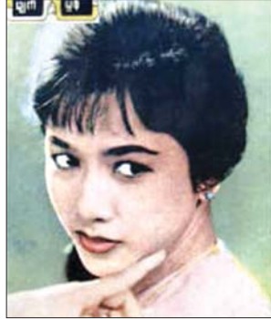
တင်တင်လှ

အဲဒီ 'ပြည်တန်တူးကျည်ဆံ' မှာ ကျွန်တော်လွဲခဲ့ရတာ။ နောက် ခုနက ကျွန်တော် ပြောဖူးတဲ့ ကြည်ကြည်ဌေးနဲ့ 'မိမိကြီး'မှာ။ ကြည်စိုးထွန်း ။ ။ ဪ။ မင်းသားကြီးမြင့်စိုး ။ ။ ကျွန်တော်ချစ်မောင်က မင်းသား မောင်ရင် မင်း အကယ်ဒမီပဲ အကယ်ဒမီပဲတဲ့။ ကြည်စိုးထွန်း ။ ။ ဪ သူက။ မင်းသားကြီးမြင့်စိုး ။ ။ ကျွန်တော်က ကျော်စောကြီးရဲ့သား၊ မြင်းလှည်း သမားလုပ်ရတယ်။ ချစ်လှသိပ်ကောင်းတယ် ဆရာရယ်။ အဲဒီမှာ ဘာသွား သတိရလဲဆိုတော့ ကျွန်တော်က 'မာယာကြာခြည်'တုန်းက ကြည်ကြည်ဌေးနဲ့ ကျွန်တော်က သူဌေးသား။ ကြည်စိုးထွန်း ။ ။ ဟုတ်ကဲ့။