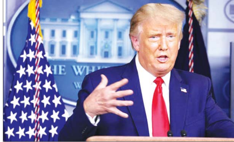
အမေရိကန်သမ္မတ ဒေါ်နယ်ထရမ်

နီးစပ်နေပြီဖြစ်ကြောင်းနှင့် လာမည့်ရက်သတ္တပတ် သုံးပတ်သို့မဟုတ် လေးပတ်အတွင်း ကာကွယ်ဆေး ရရှိနိုင်ကြောင်း ပြောကြားခဲ့သည်။ ထို့ပြင် သမ္မတထရမ်က ယခင်အစိုးရအဖွဲ့ လက်ထက်က အမေရိကန် အစားအသောက်နှင့် ဆေးဝါးကွပ်ကဲရေးအဖွဲ့နှင့် အခြားအာဏာပိုင် အဖွဲ့အစည်းများ၏ အတည်ပြုထောက်ခံချက်ရရှိရေး လုပ်ငန်းစဉ်အဆင့်ဆင့်ကြောင့် ကာကွယ်ဆေး ရရှိရေးအတွက် နှစ်ချီကြာမြင့်အောင် အချိန်ယူခဲ့ရ ကြောင်း ပြောသည်။ လာမည့် အောက်တိုဘာလတွင် ကာကွယ်ဆေး အဆင့်သင့်ဖြစ်နိုင်ကြောင်းနှင့် ယခုနှစ်ကုန်ပိုင်း လောက်တွင် ကိုဗစ်- ၁၉ ကာကွယ်ဆေးကို ပြည်သူ သန်း ၁၀၀ ထက်မနည်းကို ဖြန့်ဝေပေးနိုင်မည် ဖြစ်ကြောင်း ပြောကြားခဲ့သည်။ အမေရိကန် သမ္မတရွေးကောက်ပွဲကျင်းပရန် နှစ်လသာ ကျန်ရှိတော့ သည့်အချိန်တွင် သမ္မတထရမ်အနေ ဖြင့် ကာကွယ်ဆေးမြန်မြန်ရရှိရေးအတွက် ၎င်း မည်မျှ ကြိုးစားအားထုတ်လျက်ရှိသည်ကို ပြသရန် စိတ်အားထက်သန်လျက်ရှိကြောင်း မီဒီယာများက ဖော်ပြကြသည်။ အေအက်ဖ်ပီ