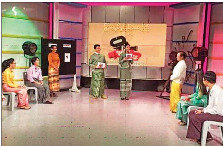
ရုပ်မြင်သံကြား၊ ပြန်ကြားရေးနှင့် ပြည်သူ့ဆက်ဆံရေးဦးစီးဌာန၊ အမျိုးသားယဉ်ကျေးမှုနှင့် အနုပညာတက္ကသိုလ် (ရန်ကုန်) နှင့် မြန်မာနိုင်ငံ ရုပ်ရှင်အစည်းအရုံးတို့ ပူးပေါင်းစီစဉ်ကျင်းပခြင်းဖြစ်သည်။ အဆိုပါပြိုင်ပွဲ ယှဉ်ပြိုင်မှုအား ထုတ်လွှင့်

ရန်ကုန် စက်တင်ဘာ ၁၇ မြန်မာ့ရုပ်ရှင်ရာပြည့်အထိမ်းအမှတ် ရုပ်မြင်သံကြား ဉာဏ်စမ်းပဟေဠိပြိုင်ပွဲ ယှဉ်ပြိုင်မှုများကို ရန်ကုန်မြို့ မြန်မာ့အသံနှင့် ရုပ်မြင်သံကြား စတူဒီယို (၁) တွင် စက်တင်ဘာ ၇ ရက် မှ ၉ ရက်အထိ ကျင်းပသည်။ (ယာပုံ) ပြိုင်ပွဲသို့ ရုပ်ရှင်ချစ်တဲ့သူ၊ Third Boys ၊ Three Stars၊ တော်ဝင်မောင်၊ Sky၊ မဟာစံ၊ ရွှေငွေထိန်၊ Triangle စသည့်အဖွဲ့ရပ်စွဲ၊ ပါဝင်ယှဉ်ပြိုင်ကြပြီး ပထမအဆင့်၊ ဒုတိယအဆင့်၊ ဗိုလ်လုပွဲအဆင့်ဆင့် ယှဉ်ပြိုင်ခဲ့ပြီး ဗိုလ်လုပွဲကို စက်တင်ဘာ ၉ ရက်တွင် ကျင်းပရာ “ရွှေငွေထိန်” အသင်းက ပထမ၊ “Triangle” အသင်းက ဒုတိယ၊ “ရုပ်ရှင်ချစ်တဲ့သူ” အသင်းက တတိယနှင့် “Three Stars” အသင်းက နှစ်သိမ့်ဆုများ ရရှိကြသည်။ မြန်မာ့ရုပ်ရှင်ရာပြည့် အထိမ်းအမှတ် ရုပ်မြင်သံကြားဉာဏ်စမ်း ပဟေဠိပြိုင်ပွဲကို ပြန်ကြားရေးဝန်ကြီးဌာန၊ မြန်မာ့အသံနှင့်