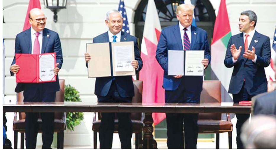
ဝါရှင်တန်မြို့တွင် စက်တင်ဘာ ၁၅ ရက်က ဘာရိန်း၊ ယူအေအီးနှင့် အစ္စရေးတို့ ပုံမှန်ဆက်ဆံရေး ထူထောင်ခြင်း သဘောတူညီမှုတွင် လက်မှတ်ရေးထိုးကြစဉ်။