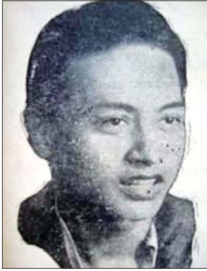
ခင်မောင်မြင့်