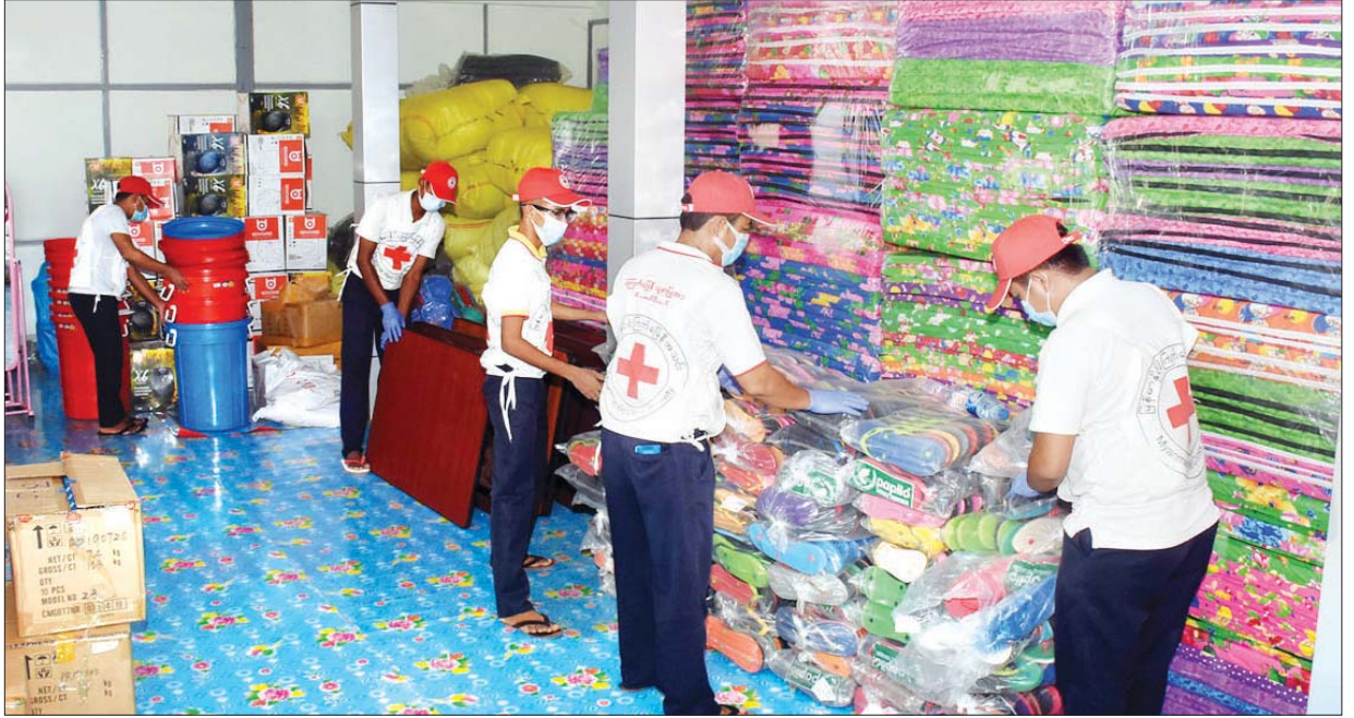
ဗဟိုဝန်ထမ်းတက္ကသိုလ် (အောက်မြန်မာပြည်) ကိုဗစ်-၁၉ ရောဂါ ကုသရေးဌာနရှိ ဆေးစတိုဗ် ဖြန့်မာနိုင်ကြက်ခြေနီအသင်းက လုပ်ငန်းများ ဆောင်ရွက်နေမှုကို တွေ့ရစဉ်။

သူတို့ကို ဆေးရုံကနေ ဆင်းချိန်တန်ရင် ဘယ်လိုဆင်းရမလဲဆိုတာ ရှိပါ တယ်။ ဒီဆေးရုံတွေကနေ ဆင်းခွင့်ပေးလိုက်တဲ့ အနယ်နယ်အရပ်ရပ်ကနေ လာရောက်ကြသူတွေက အနယ်နယ်အရပ်ရပ်ကို ပြန်သွားကြတဲ့အခါ မိမိရဲ့