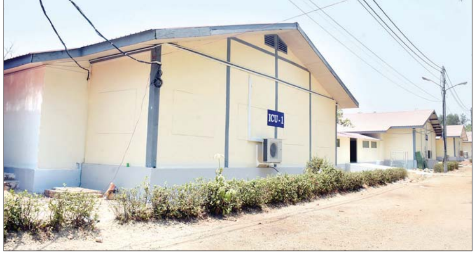
ဗဟိုဝန်ထမ်းတက္ကသိုလ် (အောက်မြန်မာပြည်) ကိုဗစ်-၁၉ ရောဂါကုသရေးဌာနရှိ အထူးကြပ်မတ်ကုသဆောင် ၁၊ ၂၊ ၄ အဆောက်အအုံများကို တွေ့ရစဉ်။

အိမ်မှာ နောက်ထပ်တစ်ပတ် အများကို မကူးစက်အောင်ဆိုပြီး ချမှတ်ထားတဲ့ Social Distancing အတိုင်း လိုက်နာရပါမယ်။ အိမ်မှာ တစ်ယောက်နဲ့ တစ်ယောက်ခွာပြီး နေတာတွေ၊ မလိုလားအပ်ဘဲနဲ့ စုစုဝေးဝေး နေတာတွေကို ရှောင်ကြဉ်ပြီး မကြာခဏ လက်ဆေးတာတွေ၊ Mask တပ်တာတွေကို ဆောင် ရွက်ပါ။ ဒါမှနောက်တစ်ယောက်ကို ကူးစက်နိုင်ဖို့ အခွင့်အလမ်းနည်းသွားမှာ ဖြစ်ပါတယ်။ အပြည်ပြည်ဆိုင်ရာ သုတေသနတွေအရ နှစ်ပတ်ကျော်ရင် ဒီလူနာ ကနေ နောက်တစ်ယောက်ကို ကူးစက်ဖို့ အခွင့်အလမ်း မရှိတော့ဘူးလို့ ပြော ကြပေမယ့် ဆေးရုံမှာ နှစ်ပတ်နေပြီးတဲ့နောက်မှာ အိမ်မှာလည်း တစ်ပတ်နေဖို့