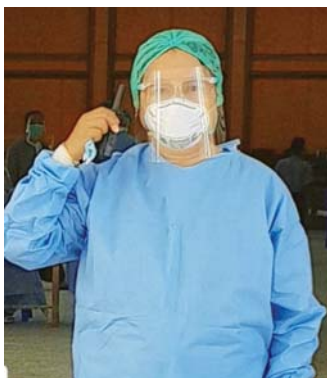
ဒေါက်တာ ပပ ကျွမ်းကျင်သူ

Positive လူနာတွေကို လေးယောက်တစ်ခန်း၊ ငါးယောက်တစ်ခန်း အကန့်လိုက်ခွဲပြီး ထားပါတယ်။ အပြင်ကနေ CCTV နဲ့ ကြည့်လို့ရအောင်၊ လူနာတွေပြောချင်တာတွေရှိရင် အင်တာကွန်းနဲ့ ပြောလို့ရအောင် စီစဉ်ပေးထားတယ်။ အဲဒီအပြင် လူနာတွေရဲ့ Complaint တွေကို ဖုန်းနဲ့ဖြေရှင်းပေးတာ၊ လိုအပ်ရင် ကာကွယ်ရေးဝတ်စုံ အပြည့်ဝတ်ပြီး လူကိုယ်တိုင် ဝင်ကြည့်တာတွေ လုပ်ပါတယ်။ ရင်ဘတ်ဓာတ်မှန်ကိုလည်း အဲဒီ Ward ထဲမှာပဲ ရိုက်လို့ရအောင် စီစဉ်ထားရှိပါတယ်။ လိုအပ်တဲ့ စစ်ဆေးမှုတွေကိုလည်း အချိန်နဲ့အညီ သတ်မှတ်ချက်အတိုင်းပြည့်အောင် လုပ်ဆောင်ပါတယ်။ အဲဒီအတွက် တာဝန်ကျ လက်ထောက်ဆရာဝန်တစ်ဦး၊ ကြီးကြပ်မယ့် အထူးကုလက်ထောက်ဆရာဝန်တစ်ဦး၊ တာဝန်ကျ ကျန်းမာရေးဝန်ထမ်းတွေနဲ့ အလုပ်သမားတွေက အချိန်နဲ့ တစ်ပြေးညီ လိုအပ်တဲ့ ကုသမှုပေးနေပါတယ်။ Isolation