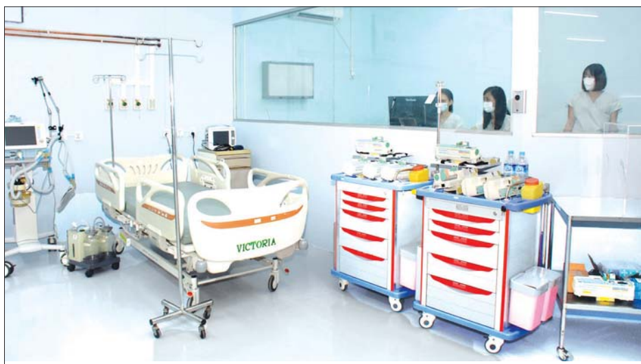
မဟိုဝန်ထမ်းတက္ကသိုလ် (အောက်မြန်မာပြည်) ကိုဗစ်-၁၉ ရောဂါ ကုသရေးဌာနရှိ အထူးကြပ်မတ်ကုသဆောင်များ၌ လူနာများ ကုသမည့်စက်ပစ္စည်းများနှင့် ခုတင်များ ဆောင်ရွက်ထားရှိမှုကို တွေ့ရစဉ်။

ဒီလိုပို့ဆောင်ပေးရတဲ့ လူနာတွေကို ကြည့်မယ်ဆိုရင် ပို့ဆောင်ပေးရတဲ့ ဆေးရုံအမျိုးအစား နှစ်မျိုးရှိပါတယ်။ နံပါတ် (၁) က ဆေးရုံတွေကနေထွက်တဲ့ Patient Under Investigation လို့ခေါ်တဲ့ PUI လူနာတွေကို ပို့ဆောင်ပေးရတာပါ။ နံပါတ် (၂) က Quarantine Center တွေက လူနာတွေကို ပို့ဆောင်ပေးရတာ ဖြစ်ပါတယ်။ ဒီလို နှစ်မျိုးရှိပါတယ်။