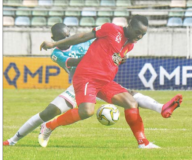
ရန်ကုန်နှင့် ဟံသာဝတီအသင်းတို့ ပထမအကျော့တွေ့ဆုံခဲ့စဉ်။

ရန်ကုန် စက်တင်ဘာ ၁၇ ၂၀၂၀ ရာသီ MNL အမှတ်ပေးပြိုင်ပွဲ ပွဲစဉ် (၁၇) ကို စက်တင်ဘာ ၁၉၊ ၂၀ ရက်တို့ တွင် ဆက်လက်ကျင်းပမည်ဖြစ်ပြီး ချန်ပီယံရှစ်လှိုင်ချက်ရှိနေသည့် ဒုတိယ နေရာမှ ဟံသာဝတီအသင်းသည် နာမည်ကြီးရန်ကုန်အသင်းနှင့် ပွဲကျပ်ကစားရ မည်ဖြစ်သည်။ ပွဲစဉ် (၁၇) အဖြစ် စက်တင်ဘာ ၁၉ ရက်တွင် YUSC ကွင်း၌ ဟံသာဝတီ အသင်းနှင့် ရန်ကုန်အသင်း၊ သုဝဏ္ဏကွင်း၌ ရှမ်းယူနိုက်တက်အသင်းနှင့် အား/ကာသိပွဲအသင်း၊ ပဒုမ္မာကွင်း၌ ရခိုင်အသင်းနှင့် ဧရာဝတီအသင်း၊ စက်တင်ဘာ ၂၀ ရက်တွင် သုဝဏ္ဏကွင်း၌ မကွေးအသင်းနှင့် ရတနာပုံအသင်း၊ YUSC ကွင်း၌ စစ်ကိုင်းအသင်းနှင့် Southern အသင်းတို့ ယှဉ်ပြိုင်ကစားမည်ဖြစ် သည်။ ယခု တစ်ပတ်တွင် အကောင်းဆုံးပွဲအဖြစ် ဟံသာဝတီနှင့် ရန်ကုန်အသင်းတို့ ထိပ်တိုက် တွေ့ဆုံသည့်ပွဲကို ပြုမည်ဖြစ်ပြီး နှစ်သင်းစလုံးအတွက် အရေးပါသည့်ပွဲဖြစ်နေသည်။ အမှတ်ပေးဇယားဒုတိယနေရာတွင် ရပ်တည်နေ သည့် ဟံသာဝတီအသင်းအတွက် မဖြစ်မနေအနိုင်ရရန် လိုအပ်နေသလို နာမည်ကြီး ရန်ကုန်အသင်းအတွက်လည်း ချန်ပီယံဆုအတွက် နောက်ဆုံး မျှော်လင့်ချက်ဖြစ်နေသည်။ ပွဲစဉ် (၁၆) တွင် ရှမ်းယူနိုက်တက်အသင်းကို ရိုးပြတ်အရေးနိမ့်ခဲ့သည့် ရန်ကုန်အသင်းအတွက် နောက်ဆုံးမျှော်လင့်ချက်လည်းဖြစ်နေပြီး အနိုင်ရမှသာ ဆက်လက်မျှော်လင့်နိုင်မည်ဖြစ်သည်။ သို့သော် ဇယားထိပ်ပိုင်းမှ အသင်းများနှင့် ခုနစ်မှတ်ကွာဟသွားသည့် ရန်ကုန်အသင်းအနေဖြင့် အခွင့်အရေးအလွန် နည်းပါးနေပြီဖြစ်သည်။ အမှတ်ပေးဇယားထိပ်ဆုံးမှ ဧရာဝတီအသင်းသည် ဒုတိယနေရာမှ ဟံသာဝတီအသင်း ပွဲကျပ်ကစားရမည့်အခွင့်အရေးကို အသုံးချ ရန် ကြိုးပမ်းရမည်ဖြစ်ပြီး ပွဲကျပ်များမကစားမီ အမှတ်ပြည့်ရယူထားရမည်ဖြစ် သည်။ လက်ရှိချန်ပီယံရှမ်းယူနိုက်တက်အသင်းမှာလည်း ဧရာဝတီနှင့်ဟံသာဝတီ ကို ဆက်လက်ဖိအားပေးနိုင်ရန် ယခုပွဲတွင် မဖြစ်မနေအနိုင်ကစားရန် လိုအပ် နေသည်။