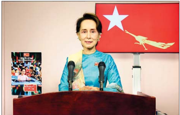
ပြည်ထောင်စုမြန်မာနိုင်ငံတော်၊ ပြည်သူ့ပြည်သားအပေါင်းရှင်၊ နှလုံးစိတ်ဝမ်းအေးချမ်းကြပါစေ .....

အမျိုးသားဒီမိုကရေစီအဖွဲ့ချုပ်ပါတီ ဥက္ကဋ္ဌ ဒေါ်အောင်ဆန်းစုကြည်က ၎င်းတို့၏ မူဝါဒ၊ သဘောထား၊ လုပ်ငန်းစဉ် စသည်တို့ကို စက်တင်ဘာ ၁၇ ရက် ညပိုင်းတွင် ရေဒီယိုနှင့် ရုပ်မြင်သံကြားအစီအစဉ်များမှ ဟောပြောတင်ပြခဲ့ပါသည်။ အဆိုပါ ဟောပြောတင်ပြချက်အပြည့်အစုံမှာ အောက်ပါအတိုင်း ဖြစ်ပါသည်။ -