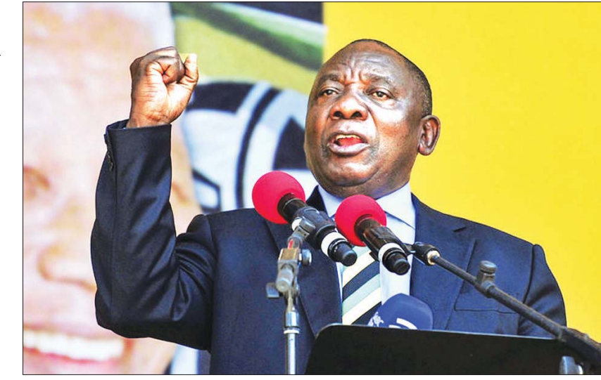
တောင်အာဖရိကသမ္မတ ရာမာဖိုဆာ။

နိုင်ငံများသို့ ခရီးသွားလာခြင်းနှင့် အဆိုပါနိုင်ငံ များမှ တောင်အာဖရိကသို့ လာရောက်ခြင်းကို ဆက်လက် ကန့်သတ်ထားဦးမည်ဖြစ်ကြောင်း သိရသည်။ တောင်အာဖရိကနိုင်ငံသည် အာဖရိက ၌ အကြီးဆုံးစက်မှုနိုင်ငံ ဖြစ်သည်။ အင်န်အိတ်ချ်ကေ