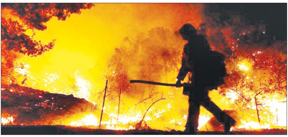
ကယ်လီဖိုးနီးယားပြည်နယ် လော့စ်အိန်ဂျလစ်မြို့ အာကေးဒီးယားဒေသတွင် တောမီးလောင်မှုကို စက်တင်ဘာ ၁၃ ရက်က တွေ့ရစဉ်။

ဆန်ဖရန်စစ္စကို စက်တင်ဘာ ၁၇ အမေရိကန်နိုင်ငံ ကယ်လီဖိုးနီးယား ပြည်နယ်တွင် ယခုနှစ်အတွင်း တောမီးလောင်မှုပေါင်း ၇၈၆၀ ဖြစ်ပွား ခဲ့ပြီး မြေကေပေါင်း ၃ ဒသမ ၄ သန်း လောင်ကျွမ်းခဲ့သည်ဟု ပြည်နယ် အုပ်ချုပ်ရေးမှူး ဂါဗင်နယူးဆမ်းက စက်တင်ဘာ ၁၆ ရက်တွင် ပြော သည်။ အကူအညီရယူ တောမီးလောင်မှုများကို ငြိမ်း သတ်ရန် ကယ်လီဖိုးနီးယားသစ်တော နှင့် တောမီးထိန်းသိမ်းရေးဌာနနှင့် အမေရိကန် သစ်တောဌာနတို့က ဆက်လက် ကြိုးပမ်းလျက်ရှိပြီး ဖွဲ့စည်းထားသည့် ယူတား ပြည်နယ် တက္ကဆက်ပြည်နယ်နှင့် နယူးဂျာစီ ပြည်နယ်တို့မှ မီးသတ် ဝန်ထမ်းများ၏ အကူအညီကိုလည်း ရယူခဲ့ကြသည်။ မီးငြိမ်းသတ်မှု လုပ်ဆောင် ကယ်လီဖိုးနီးယားပြည်နယ်တွင် တောမီးလောင်မှုများကို လတ်တလော ငြိမ်းသတ်နေသည့် မီးသတ်သမား ပေါင်း ၁၇၀၀၀ ကျော်ရှိပြီး မီးသတ် ယာဉ်ပေါင်း ၂၂၀၀ နှင့် မီးငြိမ်းသတ်မှု လုပ်ငန်းများ လုပ်ဆောင်လျက် ရှိသည်။ အကြီးဆုံးတောမီးဖြစ် ကယ်လီဖိုးနီးယားပြည်နယ် မန်နို စီနီခရိုင်တွင် တောမီးလောင်မှုမှာ ပြည်နယ်အတွင်း အကြီးဆုံး တောမီး ဖြစ်ပြီး စက်တင်ဘာ ၁၆ ရက်အထိ ဆက်လက်လောင်လျက်ရှိသည်။ ထိန်းချုပ်နိုင်ပြီဖြစ် တာတီ၊ ပလူမက်စ်နှင့် ယူတား စီရင်စုတို့တွင်မူ တောမီးလောင်မှုကို ထိန်းချုပ်နိုင်ပြီ ဖြစ်သည်။