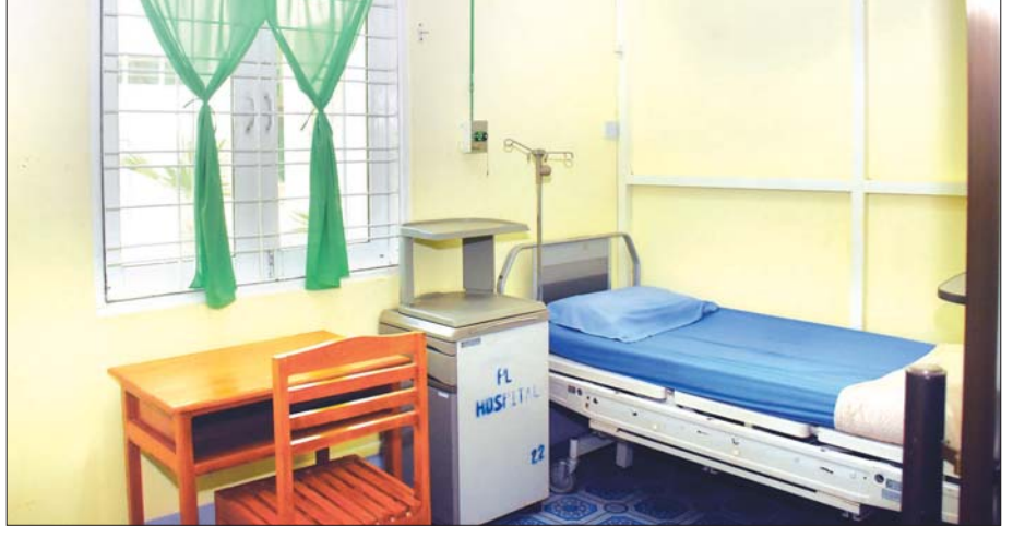
ဗဟိုဝန်ထမ်းတက္ကသိုလ် (အောက်မြန်မာပြည်) ကိုဗစ်-၁၉ ရောဂါကုသရေးဌာန သရဖီဆောင်ရှိ လူနာများ ဆေးကုသနေထိုင်မည့်အခန်းကို တွေ့ရစဉ်။

ကောင်းအောင် ဖန်တီးပေးထားတဲ့အတွက်ကြောင့်မို့၊ လူနာရှင်တွေ အနေနဲ့ လိုက်ပါပြီး ပြုစုစောင့်ရှောက်ခြင်း မရှိသော်လည်း ဒီလူနာတွေနဲ့ မိသားစုဝင် တွေက ဆက်တိုက်အဆက်မပြတ် ထိတွေ့နိုင်အောင် ဖန်တီးပေးထားတာ ဖြစ်ပါတယ်။