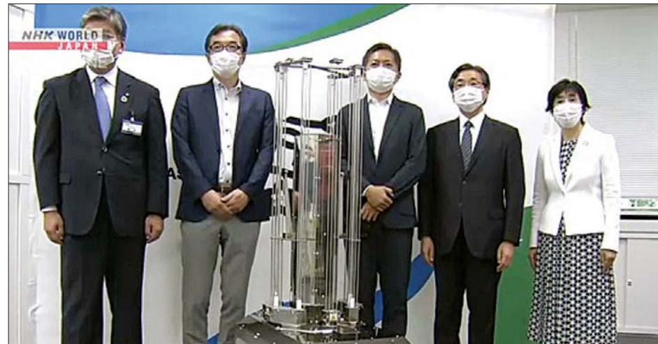
ကိုဗစ်-၁၉ ဗိုင်းရပ်စ်ကို တိုက်ဖျက်ရန် ဂျပန်သုတေသနပညာရှင်များ တီထွင်ထုတ်လုပ်လိုက်သည့် အင်အားပြင်းခရမ်းလွန်ရောင်ခြည်သုံး စက်ရုပ်ကို တွေ့ရစဉ်။