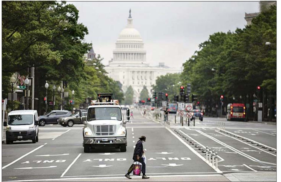
အမေရိကန်ပြည်ထောင်စု ဝါရှင်တန်ဒီစီရှိ ကက်ပီတိုလ် အဆောက်အအုံ