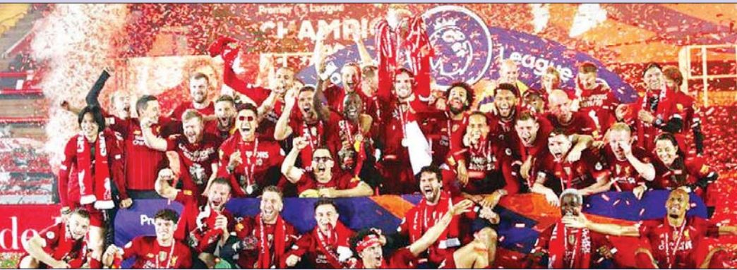
၂၀၁၉ - ၂၀၂၀ ဘောလုံးရာသီ ပရိမီယာလိဂ် ချန်ပီယံ လီဗာပူးအသင်း။