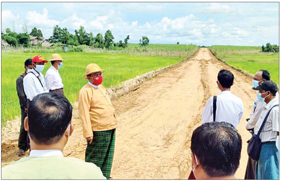
တိုင်းဒေသကြီးဝန်ကြီးချုပ် ဦးဝင်းသိန်း ကျေးရွာချင်းဆက်လမ်းဖောက်လုပ်ပြီးစီးမှု ကွင်းဆင်းစစ်ဆေးစဉ်။

အဆိုပါ ကြံသနွယ်ကျေးရွာ အုပ်စု နန်ချွန်-ဖျံချောင်း-ဖားဘောင် တင် ကျေးရွာချင်းဆက်မြေသားလမ်းသည် အရှည်ပေ ၃၅၀၀၊ အကျယ်ပေ ၂၀၊ အမြင့်နှစ်ပေရှိပြီး တိုင်းဒေသကြီး အစိုးရအဖွဲ့မှ ၂၀၁၉-၂၀၂၀ ဘဏ္ဍာနှစ် ခွင့်ပြုရန်ပုံငွေကျပ် ၂၄ သန်းဖြင့် ရေတာရှည်မြို့နယ် ကျေးလက်လမ်း ဦးစီးဌာနမှ တာဝန်ယူဆောင်ရွက်ခဲ့ခြင်းဖြစ်ပြီး အဆိုပါ လမ်းပိုင်းပြီးစီးပါက တောင်ငူမြို့နယ်နှင့် ရေတာရှည်မြို့နယ်အတွင်းရှိ ကျေးရွာများ ရာသီမရွေး အဆင်ပြေစွာ သွားလာနိုင်ကြမည်ဖြစ်ကြောင်း၊ လူမှုစီးပွားဘဝ ပိုမိုဖွံ့ဖြိုးတိုးတက်လာမည်ဖြစ်ကြောင်း သိရသည်။