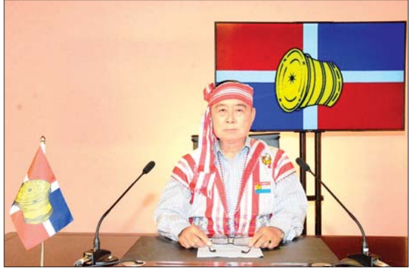
“အားလုံးမင်္ဂလာ ညနေခင်းပါခင်ဗျာ”

အဆိုပါ ဟောပြောတင်ပြချက်အပြည့်အစုံမှာ အောက်ပါအတိုင်း ဖြစ်ပါသည်။