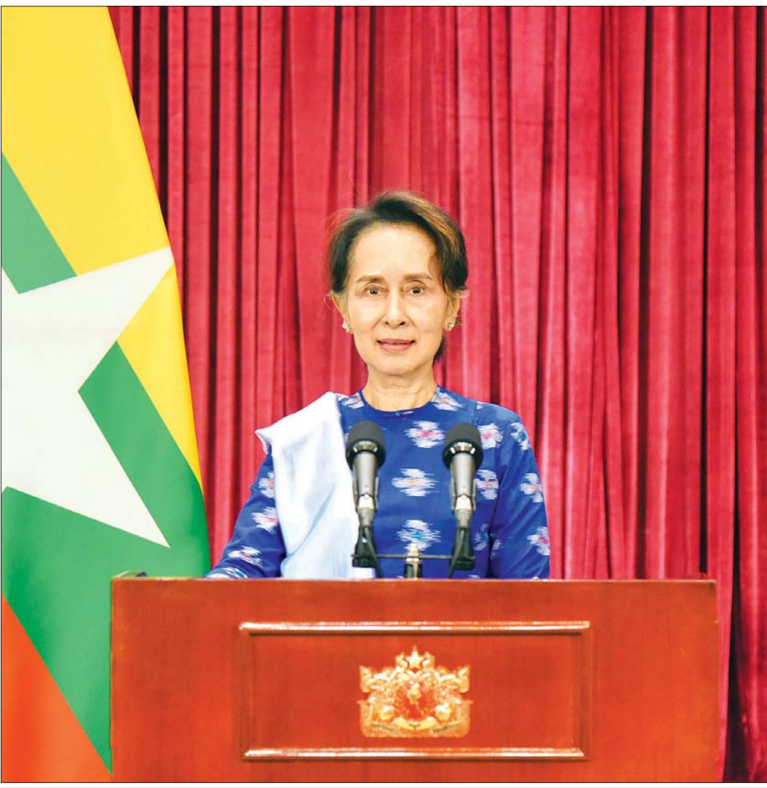
နိုင်ငံတော်၏အတိုင်ပင်ခံပုဂ္ဂိုလ် ဒေါ်အောင်ဆန်းစုကြည် COVID - 19 ရောဂါပြန့်ပွားမှုကို ထိထိရောက်ရောက်ထိန်းချုပ်နိုင်ရန် ထုတ်ပြန်ထား သည့် စည်းမျဉ်းစည်းကမ်းများနှင့် ညွှန်ကြားချက်များကို လိုက်နာရေးနှင့် စပ်လျဉ်း၍ ပြည်သူများသို့ အစီရင်ခံတင်ပြသည့် မိန့်ခွန်း ပြောကြားစဉ်။

အခု ရန်ကုန်တိုင်းနဲ့ ပတ်သက်ပြီးတော့လည်း ကျွန်မတို့ စည်းမျဉ်း စည်းကမ်းတွေ ထုတ်ထားပါတယ်။ ဒါကို တင်းကျပ်တယ်လို့ တချို့ က ထင်ပါလိမ့်မယ်။ ဒါပေမယ့်လည်း ဒီလို တင်းကျပ်ကျပ်နဲ့ နှစ်ပတ်၊ သုံးပတ်လောက် လိုက်နာလိုက်မယ်ဆိုရင် ကျွန်မတို့ ဒီရောဂါကို ထိန်းချုပ်နိုင်မယ့် အခြေအနေကို ရောက်လာမှာပါ။ အဲဒါကြောင့် အားလုံးကနေပြီးတော့ စည်းမျဉ်းစည်းကမ်းတွေကို လိုက်နာကြပါ။