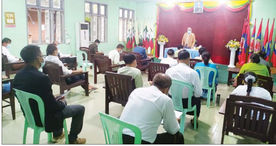
များနှင့် အုပ်ချုပ်ရေးအဖွဲ့များ၊ လူမှုရေးအသင်းအဖွဲ့များအား အထူးပင်ကျေးဇူးတင်ဂုဏ်ယူကြောင်း၊ ယခုအခါ စစ်ဆေးရေးဂိုဏ်း စစ်ဆေးမှုပြုလုပ်ပြီး ပြည်သူလူထု ပူးပေါင်းပါဝင်မှုဖြင့် သတ်မှတ်နေရာ အသွားအလာ ကန့်သတ်ထားသည့်သူများအနက် အချို့သည် မိမိအစီအစဉ်ဖြင့် ဟိုတယ်တွင် အသွားအလာ ကန့်သတ်နေထိုင်မှုဖြင့် နေထိုင်ချင်ပါက မိမိတို့အနေဖြင့် ကြိုတင်ဆောင်ရွက်ထားနိုင်ရေးအတွက် မြို့နယ်အတွင်းရှိ ဟိုတယ်များ

မွန်ပြည်နယ်ဝန်ကြီးချုပ် ဒေါက်တာ အေးစံနှင့် ကျိုက်ထိုမြို့နယ် ကိုဗစ် - ၁၉ ရောဂါ ကာကွယ်၊ ထိန်းချုပ်၊ ကုသရေးကော်မတီဝင်များ၊ ဟိုတယ်လုပ်ငန်းရှင်များသည် စက်တင်ဘာ ၈ ရက်က ကျိုက်ထိုမြို့နယ် အထွေထွေအုပ်ချုပ်ရေးဦးစီးဌာန အစည်းအဝေးခန်းမ၌ တွေ့ဆုံသည်။ (ယာဝု)