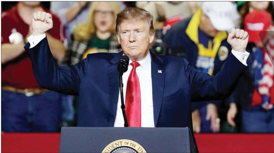
အမေရိကန်သမ္မတ ဒေါ်နယ်ထရမ်