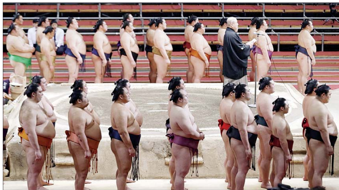
ဂျပန်ဆူမိုနပန်းသမားများကို တွေ့ရစဉ်။