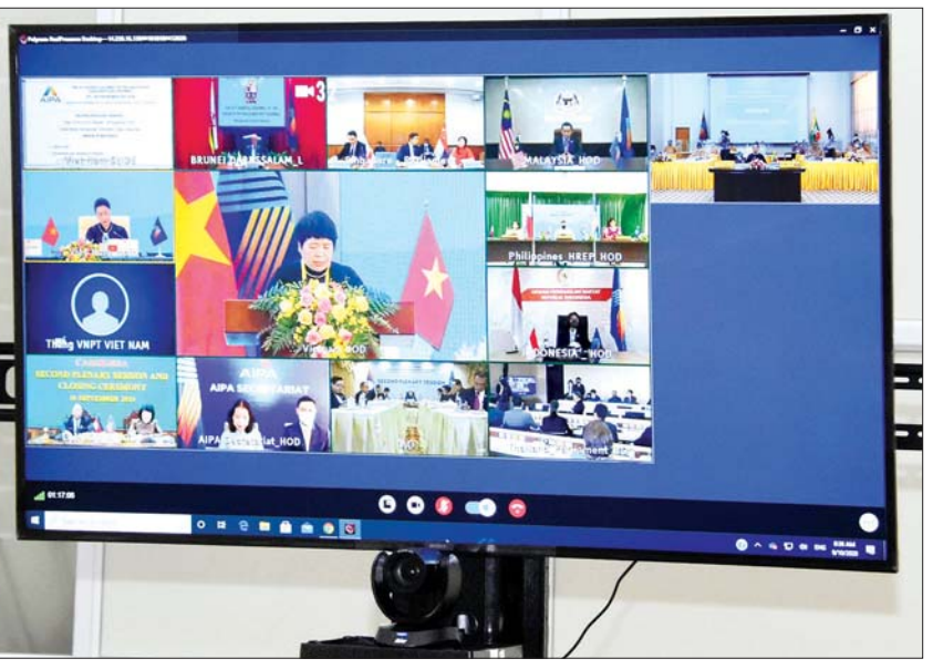
ပြည်ထောင်စုလွှတ်တော် နာယက၊ ပြည်သူ့လွှတ်တော်ဥက္ကဋ္ဌ ဦးတီခွန်မြတ် Video Conferencing ဖြင့် ကျင်းပသည့် (၄၁) ကြိမ်မြောက် အာဆီယံပါလီမန်များ အထွေထွေညီလာခံ ဒုတိယစုံညီအစည်းအဝေးနှင့် ပိတ်ပွဲအခမ်းအနားသို့ တက်ရောက်စဉ်။

ဒုတိယ စုံညီအစည်းအဝေးကို နံနက် ၈ နာရီခွဲတွင် စတင်ကျင်းပရာ သက်ဆိုင်ရာကဏ္ဍအလိုက် ကော်မတီများ၏ အစီရင်ခံစာများကို တင်ပြဖတ်ကြားအတည်ပြုကြပြီး (၄၁) ကြိမ်မြောက် AIPA အထွေထွေညီလာခံ၏ ကြေညာချက် (Joint Communique) ကို ကိုယ်စားလှယ်အဖွဲ့ ခေါင်းဆောင်များက E-Signature ဖြင့် အတည်ပြုလက်မှတ်ရေးထိုးကြသည်။